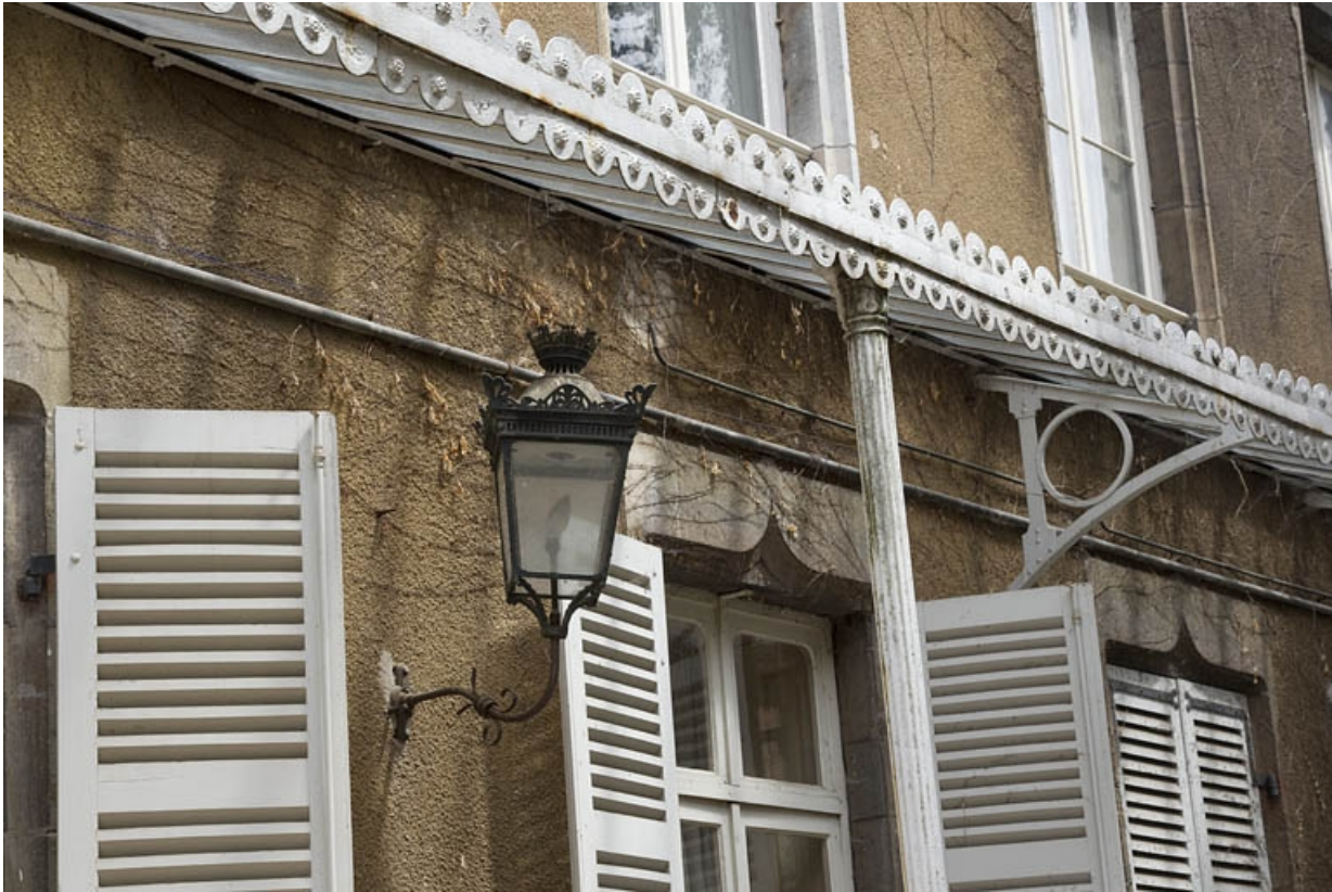
Logis principal, façade antérieure : détail du bec de gaz. 25, Besançon, 7 rue d' Anvers, lieudit : îlot d' Emskerque