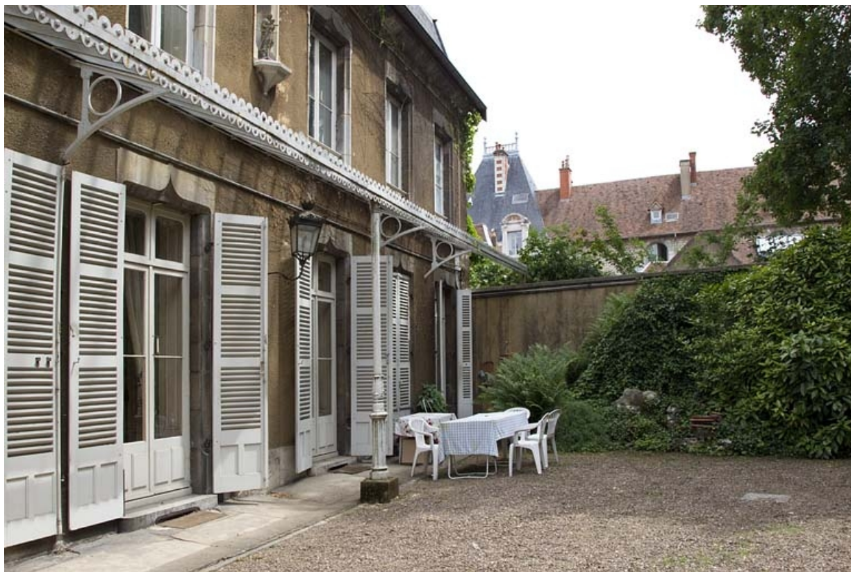
Logis principal, façade antérieure : de trois quart droit. 25, Besançon, 7 rue d' Anvers, lieudit : îlot d' Emskerque