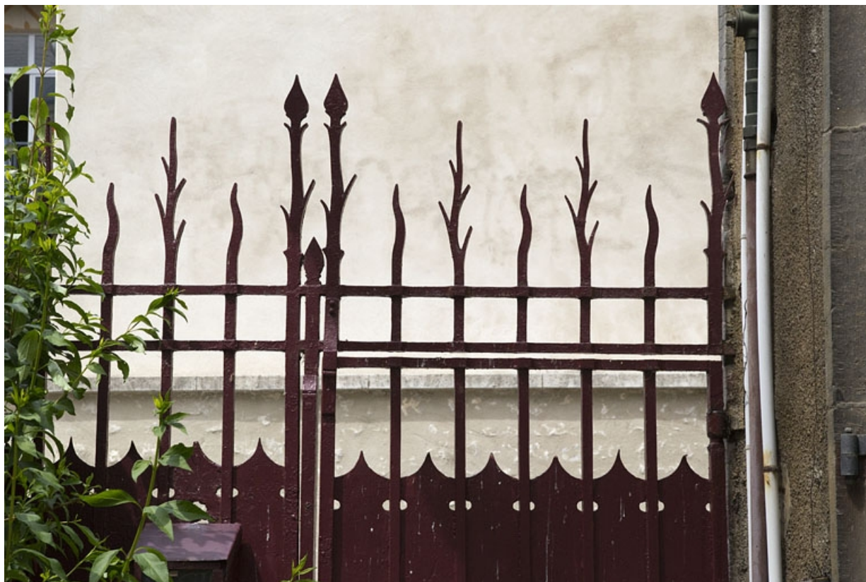
Clôture de cour : détail de la partie supérieure du portail.

25, Besançon, 7 rue d' Anvers, lieudit : îlot d' Emskerque