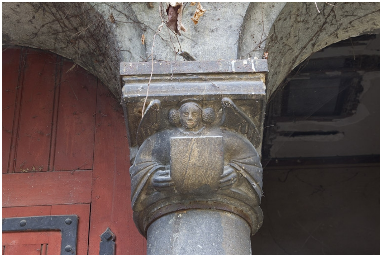
Bâtiment des remises, détail d'un chapiteau : anges portant un écu, de face. 25, Besançon, 7 rue d' Anvers, lieudit : îlot d' Emskerque