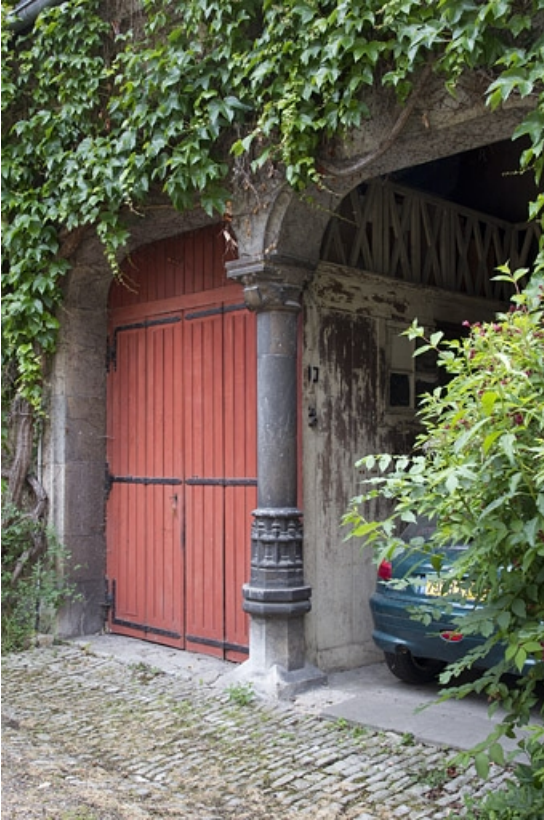
Bâtiment des remises : détail des portes des remises. 25, Besançon, 7 rue d' Anvers, lieudit : îlot d' Emskerque