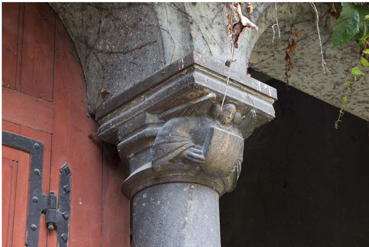
Bâtiment des remises, détail d'un chapiteau : ange portant un écu, de trois quarts gauche.

25, Besançon, 7 rue d' Anvers, lieudit : îlot d' Emskerque