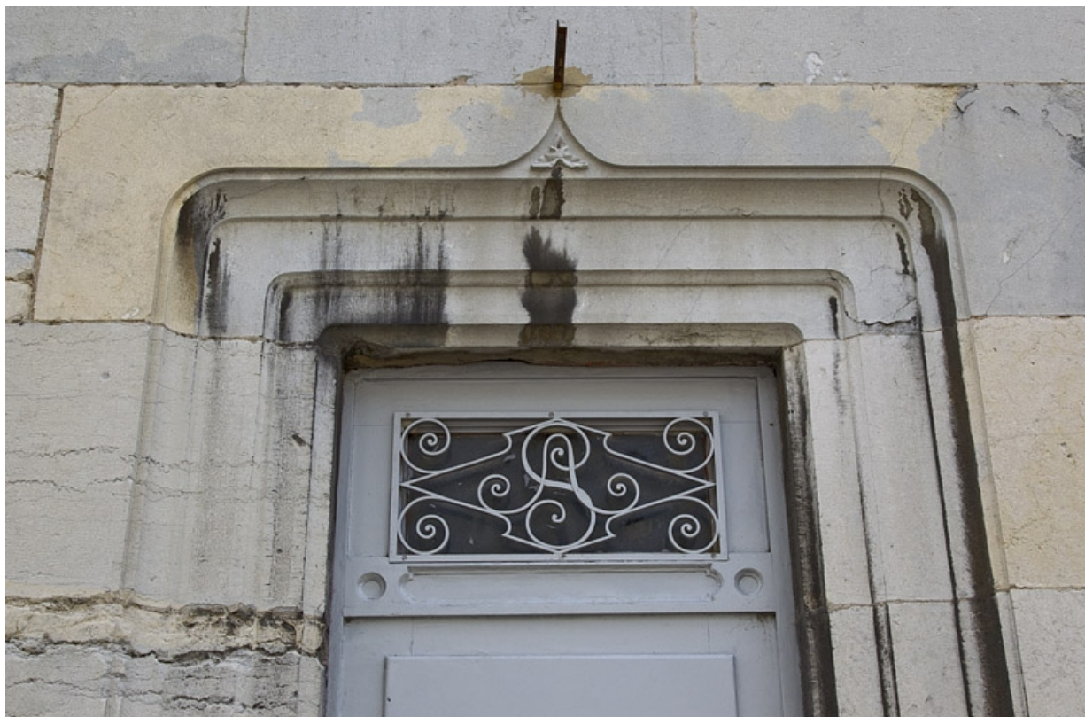
Logis principal, façade sur rue : détail de la partie supérieure de la porte. 25, Besançon, 7 rue d' Anvers, lieudit : îlot d' Emskerque