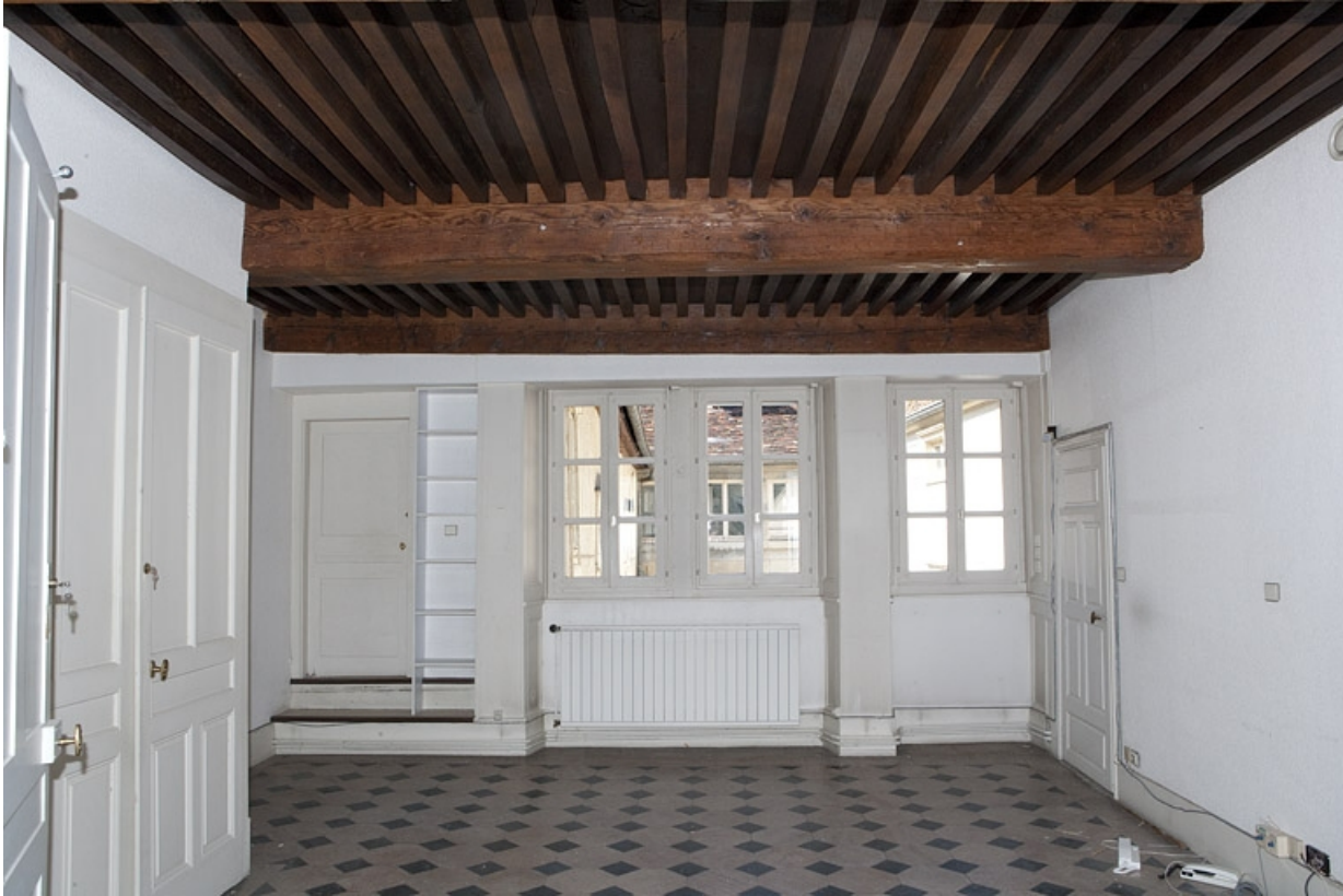
Logis principal, appartement du premier étage : vue de la pièce avec plafond à la française, depuis le fond.

25, Besançon Grande Rue 48, lieudit : îlot d' Emskerque