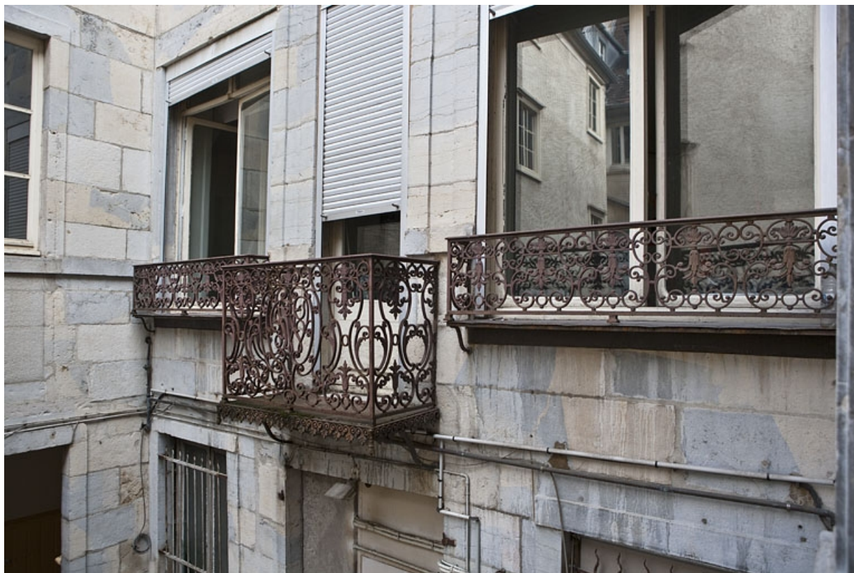
Logis principal, façade postérieure : détail du balcon en ferronnerie, de trois quarts droit. 25, Besançon Grande Rue 48, lieudit : îlot d' Emskerque