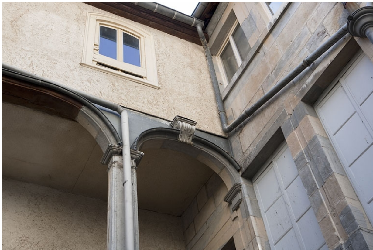
Escalier à cage ouverte sur cour : détail des arcs soutenant la galerie, partie droite.

25, Besançon Grande Rue 48, lieudit : îlot d' Emskerque