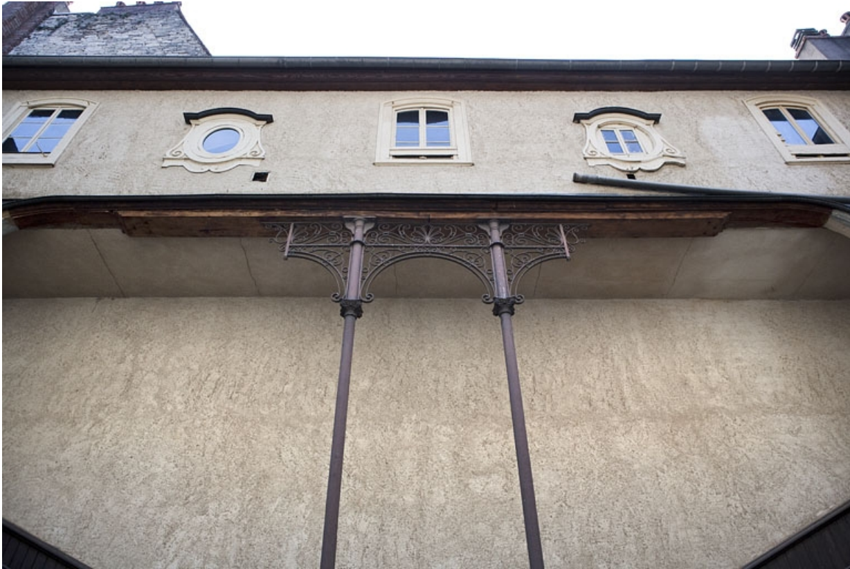
Escalier à cage ouverte sur cour : détail de la galerie fermée au-dessus de l'escalier, de face.

25, Besançon Grande Rue 48, lieudit : îlot d' Emskerque