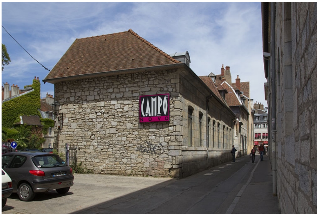
Communs, façade sur rue : de trois quarts gauche. 25, Besançon Grande Rue 48, lieudit : îlot d' Emskerque