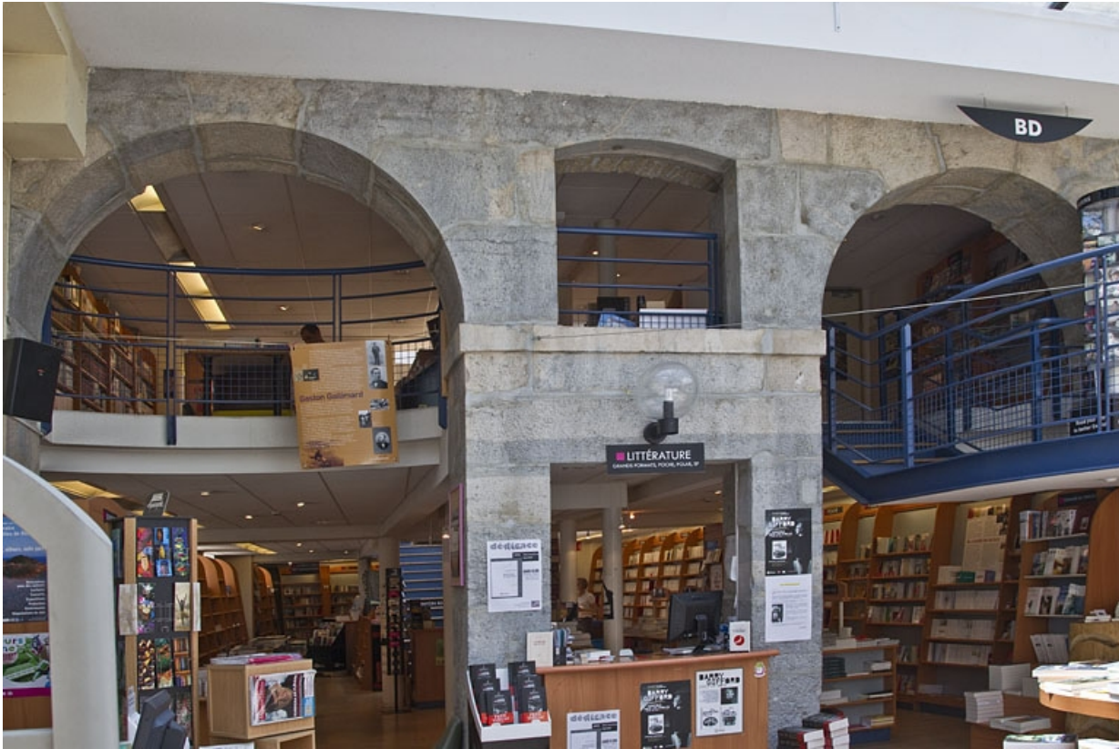
Ancienne cour des commons : détail des baies des anciennes remises et écuries.

25, Besançon Grande Rue 48, lieudit : îlot d' Emskerque