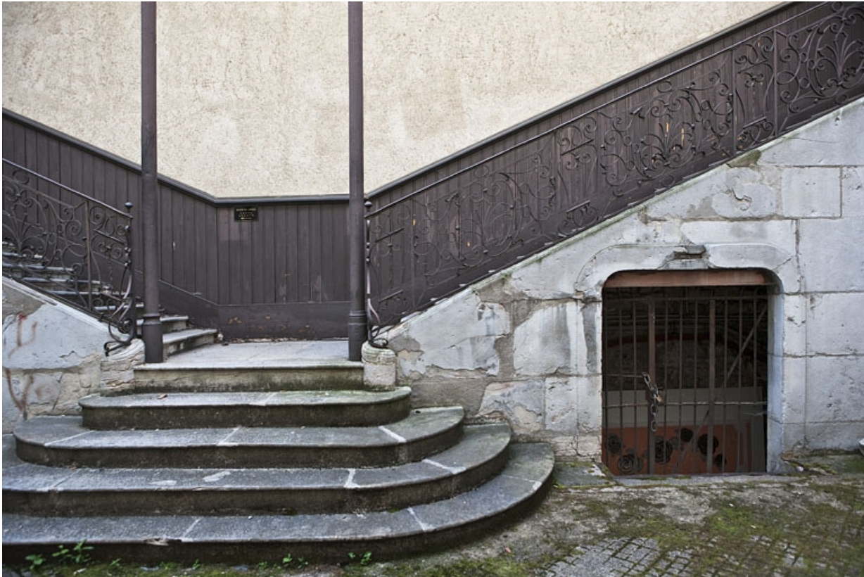
Escalier à cage ouverte sur cour : détail de l'emmarchement de l'escalier.

25, Besançon Grande Rue 48, lieudit : îlot d' Emskerque