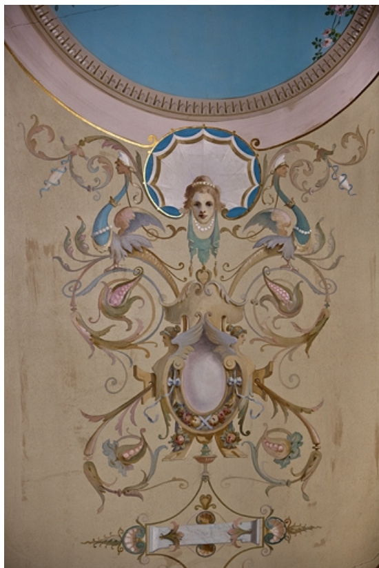
Logis principal, appartement du premier étage, grande pièce sur rue : détail d'un décor de la partie centrale du plafond. 25, Besançon Grande Rue 48, lieudit : îlot d' Emskerque