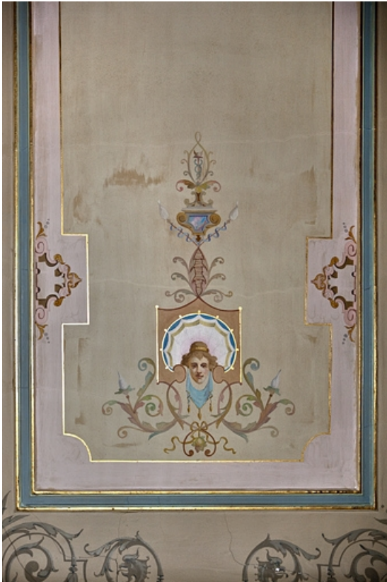
Logis principal, appartement du premier étage, grande pièce sur rue : détail d'un décor du plafond.

25, Besançon Grande Rue 48, lieudit : îlot d' Emskerque