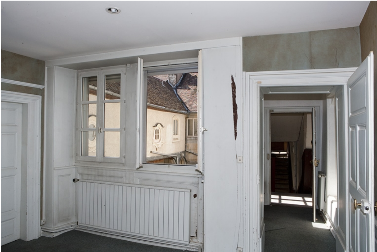
Logis principal, intérieur, appartement du premier étage : vue du couloir d'entrée. 25, Besançon Grande Rue 48, lieudit : îlot d' Emskerque