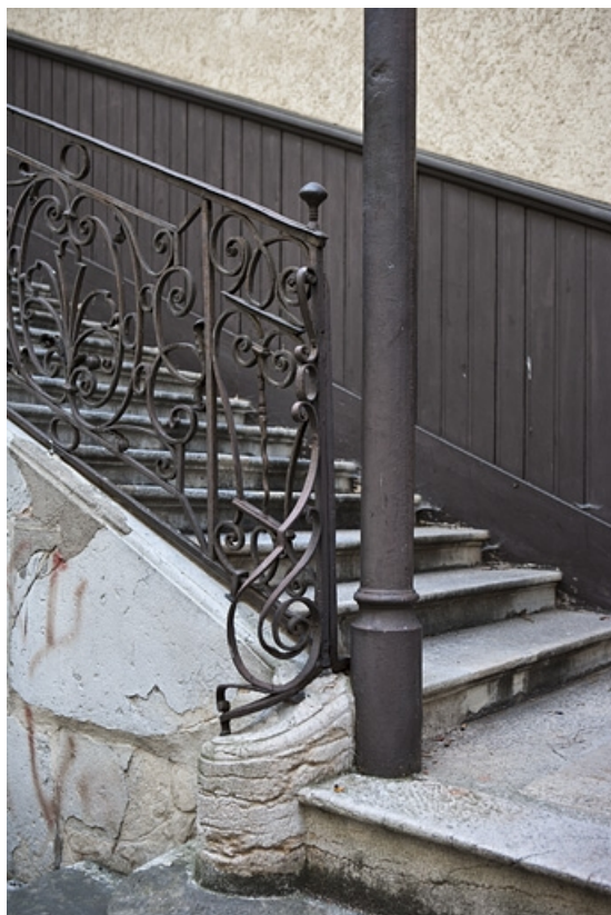
Escalier à cage ouverte sur cour : détail du départ de la volée gauche.

25, Besançon Grande Rue 48, lieudit : îlot d' Emskerque