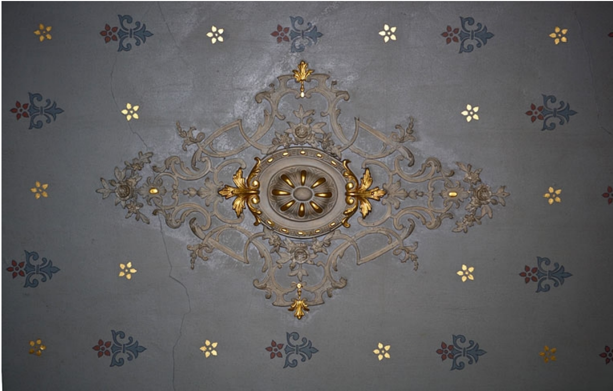
Logis principal, appartement du premier étage, pièce sur rue : détail du décor central du plafond. 25, Besançon Grande Rue 48, lieudit : îlot d' Emskerque