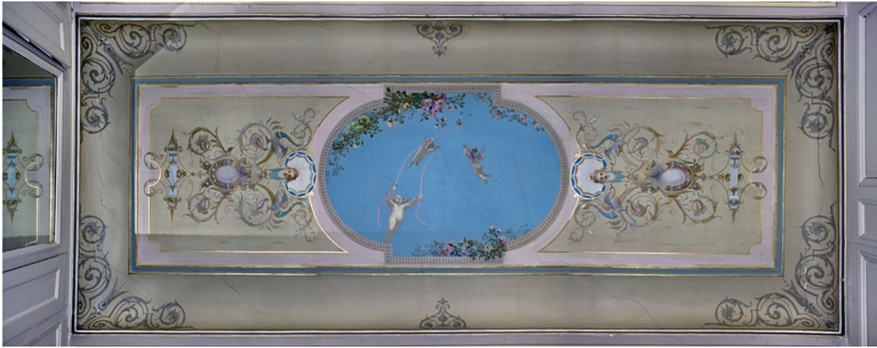
Logis principal, appartement du premier étage, grande pièce sur rue : vue d'ensemble du décor central du plafond. 25, Besançon Grande Rue 48, lieudit : îlot d' Emskerque