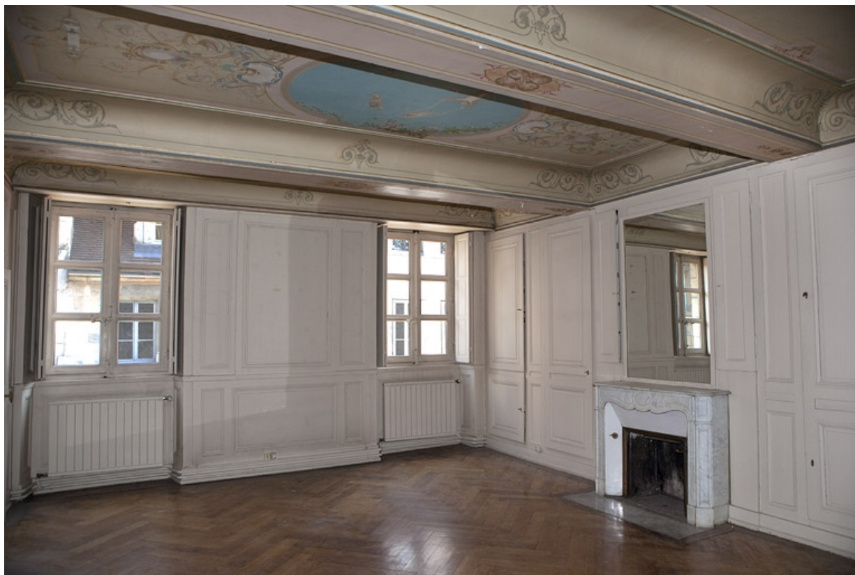
Logis principal, appartement du premier étage, grande pièce sur rue : vue d'ensemble depuis le fond, de trois quarts gauche. 25, Besançon Grande Rue 48, lieudit : îlot d' Emskerque