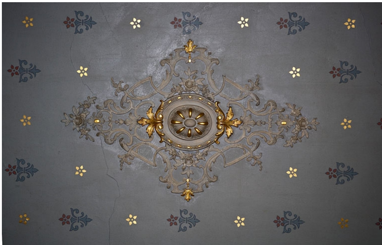
Logis principal, appartement du premier étage, pièce sur rue : détail du décor central du plafond. 25, Besançon Grande Rue 48, lieudit : îlot d' Emskerque