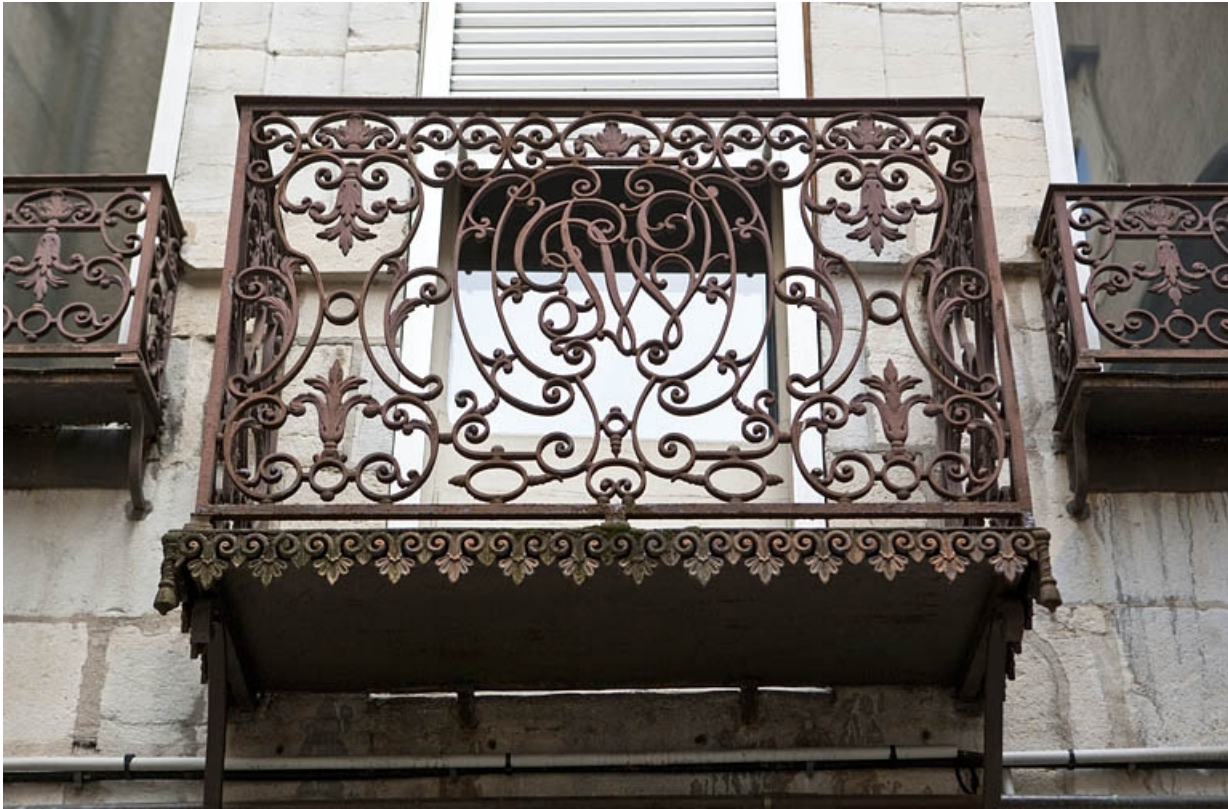
Logis principal, façade postérieure : détail du balcon en ferronnerie, de face.

25, Besançon Grande Rue 48, lieudit : îlot d' Emskerque