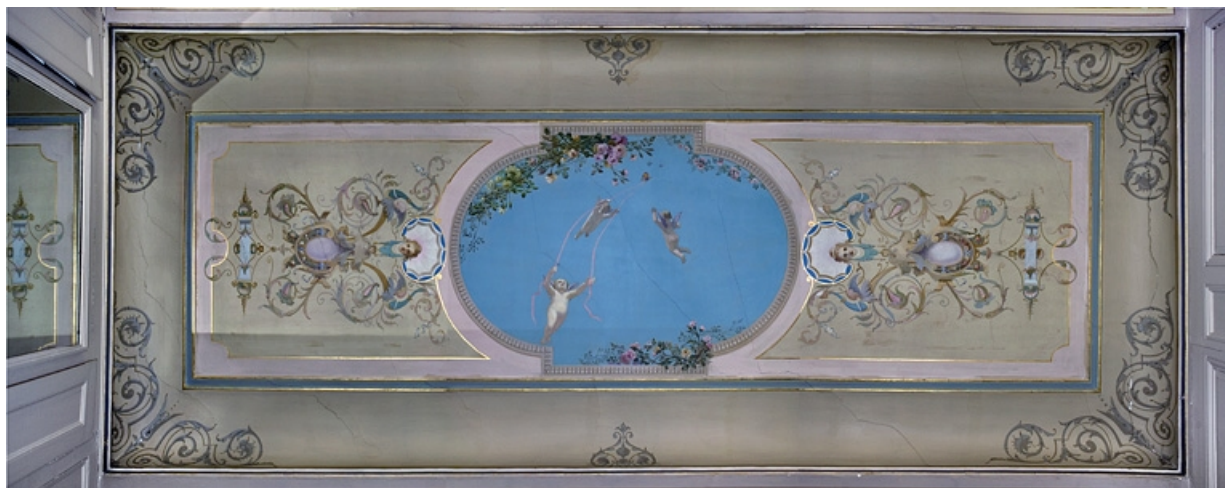
Logis principal, appartement du premier étage, grande pièce sur rue : vue d'ensemble du décor central du plafond. 25, Besançon Grande Rue 48, lieudit : îlot d' Emskerque