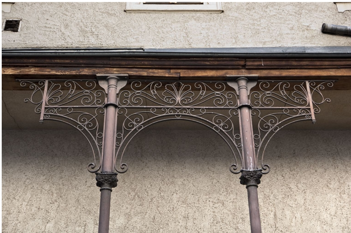
Escalier à cage ouverte sur cour : détail des arcs et des piliers en métal soutenant la galerie, partie centrale.

25, Besançon Grande Rue 48, lieudit : îlot d' Emskerque