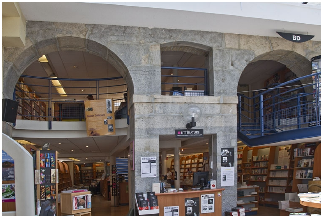
Ancienne cour des communs : détail des baies des anciennes remises et écuries.

25, Besançon Grande Rue 48, lieu dit : îlot d' Emskerque