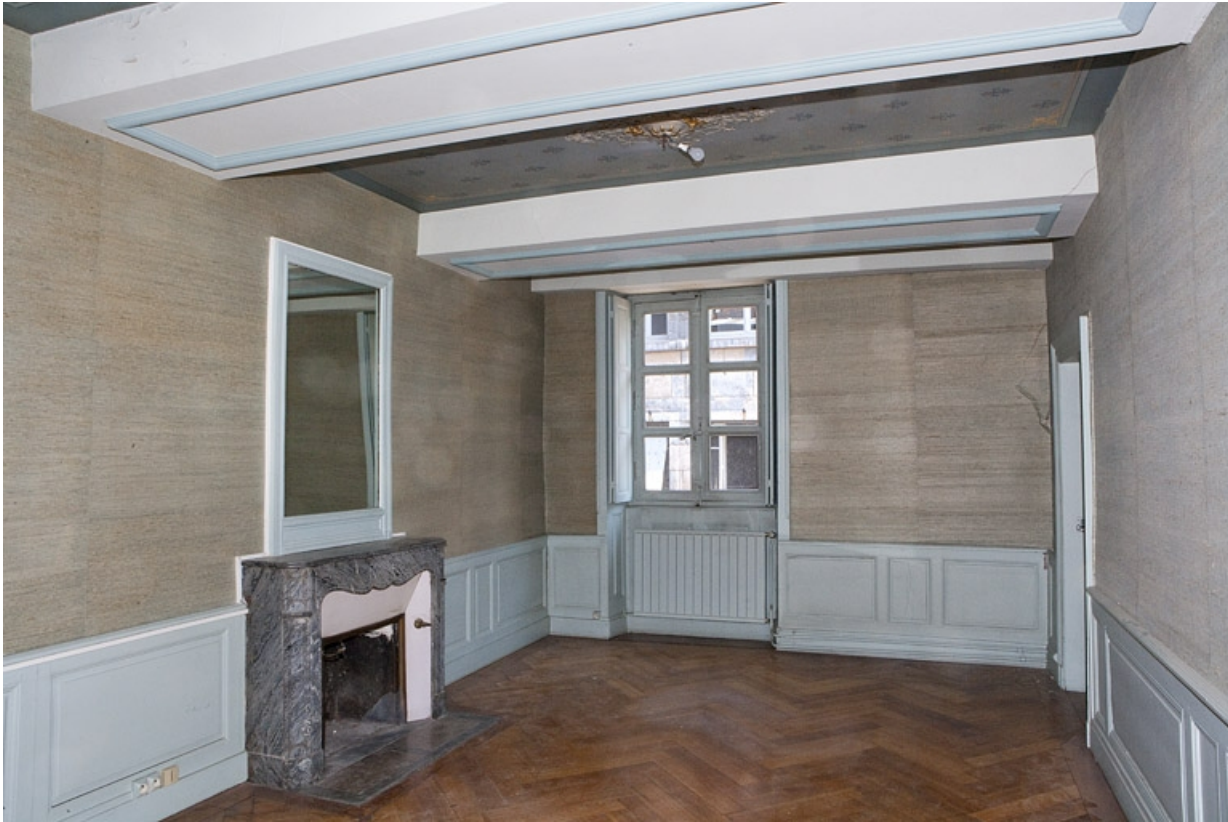
Logis principal, appartement du premier étage : vue d'ensemble d'une pièce sur rue.

25, Besançon Grande Rue 48, lieudit : îlot d' Emskerque