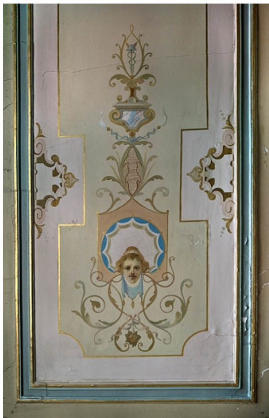
Logis principal, appartement du premier étage, grande pièce sur rue : détail d'un décor du plafond. 25, Besançon Grande Rue 48, lieudit : îlot d' Emskerque