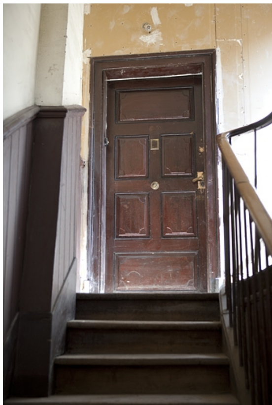
Logis principal : porte d'entrée de l'appartement du premier étage. 25, Besançon Grande Rue 48, lieudit : îlot d' Emskerque