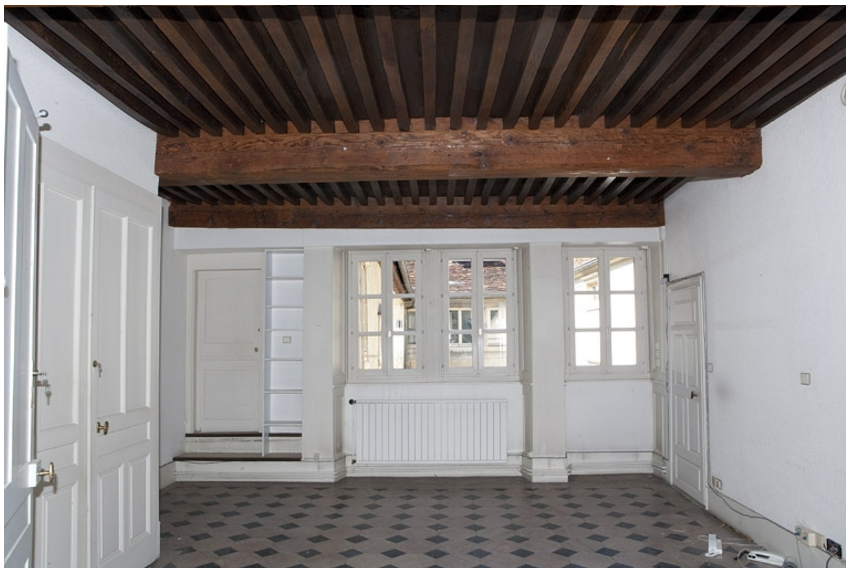
Logis principal, appartement du premier étage : vue de la pièce avec plafond à la française, depuis le fond. 25, Besançon Grande Rue 48, lieudit : îlot d' Emskerque