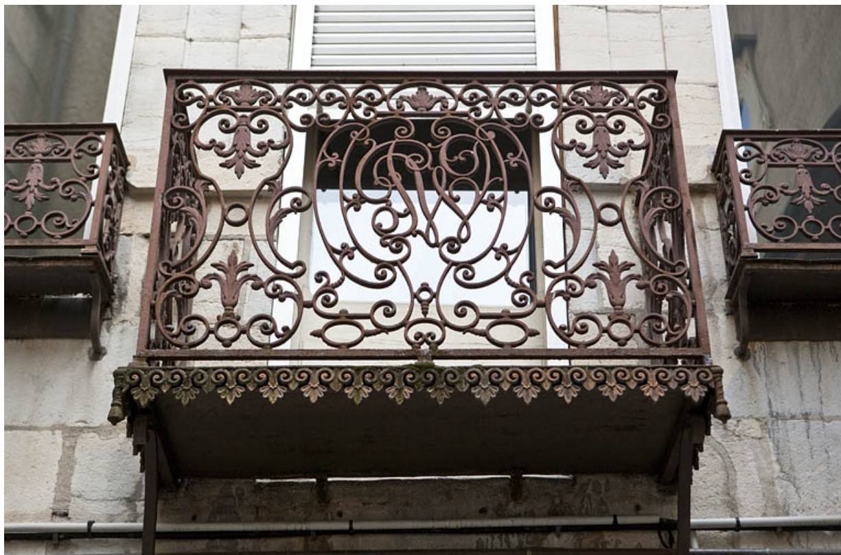
Logis principal, façade postérieure : détail du balcon en ferronnerie, de face. 25, Besançon Grande Rue 48, lieudit : îlot d' Emskerque