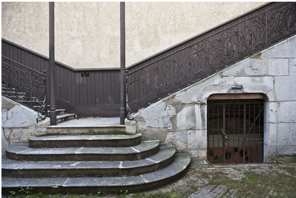
Escalier à cage ouverte sur cour : détail de l'embranchement de l'escalier.

25, Besançon Grande Rue 48, lieudit : îlot d' Emskerque