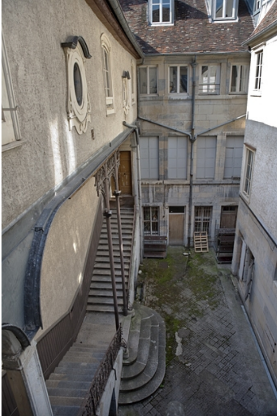
Logis secondaire : vue de la façade antérieure, de face.

25, Besançon Grande Rue 48, lieudit : îlot d' Emskerque