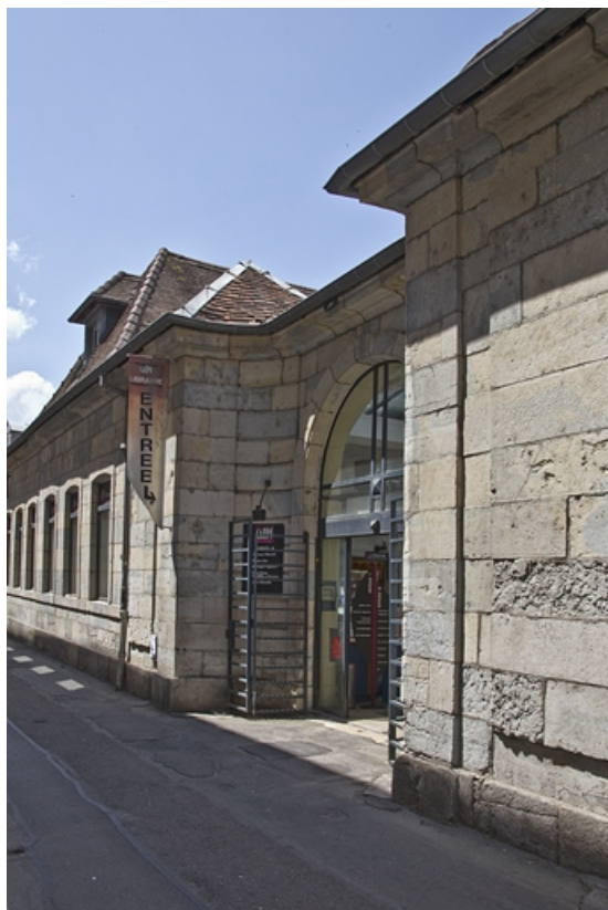
Détail de l'entrée de l'ancienne cour des communs, de trois quarts droit.

25, Besançon Grande Rue 48, lieudit : îlot d' Emskerque