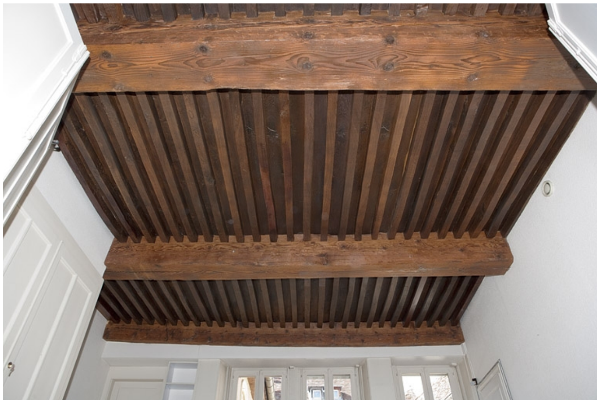
Logis principal, appartement du premier étage : détail du plafond à la française.

25, Besançon Grande Rue 48, lieu-dit : îlot d' Emskerque