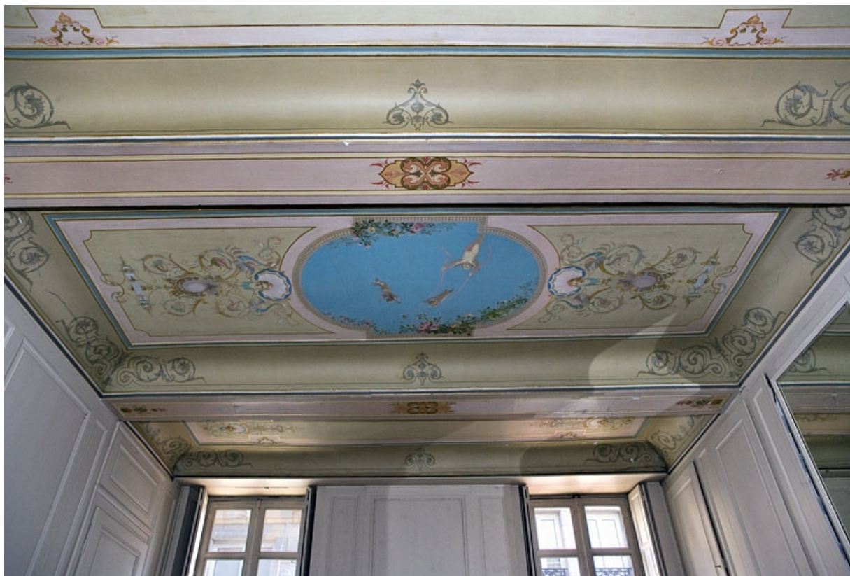
Logis principal, appartement du premier étage, grande pièce sur rue : vue d'ensemble du plafond. 25, Besançon Grande Rue 48, lieudit : îlot d' Emskerque