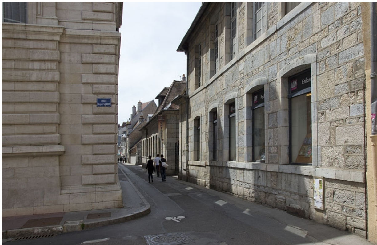
Communs, façade sur rue : vue d'ensemble de trois quarts droit. 25, Besançon Grande Rue 48, lieudit : îlot d' Emskerque