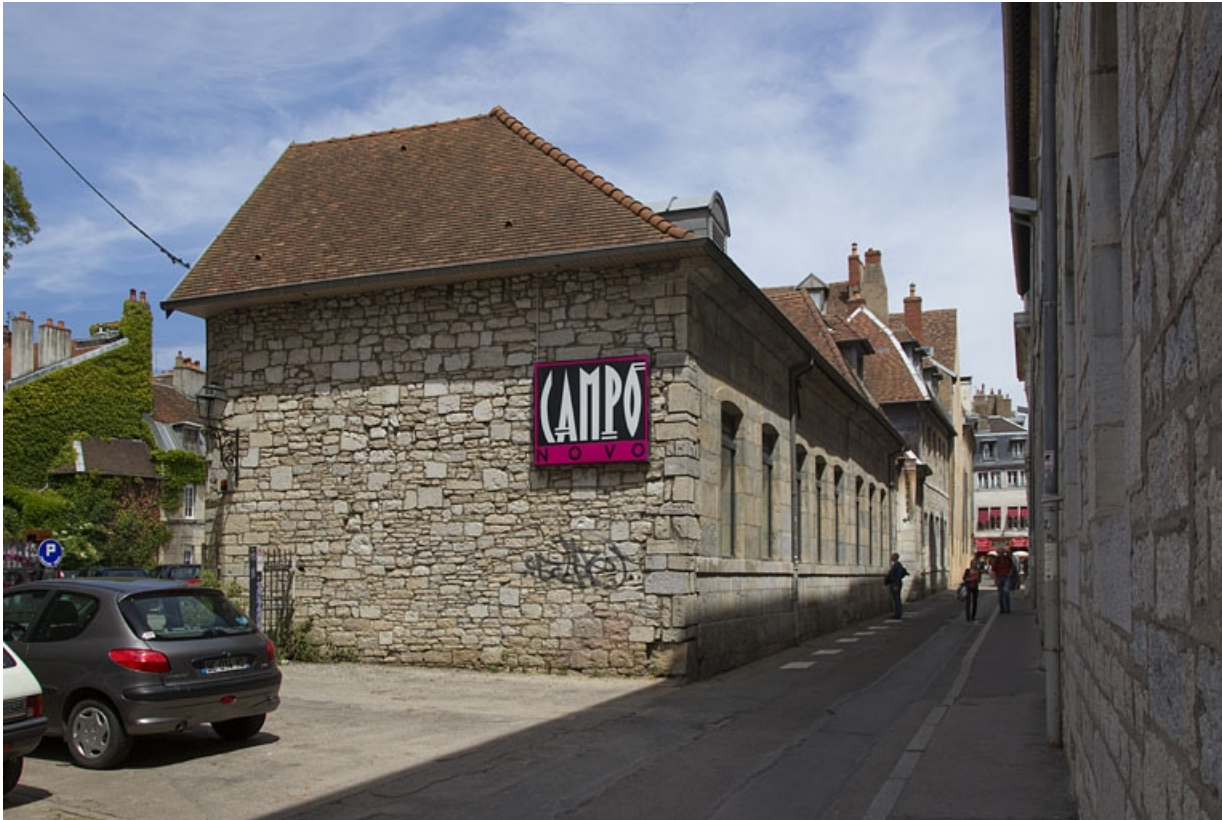
Communs, façade sur rue : de trois quarts gauche. 25, Besançon Grande Rue 48, lieudit : îlot d' Emskerque