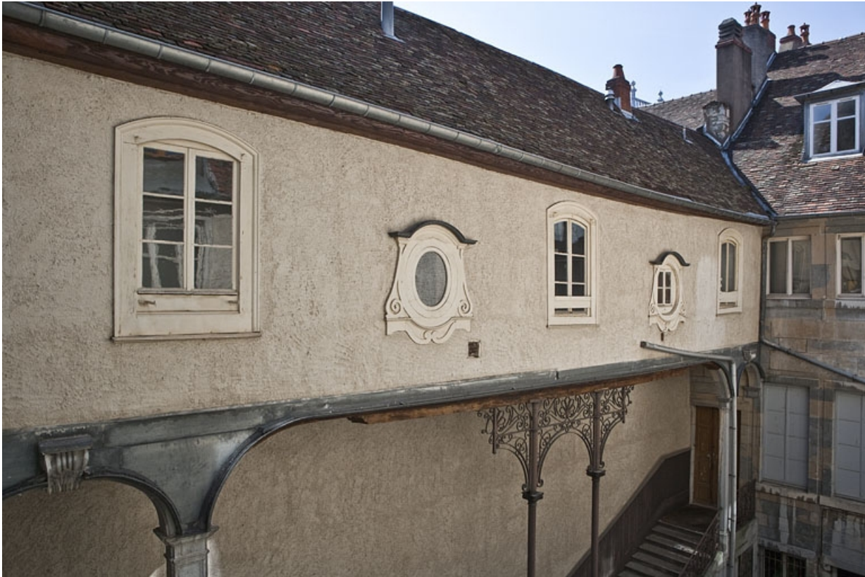
Escalier à cage ouverte sur cour : détail de la galerie fermée au-dessus de l'escalier, de trois quarts gauche.

25, Besançon Grande Rue 48, lieudit : îlot d' Emskerque