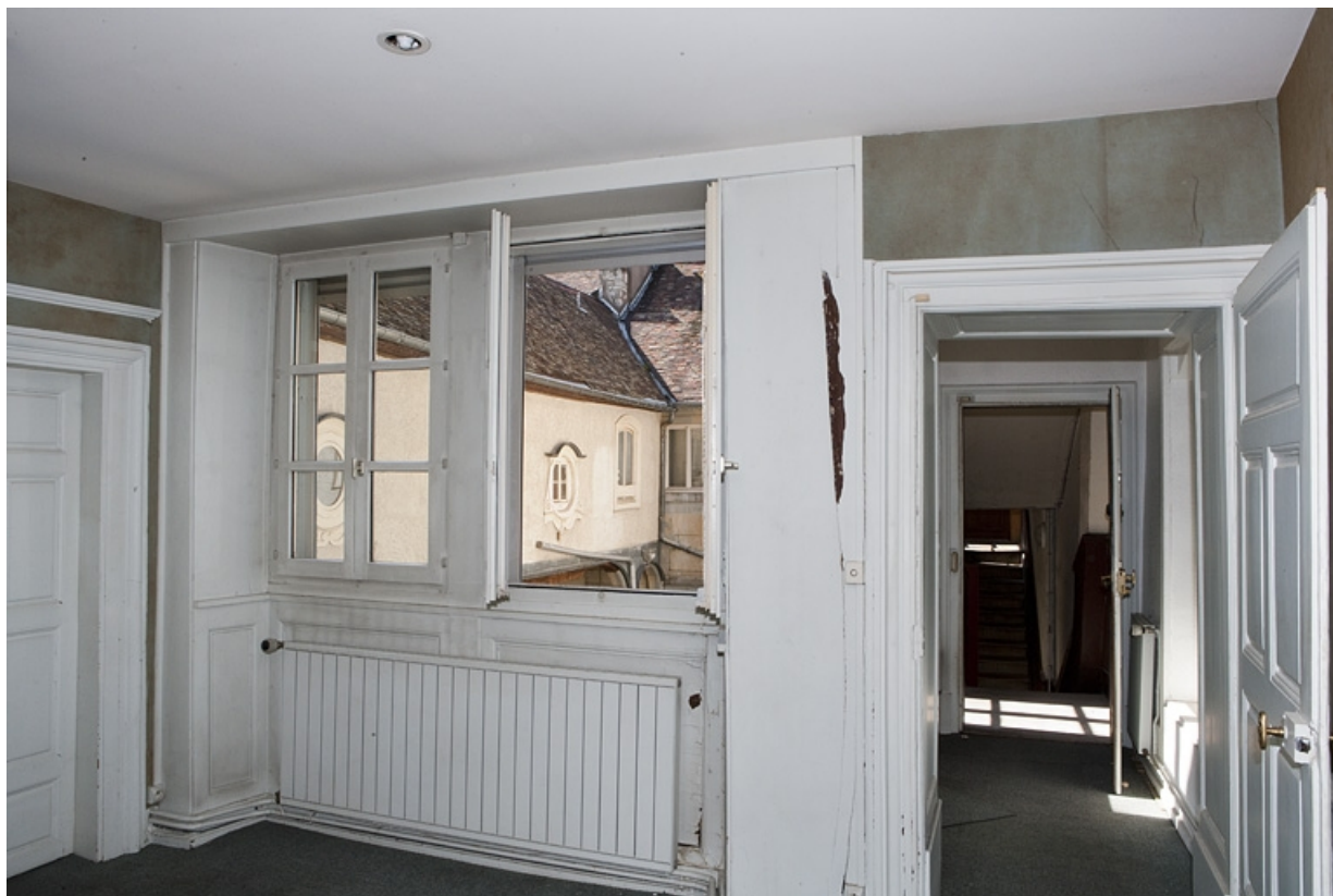
Logis principal, intérieur, appartement du premier étage : vue du couloir d'entrée. 25, Besançon Grande Rue 48, lieudit : îlot d' Emskerque