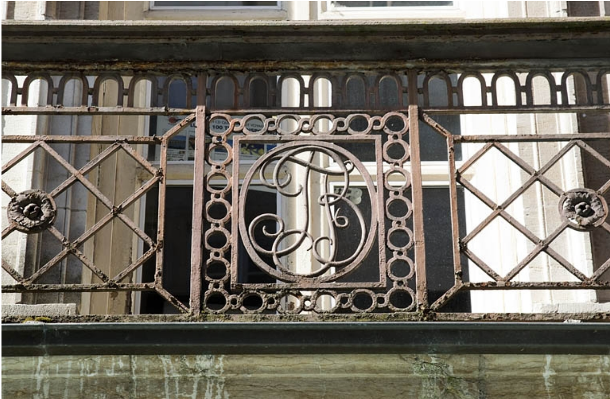
Logis principal, façade sur rue : détail du monogramme du balcon en ferronnerie.

25, Besançon Grande Rue 48, lieudit : îlot d' Emskerque