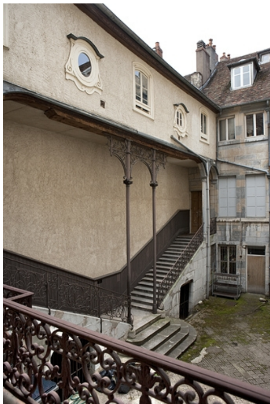
Escalier à cage ouverte sur cour : vue d'ensemble de trois quarts gauche.

25, Besançon Grande Rue 48, lieudit : îlot d' Emskerque