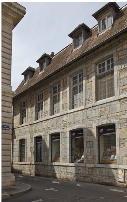
Logis principal, façade latérale gauche sur rue : vue d'ensemble de trois quarts droit. 25, Besançon Grande Rue 48, lieudit : îlot d' Emskerque