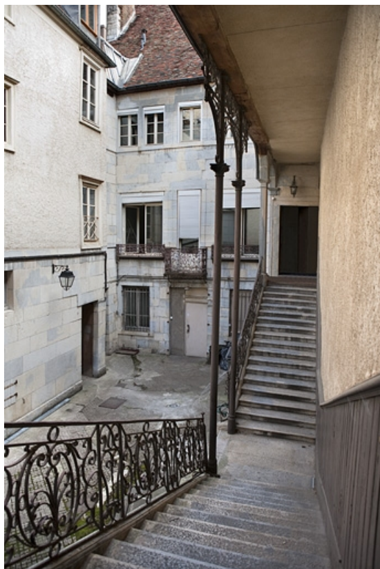
Façade postérieure du logis principal depuis l'intérieur de l'escalier à cage ouverte. 25, Besançon Grande Rue 48, lieudit : îlot d' Emskerque