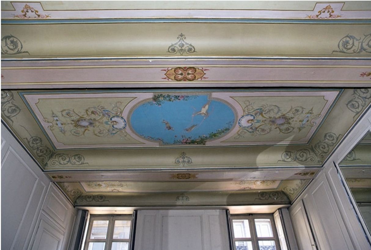
Logis principal, appartement du premier étage, grande pièce sur rue : vue d'ensemble du plafond. 25, Besançon Grande Rue 48, lieudit : îlot d' Emskerque