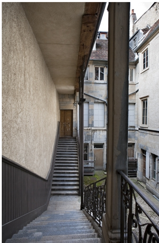
Escalier à cage ouverte sur cour : vue depuis l'intérieur de l'escalier.

25, Besançon Grande Rue 48, lieudit : îlot d' Emskerque