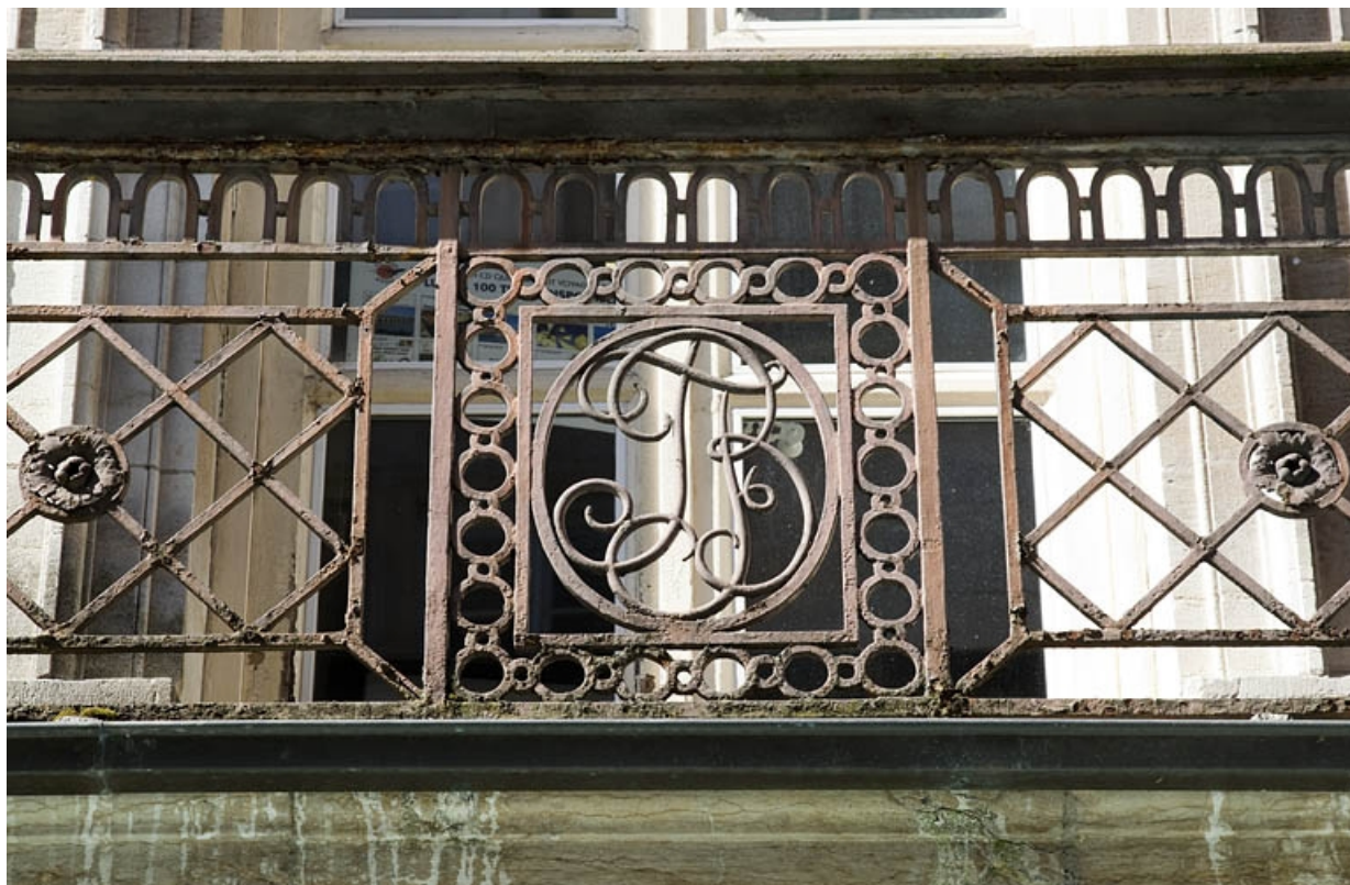
Logis principal, façade sur rue : détail du monogramme du balcon en ferronnerie.

25, Besançon Grande Rue 48, lieudit : îlot d' Emskerque