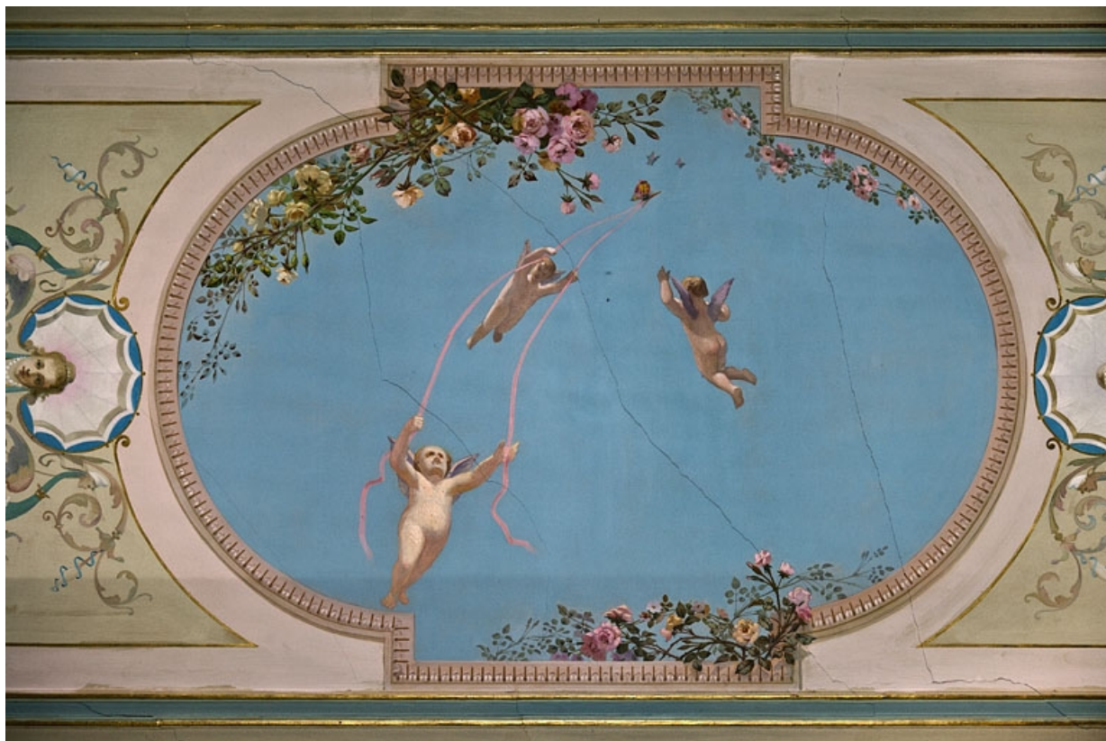
Logis principal, appartement du premier étage, grande pièce sur rue : détail du décor de la partie centrale du plafond. 25, Besançon Grande Rue 48, lieudit : îlot d' Emskerque