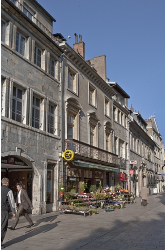
Logis principal, façade sur rue : de trois quarts gauche.

25, Besançon Grande Rue 48, lieudit : îlot d' Emskerque