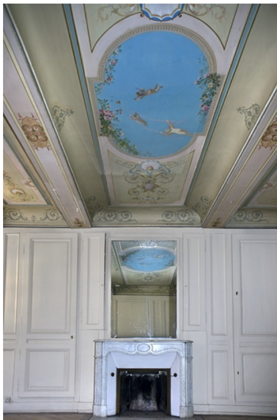
Logis principal, appartement du premier étage, grande pièce sur rue : vue d'ensemble de la cheminée et du décor du plafond. 25, Besançon Grande Rue 48, lieudit : îlot d' Emskerque