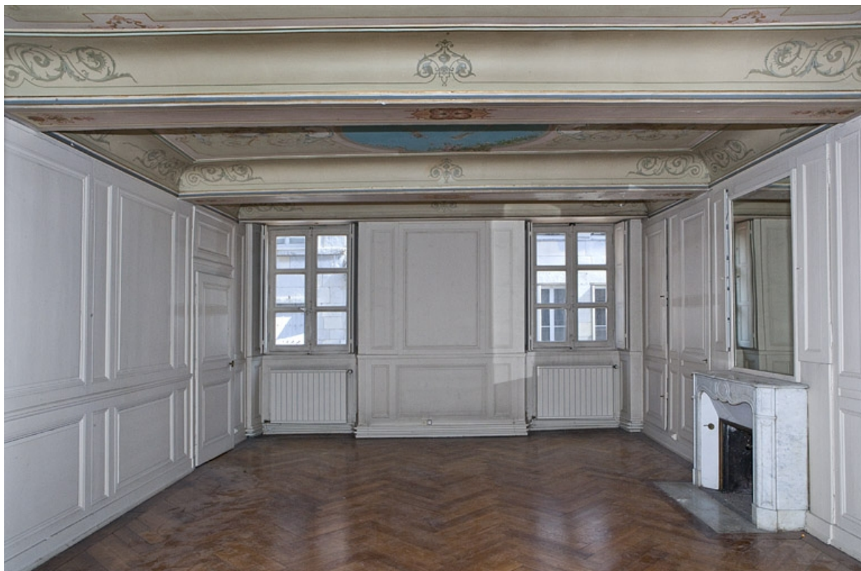
Logis principal, appartement du premier étage, grande pièce sur rue : vue d'ensemble depuis le fond. 25, Besançon Grande Rue 48, lieudit : îlot d' Emskerque