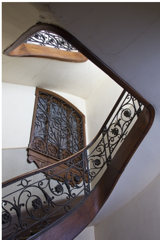
Logis principal : vue de la cage de l'escalier dans oeuvre.

25, Besançon, 9 rue d' Anvers, lieudit : îlot d' Emskerque