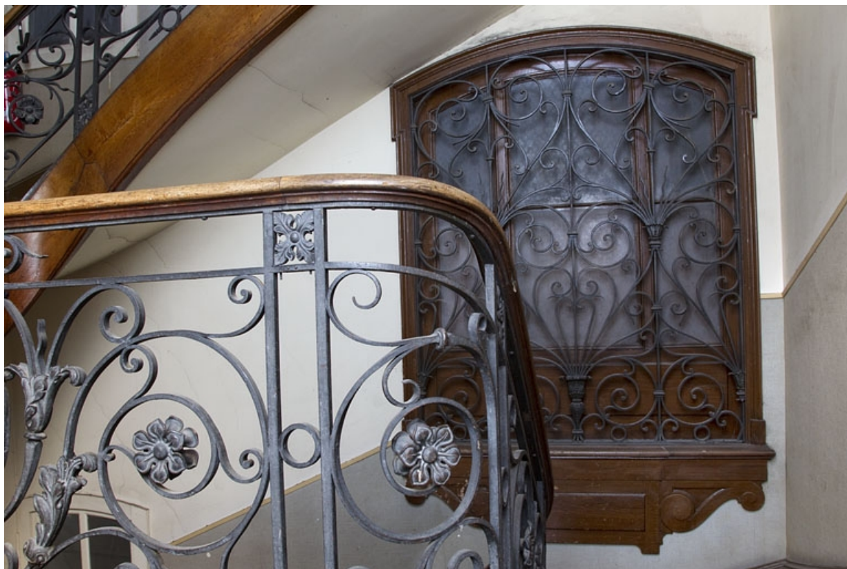
Logis principal, cage de l'escalier dans oeuvre : détail de la grille devant une fenêtre.

25, Besançon, 9 rue d' Anvers, lieudit : îlot d' Emskerque