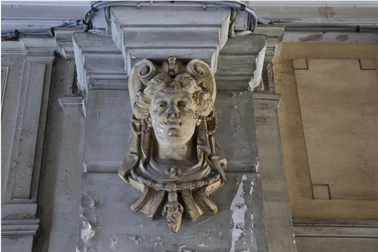
Logis principal, passage cocher, décor : tête de femme.

25, Besançon, 9 rue d' Anvers, lieudit : îlot d' Emskerque