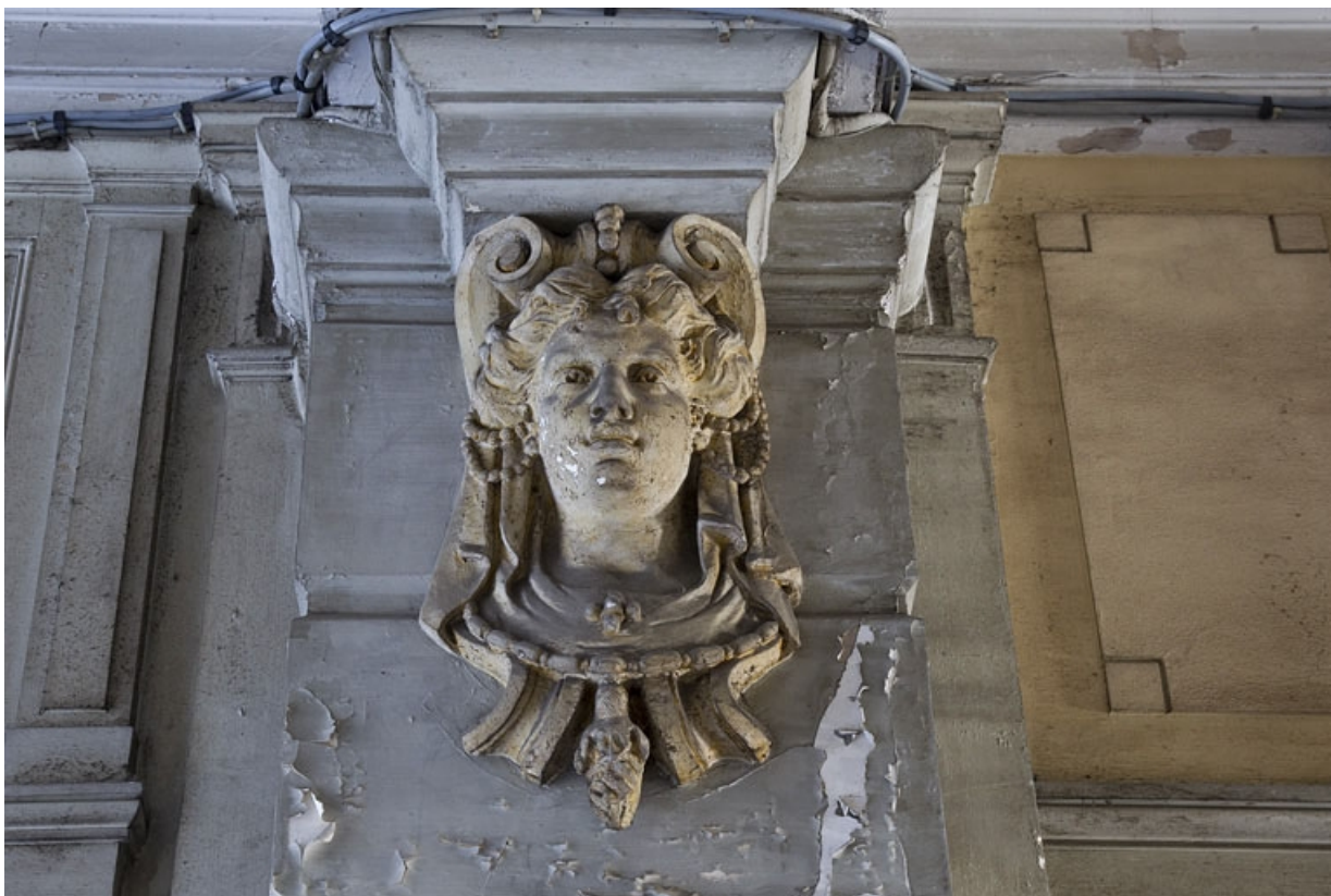
Logis principal, passage cocher, décor : tête de femme.

25, Besançon, 9 rue d' Anvers, lieudit : îlot d' Emskerque