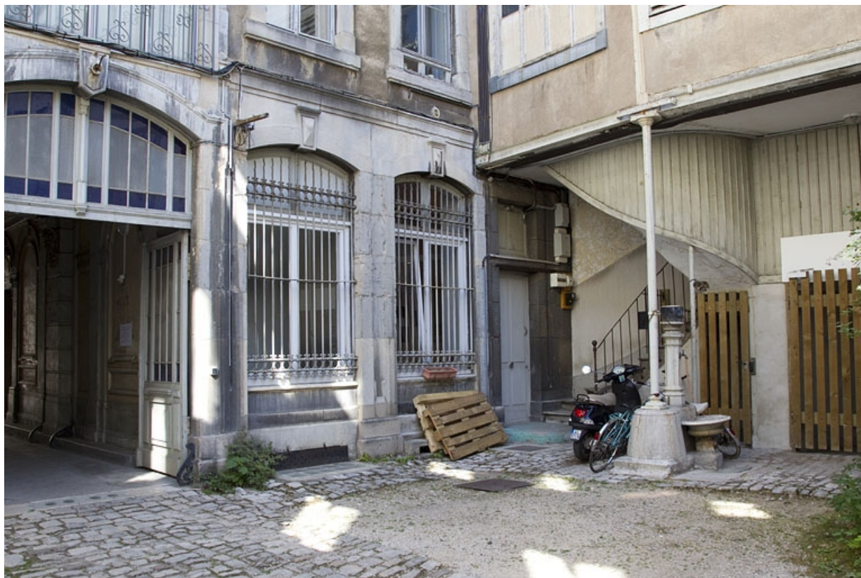
Logis principal, façade postérieure : fenêtres du rez-de-chaussée, à gauche du portail. 25, Besançon, 9 rue d' Anvers, lieu-dit : îlot d' Emskerque