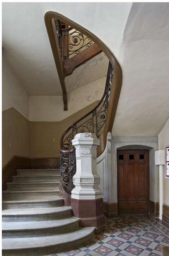
Logis principal, escalier dans oeuvre : vue d'ensemble.

25, Besançon, 9 rue d' Anvers, lieudit : îlot d' Emskerque