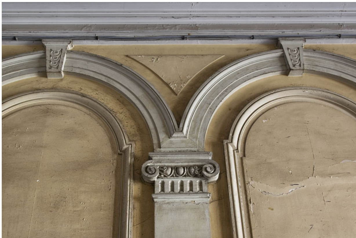
Logis principal, passage cocher : détail du décor.

25, Besançon, 9 rue d' Anvers, lieudit : îlot d' Emskerque