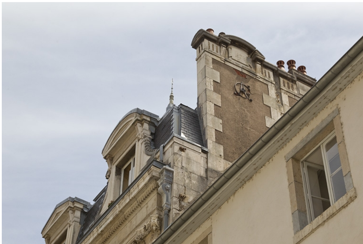
Logis principal, cheminée droite : détail du monogramme.

25, Besançon, 9 rue d' Anvers, lieu-dit : îlot d' Emskerque