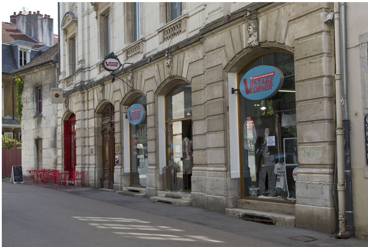
Logis principal, façade sur rue : détail du rez-de-chaussée, de trois quarts droit. 25, Besançon, 9 rue d' Anvers, lieudit : îlot d' Emskerque