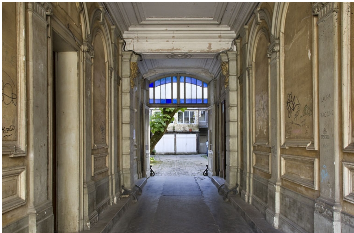
Logis principal, passage cocher : vue en direction de la cour.

25, Besançon, 9 rue d' Anvers, lieudit : îlot d' Emskerque