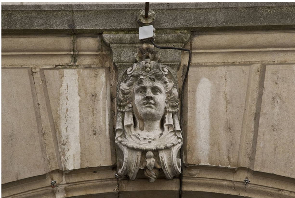
Logis principal, façade sur rue, décor des arcades boutiquières : détail d'une tête de femme. 25, Besançon, 9 rue d' Anvers, lieudit : îlot d' Emskerque