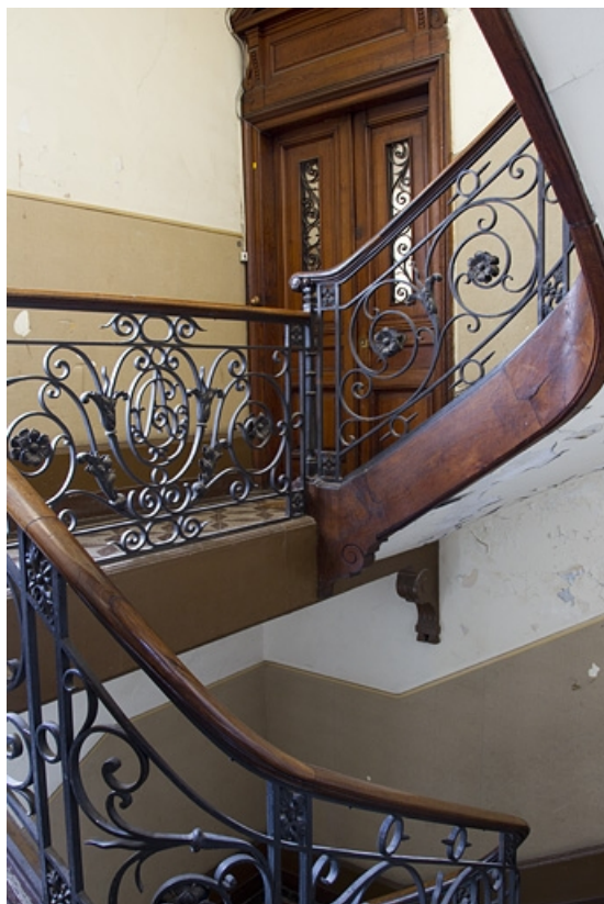
Logis principal, détail de l'escalier.

25, Besançon, 9 rue d' Anvers, lieudit : îlot d' Emskerque