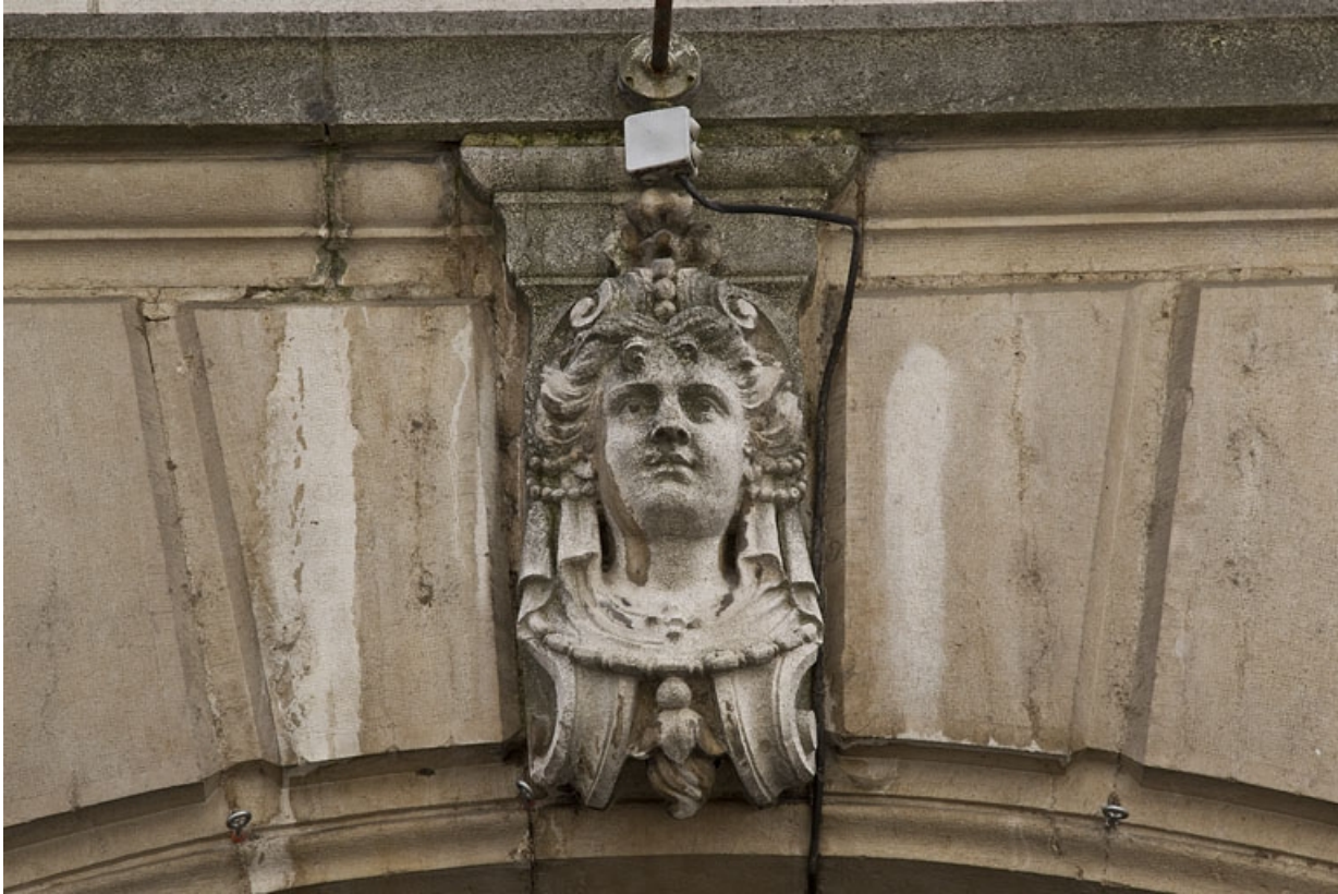
Logis principal, façade sur rue, décor des arcades boutiquières : détail d'une tête de femme.

25, Besançon, 9 rue d' Anvers, lieudit : îlot d' Emskerque