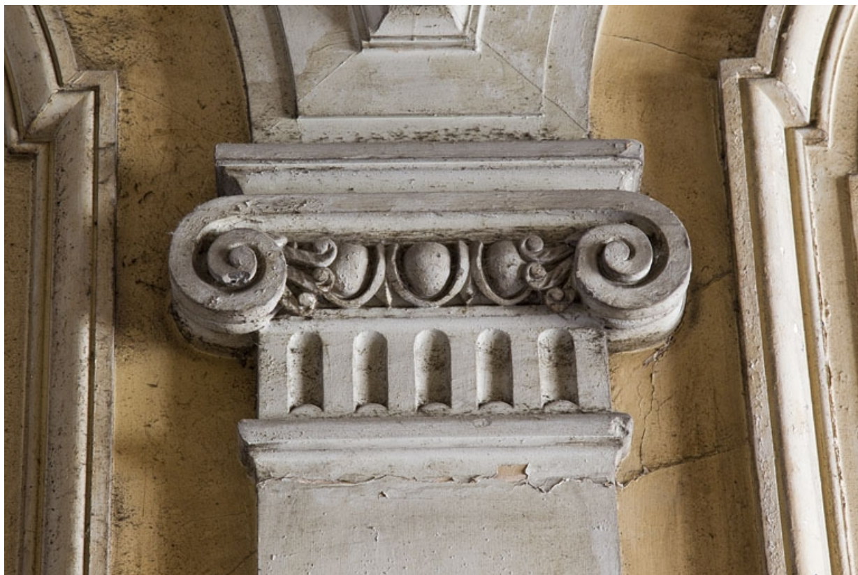
Logis principal, passage cocher : détail du décor, chapiteau ionique.

25, Besançon, 9 rue d' Anvers, lieudit : îlot d' Emskerque