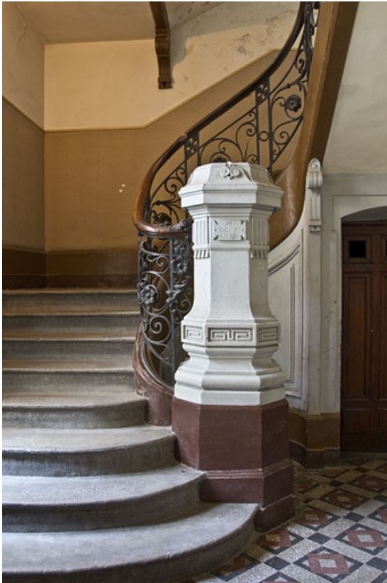
Logis principal, départ de l'escalier dans oeuvre.

25, Besançon, 9 rue d' Anvers, lieudit : îlot d' Emskerque