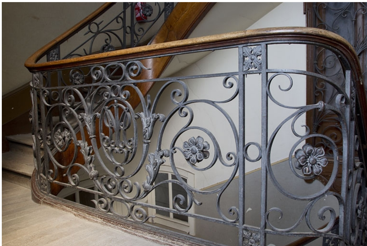
Logis principal, escalier dans oeuvre : détail de la rampe en ferronnerie.

25, Besançon, 9 rue d' Anvers, lieudit : îlot d' Emskerque