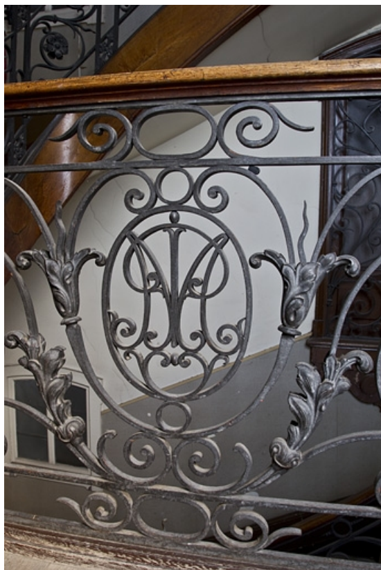
Logis principal, escalier dans oeuvre : détail du monogramme sur la rampe en ferronnerie. 25, Besançon, 9 rue d' Anvers, lieudit : îlot d' Emskerque