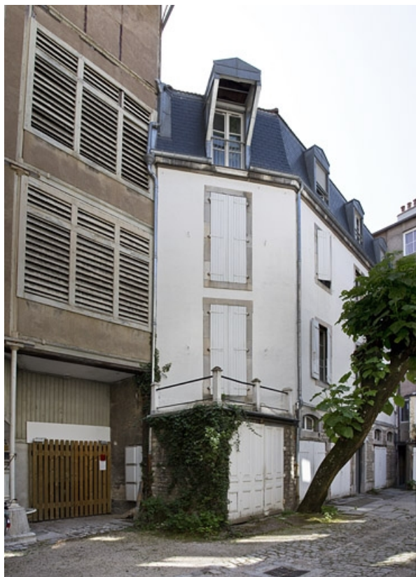
Logis secondaire à gauche de la cour : vue d'ensemble.

25, Besançon, 9 rue d' Anvers, lieudit : îlot d' Emskerque