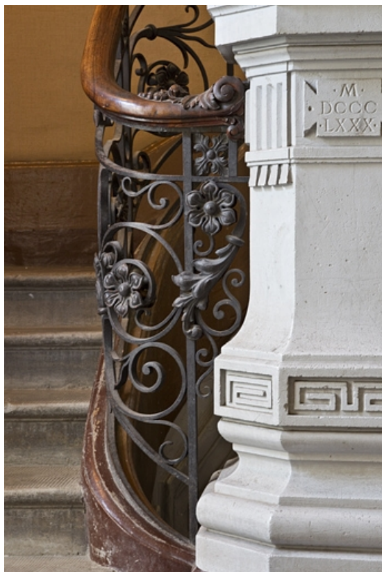
Logis principal, départ de l'escalier dans oeuvre : détail de la rampe en ferronnerie.

25, Besançon, 9 rue d' Anvers, lieudit : îlot d' Emskerque