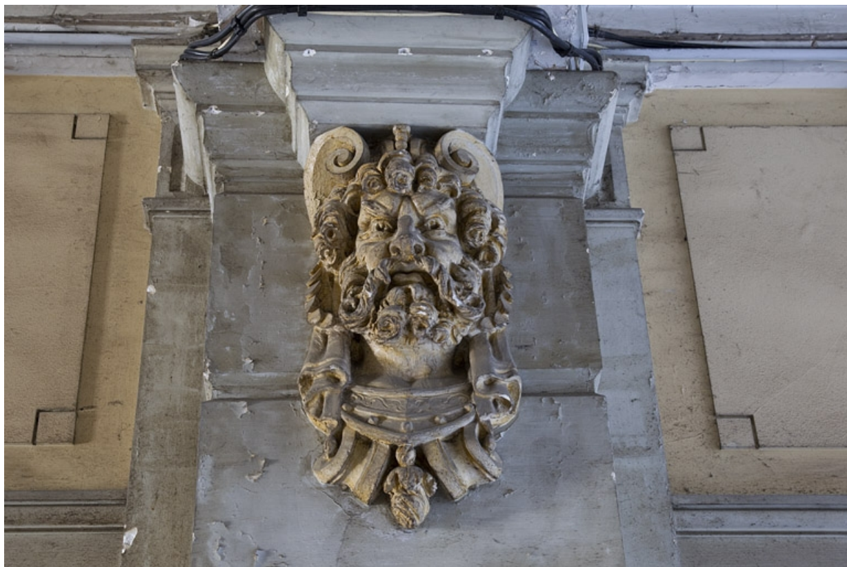
Logis principal, passage cocher, décor : tête d'homme barbu.

25, Besançon, 9 rue d' Anvers, lieudit : îlot d' Emskerque