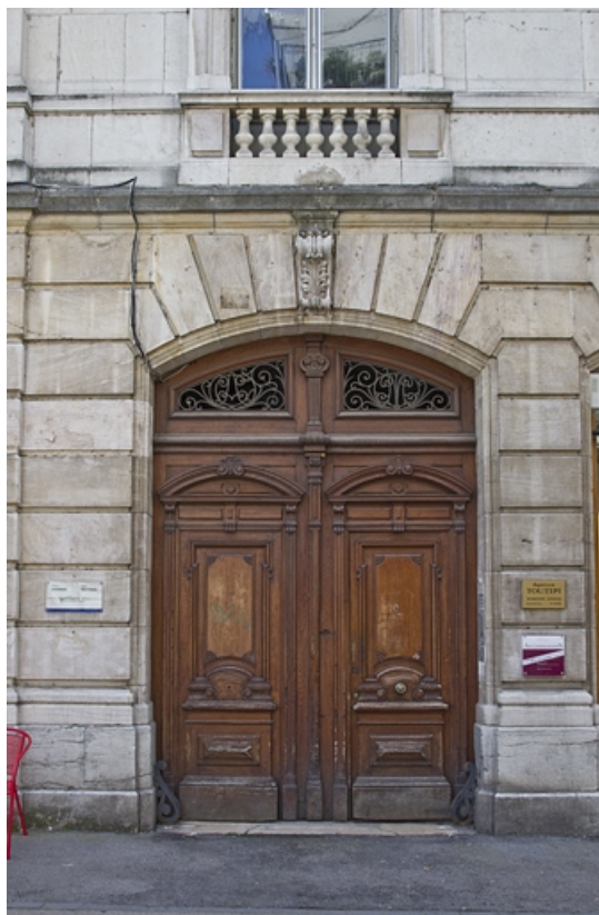
Logis principal, façade sur rue : détail du portail d'entrée.

25, Besançon, 9 rue d' Anvers, lieudit : îlot d' Emskerque