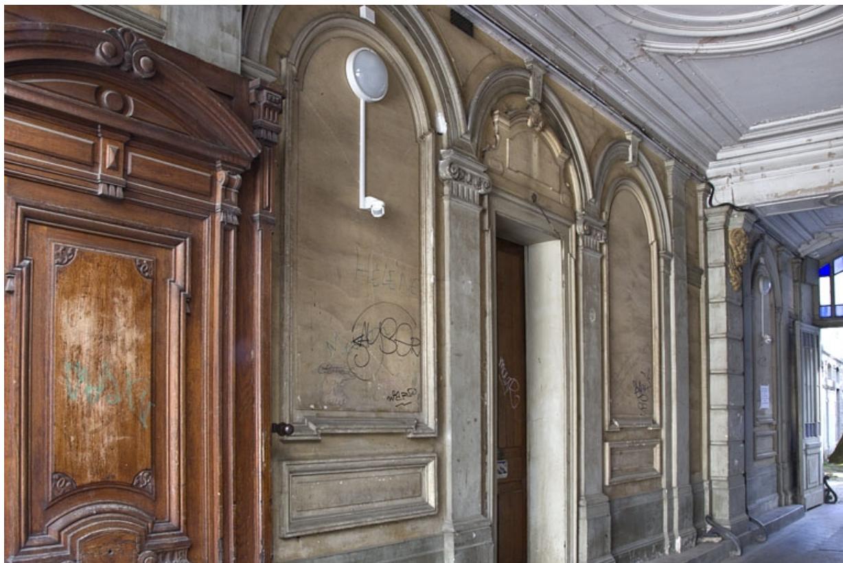
Logis principal, passage cochier : décor du mur gauche.

25, Besançon, 9 rue d' Anvers, lieudit : îlot d' Emskerque