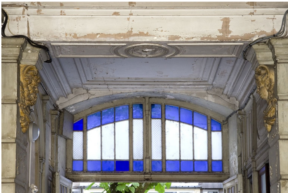
Logis principal, passage cocher : portail côté cour, partie supérieure.

25, Besançon, 9 rue d' Anvers, lieudit : îlot d' Emskerque