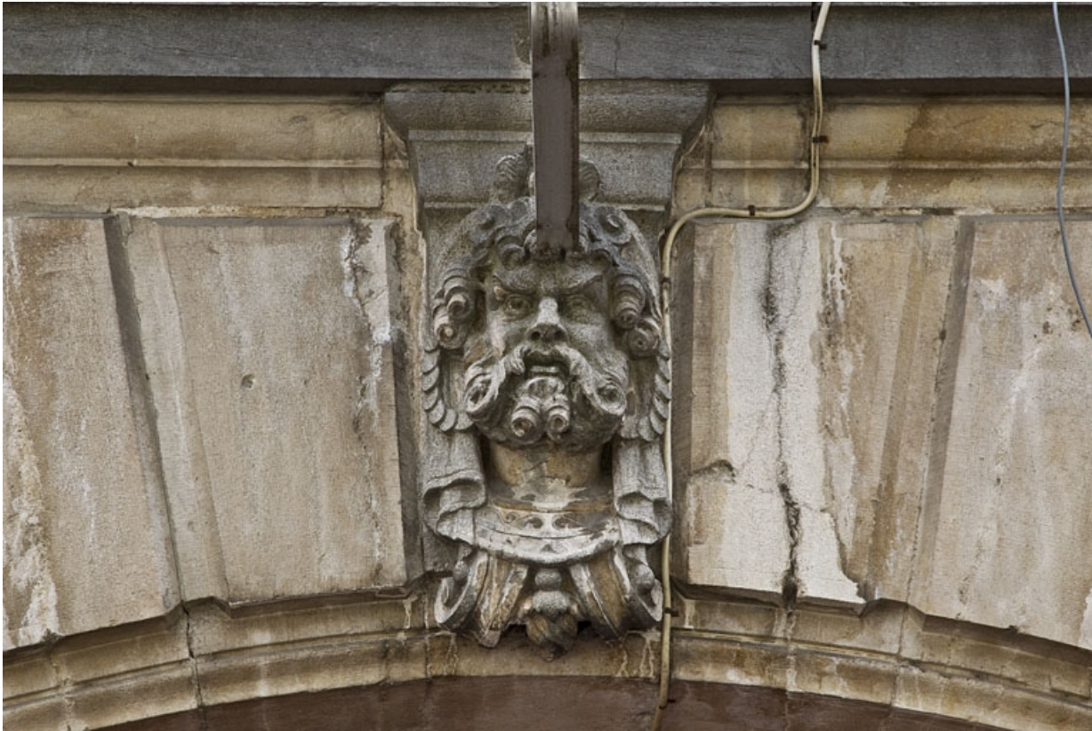
Logis principal, façade sur rue, décor des arcades boutiquières : détail d'une tête d'homme.

25, Besançon, 9 rue d' Anvers, lieudit : îlot d' Emskerque