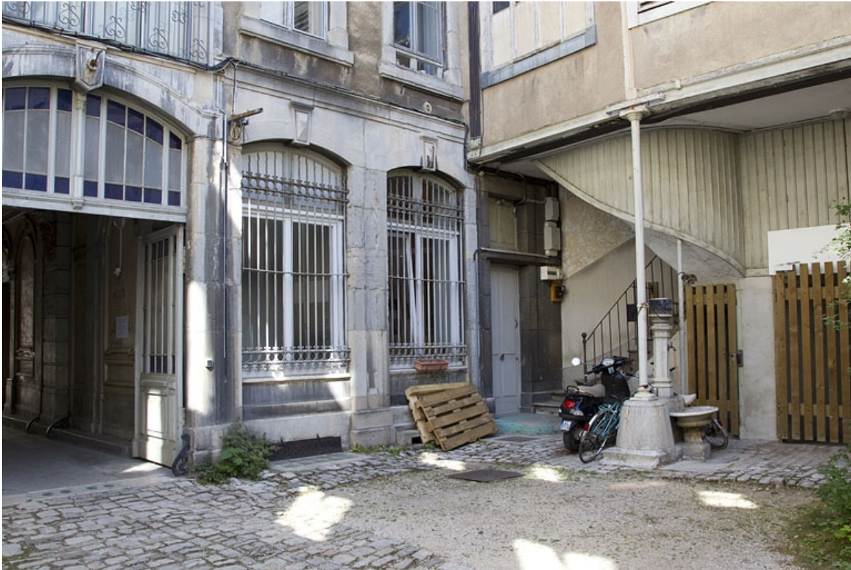
Logis principal, façade postérieure : fenêtres du rez-de-chaussée, à gauche du portail.

25, Besançon, 9 rue d' Anvers, lieudit : îlot d' Emskerque