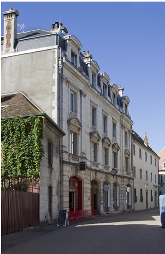
Vue d'ensemble du logis principal, de trois quarts gauche.

25, Besançon, 9 rue d' Anvers, lieudit : îlot d' Emskerque