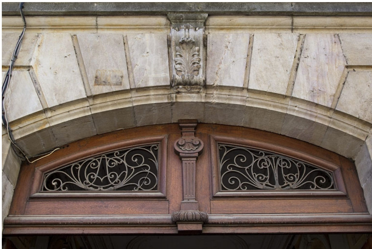
Logis principal, portail d'entrée : détail de la partie supérieure.

25, Besançon, 9 rue d' Anvers, lieudit : îlot d' Emskerque