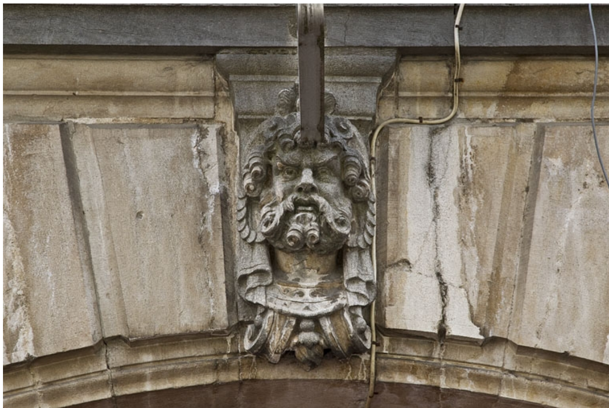
Logis principal, façade sur rue, décor des arcades boutiquières : détail d'une tête d'homme.

25, Besançon, 9 rue d' Anvers, lieudit : îlot d' Emskerque