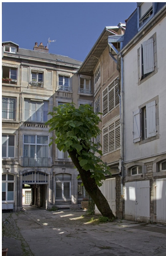
Logis principal, façade postérieure depuis le fond de la cour. 25, Besançon, 9 rue d' Anvers, lieudit : îlot d' Emskerque