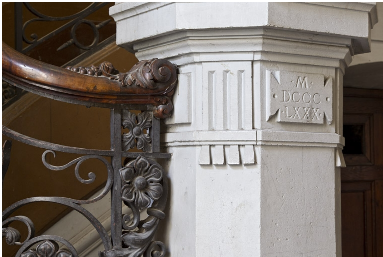
Logis principal, départ de l'escalier dans oeuvre : détail de la date (1890).

25, Besançon, 9 rue d' Anvers, lieudit : îlot d' Emskerque