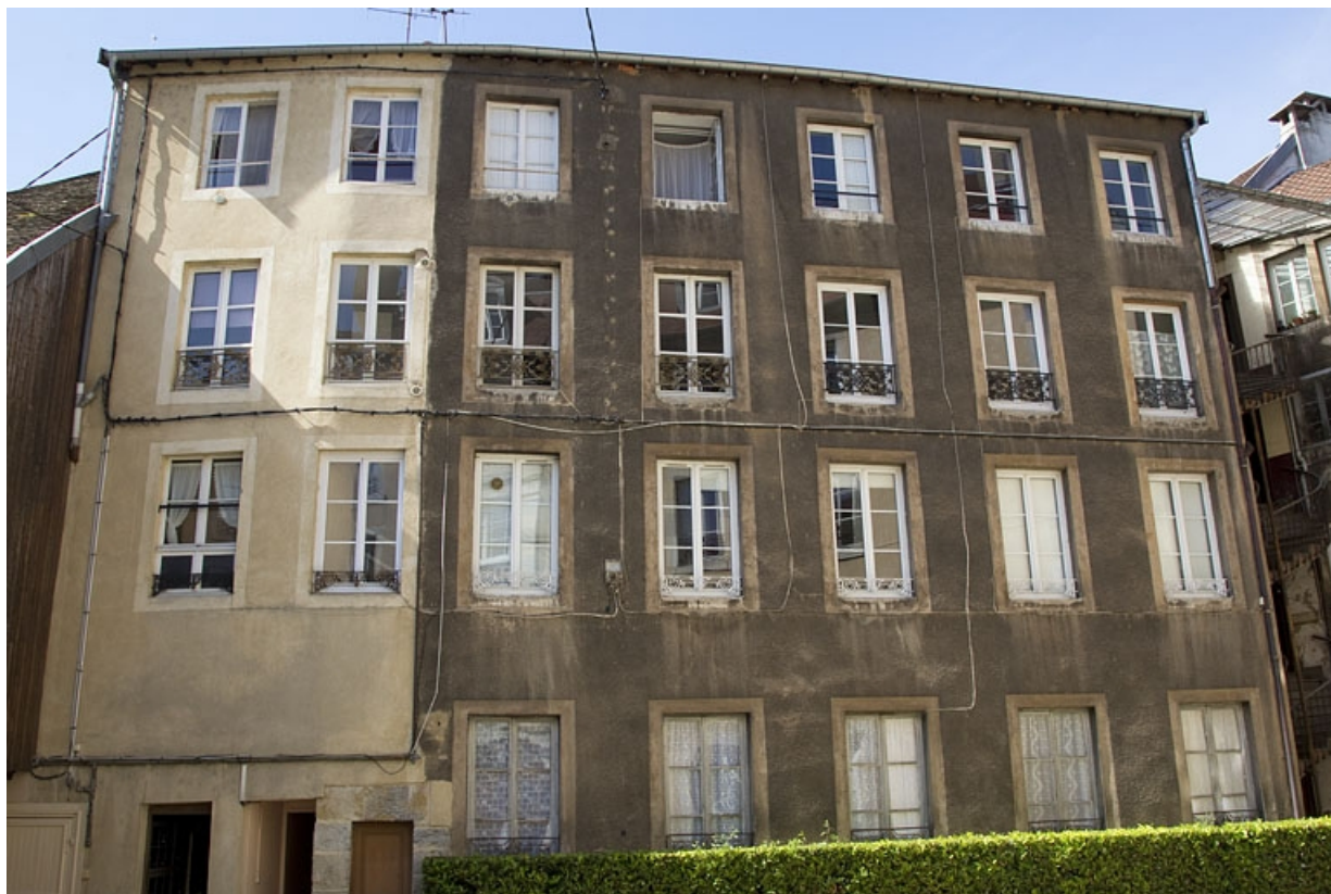
Logis secondaire droit : vue d'ensemble de la façade antérieure.

25, Besançon, 15 rue Pasteur, lieudit : îlot d' Emskerque