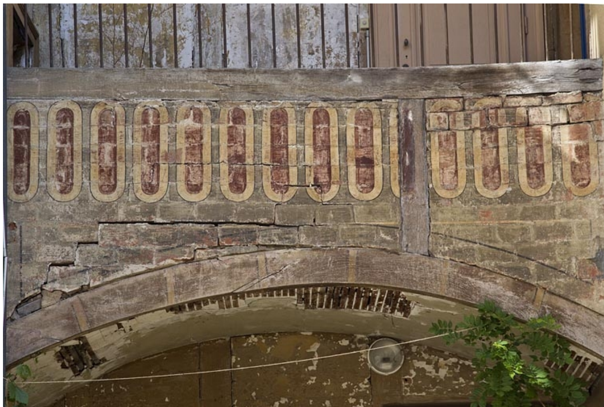
Galleries superposées entre le logis secondaire gauche et le logis principal : détail d'un décor peint.

25, Besançon, 15 rue Pasteur, lieudit : îlot d' Emskerque