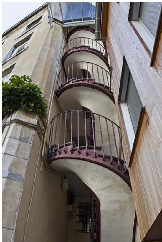
Logis secondaire gauche : détail de l'escalier à cage ouverte à l'extrémité du bâtiment. 25, Besançon, 15 rue Pasteur, lieudit : îlot d' Emskerque