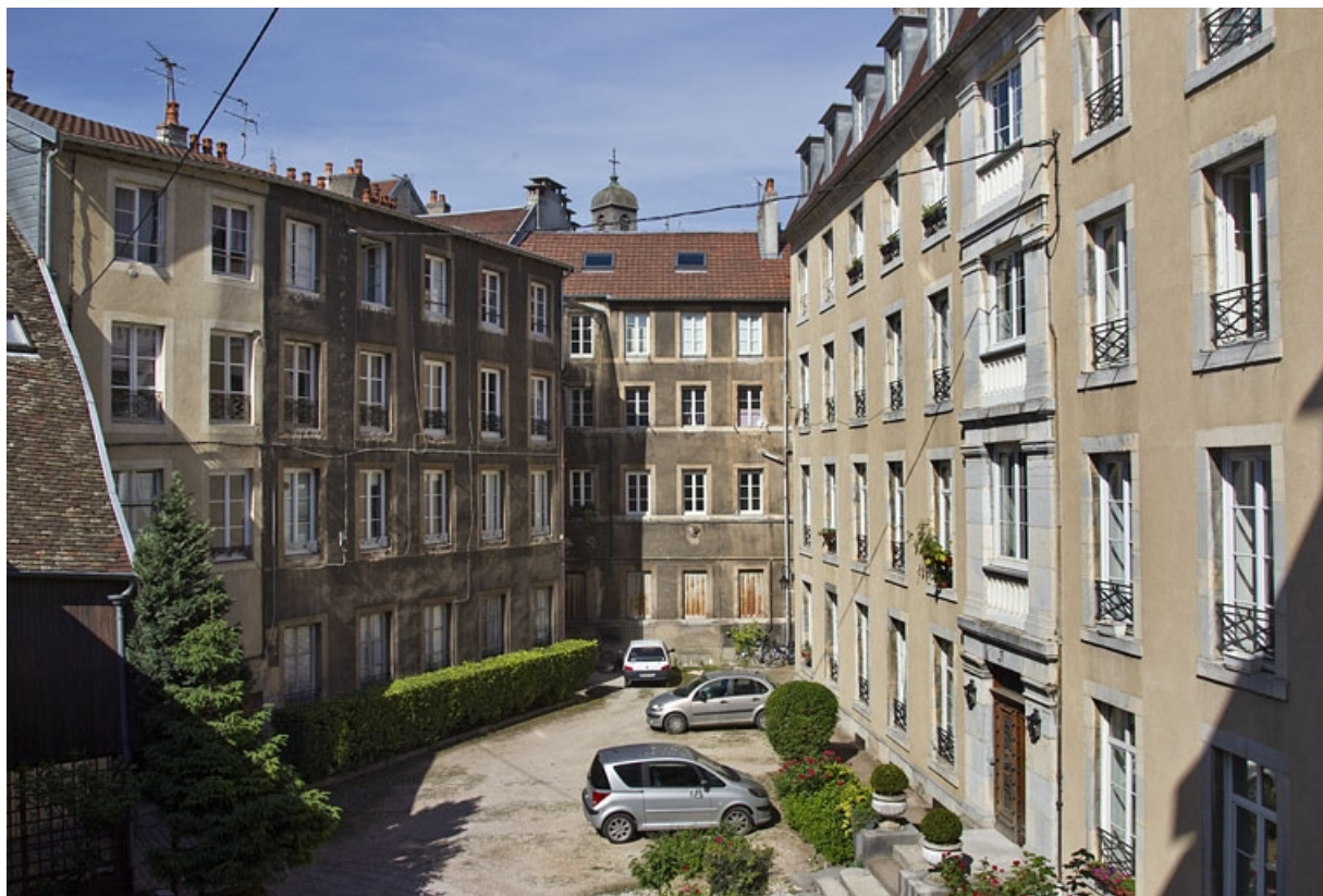
Vue d'ensemble des logis depuis le fond de la cour.

25, Besançon, 15 rue Pasteur, lieudit : îlot d' Emskerque