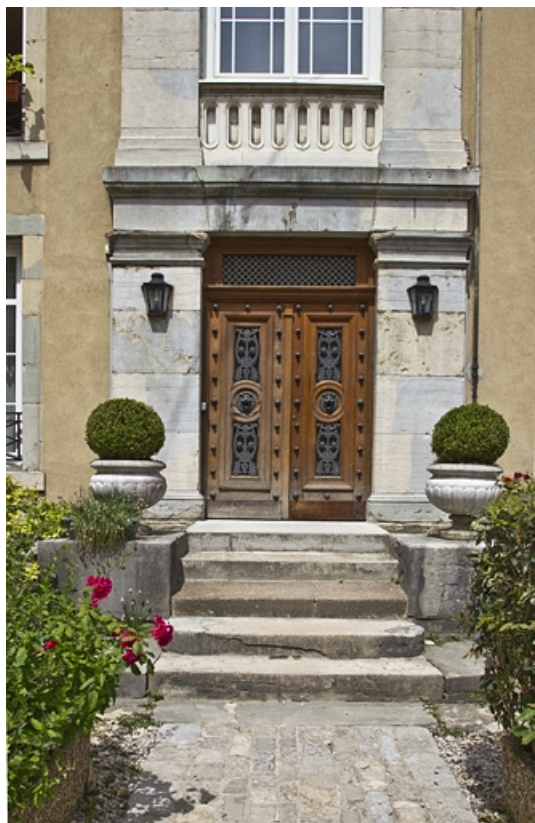
Logis secondaire à gauche dans la cour, façade : détail de la porte d'entrée. 25, Besançon, 15 rue Pasteur, lieudit : îlot d' Emskerque