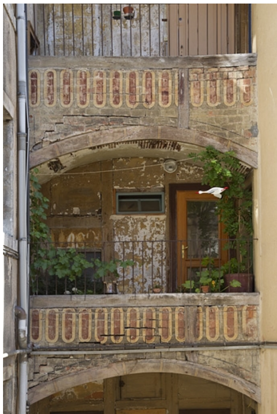
Galleries superposées entre le logis secondaire gauche et le logis principal : détail de la galerie du premier étage. 25, Besançon, 15 rue Pasteur, lieudit : îlot d' Emskerque