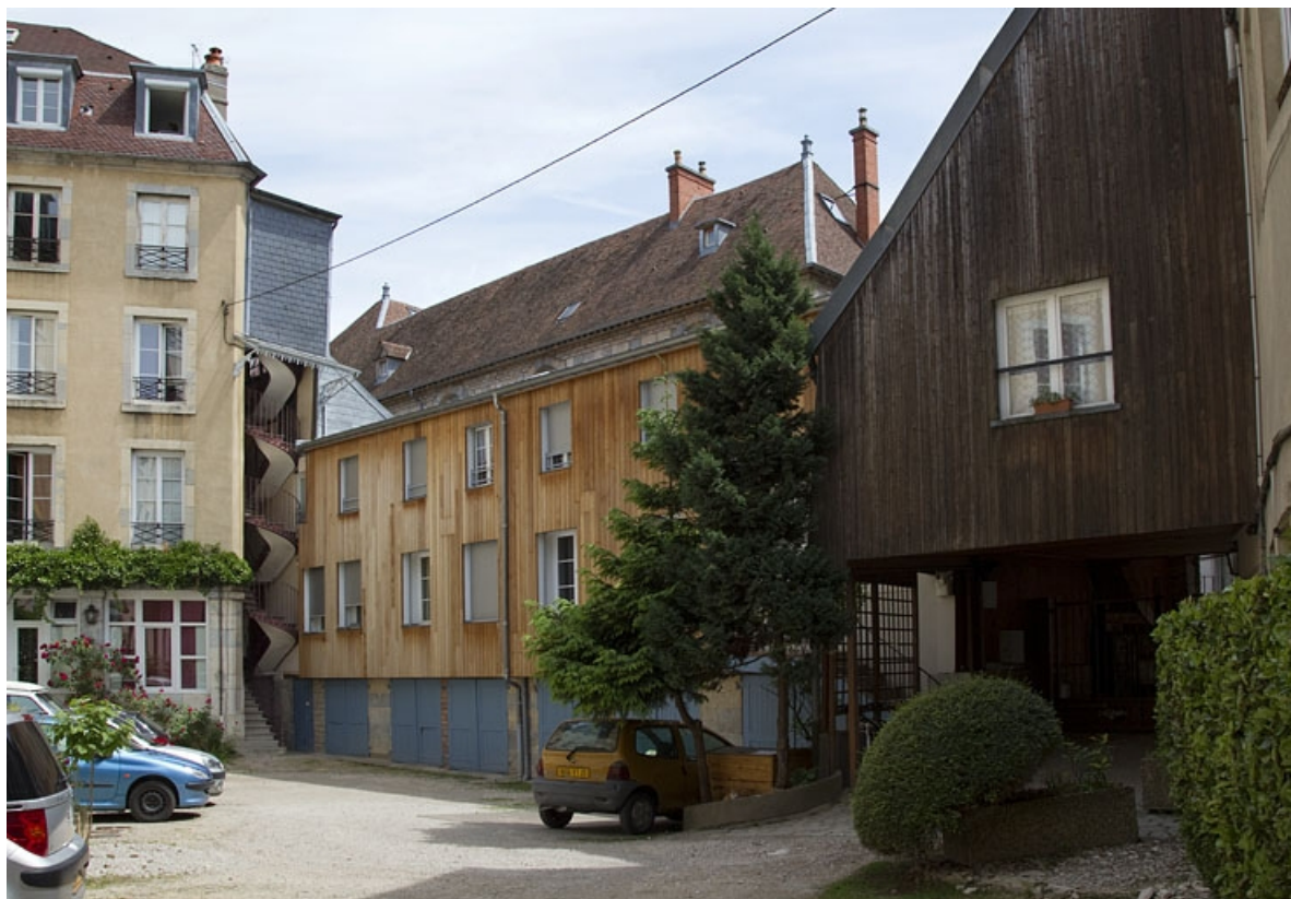
Vue du logis secondaire situé au fond de la cour, de trois quarts droit.

25, Besançon, 15 rue Pasteur, lieudit : îlot d' Emskerque