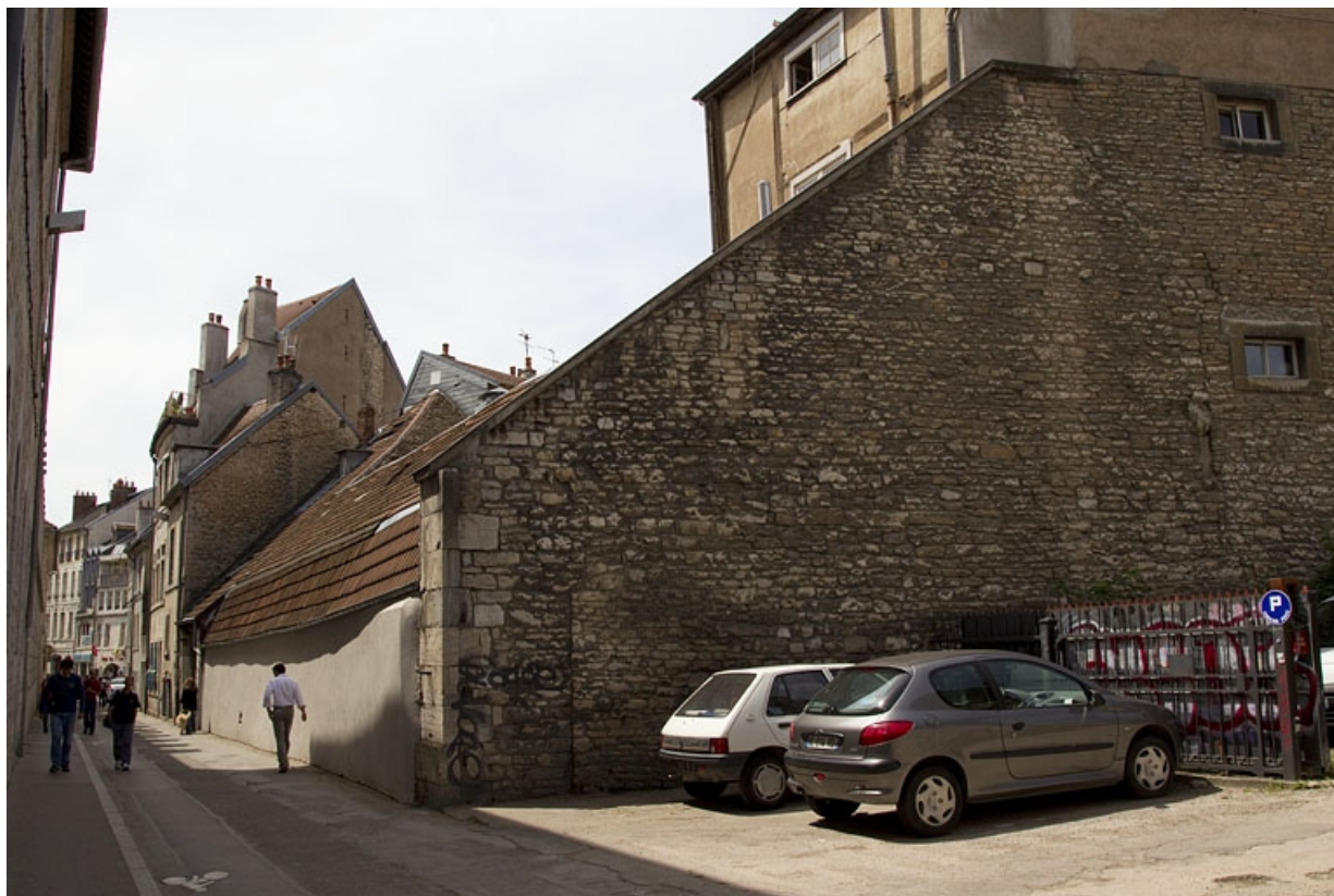
Logis secondaire au fond de la cour : façade postérieure, de trois quarts droit. 25, Besançon, 15 rue Pasteur, lieudit : îlot d' Emskerque