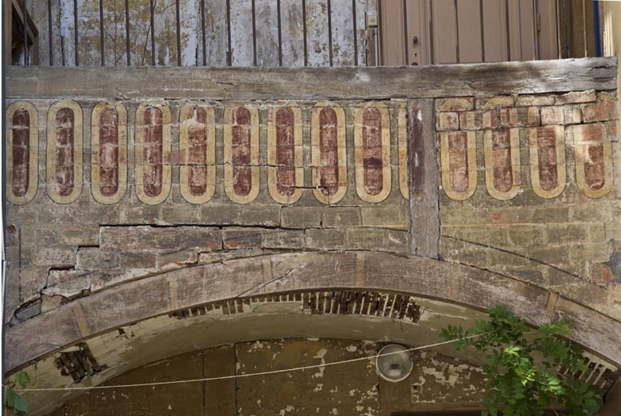
Galleries superposées entre le logis secondaire gauche et le logis principal : détail d'un décor peint.

25, Besançon, 15 rue Pasteur, lieudit : îlot d' Emskerque