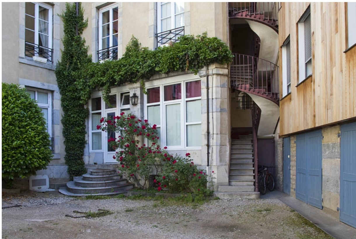
Logis secondaire à gauche de la cour : détail du rez-de-chaussée de l'aile droite.

25, Besançon, 15 rue Pasteur, lieudit : îlot d' Emskerque