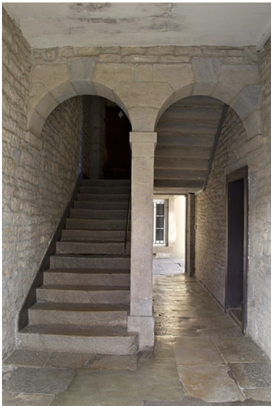
Logis principal : vue d'ensemble de l'escalier dans oeuvre.

25, Besançon, 15 rue Pasteur, lieudit : îlot d' Emskerque