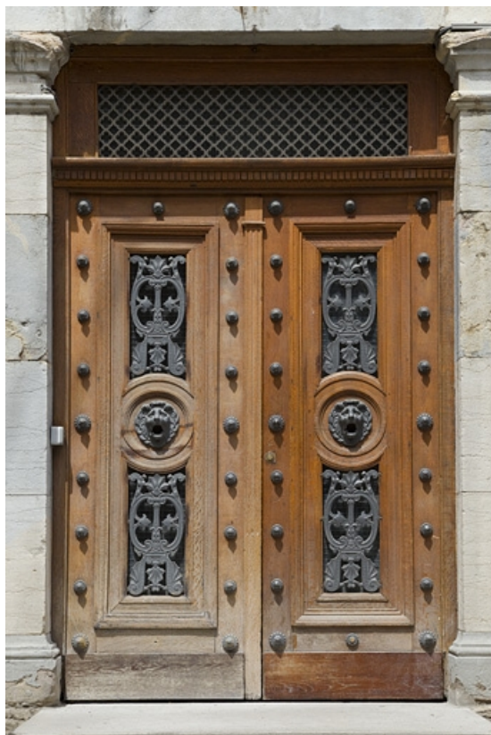
Logis secondaire gauche : vue rapprochée de la porte d'entrée.

25, Besançon, 15 rue Pasteur, lieudit : îlot d' Emskerque