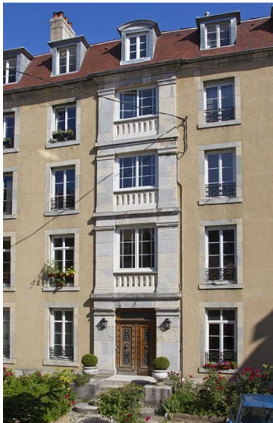
Logis secondaire à gauche dans la cour, façade : détail de la partie centrale. 25, Besançon, 15 rue Pasteur, lieudit : îlot d' Emskerque