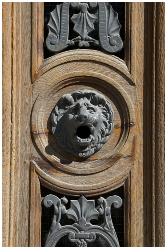
Logis secondaire gauche, porte d'entrée : décor, détail d'une tête de lion.

25, Besançon, 15 rue Pasteur, lieudit : îlot d' Emskerque