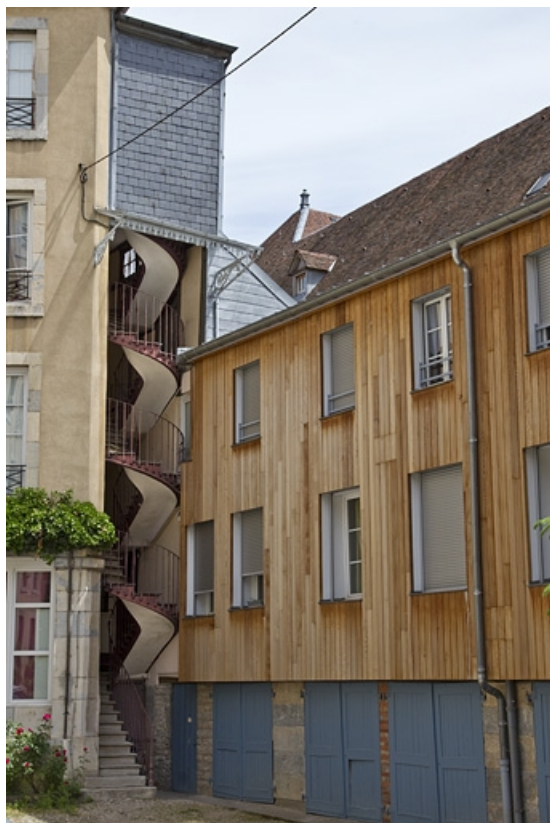
Vue du logis secondaire situé au fond de la cour.

25, Besançon, 15 rue Pasteur, lieudit : îlot d' Emskerque