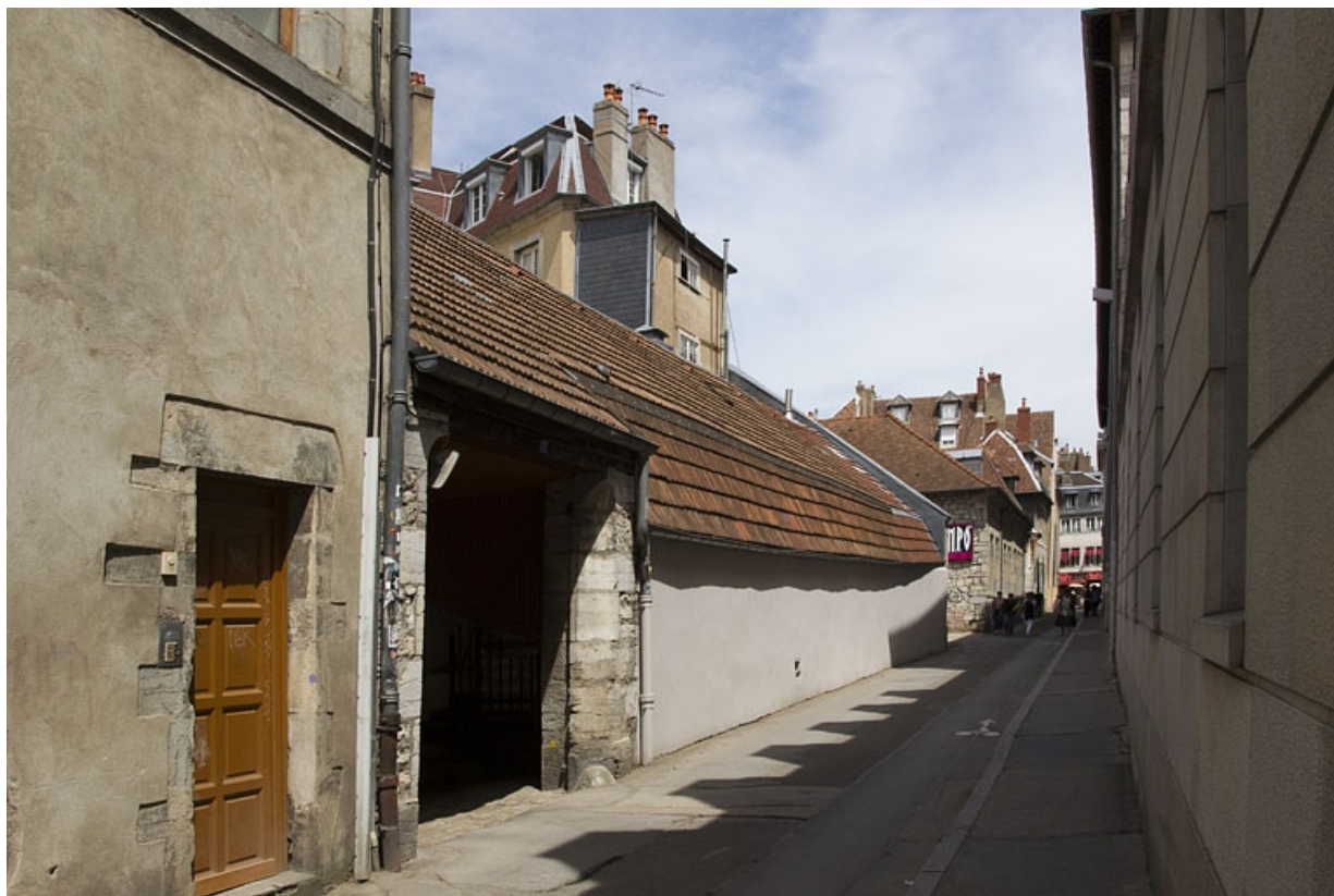
Logis secondaire au fond de la cour : façade postérieure, de trois quarts gauche.

25, Besançon, 15 rue Pasteur, lieudit : îlot d' Emskerque