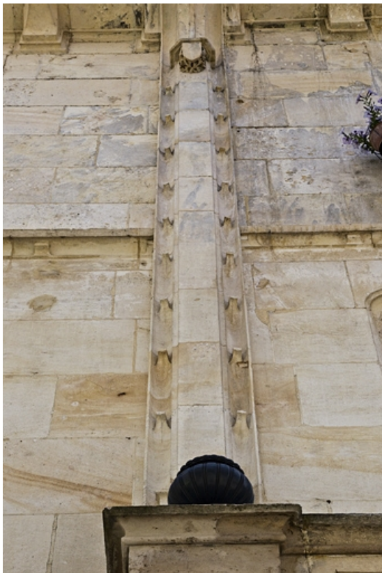
Logis secondaire, façade antérieure : détail d'un pilastre.

25, Besançon, 1, 3 rue d' Anvers, lieudit : îlot d' Emskerque