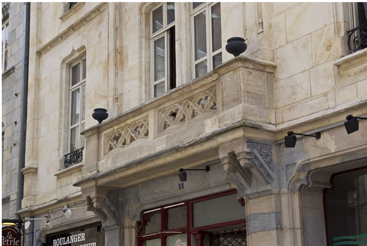
Logis secondaire, façade antérieure : détail du balcon du premier étage, de trois quarts droit.

25, Besançon, 1, 3 rue d' Anvers, lieudit : îlot d' Emskerque