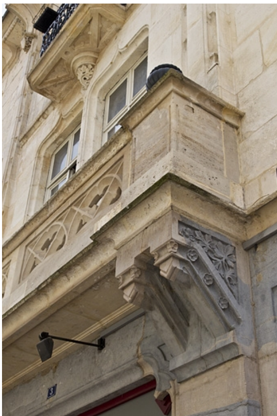
Logis secondaire, façade antérieure, balcon du premier étage, détail du support droit. 25, Besançon, 1, 3 rue d' Anvers, lieudit : îlot d' Emskerque