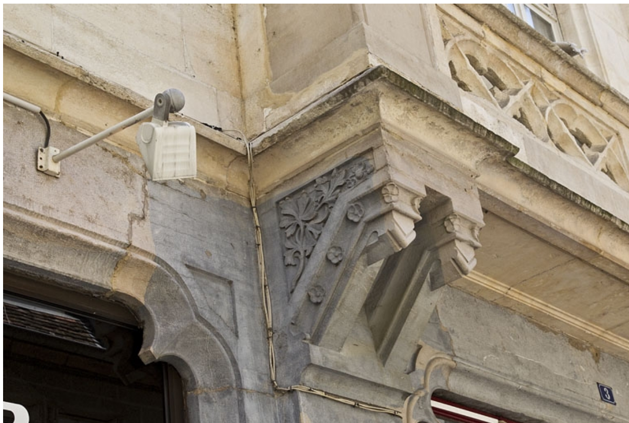
Logis secondaire, façade antérieure, balcon du premier étage : détail du support gauche.

25, Besançon, 1, 3 rue d' Anvers, lieudit : îlot d' Emskerque