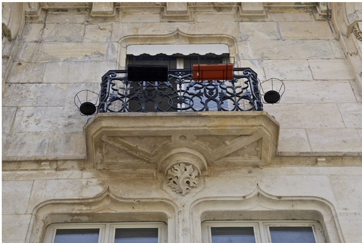
Logis secondaire, façade antérieure, balcon du deuxième étage : en contre-plongée.

25, Besançon, 1, 3 rue d' Anvers, lieudit : îlot d' Emskerque