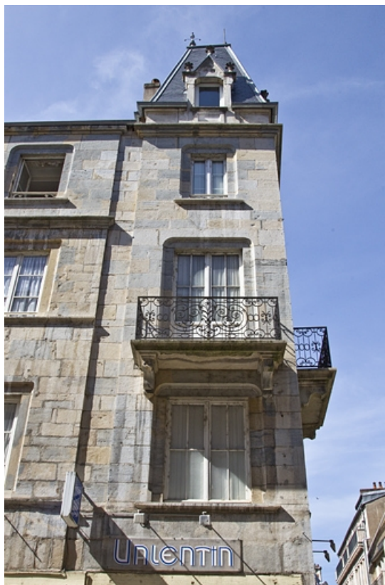
Logis principal : détail de l'angle, côté Grande Rue.

25, Besançon, 1, 3 rue d' Anvers, lieudit : îlot d' Emskerque