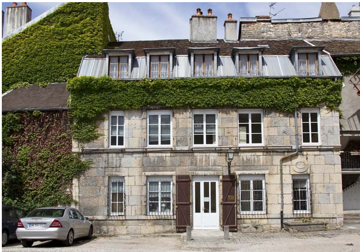
Troisième logis secondaire, façade antérieure : de face.

25, Besançon Grande Rue 44, lieudit : îlot d' Emskerque