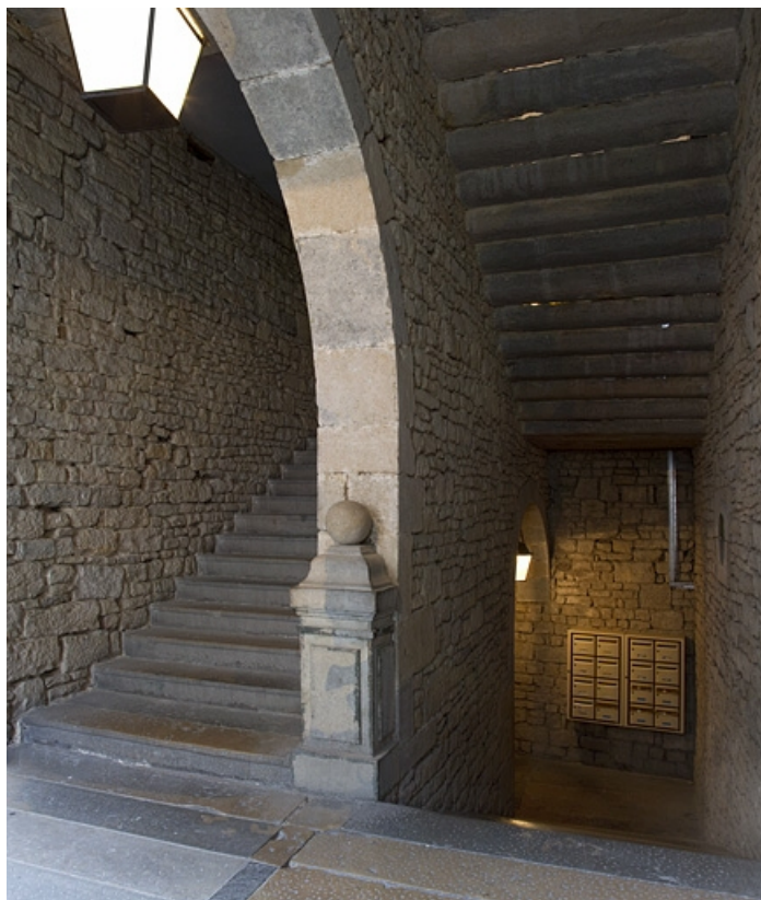
Logis principal, intérieur : vue de l'escalier d'honneur. 25, Besançon Grande Rue 44, lieudit : îlot d' Emskerque