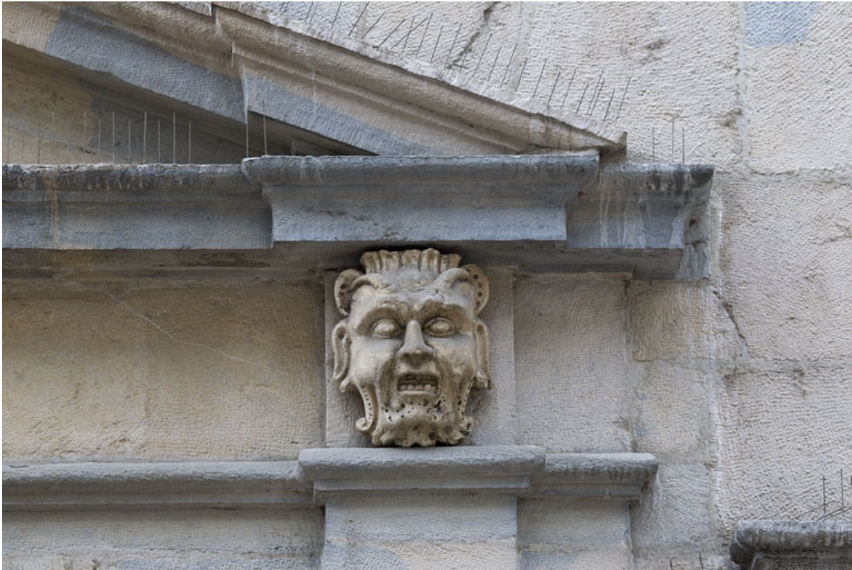
Logis principal, façade sur rue : mascaron droit ornant le portail.

25, Besançon Grande Rue 44, lieudit : îlot d' Emskerque