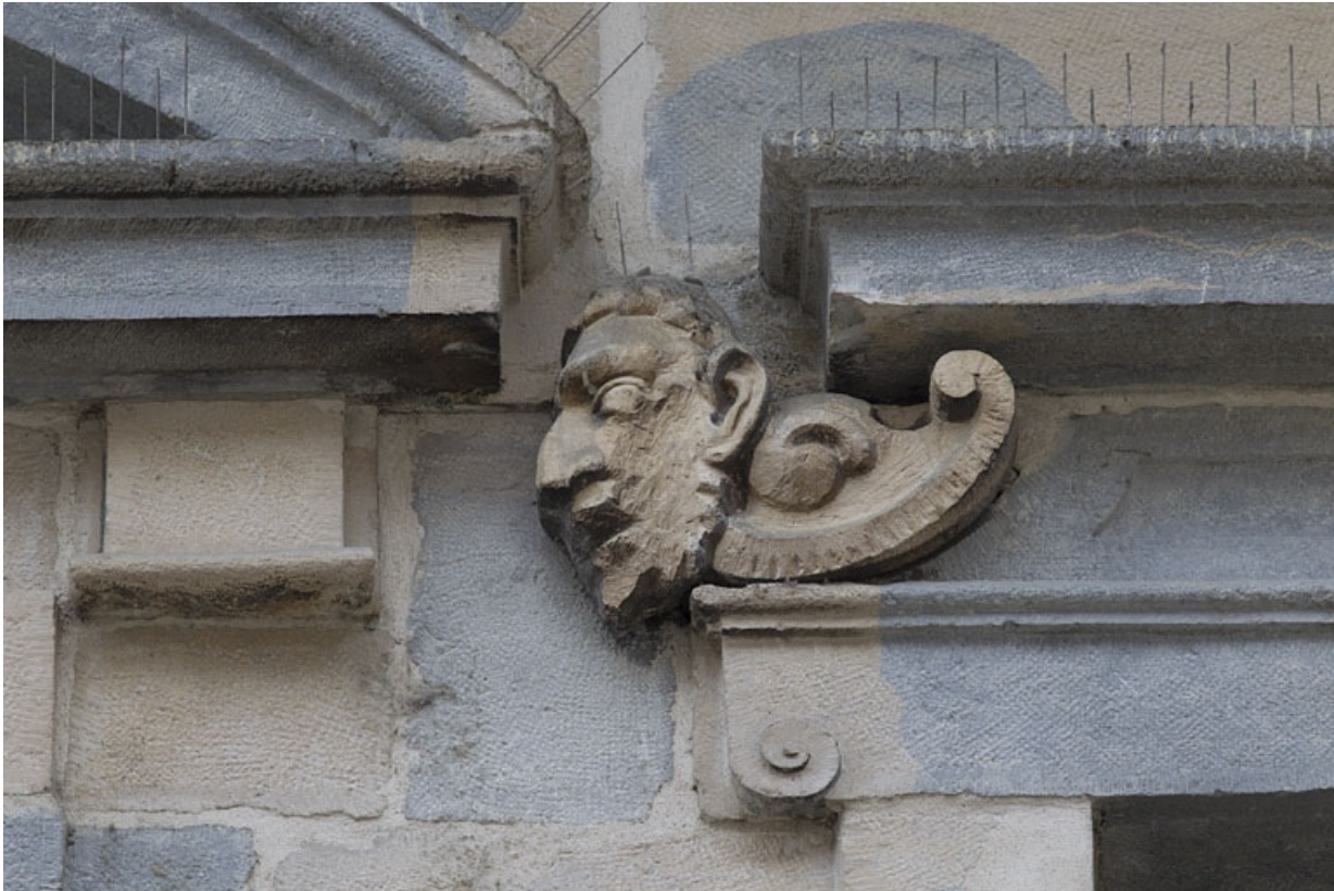
Logis principal, façade sur rue, premier étage, partie droite, troisième fenêtre : mascaron gauche. 25, Besançon Grande Rue 44, lieudit : îlot d' Emskerque