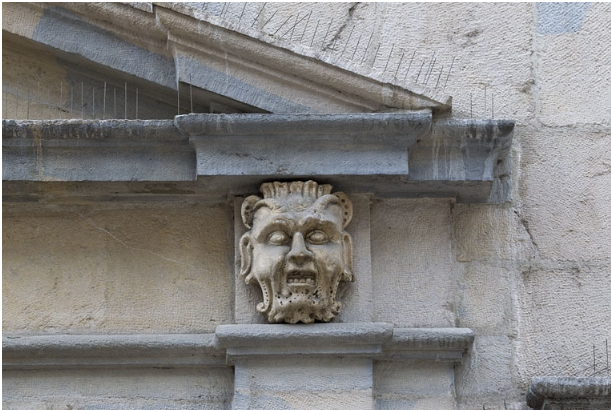
Logis principal, façade sur rue : mascaron droit ornant le portail.

25, Besançon Grande Rue 44, lieudit : îlot d' Emskerque