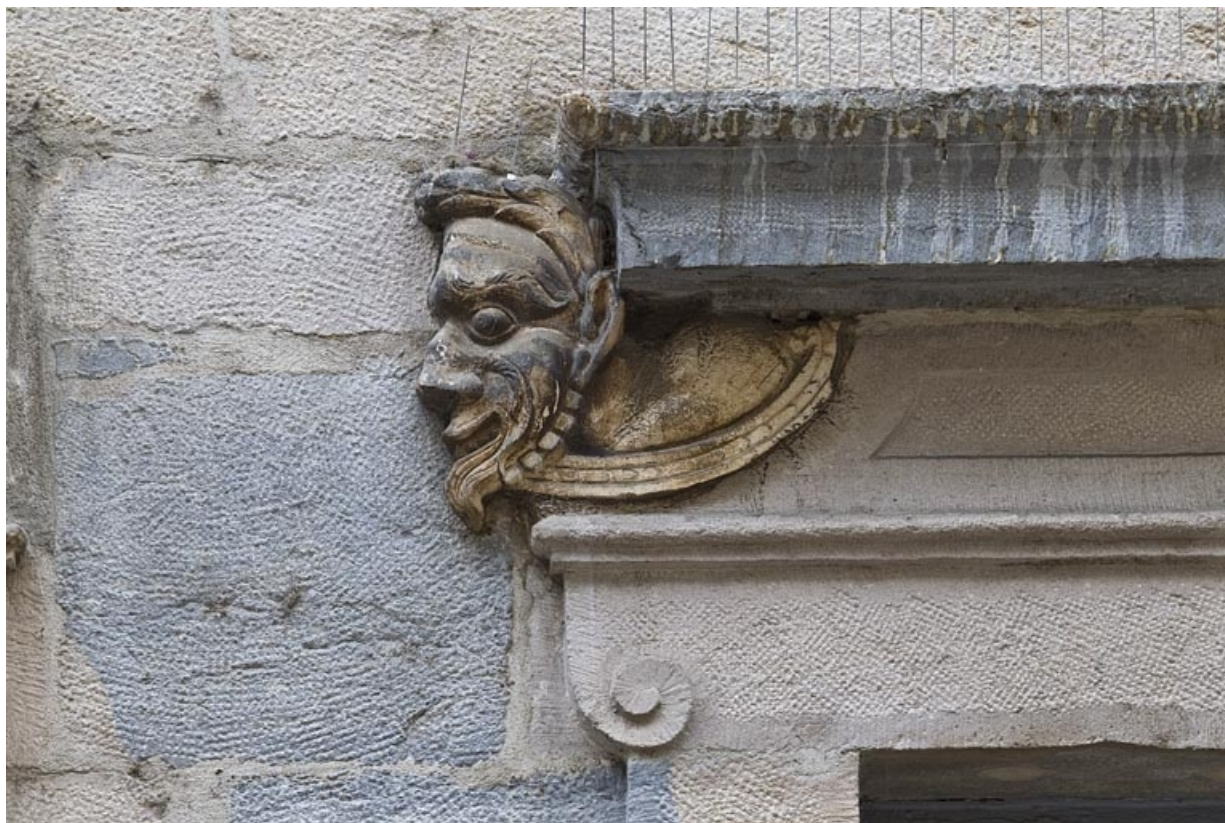
Logis principal, façade sur rue, partie droite, rez-de-chaussée, deuxième baie : mascaron droit. 25, Besançon Grande Rue 44, lieudit : îlot d' Emskerque