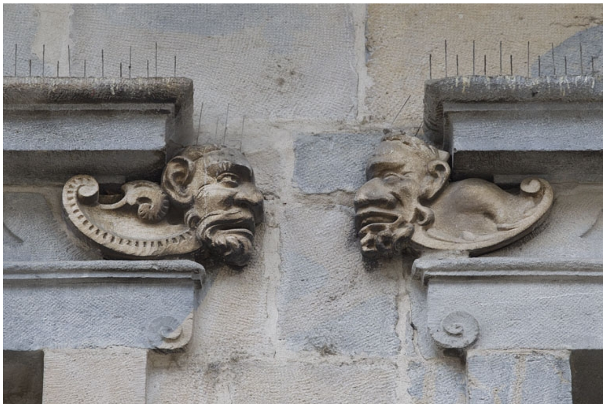
Logis principal, façade sur rue, premier étage, partie droite, troisième et quatrième fenêtre : mascarons droit et gauche. 25, Besançon Grande Rue 44, lieudit : îlot d' Emskerque