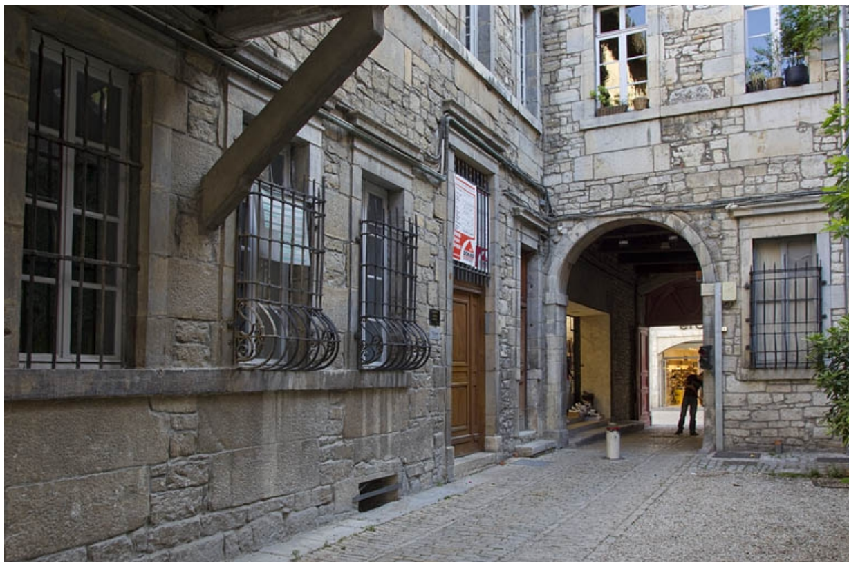
Vue du premier passage cocher depuis la cour, de trois quarts droit.

25, Besançon Grande Rue 44, lieudit : îlot d' Emskerque