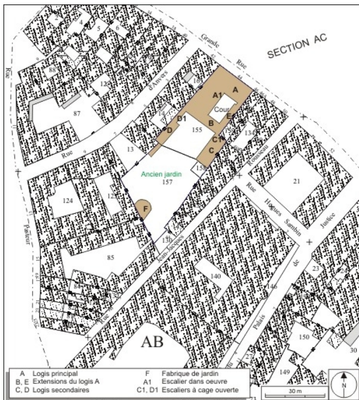
Plan masse et de situation. Extrait du plan cadastral, 1974, section AB. 25, Besançon Grande Rue 44, lieudit : îlot d' Emskerque