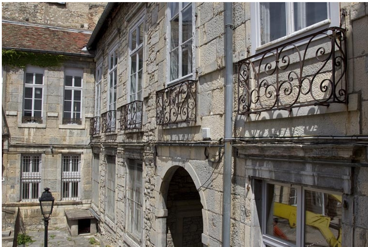
Façade postérieure du logis principal donnant sur l'ancien jardin : de trois quarts droit.

25, Besançon Grande Rue 44, lieudit : îlot d' Emskerque