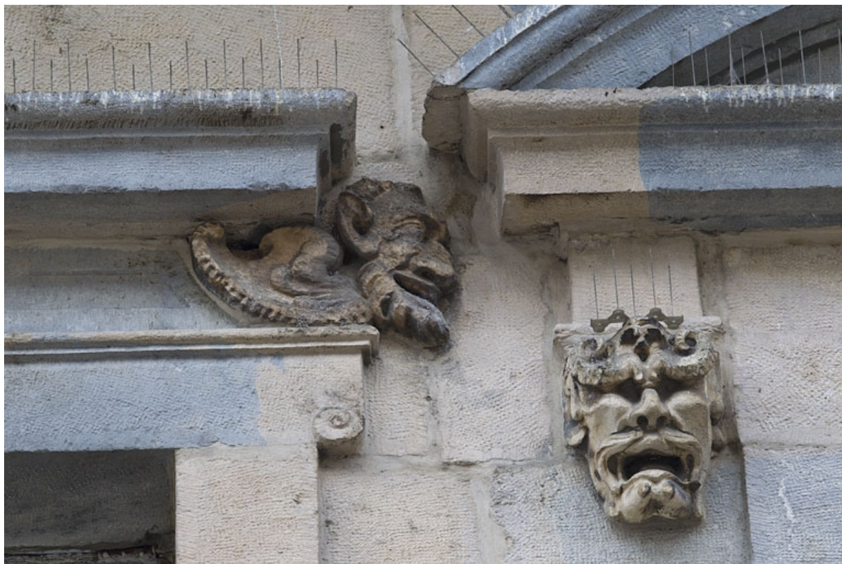
Logis principal, façade sur rue, partie gauche, premier étage, troisième et quatrième baies : mascarons gauche et droit. 25, Besançon Grande Rue 44, lieudit : îlot d' Emskerque