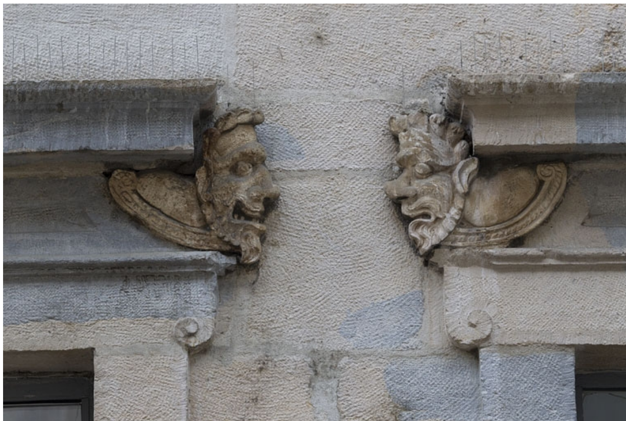
Logis principal, façade sur rue, partie droite, rez-de-chaussée, quatrième et cinquième baies : mascarons gauche et droit. 25, Besançon Grande Rue 44, lieudit : îlot d' Emskerque