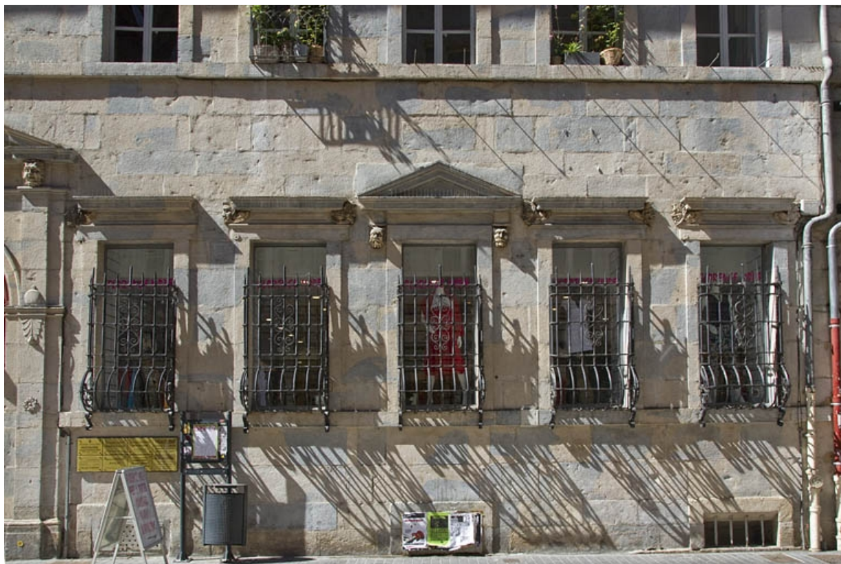
Logis principal, façade sur rue, partie droite : de face. 25, Besançon Grande Rue 44, lieudit : îlot d' Emskerque