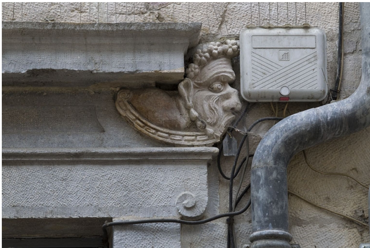
Logis principal, façade sur rue, partie droite, rez-de-chaussée, cinquième baies : mascaron droit. 25, Besançon Grande Rue 44, lieudit : îlot d' Emskerque