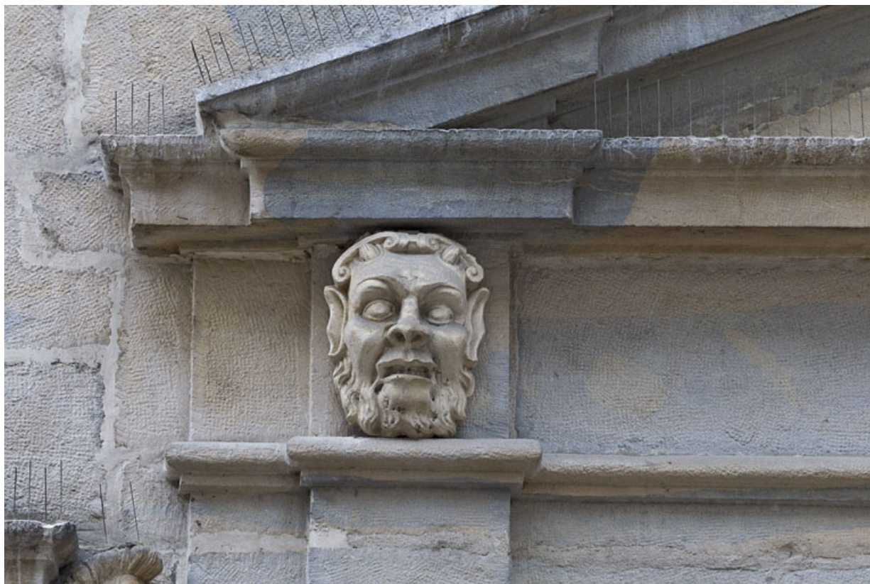
Logis principal, façade sur rue : mascaron gauche ornant le portail.

25, Besançon Grande Rue 44, lieudit : îlot d' Emskerque