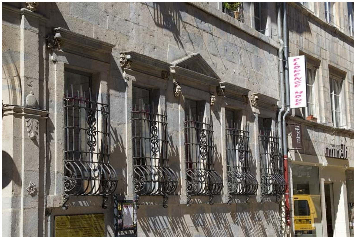
Logis principal, façade sur rue : partie droite du rez-de-chaussée. 25, Besançon Grande Rue 44, lieudit : îlot d' Emskerque