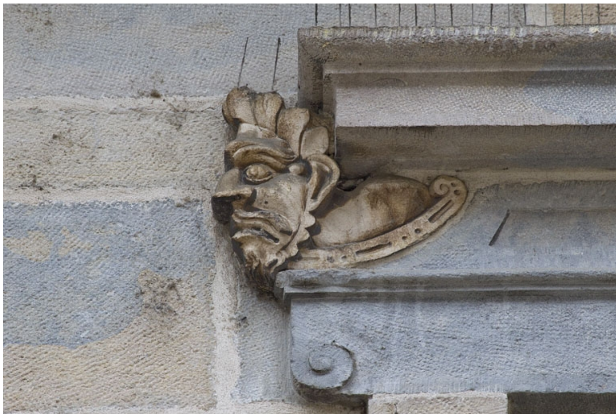
Logis principal, façade sur rue, premier étage, partie droite, fenêtre droite : mascaron gauche. 25, Besançon Grande Rue 44, lieudit : îlot d' Emskerque