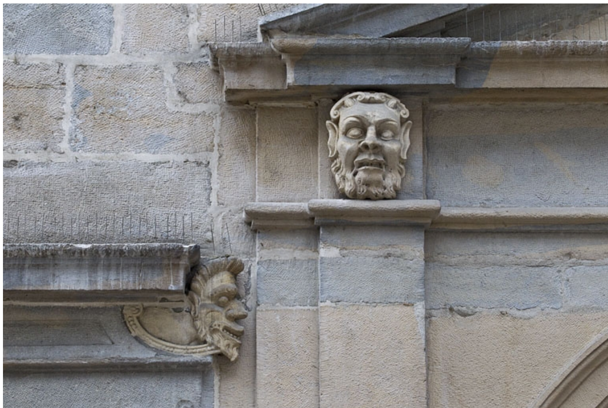
Logis principal, façade sur rue, partie droite, rez-de-chaussée, baie à droite de l'arcade boutiquière : mascarón droit et mascarón gauche ornant le portail.

25, Besançon Grande Rue 44, lieudit : îlot d' Emskerque