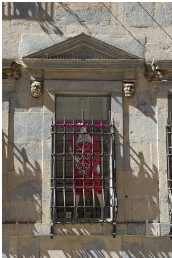
Logis principal, façade sur rue, partie droite : détail de la fenêtre centrale. 25, Besançon Grande Rue 44, lieudit : îlot d' Emskerque