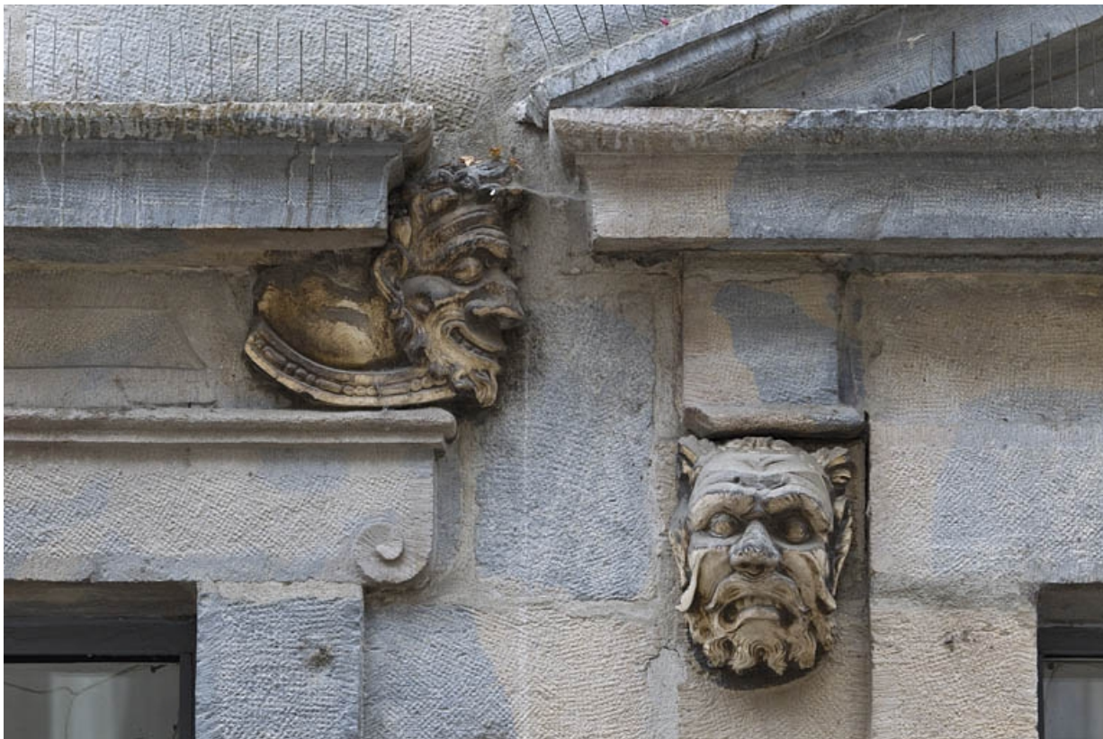
Logis principal, façade sur rue, partie droite, rez-de-chaussée, troisième baie : mascarons droit, et mascarons gauche de la baie centrale.

25, Besançon Grande Rue 44, lieudit : îlot d' Emskerque