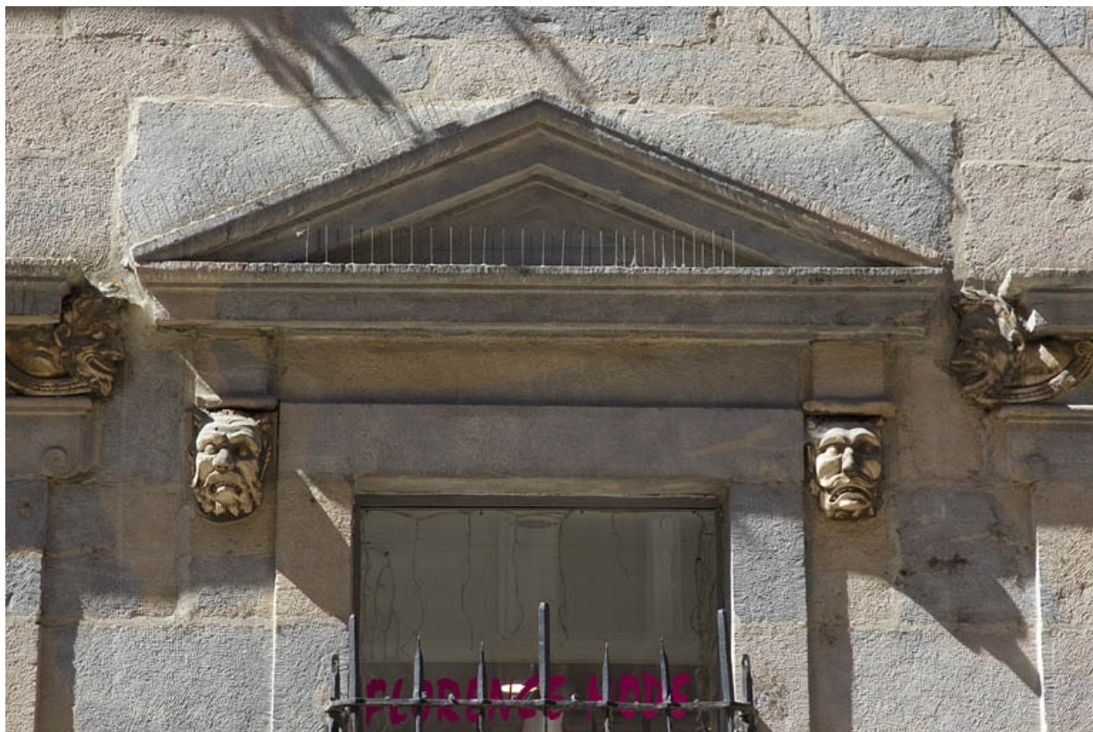
Logis principal, façade sur rue, partie droite : détail du fronton de la fenêtre centrale.

25, Besançon Grande Rue 44, lieudit : îlot d' Emskerque