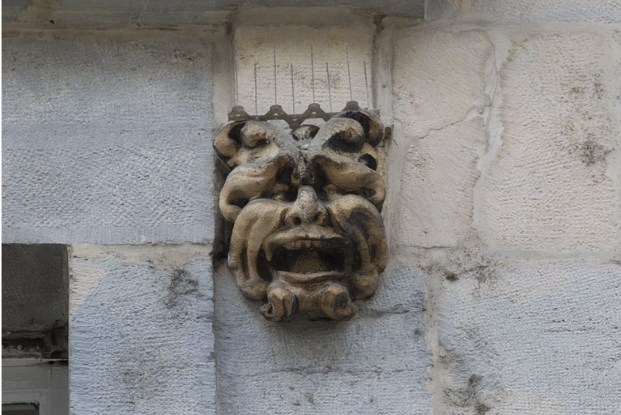
Logis principal, façade sur rue, partie gauche, premier étage, quatrième baie : mascaron droit. 25, Besançon Grande Rue 44, lieudit : îlot d' Emskerque