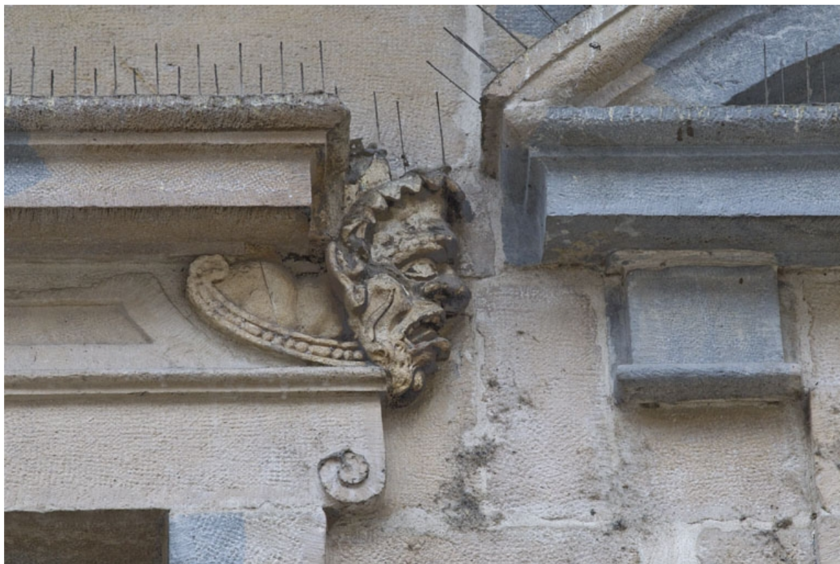
Logis principal, façade sur rue, premier étage, partie droite, fenêtre droite : mascaron droit. 25, Besançon Grande Rue 44, lieudit : îlot d' Emskerque