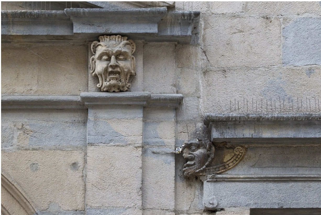
Logis principal, façade sur rue, partie droite, rez-de-chaussée : portail, mascaron droit et mascaron gauche de la première baie. 25, Besançon Grande Rue 44, lieudit : îlot d' Emskerque