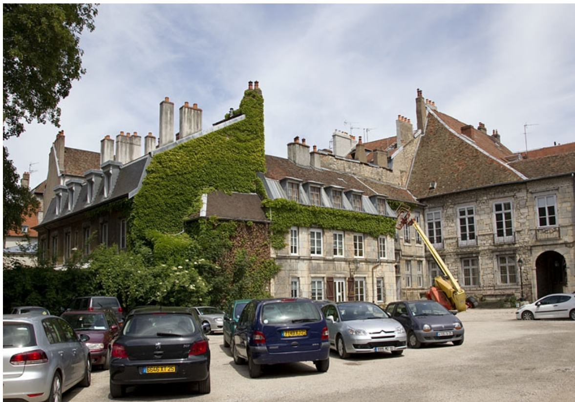
Troisième logis secondaire, à droite de l'ancien jardin : de trois quarts gauche. 25, Besançon Grande Rue 44, lieudit : îlot d' Emskerque