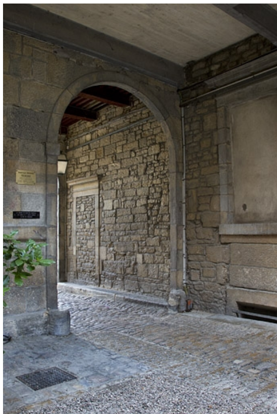
Vue du deuxième passage cocher depuis la cour, de trois quarts gauche.

25, Besançon Grande Rue 44, lieudit : îlot d' Emskerque