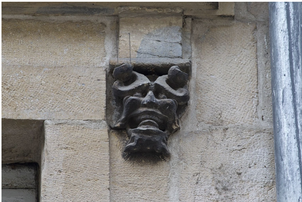
Logis principal, façade sur rue, premier étage, partie droite, cinquième fenêtre : mascaron droit. 25, Besançon Grande Rue 44, lieudit : îlot d' Emskerque