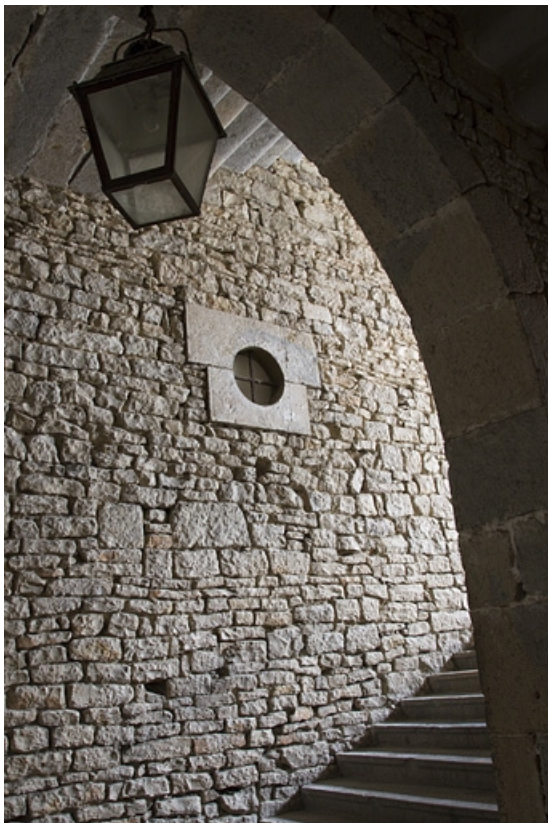
Logis principal, intérieur : détail de la cage d'escalier. 25, Besançon Grande Rue 44, lieudit : îlot d' Emskerque