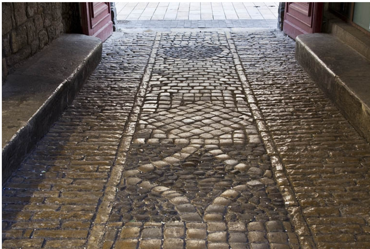
Premier passage cocher : détail du décor du sol, vue d'ensemble.

25, Besançon Grande Rue 44, lieudit : îlot d' Emskerque