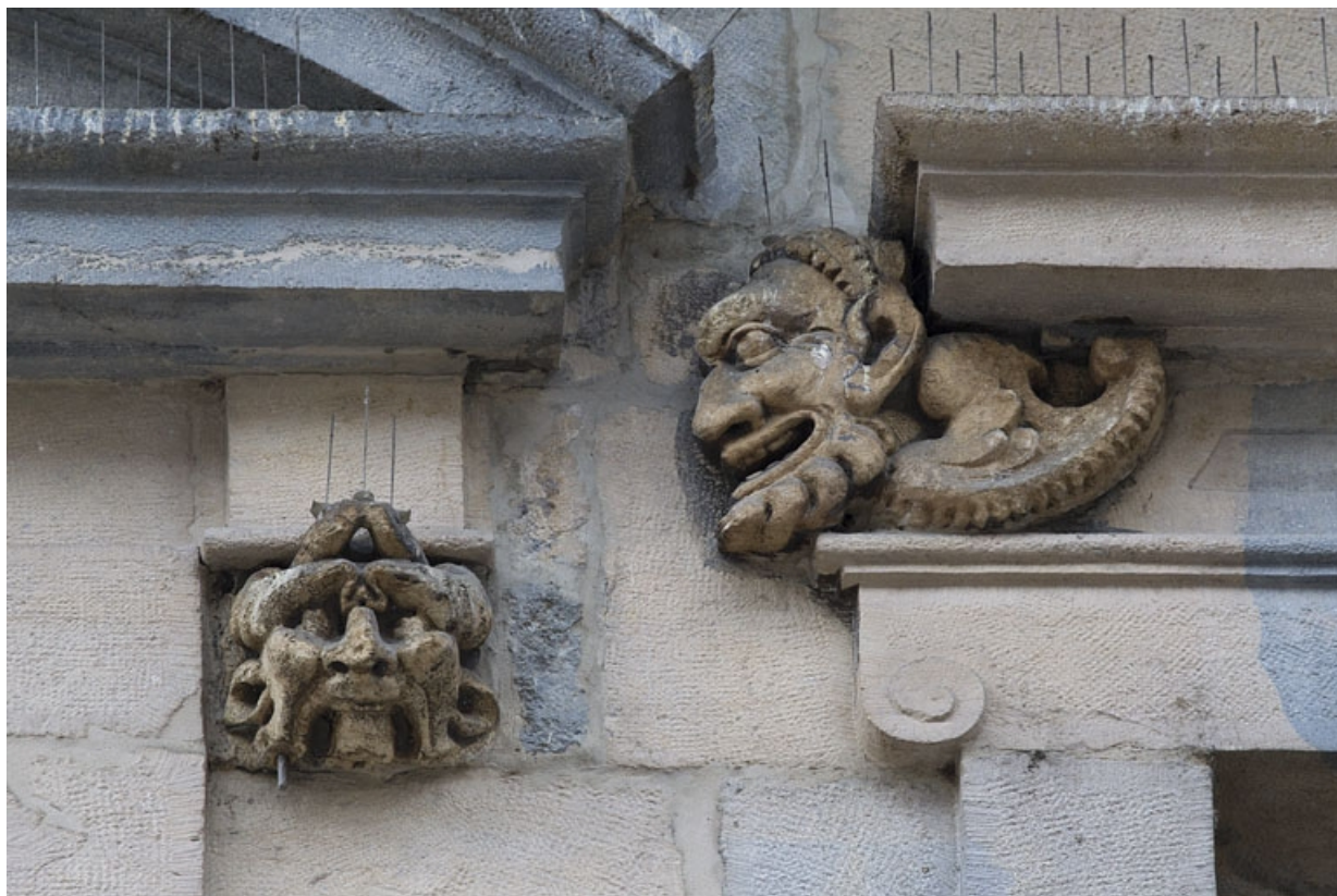
Logis principal, façade sur rue, partie gauche, premier étage, baie gauche : mascarons droit et mascarons gauche de la baie suivante. 25, Besançon Grande Rue 44, lieudit : îlot d' Emskerque