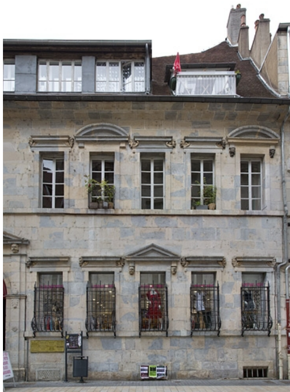
Logis principal, façade sur rue : partie droite, de face. 25, Besançon Grande Rue 44, lieudit : îlot d' Emskerque