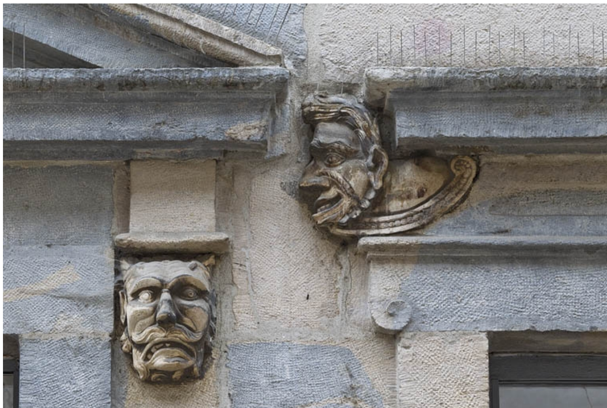
Logis principal, façade sur rue, partie droite, rez-de-chaussée, quatrième baie : mascarón gauche, et mascarón droit de la baie centrale.

25, Besançon Grande Rue 44, lieudit : îlot d' Emskerque