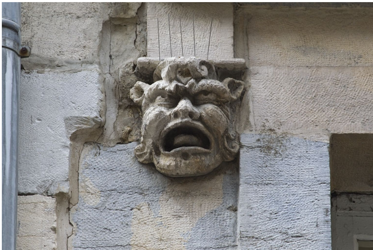
Logis principal, façade sur rue, partie gauche, premier étage, baie gauche : mascaron gauche. 25, Besançon Grande Rue 44, lieudit : îlot d' Emskerque