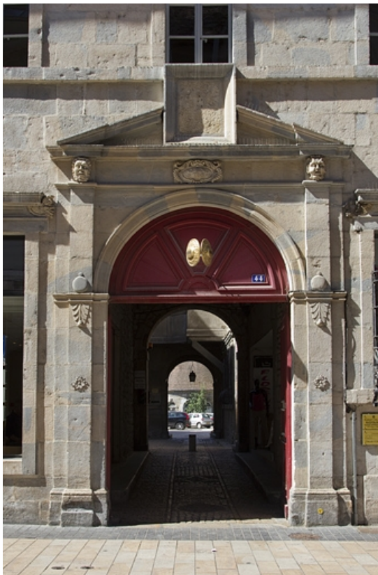
Logis principal, façade sur rue : détail du portail d'entrée. 25, Besançon Grande Rue 44, lieudit : îlot d' Emskerque