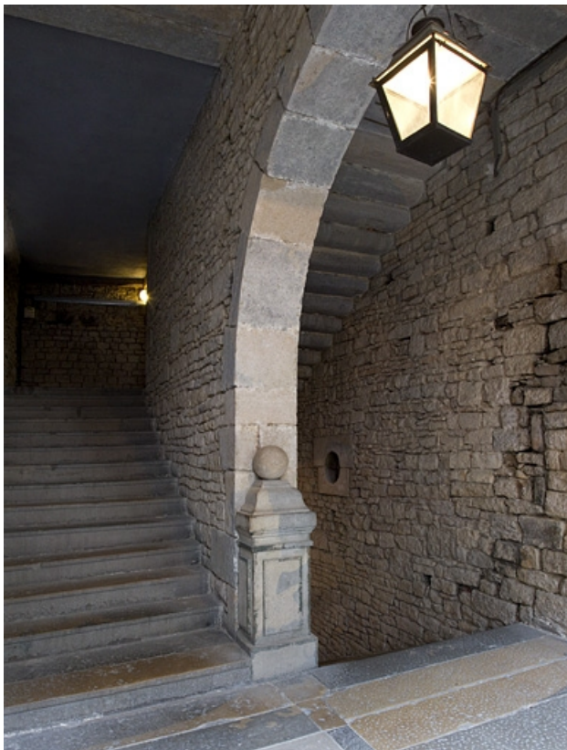
Logis principal, intérieur : vue de l'escalier d'honneur. 25, Besançon Grande Rue 44, lieudit : îlot d' Emskerque