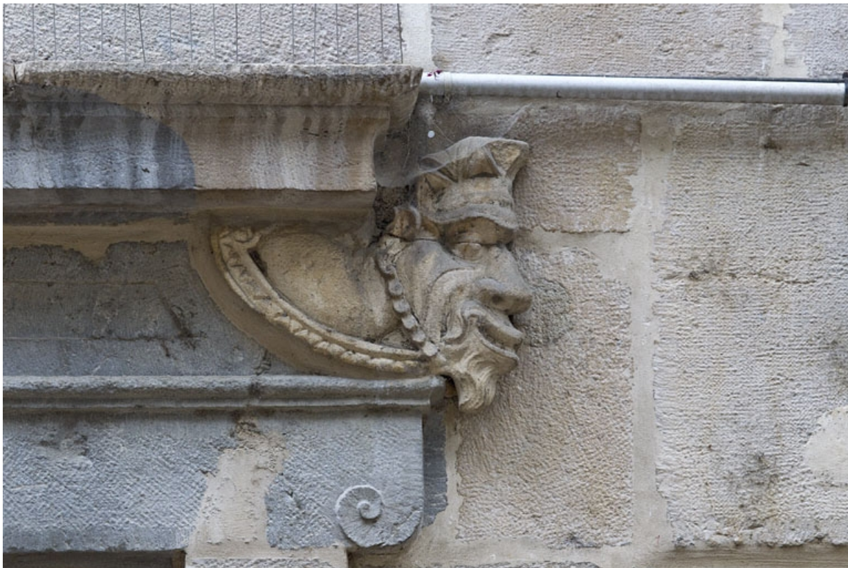
Logis principal, façade sur rue, partie droite, rez-de-chaussée, baie à gauche de l'arcade boutique : mascaron. 25, Besançon Grande Rue 44, lieudit : îlot d' Emskerque