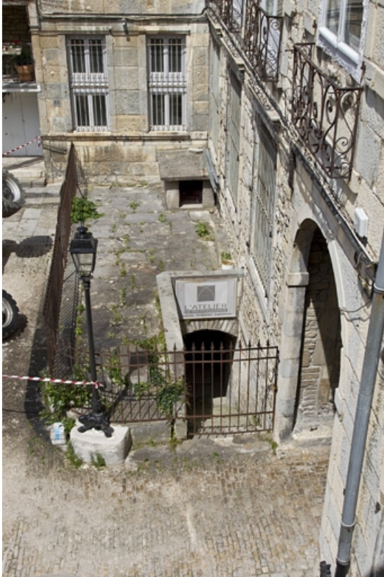
Vue de l'entrée de cave du logis principal donnant sur l'ancien jardin.

25, Besançon Grande Rue 44, lieudit : îlot d' Emskerque