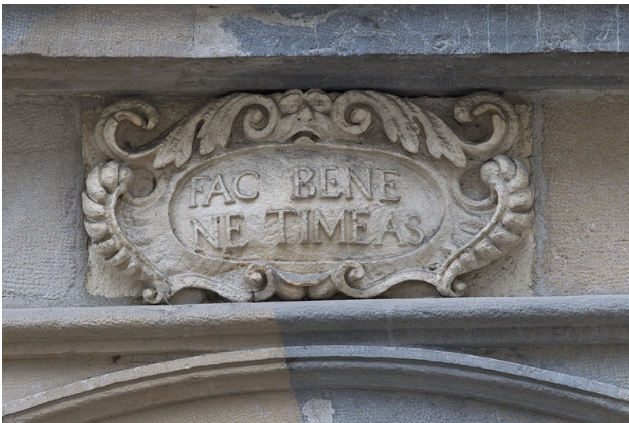
Logis principal, façade sur rue : détail de l'inscription latine ornant le portail. 25, Besançon Grande Rue 44, lieudit : îlot d' Emskerque