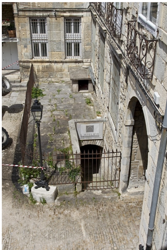
Vue de l'entrée de cave du logis principal donnant sur l'ancien jardin.

25, Besançon Grande Rue 44, lieudit : îlot d' Emskerque