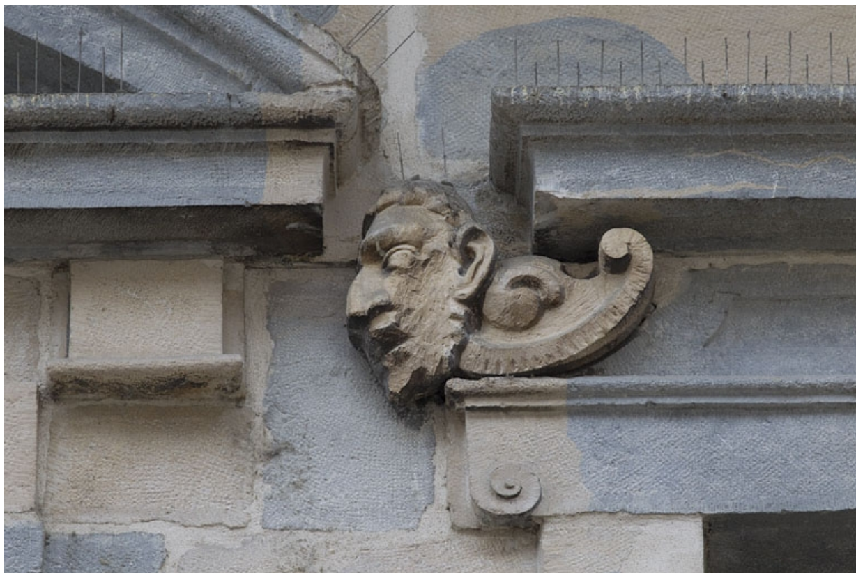
Logis principal, façade sur rue, premier étage, partie droite, troisième fenêtre : mascaron gauche. 25, Besançon Grande Rue 44, lieudit : îlot d' Emskerque