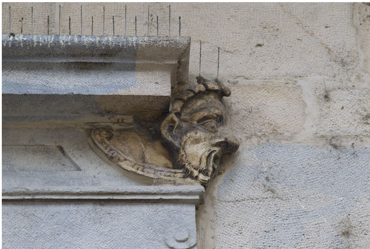
Logis principal, façade sur rue, premier étage, baie au dessus du portail : mascaron droit. 25, Besançon Grande Rue 44, lieudit : îlot d' Emskerque