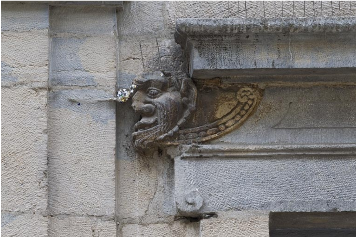
Logis principal, façade sur rue, partie droite, rez-de-chaussée : mascarón gauche de la baie gauche. 25, Besançon Grande Rue 44, lieudit : îlot d' Emskerque