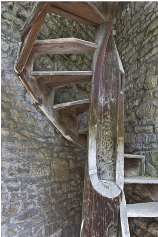
Fabrique de jardin : détail de l'escalier, vue rapprochée.

25, Besançon Grande Rue 44, lieudit : îlot d' Emskerque