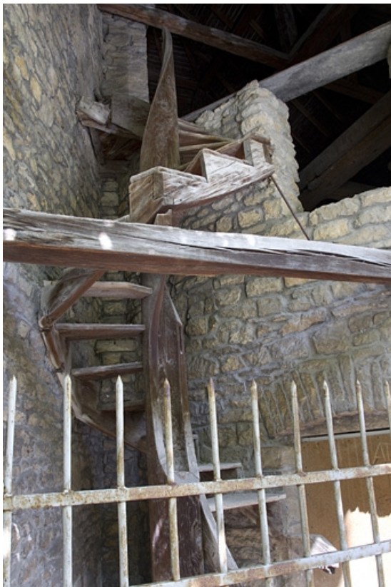
Fabrique de jardin : détail de l'escalier, vue d'ensemble.

25, Besançon Grande Rue 44, lieudit : îlot d' Emskerque