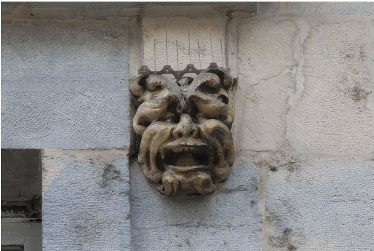
Logis principal, façade sur rue, partie gauche, premier étage, quatrième baie : mascaron droit. 25, Besançon Grande Rue 44, lieudit : îlot d' Emskerque