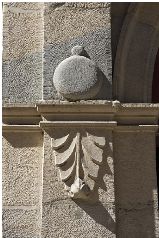
Logis principal, façade sur rue, portail d'entrée : détail du décor de palmette sur le pilastre gauche. 25, Besançon Grande Rue 44, lieudit : îlot d' Emskerque