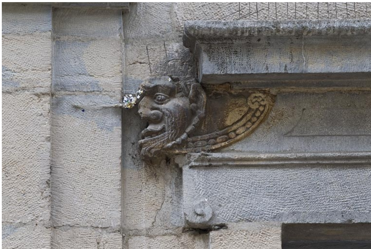
Logis principal, façade sur rue, partie droite, rez-de-chaussée : mascarone gauche de la baie gauche. 25, Besançon Grande Rue 44, lieudit : îlot d' Emskerque