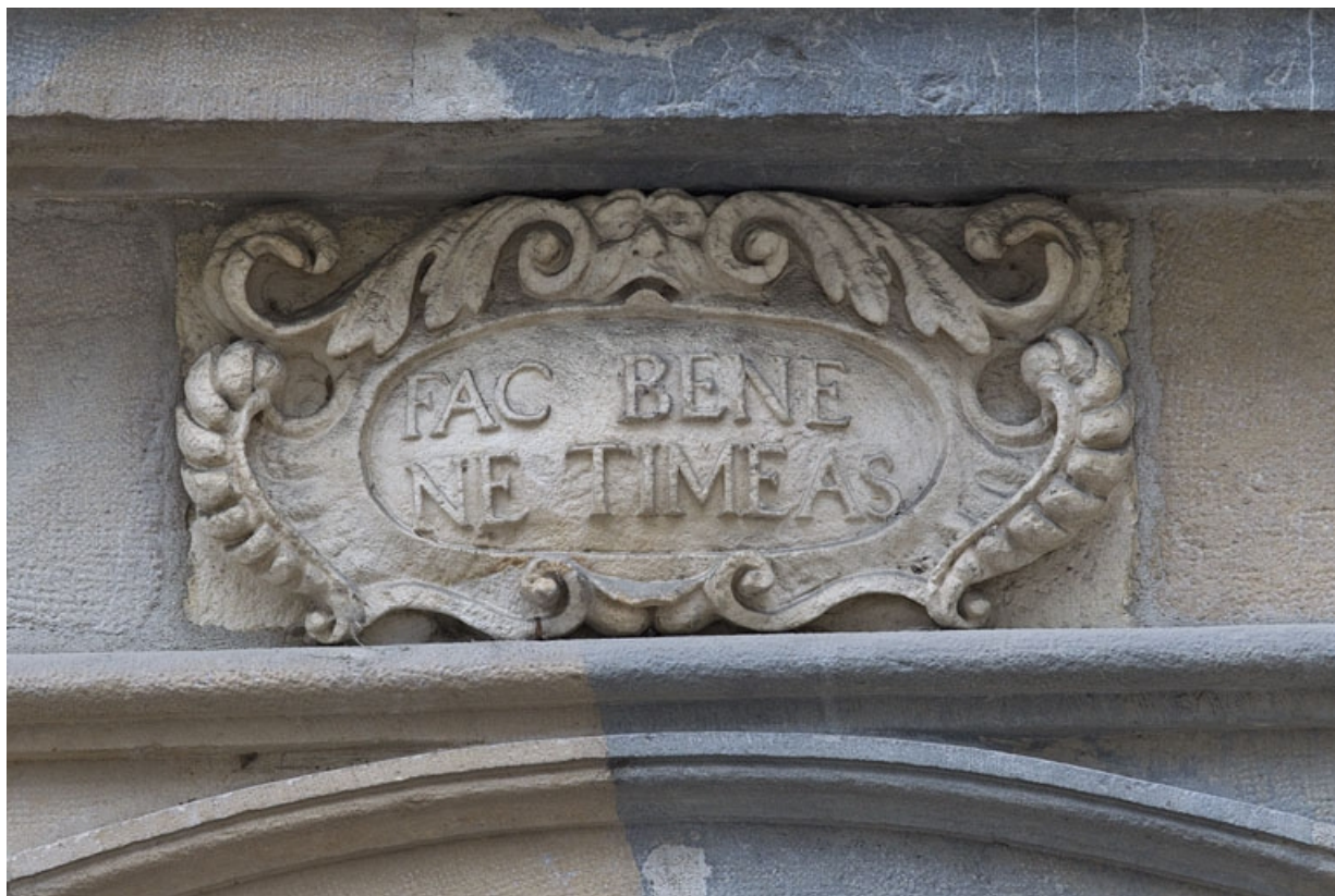
Logis principal, façade sur rue : détail de l'inscription latine ornant le portail. 25, Besançon Grande Rue 44, lieudit : îlot d' Emskerque