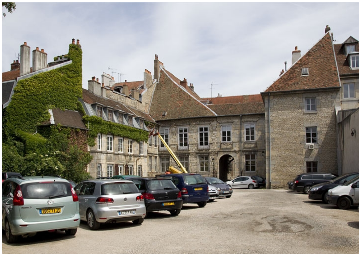
Vue d'ensemble des bâtiments depuis le fond de l'ancien jardin.

25, Besançon Grande Rue 44, lieudit : îlot d' Emskerque