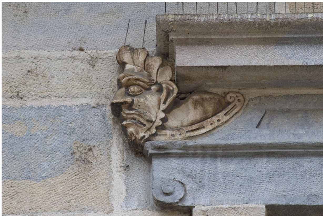
Logis principal, façade sur rue, premier étage, partie droite, fenêtre droite : mascaron gauche. 25, Besançon Grande Rue 44, lieudit : îlot d' Emskerque