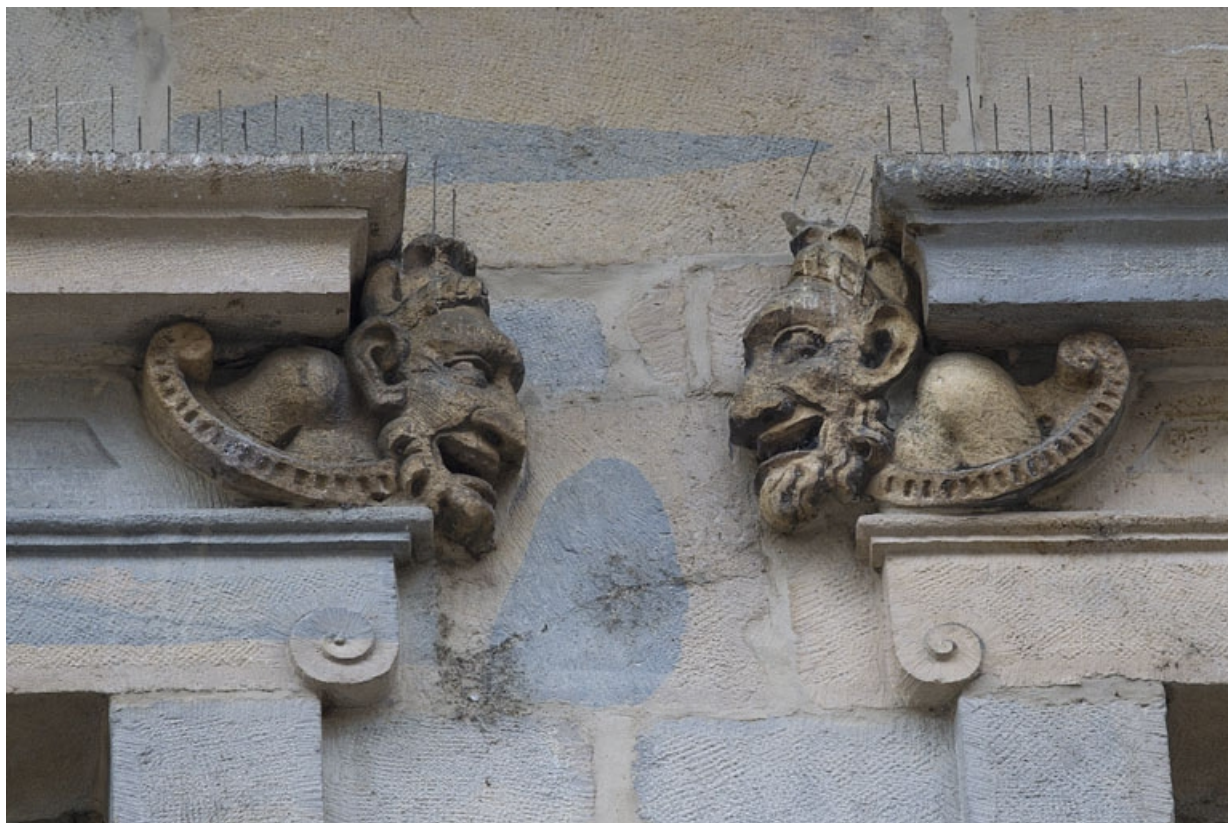
Logis principal, façade sur rue, partie gauche, premier étage, deuxième et troisième baies : mascarons gauche et droit. 25, Besançon Grande Rue 44, lieudit : îlot d' Emskerque