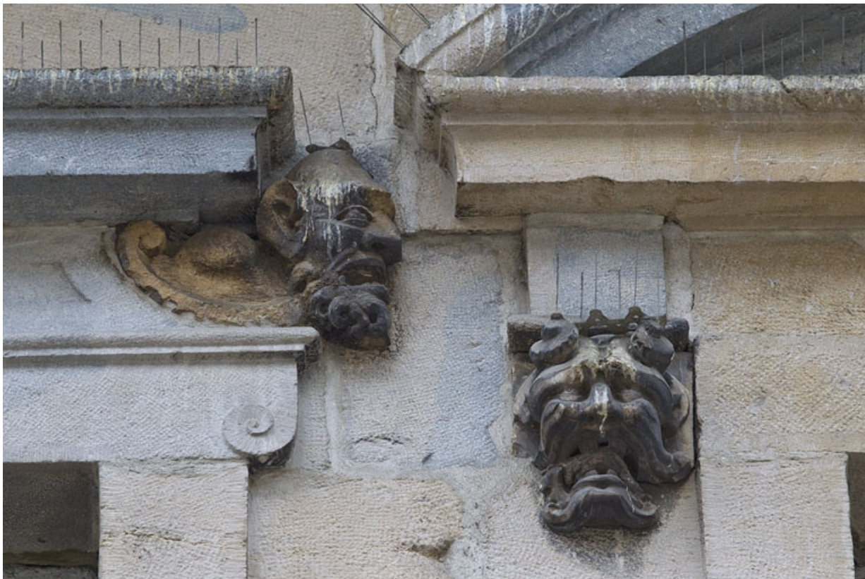
Logis principal, façade sur rue, premier étage, partie droite, quatrième et cinquième fenêtres : mascarons gauche et droit. 25, Besançon Grande Rue 44, lieudit : îlot d' Emskerque