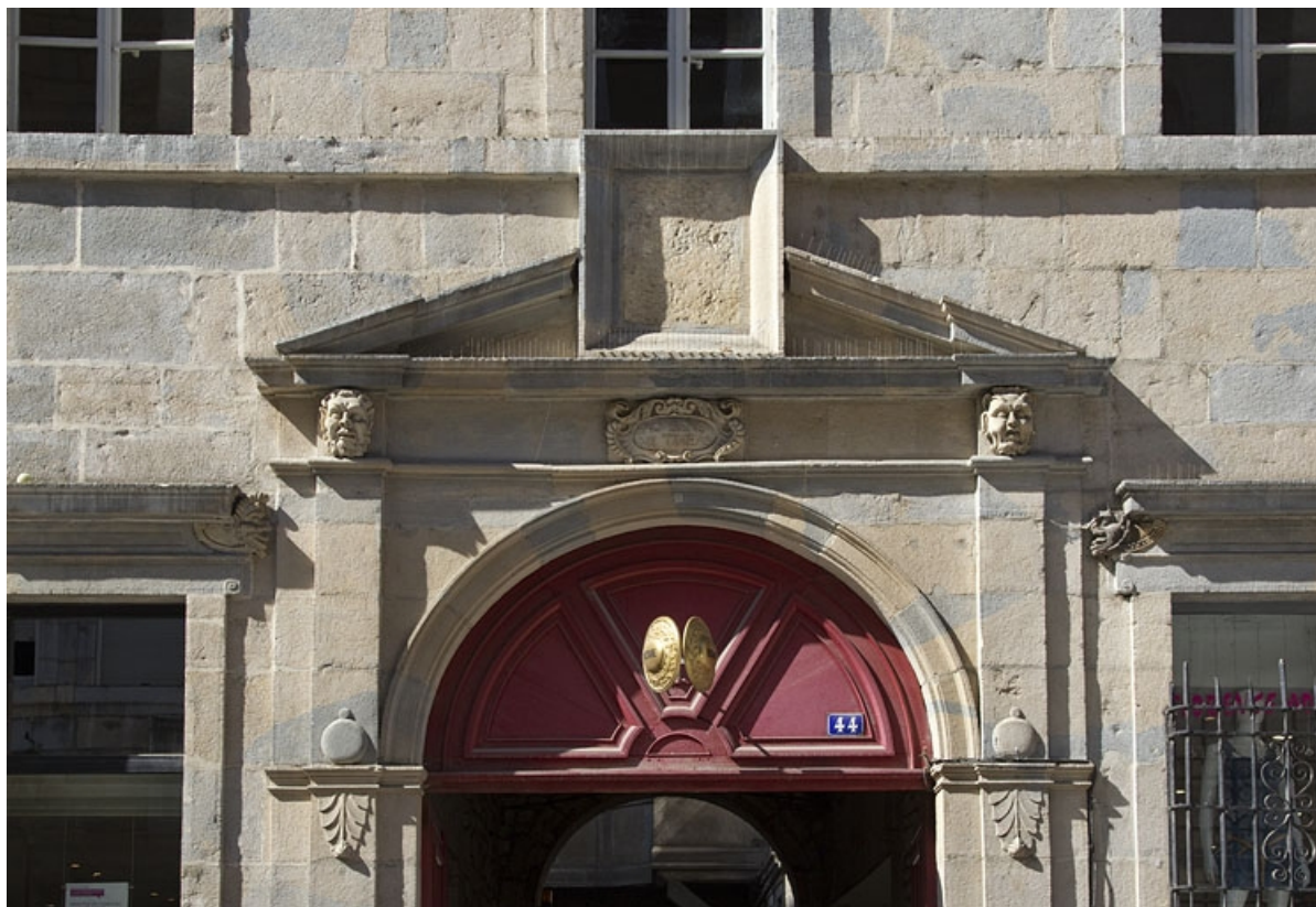
Logis principal, portail d'entrée : détail du fronton interrompu à tabernacle. 25, Besançon Grande Rue 44, lieudit : îlot d' Emskerque