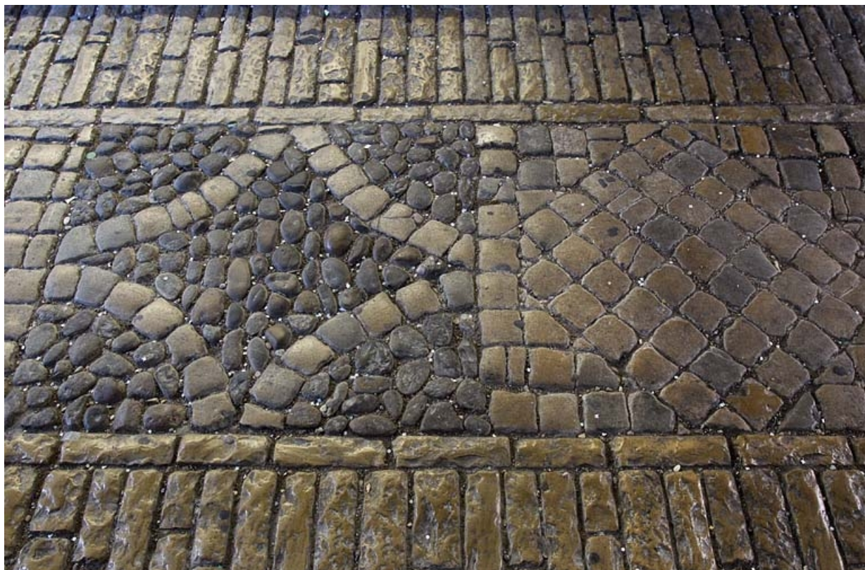
Premier passage cocher : détail du décor du sol.

25, Besançon Grande Rue 44, lieudit : îlot d' Emskerque