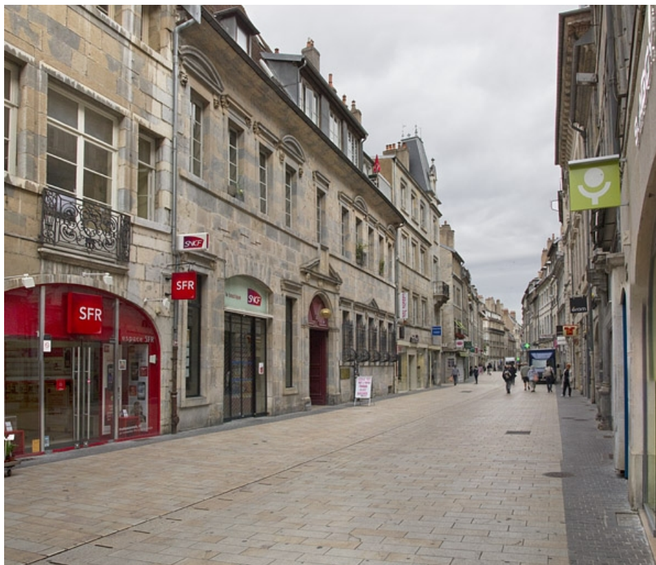
Logis principal, façade sur rue : de trois quarts gauche.

25, Besançon Grande Rue 44, lieudit : îlot d' Emskerque