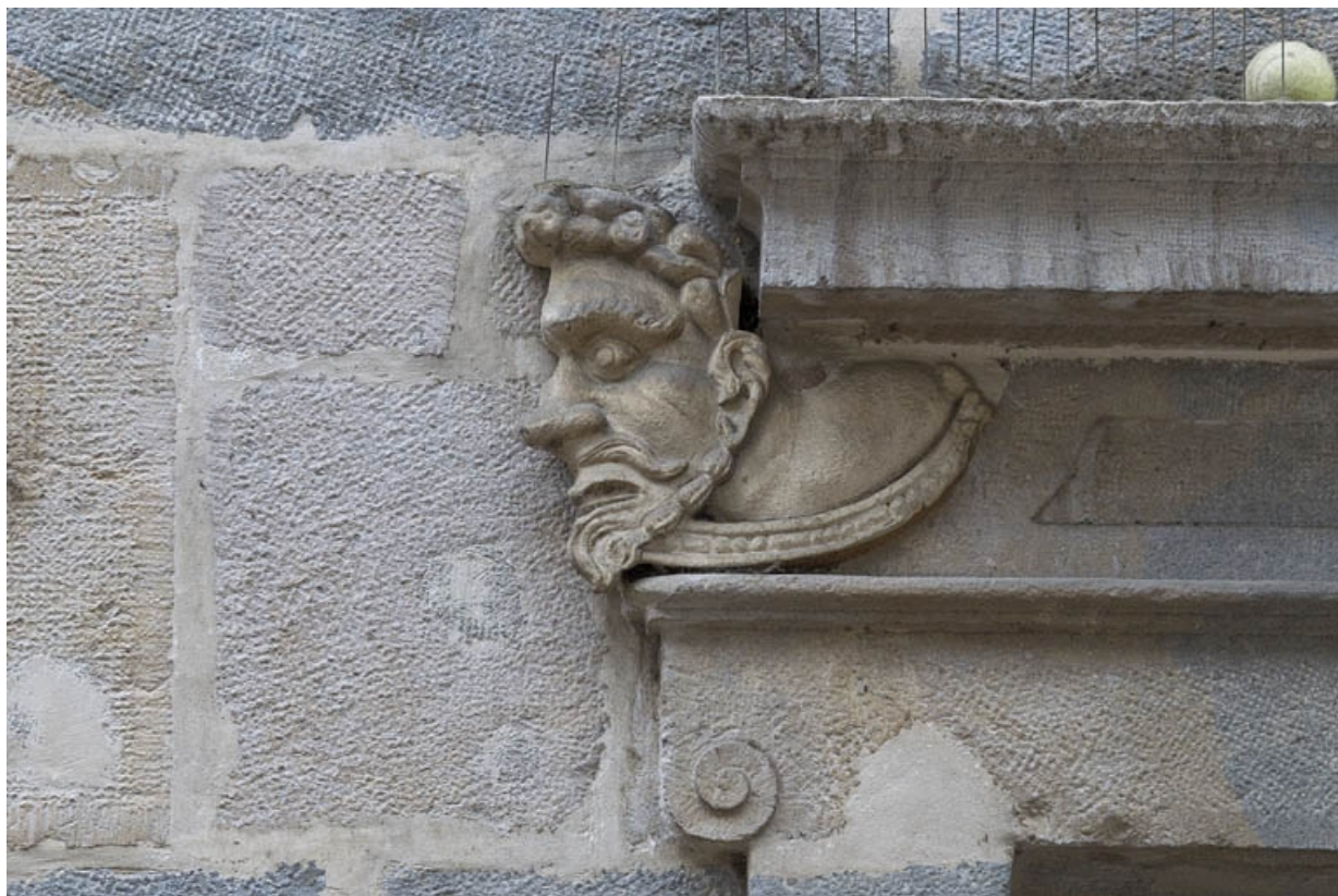
Logis principal, façade sur rue, partie droite, rez-de-chaussée, baie à droite de l'arcade boutiquière : mascaron gauche. 25, Besançon Grande Rue 44, lieudit : îlot d' Emskerque