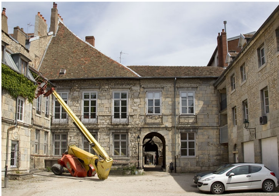
Premier logis secondaire, façade postérieure donnant sur l'ancien jardin.

25, Besançon Grande Rue 44, lieudit : îlot d' Emskerque