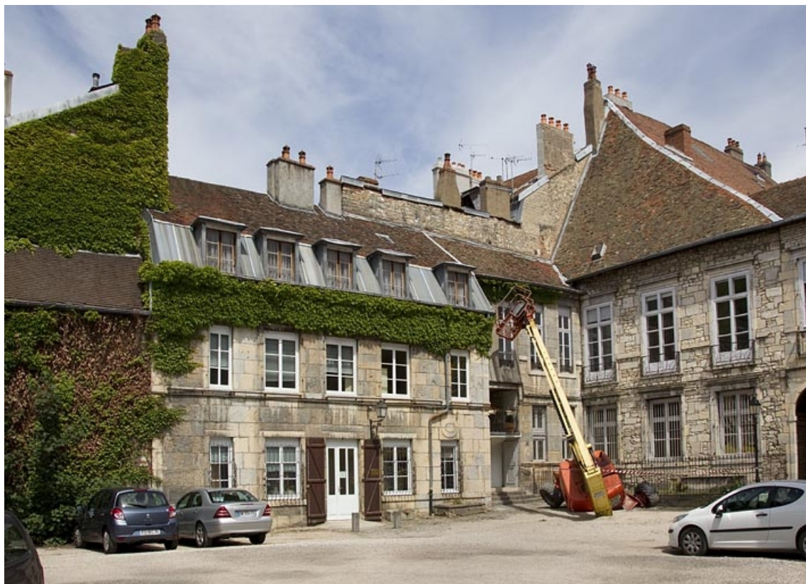
Troisième logis secondaire, à droite de l'ancien jardin : de trois quarts gauche, vue rapprochée. 25, Besançon Grande Rue 44, lieudit : îlot d' Emskerque