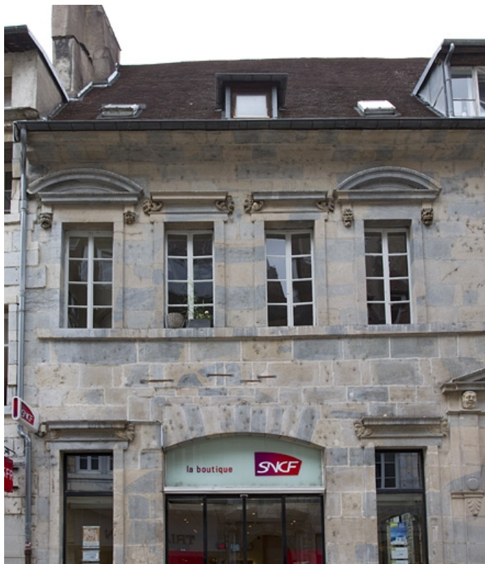
Logis principal, façade sur rue : partie gauche, de face. 25, Besançon Grande Rue 44, lieudit : îlot d' Emskerque