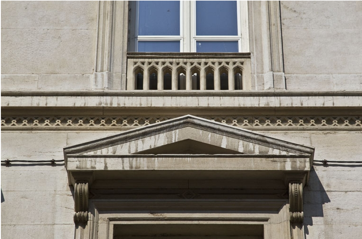
Logis principal : détail d'un fronton d'une fenêtre du premier étage.

25, Besançon, 14 rue de la Préfecture, lieudit : îlot Mairie