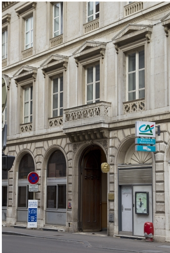
Vue de la façade principale sur rue : de trois quarts droit.

25, Besançon, 14 rue de la Préfecture, lieudit : îlot Mairie