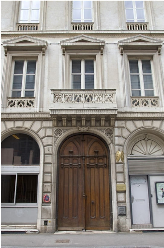
Vue d'ensemble du portail d'entrée.

25, Besançon, 14 rue de la Préfecture, lieudit : îlot Mairie