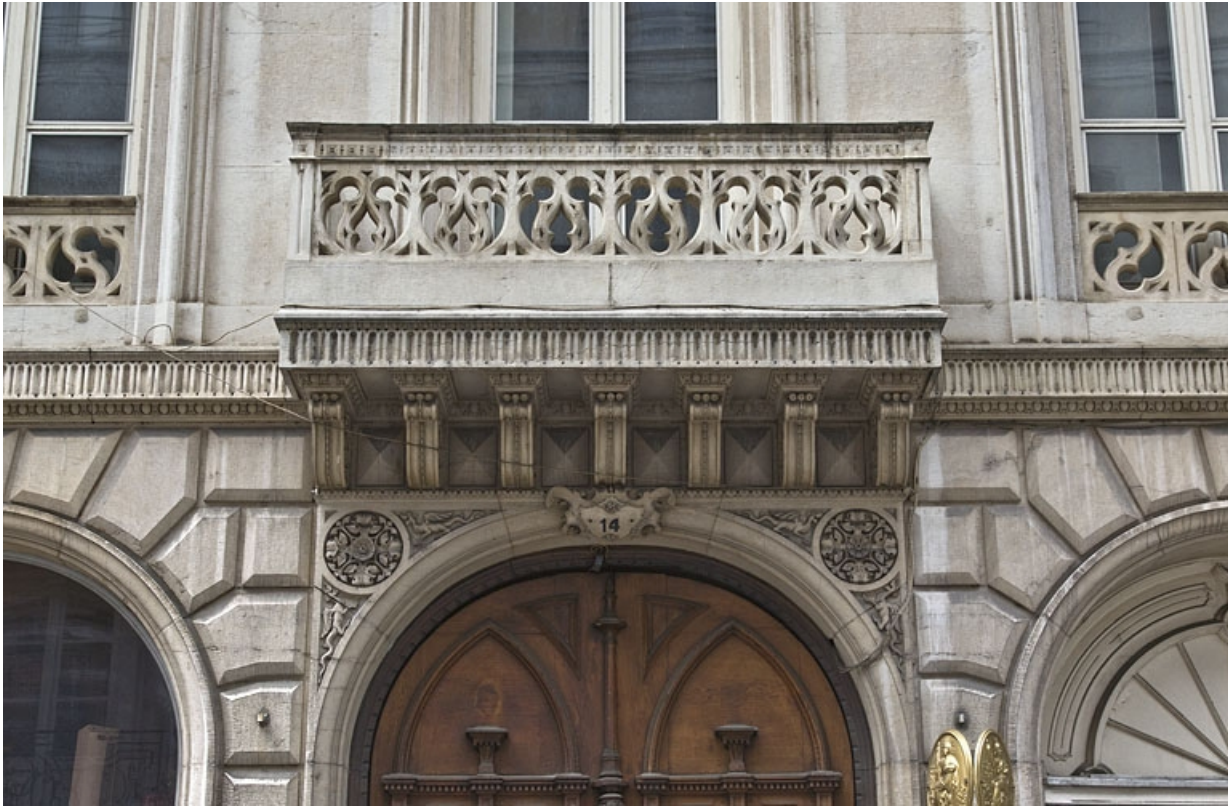
Vue d'ensemble du balcon au-dessus du portail d'entrée.

25, Besançon, 14 rue de la Préfecture, lieudit : îlot Mairie