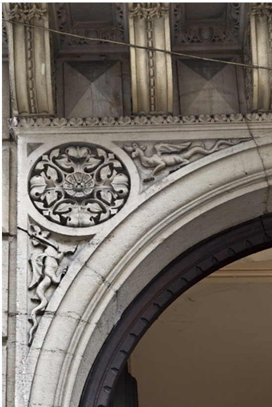
Portail d'entrée : détail du décor de la partie supérieure, écoinçon gauche. 25, Besançon, 14 rue de la Préfecture, lieudit : îlot Mairie