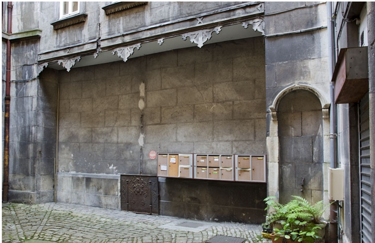
Première cour : vue d'ensemble du puits.

25, Besançon, 14 rue de la Préfecture, lieudit : îlot Mairie