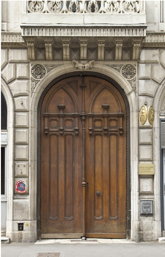
Vue des vantaux du portail d'entrée.

25, Besançon, 14 rue de la Préfecture, lieudit : îlot Mairie