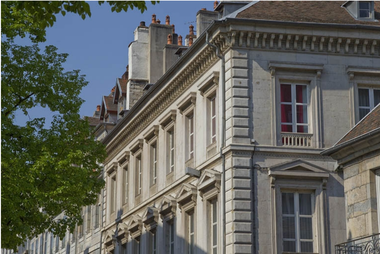
Logis principal : détail des fenêtres du deuxième étage sur la rue de la Préfecture.

25, Besançon, 14 rue de la Préfecture, lieudit : îlot Mairie