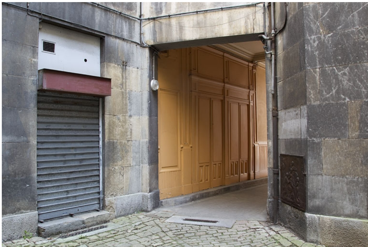
Vue du passage cocher depuis la première cour.

25, Besançon, 14 rue de la Préfecture, lieudit : îlot Mairie