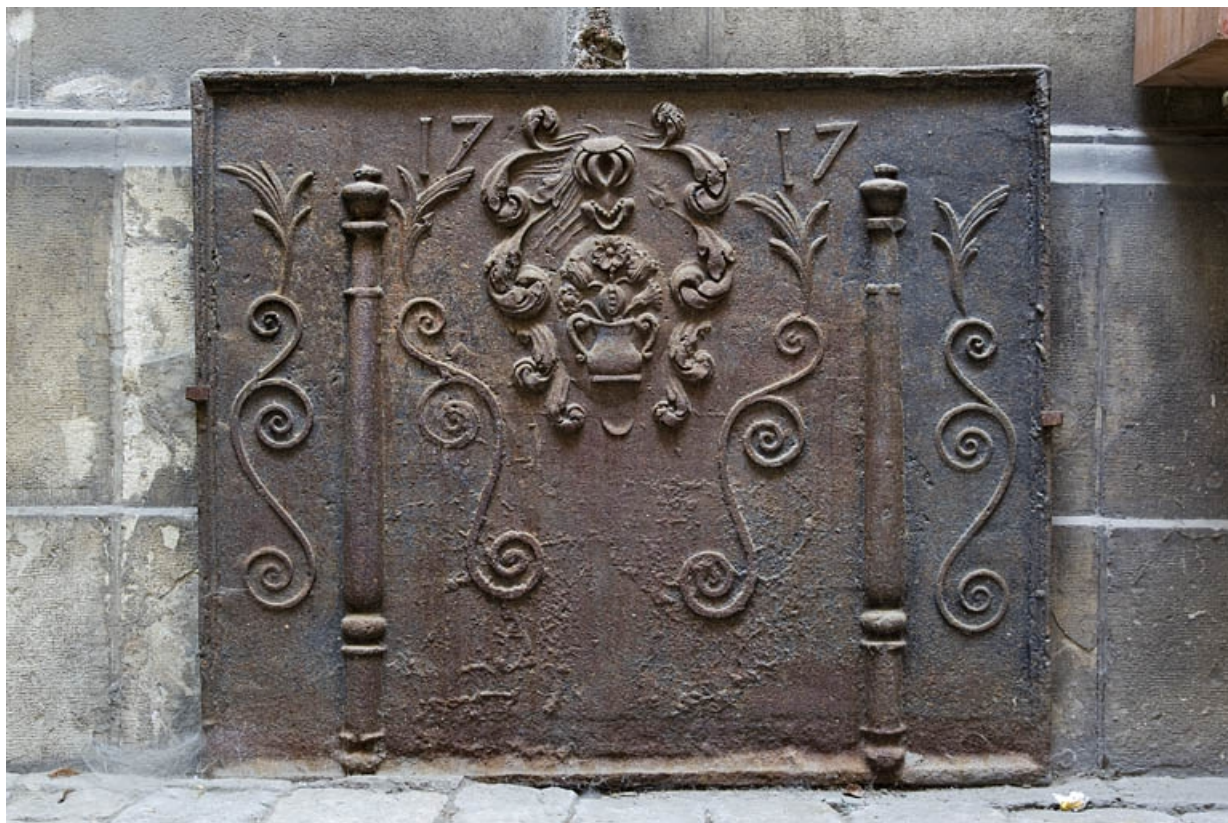
Première cour : détail d'une plaque de cheminée déposée.

25, Besançon, 14 rue de la Préfecture, lieudit : îlot Mairie