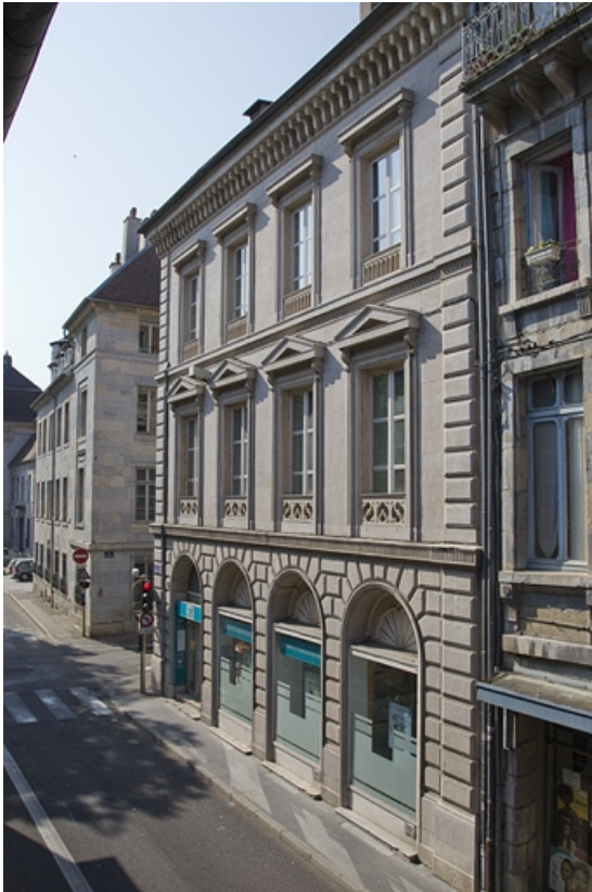
Logis principal : vue d'ensemble de la façade latérale droite.

25, Besançon, 14 rue de la Préfecture, lieudit : îlot Mairie