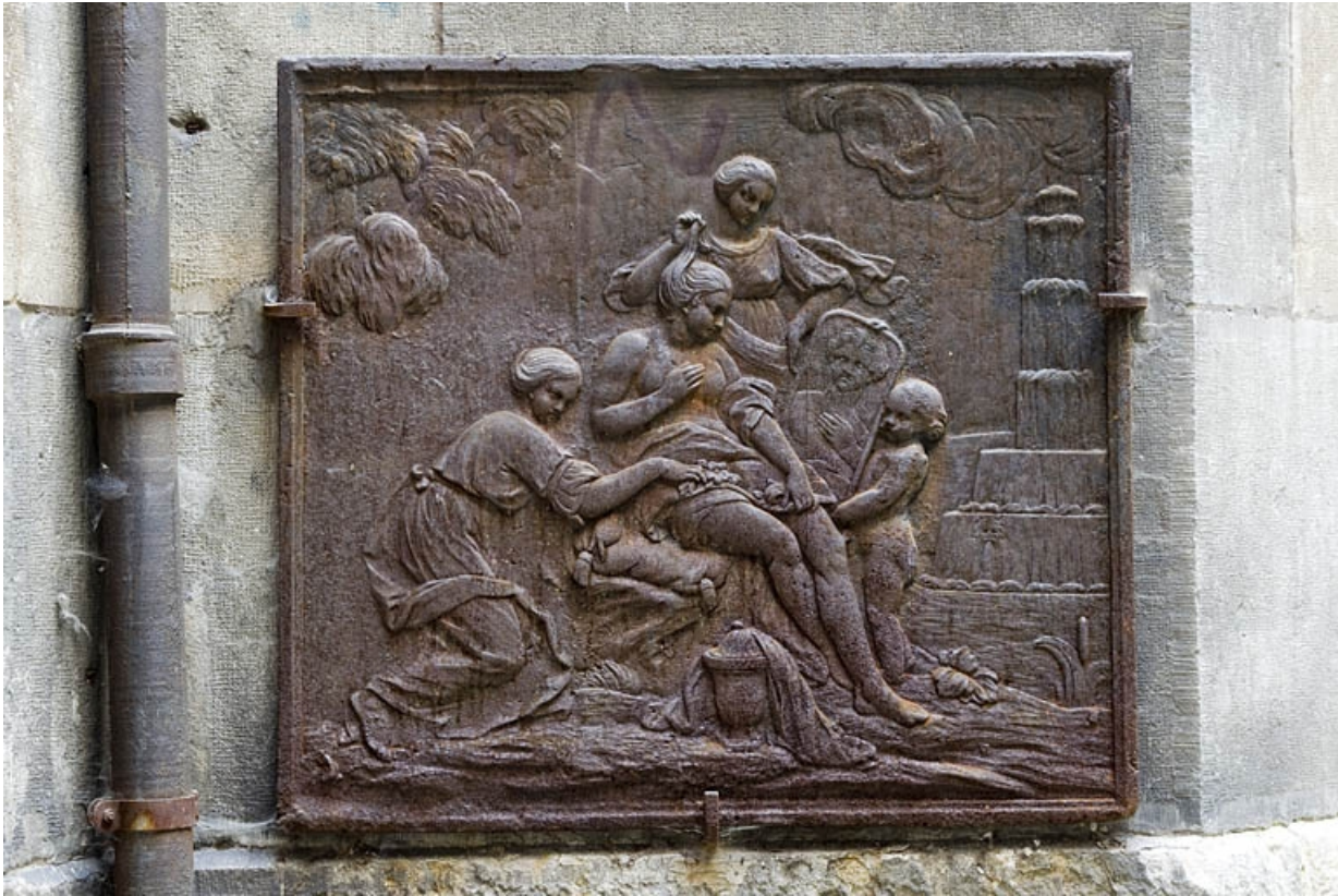
Première cour : plaque de cheminée déposée.

25, Besançon, 14 rue de la Préfecture, lieudit : îlot Mairie