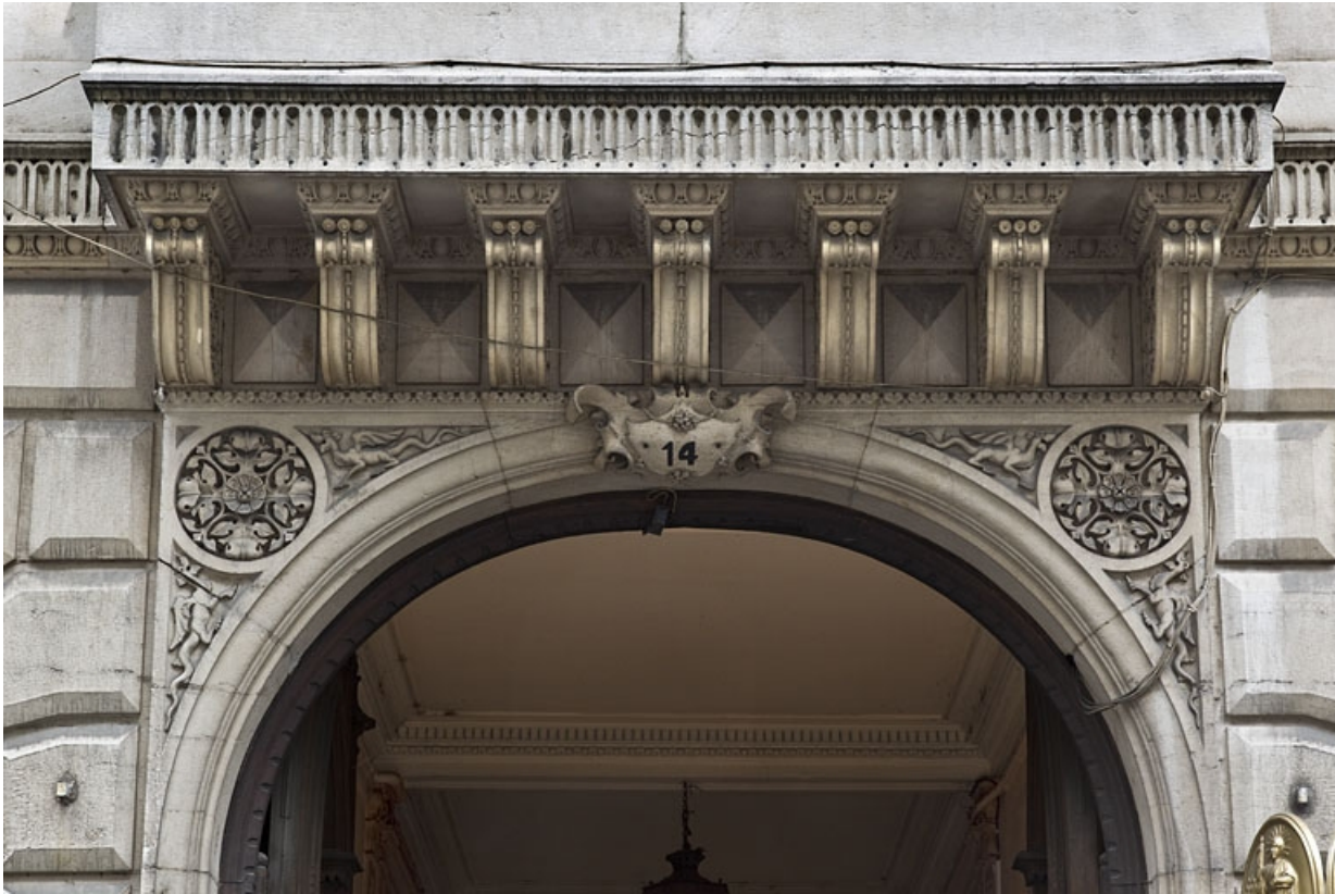
Portail d'entrée : détail du décor de la partie supérieure.

25, Besançon, 14 rue de la Préfecture, lieudit : îlot Mairie