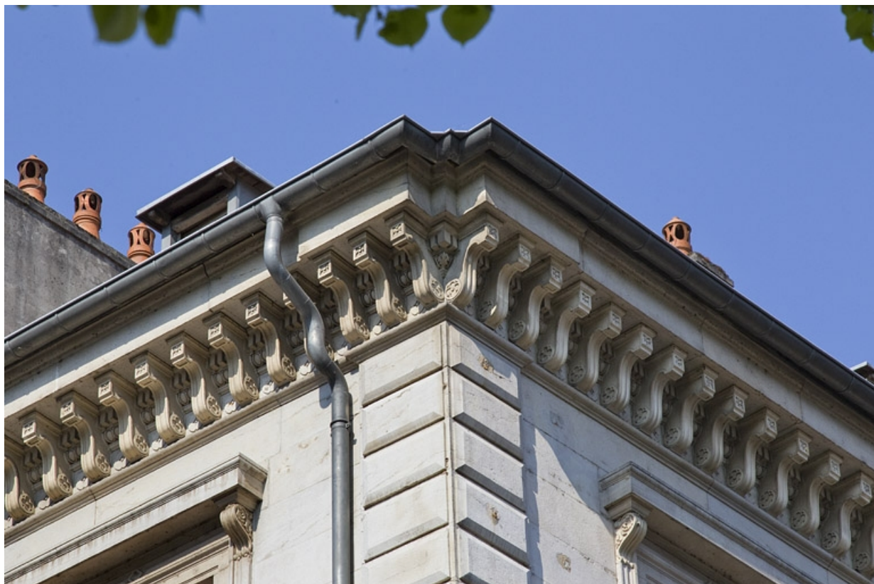
Logis principal : détail de la corniche du toit.

25, Besançon, 14 rue de la Préfecture, lieudit : îlot Mairie