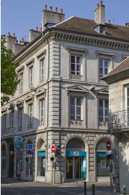
Logis principal : vue de l'angle sur rue.

25, Besançon, 14 rue de la Préfecture, lieudit : îlot Mairie