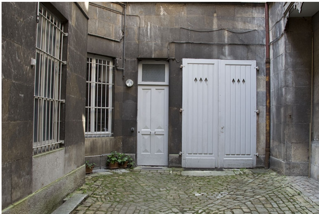
Première cour : vue de la remise et de la porte conduisant à la deuxième cour.

25, Besançon, 14 rue de la Préfecture, lieudit : îlot Mairie