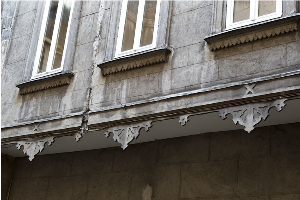
Première cour : détail du décor en bois découpé de l'aile droite.

25, Besançon, 14 rue de la Préfecture, lieudit : îlot Mairie