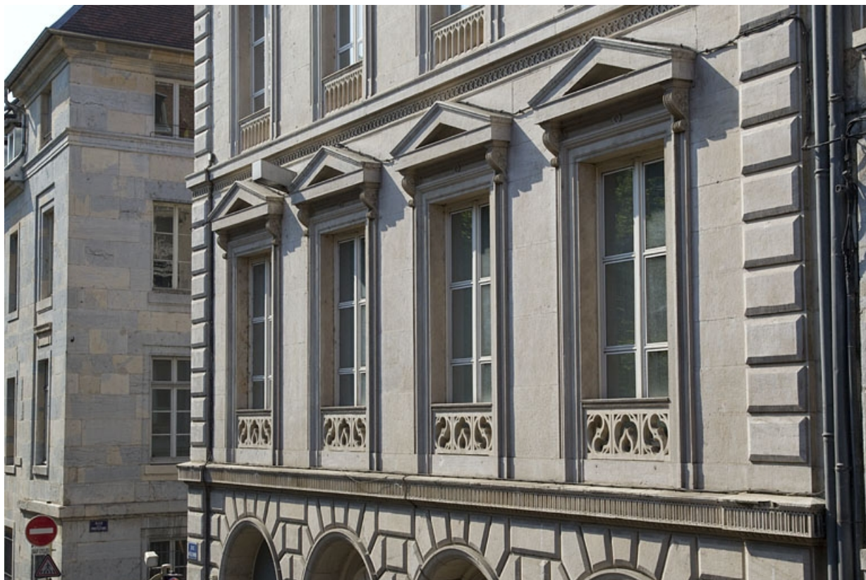
Logis principal, façade latérale droite : détail des fenêtres du premier étage.

25, Besançon, 14 rue de la Préfecture, lieudit : îlot Mairie