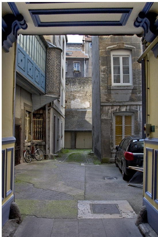
Vue d'ensemble de la première cour, depuis le passage cocher.

25, Besançon, 26 rue Mégevand, lieudit : îlot Mairie