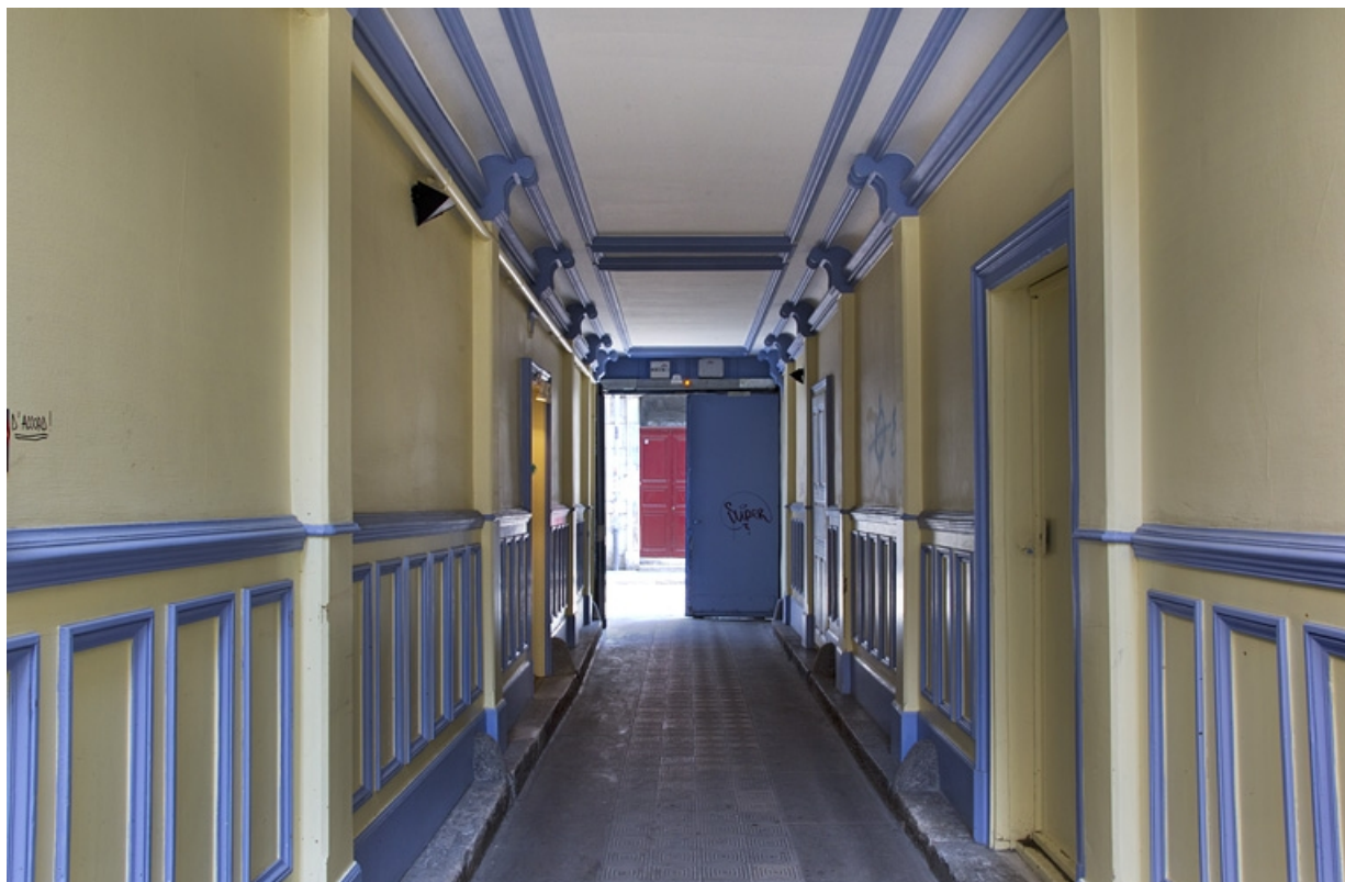
Vue du passage cocher en direction de la rue.

25, Besançon, 26 rue Mégevand, lieudit : îlot Mairie