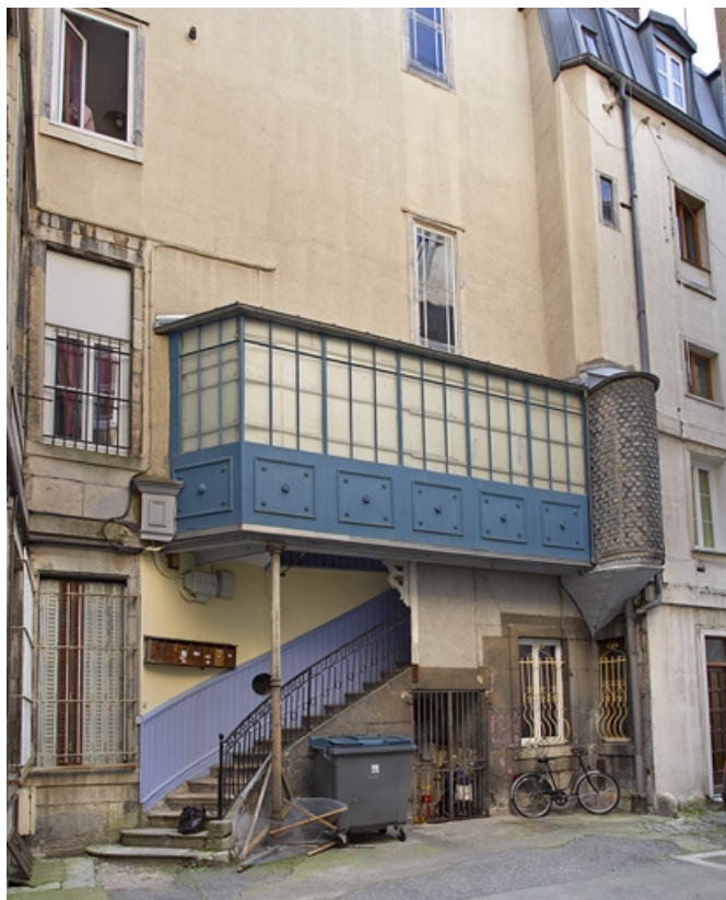
Escalier à cage ouverte à gauche de la première cour : de trois quarts gauche. 25, Besançon, 26 rue Mégevand, lieudit : îlot Mairie