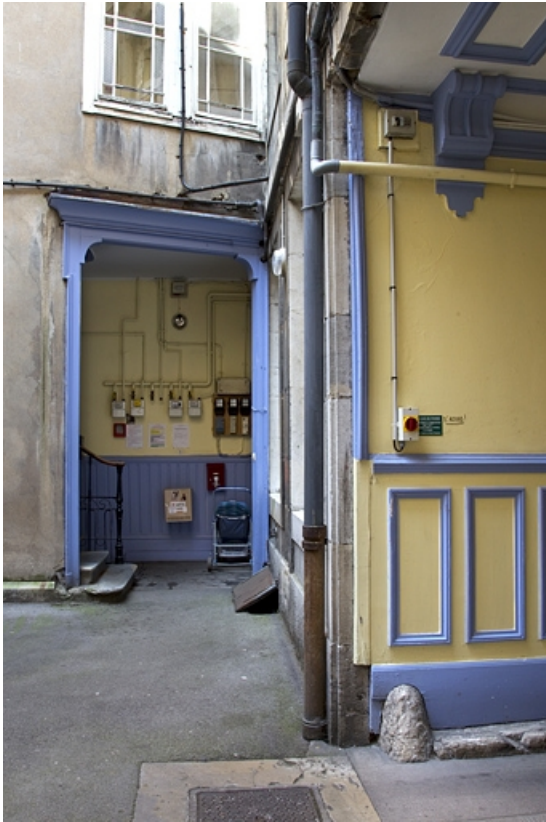
Vue de l'entrée de l'escalier à droite de la première cour.

25, Besançon, 26 rue Mégevand, lieudit : îlot Mairie