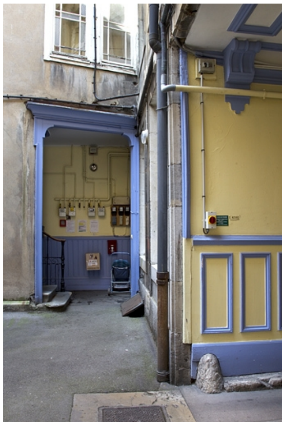
Vue de l'entrée de l'escalier à droite de la première cour.

25, Besançon, 26 rue Mégevand, lieudit : îlot Mairie