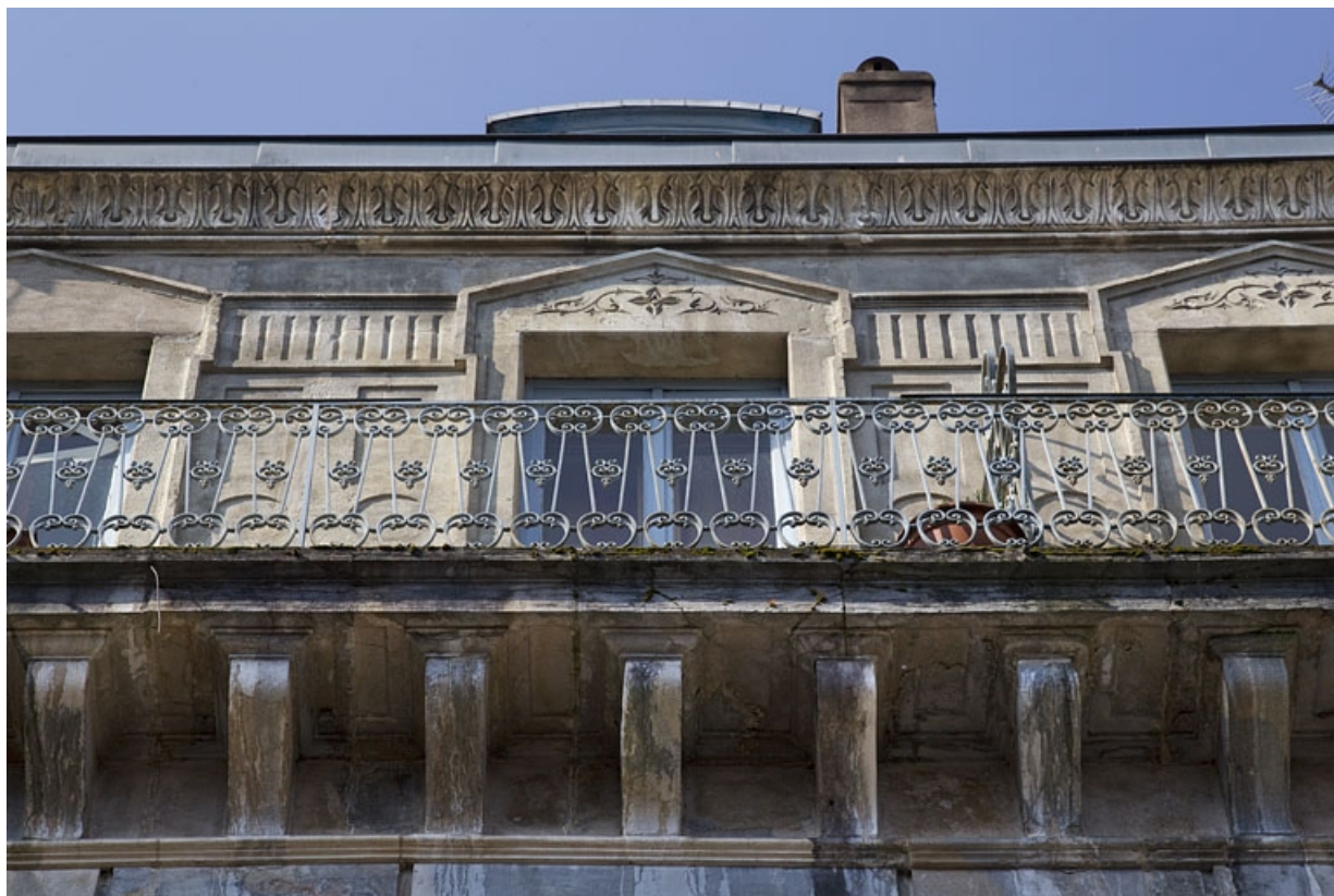
Logis principal, façade sur rue, troisième étage : détail du balcon filant en ferronnerie.

25, Besançon, 26 rue Mégevand, lieudit : îlot Mairie