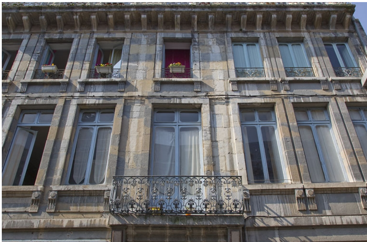
Logis principal, façade sur rue : détail des premier et deuxième étages, de face. 25, Besançon, 26 rue Mégevand, lieudit : îlot Mairie