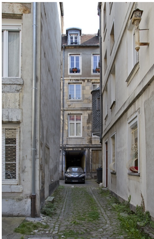
Logis principal, façade postérieure depuis l'entrée de la deuxième cour. 25, Besançon, 26 rue Mégevand, lieudit : îlot Mairie