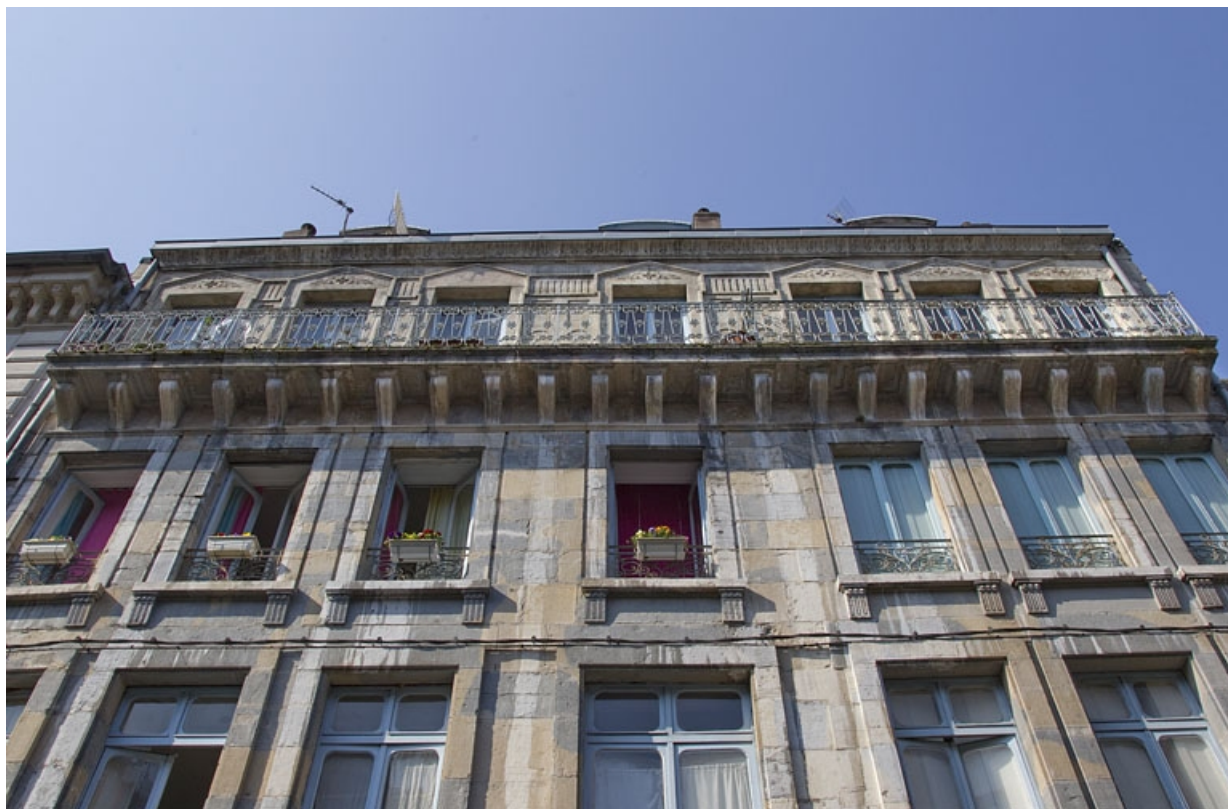
Logis principal, façade sur rue : détail des deuxième et troisième étages, de face. 25, Besançon, 26 rue Mégevand, lieudit : îlot Mairie