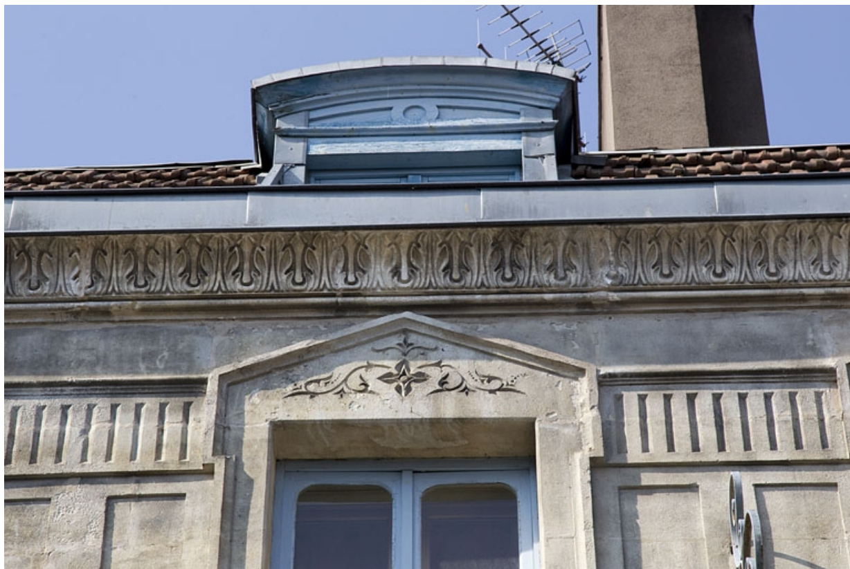
Logis principal, façade sur rue, troisième étage : détail du décor d'une baie et de la corniche du toit.

25, Besançon, 26 rue Mégevand, lieudit : îlot Mairie