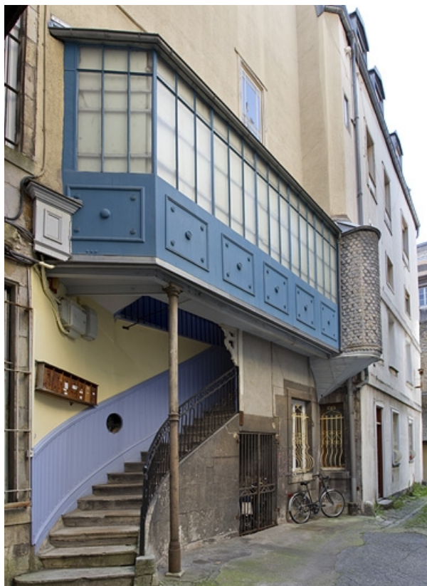
Escalier à cage ouverte à gauche de la première cour : de trois quarts gauche, vue rapprochée. 25, Besançon, 26 rue Mégevand, lieudit : îlot Mairie