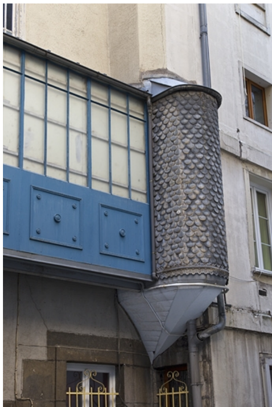
Escalier à cage ouverte à gauche de la première cour : détail de la partie supérieure.

25, Besançon, 26 rue Mégevand, lieudit : îlot Mairie