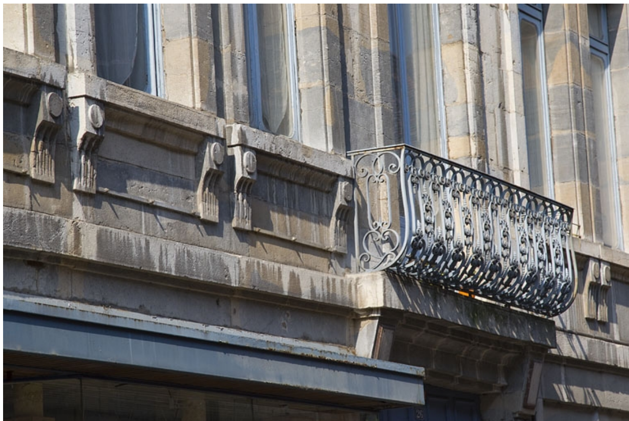
Logis principal, façade sur rue, premier étage : détail du balcon, de trois quarts gauche.

25, Besançon, 26 rue Mégevand, lieudit : îlot Mairie