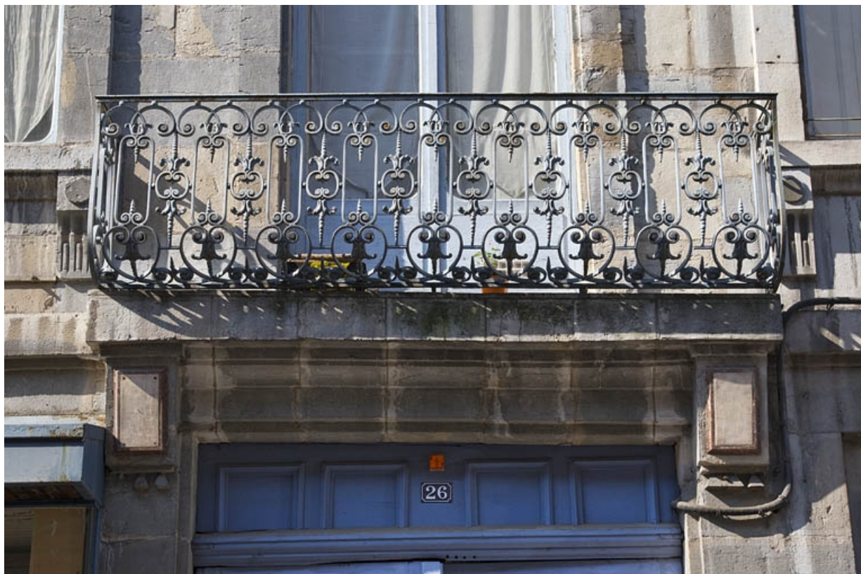
Logis principal, façade sur rue, premier étage : détail du balcon en ferronnerie.

25, Besançon, 26 rue Mégevand, lieudit : îlot Mairie