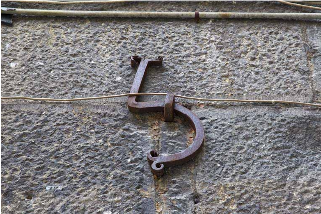
Deuxième logis secondaire : détail de la date en fer forgé (1715), chiffre 5.

25, Besançon, 24 rue Mégevand, lieudit : îlot Mairie