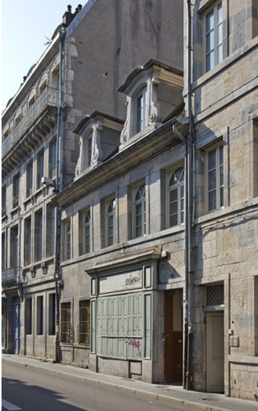
Logis principal, façade antérieure : de trois quarts droit.

25, Besançon, 24 rue Mégevand, lieudit : îlot Mairie