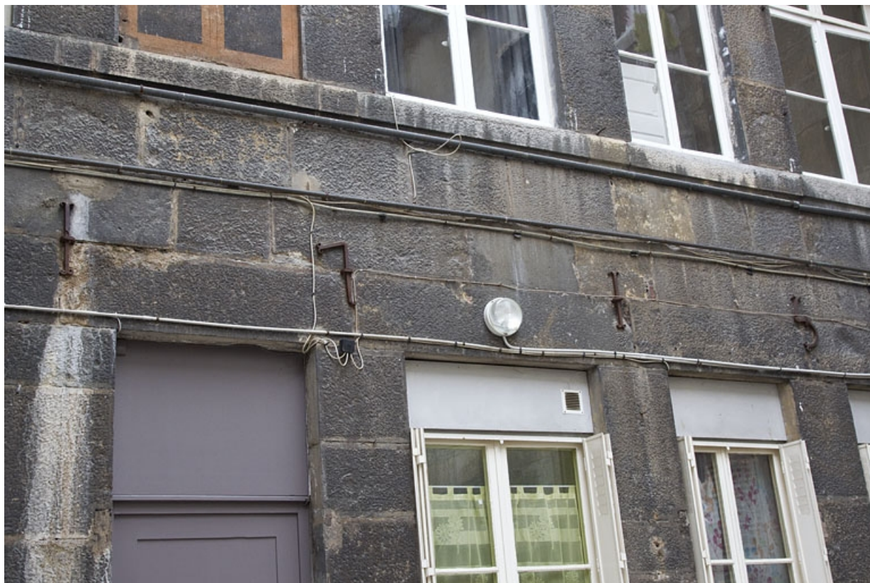
Deuxième logis secondaire : détail de la date en fer forgé (1715), vue d'ensemble.

25, Besançon, 24 rue Mégevand, lieudit : îlot Mairie