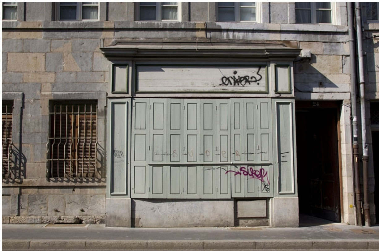
Logis principal, façade antérieure : détail de la devanture en menuiserie.

25, Besançon, 24 rue Mégevand, lieudit : îlot Mairie