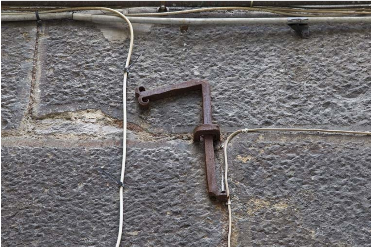
Deuxième logis secondaire : détail de la date en fer forgé (1715), chiffre 7.

25, Besançon, 24 rue Mégevand, lieudit : îlot Mairie