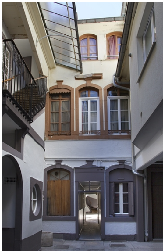
Premier logis secondaire, façade antérieure au fond de la première cour : de face.

25, Besançon, 24 rue Mégevand, lieudit : îlot Mairie