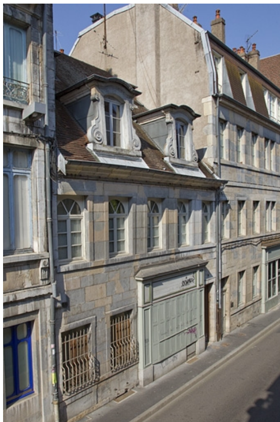
Logis principal, façade antérieure de trois quarts gauche, vue rapprochée. 25, Besançon, 24 rue Mégevand, lieudit : îlot Mairie