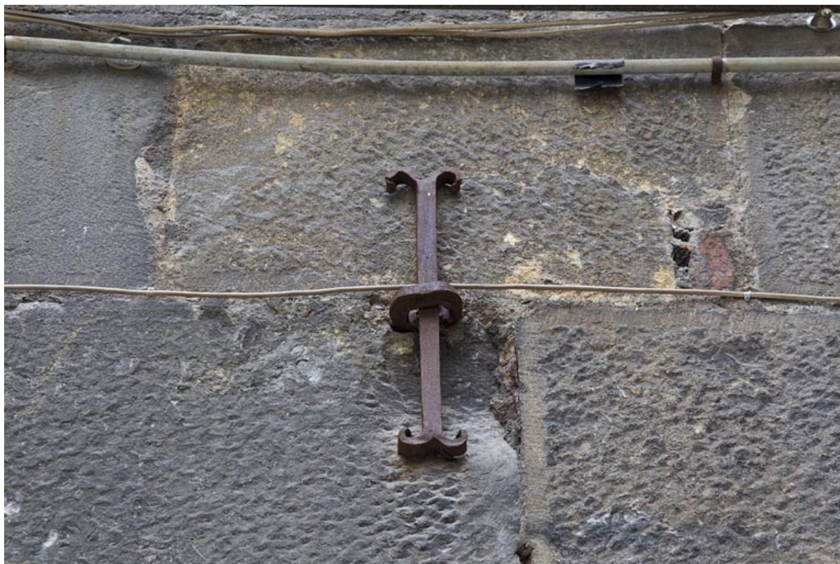
Deuxième logis secondaire : détail de la date en fer forgé (1715), chiffre 1.

25, Besançon, 24 rue Mégevand, lieudit : îlot Mairie