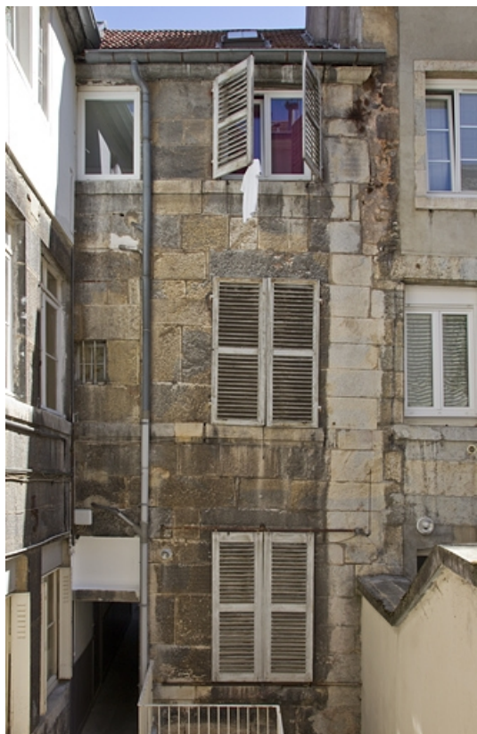
Premier logis secondaire, façade postérieure.

25, Besançon, 24 rue Mégevand, lieudit : îlot Mairie