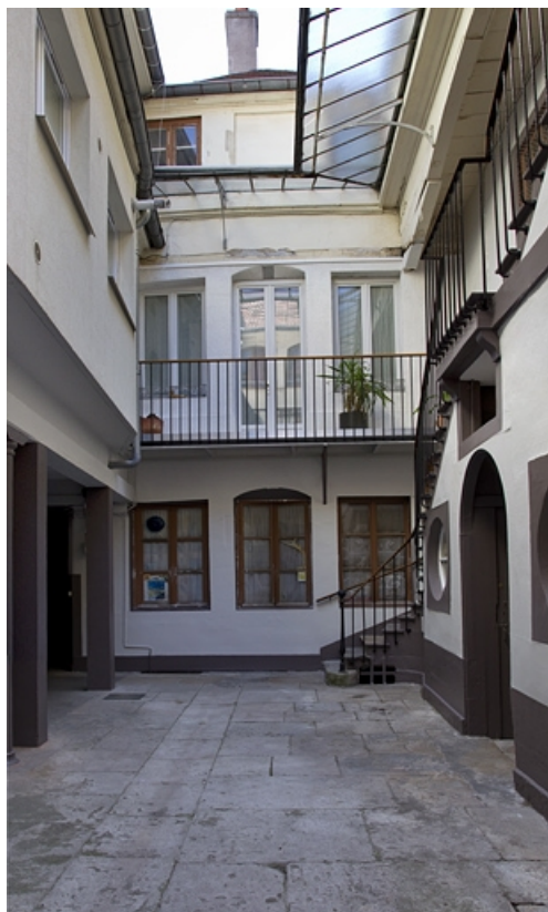
Logis principal, façade postérieure depuis le fond de la cour.

25, Besançon, 24 rue Mégevand, lieudit : îlot Mairie