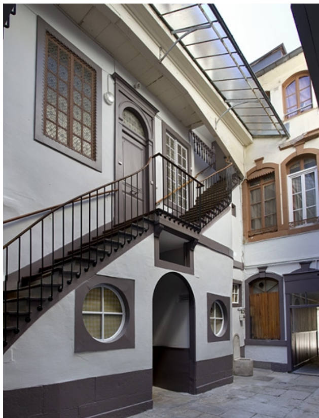
Vue de l'escalier à cage ouverte sur cour : de trois quarts gauche.

25, Besançon, 24 rue Mégevand, lieudit : îlot Mairie