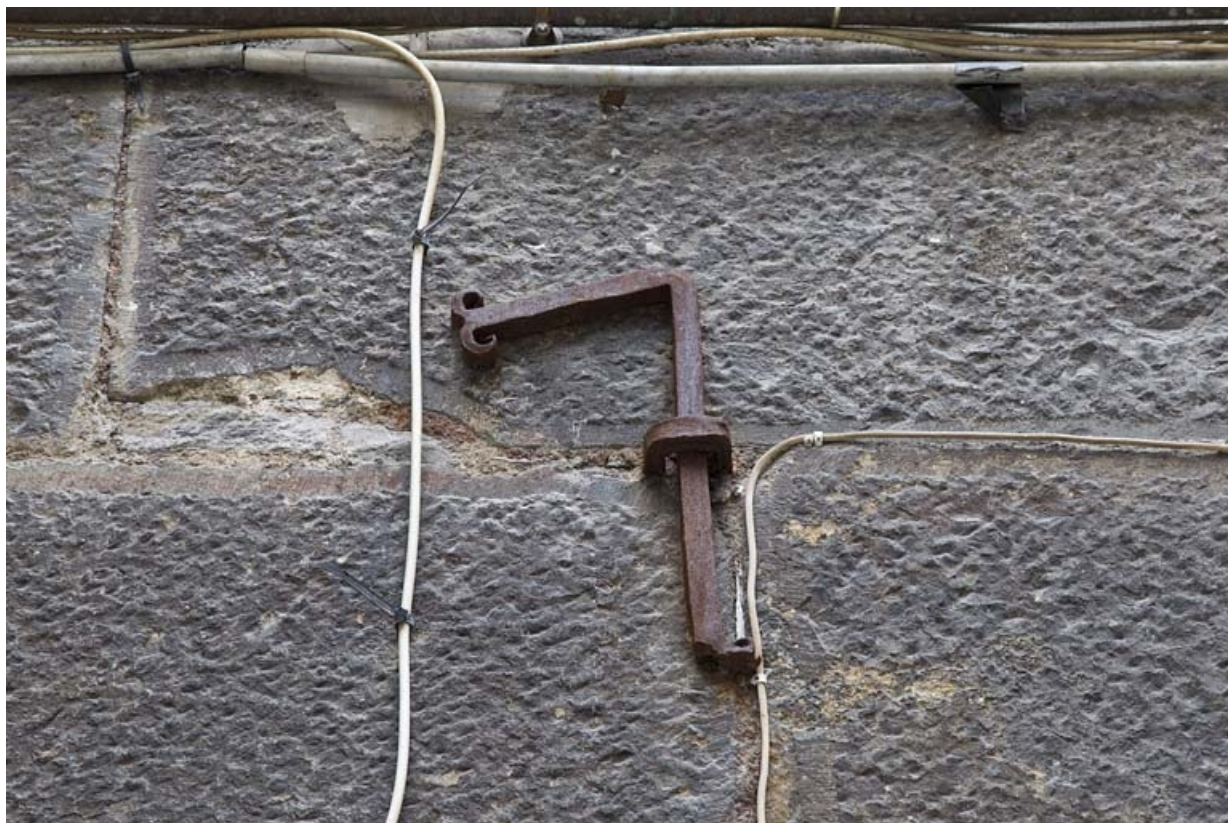
Deuxième logis secondaire : détail de la date en fer forgé (1715), chiffre 7.

25, Besançon, 24 rue Mégevand, lieudit : îlot Mairie