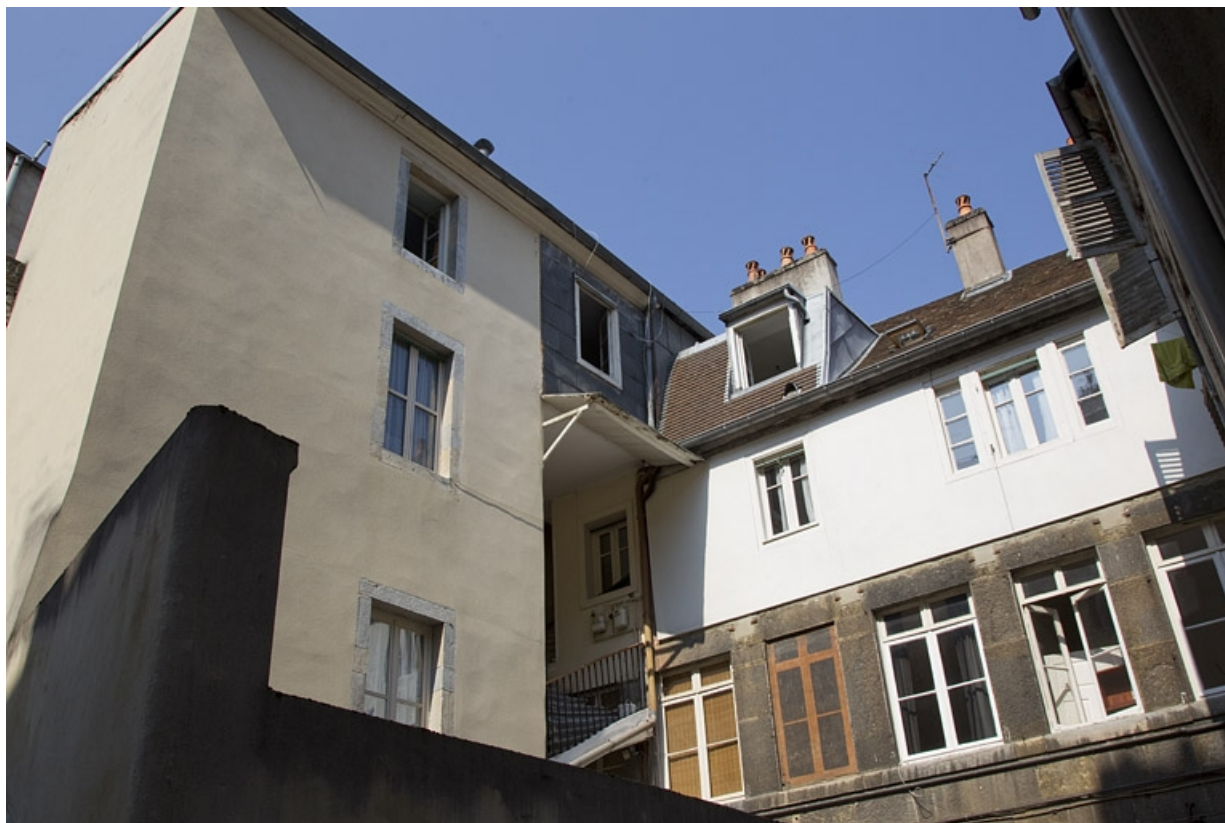
Deuxième logis secondaire dans la deuxième cour : vue d'ensemble depuis la parcelle voisine.

25, Besançon, 24 rue Mégevand, lieudit : îlot Mairie