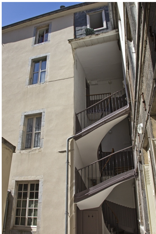
Deuxième logis secondaire, vue de l'escalier à cage ouverte.

25, Besançon, 24 rue Mégevand, lieudit : îlot Mairie