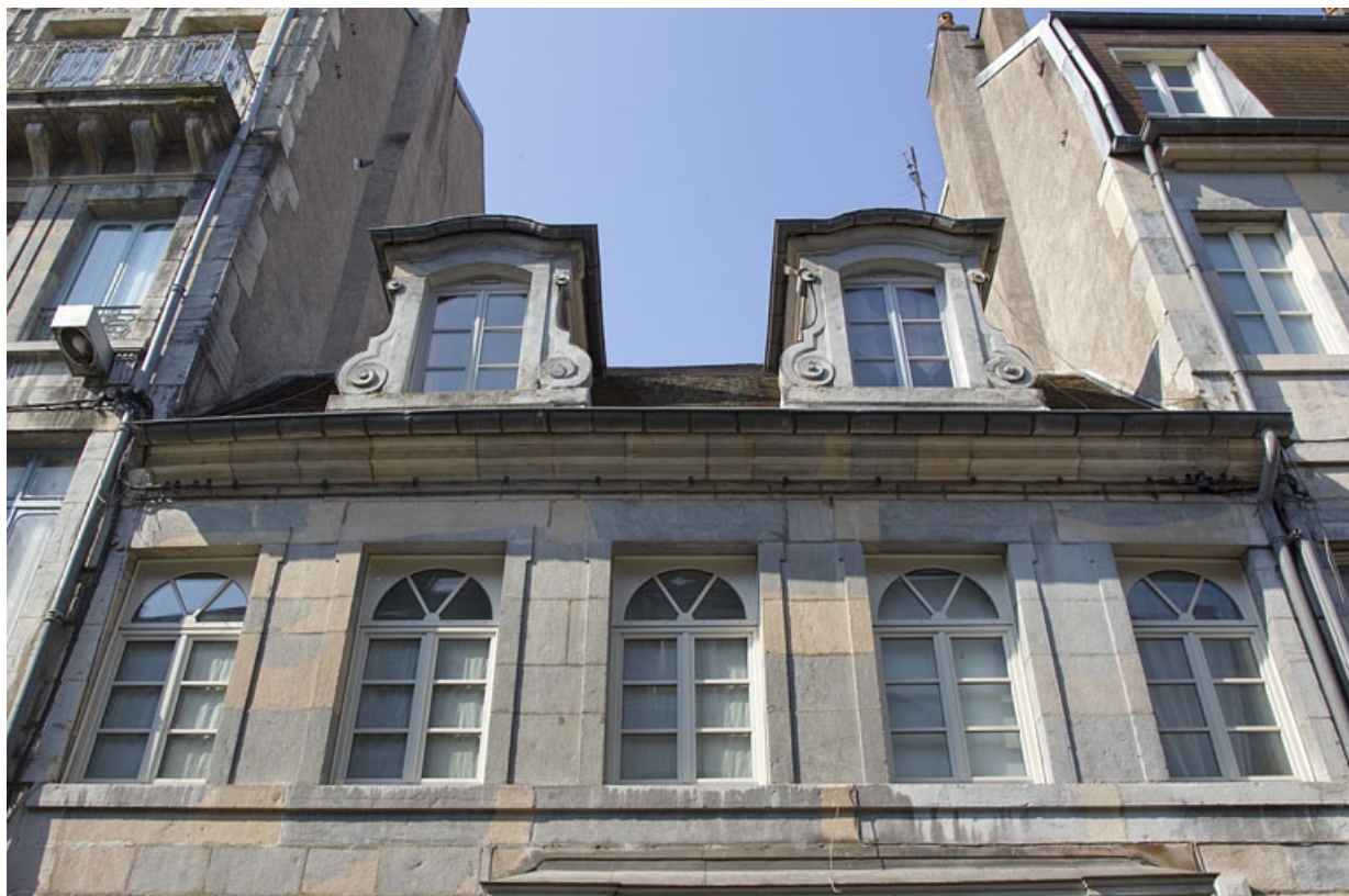
Logis principal, façade antérieure : vue du premier étage et des lucarnes dans le toit, de face.

25, Besançon, 24 rue Mégevand, lieudit : îlot Mairie