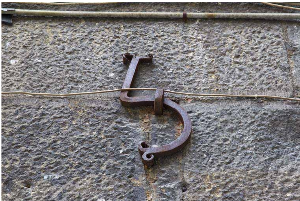
Deuxième logis secondaire : détail de la date en fer forgé (1715), chiffre 5.

25, Besançon, 24 rue Mégevand, lieudit : îlot Mairie