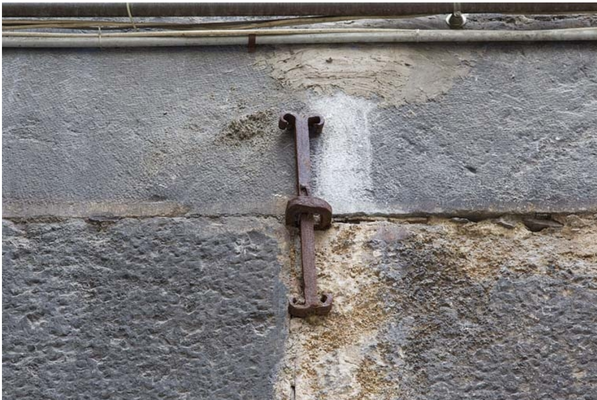
Deuxième logis secondaire : détail de la date en fer forgé (1715), chiffre 1.

25, Besançon, 24 rue Mégevand, lieudit : îlot Mairie