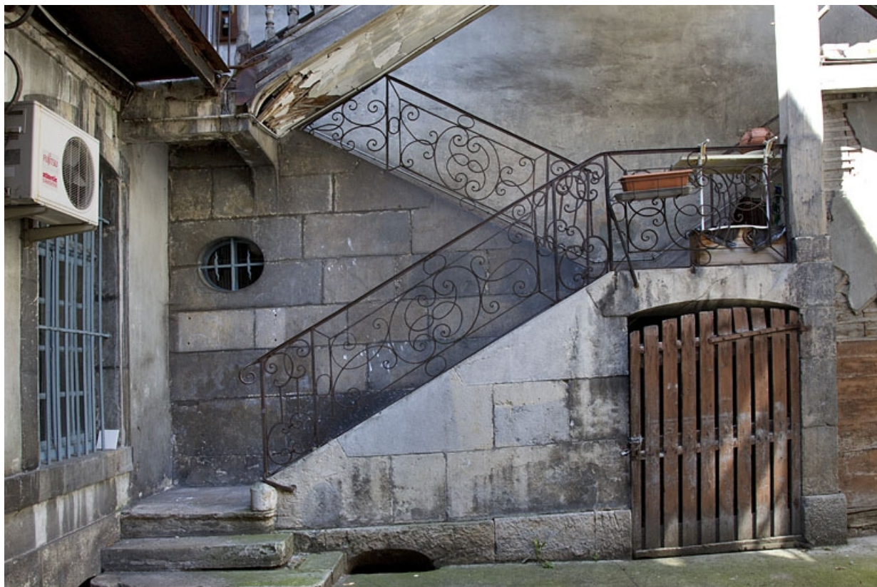
Escalier à cage ouverte : détail de la rampe en ferronnerie des premières volées.

25, Besançon, 13 rue Rivotte, lieudit : îlot des Jacobins