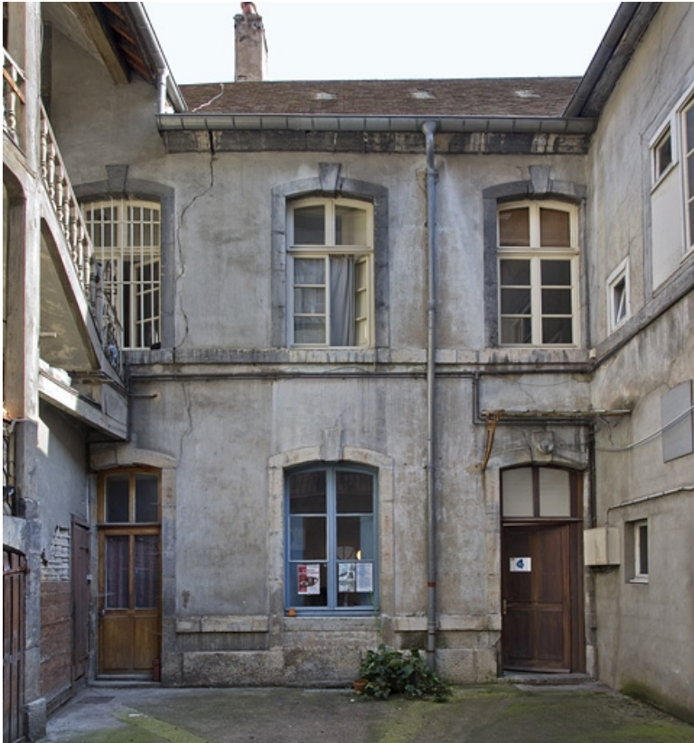
Logis secondaire : vue d'ensemble de la façade antérieure.

25, Besançon, 13 rue Rivotte, lieudit : îlot des Jacobins