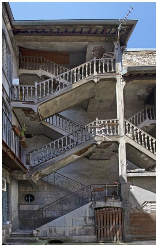
Escalier à cage ouverte sur cour, de face.

25, Besançon, 13 rue Rivotte, lieudit : îlot des Jacobins