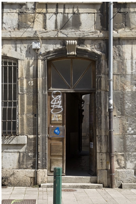
Logis principal, façade antérieure : détail de la porte d'entrée.

25, Besançon, 13 rue Rivotte, lieudit : îlot des Jacobins