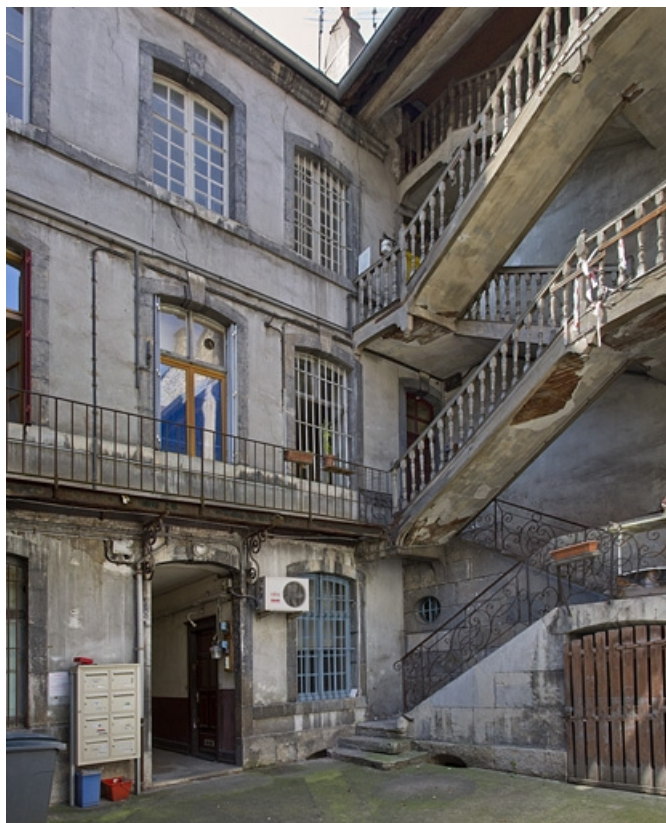
Logis principal : détail de la façade postérieure et de l'escalier à cage ouverte, de trois quarts gauche. 25, Besançon, 13 rue Rivotte, lieudit : îlot des Jacobins