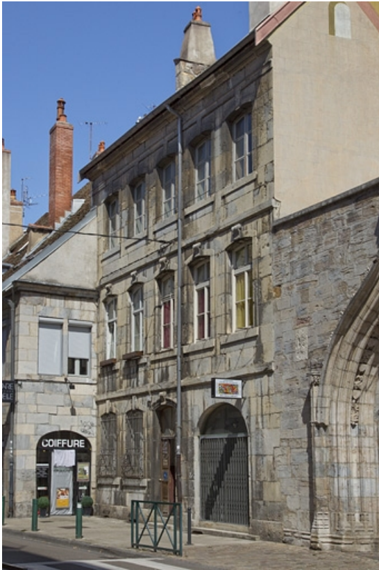
Vue d'ensemble depuis la rue, de trois quarts droit, vue rapprochée.

25, Besançon, 13 rue Rivotte, lieudit : îlot des Jacobins