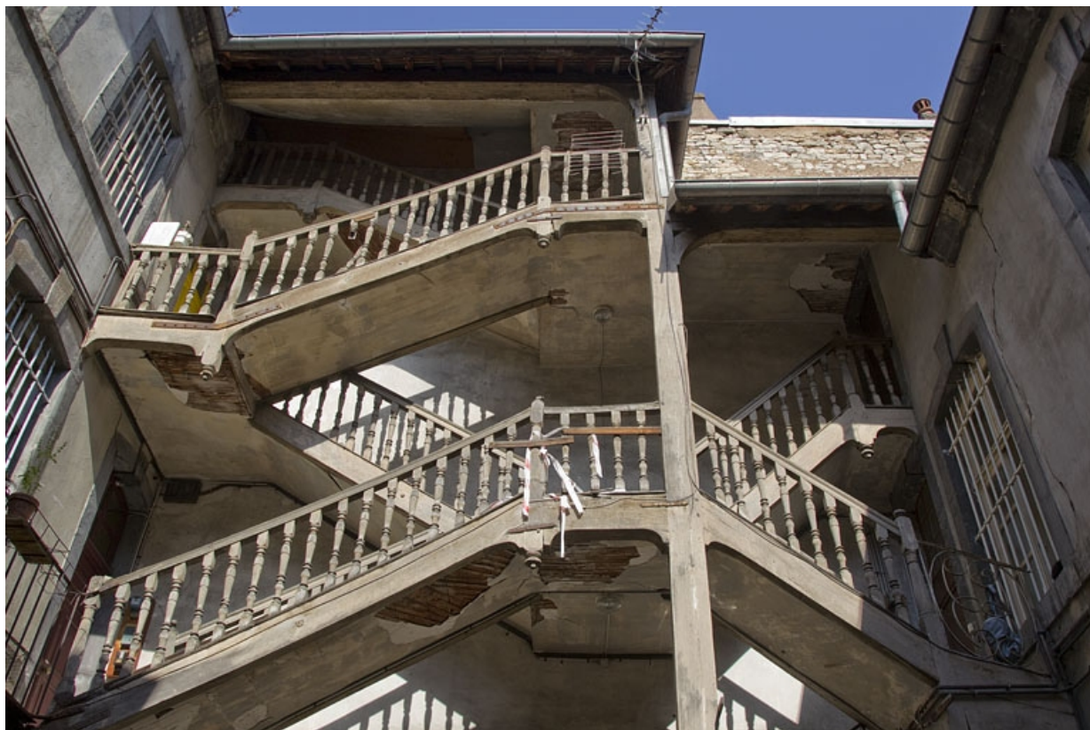
Escalier à cage ouverte sur cour, partie supérieure, de face.

25, Besançon, 13 rue Rivotte, lieudit : îlot des Jacobins