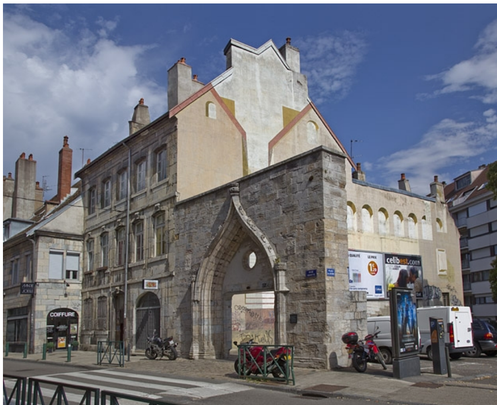
Vue d'ensemble depuis la rue, de trois quarts droit. 25, Besançon, 13 rue Rivotte, lieudit : îlot des Jacobins