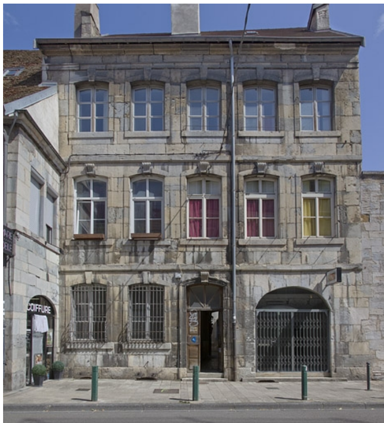
Logis principal : vue d'ensemble de la façade antérieure, de face.

25, Besançon, 13 rue Rivotte, lieudit : îlot des Jacobins