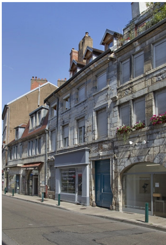
Vue d'ensemble de trois quarts droit depuis la rue, vue éloignée.

25, Besançon, 5 rue Rivotte, lieudit : îlot des Jacobins