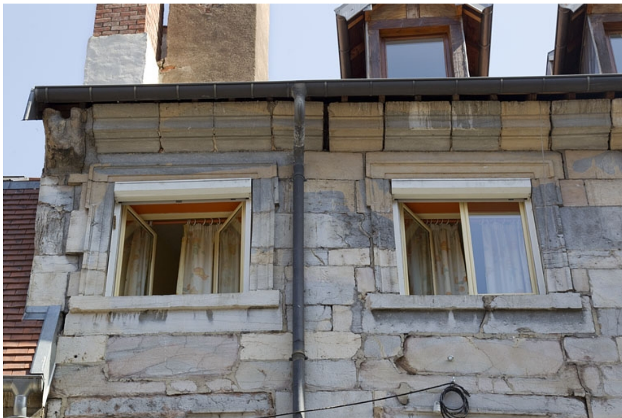
Logis principal, façade antérieure : détail des fenêtres de l'étage, partie gauche.

25, Besançon, 5 rue Rivotte, lieudit : îlot des Jacobins