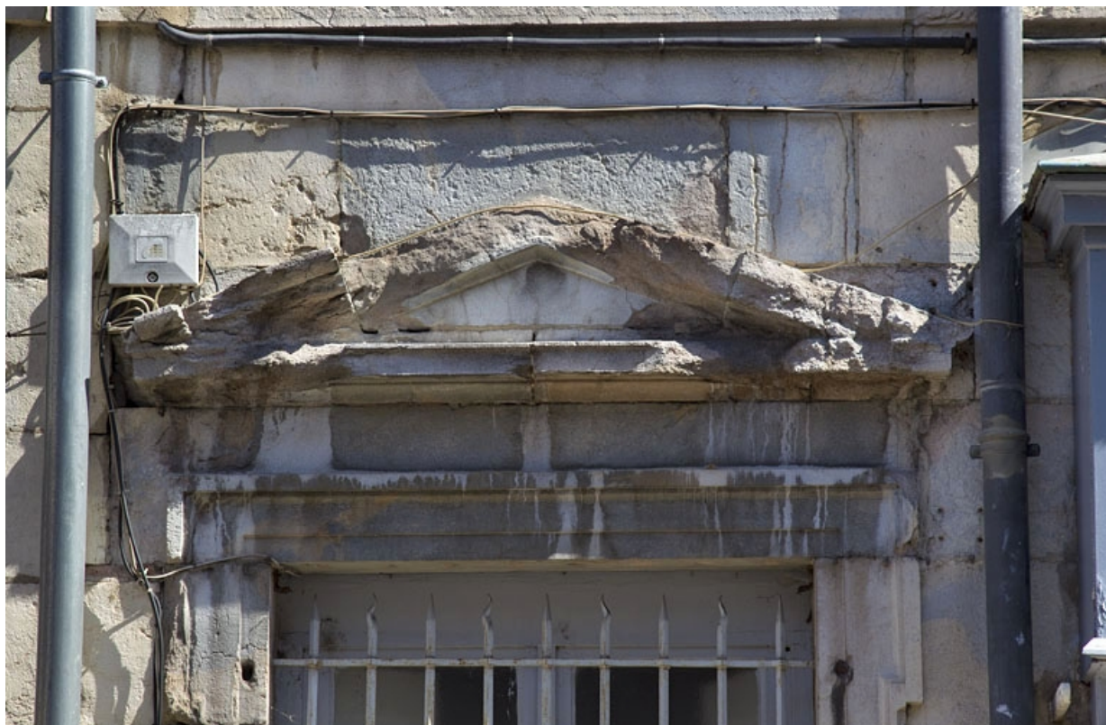
Logis principal, façade antérieure : détail du fronton de la fenêtre à gauche du portail d'entrée.

25, Besançon, 5 rue Rivotte, lieudit : îlot des Jacobins