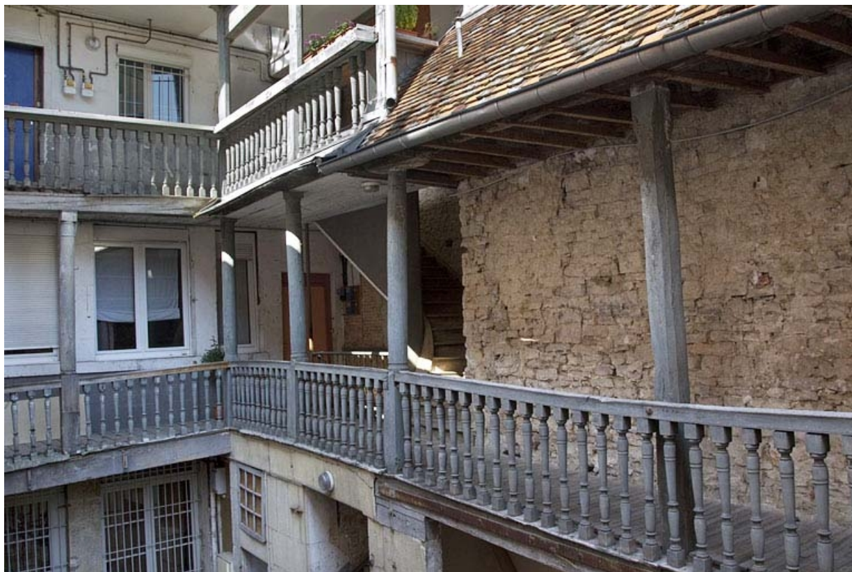
Escalier extérieur : détail des coursières, de trois quarts gauche.

25, Besançon, 5 rue Rivotte, lieudit : îlot des Jacobins