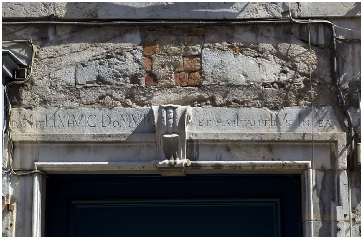
Logis principal, façade antérieure : détail de l'inscription au-dessus du portail d'entrée.

25, Besançon, 5 rue Rivotte, lieudit : îlot des Jacobins