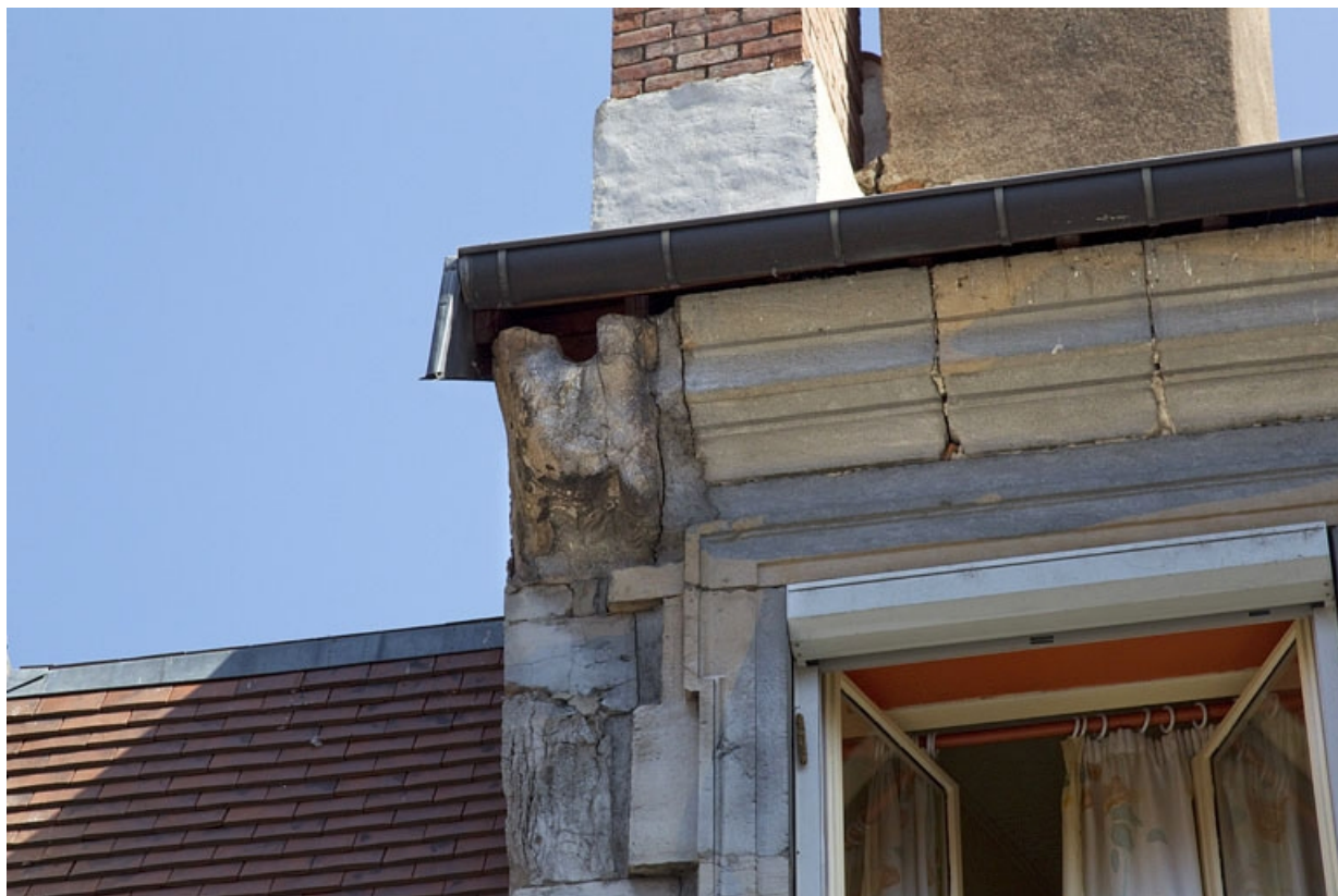
Logis principal, façade antérieure : détail de la gargouille gauche.

25, Besançon, 5 rue Rivotte, lieudit : îlot des Jacobins