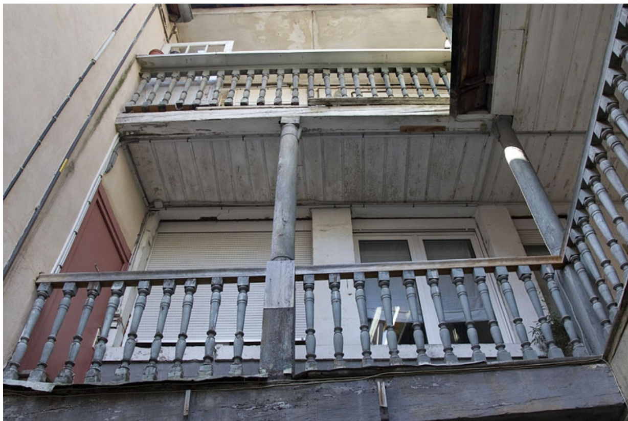
Escalier extérieur : détail des coursières, de face. 25, Besançon, 5 rue Rivotte, lieudit : îlot des Jacobins