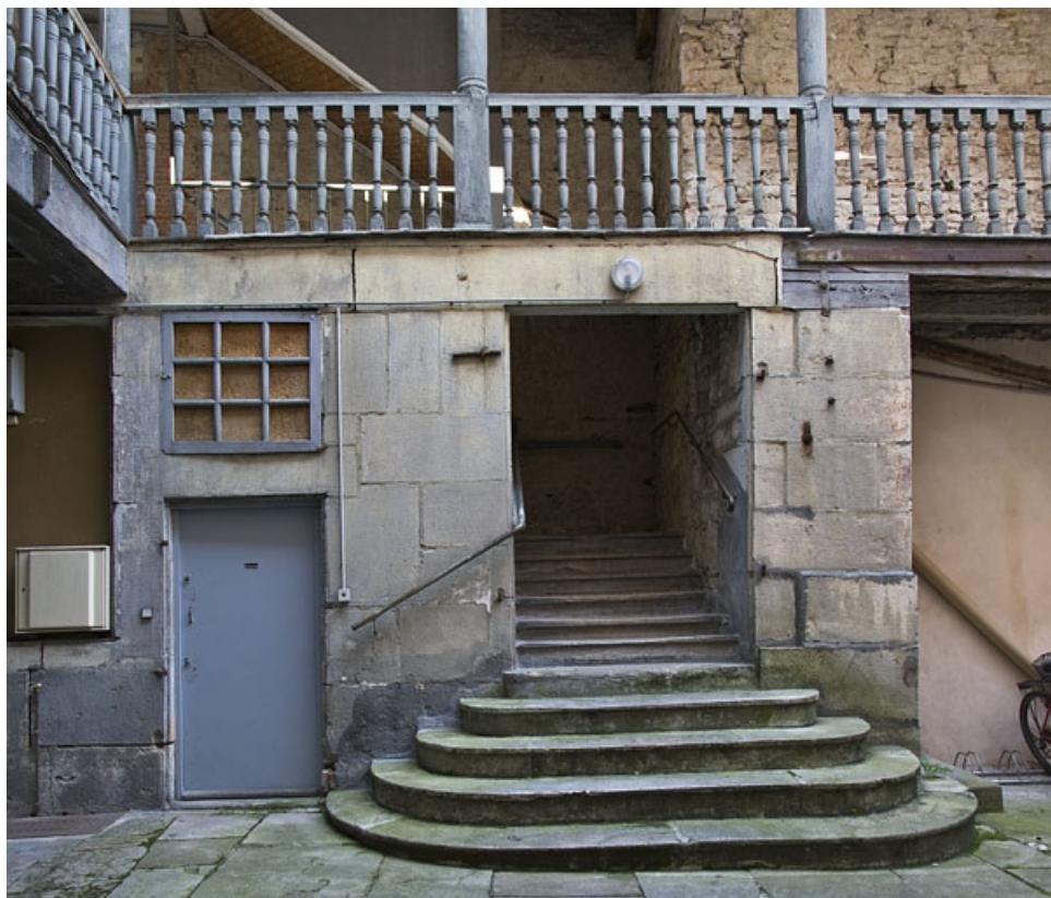
Escalier extérieur : détail du départ de l'escalier.

25, Besançon, 5 rue Rivotte, lieudit : îlot des Jacobins