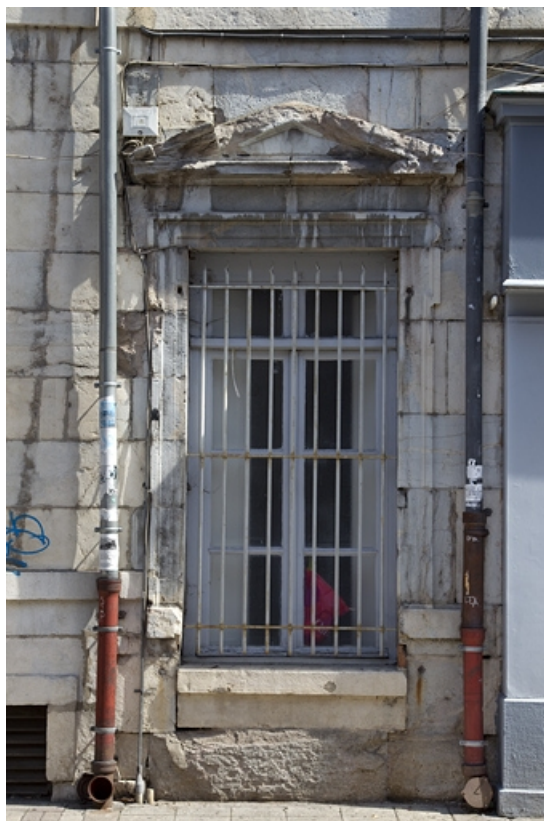
Logis principal, façade antérieure : détail d'une fenêtre du rez-de-chaussée, partie gauche. 25, Besançon, 5 rue Rivotte, lieudit : îlot des Jacobins