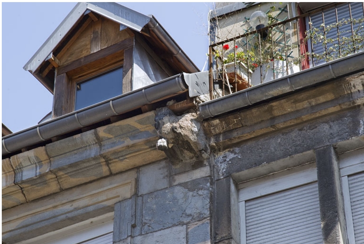
Logis principal, façade antérieure : détail de la gargouille droite.

25, Besançon, 5 rue Rivotte, lieudit : îlot des Jacobins