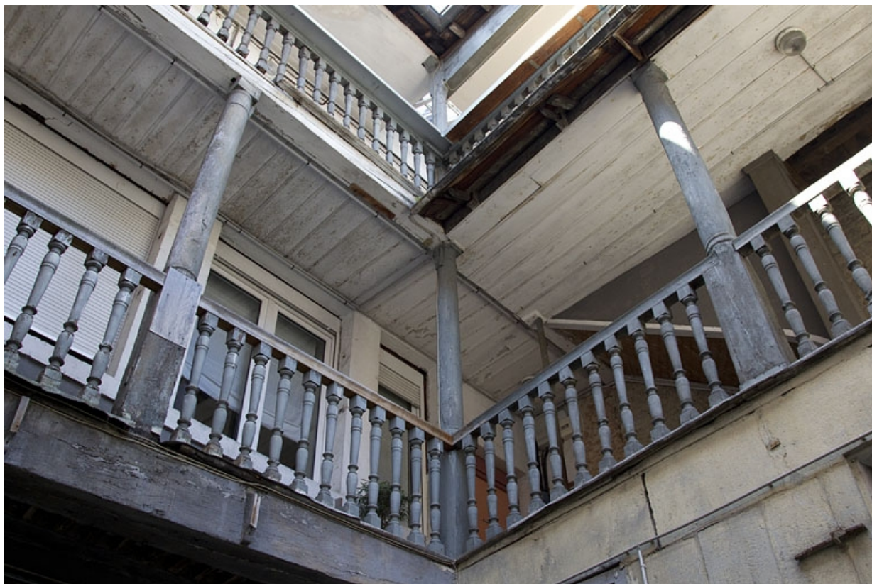
Escalier extérieur : détail de l'angle de la coursière du premier étage.

25, Besançon, 5 rue Rivotte, lieudit : îlot des Jacobins