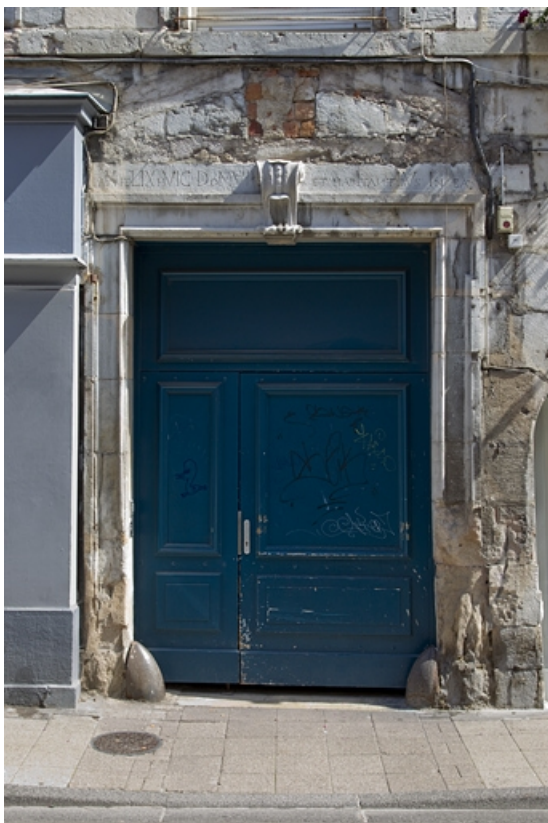
Logis principal, façade antérieure : détail du portail d'entrée.

25, Besançon, 5 rue Rivotte, lieudit : îlot des Jacobins