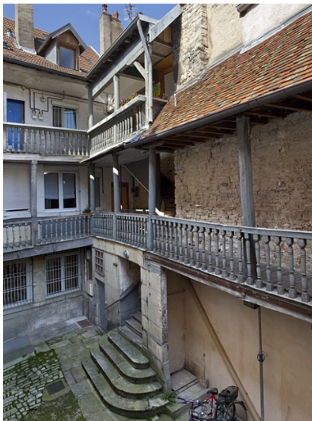
Escalier extérieur sur cour : de trois quarts gauche.

25, Besançon, 5 rue Rivotte, lieudit : îlot des Jacobins