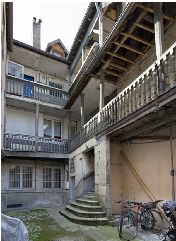
Vue d'ensemble de la façade postérieure du logis principal et de l'escalier extérieur.

25, Besançon, 5 rue Rivotte, lieudit : îlot des Jacobins