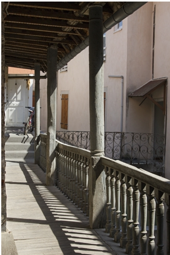
Escalier extérieur : détail de la coursière du premier étage, depuis l'intérieur. 25, Besançon, 5 rue Rivotte, lieudit : îlot des Jacobins