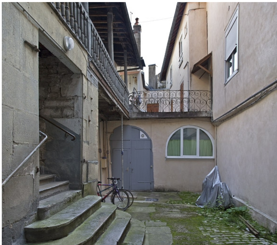
Vue d'ensemble de la cour depuis l'entrée.

25, Besançon, 5 rue Rivotte, lieudit : îlot des Jacobins