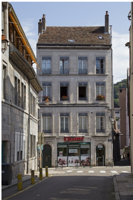
Logis principal : façade antérieure, de face.

25, Besançon, 19 rue de Pontarlier, lieudit : îlot des Jacobins