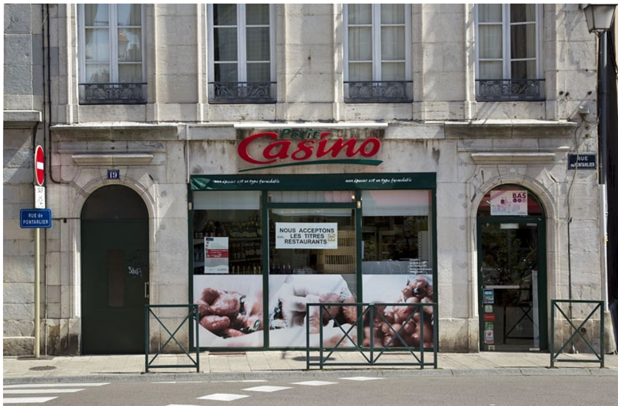
Logis principal, façade antérieure : détail du rez-de-chaussée, de face.

25, Besançon, 19 rue de Pontarlier, lieudit : îlot des Jacobins