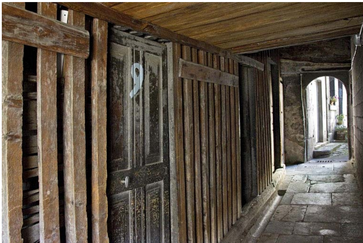
Premier logis secondaire : détail des bûchers donnant sur le couloir.

25, Besançon, 19 rue de Pontarlier, lieudit : îlot des Jacobins