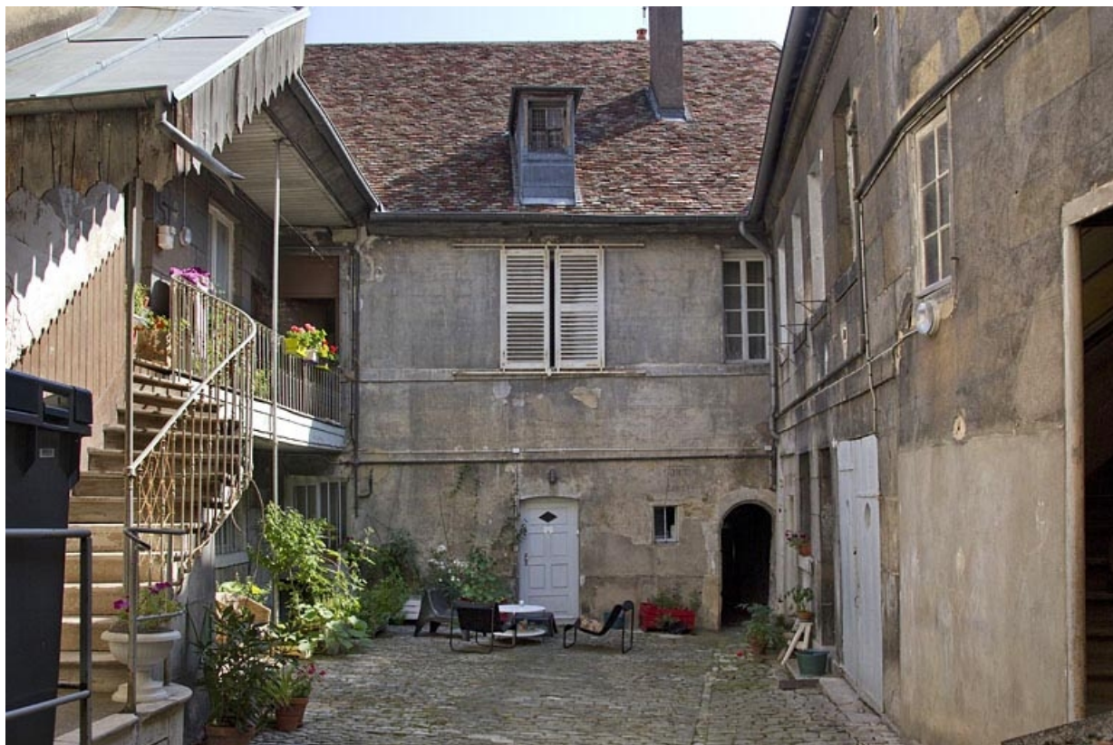
Premier logis secondaire : vue d'ensemble, de face.

25, Besançon, 19 rue de Pontarlier, lieudit : îlot des Jacobins