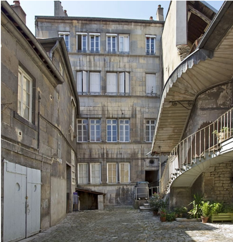
Vue de la façade postérieure du logis principal : de face. 25, Besançon, 19 rue de Pontarlier, lieudit : îlot des Jacobins