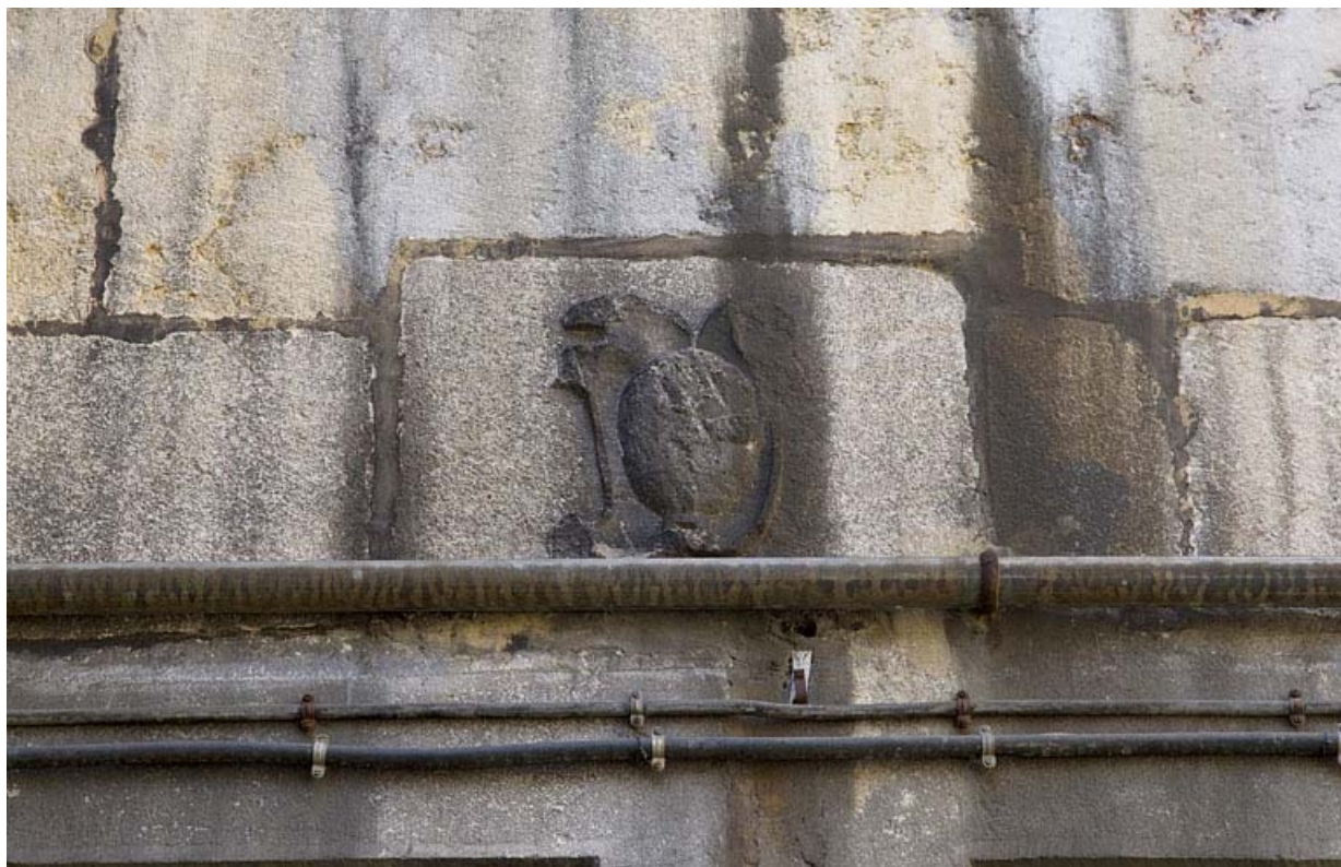
Logis principal, façade postérieure : détail du cartouche situé au-dessus d'une fenêtre. 25, Besançon, 19 rue de Pontarlier, lieudit : îlot des Jacobins