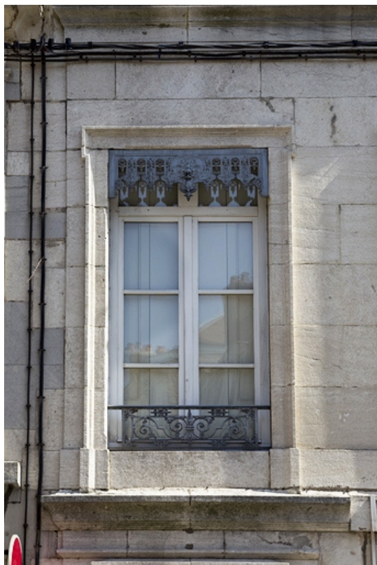
Logis principal, façade antérieure : détail d'une fenêtre du premier étage. 25, Besançon, 19 rue de Pontarlier, lieudit : îlot des Jacobins