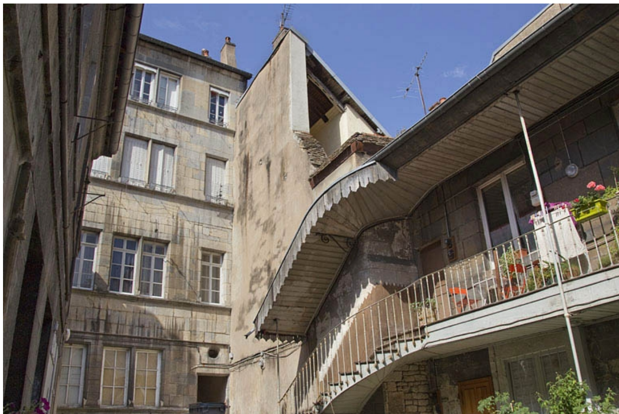
Vue d'ensemble de la façade postérieure du logis principal et du premier logis secondaire, depuis le fond de la cour. 25, Besançon, 19 rue de Pontarlier, lieudit : îlot des Jacobins