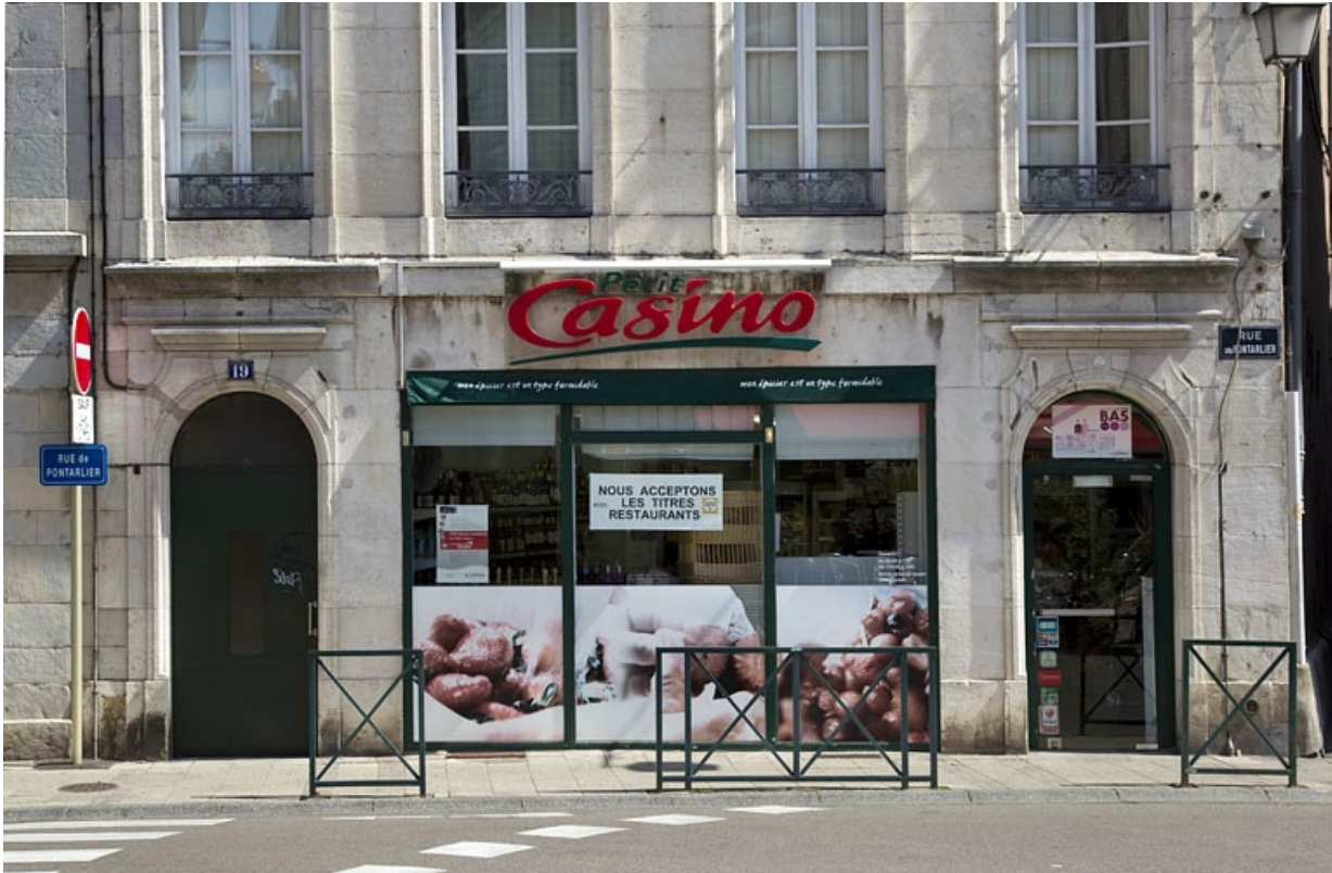
Logis principal, façade antérieure : détail du rez-de-chaussée, de face.

25, Besançon, 19 rue de Pontarlier, lieudit : îlot des Jacobins