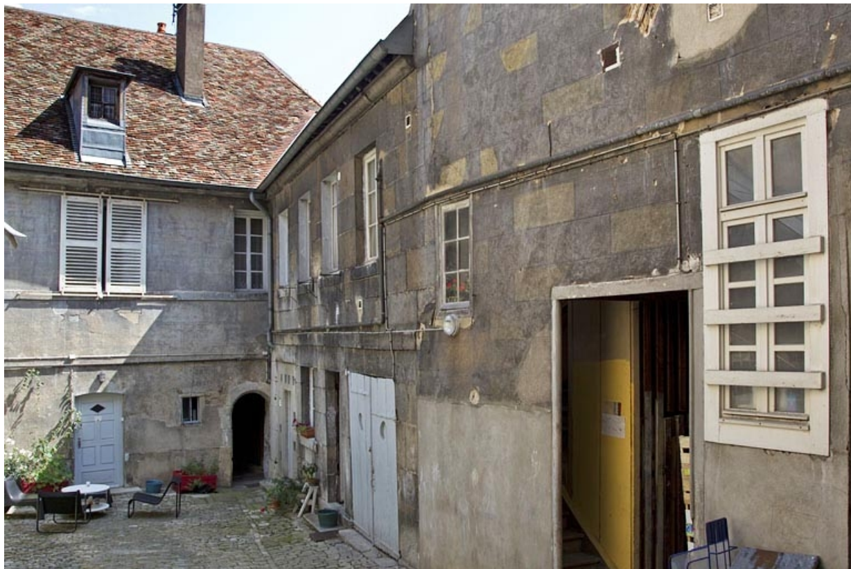
Logis principal : détail de l'aile droite sur cour, de trois quarts droit.

25, Besançon, 19 rue de Pontarlier, lieudit : îlot des Jacobins