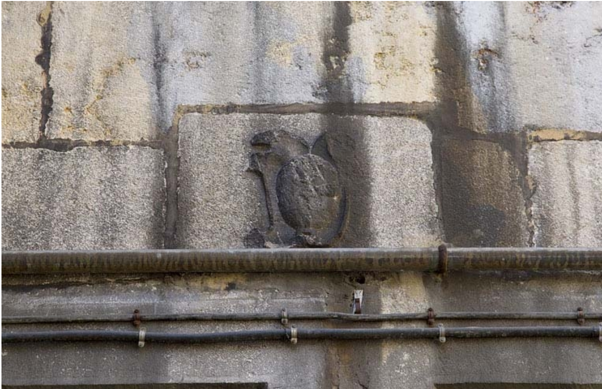
Logis principal, façade postérieure : détail du cartouche situé au-dessus d'une fenêtre. 25, Besançon, 19 rue de Pontarlier, lieudit : îlot des Jacobins