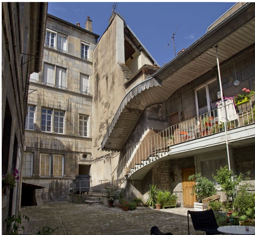
Vue de la façade postérieure du logis principal et de l'escalier extérieur du premier logis secondaire, depuis le fond de la cour. 25, Besançon, 19 rue de Pontarlier, lieudit : îlot des Jacobins