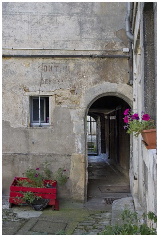
Premier logis secondaire : détail du couloir d'accès à la deuxième cour.

25, Besançon, 19 rue de Pontarlier, lieudit : îlot des Jacobins