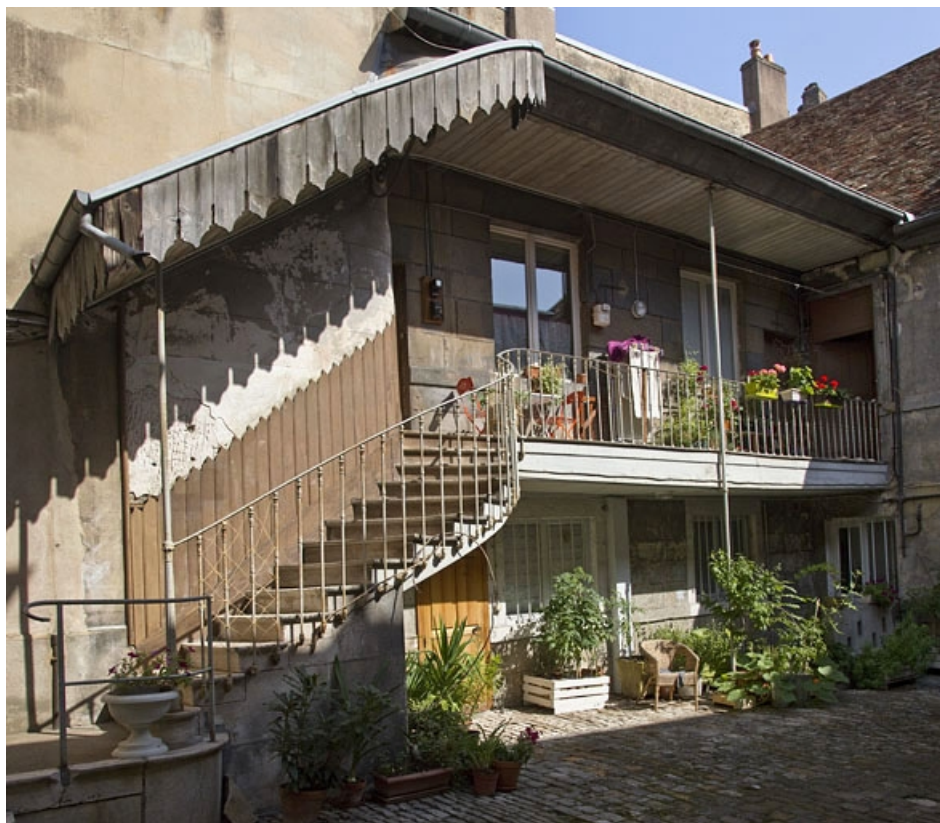
Premier logis secondaire : détail de l'escalier extérieur, de trois quarts gauche. 25, Besançon, 19 rue de Pontarlier, lieudit : îlot des Jacobins