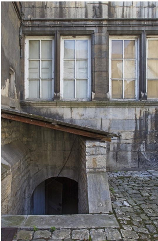
Logis principal, façade postérieure : détail de l'entrée de la cave.

25, Besançon, 19 rue de Pontarlier, lieudit : îlot des Jacobins