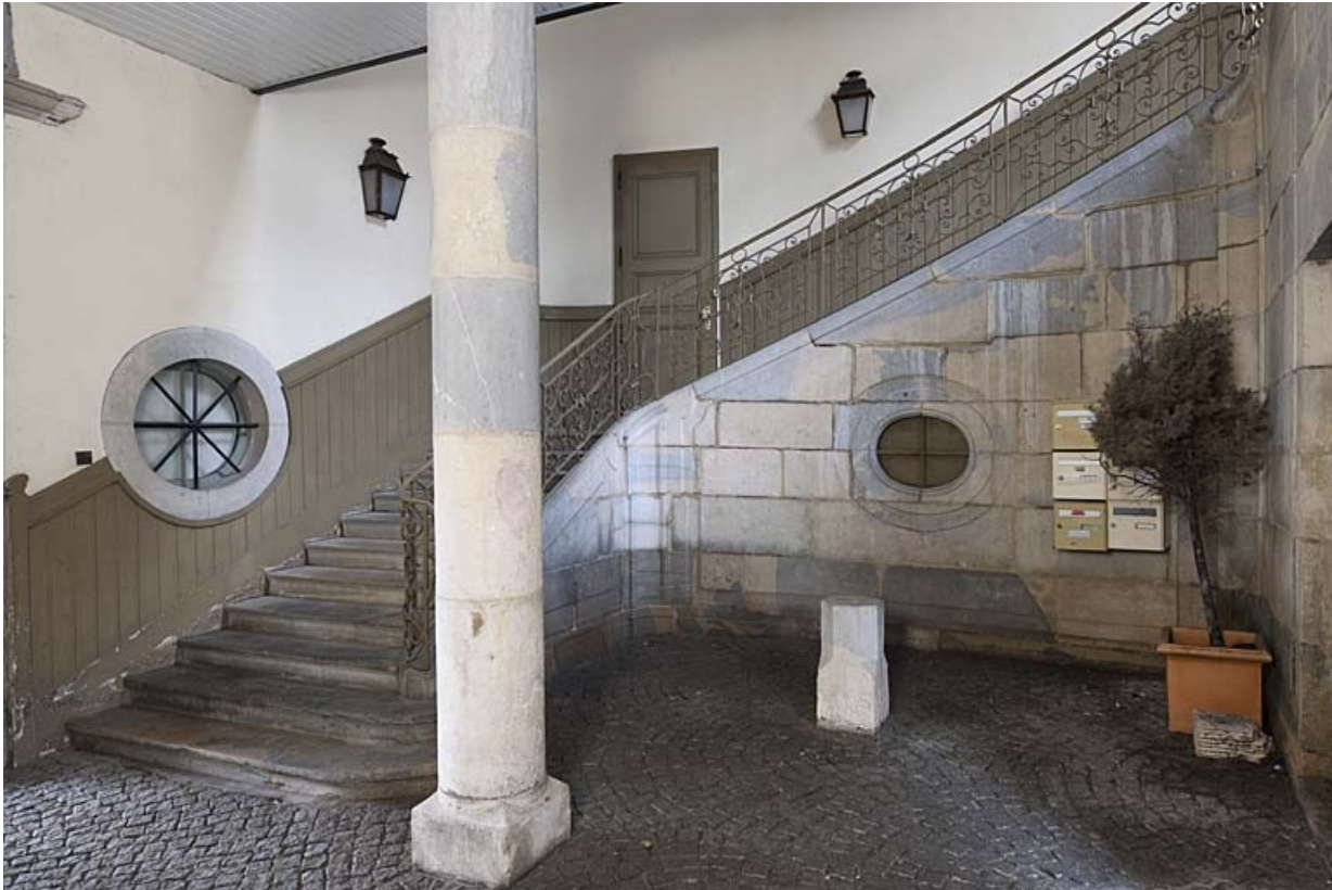
Hôtel : vue d'ensemble de l'escalier d'honneur, de trois quarts droit.

25, Besançon, 9 rue de Pontarlier, lieudit : îlot Sarrail