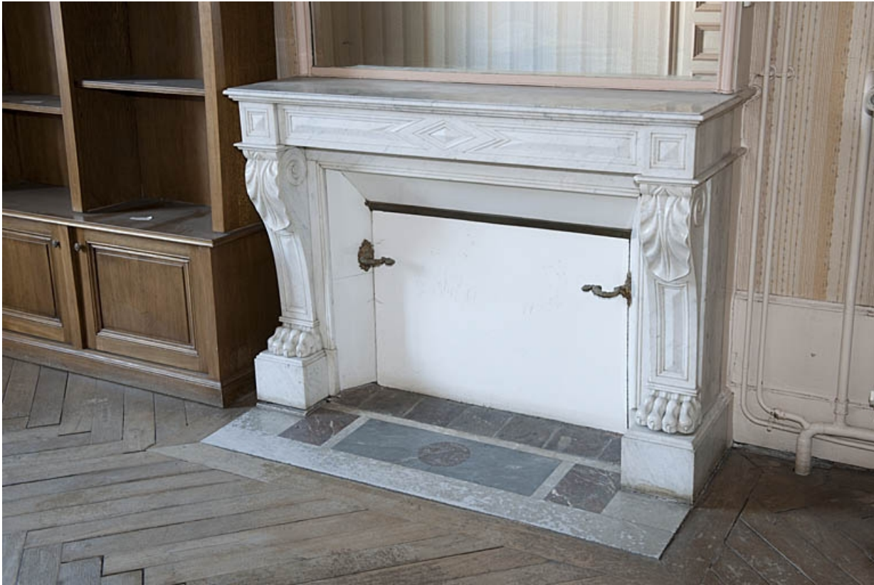
Logis au fond de la deuxième cour : détail d'une cheminée.

25, Besançon, 9 rue de Pontarlier, lieudit : îlot Sarrail