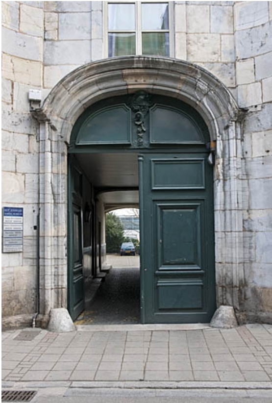
Façade antérieure de l'hôtel : détail du portail.

25, Besançon, 9 rue de Pontarlier, lieudit : îlot Sarrail