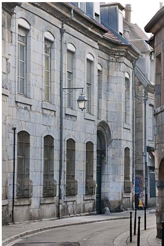
Façade antérieure de l'hôtel depuis la rue : de trois quarts gauche, vue rapprochée.

25, Besançon, 9 rue de Pontarlier, lieudit : îlot Sarrail