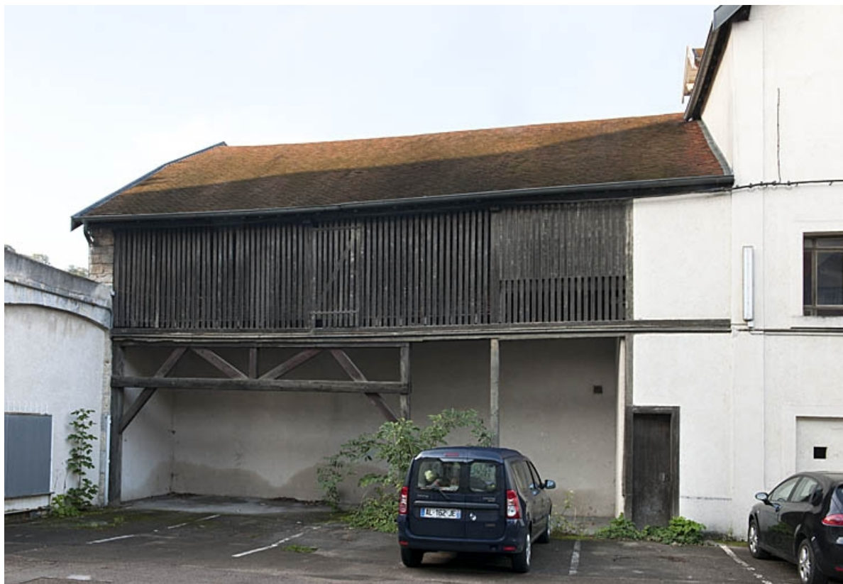
Vue d'ensemble du bûcher situé dans la deuxième cour.

25, Besançon, 9 rue de Pontarlier, lieudit : îlot Sarrail