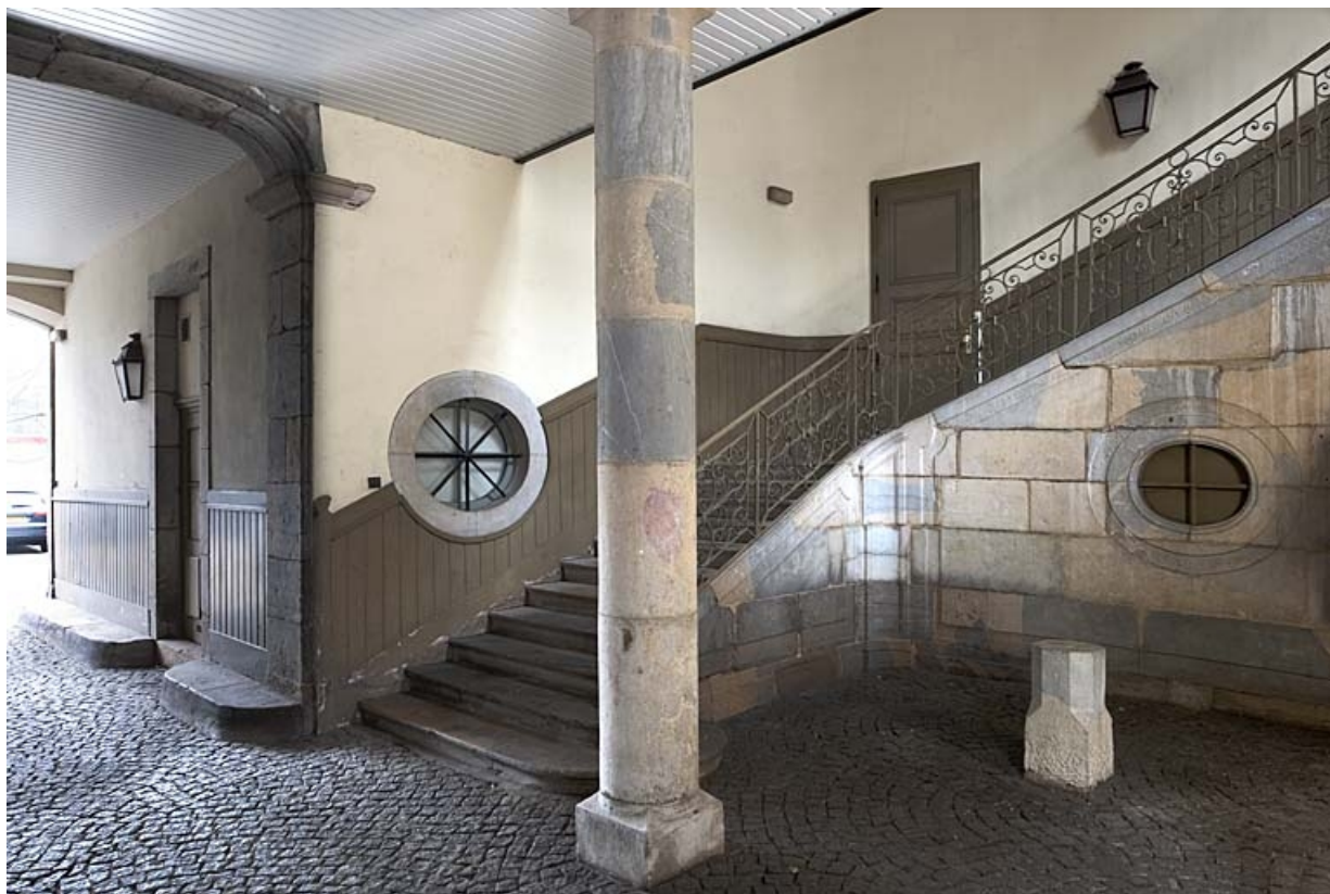
Hôtel : vue d'ensemble de l'escalier d'honneur, de trois quarts droit avec une partie du passage cocher. 25, Besançon, 9 rue de Pontarlier, lieudit : îlot Sarrail