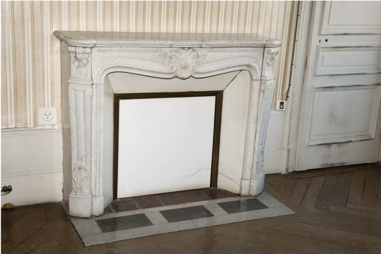
Logis au fond de la deuxième cour : détail d'une cheminée d'une pièce de l'étage.

25, Besançon, 9 rue de Pontarlier, lieudit : îlot Sarrail