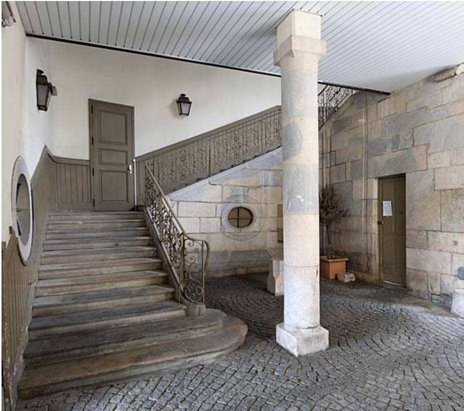
Hôtel : vue d'ensemble de l'escalier d'honneur, de face.

25, Besançon, 9 rue de Pontarlier, lieudit : îlot Sarrail