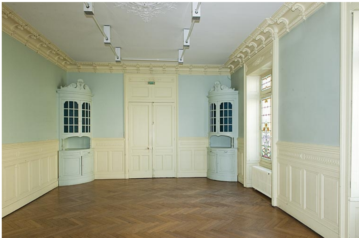
Logis au fond de la deuxième cour : vue d'une pièce du rez-de-chaussée depuis le fond.

25, Besançon, 9 rue de Pontarlier, lieudit : îlot Sarrail