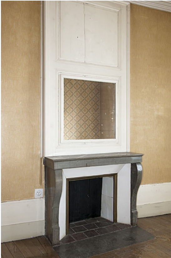
Logis au fond de la deuxième cour : détail d'une cheminée.

25, Besançon, 9 rue de Pontarlier, lieudit : îlot Sarrail