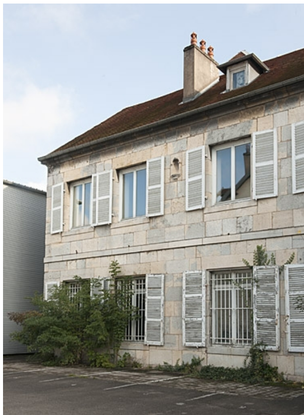
Logis au fond de la deuxième cour : partie gauche. 25, Besançon, 9 rue de Pontarlier, lieudit : îlot Sarrail