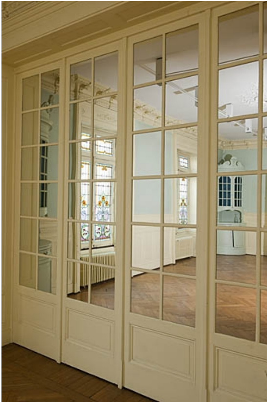
Logis au fond de la deuxième cour : détail des panneaux vitrés au fond de la pièce à gauche de l'entrée. 25, Besançon, 9 rue de Pontarlier, lieudit : îlot Sarrail