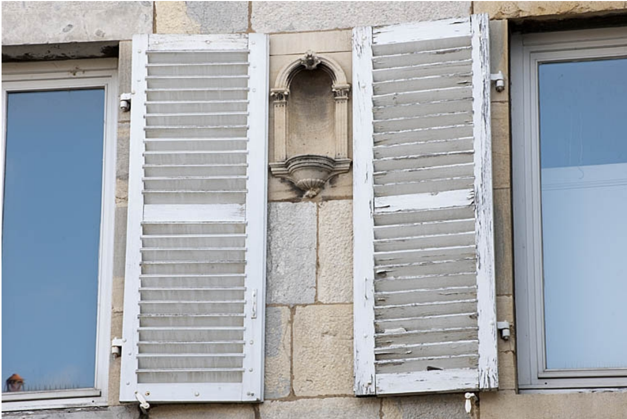
Logis au fond de la deuxième cour : détail de la niche sur la façade antérieure.

25, Besançon, 9 rue de Pontarlier, lieudit : îlot Sarrail