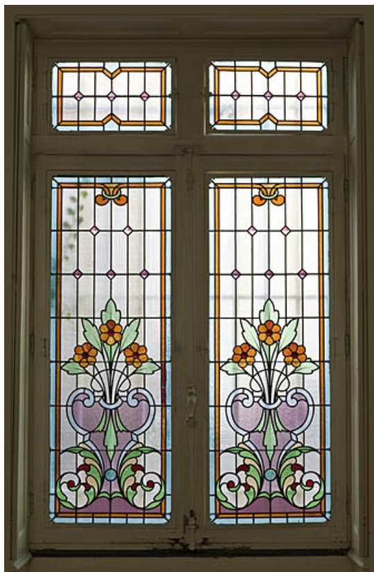
Logis au fond de la deuxième cour : détail d'un vitrail situé dans la pièce à gauche de l'entrée. 25, Besançon, 9 rue de Pontarlier, lieudit : îlot Sarrail