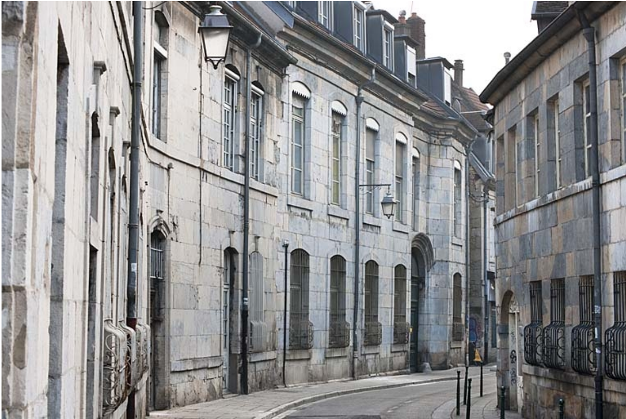
Vue d'ensemble de l'hôtel depuis la rue : de trois quarts gauche.

25, Besançon, 9 rue de Pontarlier, lieudit : îlot Sarrail