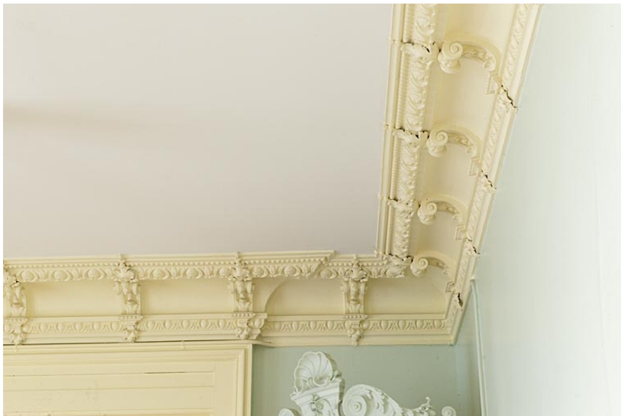
Logis au fond de la deuxième cour, pièce du rez-de-chaussée : détail de la voussure du plafond.

25, Besançon, 9 rue de Pontarlier, lieudit : îlot Sarrail