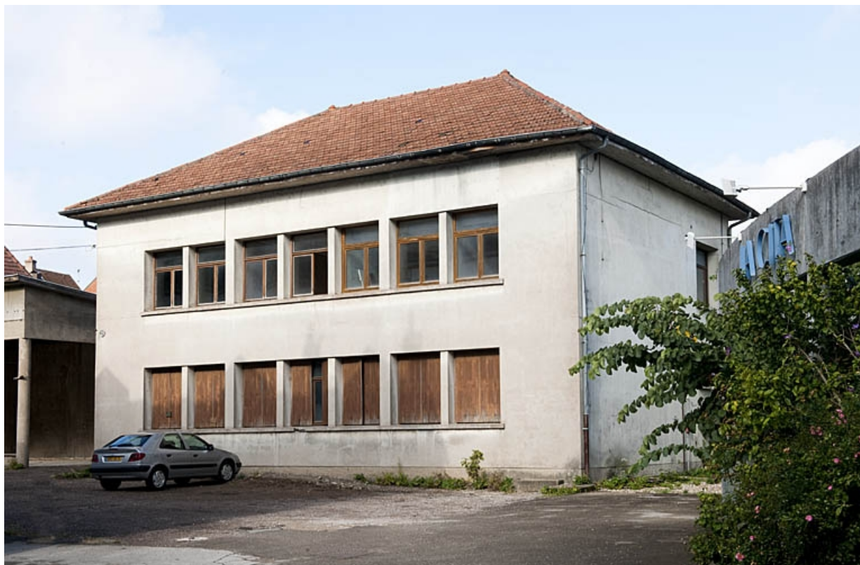
Vue d'ensemble du bâtiment à gauche du logis au fond de la deuxième cour.

25, Besançon, 9 rue de Pontarlier, lieudit : îlot Sarrail