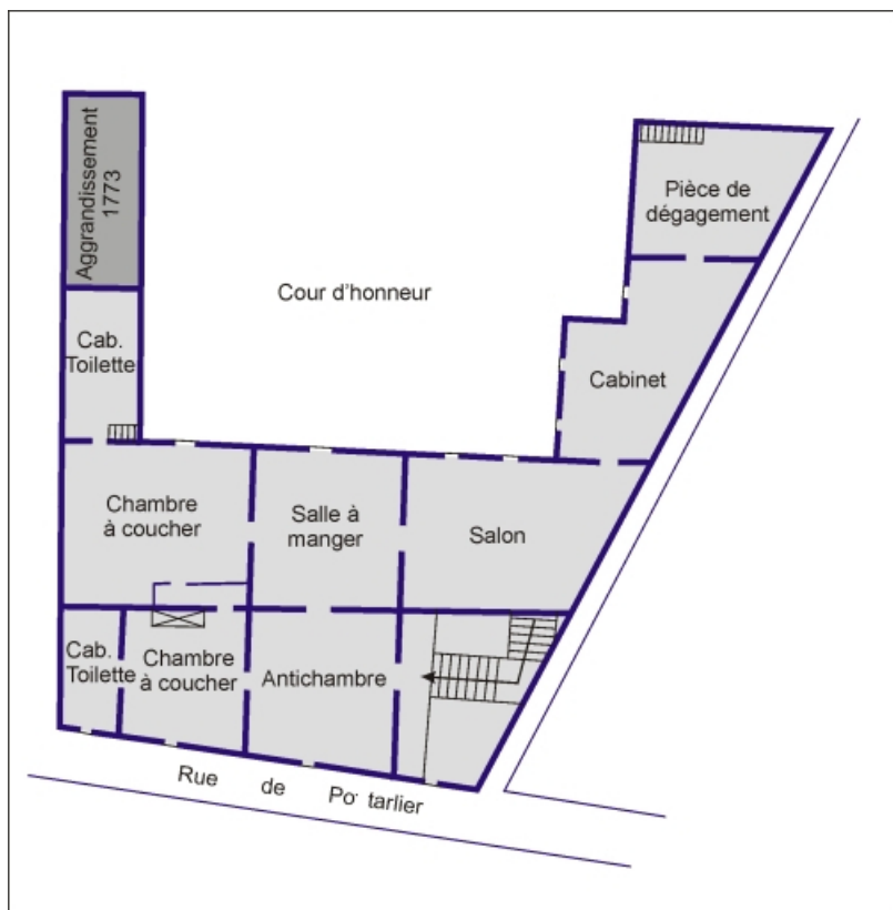
Croquis restituant la distribution intérieure du rez-de-chaussée au 18e siècle. 25, Besançon, 9 rue de Pontarlier, lieudit : îlot Sarrail