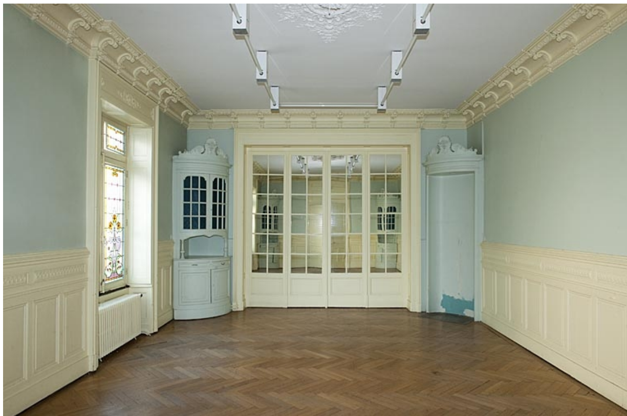
Logis au fond de la deuxième cour : vue d'une pièce du rez-de-chaussée depuis l'entrée.

25, Besançon, 9 rue de Pontarlier, lieudit : îlot Sarrail