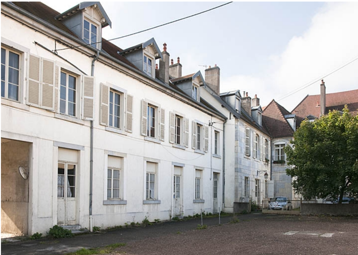
Aile droite : vue d'ensemble de trois quarts gauche.

25, Besançon, 9 rue de Pontarlier, lieudit : îlot Sarrail