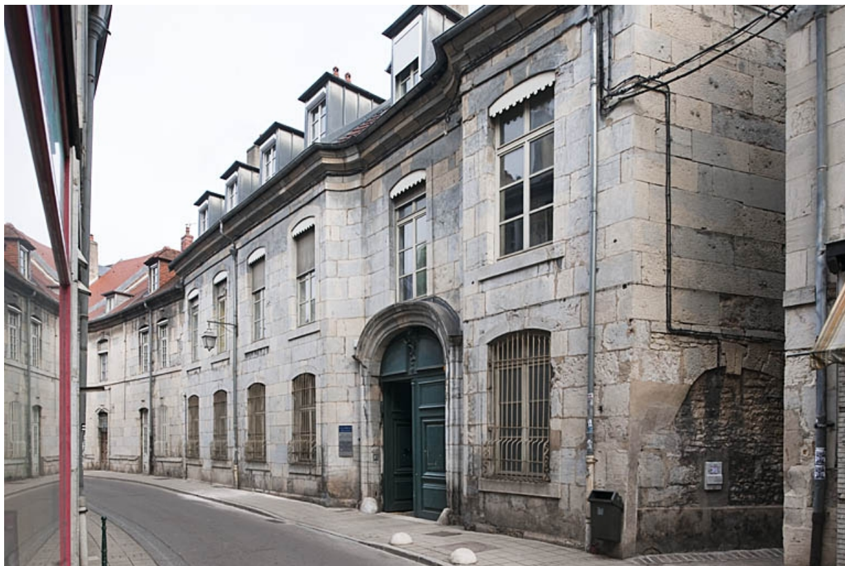
Vue d'ensemble de l'hôtel depuis la rue : de trois quarts droit.

25, Besançon, 9 rue de Pontarlier, lieudit : îlot Sarrail