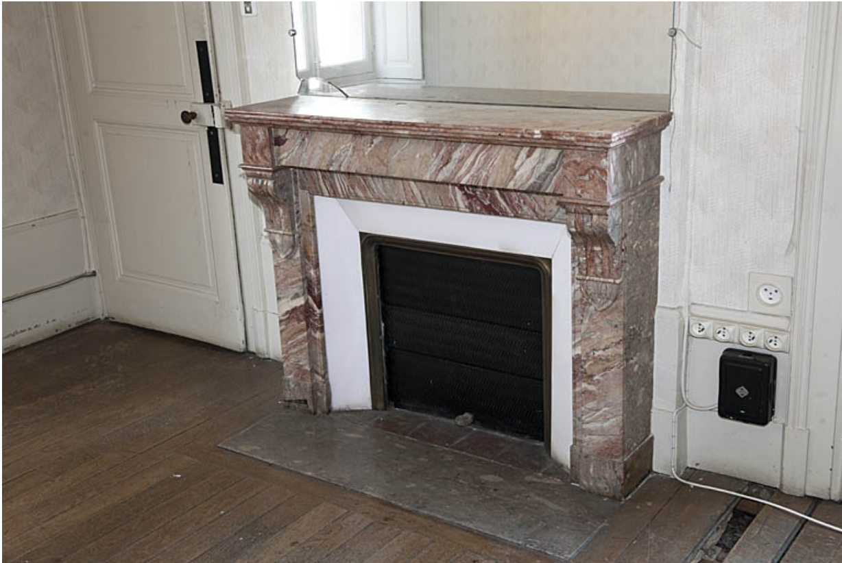
Logis au fond de la deuxième cour : détail d'une cheminée.

25, Besançon, 9 rue de Pontarlier, lieudit : îlot Sarrail