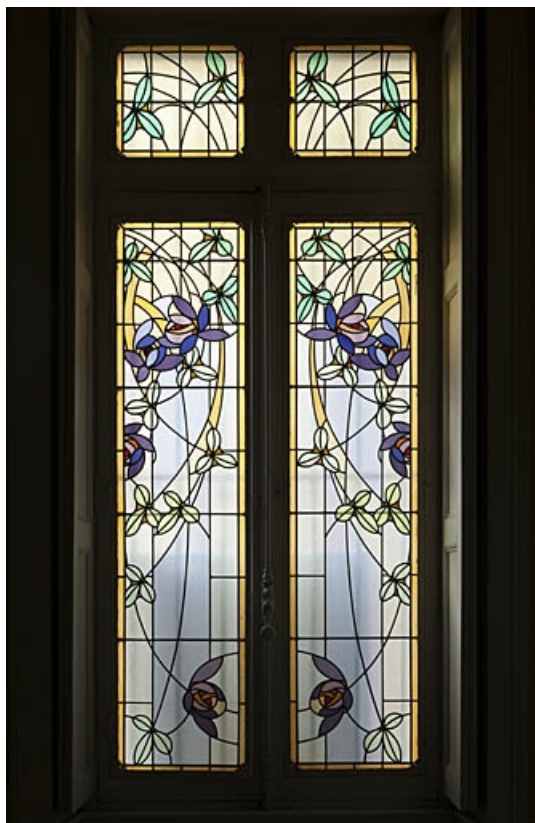
Logis au fond de la deuxième cour : détail d'un vitrail du rez-de-chaussée.

25, Besançon, 9 rue de Pontarlier, lieudit : îlot Sarrail