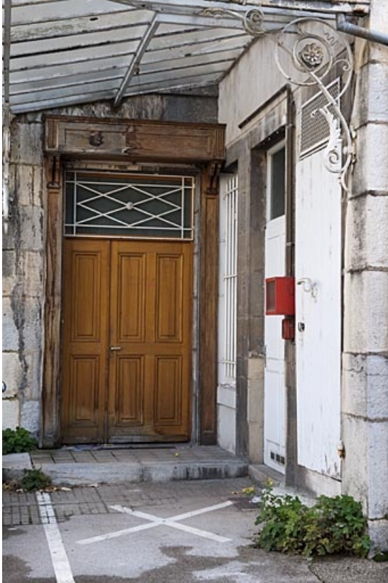
Logis au fond de la deuxième cour : détail de la porte d'entrée.

25, Besançon, 9 rue de Pontarlier, lieudit : îlot Sarrail