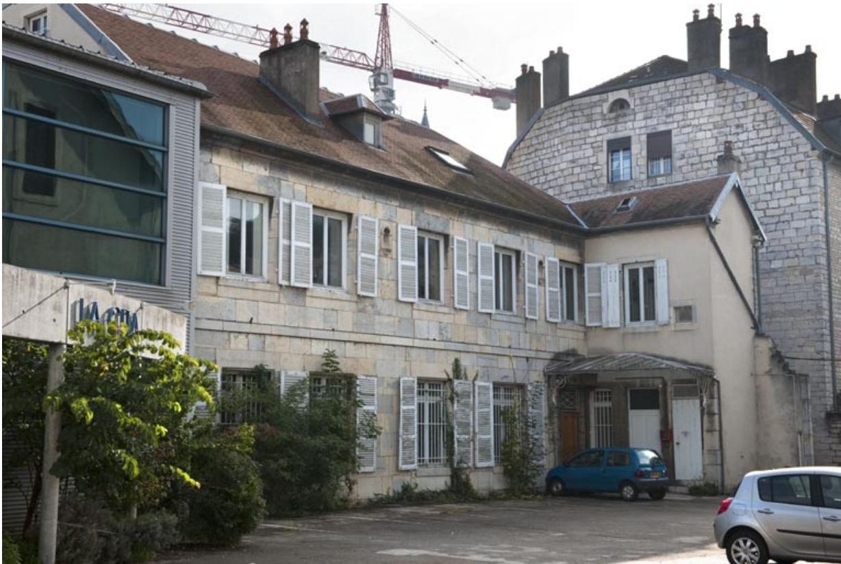
Logis au fond de la deuxième cour : vue d'ensemble de trois quarts gauche. 25, Besançon, 9 rue de Pontarlier, lieudit : îlot Sarrail