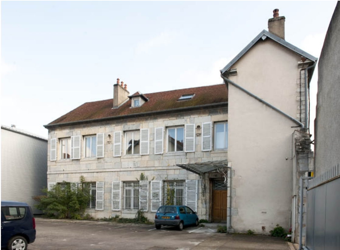
Logis au fond de la deuxième cour : vue d'ensemble de trois quarts droit.

25, Besançon, 9 rue de Pontarlier, lieudit : îlot Sarrail