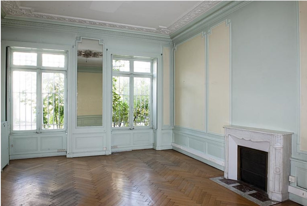
Logis au fond de la deuxième cour : vue d'une pièce de l'étage.

25, Besançon, 9 rue de Pontarlier, lieudit : îlot Sarrail