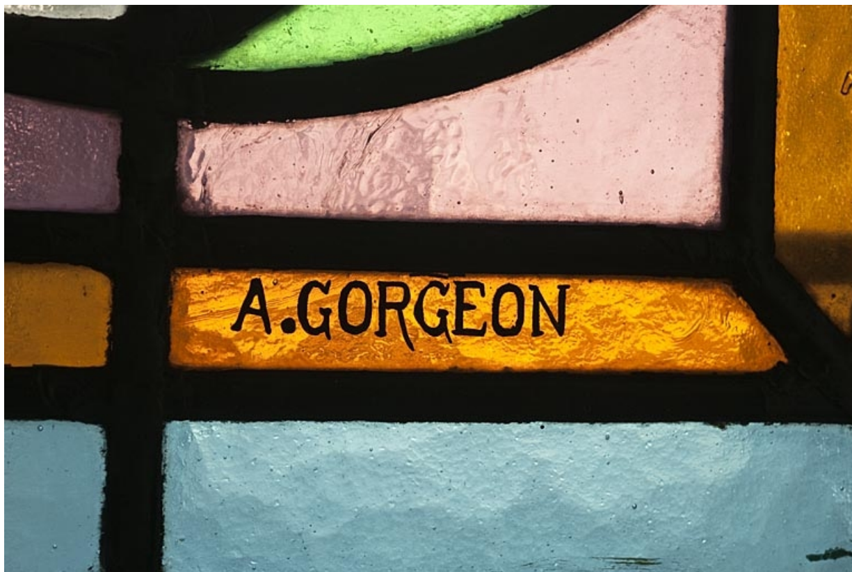
Logis au fond de la deuxième cour, pièce du rez-de-chaussée : détail de la signature du maître verrier A. Gorgeon sur un vitrail. 25, Besançon, 9 rue de Pontarlier, lieudit : îlot Sarrail