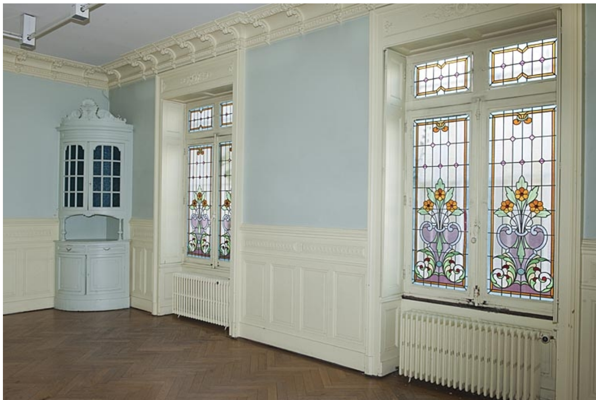
Logis au fond de la deuxième cour, pièce du rez-de-chaussée : détail des fenêtres avec des vitraux.

25, Besançon, 9 rue de Pontarlier, lieudit : îlot Sarrail