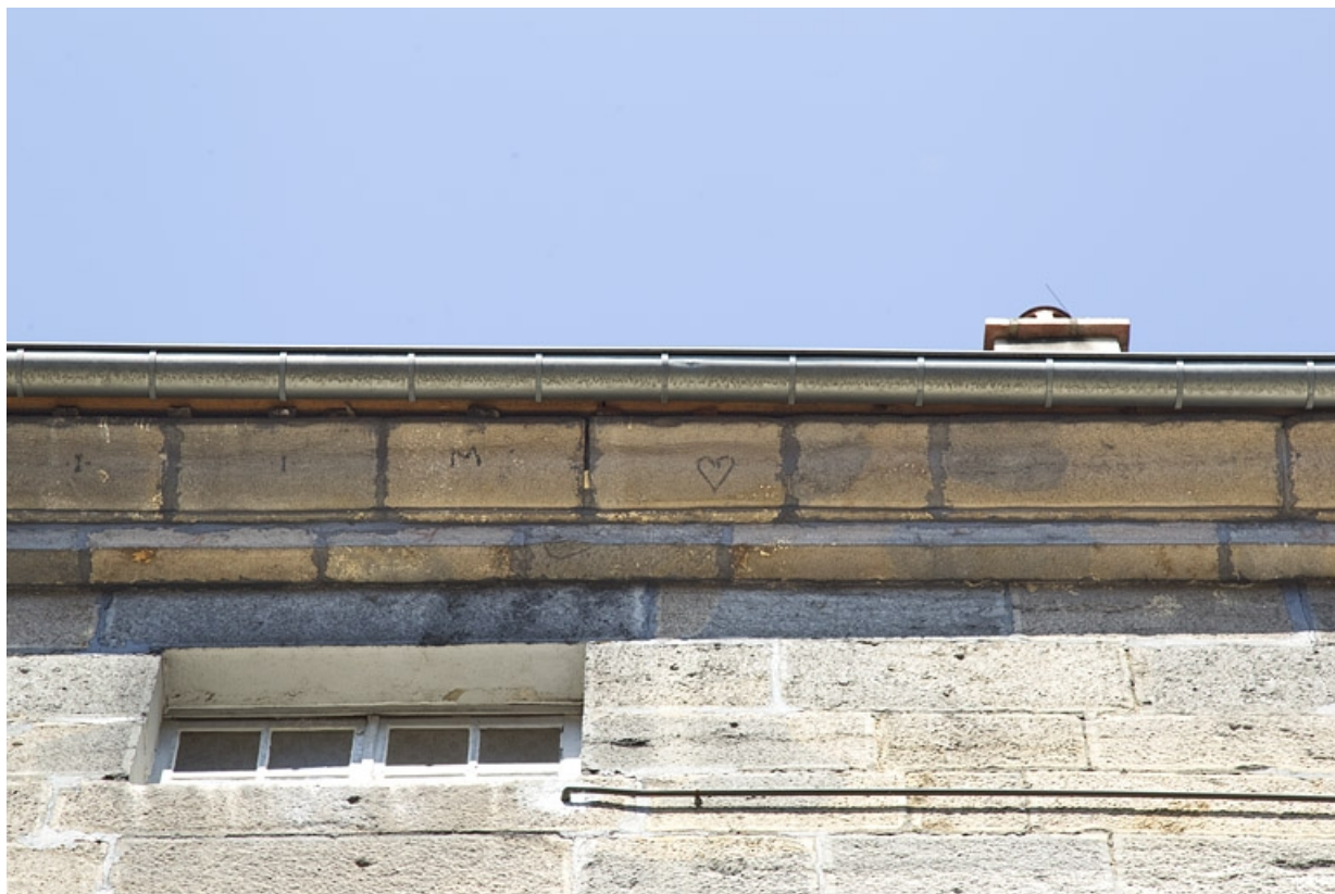
Logis principal, aile en fond de cour : détail des marques de tâcheron sur la corniche du toit.

25, Besançon, 28 rue de la Préfecture, lieudit : îlot Mairie