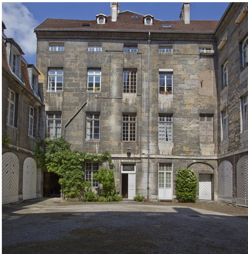
Logis principal, façade au fond de la cour : de face.

25, Besançon, 28 rue de la Préfecture, lieudit : îlot Mairie