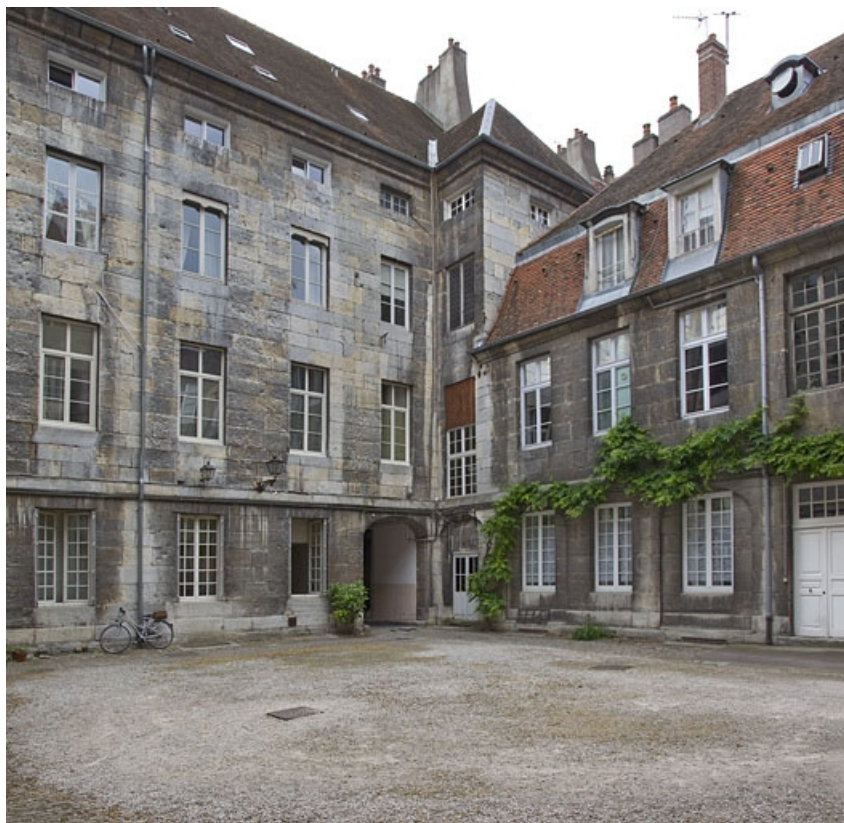
Vue du logis et des communs depuis le fond de la cour : de trois quarts gauche. 25, Besançon, 28 rue de la Préfecture, lieudit : îlot Mairie