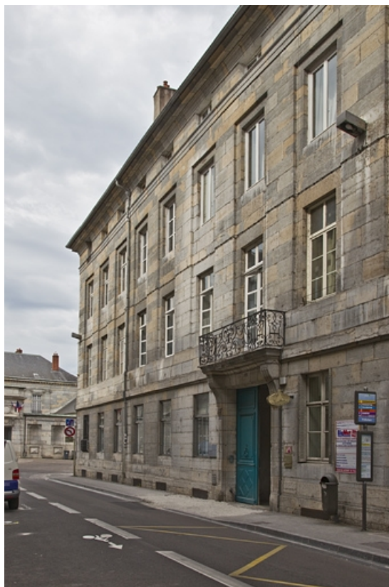
Logis principal : façade sur rue, de trois quarts droit. 25, Besançon, 28 rue de la Préfecture, lieudit : îlot Mairie