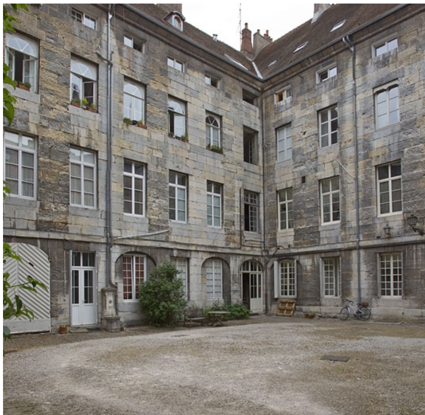
Vue du logis principal depuis le fond de la cour : de trois quarts droit.

25, Besançon, 28 rue de la Préfecture, lieudit : îlot Mairie