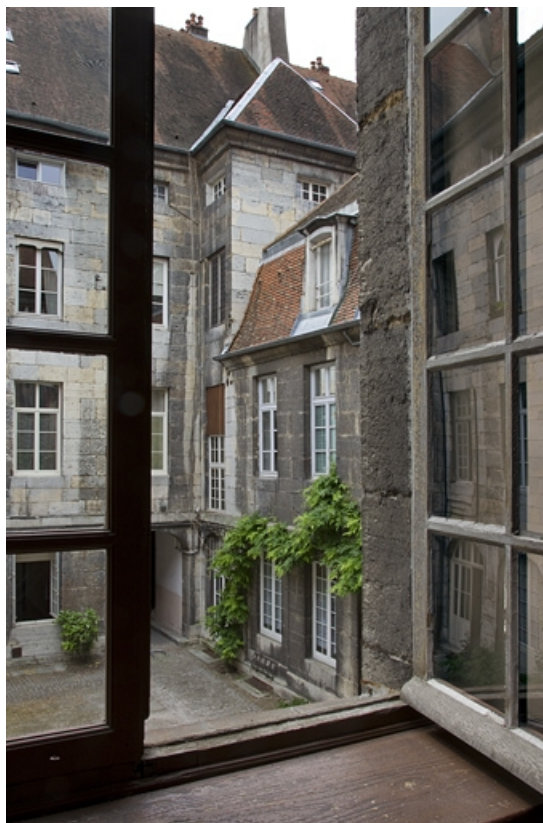
Vue des communs depuis une fenêtre de l'aile en fond de cour.

25, Besançon, 28 rue de la Préfecture, lieudit : îlot Mairie