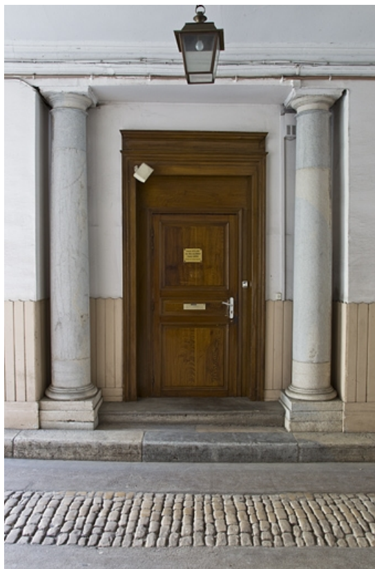
Détail d'une porte donnant sur le passage cocher, de face.

25, Besançon, 28 rue de la Préfecture, lieudit : îlot Mairie