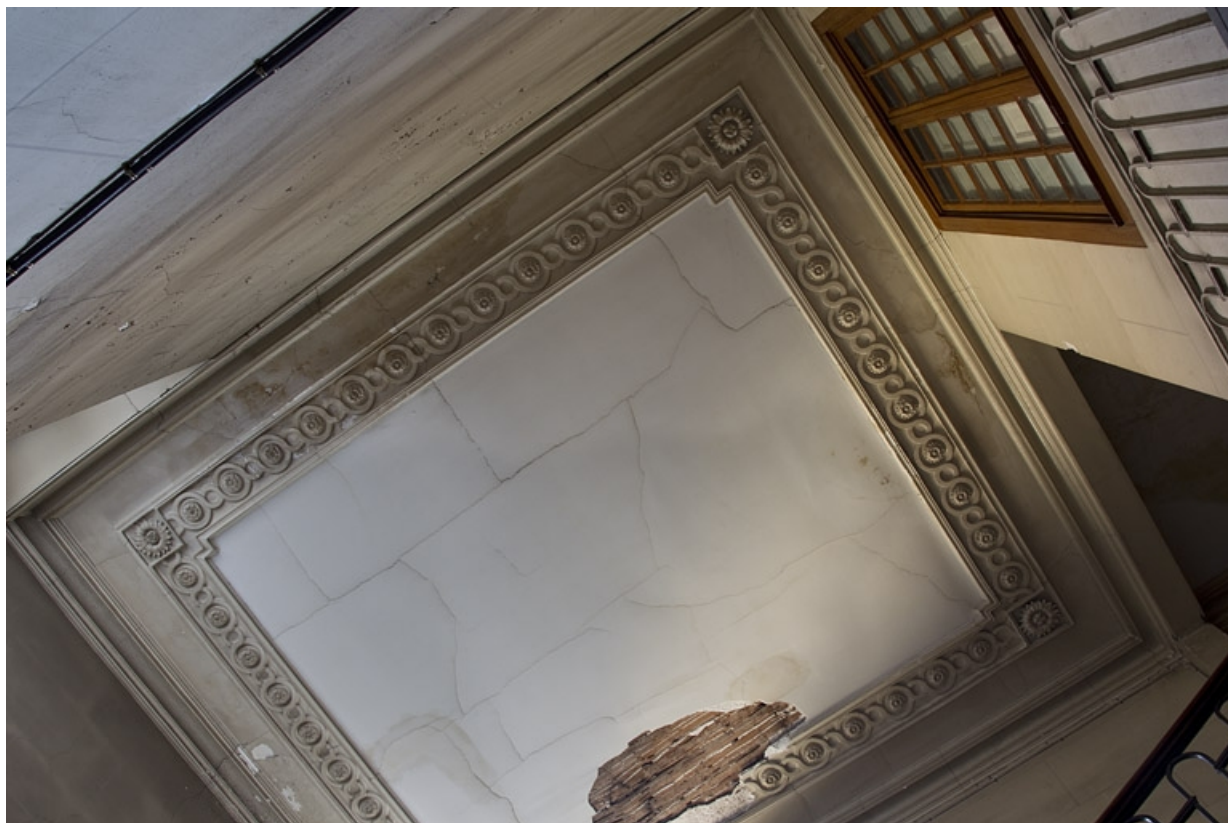
Logis principal, intérieur : détail du plafond de la cage de l'escalier principal. 25, Besançon, 28 rue de la Préfecture, lieudit : îlot Mairie