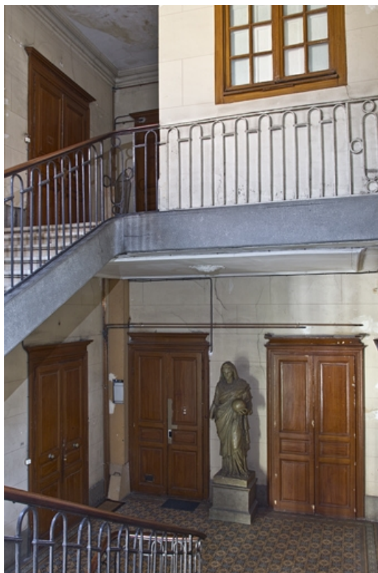
Logis principal, intérieur : détail de la cage de l'escalier principal, vue en plongée. 25, Besançon, 28 rue de la Préfecture, lieudit : îlot Mairie