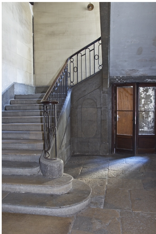
Logis principal, intérieur : détail du départ de l'escalier principal.

25, Besançon, 28 rue de la Préfecture, lieudit : îlot Mairie