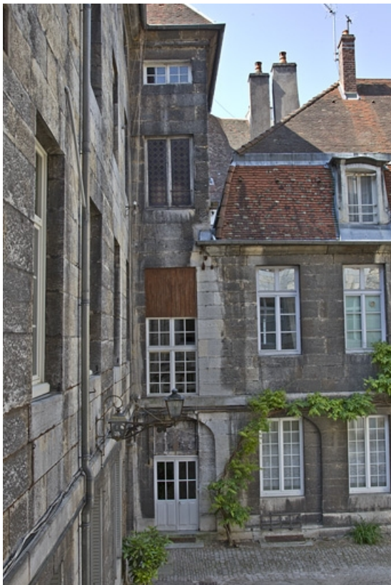
Logis principal, aile gauche sur cour contenant une partie de l'escalier dans oeuvre. 25, Besançon, 28 rue de la Préfecture, lieudit : îlot Mairie