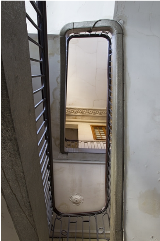
Logis principal, intérieur : détail de l'escalier principal, vue en contre-plongée. 25, Besançon, 28 rue de la Préfecture, lieudit : îlot Mairie