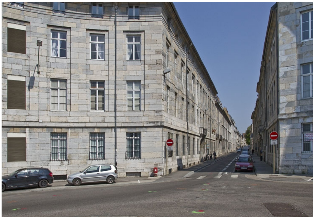
Logis principal : façade sur rue, de trois quarts gauche.

25, Besançon, 28 rue de la Préfecture, lieudit : îlot Mairie