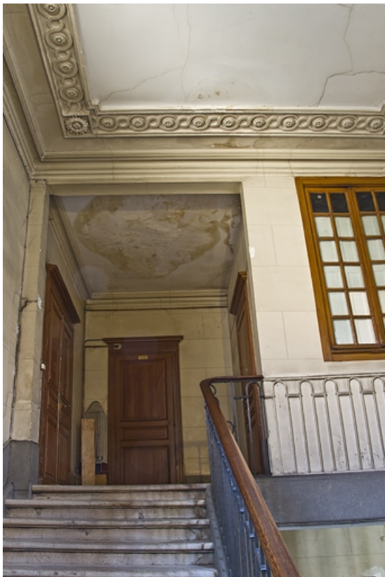
Logis principal, intérieur : détail de la cage de l'escalier principal, partie supérieure.

25, Besançon, 28 rue de la Préfecture, lieudit : îlot Mairie