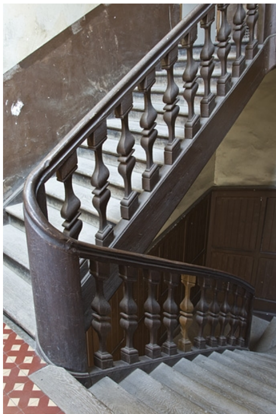
Logis principal, aile droite : détail de l'escalier secondaire.

25, Besançon, 28 rue de la Préfecture, lieudit : îlot Mairie