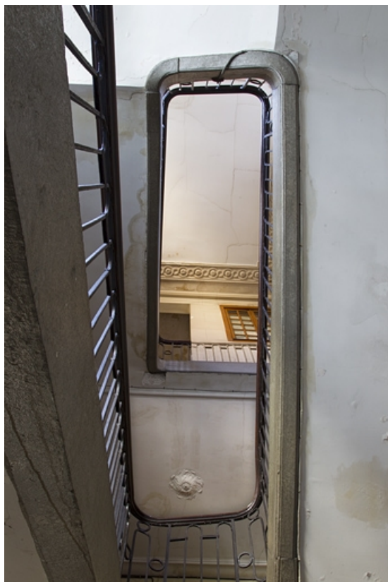
Logis principal, intérieur : détail de l'escalier principal, vue en contre-plongée. 25, Besançon, 28 rue de la Préfecture, lieudit : îlot Mairie