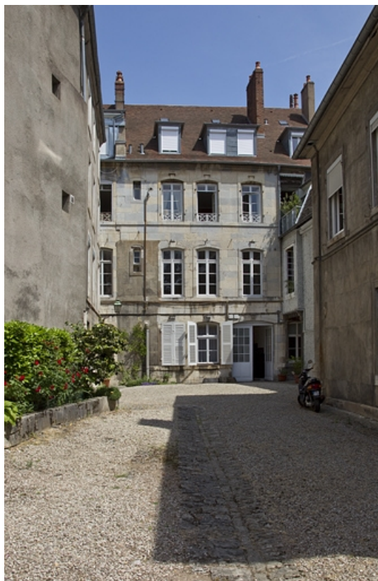
Logis principal, façade postérieure : vue éloignée. 25, Besançon, 14 rue Mégevand, lieudit : îlot Mairie