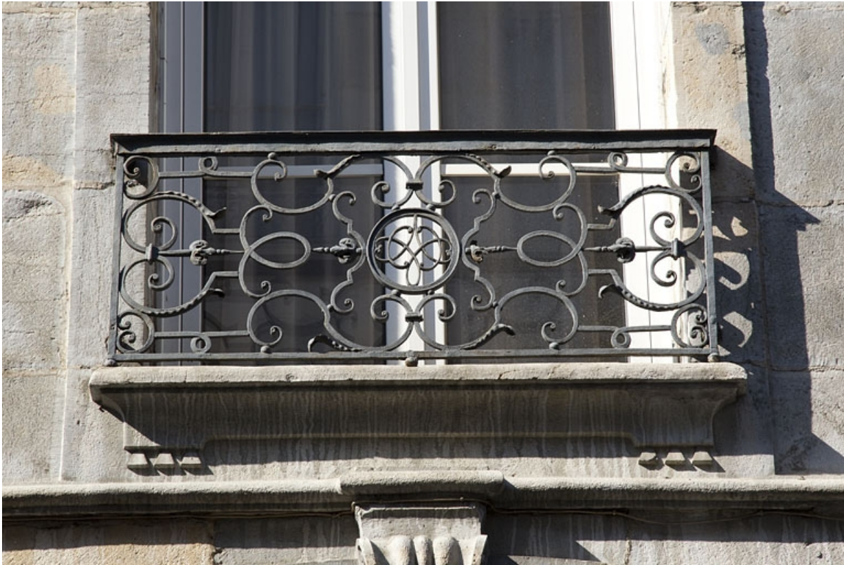
Logis principal, façade sur rue : détail d'un garde-corps en ferronnerie.

25, Besançon, 14 rue Mégevand, lieudit : îlot Mairie