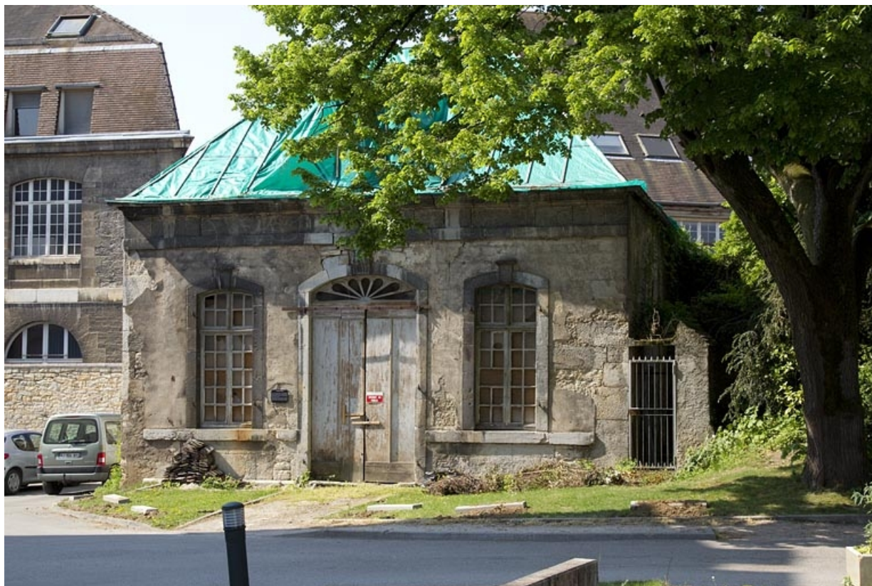
Pavillon de jardin : vue de la façade antérieure. 25, Besançon, 14 rue Mégevand, lieudit : îlot Mairie