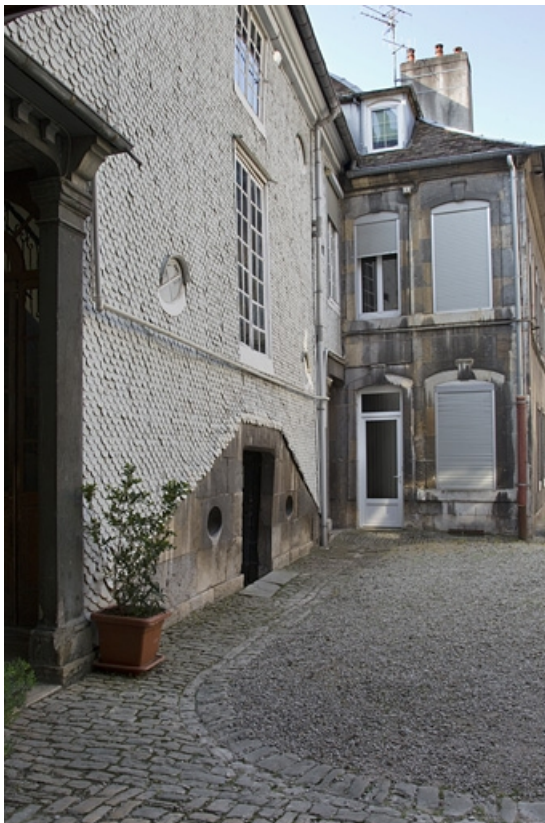
Vue de l'escalier à cage fermée et du premier logis secondaire, de trois quarts droit. 25, Besançon, 14 rue Mégevand, lieudit : îlot Mairie