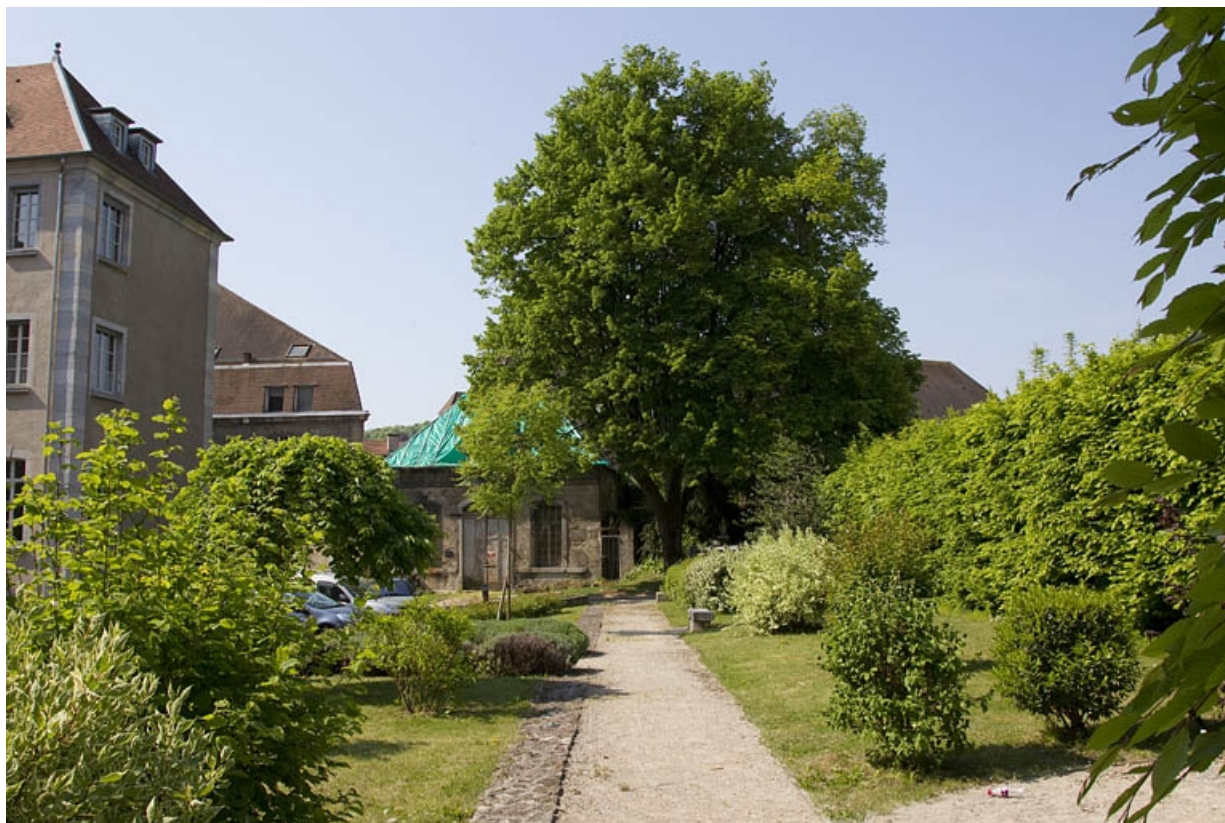
Pavillon de jardin : vue éloignée depuis l'allée du jardin.

25, Besançon, 14 rue Mégevand, lieudit : îlot Mairie