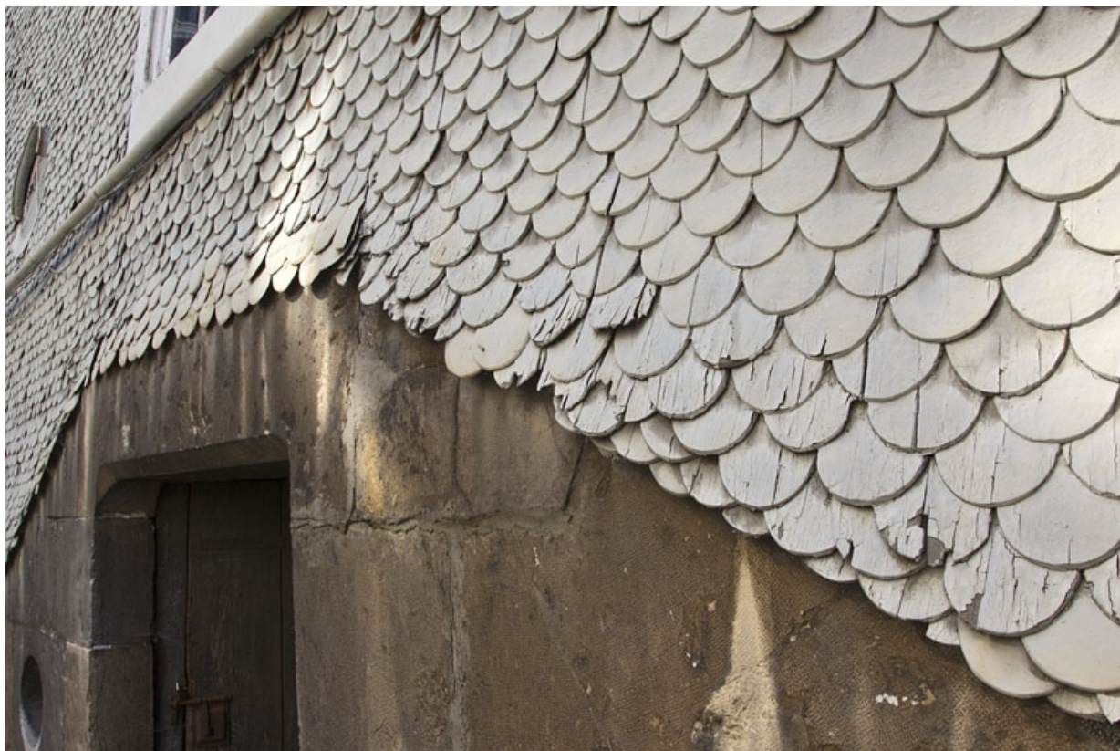
Détail des tavaillons recouvrant l'extérieur de la cage d'escalier.

25, Besançon, 14 rue Mégevand, lieudit : îlot Mairie