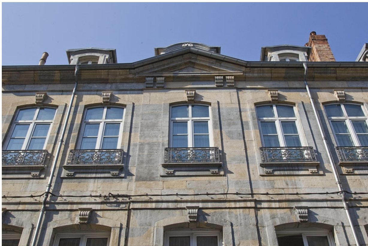
Logis principal, façade sur rue : vue de la partie supérieure, de face.

25, Besançon, 14 rue Mégevand, lieudit : îlot Mairie