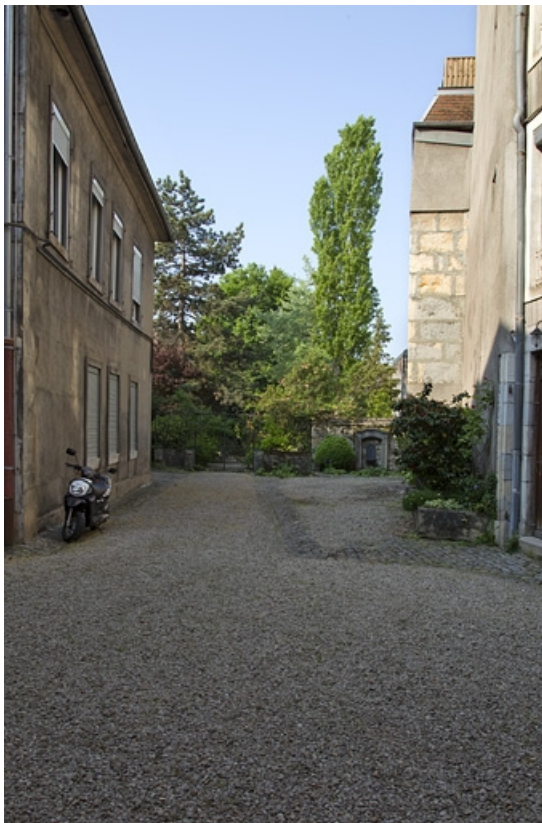
Vue d'ensemble de la cour en direction du jardin.

25, Besançon, 14 rue Mégevand, lieudit : îlot Mairie