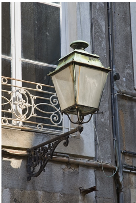
Détail d'un bec de gaz situé dans la cour.

25, Besançon, 14 rue Mégevand, lieudit : îlot Mairie