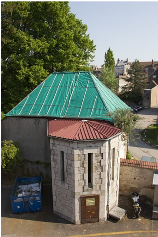
Pavillon de jardin : vue de la façade postérieure. 25, Besançon, 14 rue Mégevand, lieudit : îlot Mairie