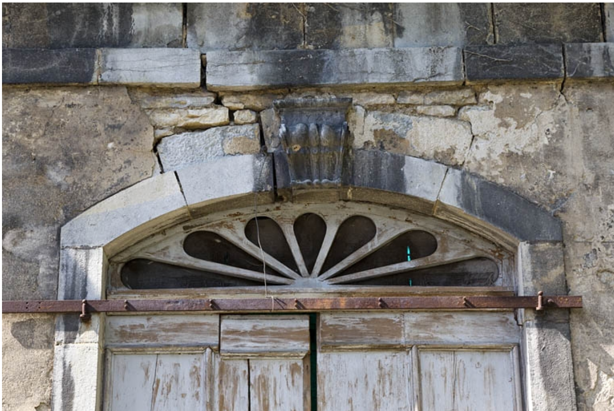
Pavillon de jardin : détail de l'arc de la porte.

25, Besançon, 14 rue Mégevand, lieudit : îlot Mairie