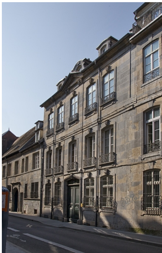
Logis principal, façade sur rue : de trois quarts droit, vue rapprochée.

25, Besançon, 14 rue Mégevand, lieudit : îlot Mairie