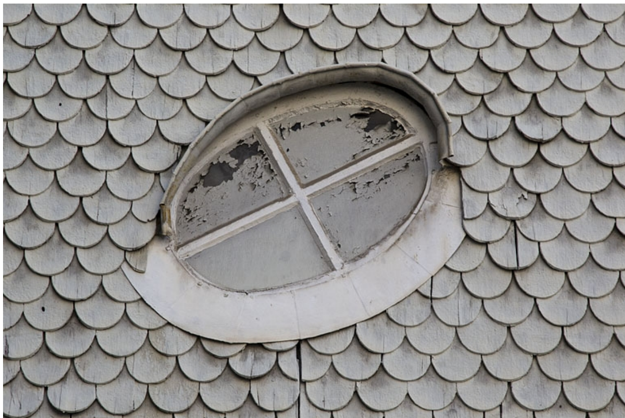
Escalier à cage fermée : détail d'un oeil de boeuf, vu de l'extérieur.

25, Besançon, 14 rue Mégevand, lieudit : îlot Mairie