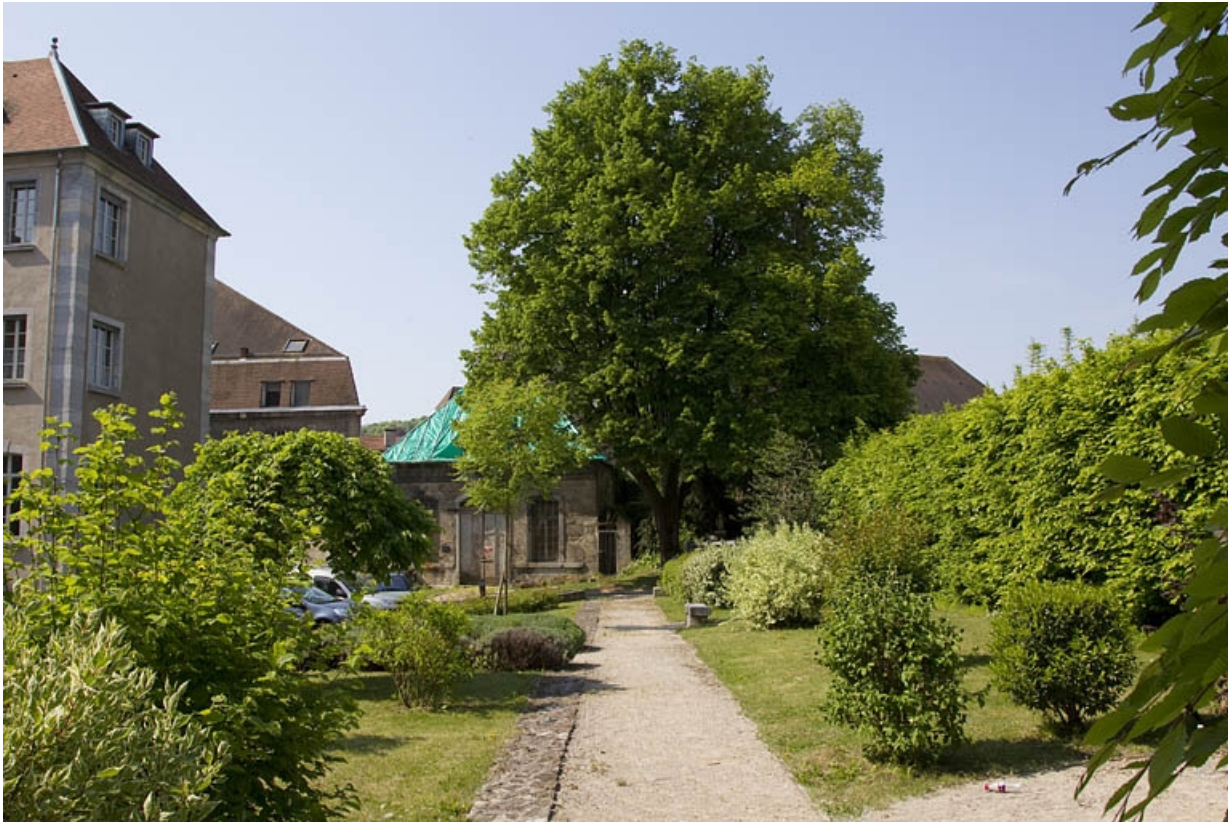
Pavillon de jardin : vue éloignée depuis l'allée du jardin.

25, Besançon, 14 rue Mégevand, lieudit : îlot Mairie