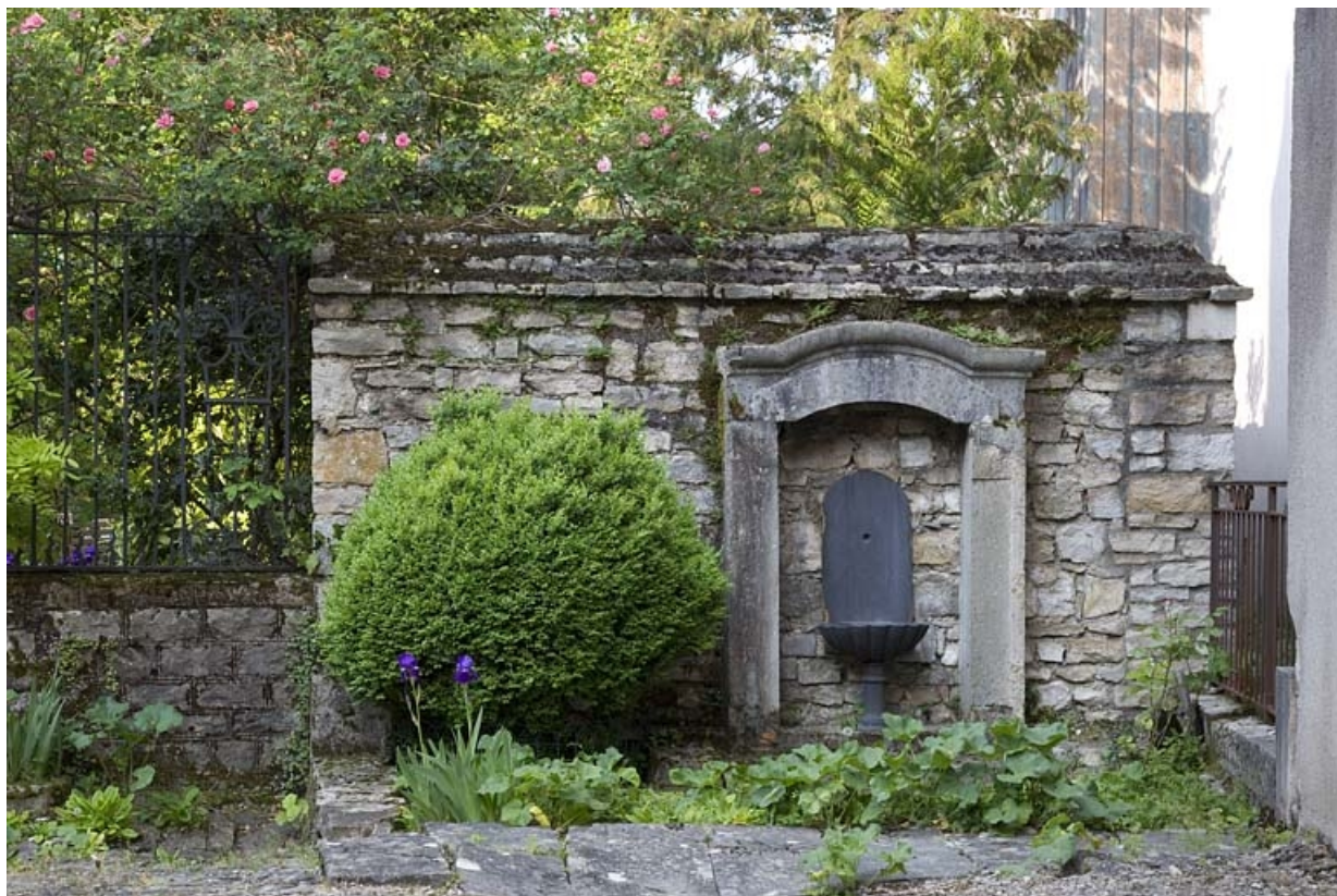
Vue de la borne-fontaine située contre le mur du jardin.

25, Besançon, 14 rue Mégevand, lieudit : îlot Mairie