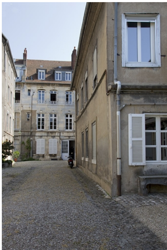
Vue d'ensemble des bâtiments depuis le fond de la cour.

25, Besançon, 14 rue Mégevand, lieudit : îlot Mairie