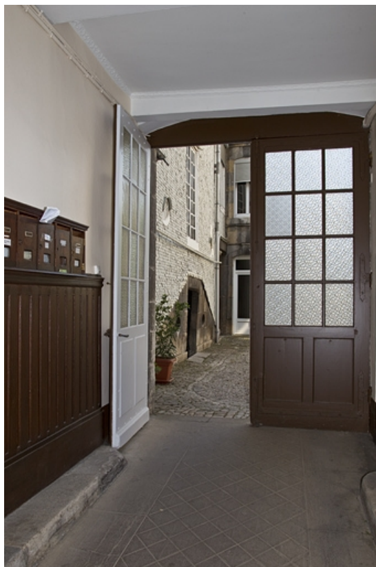
Vue du passage cocher en direction de la cour. 25, Besançon, 14 rue Mégevand, lieudit : îlot Mairie