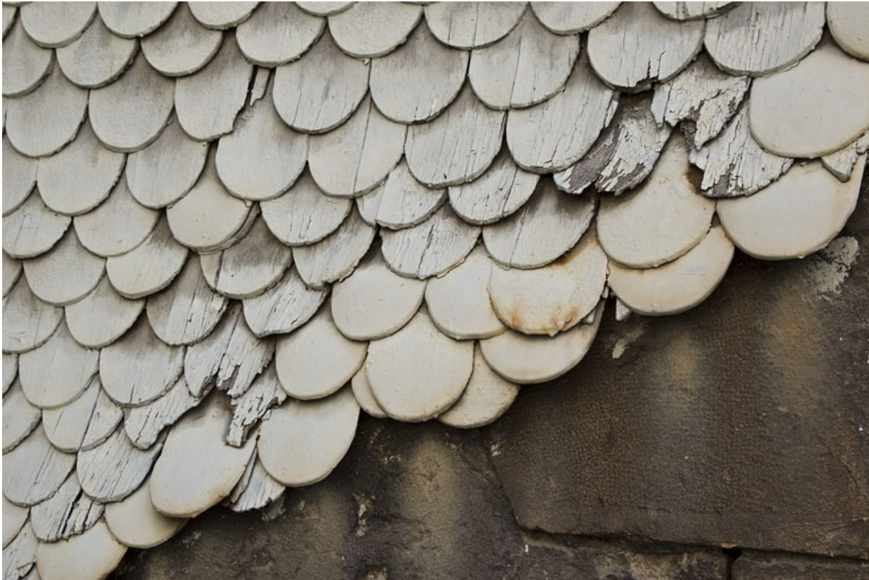
Détail des tavaillons recouvrant l'extérieur de la cage d'escalier : vue rapprochée.

25, Besançon, 14 rue Mégevand, lieudit : îlot Mairie