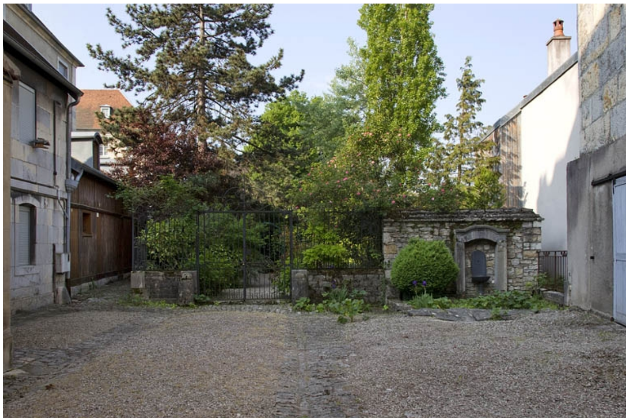
Vue de l'entrée du jardin depuis la cour.

25, Besançon, 14 rue Mégevand, lieudit : îlot Mairie