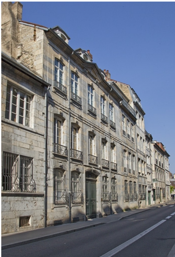
Logis principal, façade sur rue : de trois quarts gauche. 25, Besançon, 14 rue Mégevand, lieudit : îlot Mairie