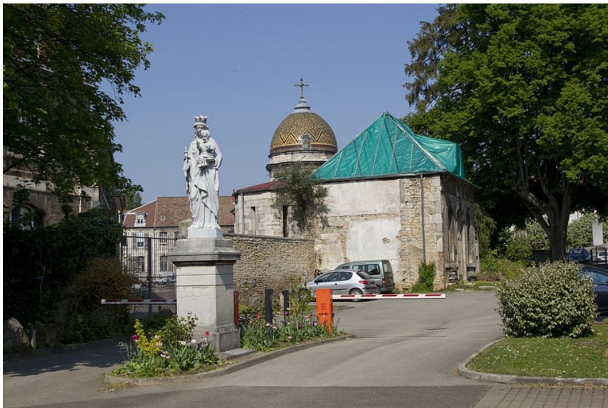
Pavillon de jardin : vue éloignée de trois quarts gauche.

25, Besançon, 14 rue Mégevand, lieudit : îlot Mairie