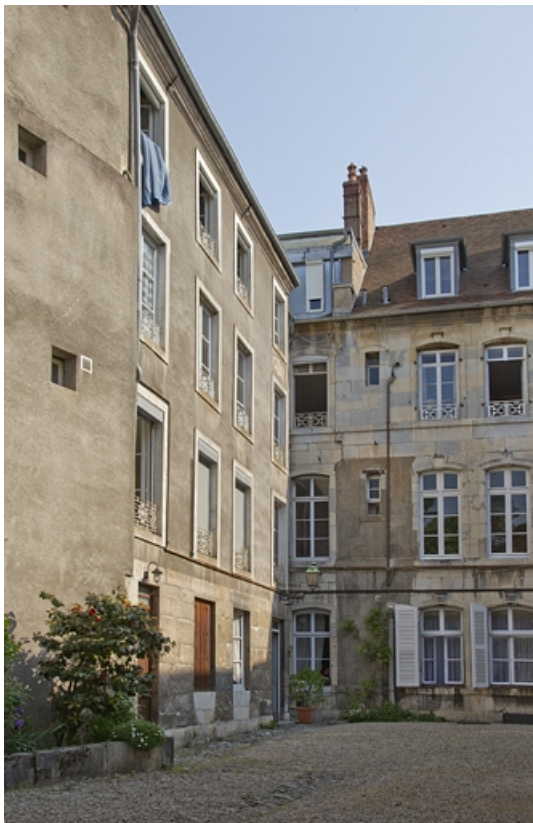
Troisième logis secondaire, à droite de la cour : de trois quarts gauche. 25, Besançon, 14 rue Mégevand, lieudit : îlot Mairie