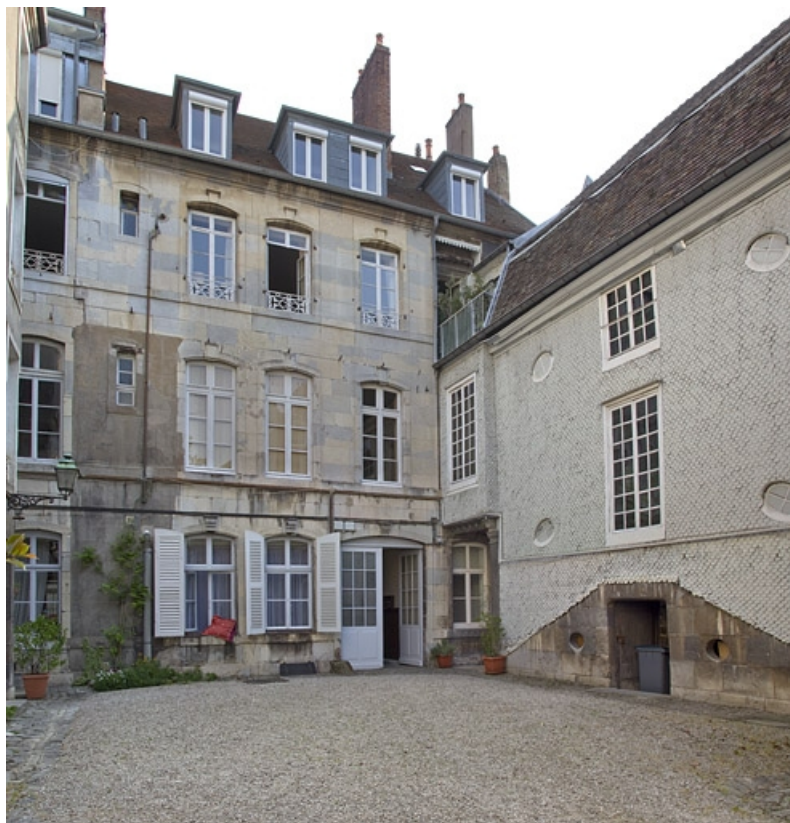
Logis principal et escalier, façades sur rue : de trois quarts gauche.

25, Besançon, 14 rue Mégevand, lieudit : îlot Mairie