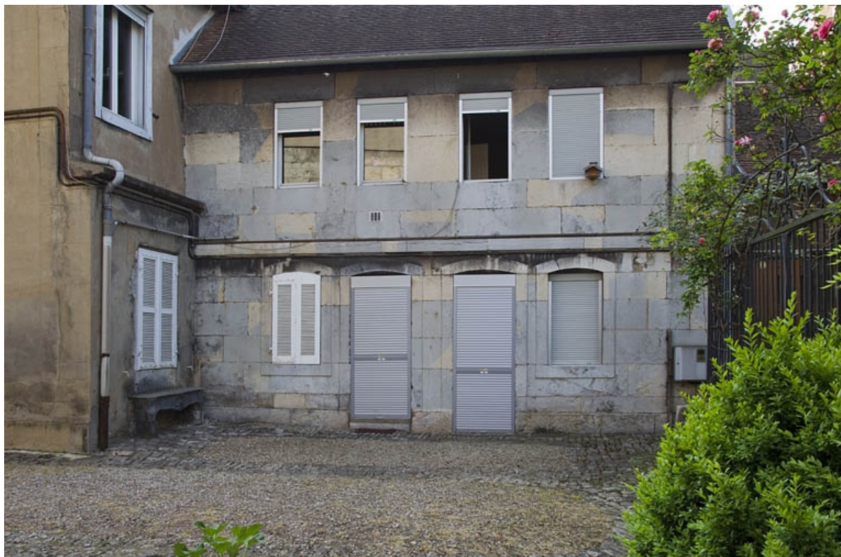
Vue du quatrième logis secondaire, au fond et à gauche de la cour : de face.

25, Besançon, 14 rue Mégevand, lieudit : îlot Mairie