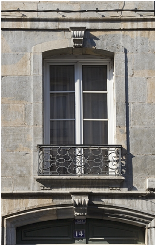
Logis principal, façade sur rue : vue d'une fenêtre et de son garde-corps en ferronnerie. 25, Besançon, 14 rue Mégevand, lieudit : îlot Mairie