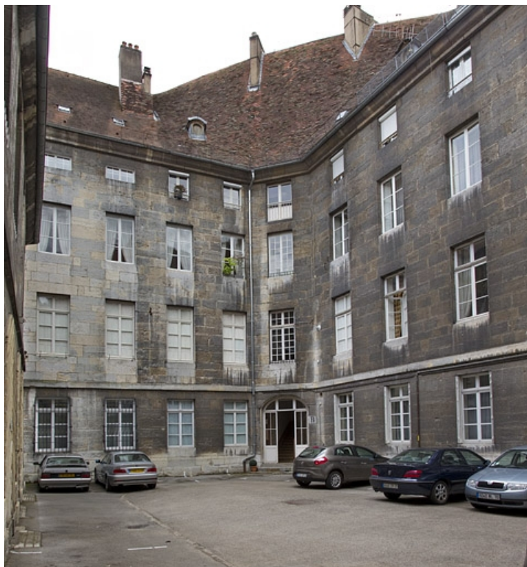
Logis principal : vue d'une partie des façades sur cour.

25, Besançon, 5 rue Charles Nodier, lieudit : îlot Mairie