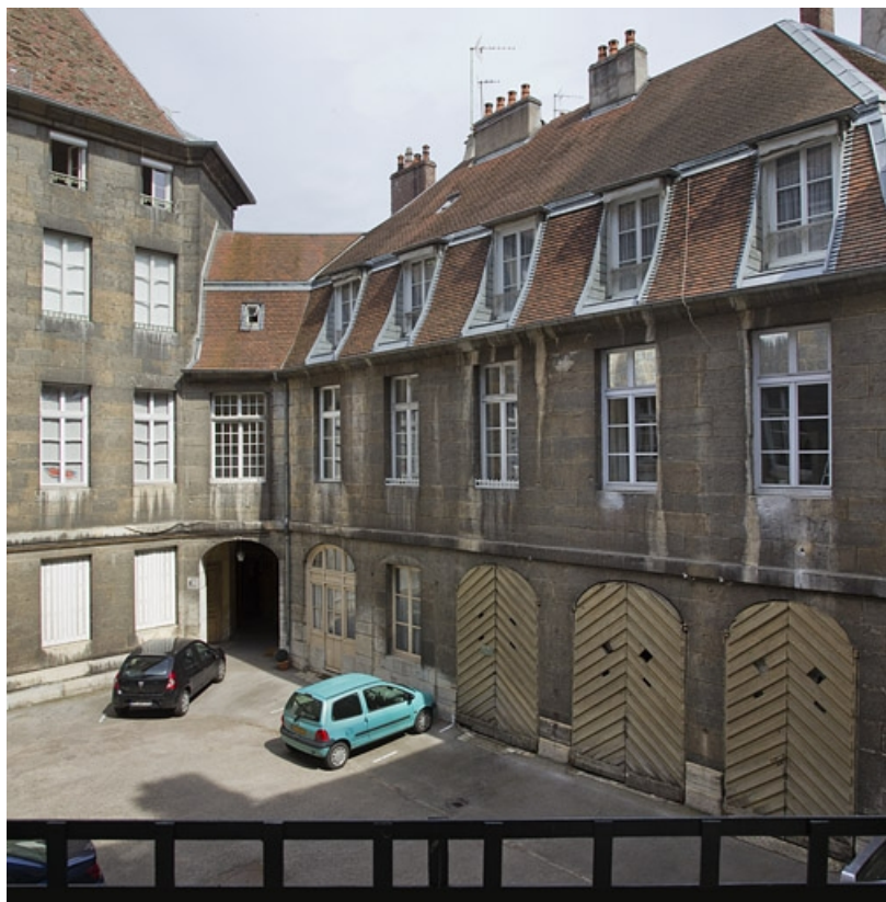
Bâtiment des remises : vue d'ensemble de trois quarts droit.

25, Besançon, 5 rue Charles Nodier, lieudit : îlot Mairie