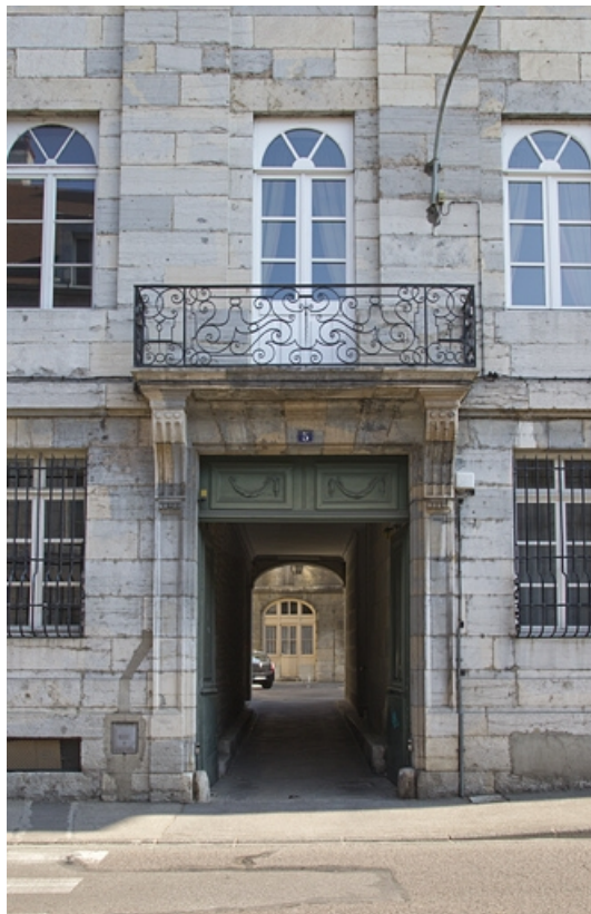
Logis principal : détail du portail d'entrée.

25, Besançon, 5 rue Charles Nodier, lieudit : îlot Mairie