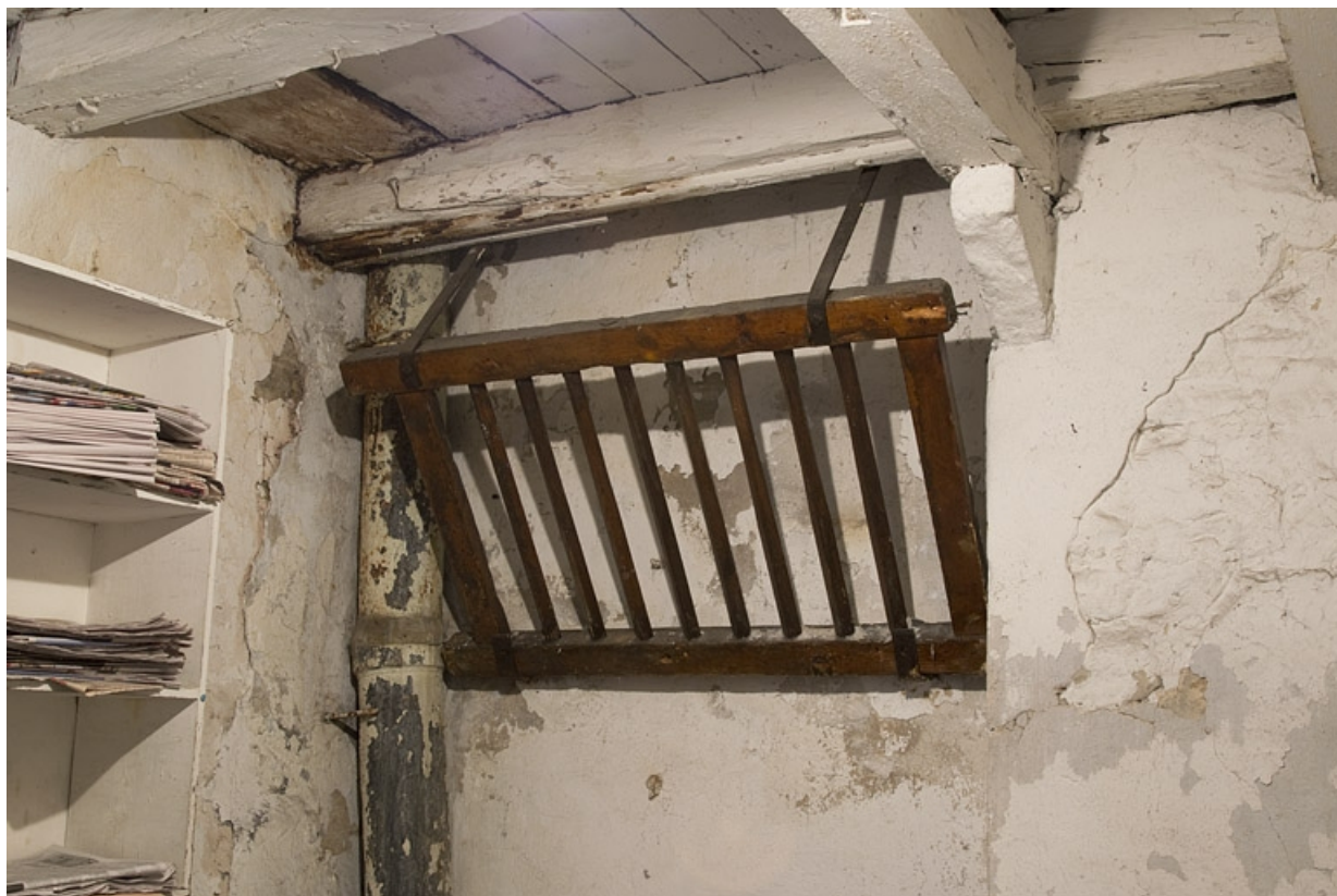
Ecurie : vue d'un râtelier.

25, Besançon, 5 rue Charles Nodier, lieudit : îlot Mairie