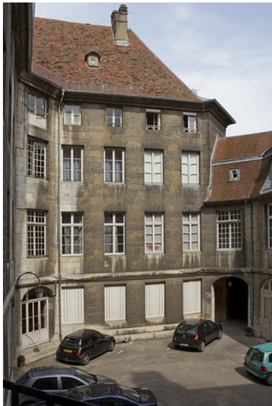
Logis principal : vue de l'aile gauche sur cour.

25, Besançon, 5 rue Charles Nodier, lieudit : îlot Mairie