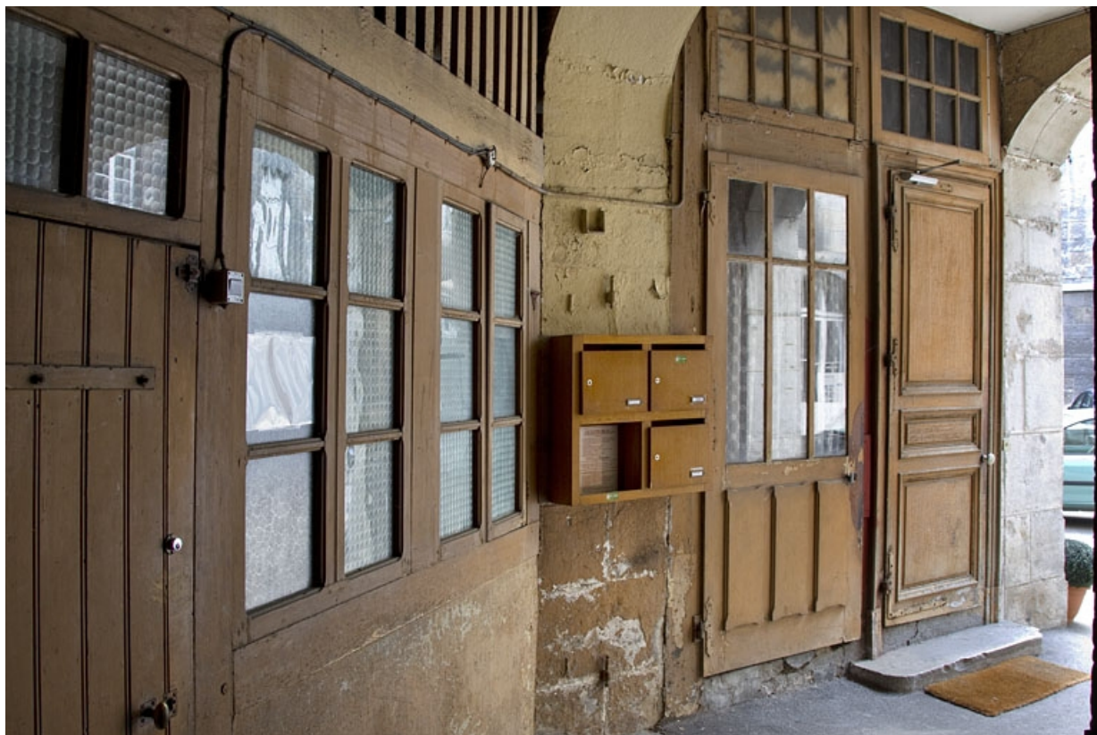
Ecurie : vue de la façade extérieure.

25, Besançon, 5 rue Charles Nodier, lieudit : îlot Mairie