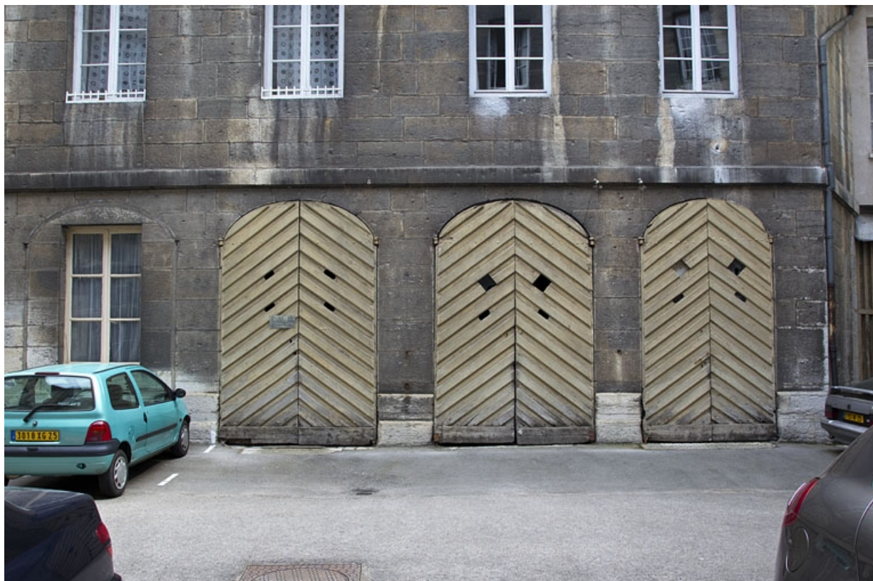
Bâtiment des remises : détail du rez-de-chaussée, de face.

25, Besançon, 5 rue Charles Nodier, lieudit : îlot Mairie