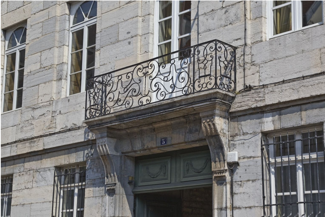
Logis principal : détail du balcon au-dessus du portail d'entrée.

25, Besançon, 5 rue Charles Nodier, lieudit : îlot Mairie