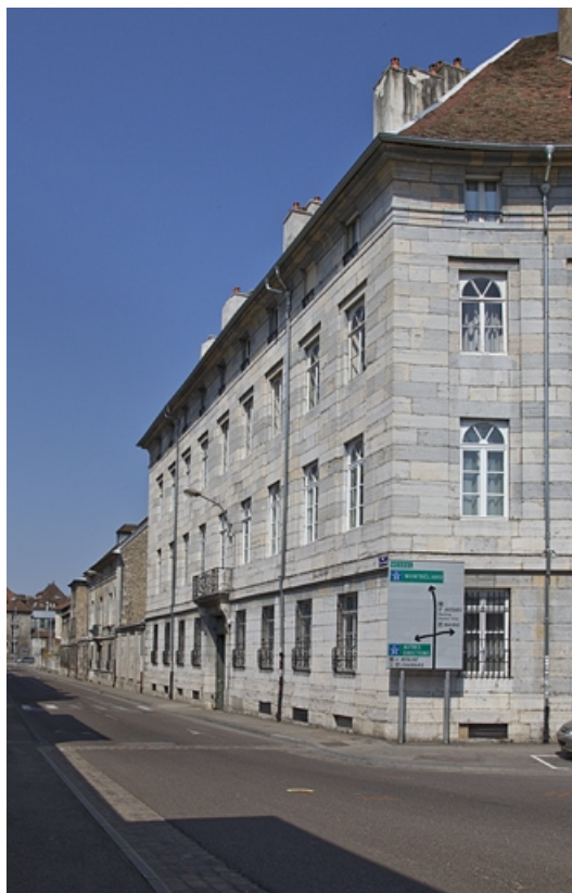
Logis principal, façade rue Charles Nodier : vue d'ensemble, de trois quarts droit. 25, Besançon, 5 rue Charles Nodier, lieudit : îlot Mairie