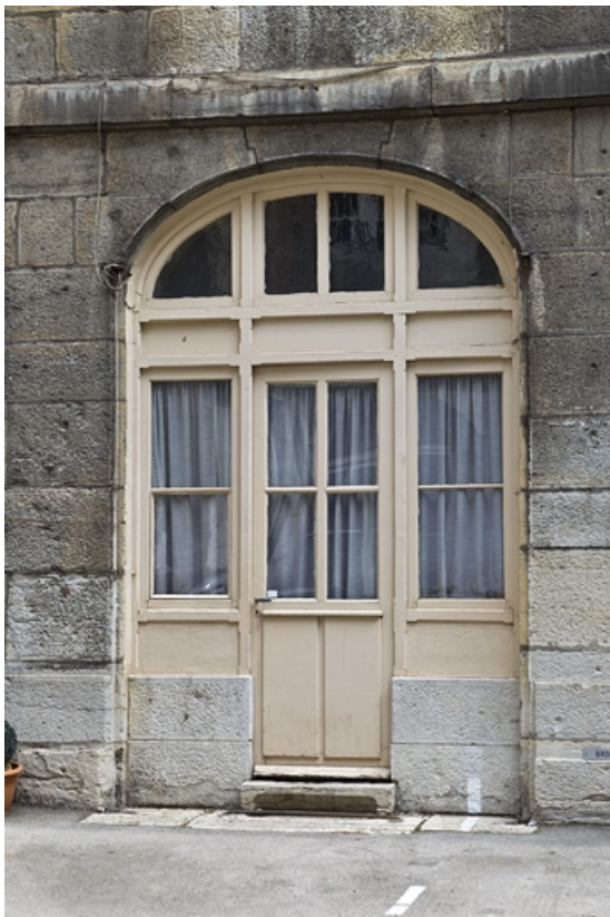
Bâtiment des remises : détail d'une baie du rez-de-chaussée.

25, Besançon, 5 rue Charles Nodier, lieudit : îlot Mairie