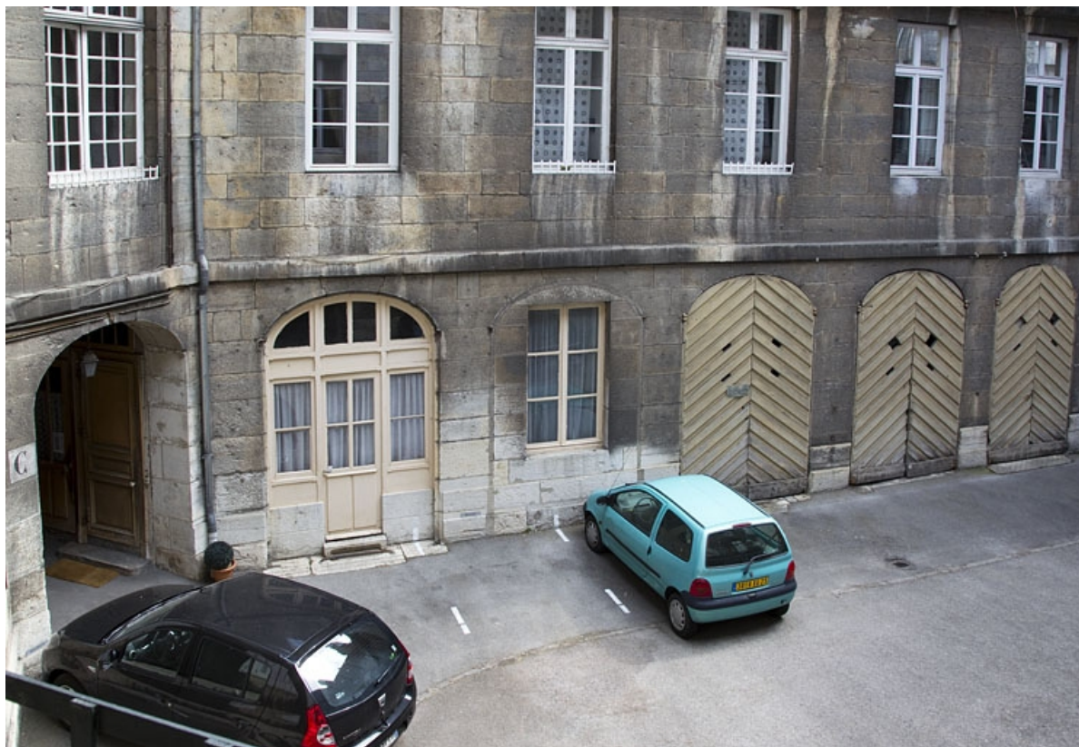
Bâtiment des remises : détail du rez-de-chaussée.

25, Besançon, 5 rue Charles Nodier, lieudit : îlot Mairie