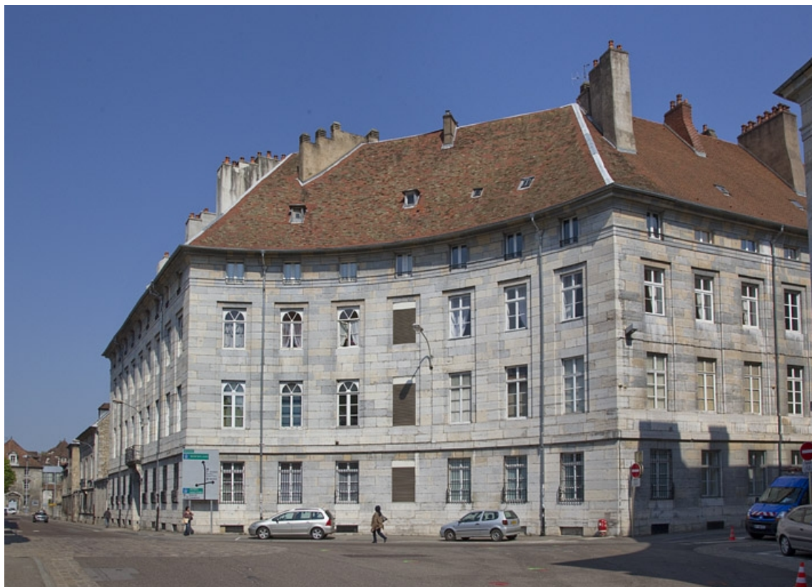
Logis principal : vue d'ensemble depuis la place de la Préfecture.

25, Besançon, 5 rue Charles Nodier, lieudit : îlot Mairie