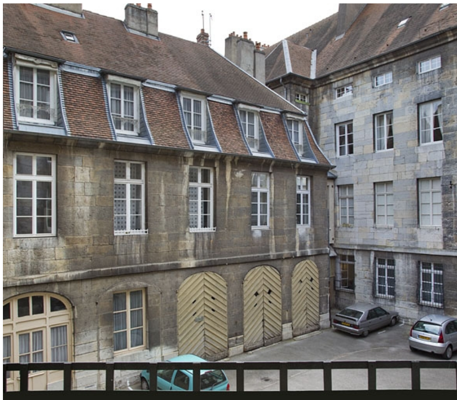
Bâtiment des remises : vue d'ensemble de trois quarts gauche.

25, Besançon, 5 rue Charles Nodier, lieudit : îlot Mairie