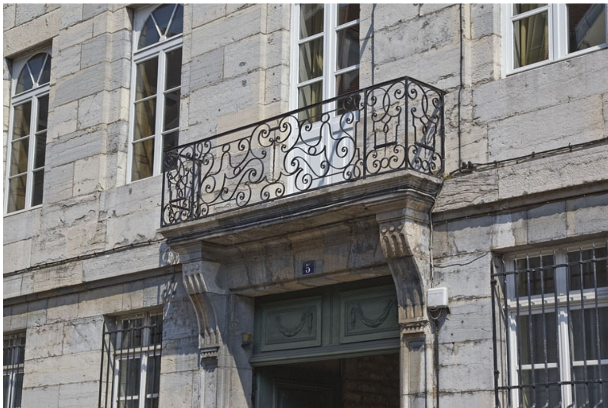
Logis principal : détail du balcon au-dessus du portail d'entrée.

25, Besançon, 5 rue Charles Nodier, lieudit : îlot Mairie