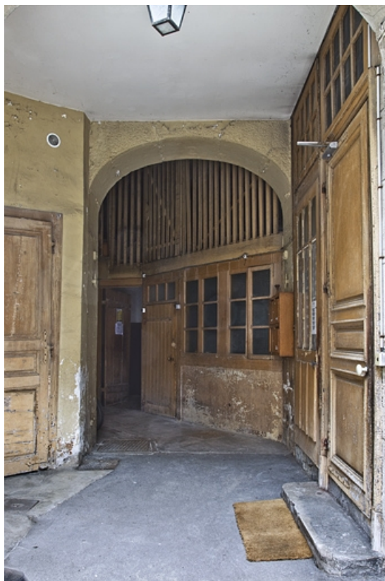
Vue d'ensemble de l'entrée de l'écurie.

25, Besançon, 5 rue Charles Nodier, lieudit : îlot Mairie