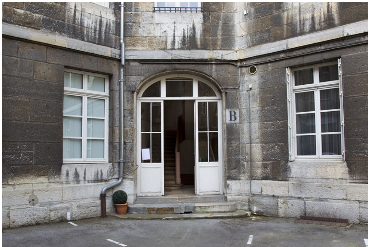
Logis principal : entrée secondaire de l'aile droite. 25, Besançon, 5 rue Charles Nodier, lieudit : îlot Mairie