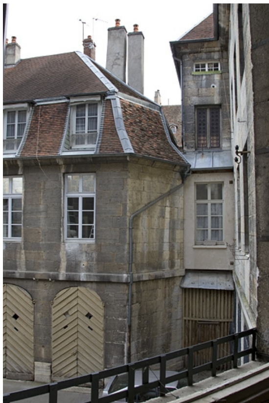
Logis principal : détail du bûcher.

25, Besançon, 5 rue Charles Nodier, lieudit : îlot Mairie