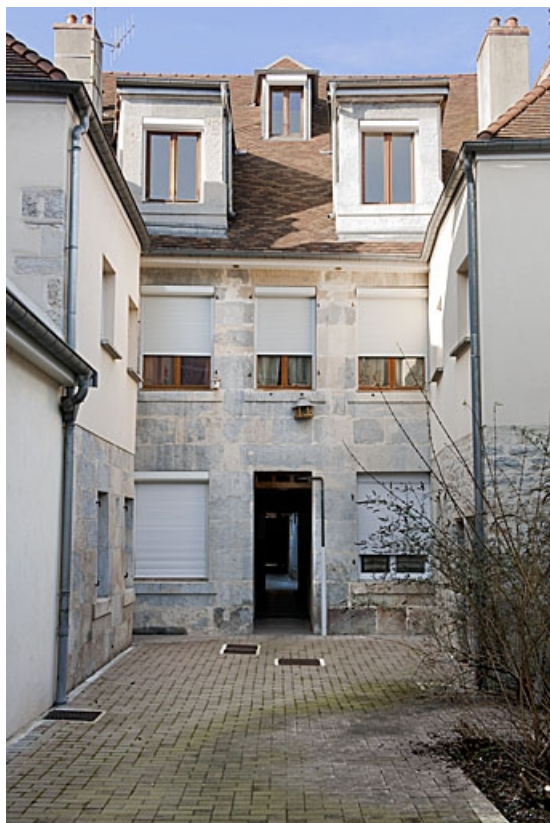
Premier logis secondaire : vue d'ensemble de la façade postérieure. 25, Besançon, 46 rue des Bersot, lieudit : îlot Jean Cornet