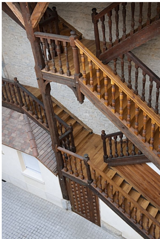
Vue d'ensemble, en plongée, de l'escalier à cage ouverte situé dans la première cour.

25, Besançon, 46 rue des Bersot, lieudit : îlot Jean Cornet