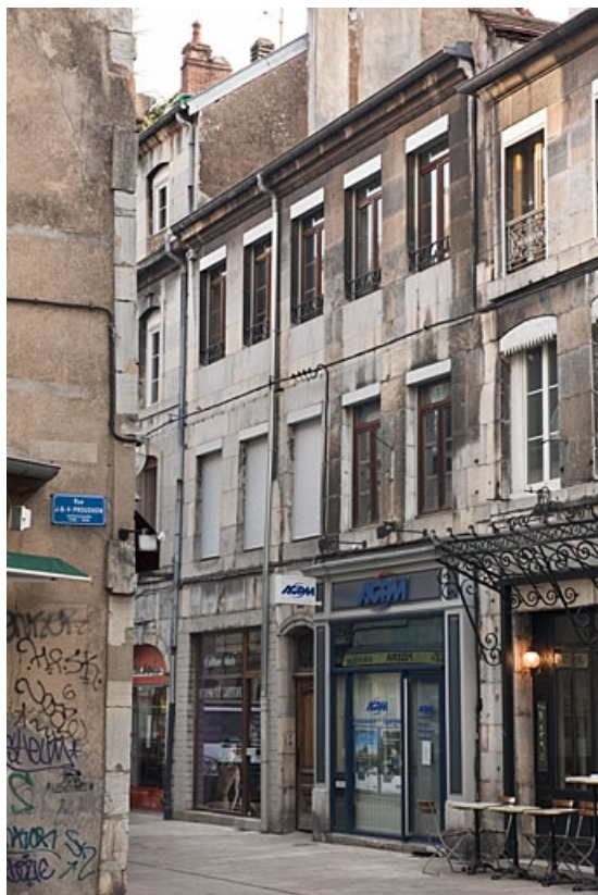
Façade sur rue du logis principal : de trois quarts droit.

25, Besançon, 46 rue des Bersot, lieudit : îlot Jean Cornet