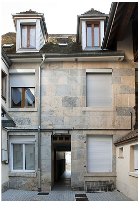
Premier logis secondaire : vue d'ensemble de la façade antérieure.

25, Besançon, 46 rue des Bersot, lieudit : îlot Jean Cornet