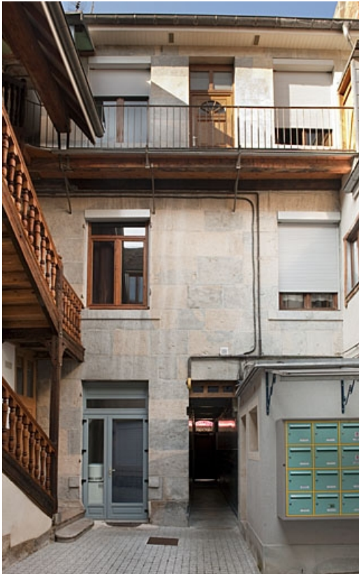
Logis principal : vue d'ensemble de la façade postérieure.

25, Besançon, 46 rue des Bersot, lieudit : îlot Jean Cornet