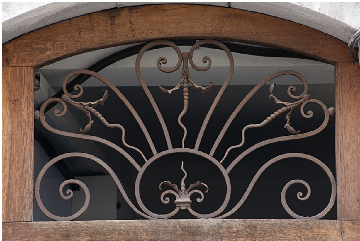
Façade sur rue du logis principal : détail du dessus de porte en ferronnerie du couloir.

25, Besançon, 46 rue des Bersot, lieudit : îlot Jean Cornet