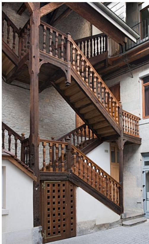
Vue d'ensemble de l'escalier à cage ouverte situé dans la première cour.

25, Besançon, 46 rue des Bersot, lieudit : îlot Jean Cornet