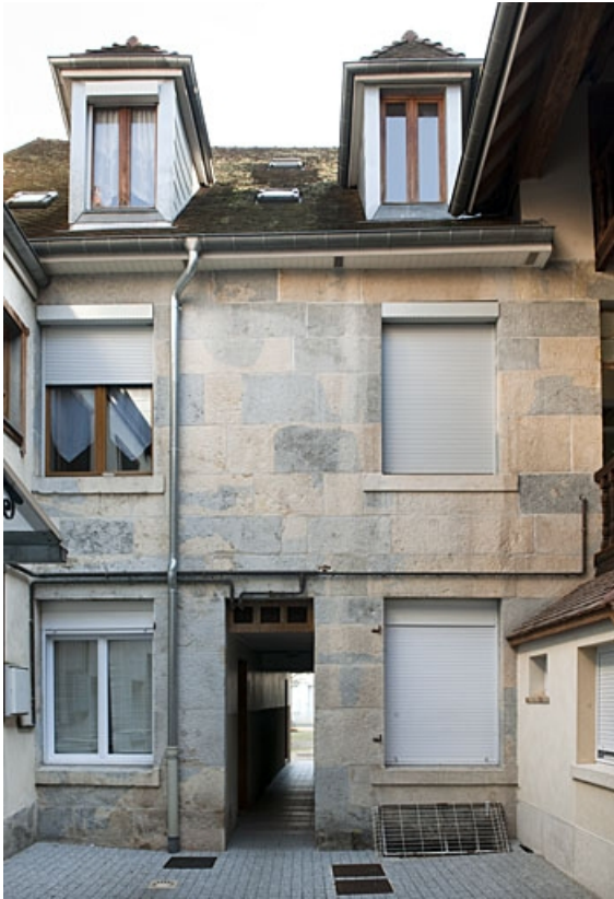
Premier logis secondaire : vue d'ensemble de la façade antérieure.

25, Besançon, 46 rue des Bersot, lieudit : îlot Jean Cornet