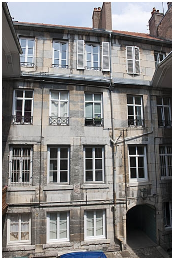
Premier logis secondaire : vue d'ensemble de la façade antérieure.

25, Besançon, 103 rue des Granges, lieudit : îlot Jean Cornet