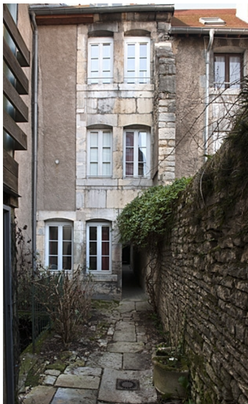
Vue d'ensemble de la façade postérieure du deuxième logis secondaire.

25, Besançon, 34 rue Bersot, lieudit : îlot Jean Cornet