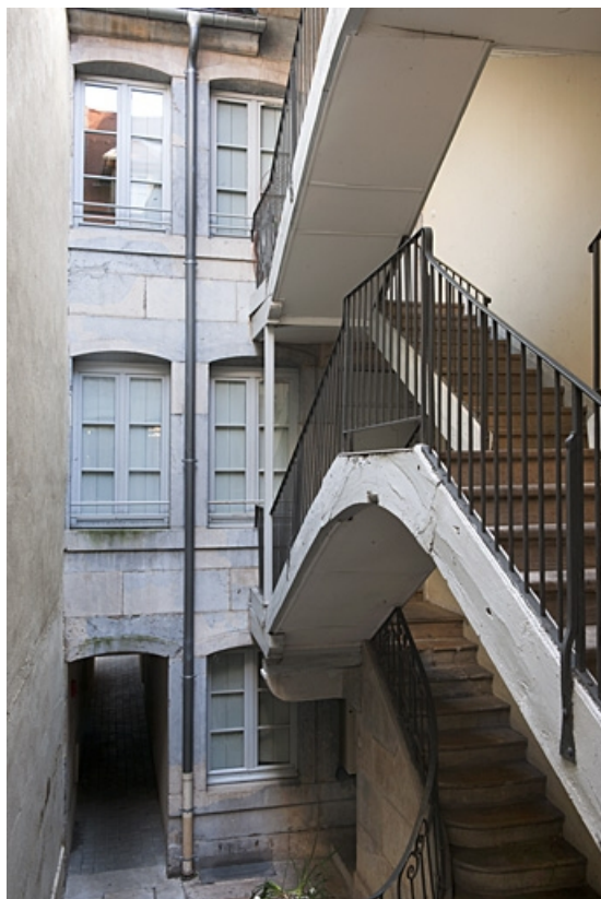
Escalier à cage ouverte situé dans la première cour : vue des volées supérieures.

25, Besançon, 34 rue Bersot, lieudit : îlot Jean Cornet