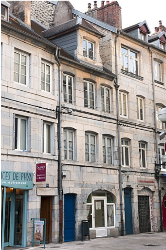
Logis principal, façade sur rue : de trois quarts gauche.

25, Besançon, 34 rue Bersot, lieudit : îlot Jean Cornet