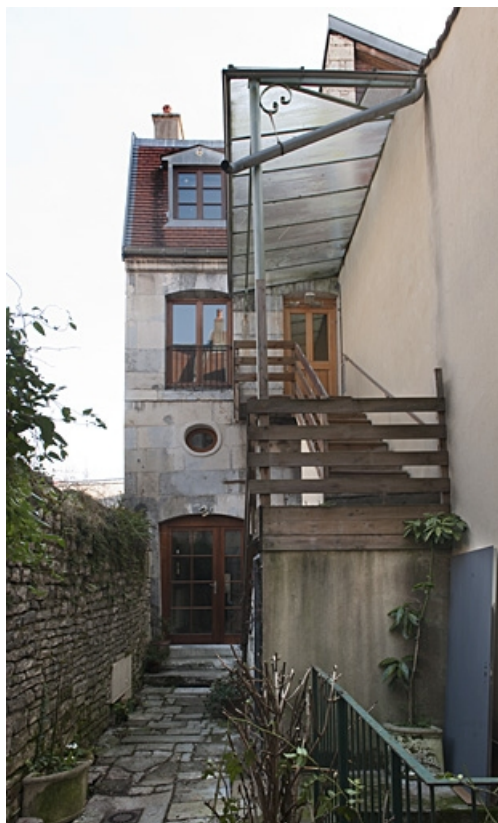
Vue du deuxième logis secondaire au fond de la deuxième cour.

25, Besançon, 34 rue Bersot, lieudit : îlot Jean Cornet