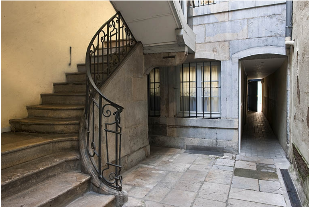
Départ de l'escalier à cage ouverte situé dans la première cour.

25, Besançon, 34 rue Bersot, lieudit : îlot Jean Cornet