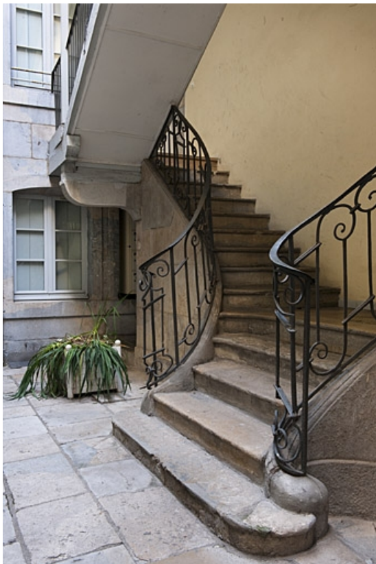
Départ de l'escalier à cage ouverte situé dans la première cour : vue d'ensemble.

25, Besançon, 34 rue Bersot, lieudit : îlot Jean Cornet