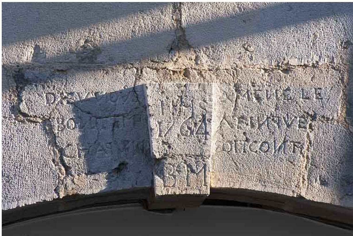
Logis principal :détail de l'inscription sur l'arcade boutiquière.

25, Besançon, 34 rue Bersot, lieudit : îlot Jean Cornet