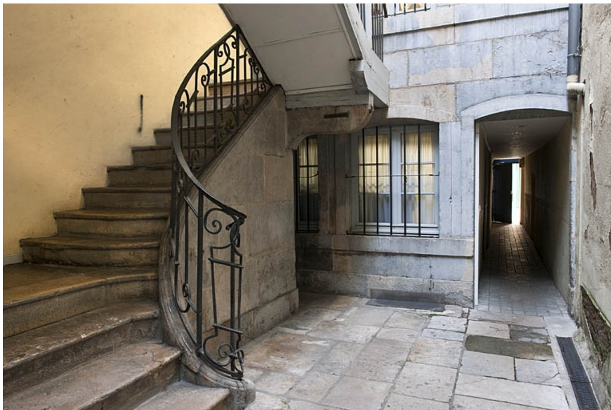
Départ de l'escalier à cage ouverte situé dans la première cour.

25, Besançon, 34 rue Bersot, lieudit : îlot Jean Cornet