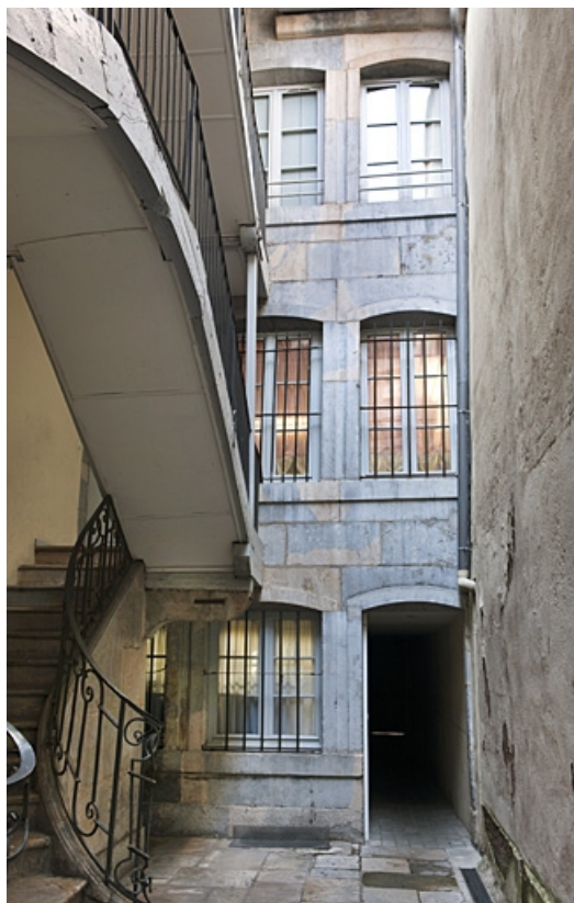
Vue d'ensemble de la façade postérieure du logis principal.

25, Besançon, 34 rue Bersot, lieudit : îlot Jean Cornet