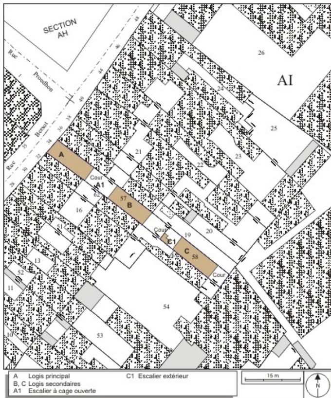
Plan masse et de situation. Extrait du plan cadastral, 1974, section AI. 25, Besançon, 34 rue Bersot, lieudit : îlot Jean Cornet