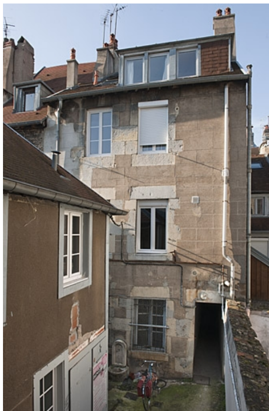
Vue d'ensemble de la façade postérieure du premier logis secondaire.

25, Besançon, 40, 42 rue Bersot, lieudit : îlot Jean Cornet