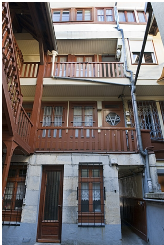
Logis principal : vue d'ensemble de la façade postérieure.

25, Besançon, 40, 42 rue Bersot, lieudit : îlot Jean Cornet