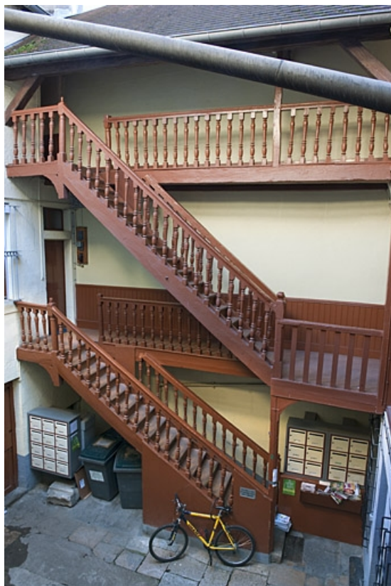
Vue d'ensemble de l'escalier à cage ouverte situé à droite dans la première cour.

25, Besançon, 40, 42 rue Bersot, lieudit : îlot Jean Cornet