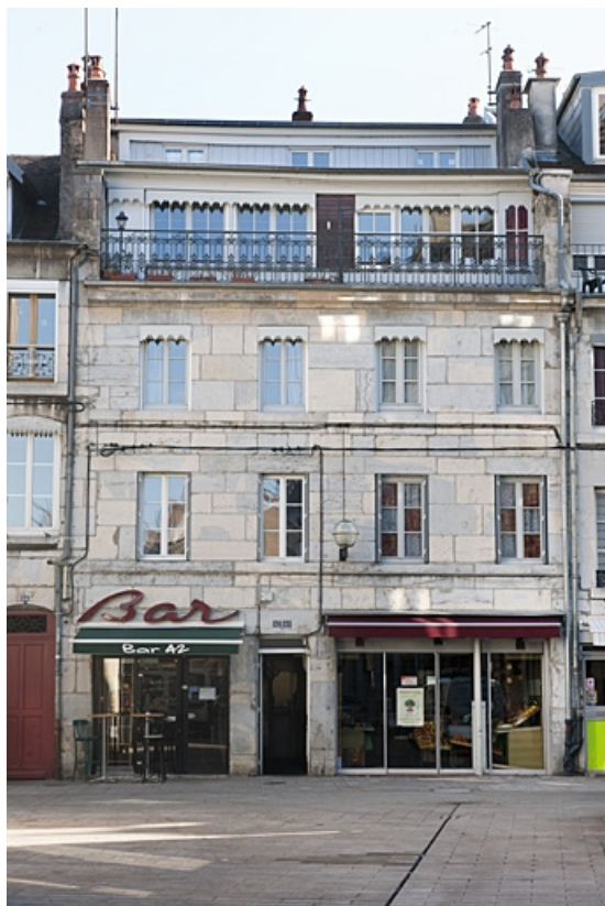
Logis principal : vue d'ensemble de la façade sur rue. 25, Besançon, 40, 42 rue Bersot, lieudit : îlot Jean Cornet