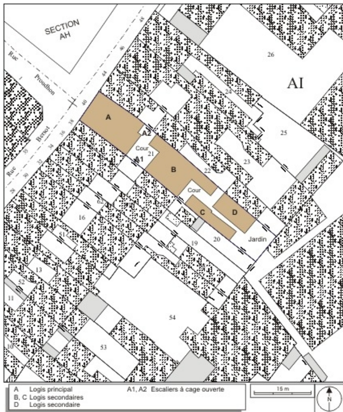
Plan masse et de situation. Extrait du plan cadastral, 1974, section AI. 25, Besançon, 40, 42 rue Bersot, lieudit : îlot Jean Cornet