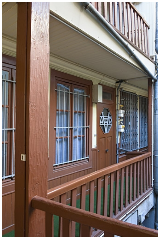
Façade postérieure du logis principal : détail d'une coursière.

25, Besançon, 40, 42 rue Bersot, lieudit : îlot Jean Cornet