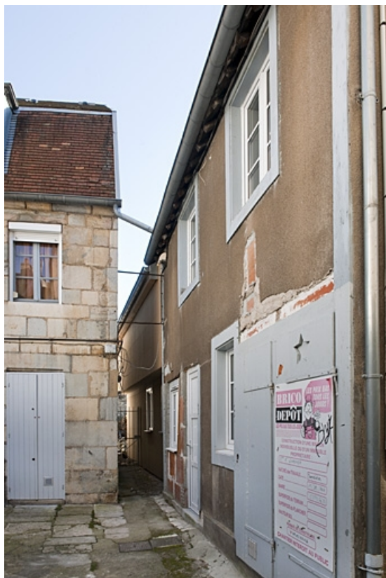
Vue des logis secondaires droit et gauche situés dans la deuxième cour.

25, Besançon, 40, 42 rue Bersot, lieudit : îlot Jean Cornet