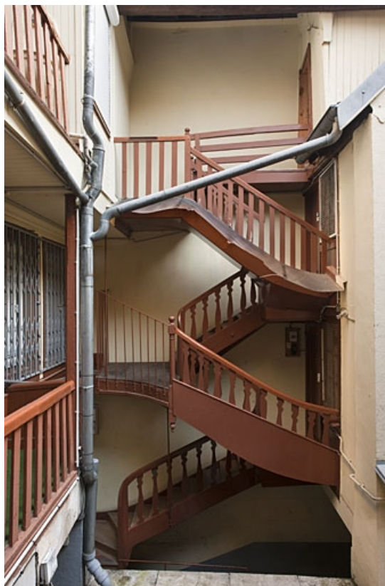
Escalier à cage ouverte à gauche dans la première cour : vue d'ensemble.

25, Besançon, 40, 42 rue Bersot, lieudit : îlot Jean Cornet