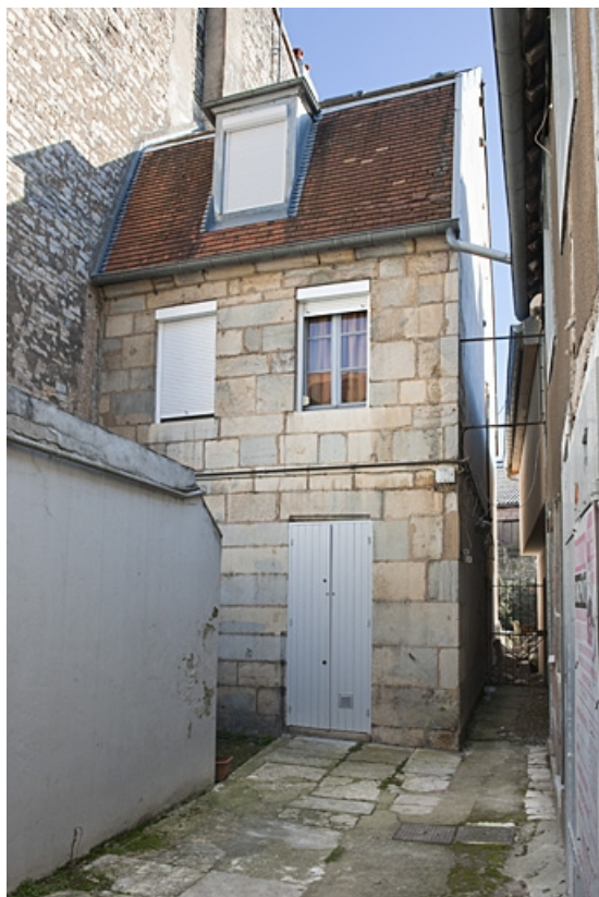
Vue du logis secondaire gauche situé dans la deuxième cour.

25, Besançon, 40, 42 rue Bersot, lieudit : îlot Jean Cornet