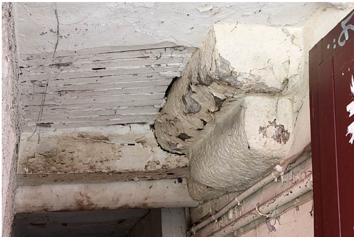
Logis principal : détail d'un encorbellemen de cheminée dans le couloir d'entrée.

25, Besançon, 8 rue Bersot, lieudit : îlot Jean Cornet