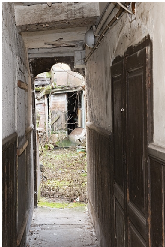
Logis principal : détail du couloir en direction de la cour.

25, Besançon, 8 rue Bersot, lieudit : îlot Jean Cornet