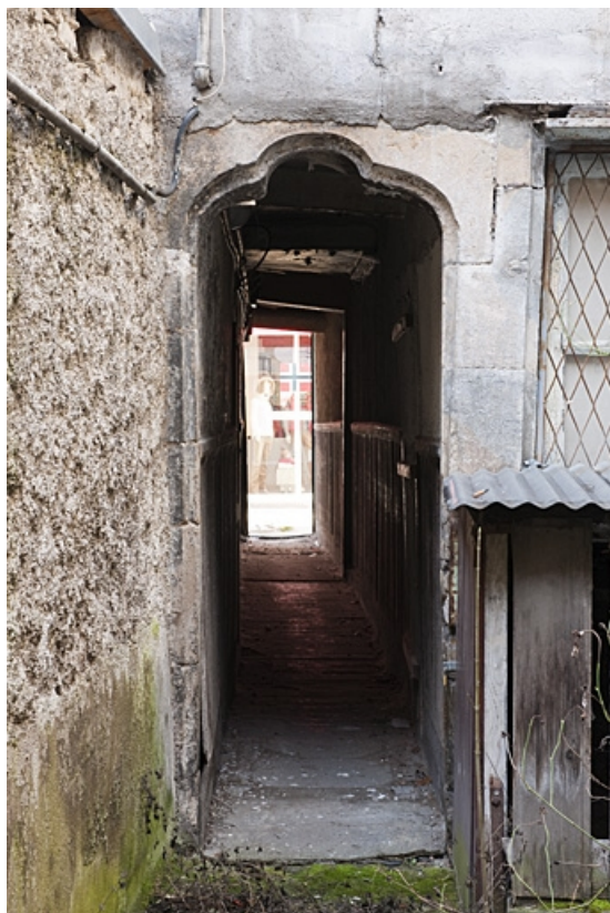
Façade postérieure du logis principal : détail de l'entrée du couloir. 25, Besançon, 8 rue Bersot, lieudit : îlot Jean Cornet