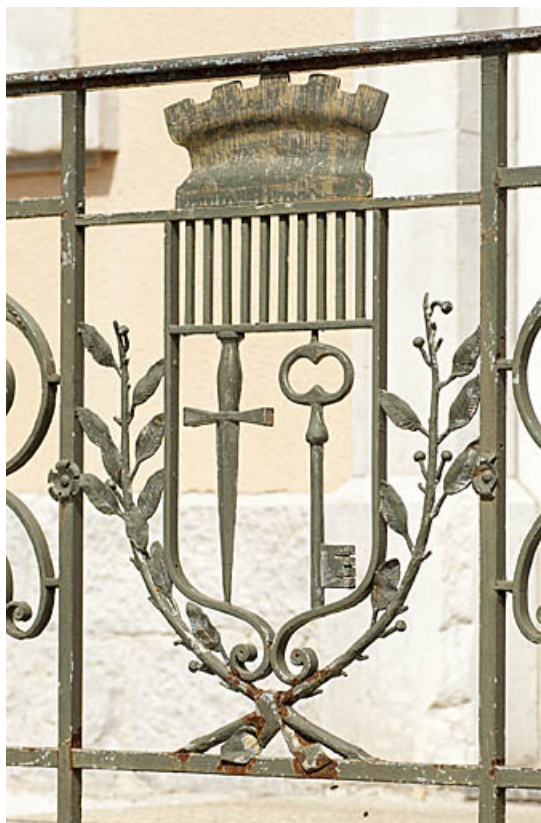
Blason ornant le garde-corps du perron.