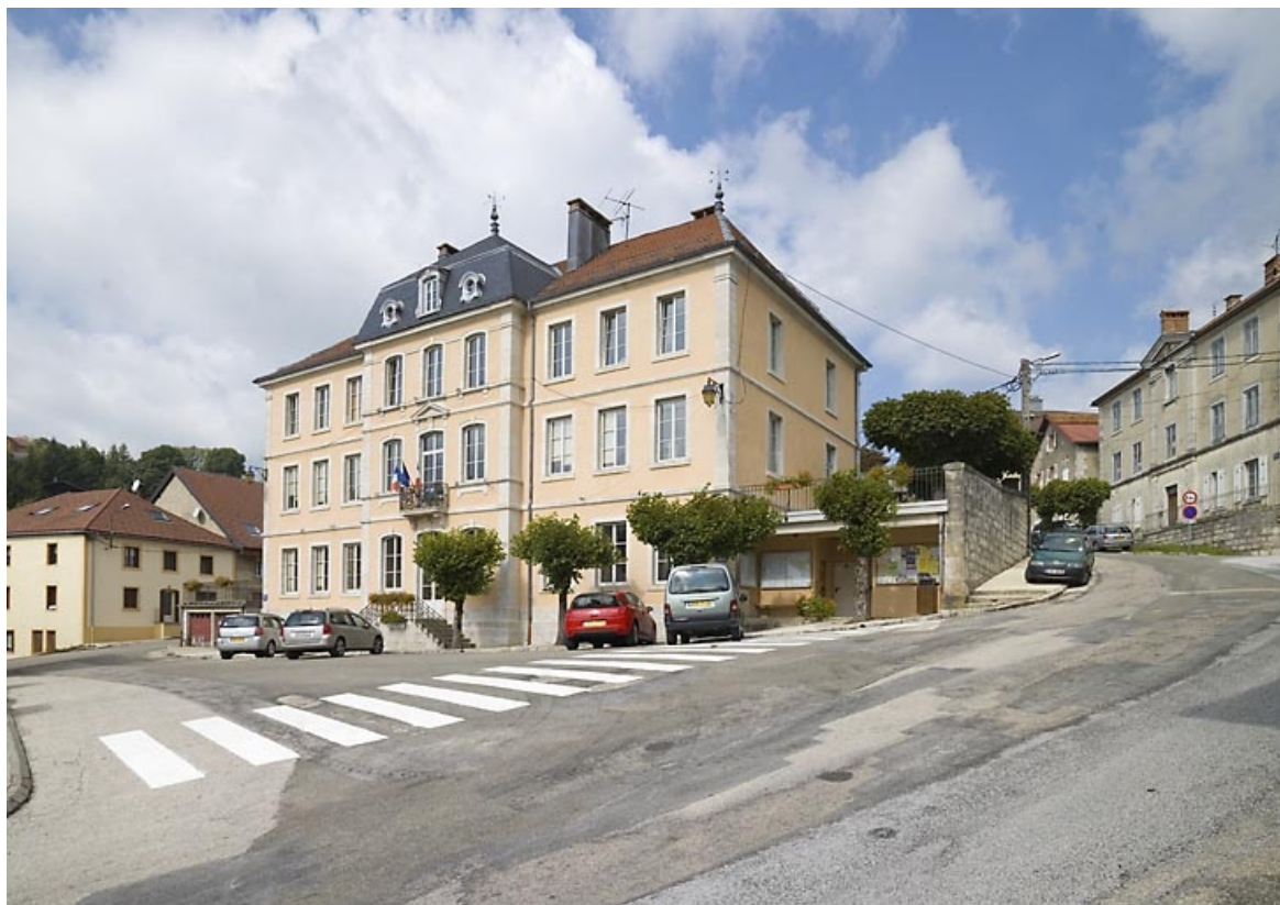
Vue générale de trois quarts droit.