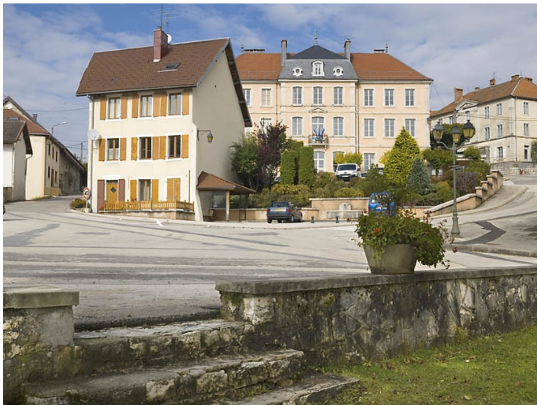
Vue générale depuis la poste.