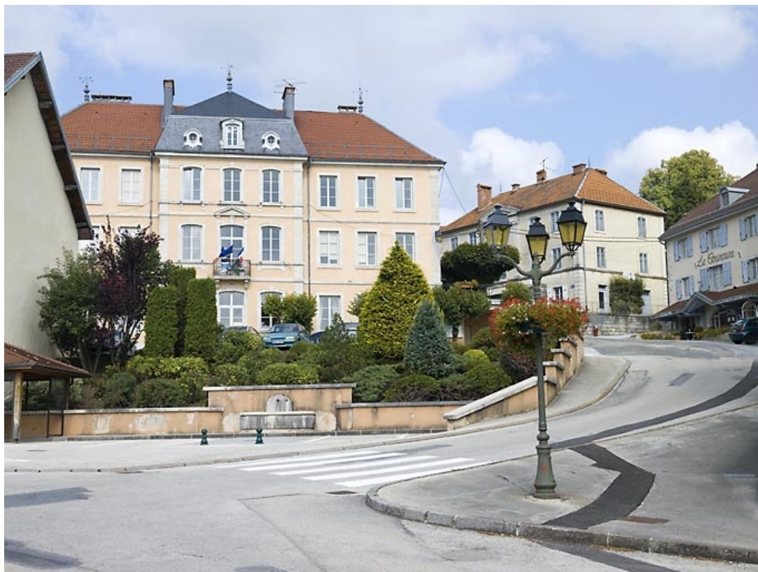
Vue générale plus rapprochée.