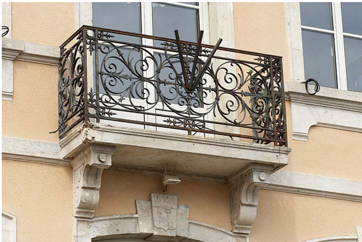
Balcon surmontant l'entrée. 25, Jougne place de la Mairie