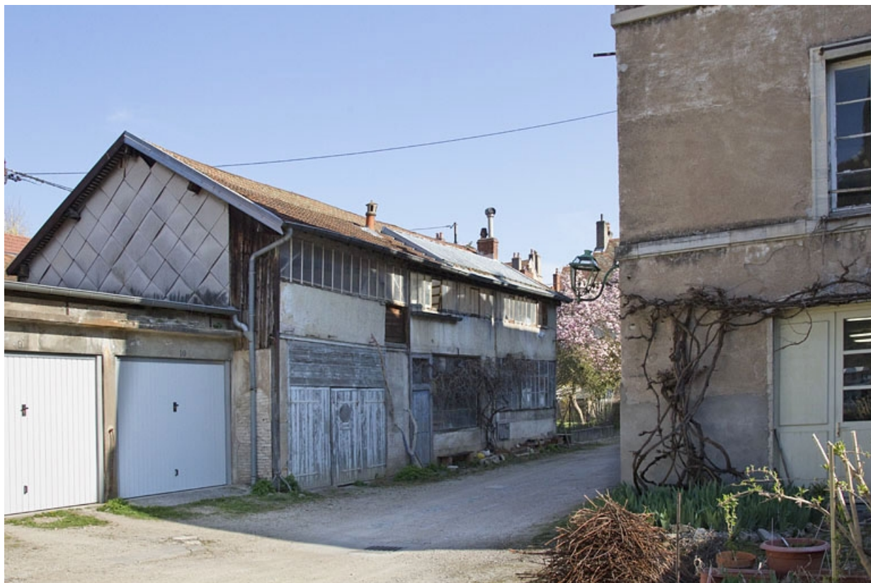
Vue d'ensemble de l'atelier, de trois quarts gauche.

25, Besançon, 20 rue Charles Nodier, lieudit : îlot Préfecture