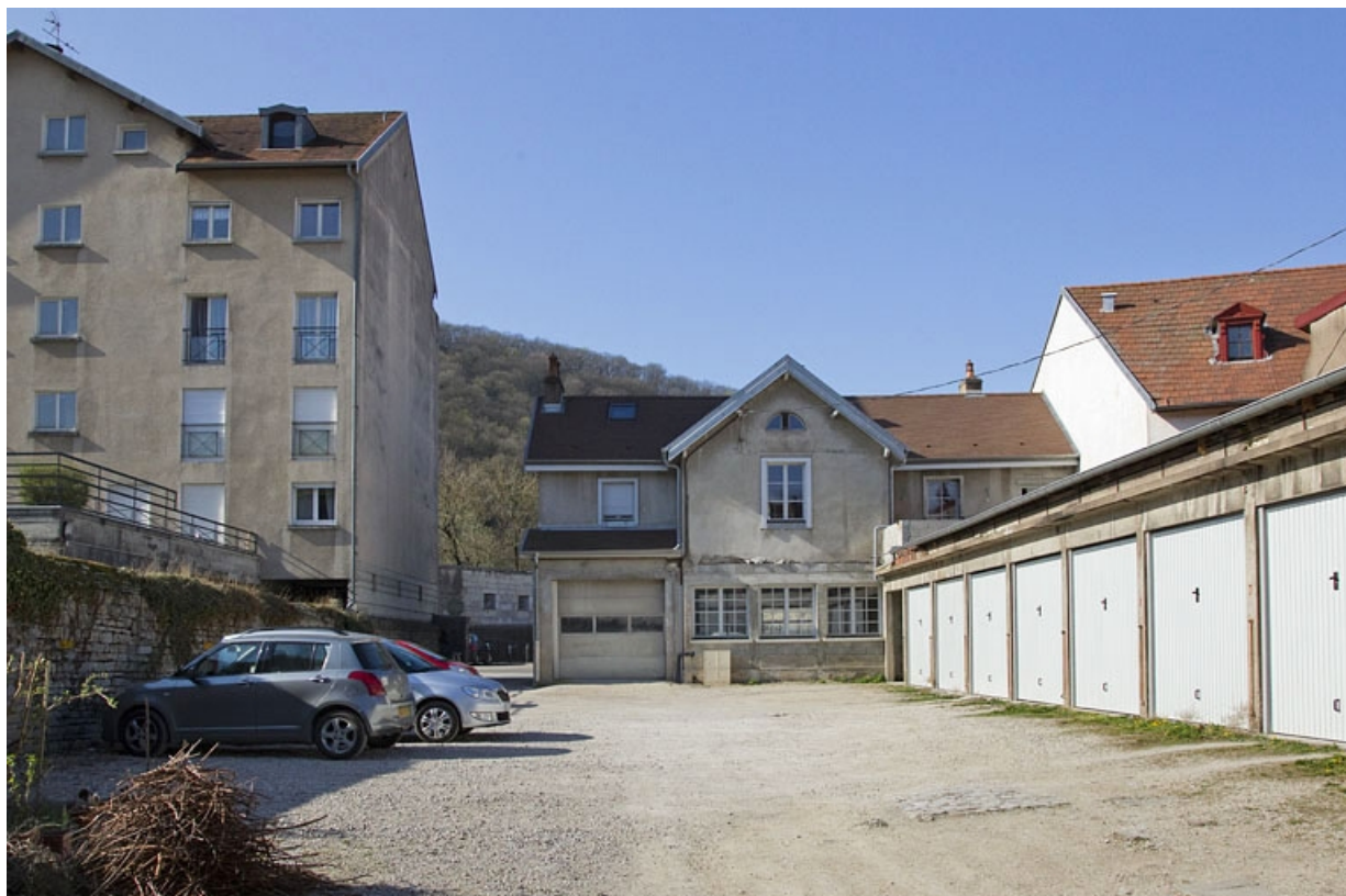
Vue du logis secondaire au fond de la deuxième cour. 25, Besançon, 20 rue Charles Nodier, lieudit : îlot Préfecture