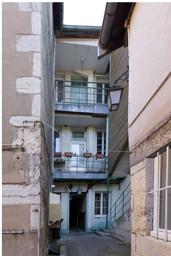
Logis principal : vue de la façade postérieure.

25, Besançon, 20 rue Charles Nodier, lieudit : îlot Préfecture