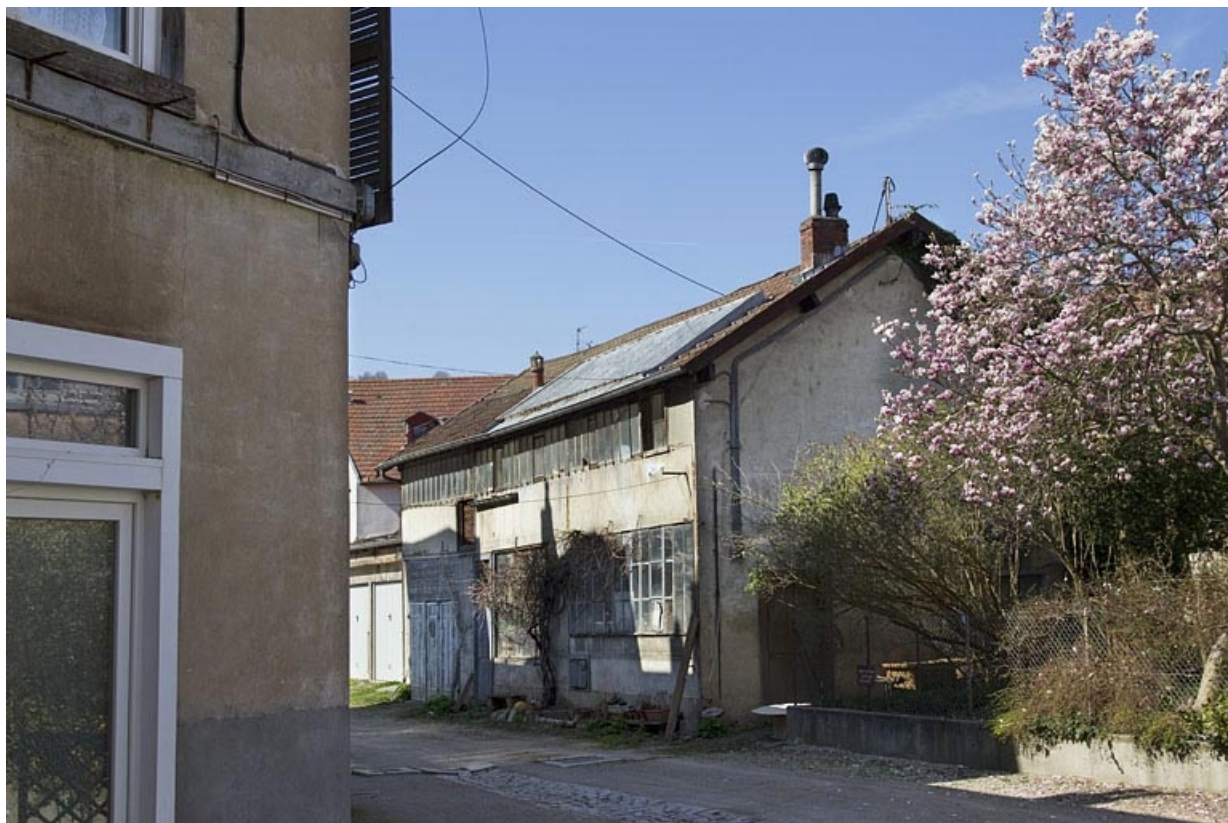
Vue d'ensemble de l'atelier, de trois quarts droit.

25, Besançon, 20 rue Charles Nodier, lieudit : îlot Préfecture