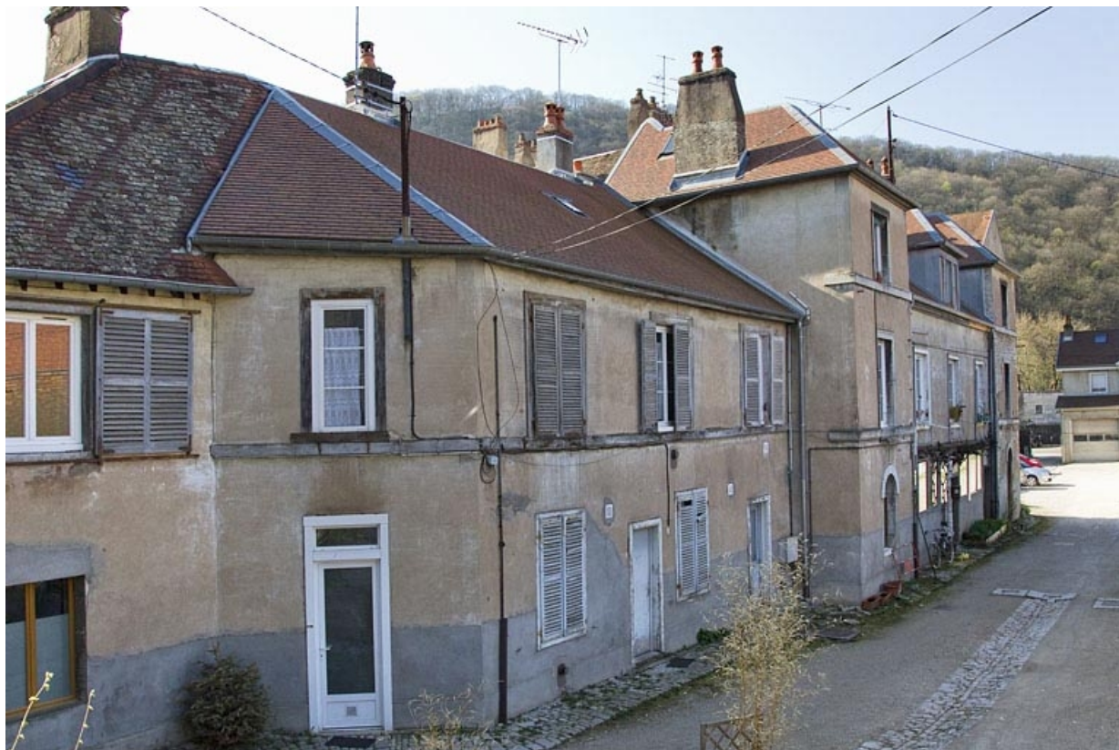
Vue des logis secondaires à gauche de cour.

25, Besançon, 20 rue Charles Nodier, lieudit : îlot Préfecture