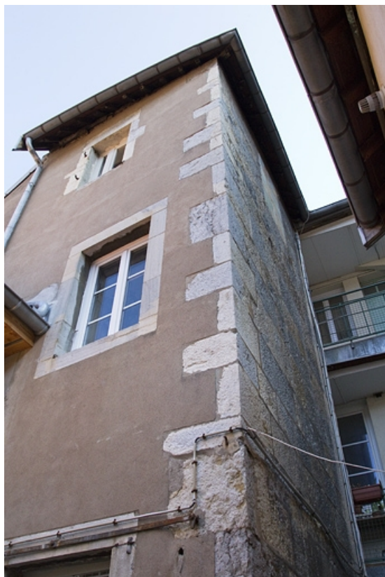
Logis principal : détail de l'aile sur cour.

25, Besançon, 20 rue Charles Nodier, lieudit : îlot Préfecture