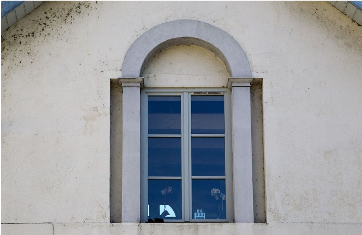
Logis secondaire au fond de la deuxième cour : façade donnant sur l'avenue de la Gare d'Eau, détail de la fenêtre de l'étage. 25, Besançon, 20 rue Charles Nodier, lieudit : îlot Préfecture