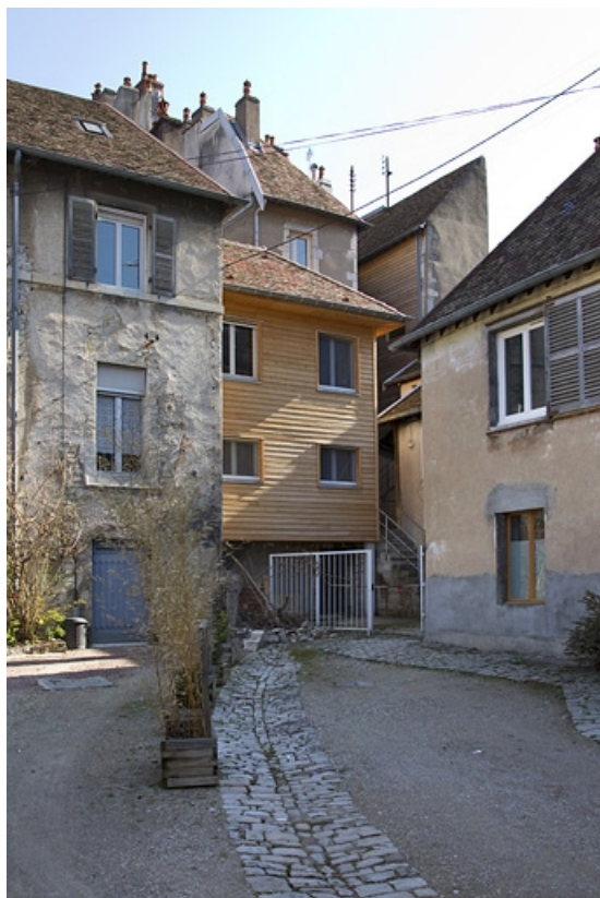
Vue de l'entrée de la première cour.

25, Besançon, 20 rue Charles Nodier, lieudit : îlot Préfecture