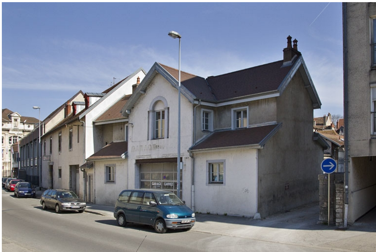
Logis secondaire au fond de la deuxième cour : vue d'ensemble depuis l'avenue de la Gare d'Eau, de trois quarts droit. 25, Besançon, 20 rue Charles Nodier, lieudit : îlot Préfecture