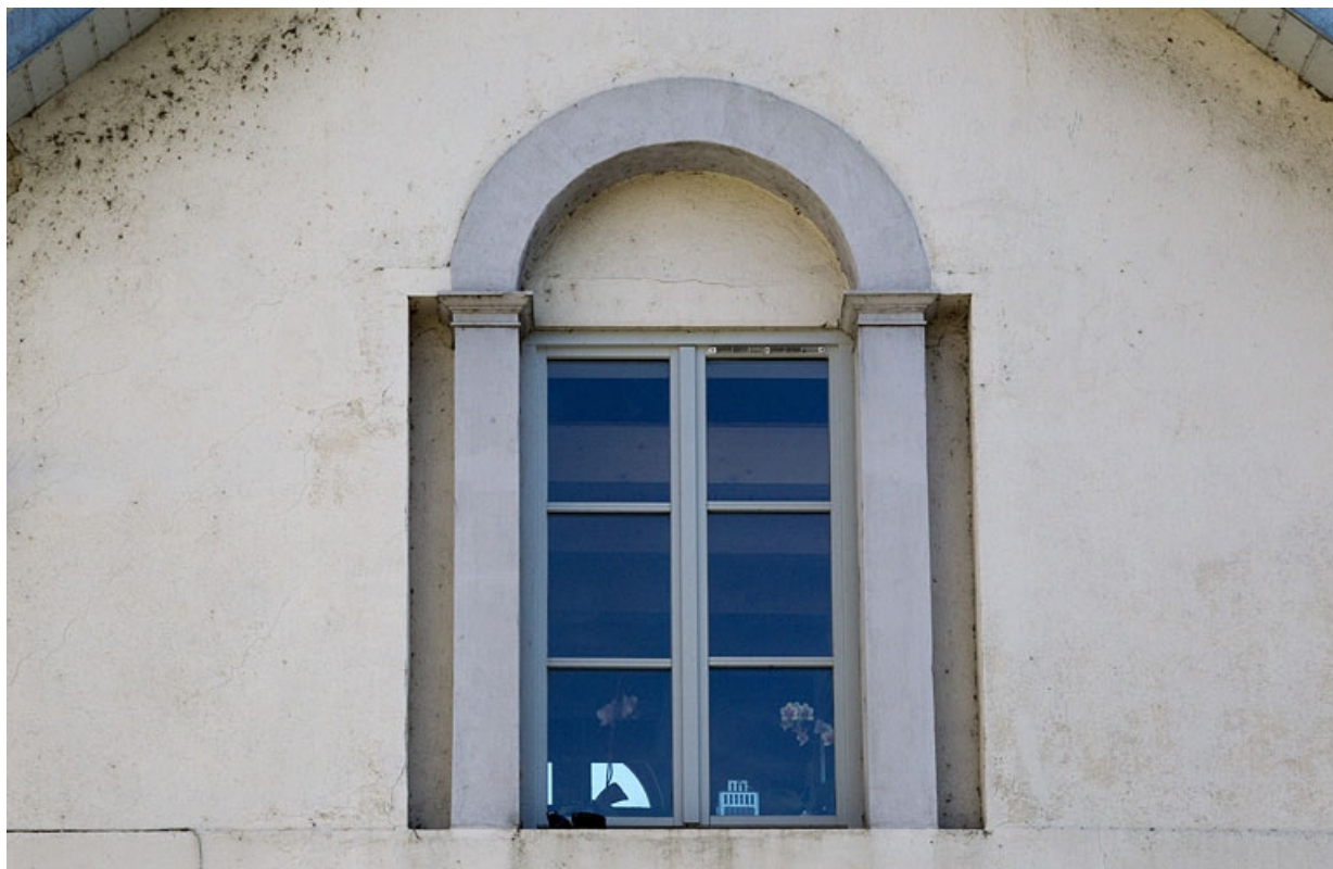
Logis secondaire au fond de la deuxième cour : façade donnant sur l'avenue de la Gare d'Eau, détail de la fenêtre de l'étage. 25, Besançon, 20 rue Charles Nodier, lieudit : îlot Préfecture