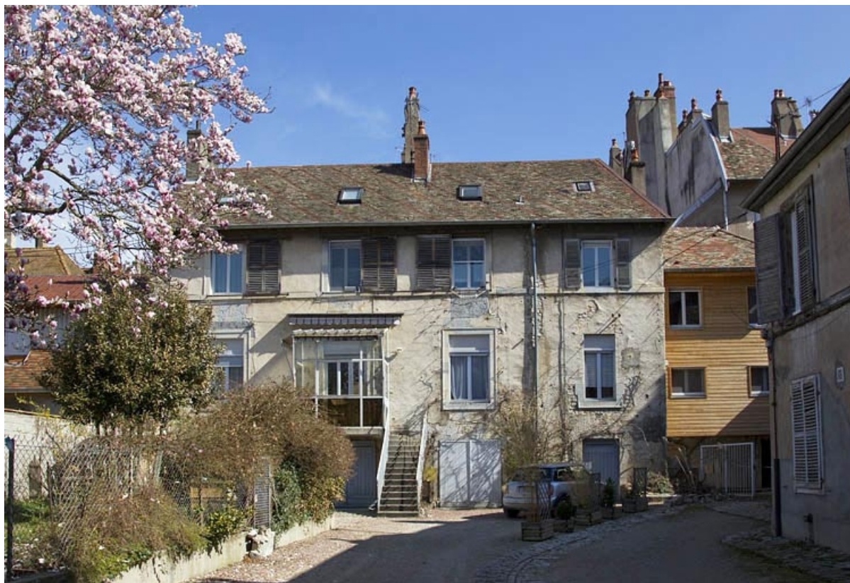
Vue du premier logis secondaire, de face.

25, Besançon, 20 rue Charles Nodier, lieudit : îlot Préfecture