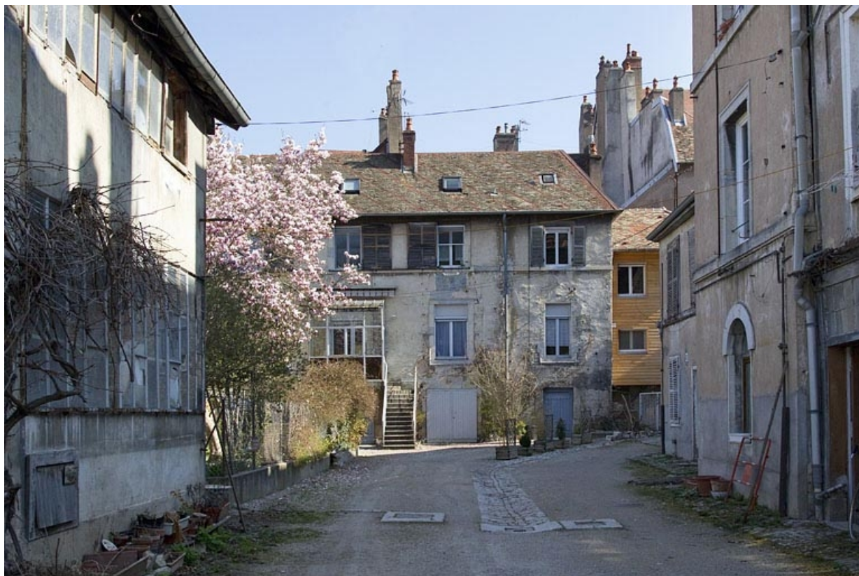
Vue éloignée du premier logis secondaire, de face.

25, Besançon, 20 rue Charles Nodier, lieudit : îlot Préfecture