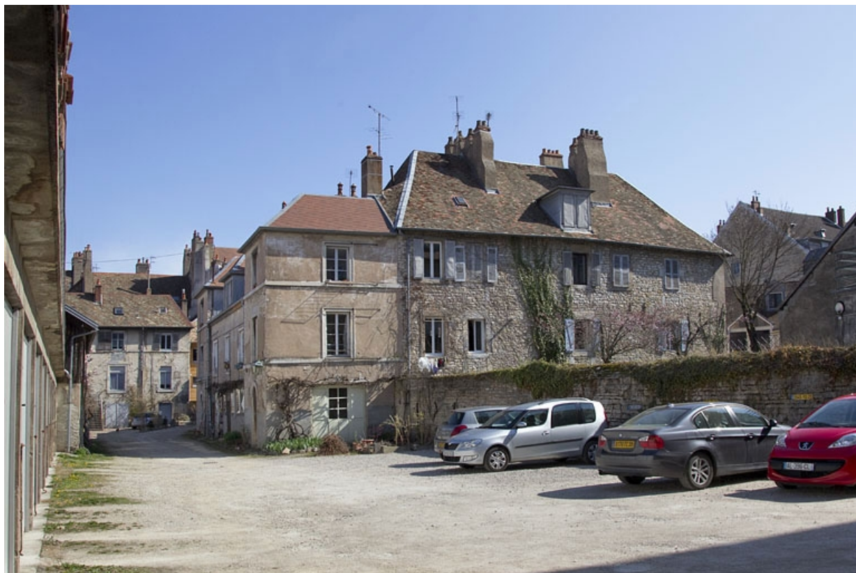
Vue d'ensemble des bâtiments depuis le fond de la deuxième cour.

25, Besançon, 20 rue Charles Nodier, lieudit : îlot Préfecture