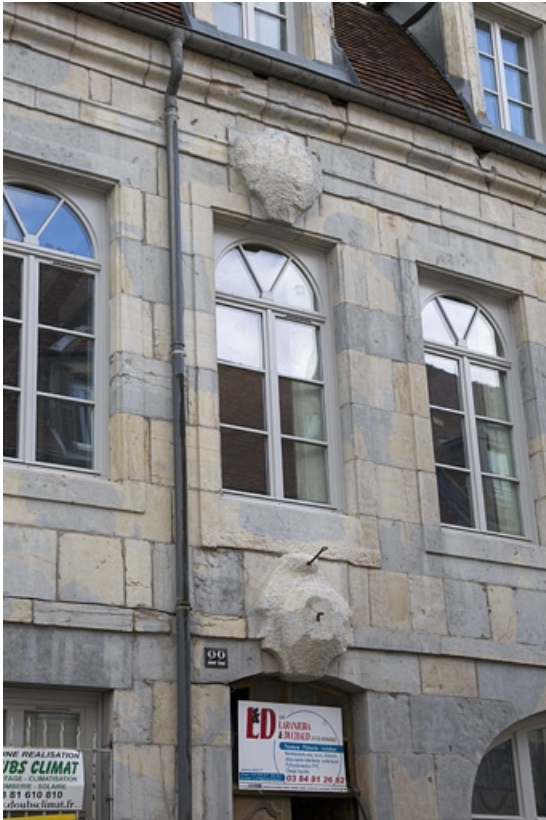
Façade antérieure : détail des pierres d'attente épannelées sur la porte du couloir et d'une fenêtre de l'étage. 25, Besançon, 22 rue Charles Nodier, lieudit : îlot Préfecture