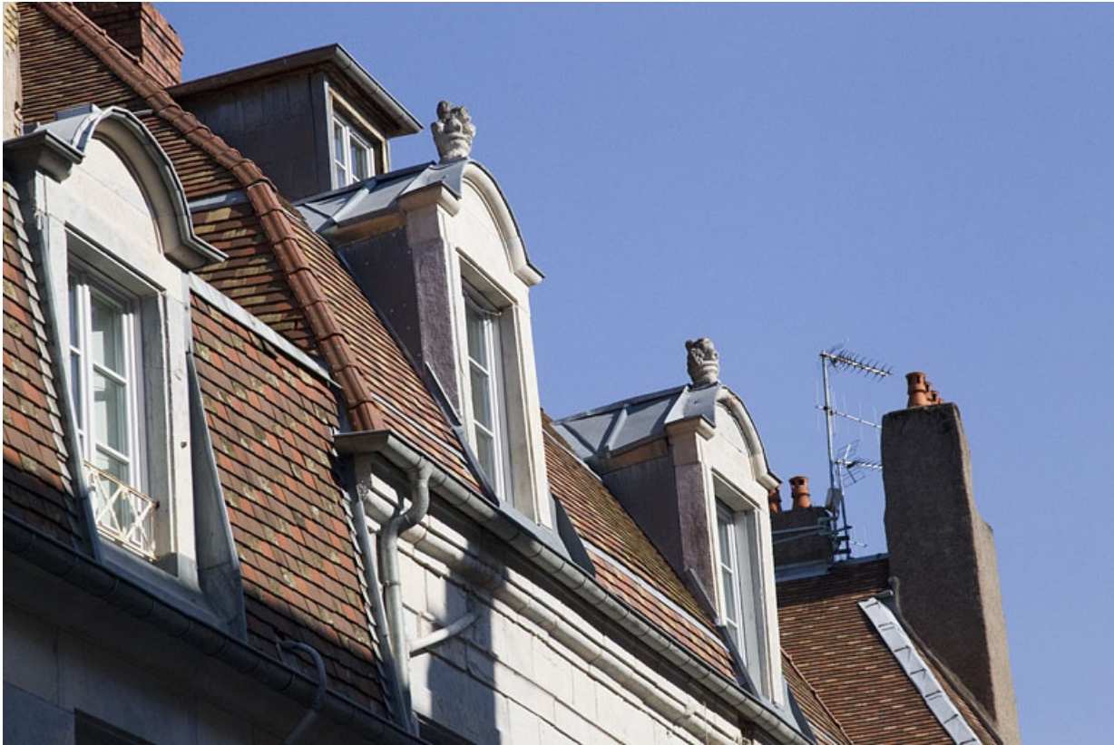
Détail des lucarnes sur le versant de toit donnant rue du Porteau.

25, Besançon, 22 rue Charles Nodier, lieudit : îlot Préfecture