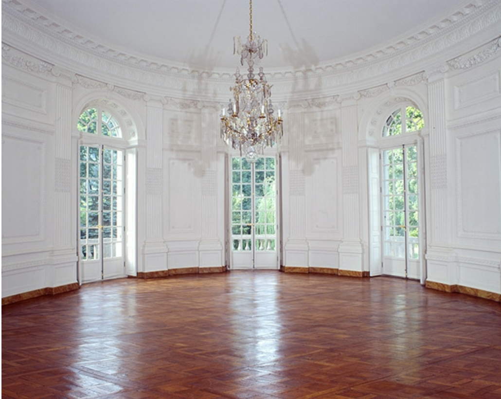
Intérieur : le salon ovale.

25, Besançon, 8bis, 10 rue Charles Nodier, lieudit : îlot Préfecture