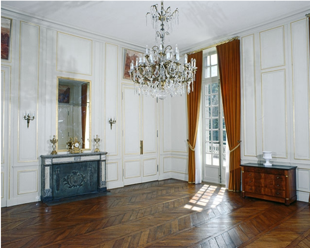
Intérieur : le salon d'attente, de trois quarts gauche.

25, Besançon, 8bis, 10 rue Charles Nodier, lieudit : îlot Préfecture