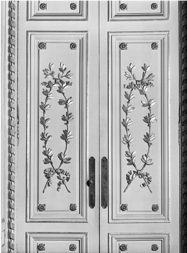
Salon de la rotonde : détail de deux vantaux de porte.

25, Besançon, 8bis, 10 rue Charles Nodier, lieudit : îlot Préfecture