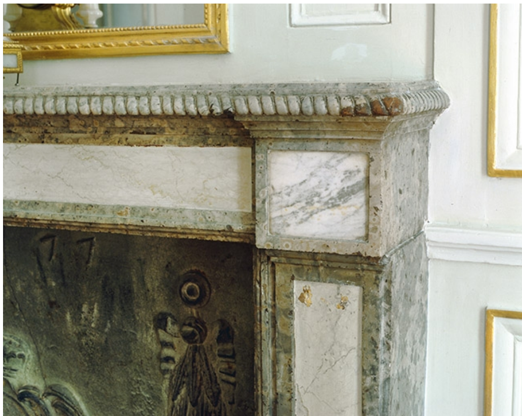
Intérieur : le salon d'attente, détail de l'angle de la cheminée.

25, Besançon, 8bis, 10 rue Charles Nodier, lieudit : îlot Préfecture