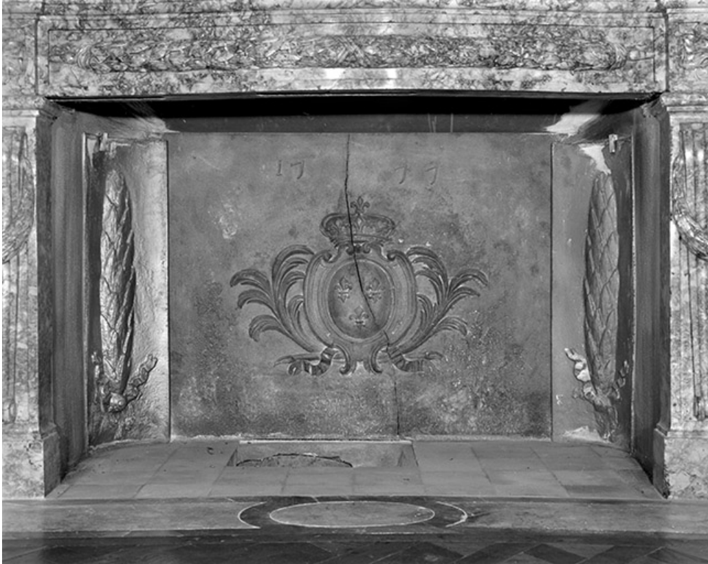
Intérieur : le salon ovale, détail d'une plaque de cheminée.

25, Besançon, 8bis, 10 rue Charles Nodier, lieudit : îlot Préfecture