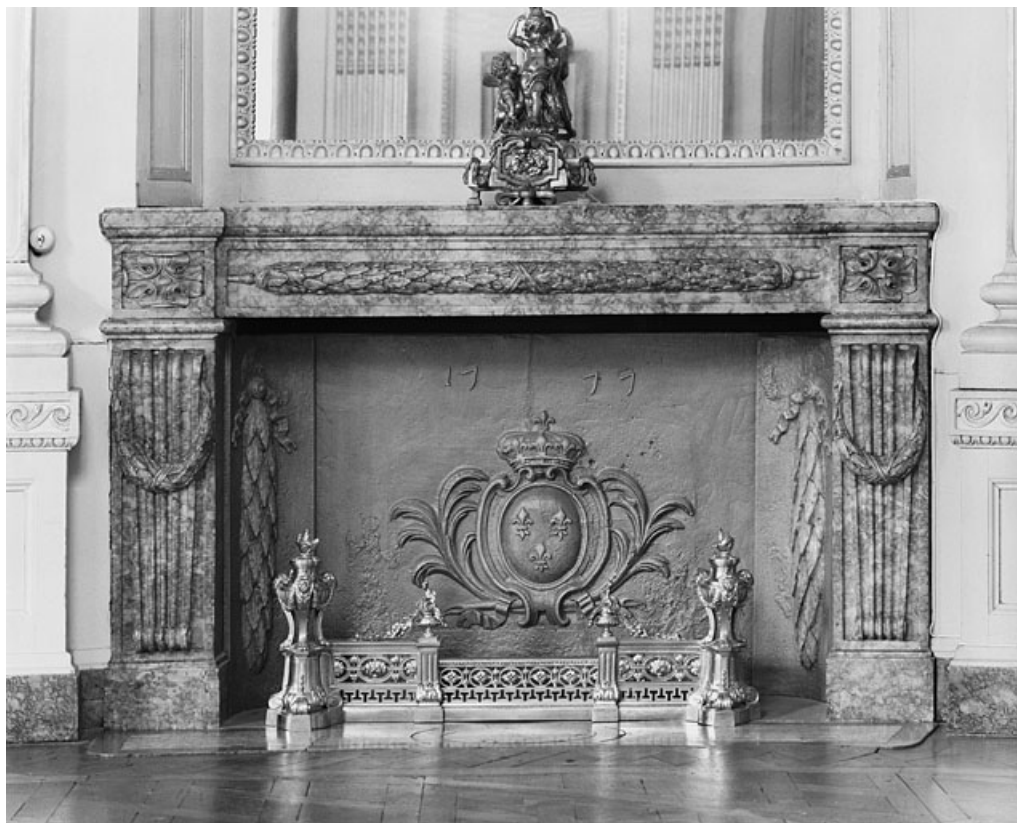
Salon de la rotonde : détail de la cheminée.

25, Besançon, 8bis, 10 rue Charles Nodier, lieudit : îlot Préfecture