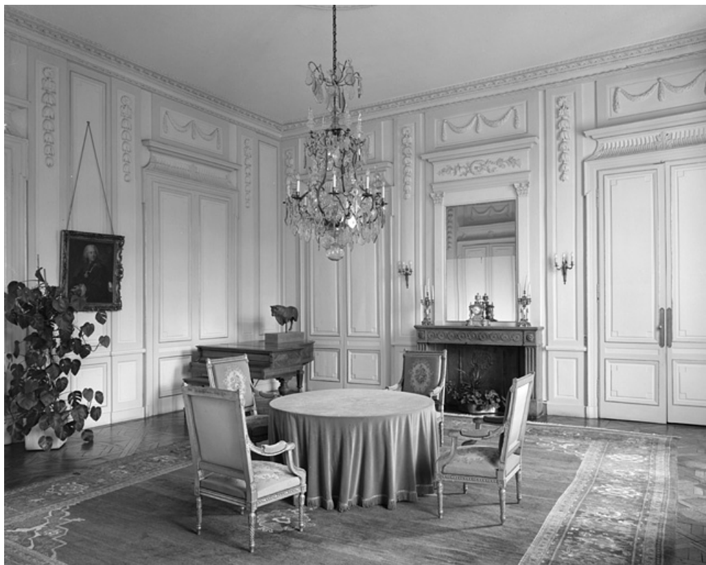
Intérieur : vue d'ensemble du salon d'audience.

25, Besançon, 8bis, 10 rue Charles Nodier, lieudit : îlot Préfecture