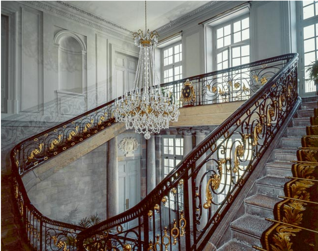
Intérieur : escalier d'honneur, vue d'ensemble.

25, Besançon, 8bis, 10 rue Charles Nodier, lieudit : îlot Préfecture