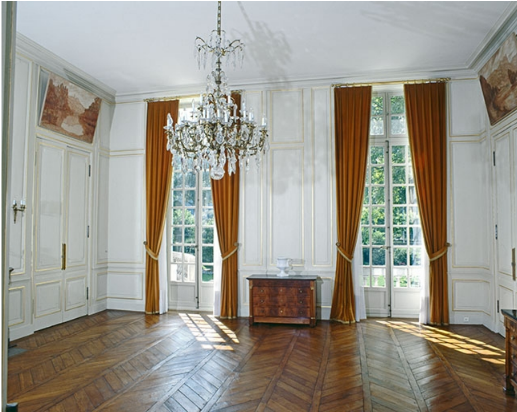
Intérieur : le salon d'attente, vue d'ensemble.

25, Besançon, 8bis, 10 rue Charles Nodier, lieudit : îlot Préfecture