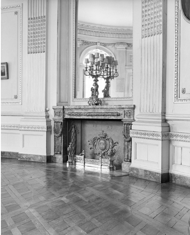
Salon de la rotonde : vue de la cheminée.

25, Besançon, 8bis, 10 rue Charles Nodier, lieudit : îlot Préfecture