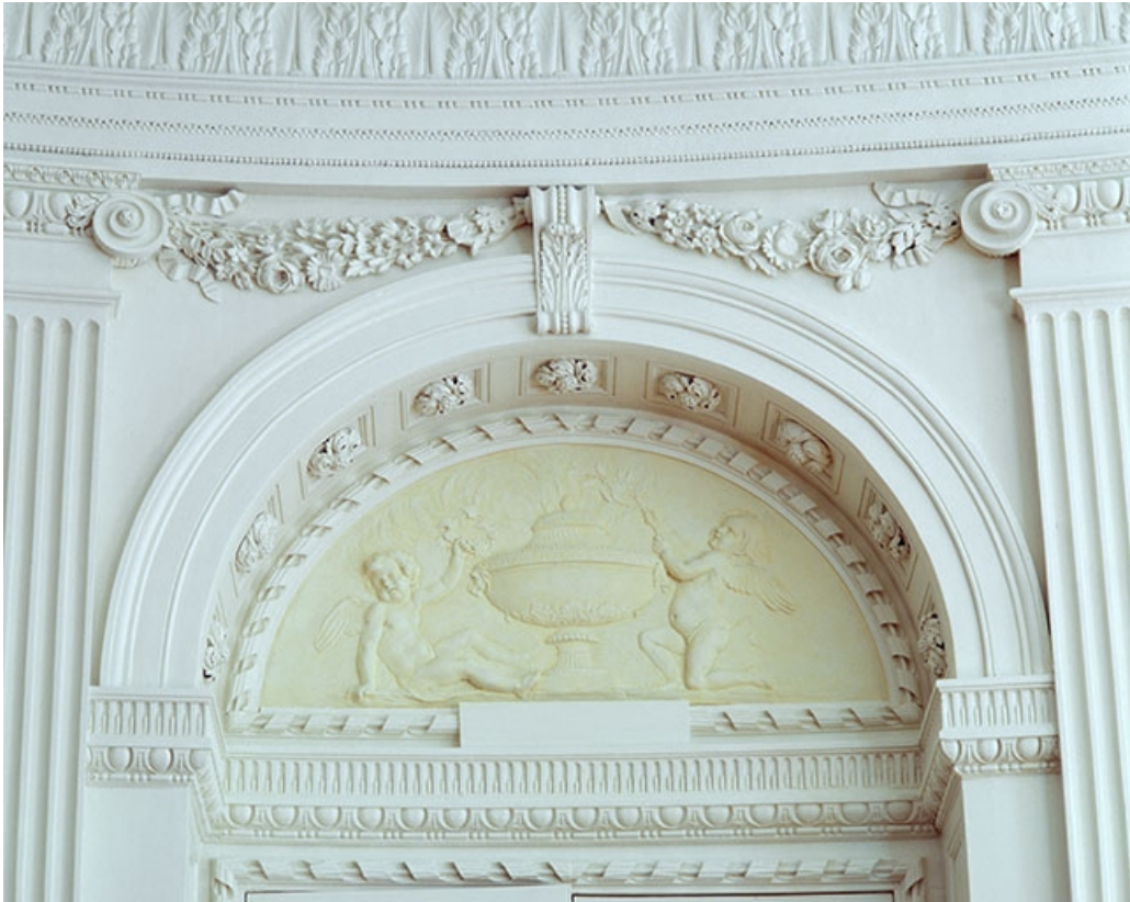
Intérieur : le salon ovale, détail d'un dessus de porte.

25, Besançon, 8bis, 10 rue Charles Nodier, lieudit : îlot Préfecture