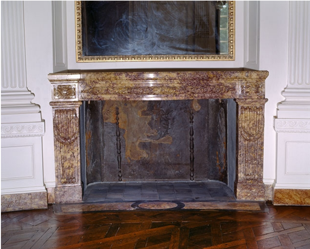
Intérieur : le salon ovale, cheminée de face.

25, Besançon, 8bis, 10 rue Charles Nodier, lieudit : îlot Préfecture