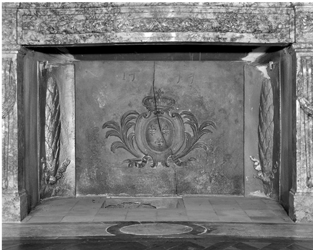
Intérieur : le salon ovale, détail d'une plaque de cheminée.

25, Besançon, 8bis, 10 rue Charles Nodier, lieudit : îlot Préfecture