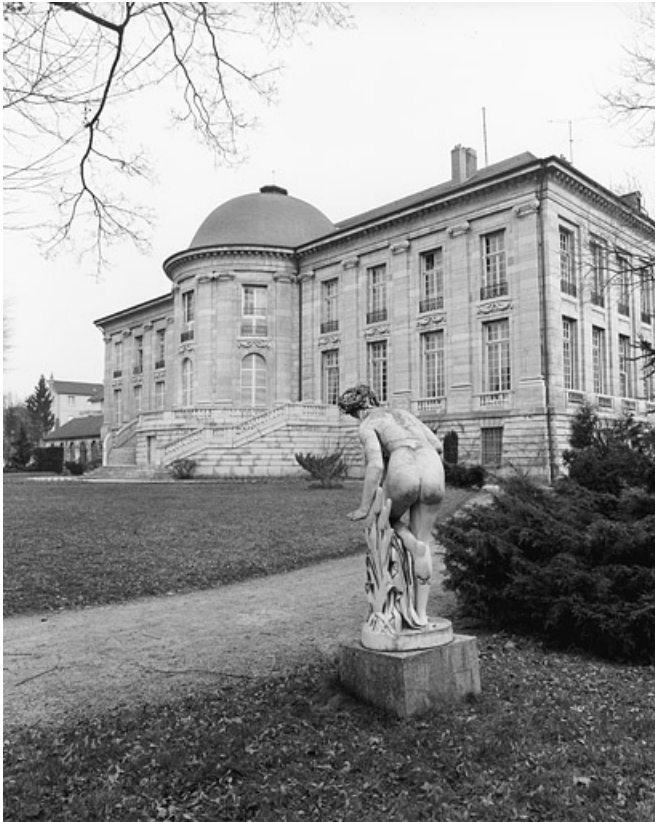
Façade postérieure, de trois quarts droit, avec une statue du parc.

25, Besançon, 8bis, 10 rue Charles Nodier, lieudit : îlot Préfecture