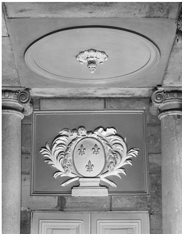
Intérieur, vestibule de l'escalier : détail d'un dessus de porte. 25, Besançon, 8bis, 10 rue Charles Nodier, lieudit : îlot Préfecture