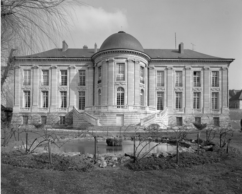
Façade postérieure, de face.

25, Besançon, 8bis, 10 rue Charles Nodier, lieudit : îlot Préfecture