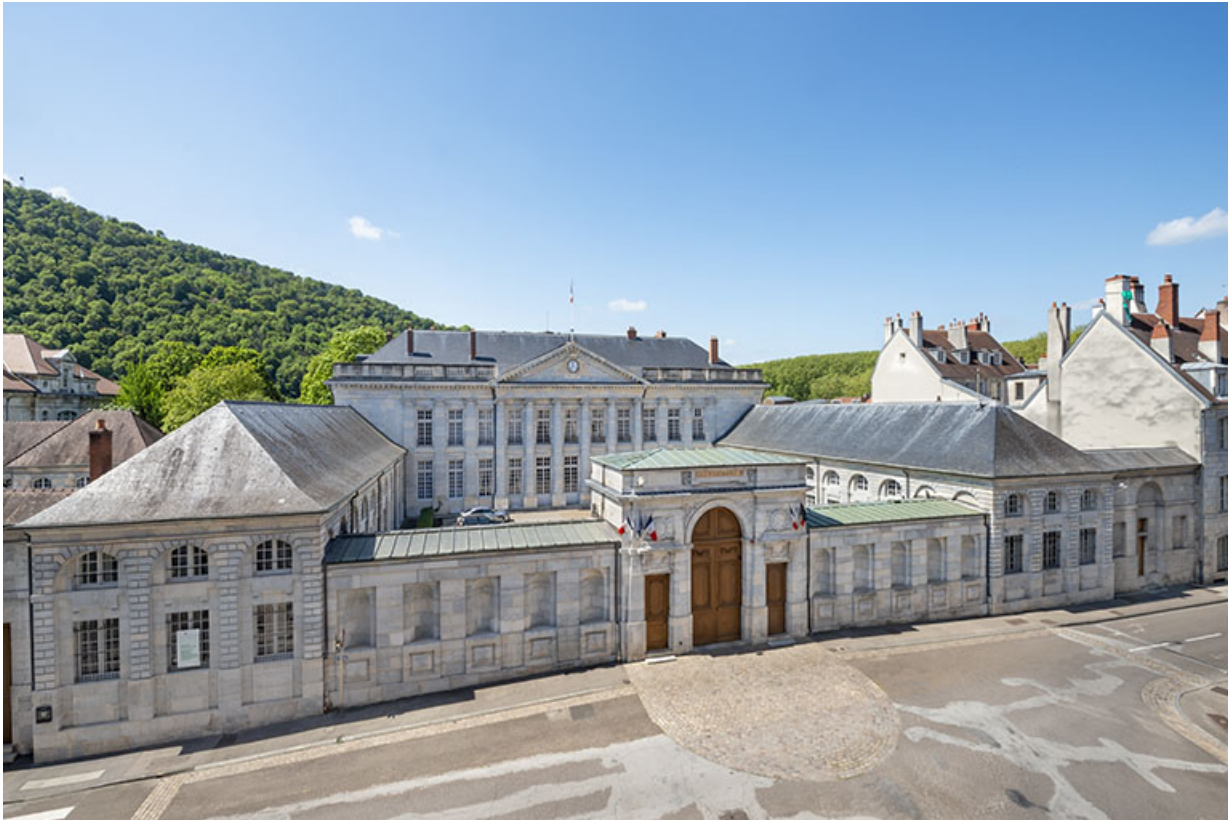
Vue d'ensemble depuis une fenêtre du 9 bis.

25, Besançon, 8bis, 10 rue Charles Nodier, lieudit : îlot Préfecture