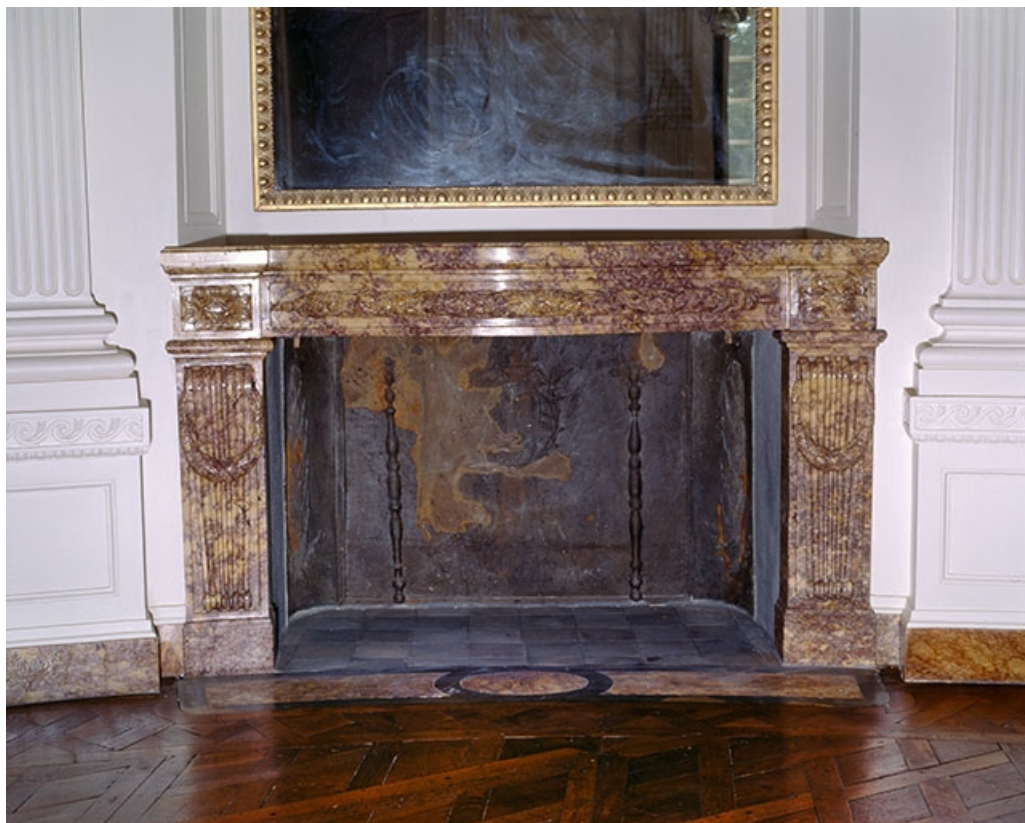
Intérieur : le salon ovale, cheminée de face.

25, Besançon, 8bis, 10 rue Charles Nodier, lieudit : îlot Préfecture