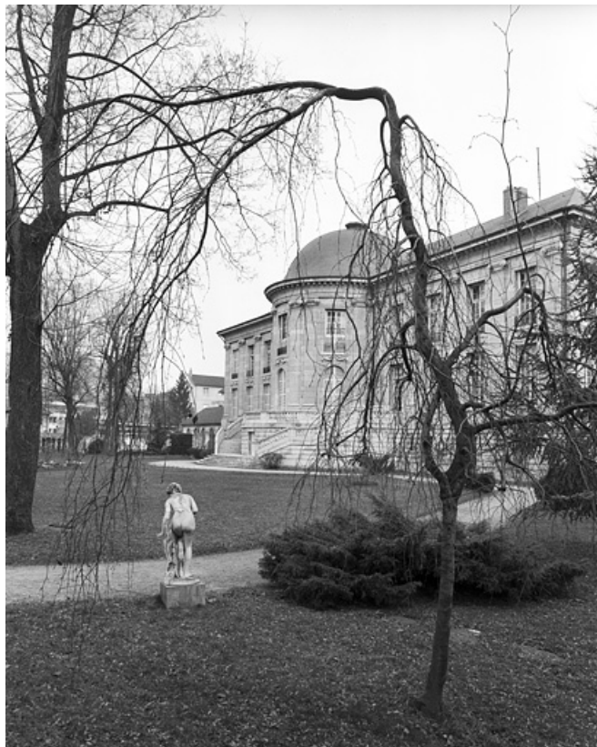
Façade postérieure, de trois quarts droit, avec une statue du parc : vue éloignée. 25, Besançon, 8bis, 10 rue Charles Nodier, lieudit : îlot Préfecture