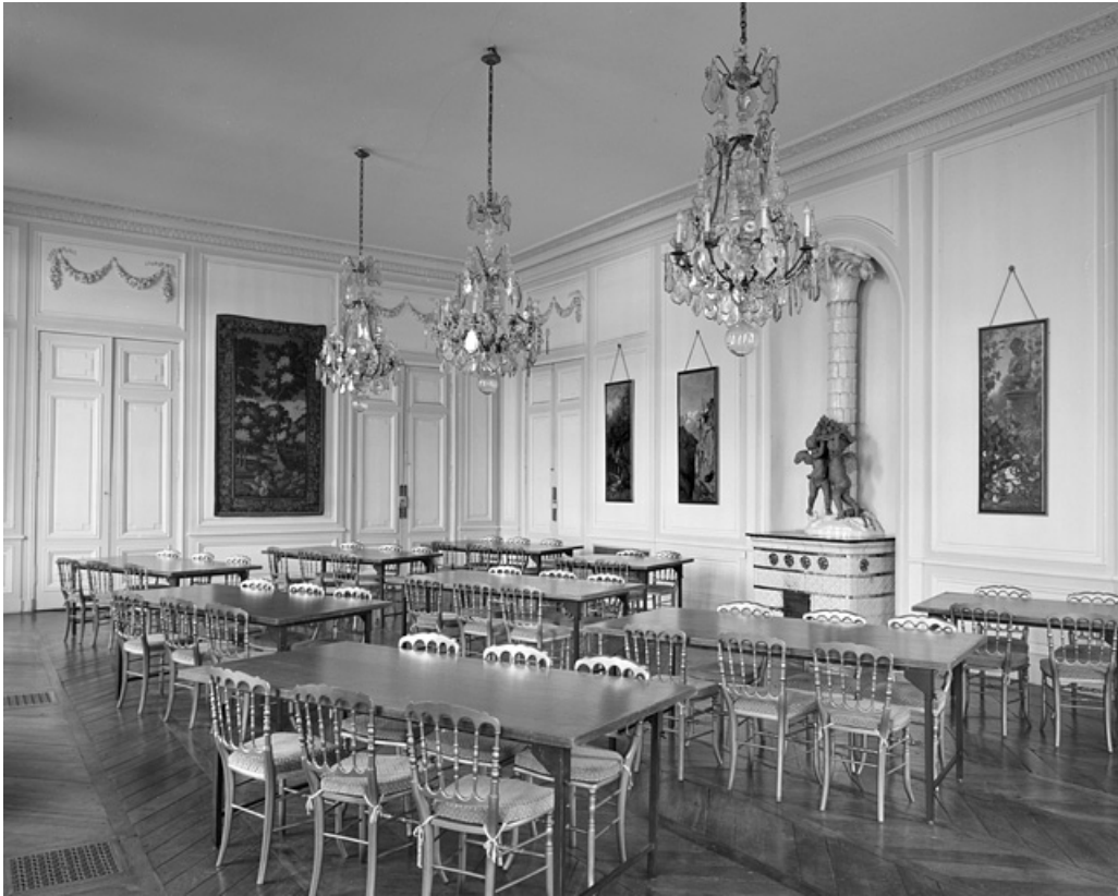
Intérieur : vue d'ensemble de la salle à manger.

25, Besançon, 8bis, 10 rue Charles Nodier, lieudit : îlot Préfecture