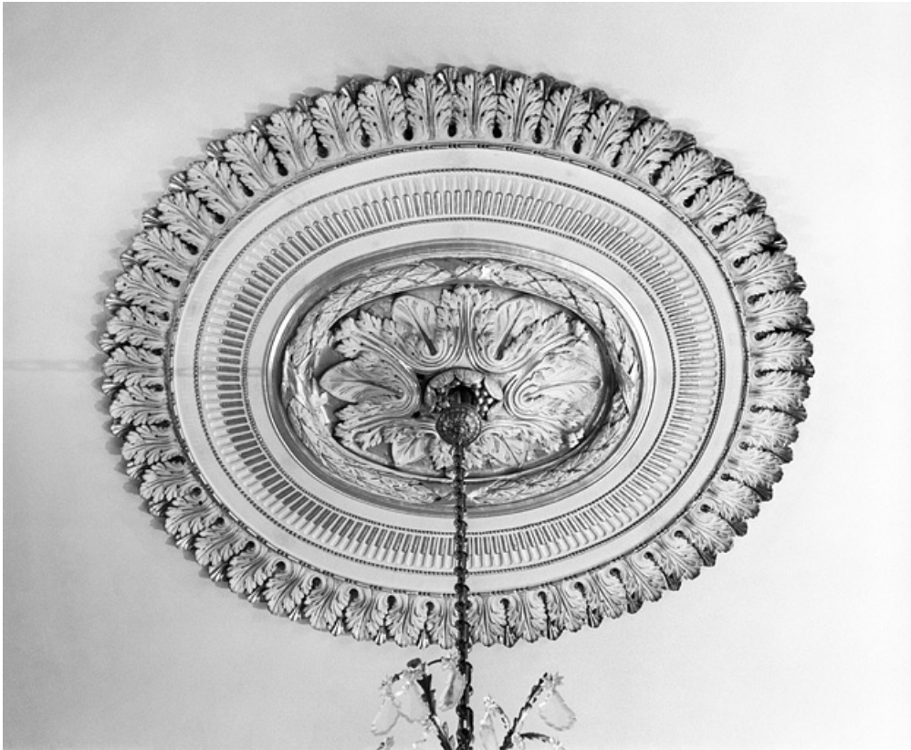
Salon de la rotonde : rosace du lustre.

25, Besançon, 8bis, 10 rue Charles Nodier, lieudit : îlot Préfecture