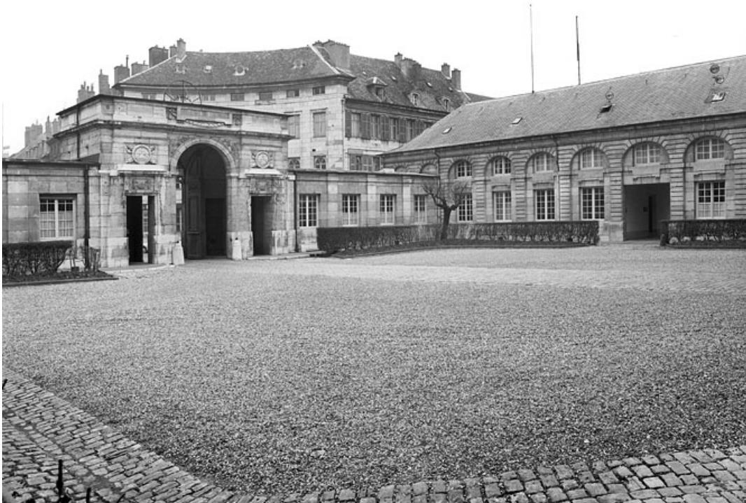
Vue de la cour de trois quarts gauche.

25, Besançon, 8bis, 10 rue Charles Nodier, lieudit : îlot Préfecture