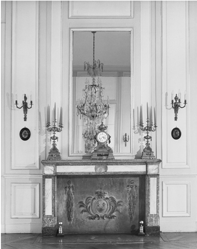
Intérieur, salon de compagnie : détail de la cheminée.

25, Besançon, 8bis, 10 rue Charles Nodier, lieudit : îlot Préfecture