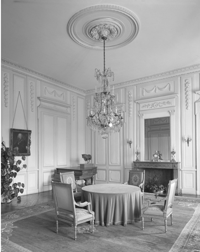
Intérieur, salon d'audience : vue d'angle.

25, Besançon, 8bis, 10 rue Charles Nodier, lieudit : îlot Préfecture