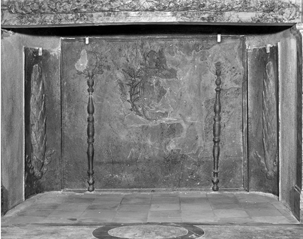
Intérieur : le salon ovale, détail d'une plaque de cheminée.

25, Besançon, 8bis, 10 rue Charles Nodier, lieudit : îlot Préfecture