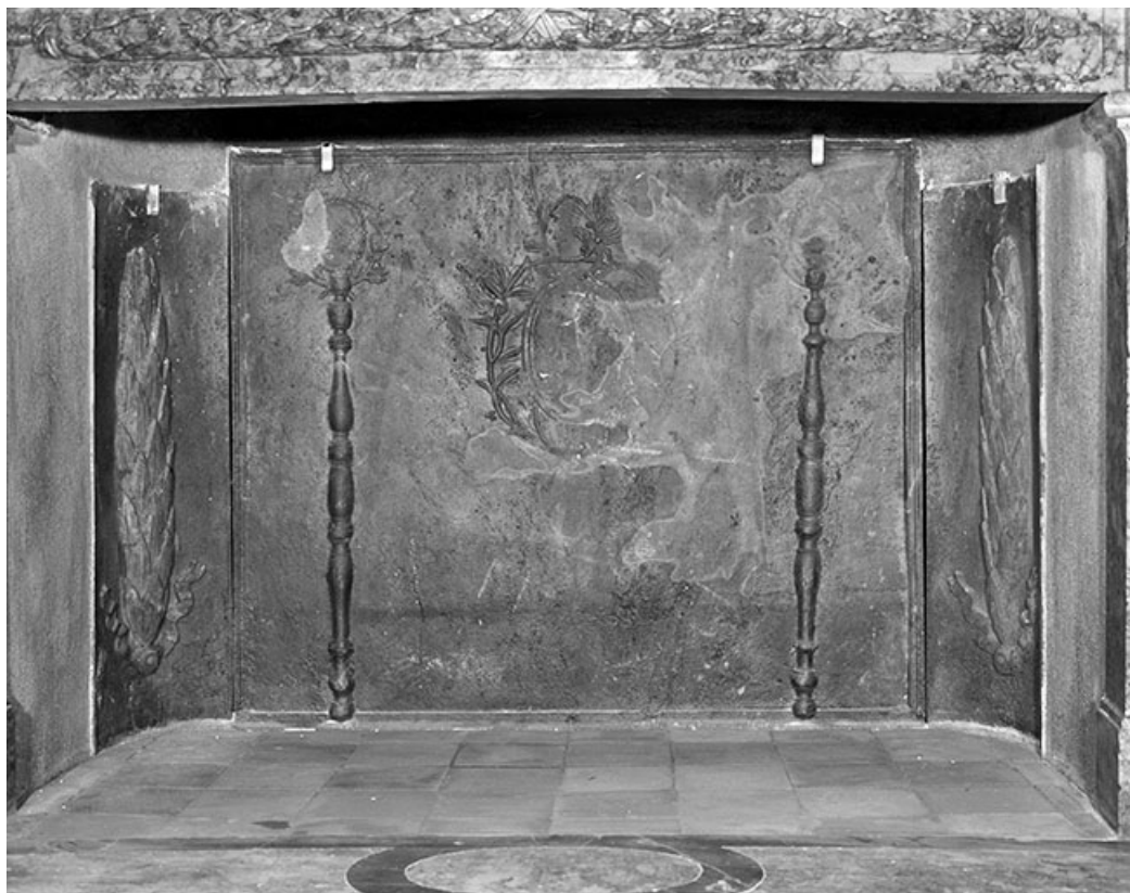
Intérieur : le salon ovale, détail d'une plaque de cheminée.

25, Besançon, 8bis, 10 rue Charles Nodier, lieudit : îlot Préfecture