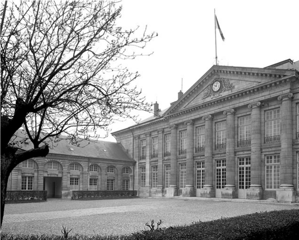
Façade antérieure, de trois quarts droit.

25, Besançon, 8bis, 10 rue Charles Nodier, lieudit : îlot Préfecture