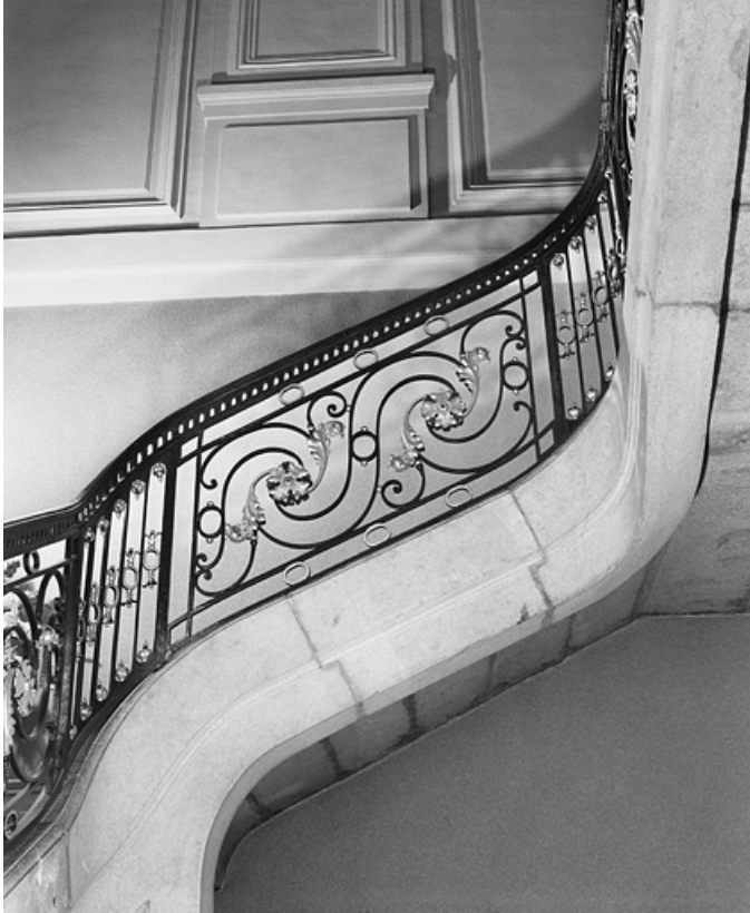
Intérieur, escalier : détail de la rampe en ferronnerie.

25, Besançon, 8bis, 10 rue Charles Nodier, lieudit : îlot Préfecture