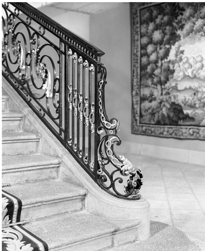
Intérieur, escalier : détail du départ de la rampe en ferronnerie. 25, Besançon, 8bis, 10 rue Charles Nodier, lieudit : îlot Préfecture