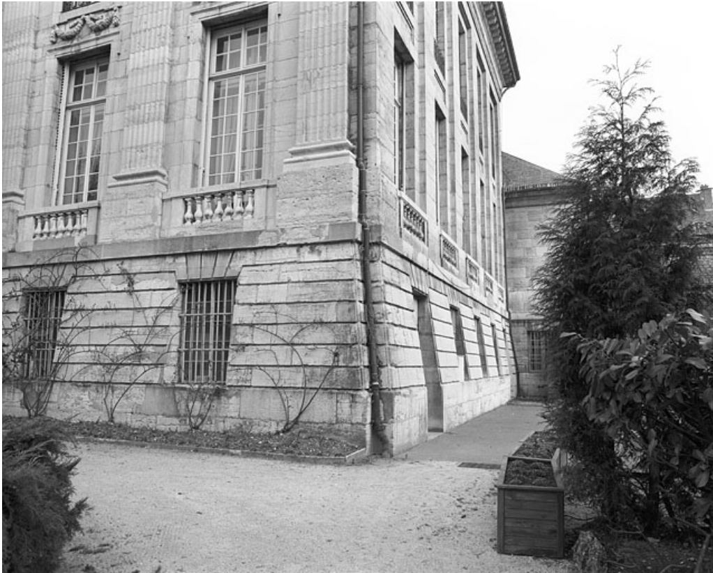
Façade postérieure : détail du soubassement de l'angle droit.

25, Besançon, 8bis, 10 rue Charles Nodier, lieudit : îlot Préfecture