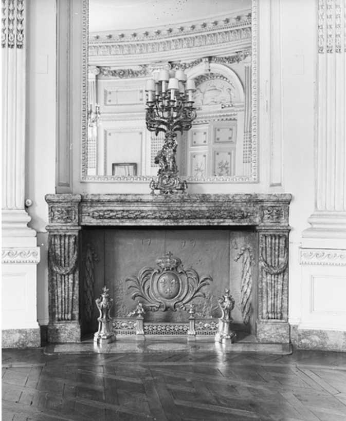
Salon de la rotonde : la cheminée vue de face.

25, Besançon, 8bis, 10 rue Charles Nodier, lieudit : îlot Préfecture