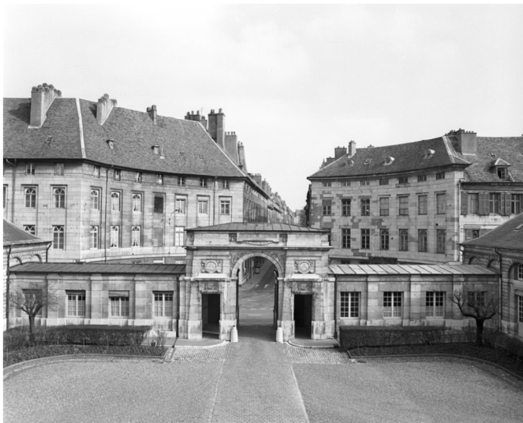
Vue du portail d'entrée depuis l'intérieur de la cour.

25, Besançon, 8bis, 10 rue Charles Nodier, lieudit : îlot Préfecture