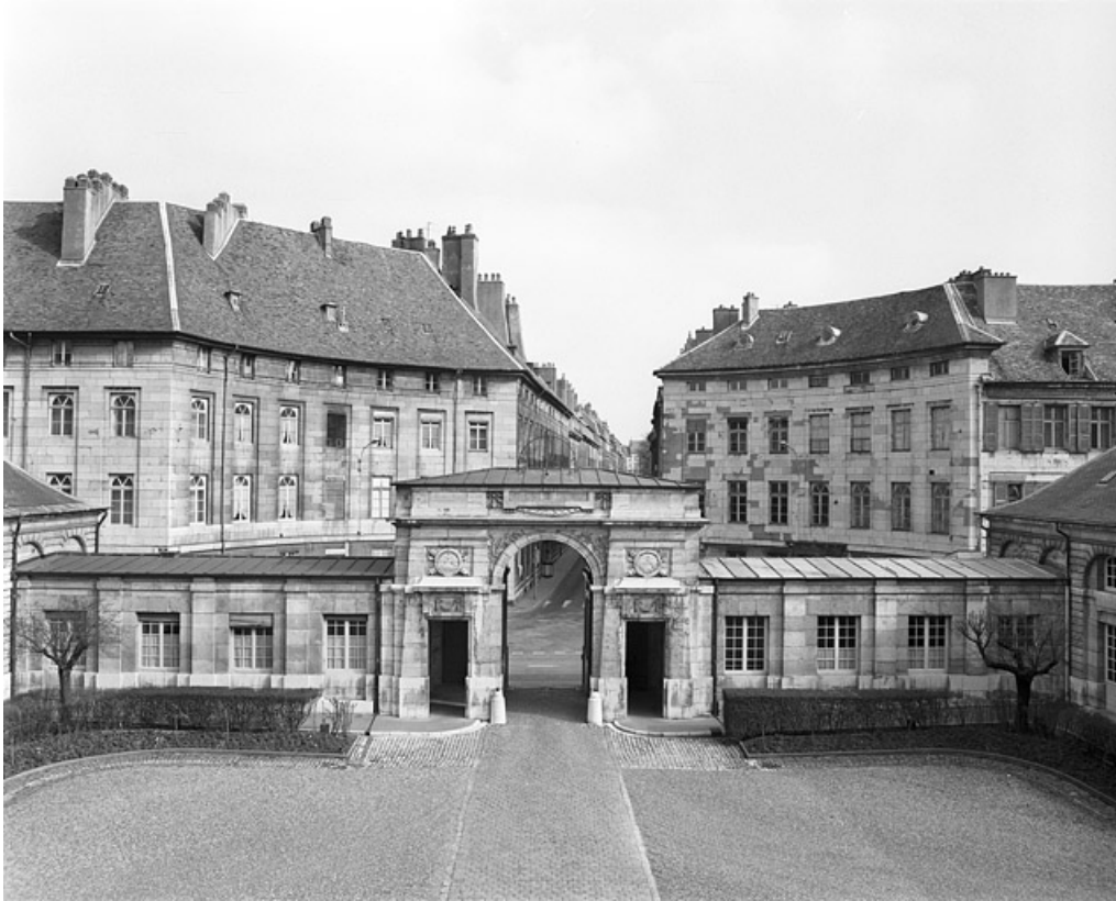
Vue du portail d'entrée depuis l'intérieur de la cour.

25, Besançon, 8bis, 10 rue Charles Nodier, lieudit : îlot Préfecture