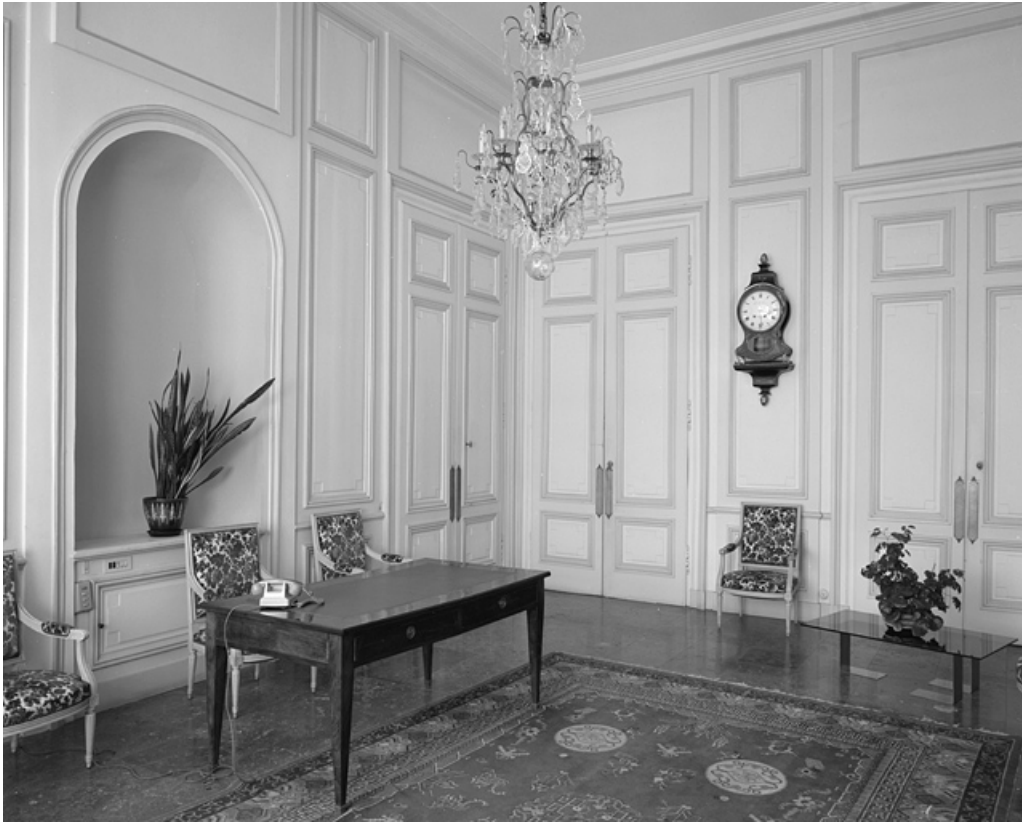
Intérieur : vue d'ensemble d'un salon.

25, Besançon, 8bis, 10 rue Charles Nodier, lieudit : îlot Préfecture