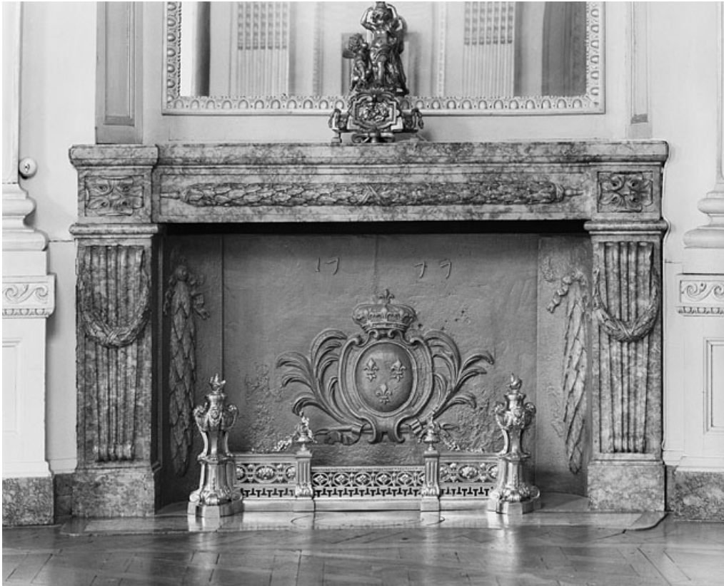
Salon de la rotonde : détail de la cheminée.

25, Besançon, 8bis, 10 rue Charles Nodier, lieudit : îlot Préfecture