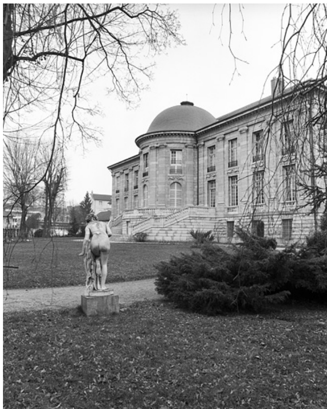
Façade postérieure, de trois quarts droit, avec une statue du parc.

25, Besançon, 8bis, 10 rue Charles Nodier, lieudit : îlot Préfecture