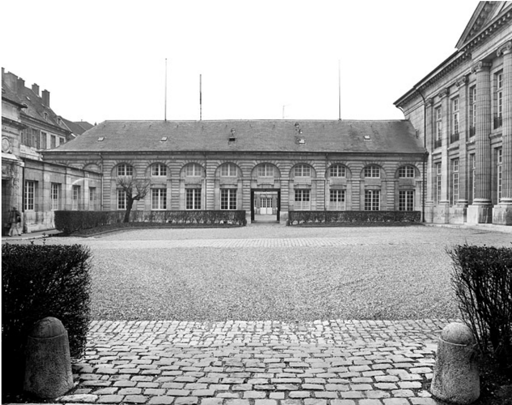
Vue de l'aile gauche sur cour, de face.

25, Besançon, 8bis, 10 rue Charles Nodier, lieudit : îlot Préfecture