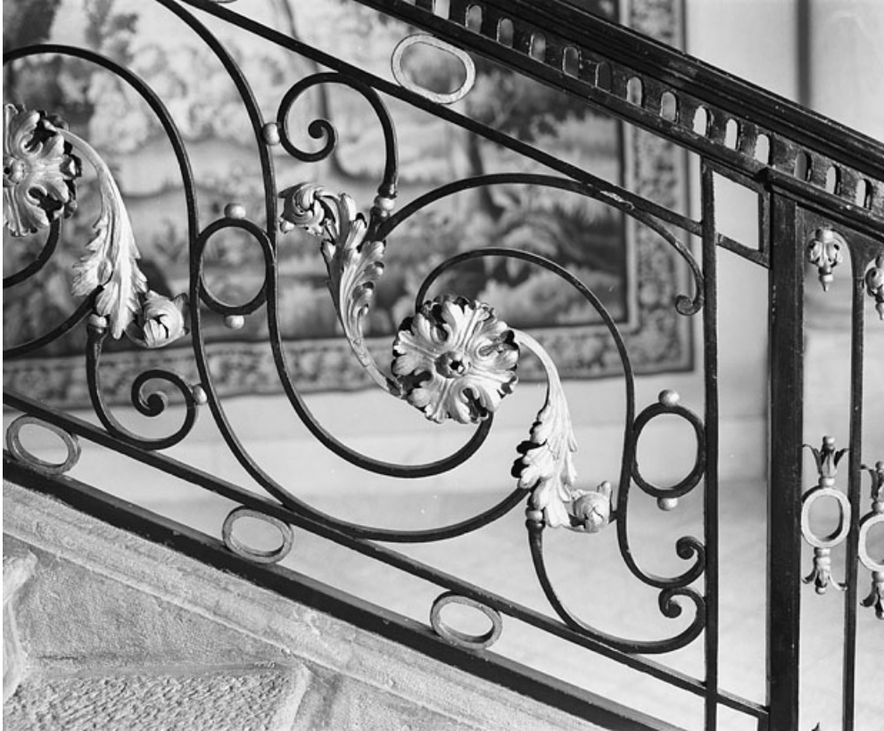
Intérieur, escalier : détail des motifs de la rampe en ferronnerie : vue rapprochée.

25, Besançon, 8bis, 10 rue Charles Nodier, lieudit : îlot Préfecture