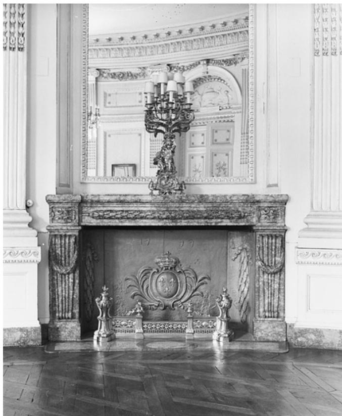
Salon de la rotonde : la cheminée vue de face.

25, Besançon, 8bis, 10 rue Charles Nodier, lieu dit : îlot Préfecture