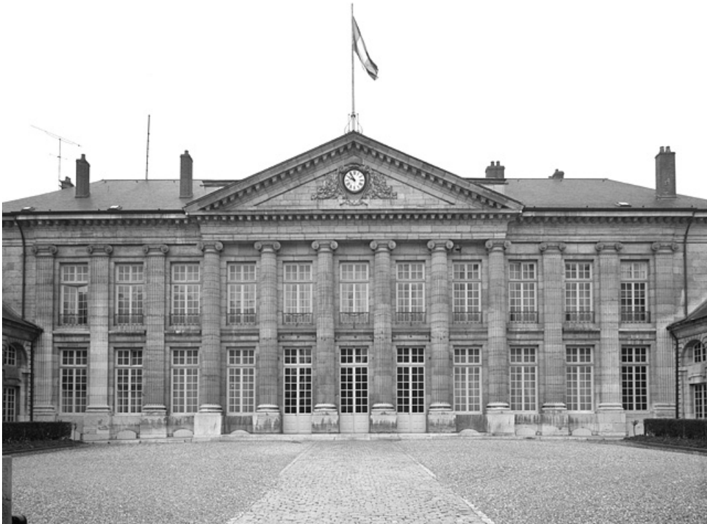
Façade antérieure, de face.

25, Besançon, 8bis, 10 rue Charles Nodier, lieudit : îlot Préfecture