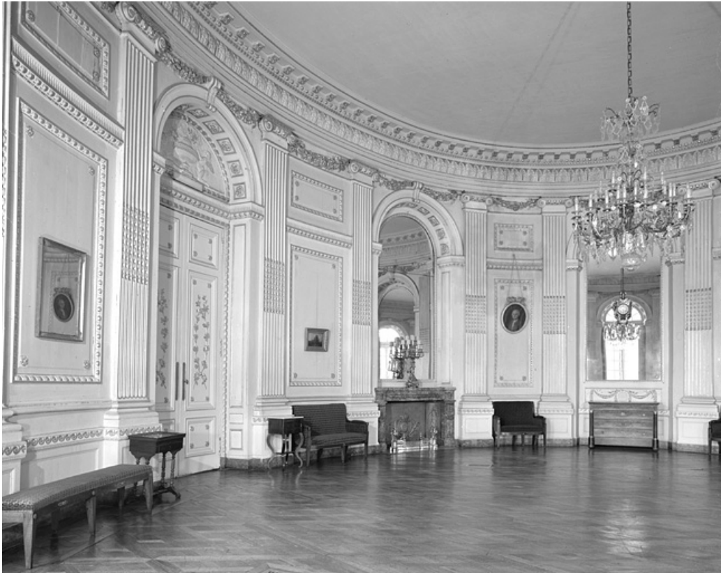
Intérieur, grand salon de la rotonde : vue partielle.

25, Besançon, 8bis, 10 rue Charles Nodier, lieudit : îlot Préfecture