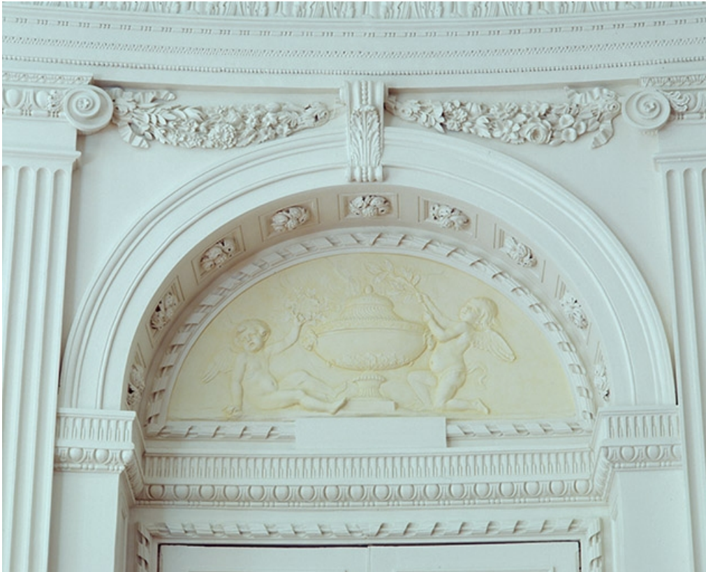
Intérieur : le salon ovale, détail d'un dessus de porte.

25, Besançon, 8bis, 10 rue Charles Nodier, lieudit : îlot Préfecture