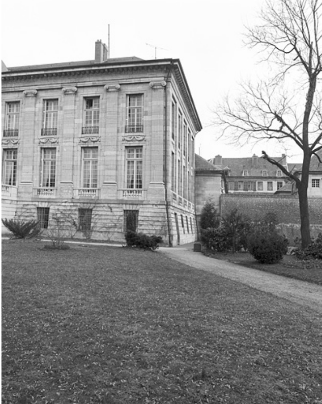
Façade postérieure : détail partie droite.

25, Besançon, 8bis, 10 rue Charles Nodier, lieudit : îlot Préfecture