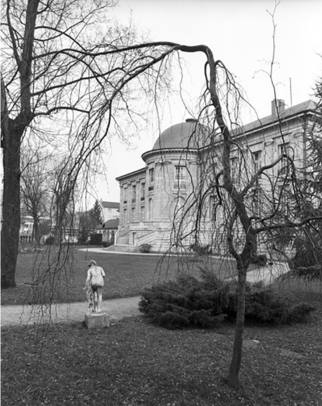
Façade postérieure, de trois quarts droit, avec une statue du parc : vue éloignée.

25, Besançon, 8bis, 10 rue Charles Nodier, lieudit : îlot Préfecture