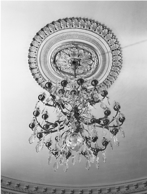
Salon de la rotonde : lustre.

25, Besançon, 8bis, 10 rue Charles Nodier, lieudit : îlot Préfecture