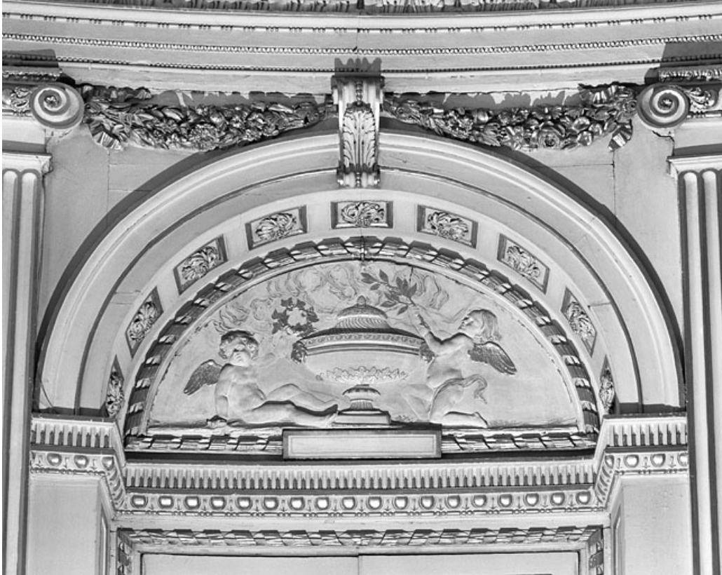
Salon de la rotonde : tympan de porte.

25, Besançon, 8bis, 10 rue Charles Nodier, lieudit : îlot Préfecture