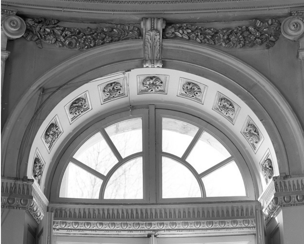
Salon de la rotonde : partie supérieure d'une fenêtre.

25, Besançon, 8bis, 10 rue Charles Nodier, lieudit : îlot Préfecture