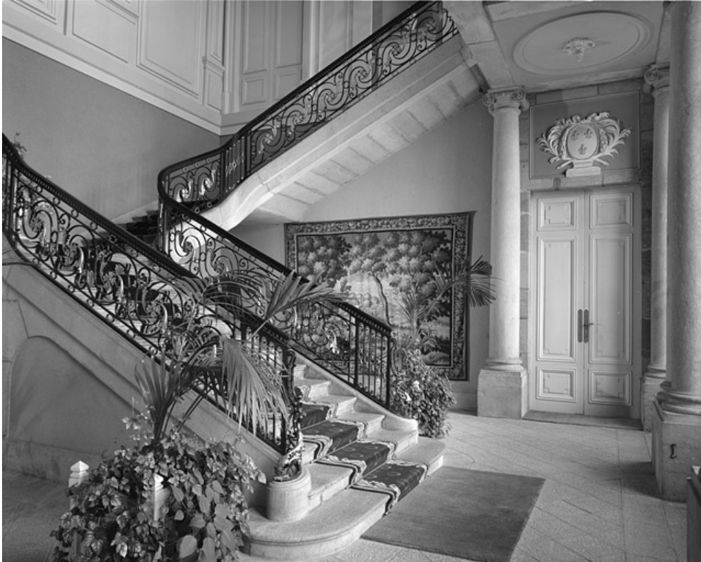
Intérieur, escalier : vue d'ensemble de trois quarts gauche.

25, Besançon, 8bis, 10 rue Charles Nodier, lieudit : îlot Préfecture