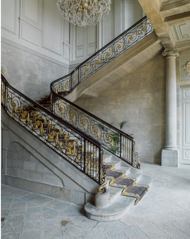
Intérieur : escalier d'honneur, de trois quarts gauche.

25, Besançon, 8bis, 10 rue Charles Nodier, lieudit : îlot Préfecture