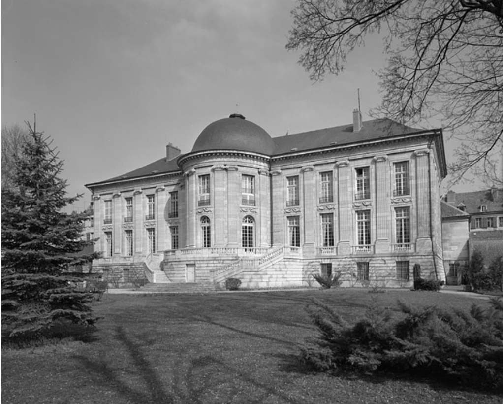
Façade postérieure, de trois quarts droit.

25, Besançon, 8bis, 10 rue Charles Nodier, lieudit : îlot Préfecture