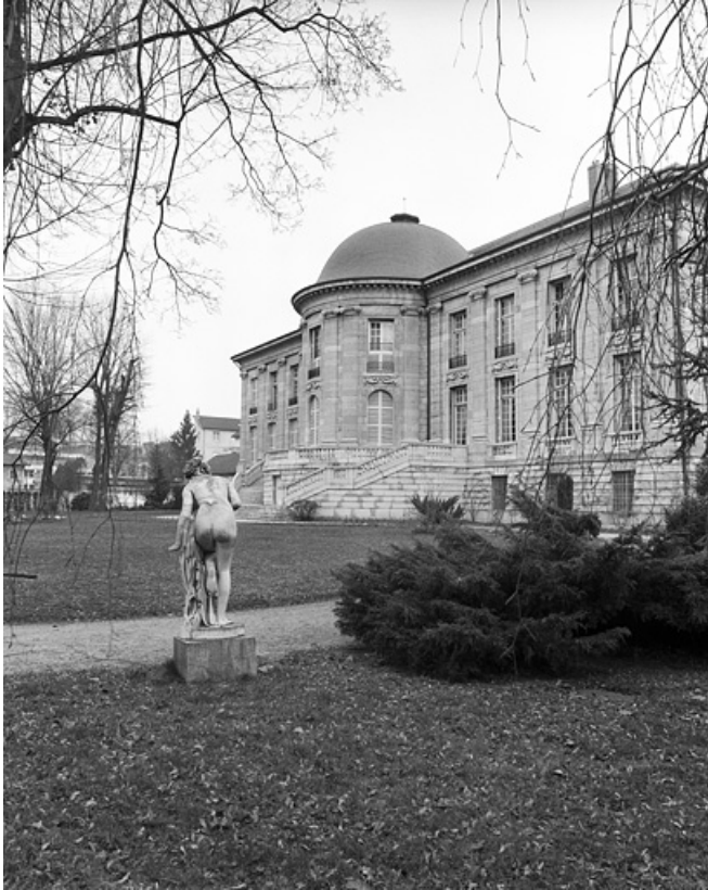
Façade postérieure, de trois quarts droit, avec une statue du parc.

25, Besançon, 8bis, 10 rue Charles Nodier, lieudit : îlot Préfecture