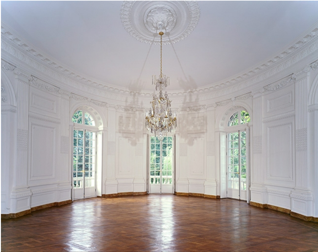
Intérieur : vue d'ensemble du salon ovale.

25, Besançon, 8bis, 10 rue Charles Nodier, lieudit : îlot Préfecture