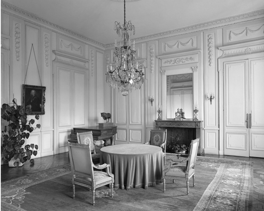
Intérieur : vue d'ensemble du salon d'audience.

25, Besançon, 8bis, 10 rue Charles Nodier, lieudit : îlot Préfecture