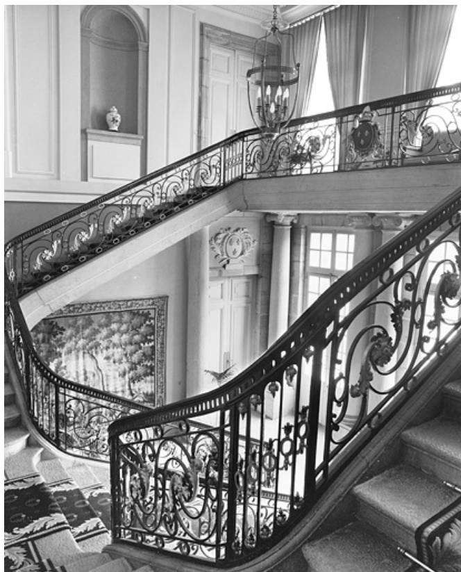
Intérieur : vue d'ensemble de l'escalier depuis le haut de la première volée. 25, Besançon, 8bis, 10 rue Charles Nodier, lieudit : îlot Préfecture