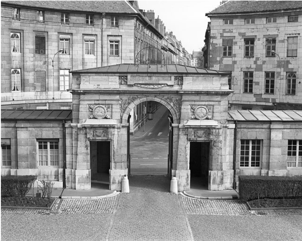
Vue du portail d'entrée depuis l'intérieur de la cour : vue rapprochée.

25, Besançon, 8bis, 10 rue Charles Nodier, lieudit : îlot Préfecture