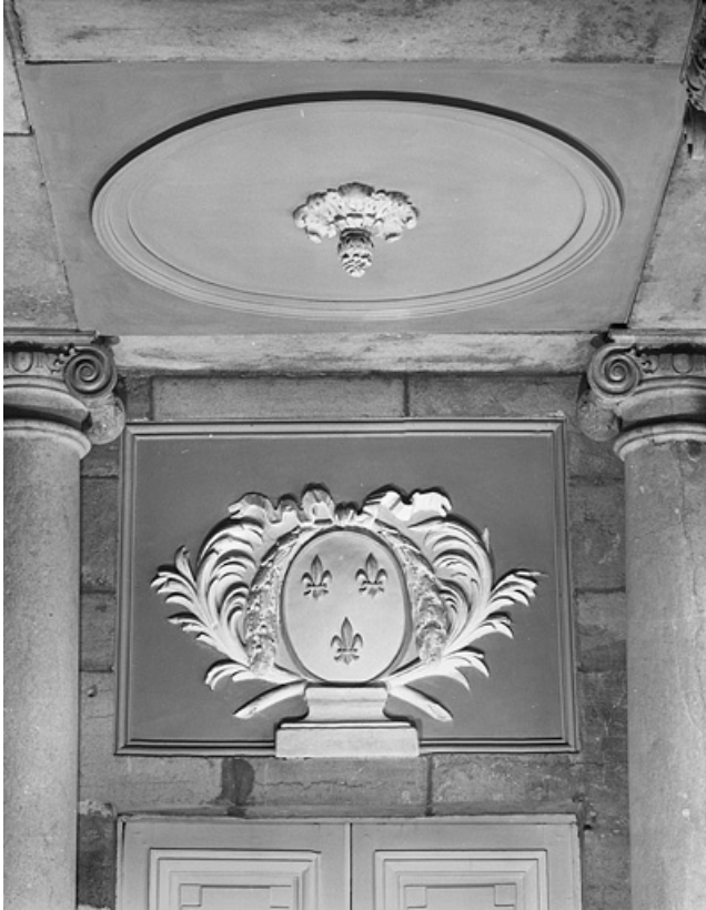
Intérieur, vestibule de l'escalier : détail d'un dessus de porte. 25, Besançon, 8bis, 10 rue Charles Nodier, lieudit : îlot Préfecture