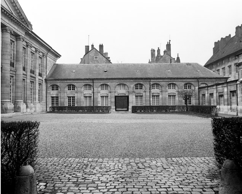
Vue de l'aile droite sur cour, de face.

25, Besançon, 8bis, 10 rue Charles Nodier, lieudit : îlot Préfecture