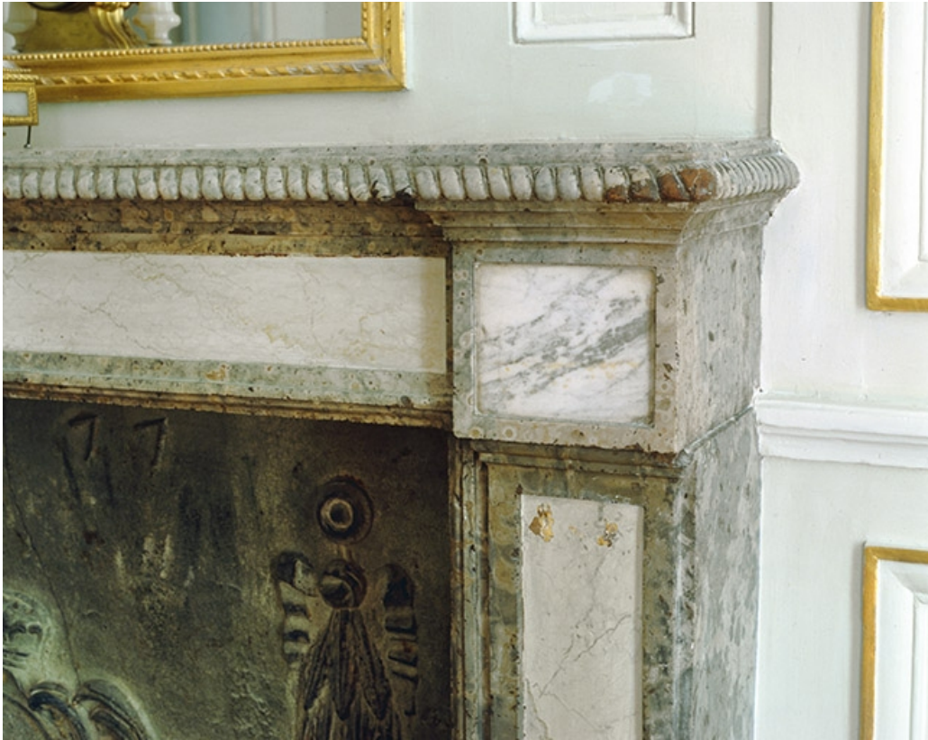
Intérieur : le salon d'attente, détail de l'angle de la cheminée.

25, Besançon, 8bis, 10 rue Charles Nodier, lieudit : îlot Préfecture