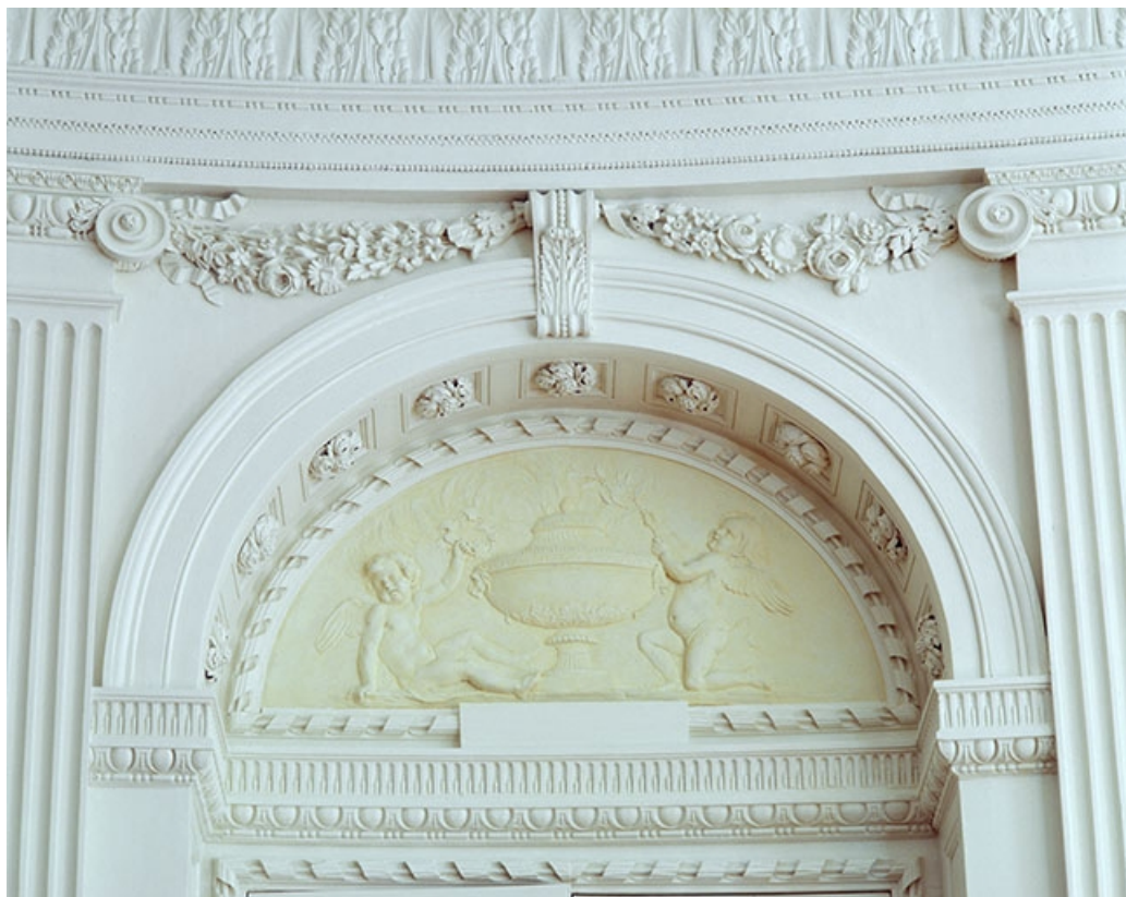
Intérieur : le salon ovale, détail d'un dessus de porte.

25, Besançon, 8bis, 10 rue Charles Nodier, lieudit : îlot Préfecture