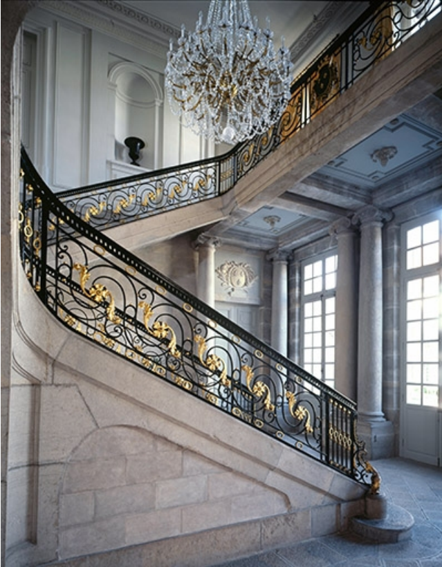
Intérieur : escalier d'honneur de profil.

25, Besançon, 8bis, 10 rue Charles Nodier, lieudit : îlot Préfecture