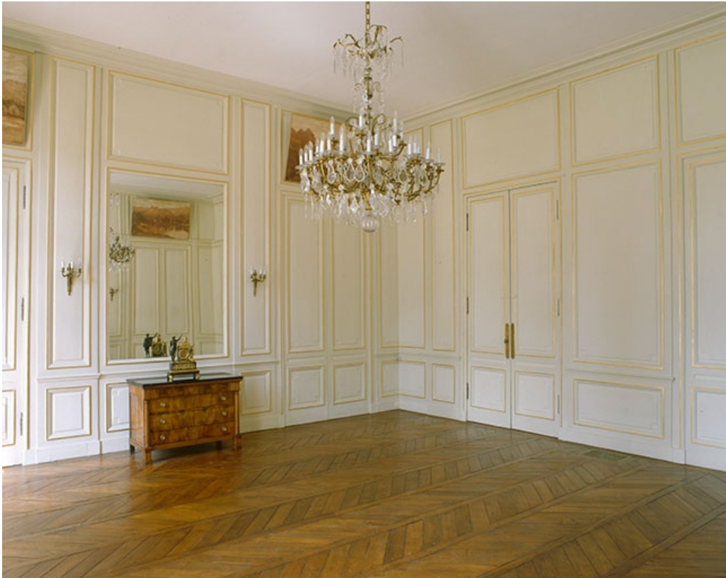
Intérieur : le salon d'attente, vue d'angle.

25, Besançon, 8bis, 10 rue Charles Nodier, lieudit : îlot Préfecture