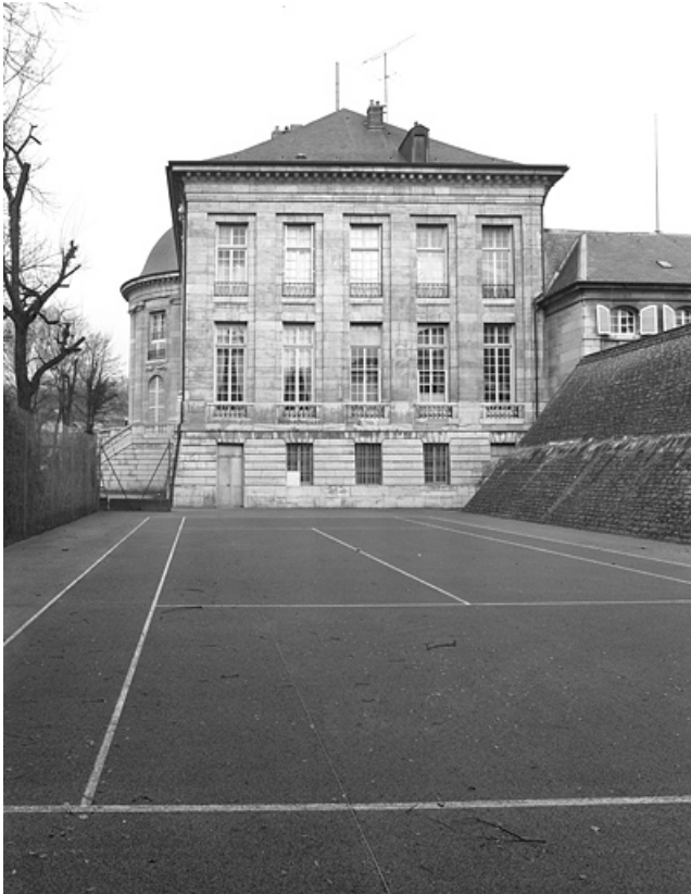
Façade latérale gauche : de face.

25, Besançon, 8bis, 10 rue Charles Nodier, lieudit : îlot Préfecture