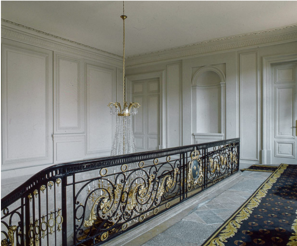
Intérieur : escalier d'honneur, vue du palier.

25, Besançon, 8bis, 10 rue Charles Nodier, lieudit : îlot Préfecture