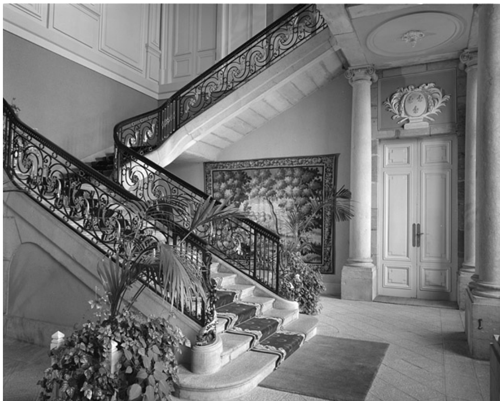
Intérieur, escalier : vue d'ensemble de trois quarts gauche.

25, Besançon, 8bis, 10 rue Charles Nodier, lieudit : îlot Préfecture