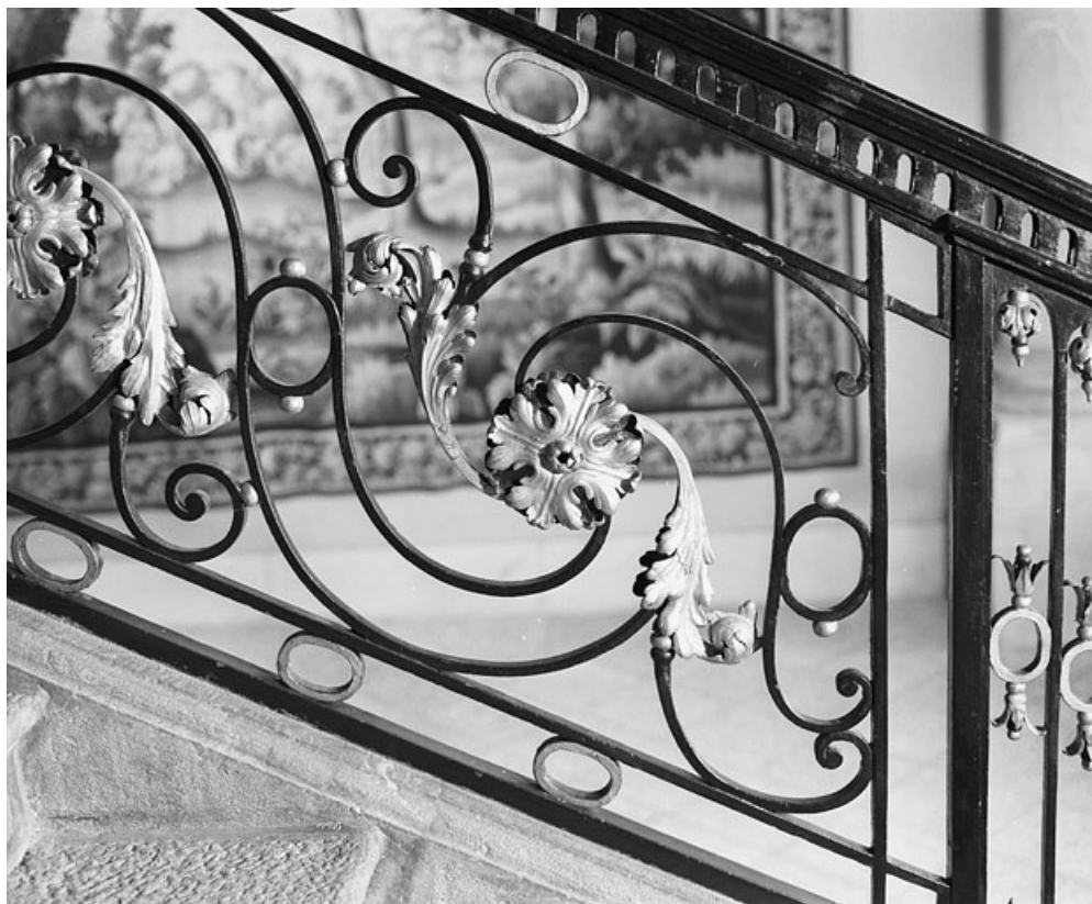
Intérieur, escalier : détail des motifs de la rampe en ferronnerie : vue rapprochée.

25, Besançon, 8bis, 10 rue Charles Nodier, lieudit : îlot Préfecture