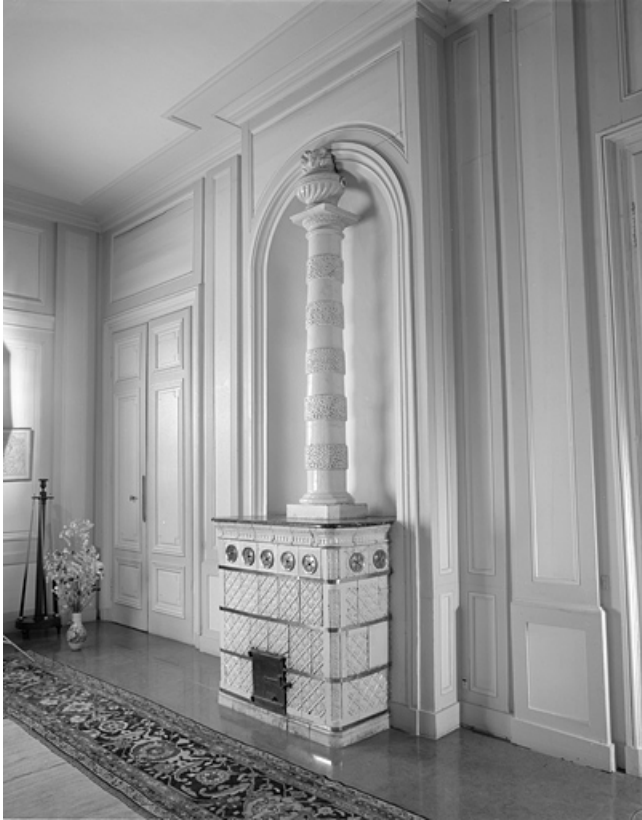
Intérieur, antichambre du billard : détail du poêle.

25, Besançon, 8bis, 10 rue Charles Nodier, lieudit : îlot Préfecture