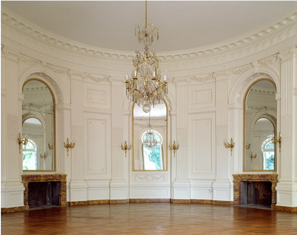
Intérieur : le salon ovale, vue des deux cheminées.

25, Besançon, 8bis, 10 rue Charles Nodier, lieudit : îlot Préfecture