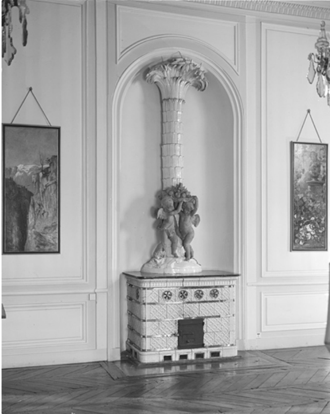
Intérieur, salle à manger : détail du poêle.

25, Besançon, 8bis, 10 rue Charles Nodier, lieudit : îlot Préfecture