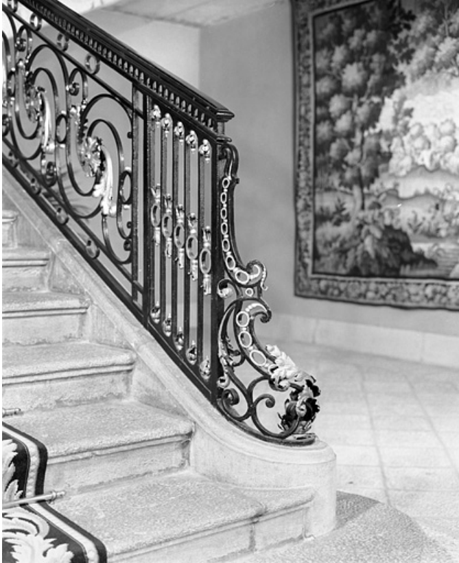
Intérieur, escalier : détail du départ de la rampe en ferronnerie. 25, Besançon, 8bis, 10 rue Charles Nodier, lieudit : îlot Préfecture