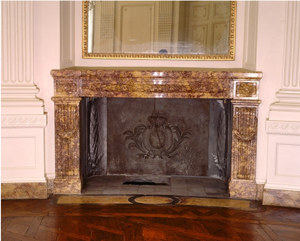
Intérieur : le salon ovale, cheminée de face.