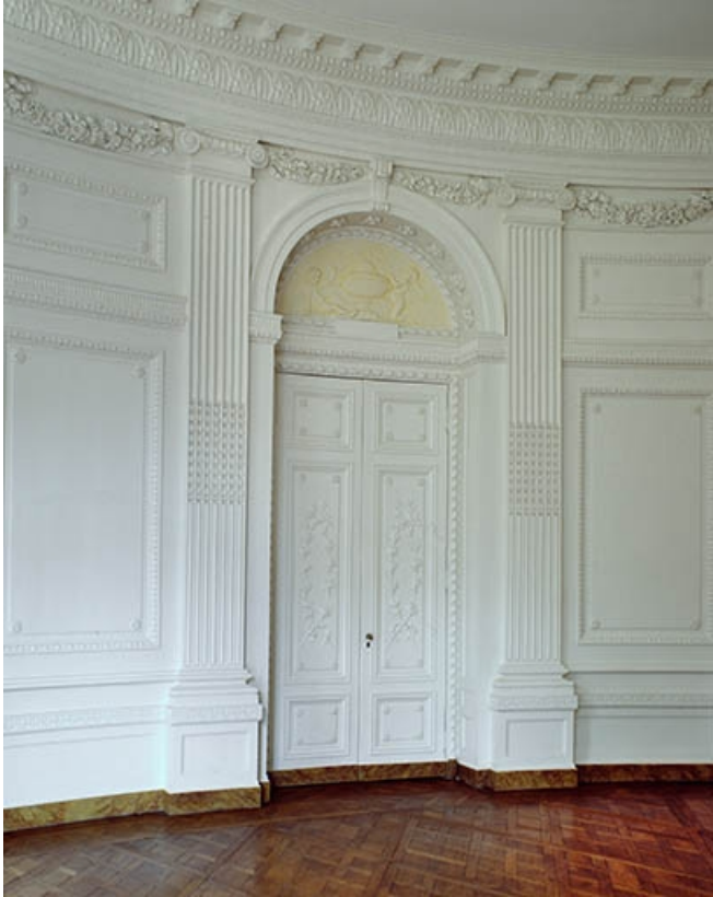
Intérieur : le salon ovale, détail des lambris.

25, Besançon, 8bis, 10 rue Charles Nodier, lieudit : îlot Préfecture