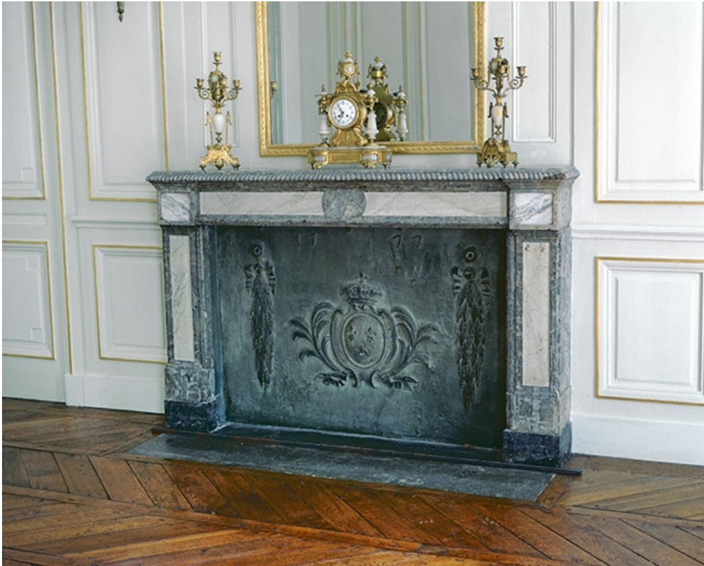
Intérieur : le salon d'attente, détail de la cheminée.

25, Besançon, 8bis, 10 rue Charles Nodier, lieudit : îlot Préfecture