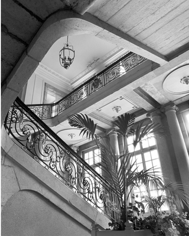
Intérieur, escalier : vue d'ensemble de la rampe en ferronnerie depuis le rez-de-chaussée, vue de profil. 25, Besançon, 8bis, 10 rue Charles Nodier, lieudit : îlot Préfecture