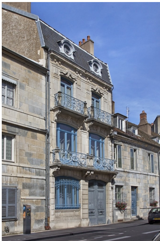
Deuxième logis secondaire : vue d'ensemble depuis la rue, de trois quarts gauche.

25, Besançon, 25 rue Charles Nodier, lieudit : îlot Lecourbe