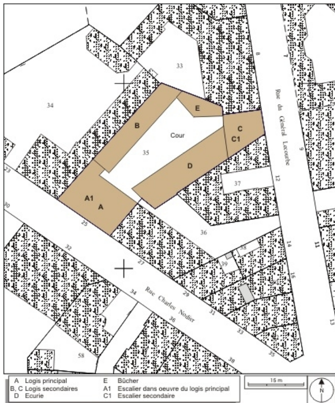
Plan masse et de situation. Extrait du plan cadastral, 1974, section AP. 25, Besançon, 25 rue Charles Nodier, lieudit : îlot Lecourbe