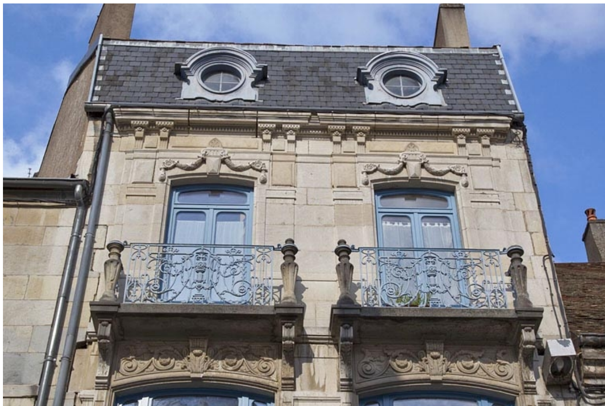
Deuxième logis secondaire, façade sur rue : vue du deuxième étage, de face.

25, Besançon, 25 rue Charles Nodier, lieudit : îlot Lecourbe