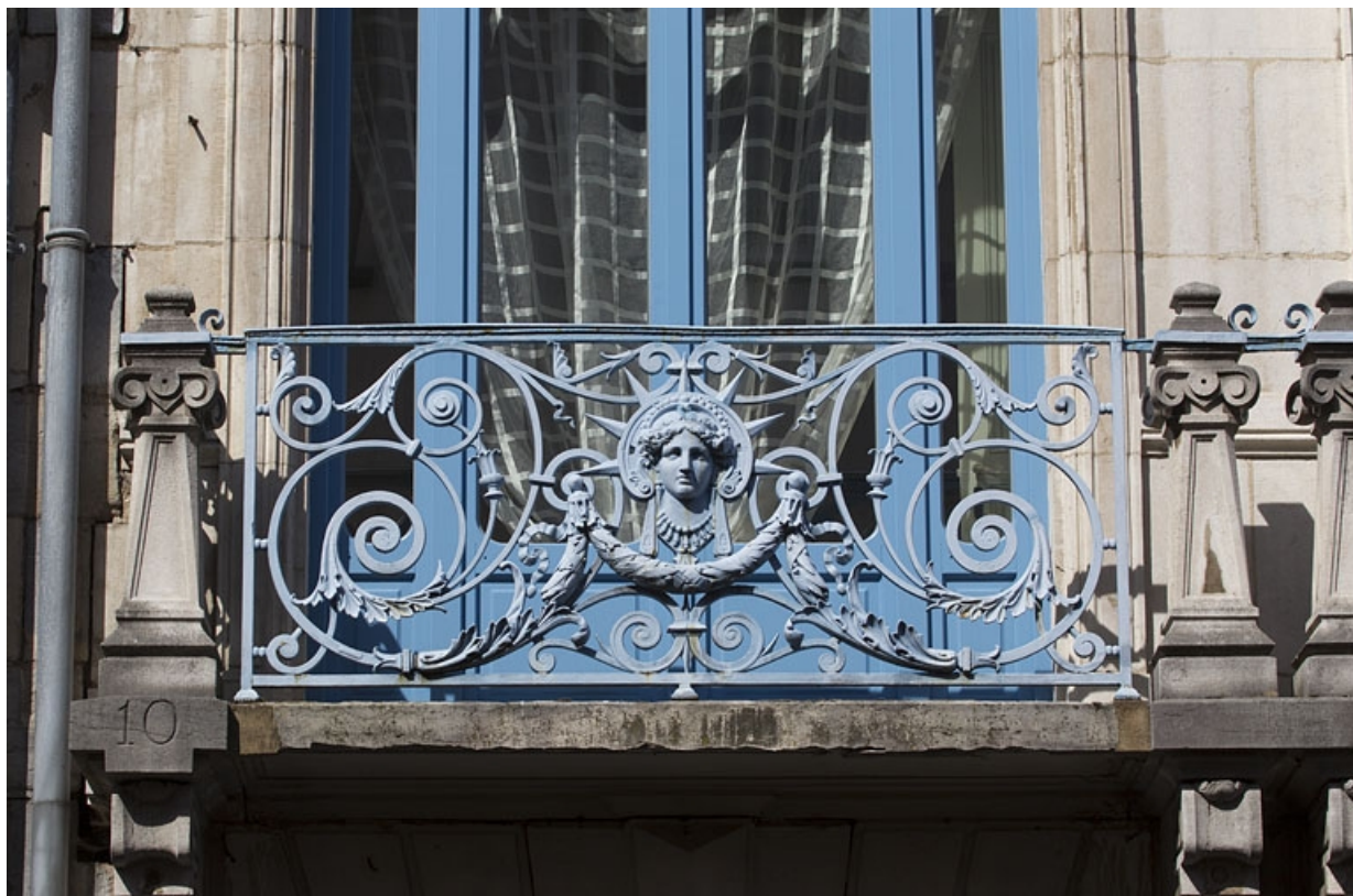
Deuxième logis secondaire, balcons du premier étage : détail d'un garde-corps.

25, Besançon, 25 rue Charles Nodier, lieudit : îlot Lecourbe