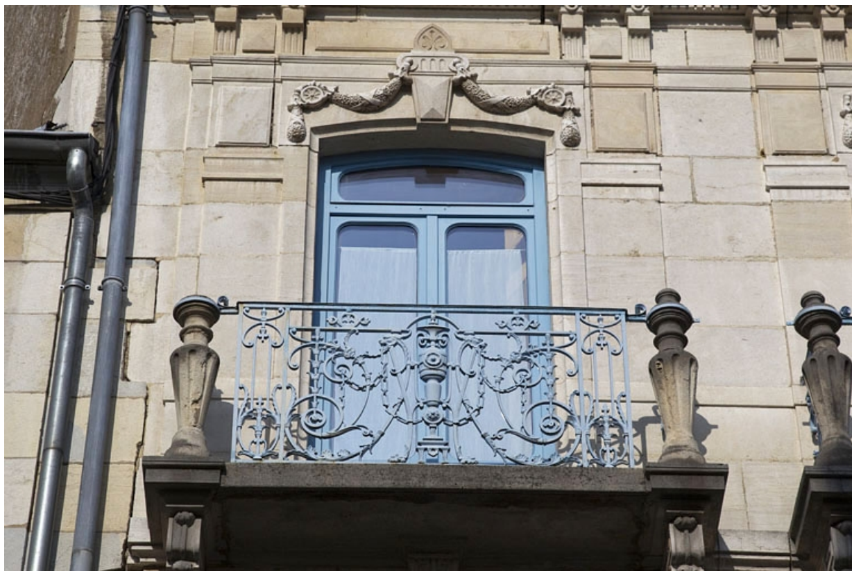
Deuxième logis secondaire, façade sur rue, deuxième étage : détail du balcon gauche.

25, Besançon, 25 rue Charles Nodier, lieudit : îlot Lecourbe