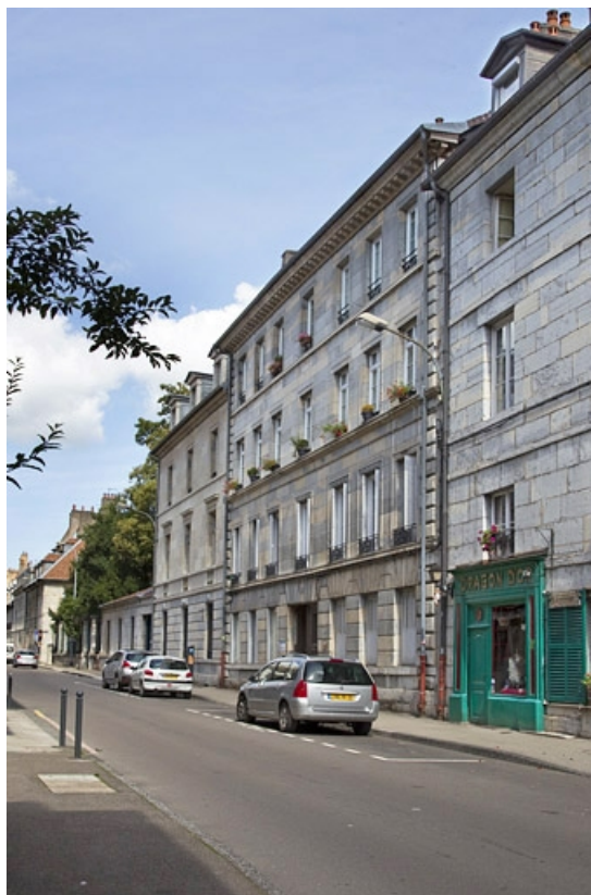
Logis principal : vue d'ensemble depuis la rue, de trois quarts droit. 25, Besançon, 25 rue Charles Nodier, lieudit : îlot Lecourbe