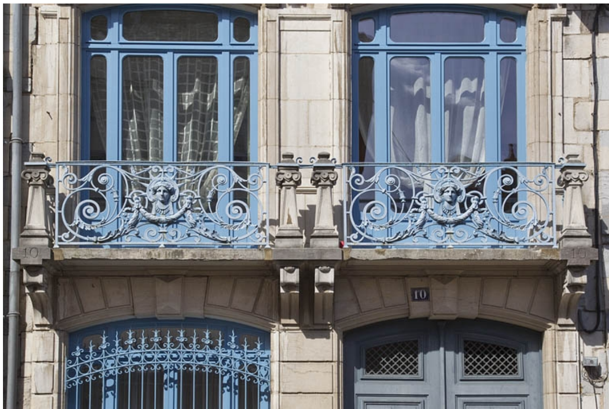
Deuxième logis secondaire, balcons du premier étage : détail des deux garde-corps.

25, Besançon, 25 rue Charles Nodier, lieu-dit : îlot Lecourbe