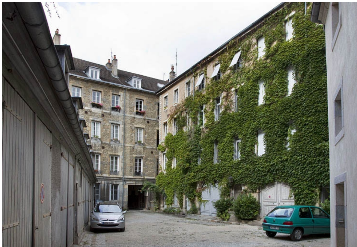
Vue d'ensemble de la façade postérieure du logis principal et du premier logis secondaire, depuis le fond de la cour. 25, Besançon, 25 rue Charles Nodier, lieudit : îlot Lecourbe