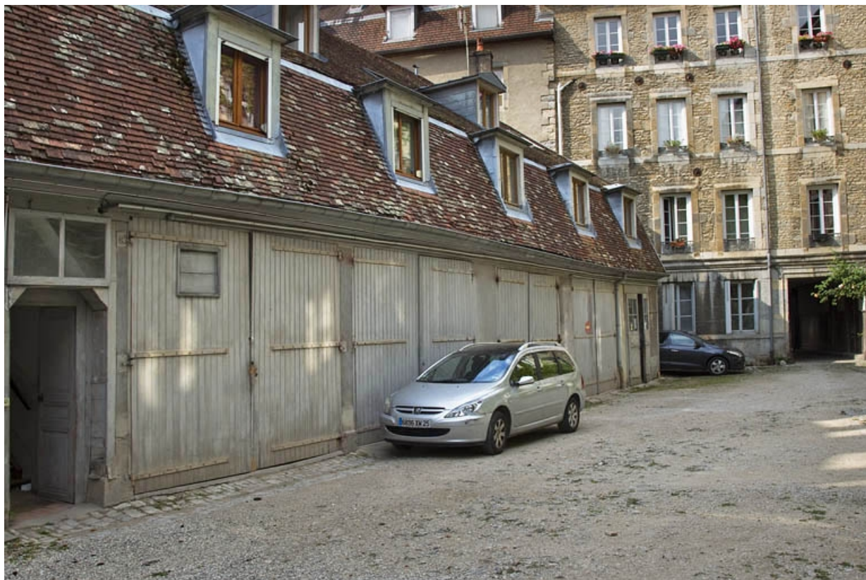
Bâtiment des écuries : vue d'ensemble, de trois quarts gauche.

25, Besançon, 25 rue Charles Nodier, lieudit : îlot Lecourbe