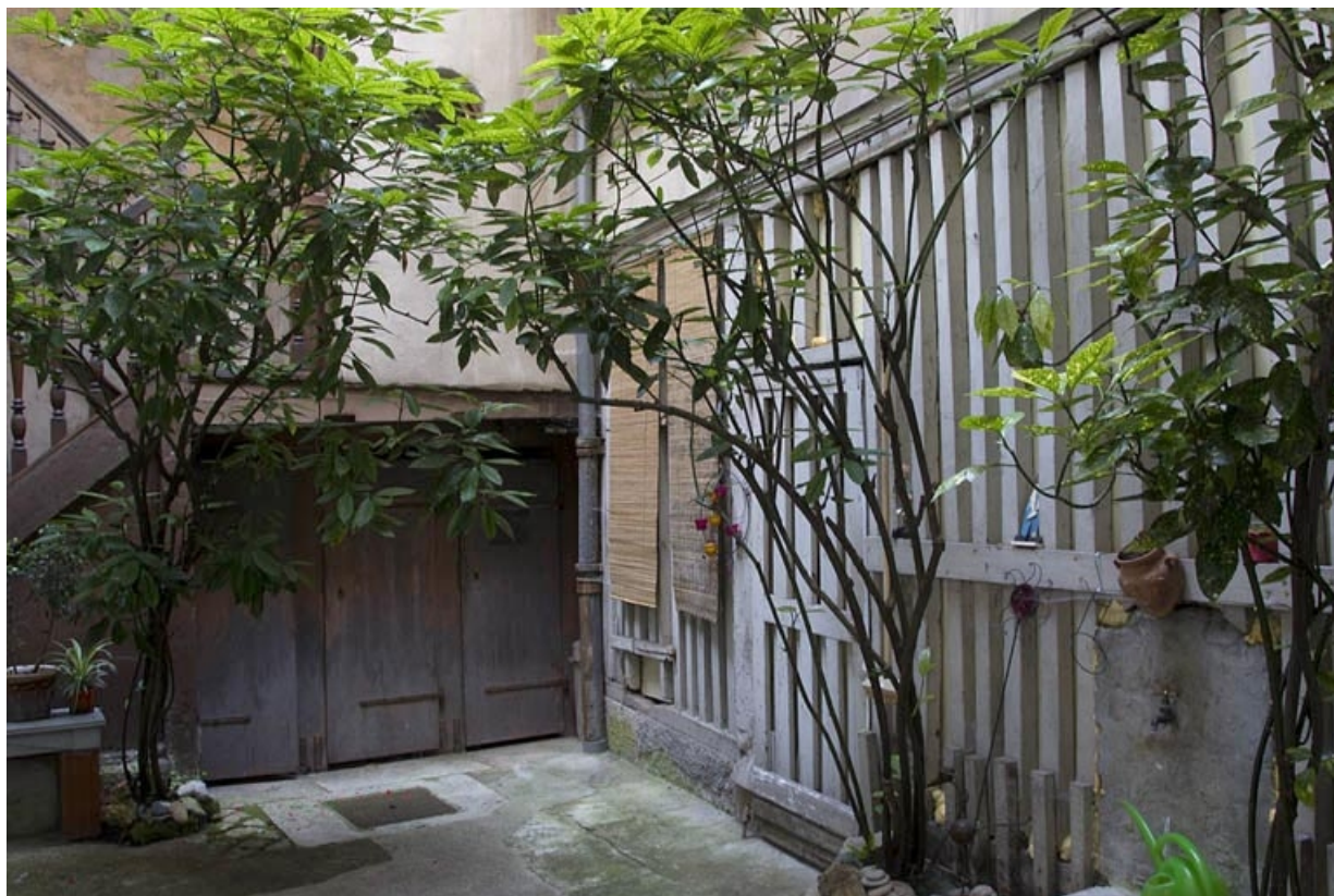
Vue d'ensemble du bûcher : de trois quarts droit.

25, Besançon, 6 rue Lecourbe, lieudit : îlot Lecourbe