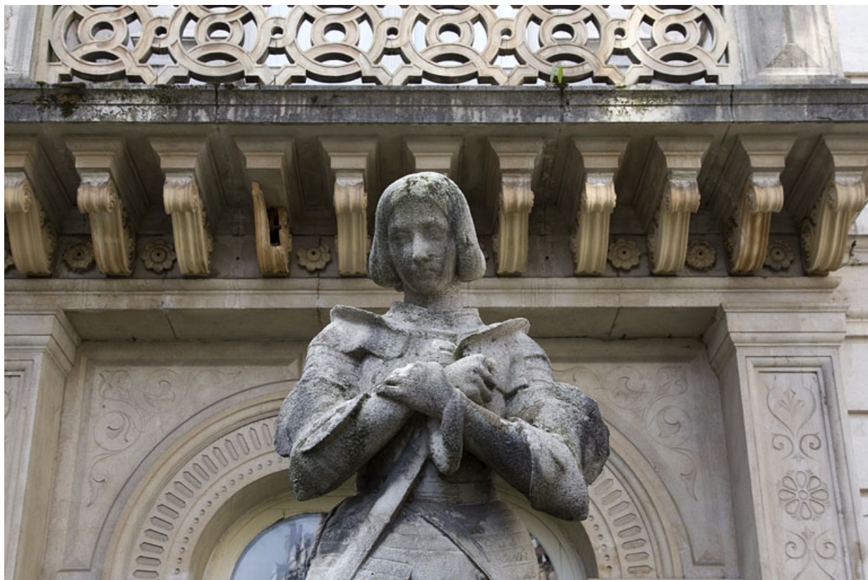
Statue de Jeanne d'arc devant la façade d'angle : détail du buste.

25, Besançon, 2 rue Lecourbe, lieudit : îlot Lecourbe