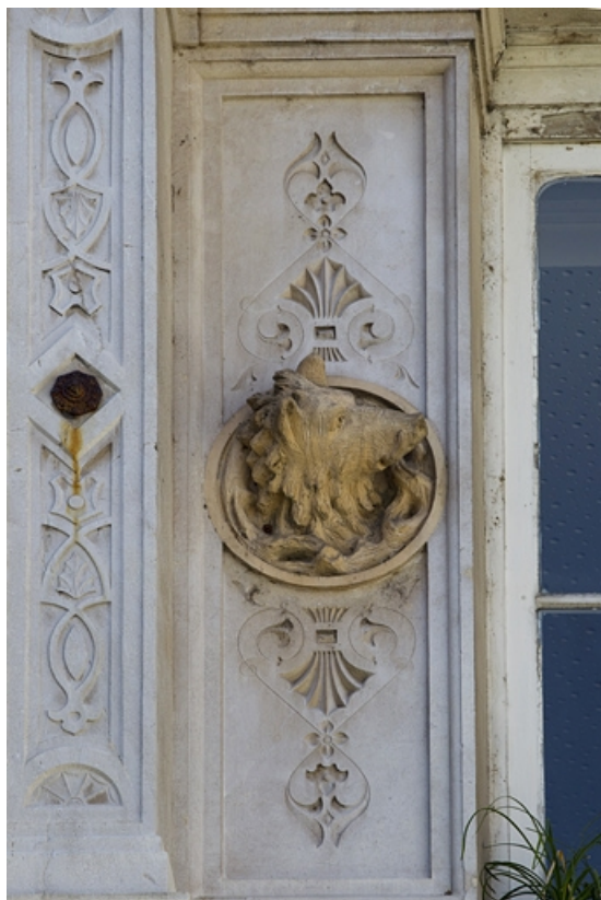
Façade d'angle, deuxième étage, baie centrale, détail du décor gauche : tête de sanglier. 25, Besançon, 2 rue Lecourbe, lieudit : îlot Lecourbe