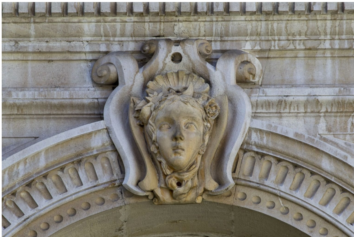
Façade d'angle, rez-de-chaussée, baie centrale, détail du décor de la clé de l'arc : tête de femme.

25, Besançon, 2 rue Lecourbe, lieudit : îlot Lecourbe