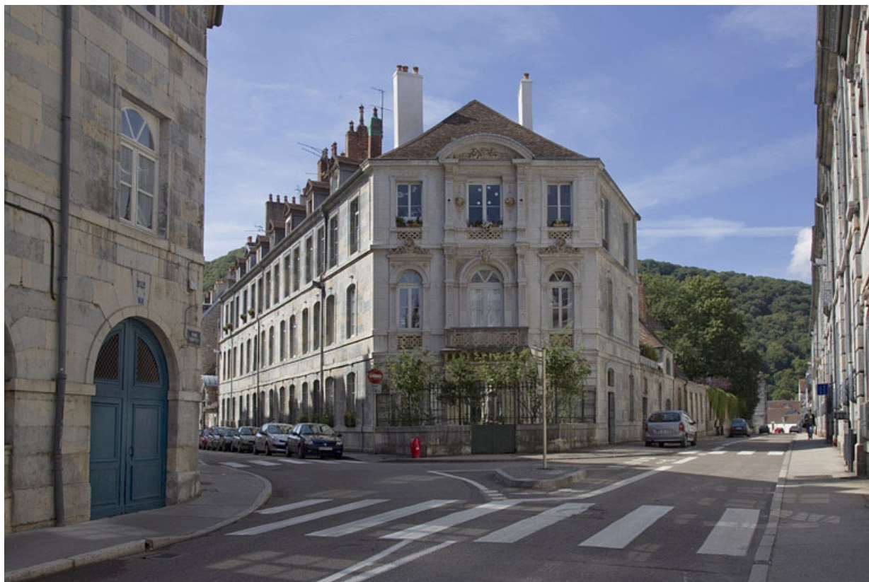
Vue d'ensemble éloignée depuis le carrefour des deux rues.

25, Besançon, 2 rue Lecourbe, lieudit : îlot Lecourbe