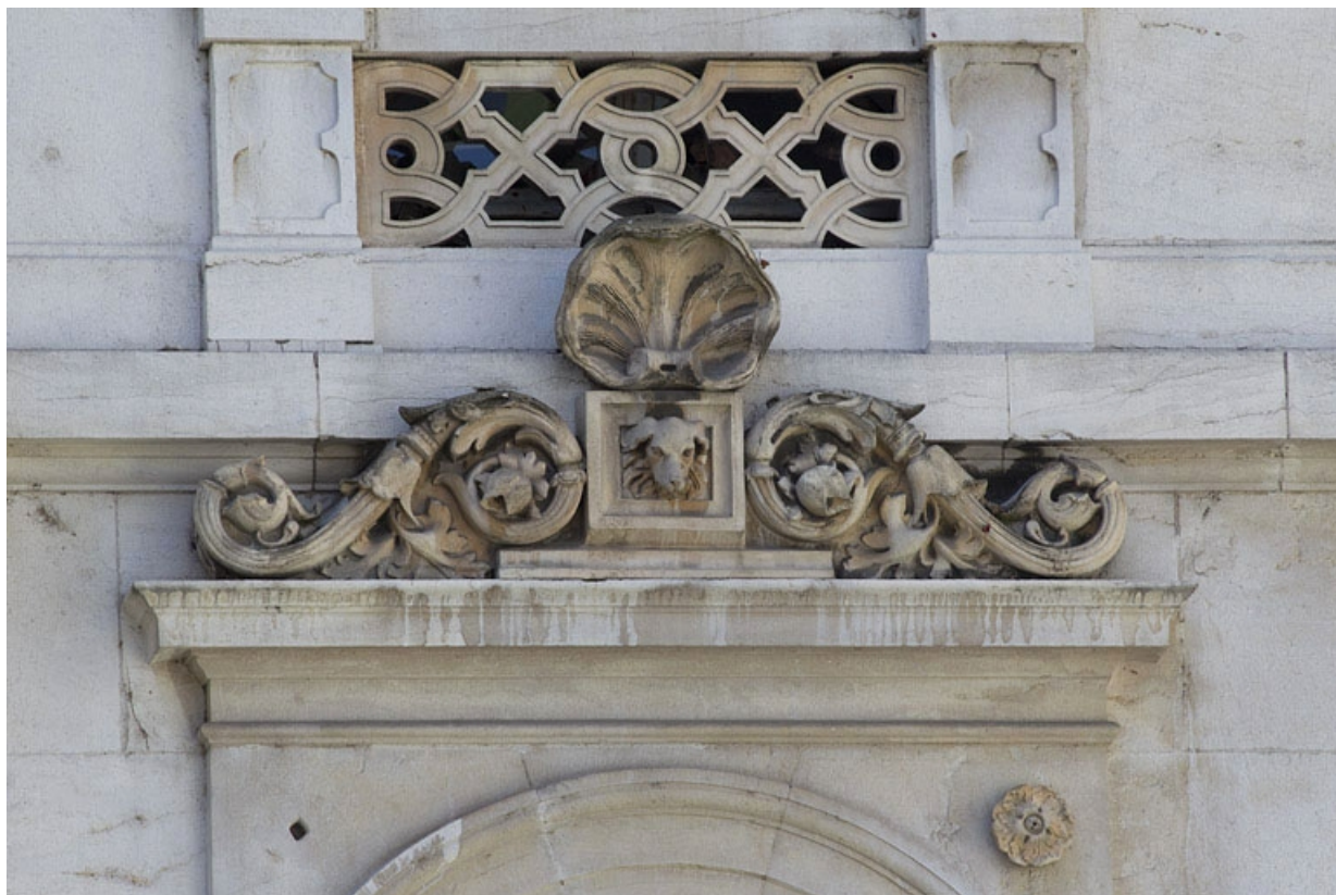
Façade d'angle, premier étage : détail du décor sur l'entablement d'une fenêtre.

25, Besançon, 2 rue Lecourbe, lieudit : îlot Lecourbe