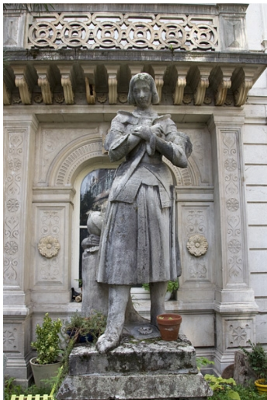
Détail d'une statue de Jeanne d'Arc devant la façade d'angle.

25, Besançon, 2 rue Lecourbe, lieudit : îlot Lecourbe