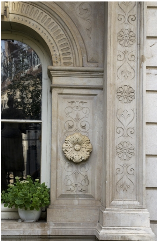
Façade d'angle, baie du rez-de-chaussée : détail du décor de l'encadrement. 25, Besançon, 2 rue Lecourbe, lieudit : îlot Lecourbe