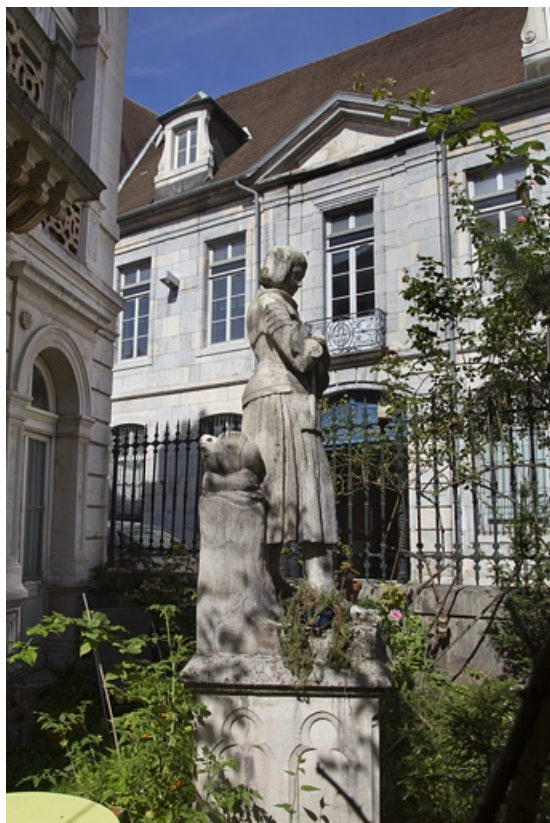
Statue de Jeanne d'Arc devant la façade d'angle : de profil.

25, Besançon, 2 rue Lecourbe, lieudit : îlot Lecourbe