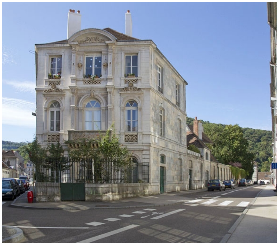
Vue d'ensemble depuis l'angle de la rue Chifflet. 25, Besançon, 2 rue Lecourbe, lieudit : îlot Lecourbe