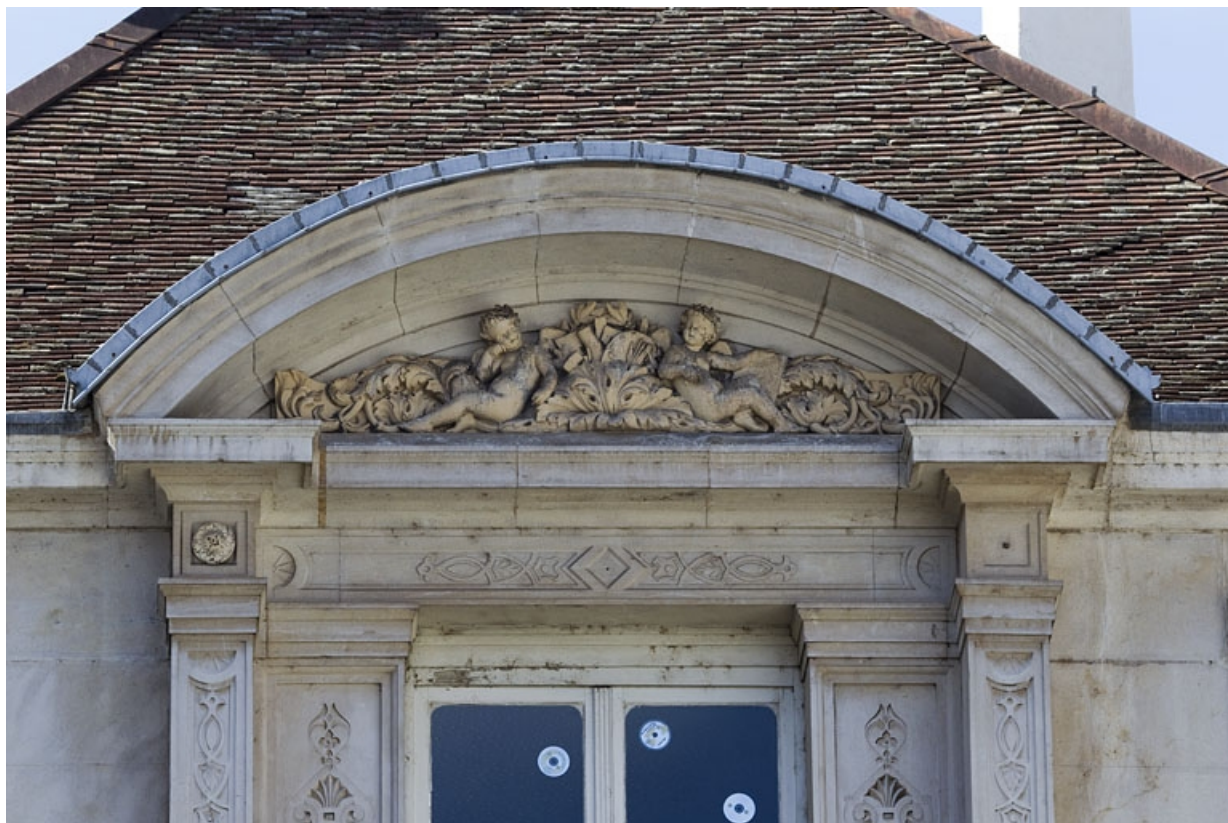
Façade d'angle, deuxième étage, baie centrale : détail du décor du fronton.

25, Besançon, 2 rue Lecourbe, lieudit : îlot Lecourbe