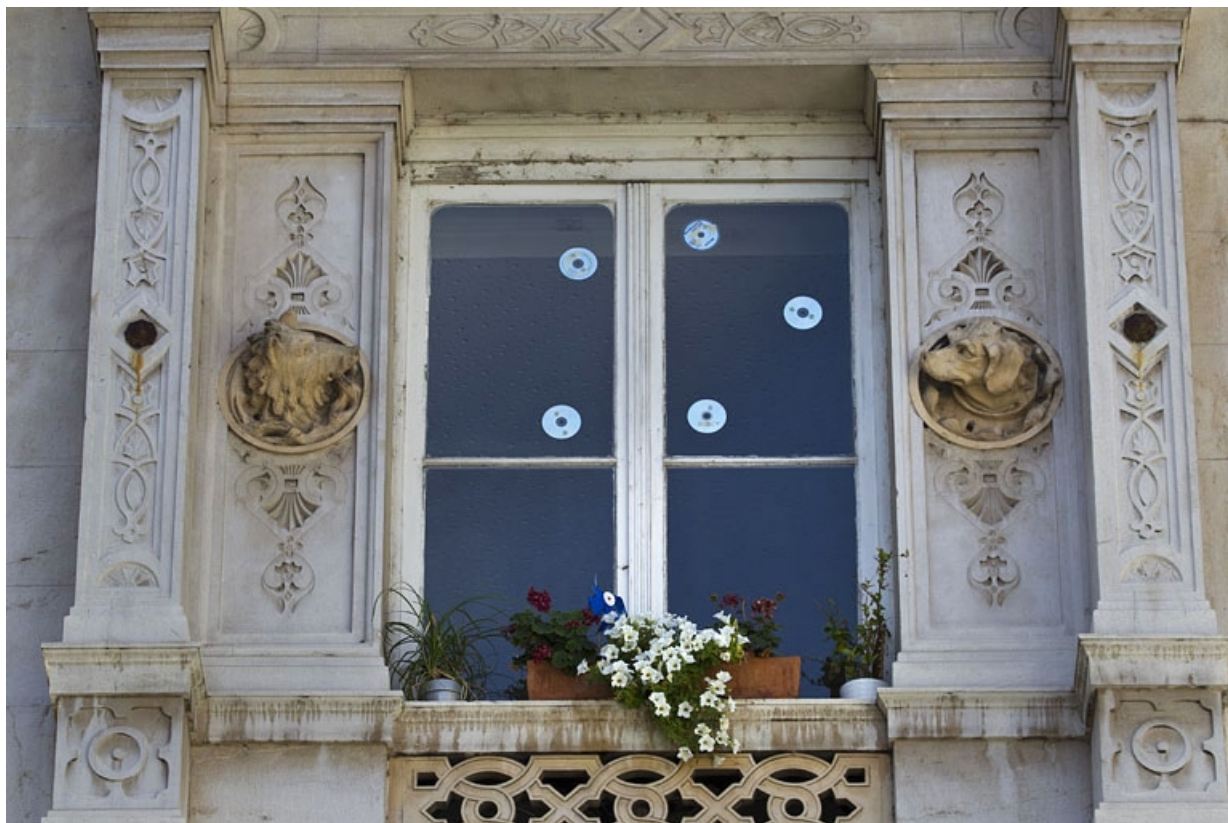
Façade d'angle, deuxième étage, baie centrale : vue d'ensemble.

25, Besançon, 2 rue Lecourbe, lieudit : îlot Lecourbe