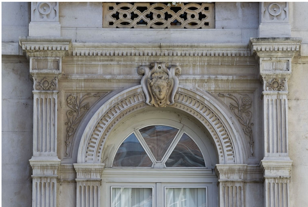
Façade d'angle, rez-de-chaussée : détail du décor, partie supérieure d'une baie. 25, Besançon, 2 rue Lecourbe, lieudit : îlot Lecourbe