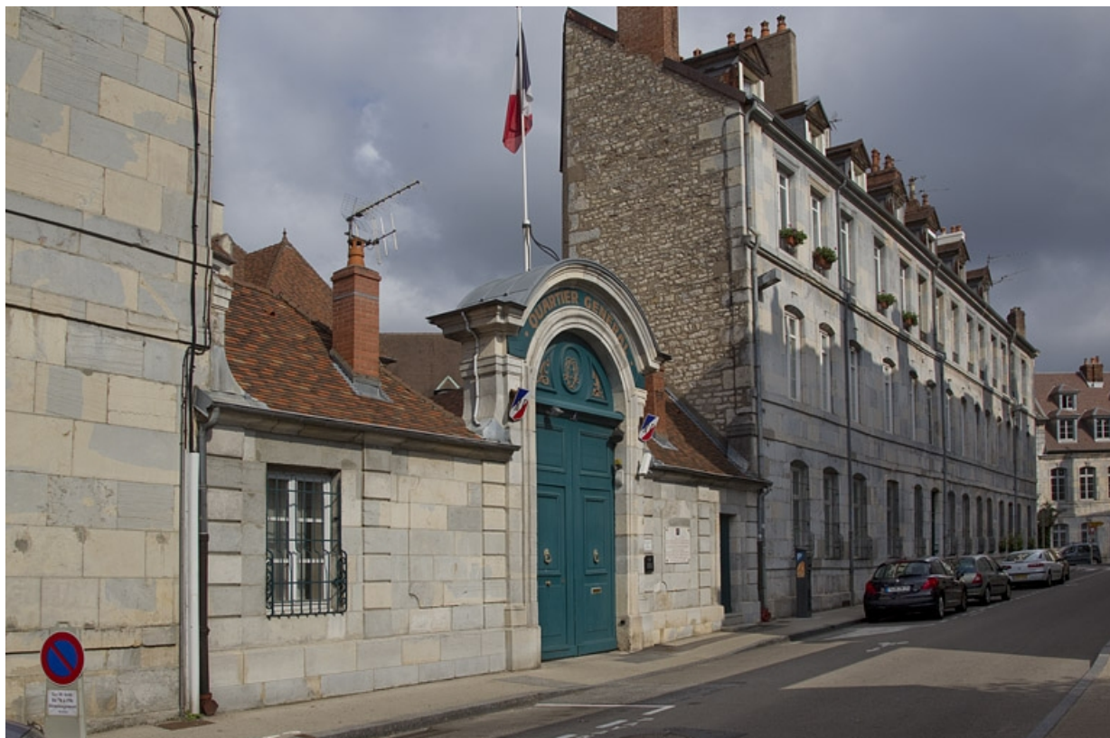
Façade, rue Charles Nodier : de trois quarts gauche.

25, Besançon, 2 rue Lecourbe, lieudit : îlot Lecourbe