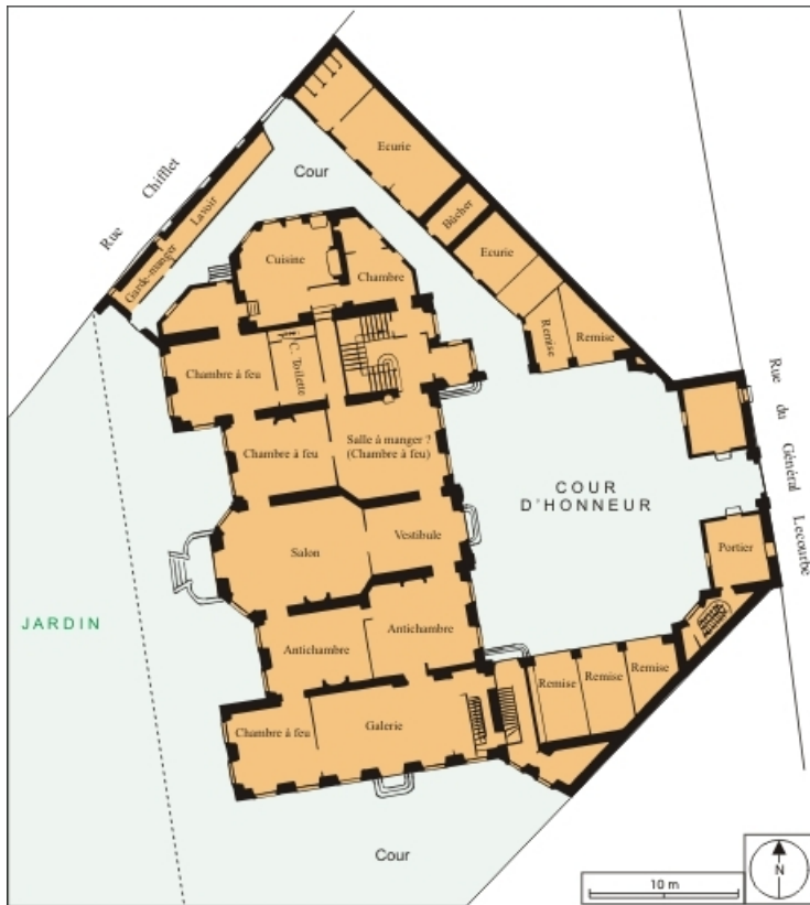
Croquis restituant la distribution intérieure du rez-de-chaussée au 18e siècle. 25, Besançon, 4 rue Lecourbe, lieudit : îlot Lecourbe