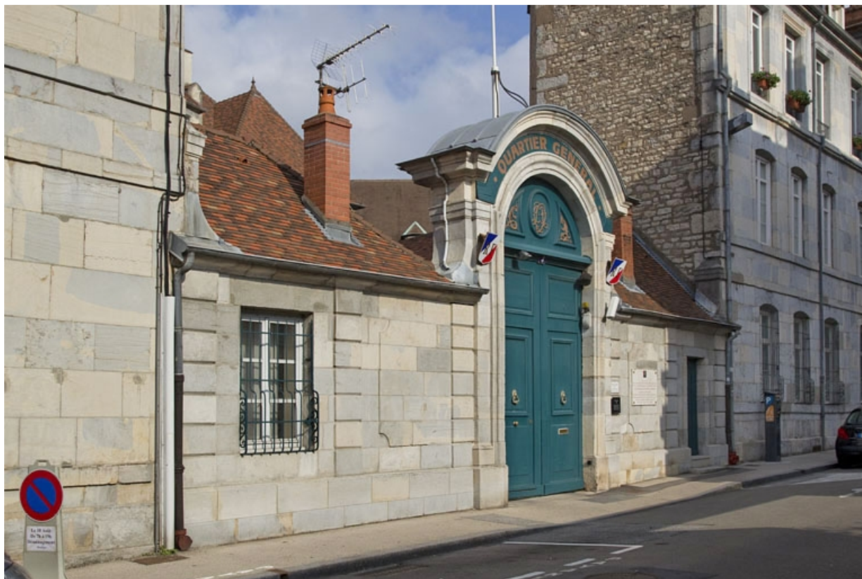
Vue du portail dans clôture : de trois quarts gauche.

25, Besançon, 4 rue Lecourbe, lieudit : îlot Lecourbe