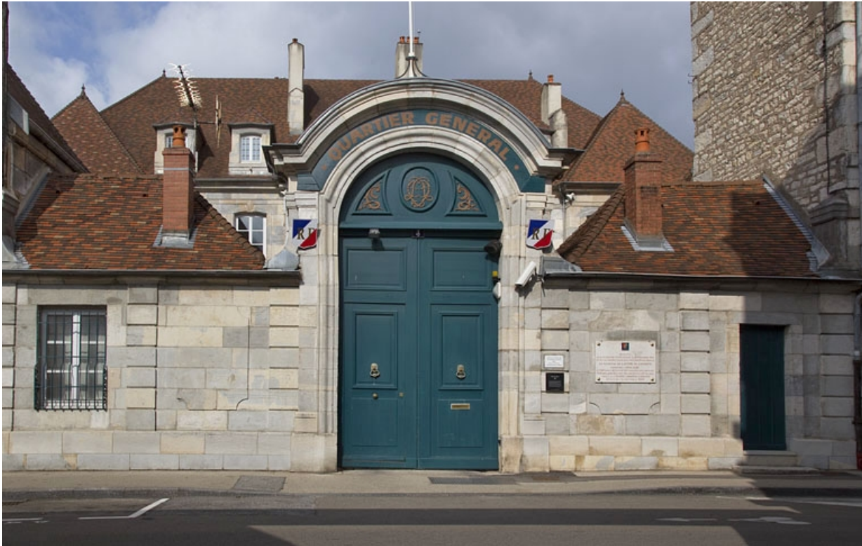
Vue du portail dans clôture : de face.

25, Besançon, 4 rue Lecourbe, lieudit : îlot Lecourbe