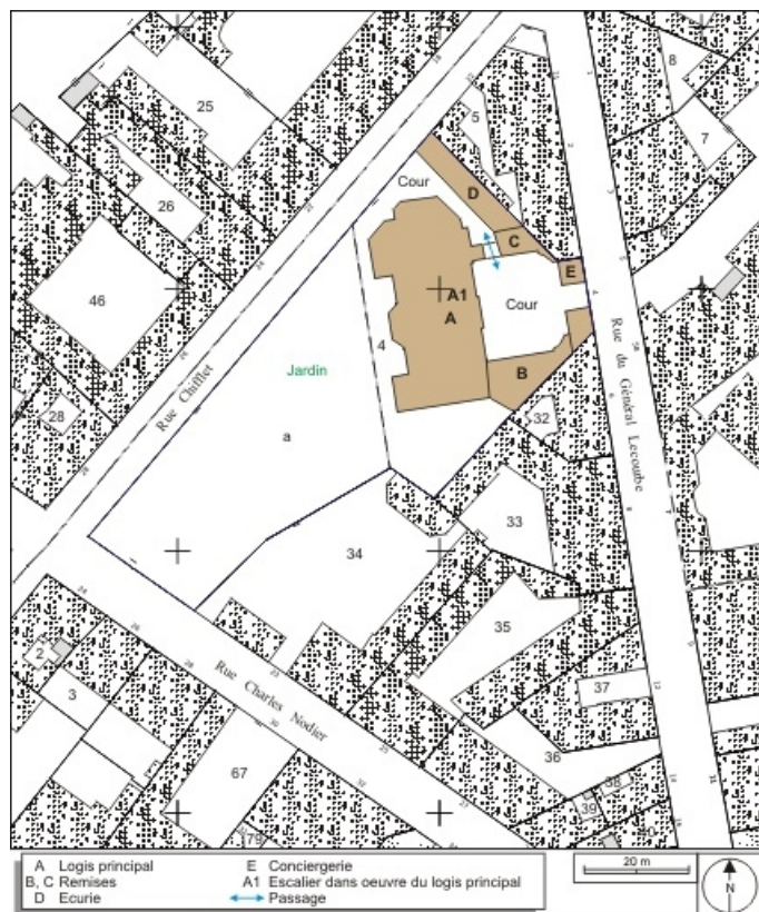
Plan masse et de situation. Extrait du plan cadastral, 1974, section AP. 25, Besançon, 4 rue Lecourbe, lieudit : îlot Lecourbe