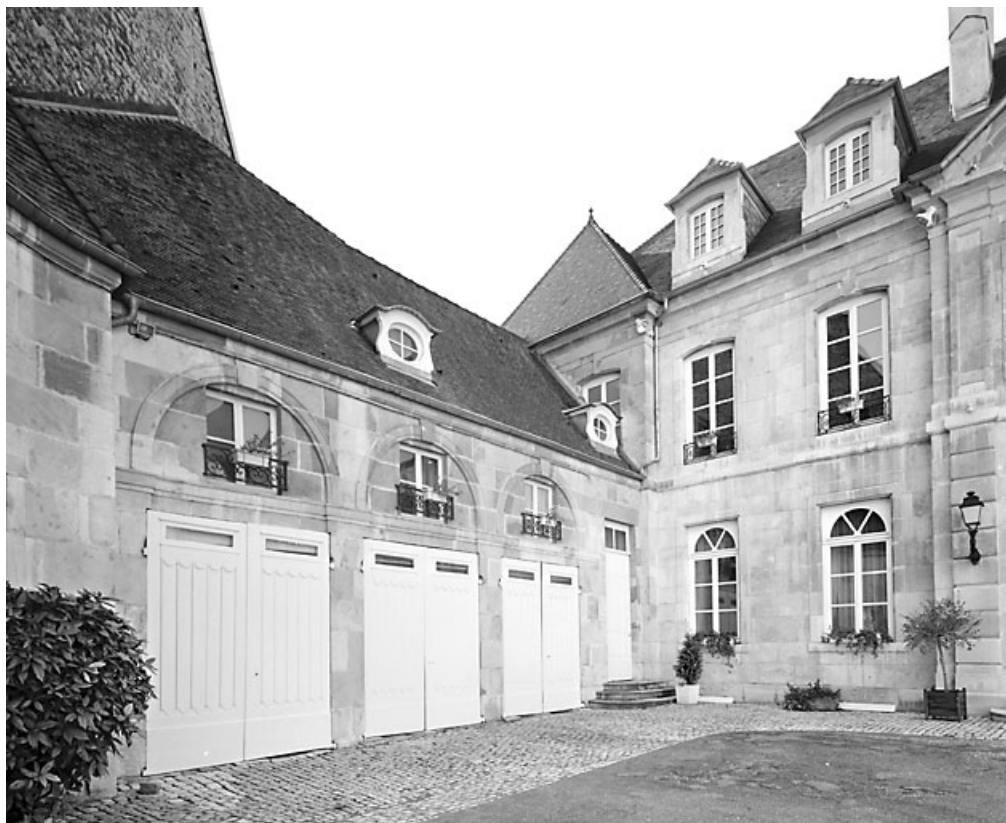
Vue d'ensemble des remises de l'aile gauche sur la cour d'honneur.

25, Besançon, 4 rue Lecourbe, lieudit : îlot Lecourbe