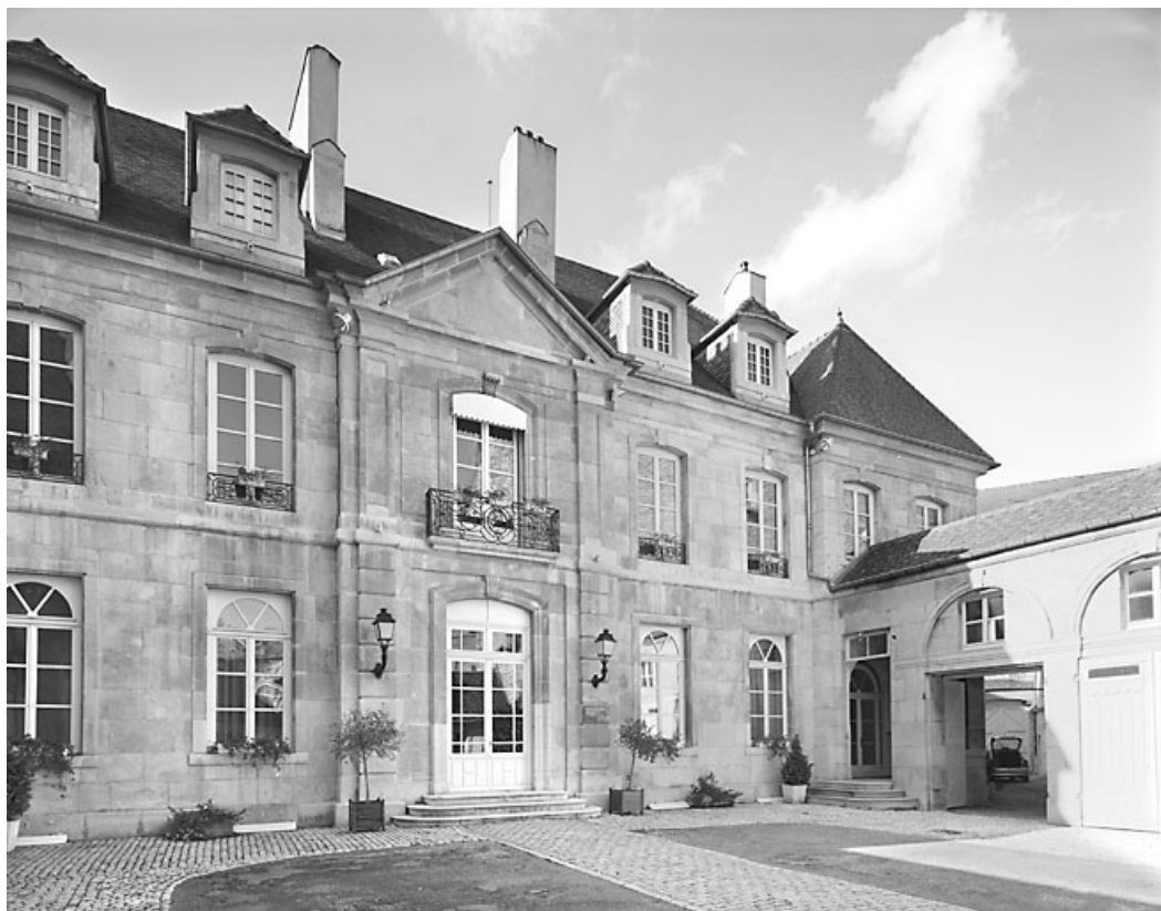
Vue d'ensemble du logis sur cour, de trois quarts droit.

25, Besançon, 4 rue Lecourbe, lieudit : îlot Lecourbe