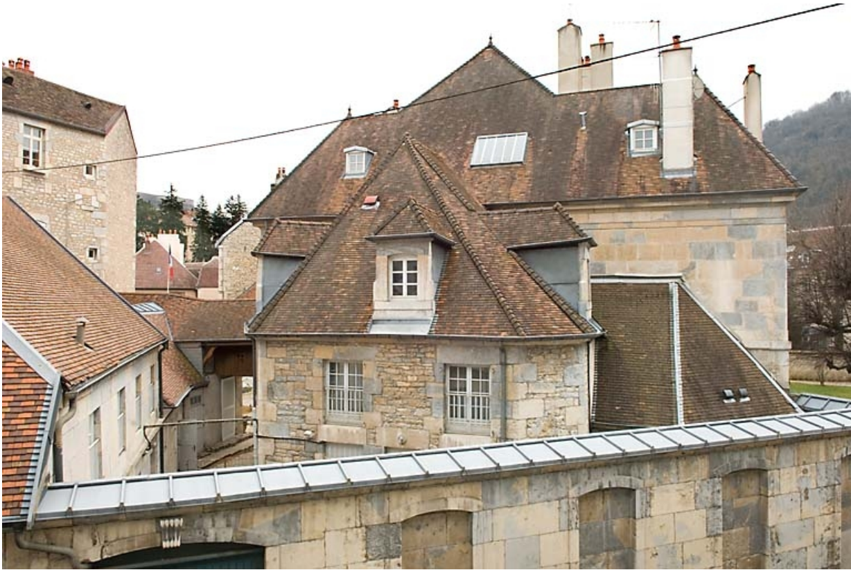
Vue d'ensemble des façades latérales depuis le balcon de l'hôtel de Courbouzon, situé rue Chifflet.

25, Besançon, 4 rue Lecourbe, lieudit : îlot Lecourbe