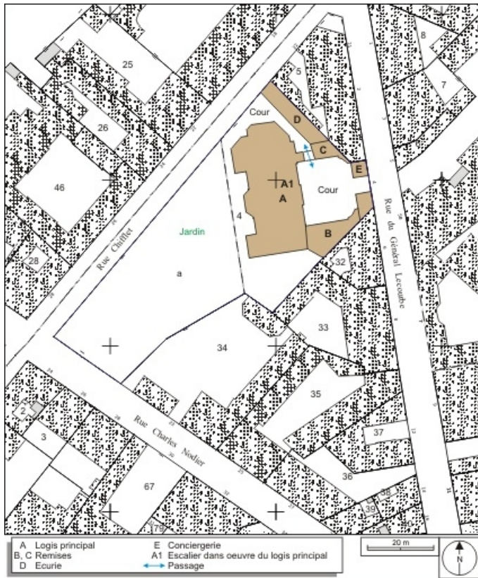
Plan masse et de situation. Extrait du plan cadastral, 1974, section AP. 25, Besançon, 4 rue Lecourbe, lieudit : îlot Lecourbe