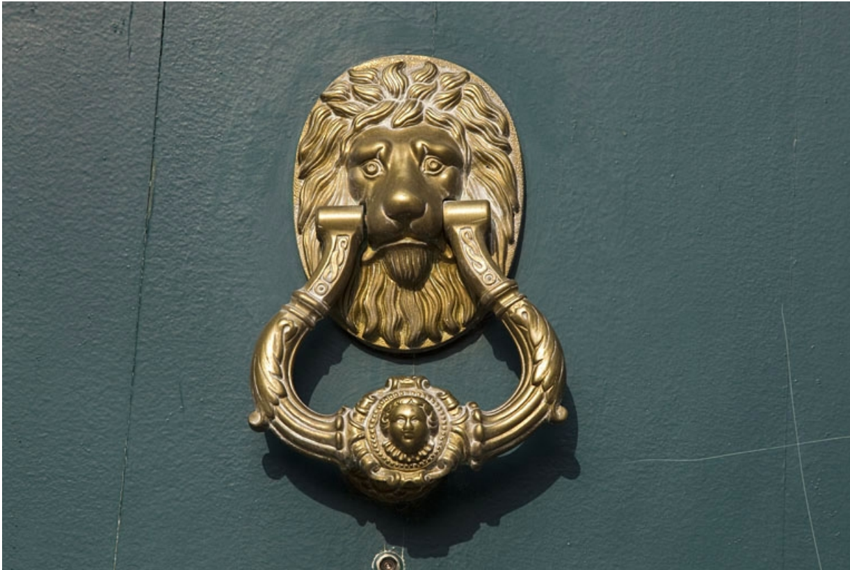
Vue du portail dans clôture : détail du heurtour.

25, Besançon, 4 rue Lecourbe, lieudit : îlot Lecourbe