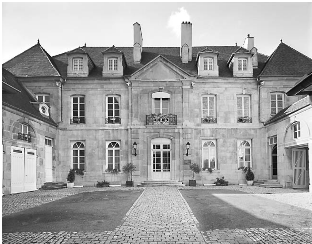
Vue d'ensemble du logis sur cour, depuis le portail d'entrée.

25, Besançon, 4 rue Lecourbe, lieu-dit : îlot Lecourbe