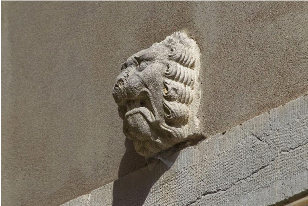
Logis secondaire (anciens communs) : détail du mufle de lion décorant la façade.

25, Besançon, 12 rue Lecourbe, lieudit : îlot Lecourbe