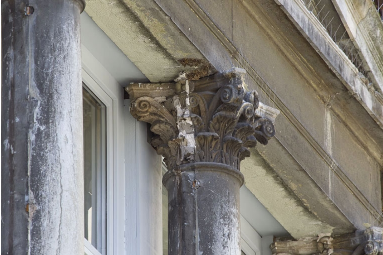
Logis principal, façade antérieure : détail d'un chapiteau corinthien.

25, Besançon, 12 rue Lecourbe, lieudit : îlot Lecourbe