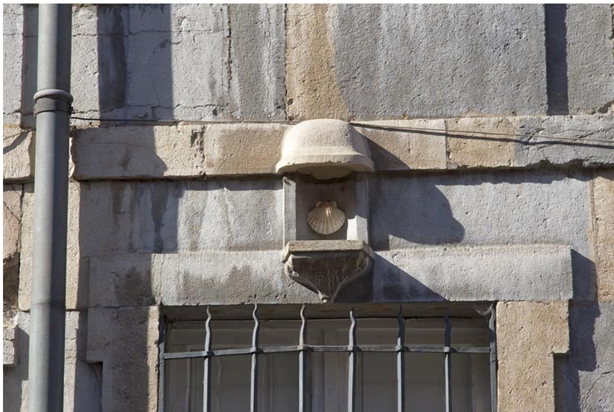
Logis principal, façade antérieure : détail d'une niche au-dessus d'une fenêtre du rez-de-chaussée. 25, Besançon, 2 rue de la Vieille Monnaie, lieudit : îlot Refuge