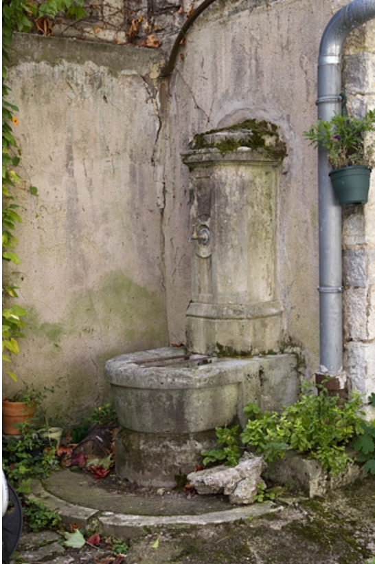
Vue d'ensemble de la borne fontaine située dans la cour. 25, Besançon, 2 rue de la Vieille Monnaie, lieudit : îlot Refuge