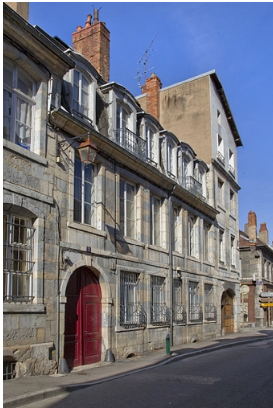
Vue d'ensemble depuis la rue, de trois quarts gauche, vue rapprochée.

25, Besançon, 2 rue de la Vieille Monnaie, lieudit : îlot Refuge