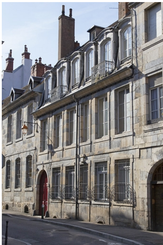
Vue d'ensemble depuis la rue, de trois quarts droit, vue rapprochée.

25, Besançon, 2 rue de la Vieille Monnaie, lieudit : îlot Refuge