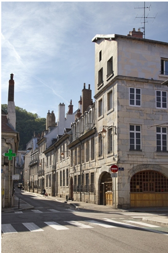
Vue d'ensemble depuis la rue, de trois quarts droit.

25, Besançon, 2 rue de la Vieille Monnaie, lieudit : îlot Refuge