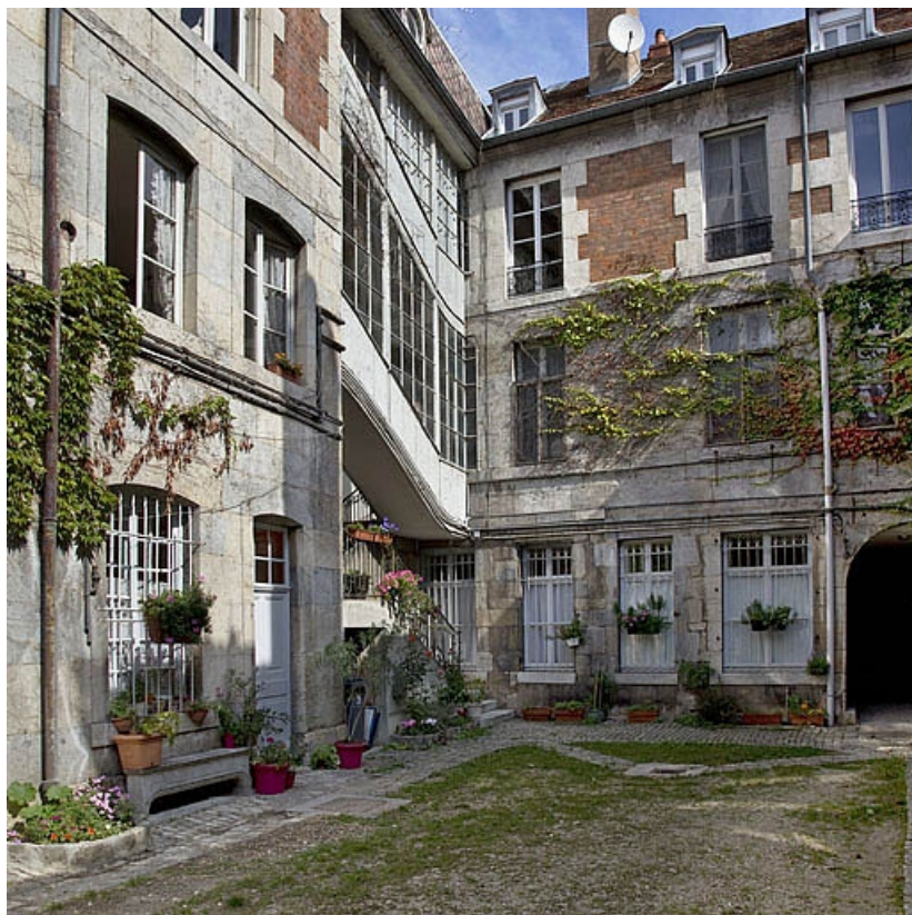
Façade postérieure du logis principal et escalier à cage ouverte, de trois quarts gauche. 25, Besançon, 2 rue de la Vieille Monnaie, lieudit : îlot Refuge