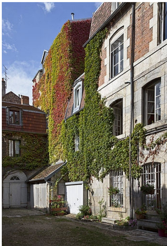
Vue d'ensemble du premier logis secondaire, de trois quarts droit.

25, Besançon, 2 rue de la Vieille Monnaie, lieudit : îlot Refuge