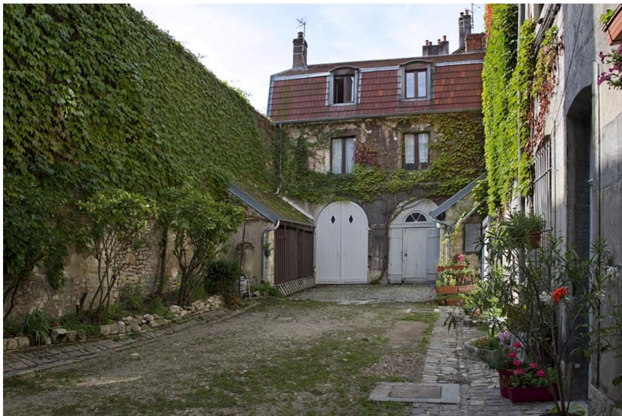
Deuxième logis secondaire : vue d'ensemble depuis l'entrée de la cour.

25, Besançon, 2 rue de la Vieille Monnaie, lieudit : îlot Refuge