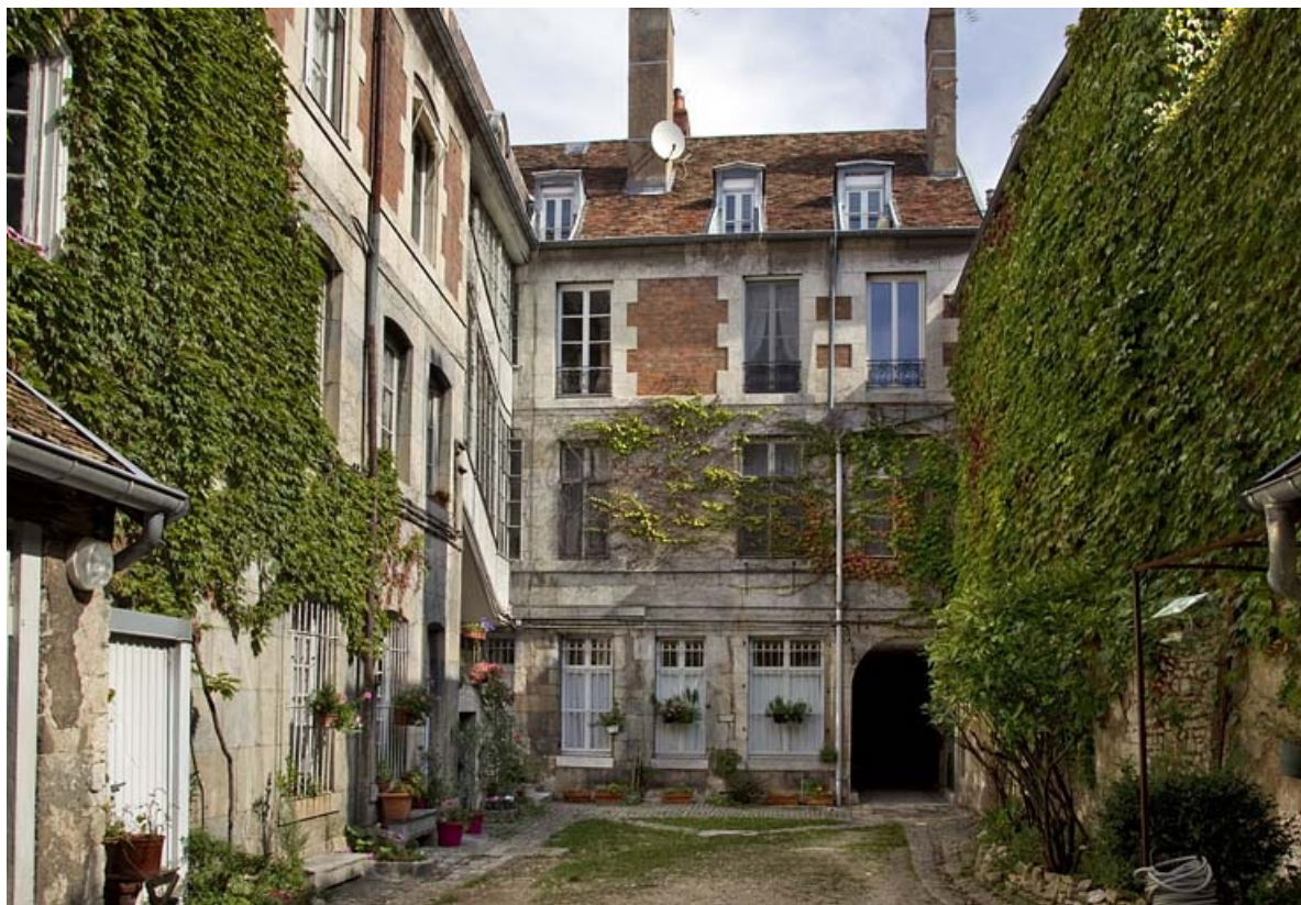
Logis principal, façade postérieure depuis le fond de la cour. 25, Besançon, 2 rue de la Vieille Monnaie, lieudit : îlot Refuge