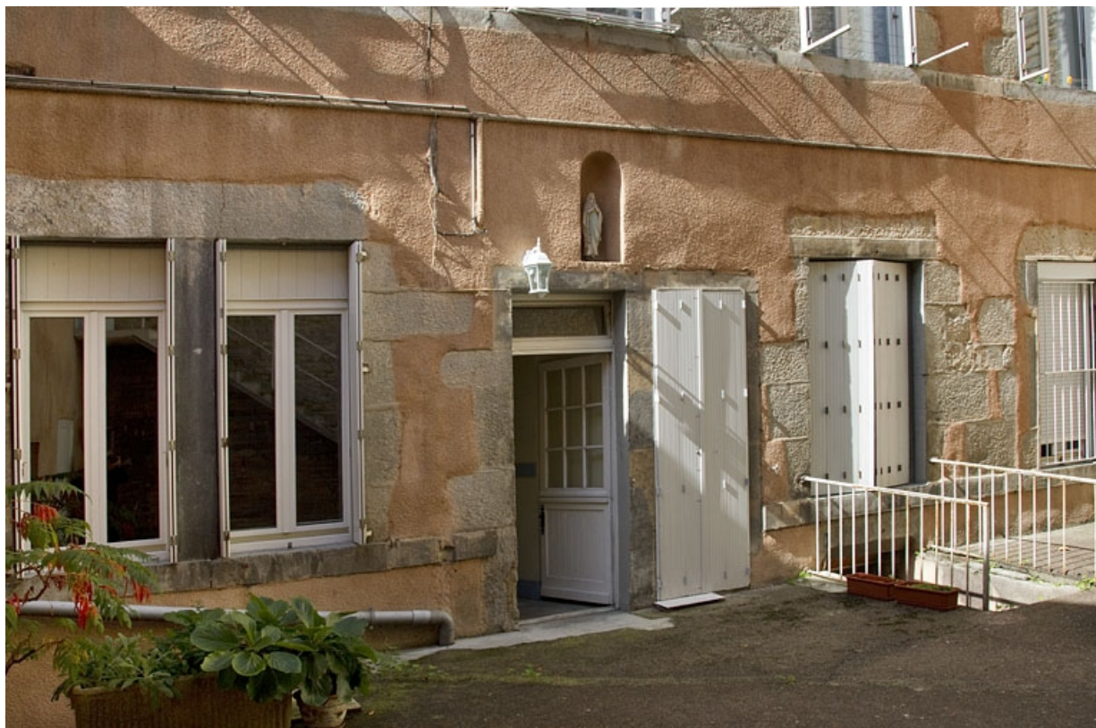
Logis principal, façade postérieure : détail du rez-de-chaussée, de trois quarts gauche.

25, Besançon, 3 rue Lecourbe, lieudit : îlot Refuge