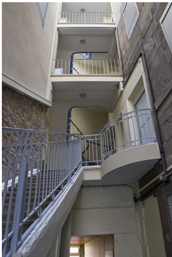
Logis principal, escalier : détail de la partie supérieure.

25, Besançon, 3 rue Lecourbe, lieudit : îlot Refuge