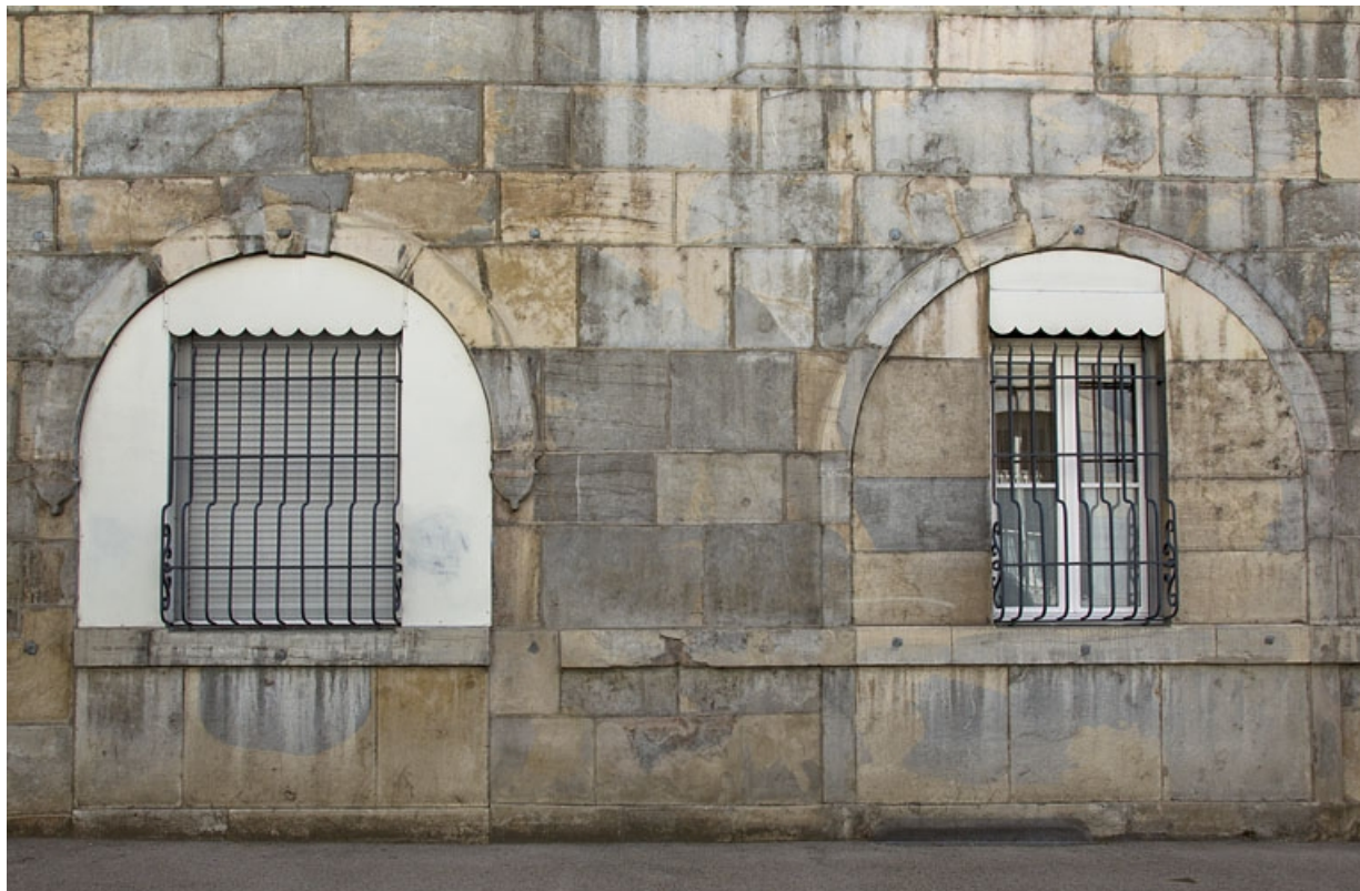
Logis principal, façade antérieure, rez-de-chaussée : détail des arcades boutiquières murées.

25, Besançon, 3 rue Lecourbe, lieudit : îlot Refuge