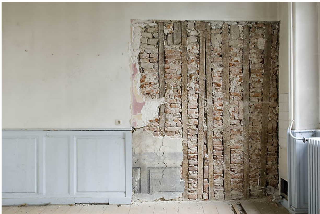
Détail d'une peinture murale sous un lambris d'appui dans une pièce du premier étage. 25, Besançon, 4 rue de la Vieille Monnaie, lieudit : îlot Refuge