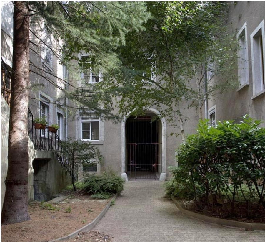
Logis principal, façade postérieure depuis le fond de la cour.

25, Besançon, 4 rue de la Vieille Monnaie, lieudit : îlot Refuge