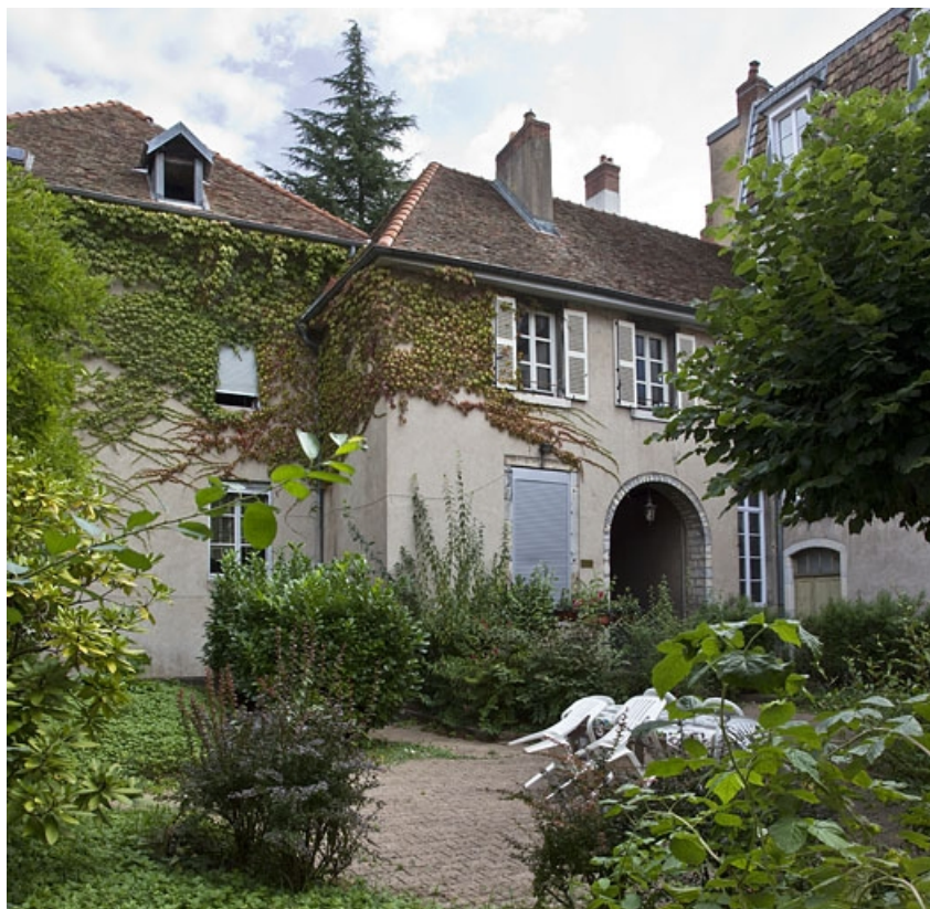
Deuxième logis secondaire, façade postérieure depuis le fond du jardin : de trois quarts gauche. 25, Besançon, 4 rue de la Vieille Monnaie, lieudit : îlot Refuge