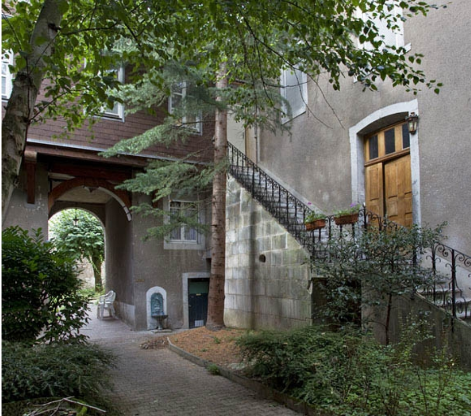
Vue d'ensemble de l'escalier extérieur du premier logis secondaire.

25, Besançon, 4 rue de la Vieille Monnaie, lieudit : îlot Refuge