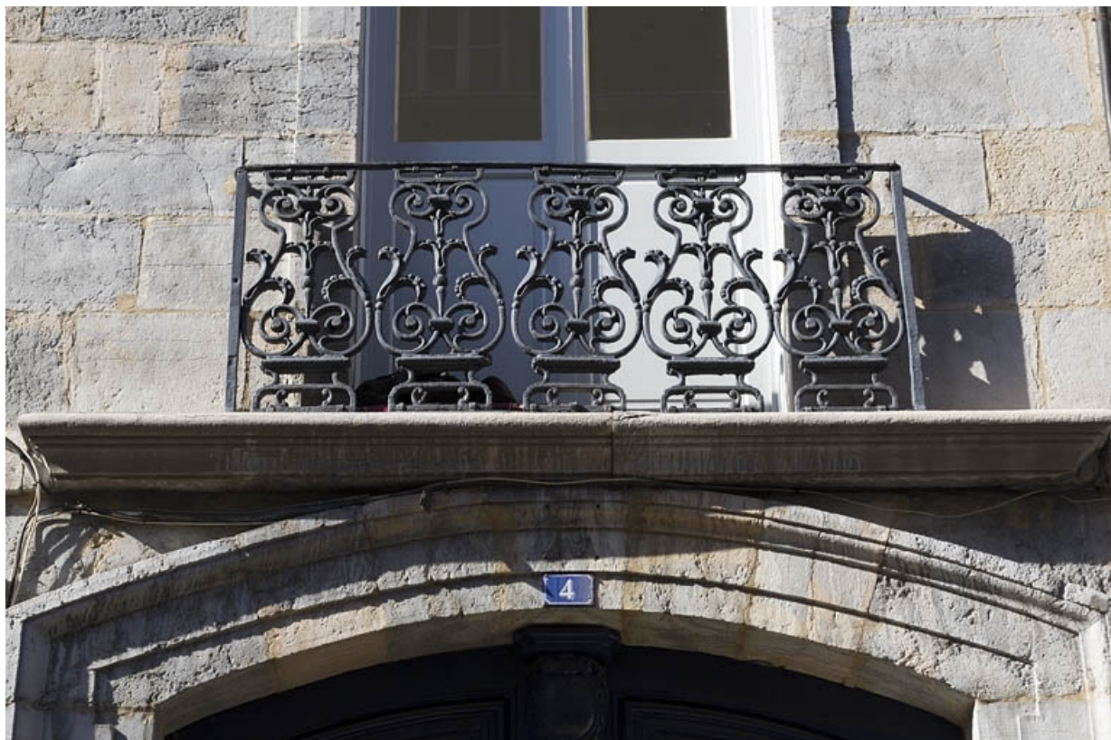
Logis principal, façade antérieure : détail du garde-corps du balcon.

25, Besançon, 4 rue de la Vieille Monnaie, lieudit : îlot Refuge