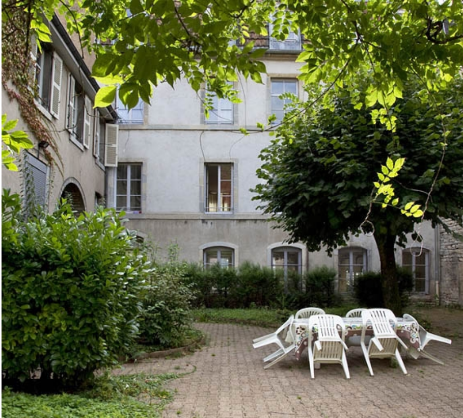
Vue d'une partie du jardin : de face.

25, Besançon, 4 rue de la Vieille Monnaie, lieudit : îlot Refuge