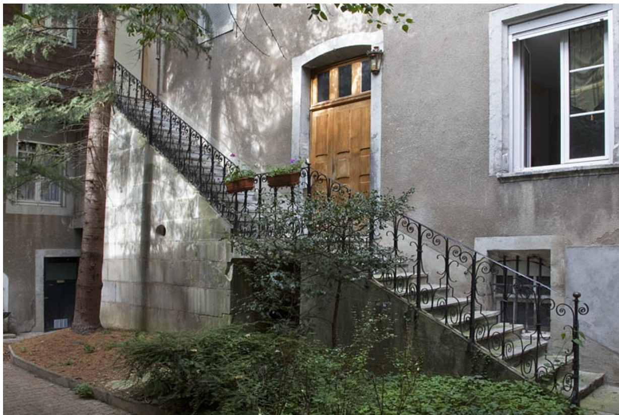
Premier logis secondaire : détail de l'escalier extérieur, de trois quarts gauche.

25, Besançon, 4 rue de la Vieille Monnaie, lieudit : îlot Refuge