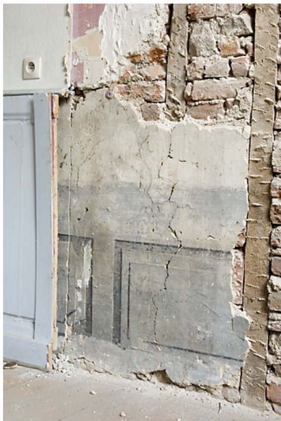
Détail d'une peinture murale sous un lambris d'appui dans une pièce du premier étage : vue rapprochée. 25, Besançon, 4 rue de la Vieille Monnaie, lieudit : îlot Refuge