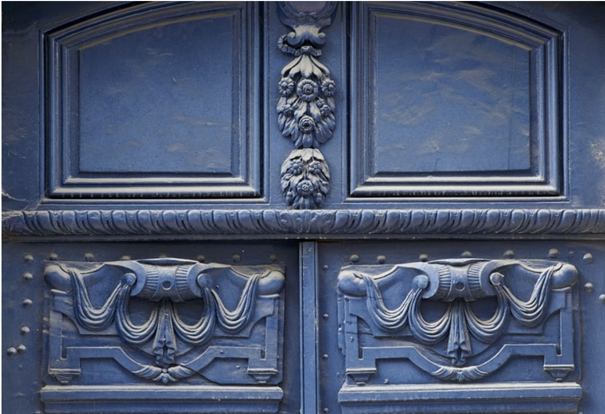
Logis principal, façade antérieure, portail d'entrée : détail du décor des vantaux de la porte.

25, Besançon, 4 rue de la Vieille Monnaie, lieudit : îlot Refuge