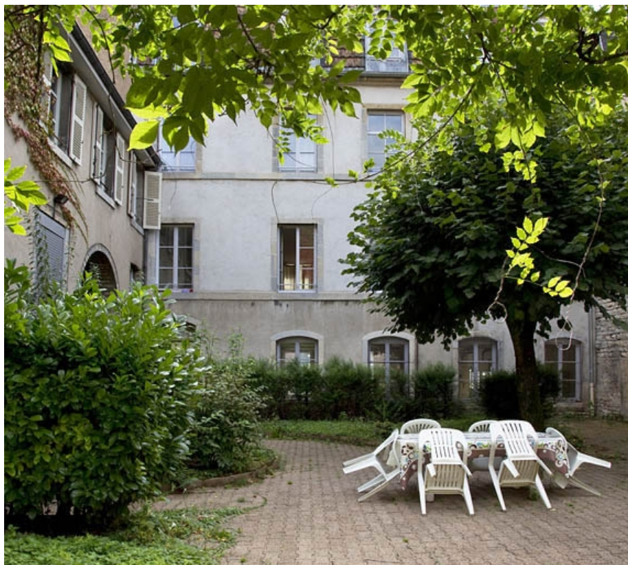
Vue d'une partie du jardin : de face.

25, Besançon, 4 rue de la Vieille Monnaie, lieudit : îlot Refuge