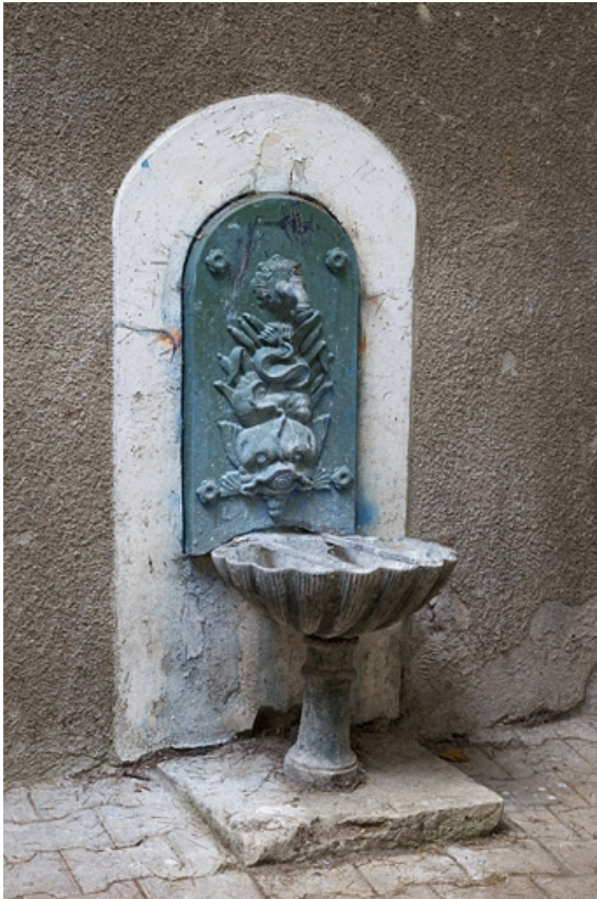
Vue d'ensemble de la borne fontaine située dans la cour. 25, Besançon, 4 rue de la Vieille Monnaie, lieudit : îlot Refuge