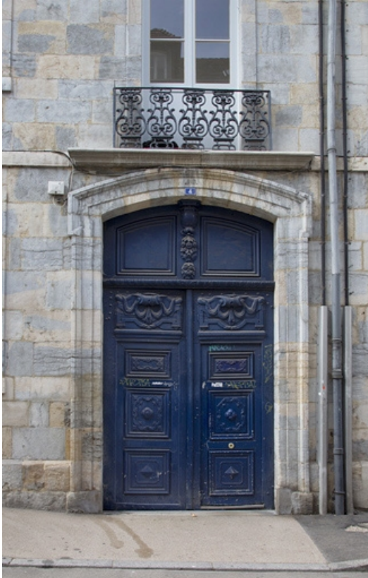
Logis principal, façade antérieure : détail du portail d'entrée.

25, Besançon, 4 rue de la Vieille Monnaie, lieudit : îlot Refuge