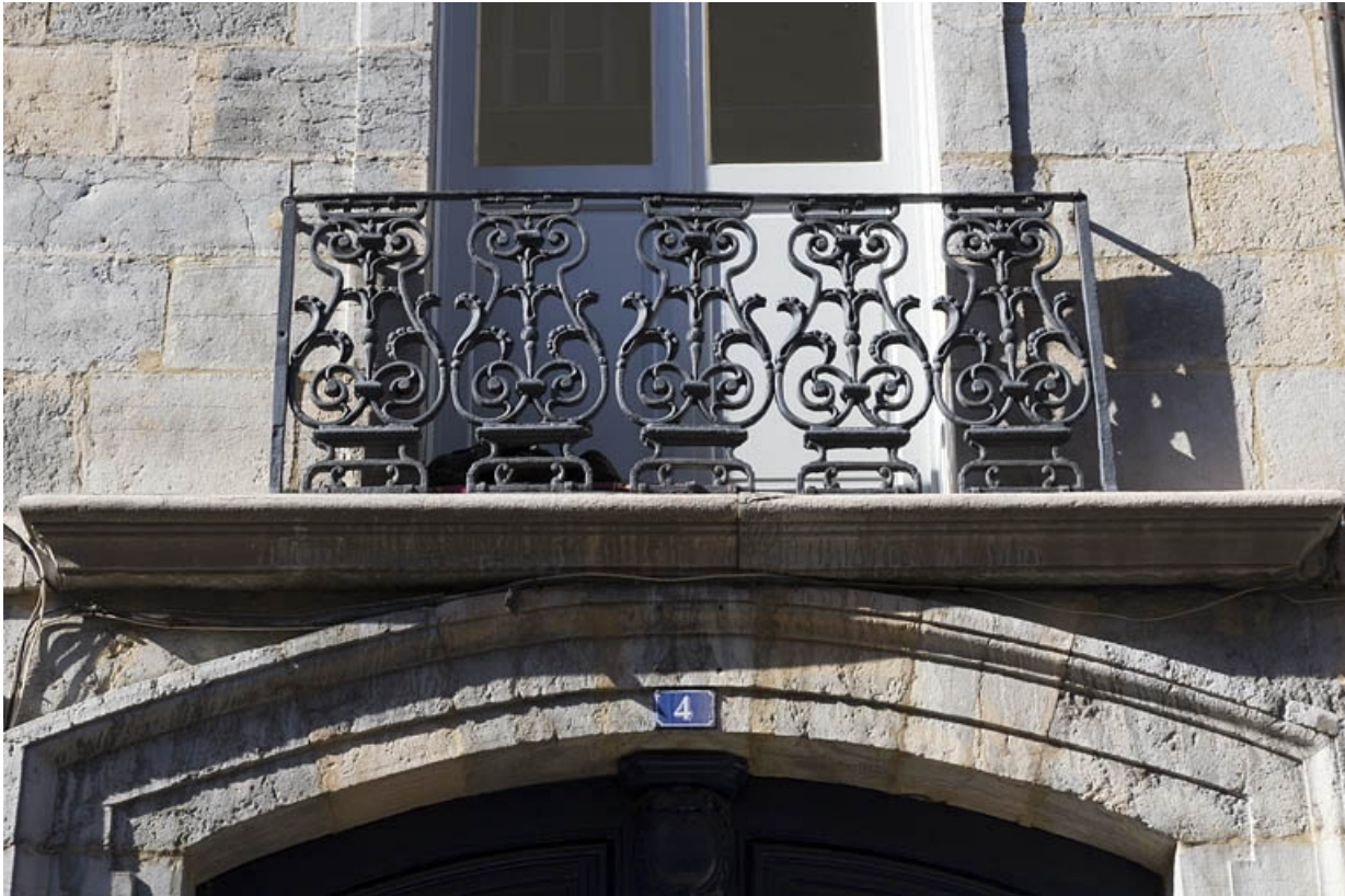
Logis principal, façade antérieure : détail du garde-corps du balcon.

25, Besançon, 4 rue de la Vieille Monnaie, lieudit : îlot Refuge