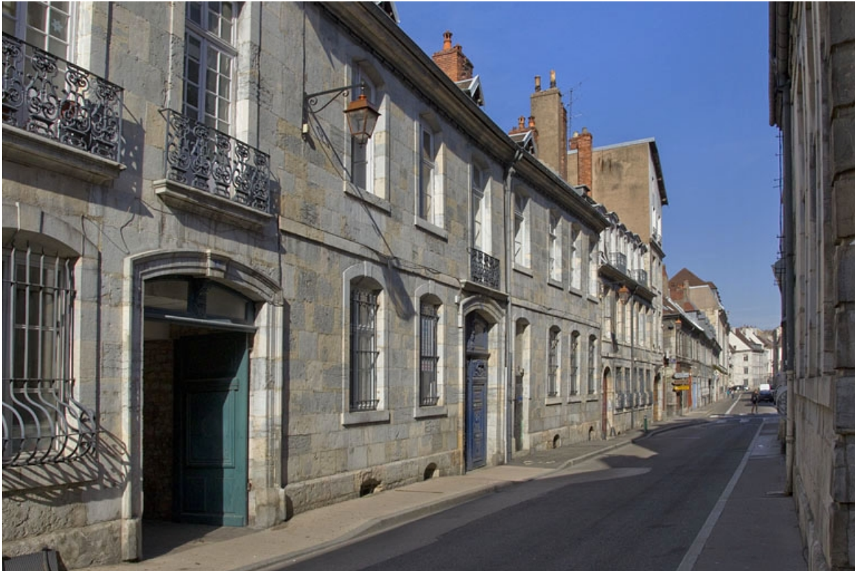
Vue d'ensemble depuis la rue, de trois quarts gauche, vue rapprochée.

25, Besançon, 4 rue de la Vieille Monnaie, lieudit : îlot Refuge