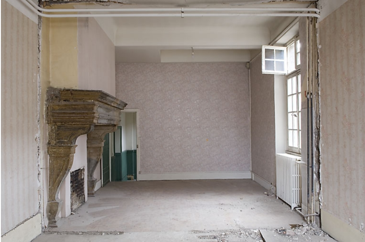
Vue d'ensemble d'une cheminée d'une pièce du premier étage.

25, Besançon, 4 rue de la Vieille Monnaie, lieudit : îlot Refuge