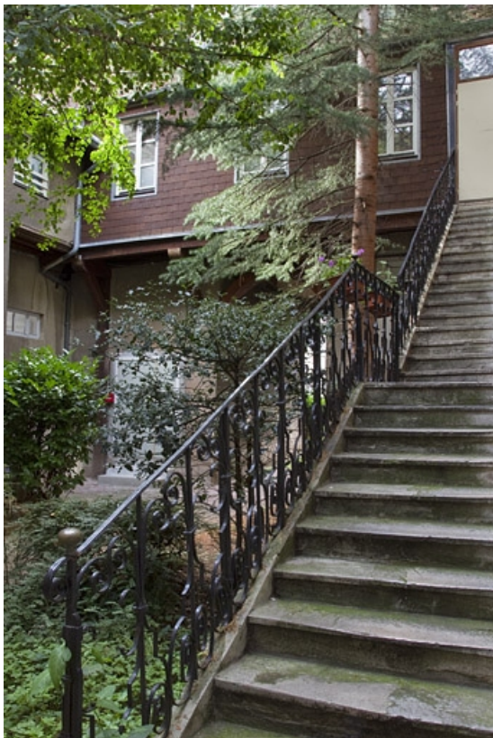
Premier logis secondaire : détail de la rampe en ferronnerie de l'escalier extérieur. 25, Besançon, 4 rue de la Vieille Monnaie, lieu-dit : îlot Refuge