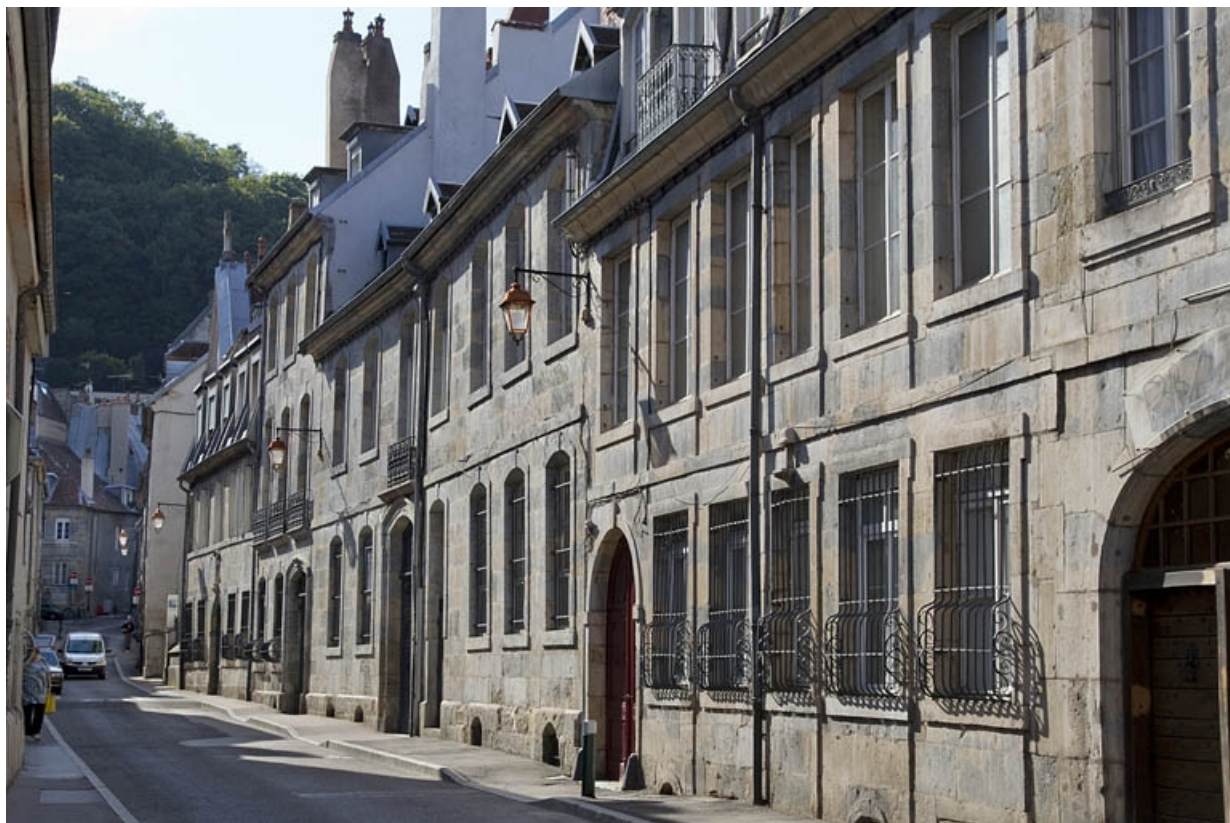
Vue d'ensemble depuis la rue, de trois quarts droit.

25, Besançon, 4 rue de la Vieille Monnaie, lieudit : îlot Refuge