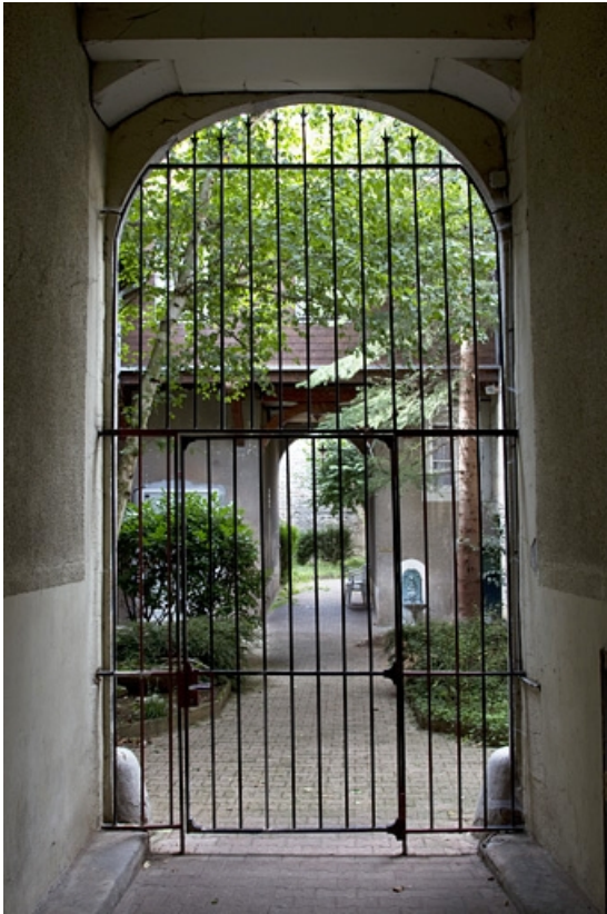
Vue d'ensemble de la cour depuis le portail d'entrée.

25, Besançon, 4 rue de la Vieille Monnaie, lieudit : îlot Refuge