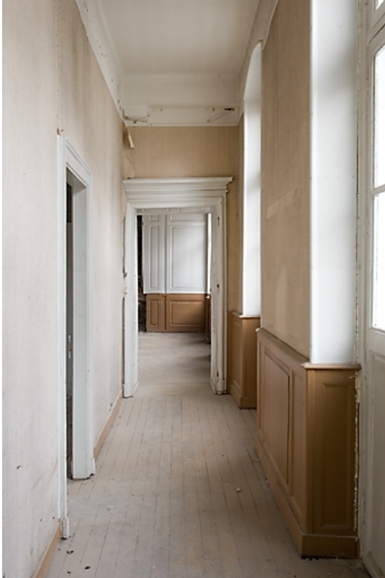
Vue d'ensemble du couloir au premier étage.

25, Besançon, 4 rue de la Vieille Monnaie, lieudit : îlot Refuge