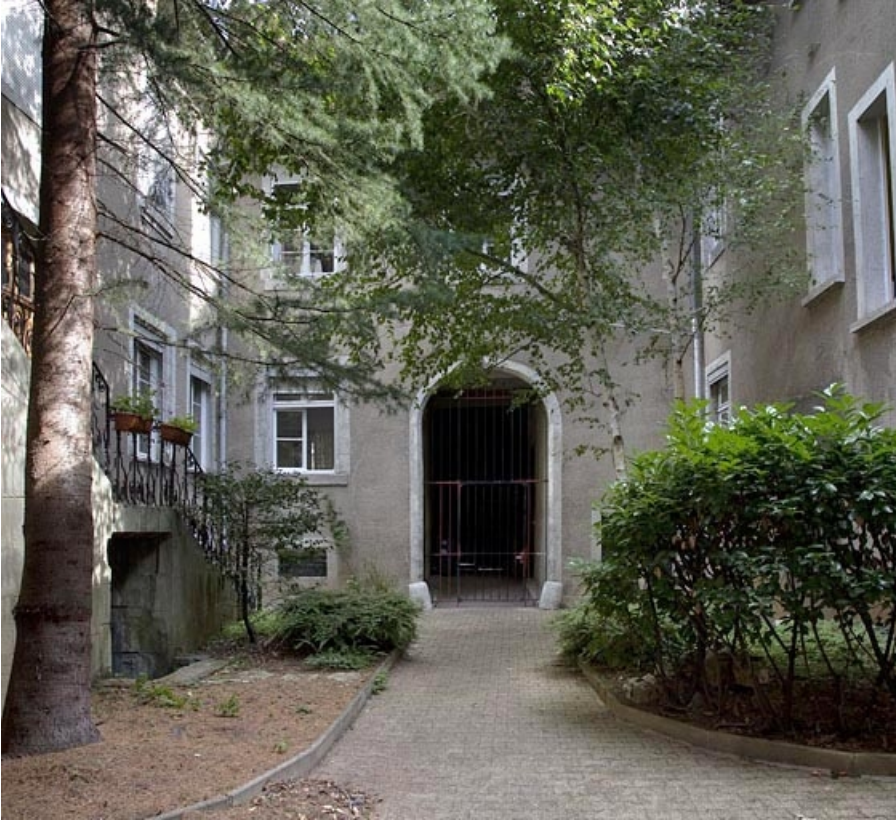
Logis principal, façade postérieure depuis le fond de la cour.

25, Besançon, 4 rue de la Vieille Monnaie, lieudit : îlot Refuge