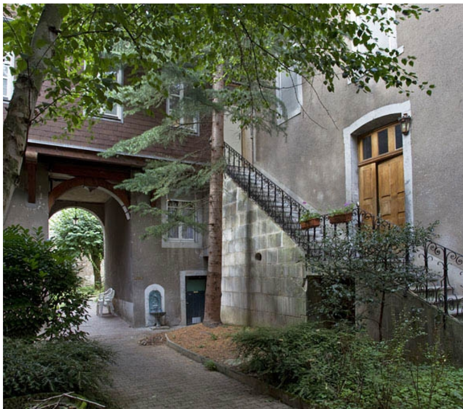
Vue d'ensemble de l'escalier extérieur du premier logis secondaire.

25, Besançon, 4 rue de la Vieille Monnaie, lieudit : îlot Refuge