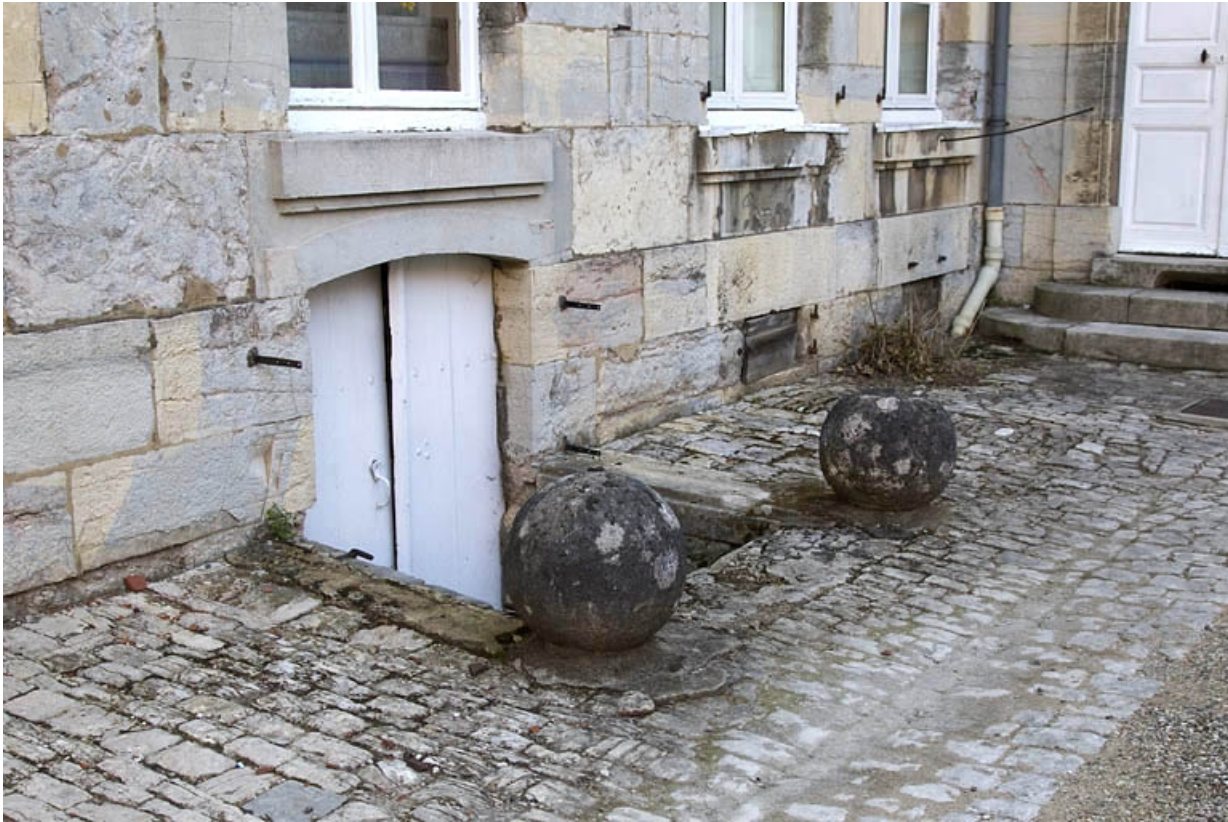
Cour : détail de l'entrée de cave.

25, Besançon, 7 rue Lecourbe, lieudit : îlot Refuge