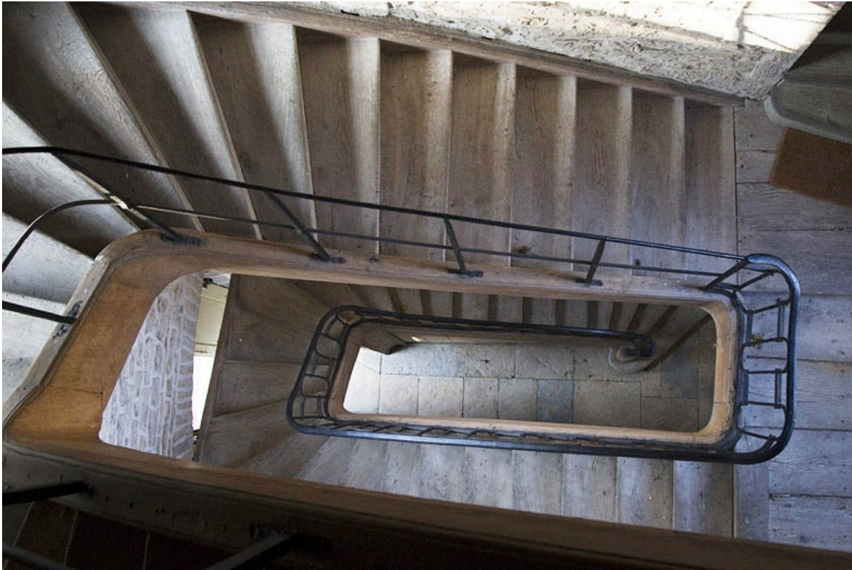
Intérieur : vue de l'escalier secondaire situé dans l'aile droite : en plongée.

25, Besançon, 7 rue Lecourbe, lieudit : îlot Refuge