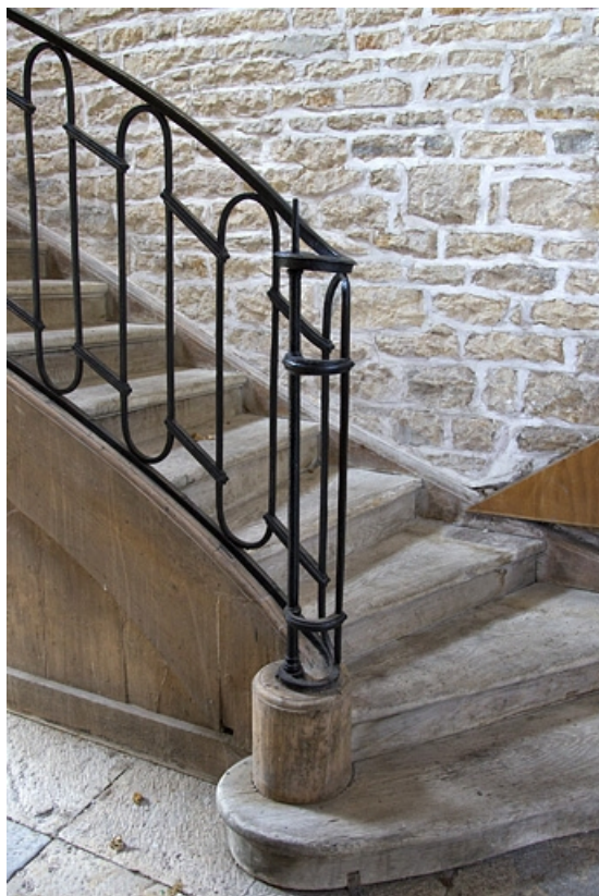
Intérieur : détail du départ de la rampe de l'escalier secondaire situé dans l'aile droite.

25, Besançon, 7 rue Lecourbe, lieudit : îlot Refuge