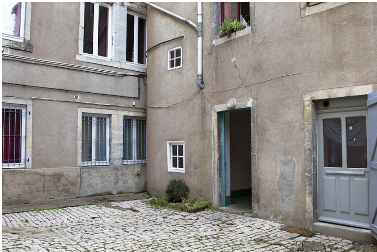
Deuxième logis secondaire : détail du rez-de-chaussée, de trois quarts droit. 25, Besançon, 14 rue de la Vieille Monnaie, lieudit : îlot Refuge