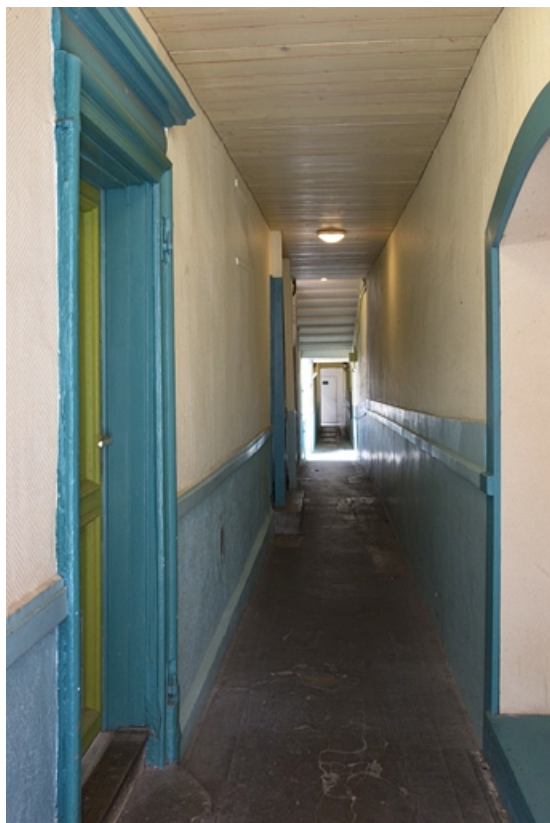
Logis principal : vue d'ensemble du couloir depuis l'entrée. 25, Besançon, 14 rue de la Vieille Monnaie, lieudit : îlot Refuge