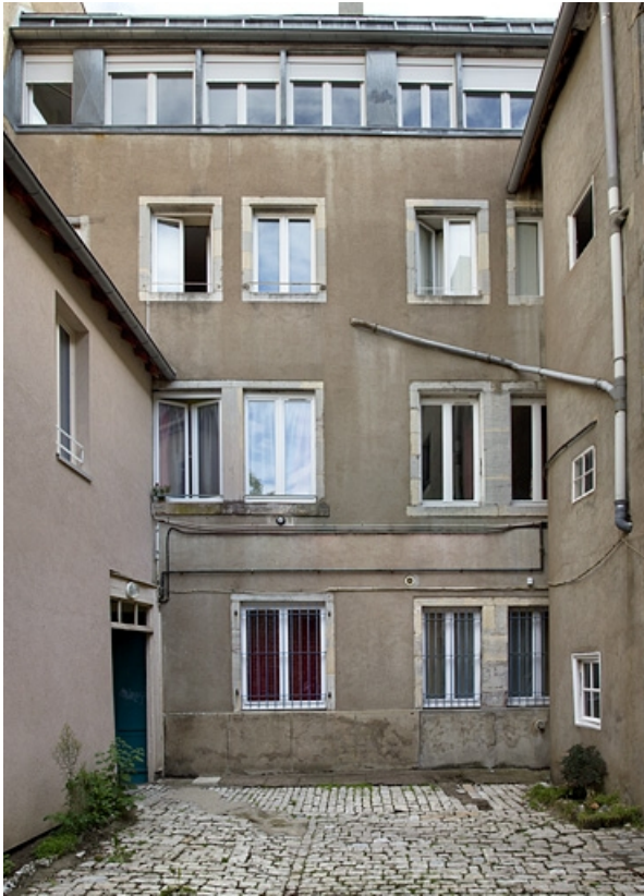
Premier logis secondaire : vue d'ensemble de la façade postérieure, de face.

25, Besançon, 14 rue de la Vieille Monnaie, lieudit : îlot Refuge