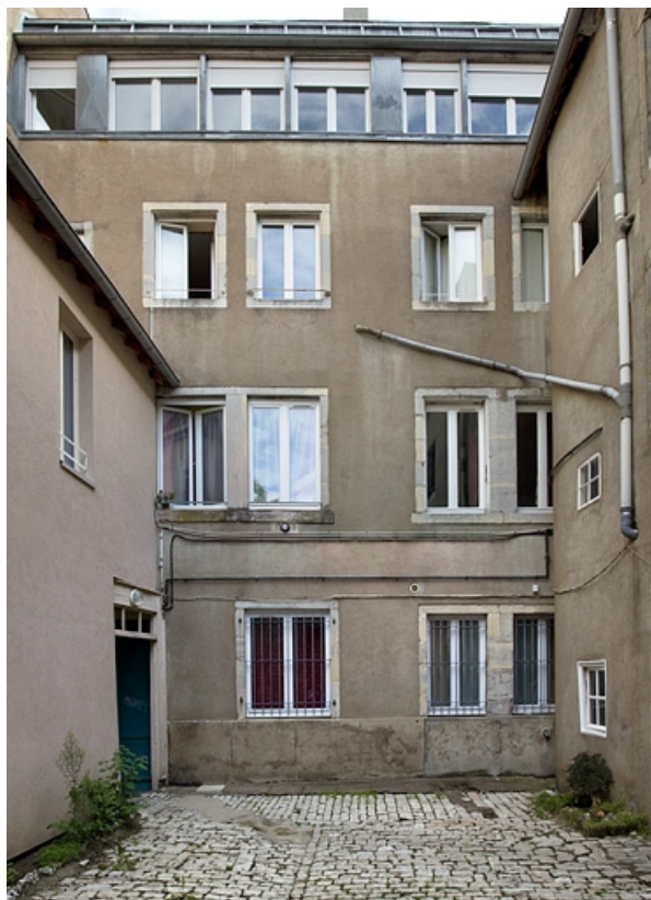
Premier logis secondaire : vue d'ensemble de la façade postérieure, de face. 25, Besançon, 14 rue de la Vieille Monnaie, lieudit : îlot Refuge