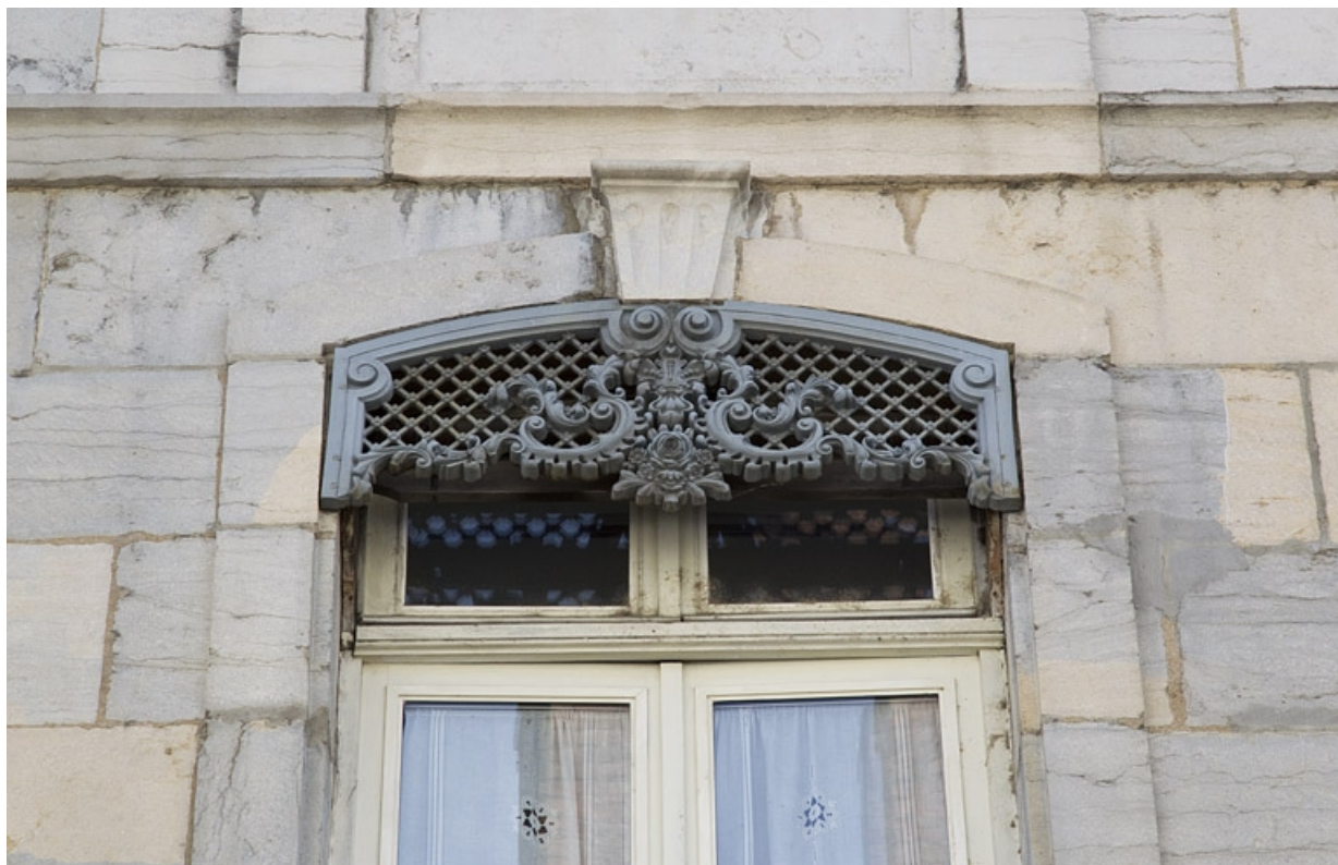
Logis principal, façade antérieure, fenêtre du premier étage : détail d'un lambrequin.

25, Besançon, 1 rue Lecourbe, lieudit : îlot Refuge