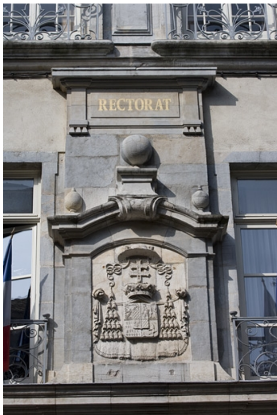
Vue d'ensemble des armoiries du cardinal Louis-François de Rohan-Chabot, situées au dessus du portail d'entrée. 25, Besançon, 10 rue de la Convention, lieudit : îlot Saint Jean