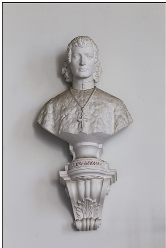
Décor de la cage d'escalier : buste du cardinal de Rohan-Chabot, archevêque.

25, Besançon, 10 rue de la Convention, lieudit : îlot Saint Jean