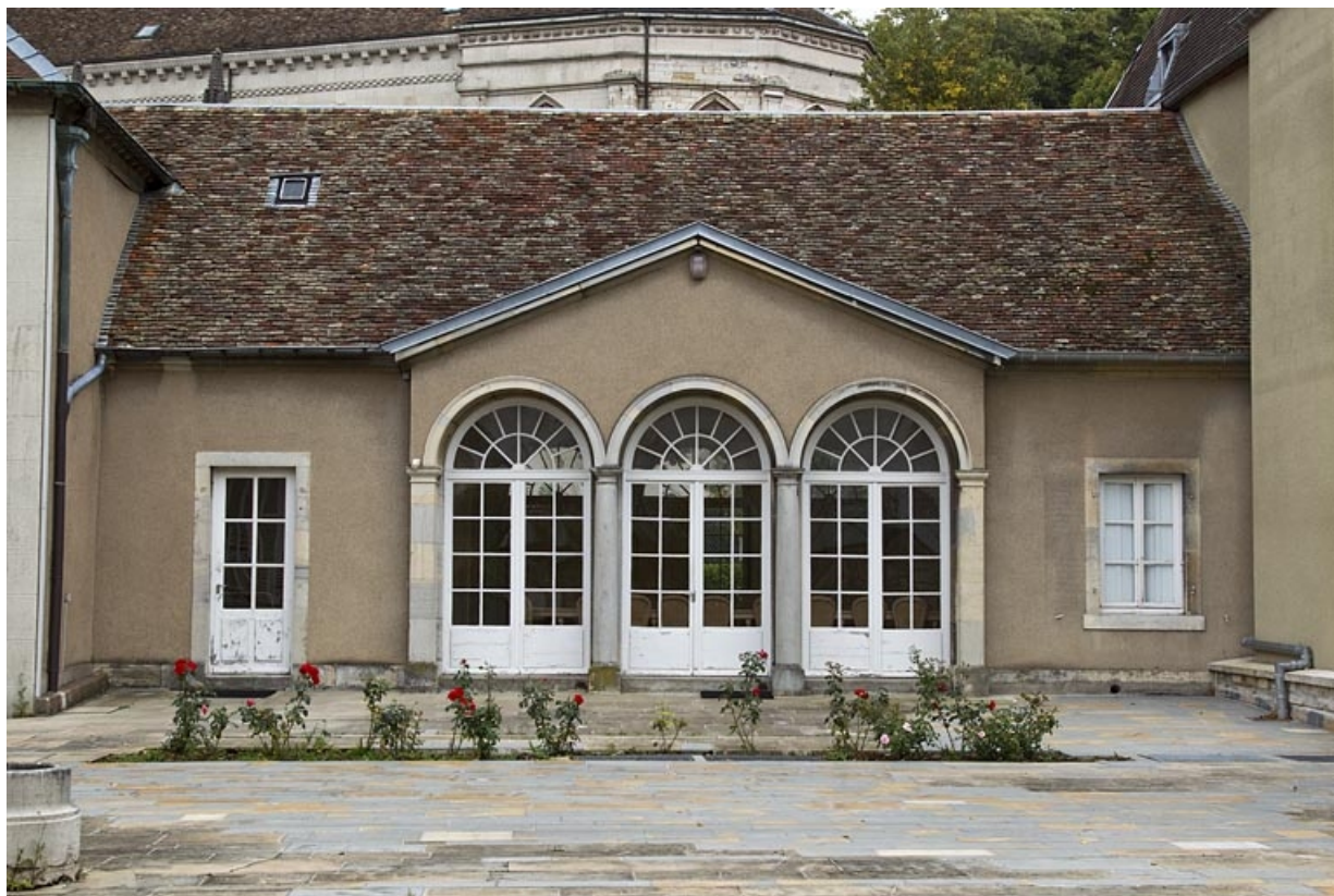
Orangerie : vue d'ensemble de la façade antérieure.

25, Besançon, 10 rue de la Convention, lieudit : îlot Saint Jean