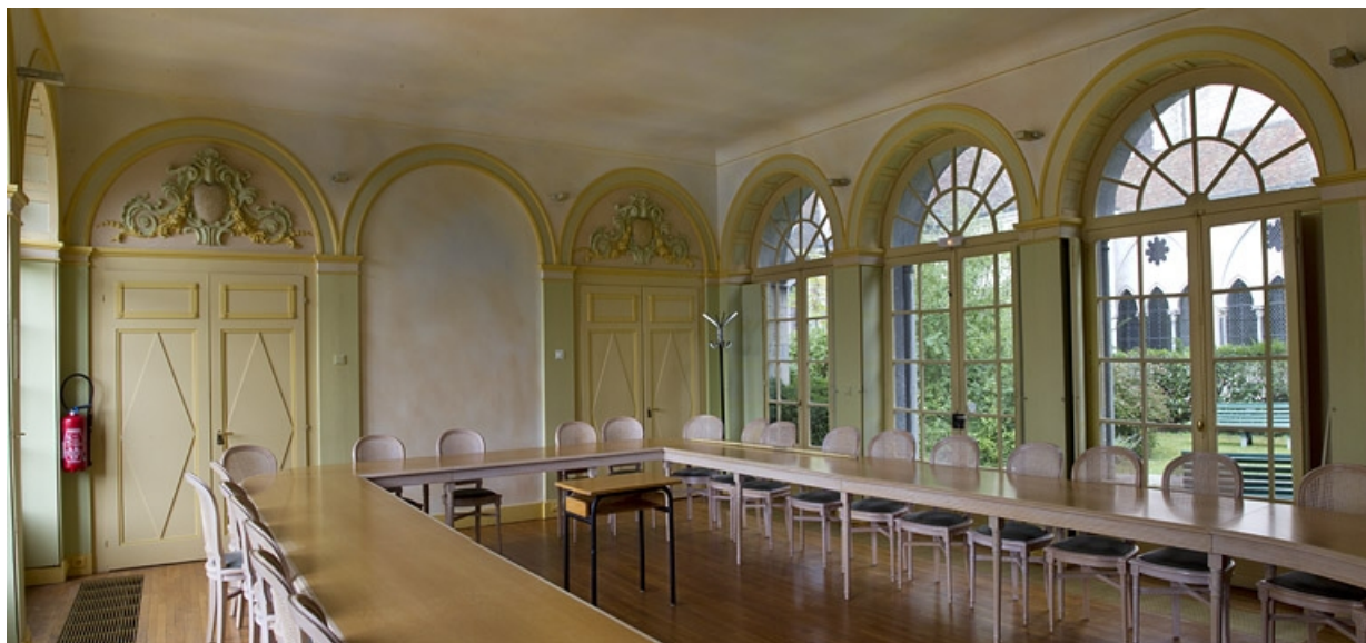
Orangerie, intérieur : vue de la pièce de trois quarts gauche.

25, Besançon, 10 rue de la Convention, lieudit : îlot Saint Jean