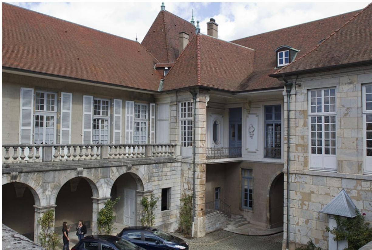
Vue d'ensemble de l'aile droite du logis depuis la terrasse, de trois quarts droit.

25, Besançon, 10 rue de la Convention, lieudit : îlot Saint Jean