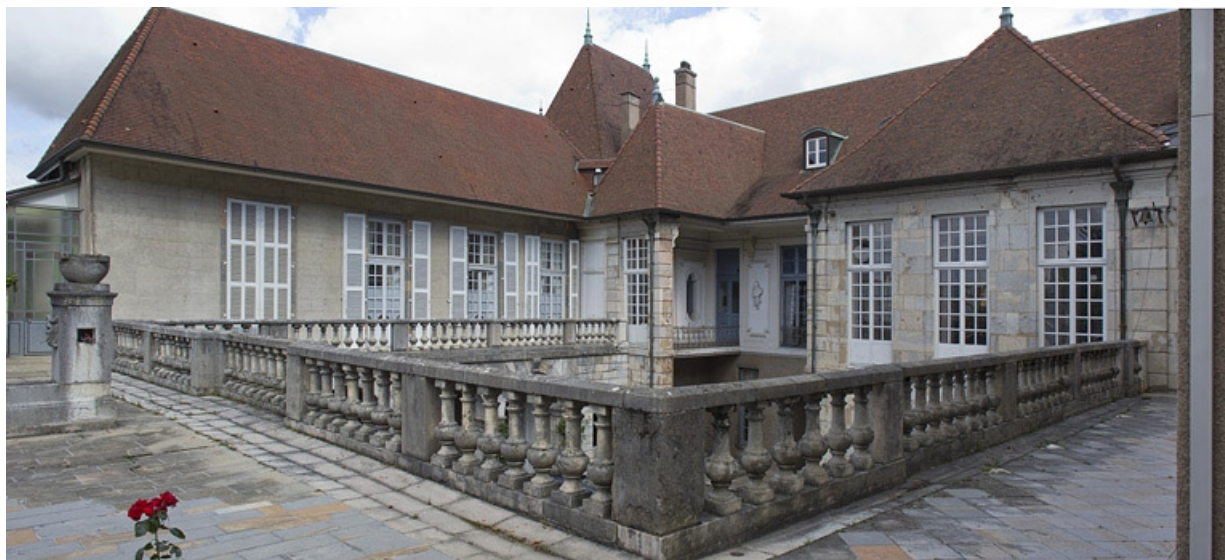
Vue du premier étage de l'aile droite du logis depuis la terrasse, de trois quarts droit.

25, Besançon, 10 rue de la Convention, lieudit : îlot Saint Jean