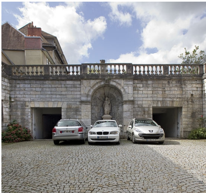
Vue d'ensemble du soubassement de la terrasse au fond de la cour, de face.

25, Besançon, 10 rue de la Convention, lieudit : îlot Saint Jean