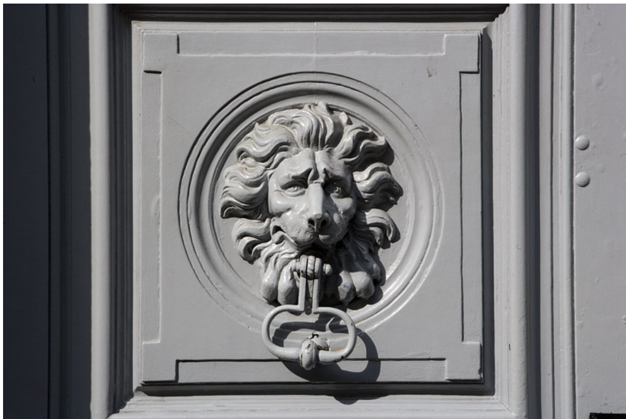
Portail d'entrée : Détail d'une tête de lion portant le heurtoir, de face.

25, Besançon, 10 rue de la Convention, lieudit : îlot Saint Jean