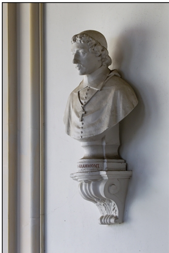
Décor de la cage d'escalier : buste d'Antoine-Pierre II de Grammont, archevêque.

25, Besançon, 10 rue de la Convention, lieudit : îlot Saint Jean