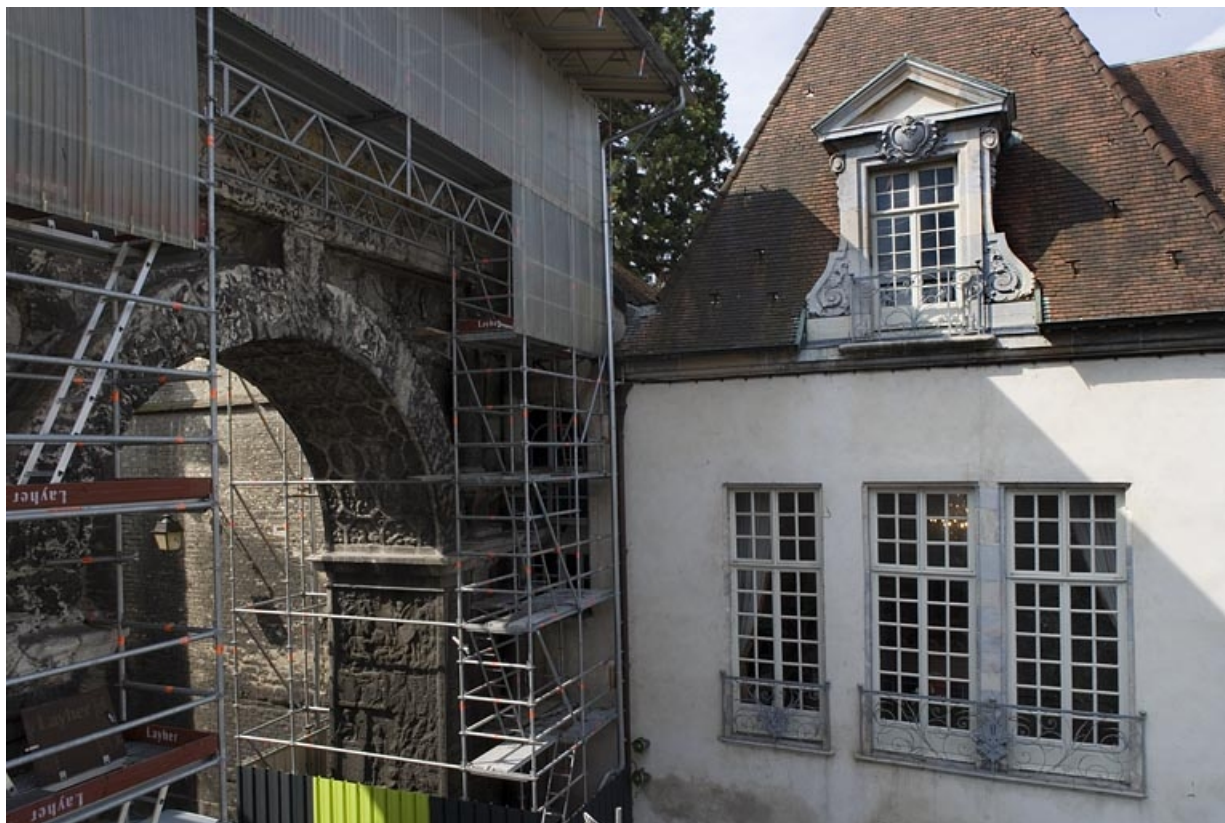
Détail de la partie supérieure de l'avant-corps gauche, vue éloignée.

25, Besançon, 10 rue de la Convention, lieudit : îlot Saint Jean