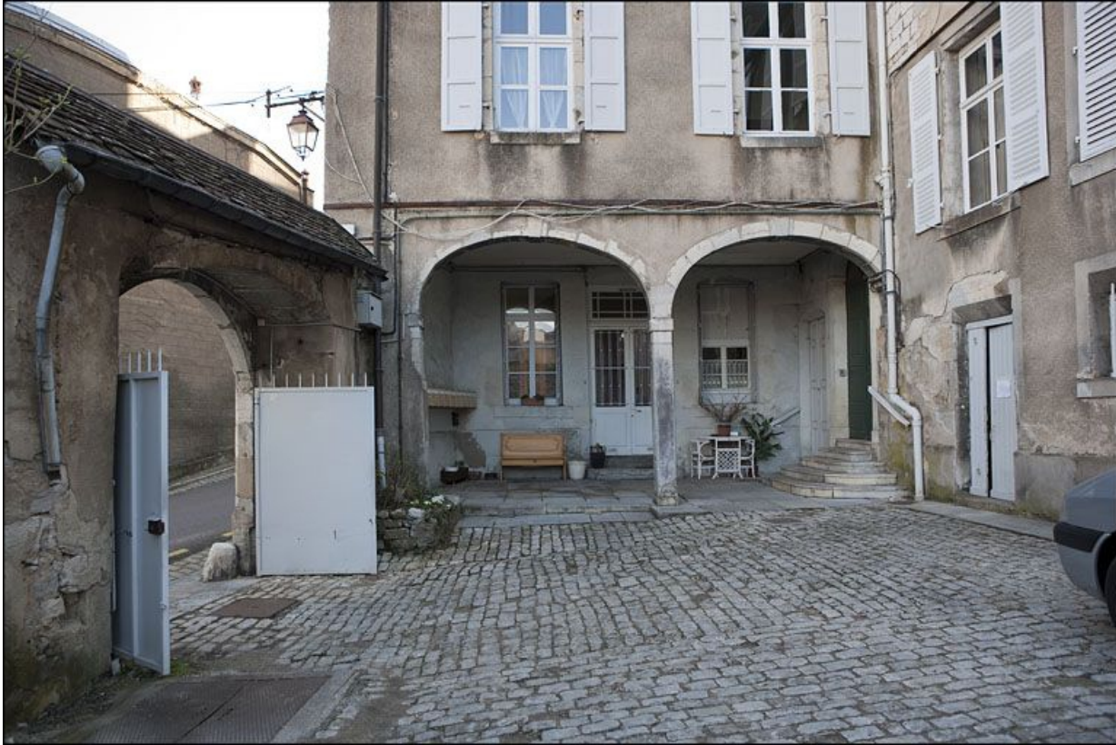
Détail du rez-de-chaussée de l'aile gauche, de face.

25, Besançon, 1 rue des Fusillés de la Résistance, lieudit : îlot Chapitre