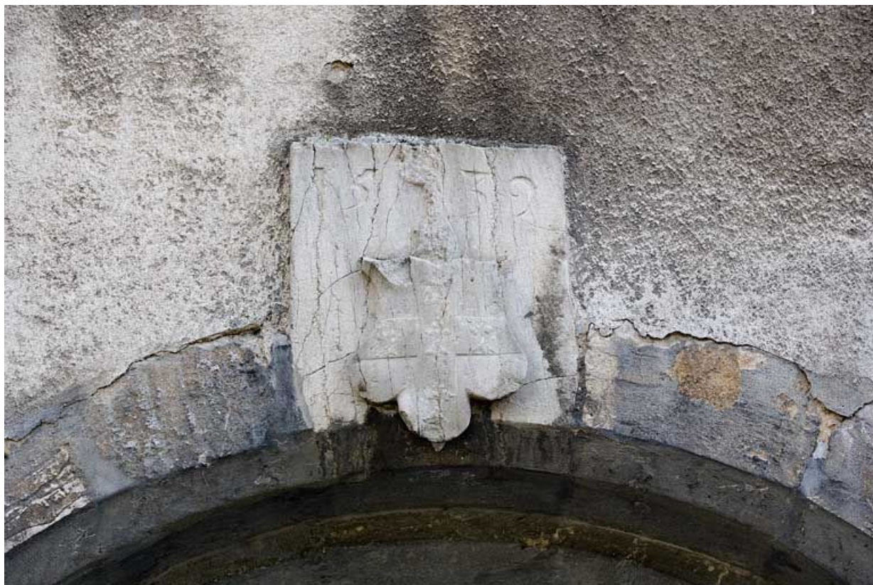
Détail d'un blason daté 1532 sur une entrée de cave.

25, Besançon, 1 rue des Fusillés de la Résistance, lieudit : îlot Chapitre