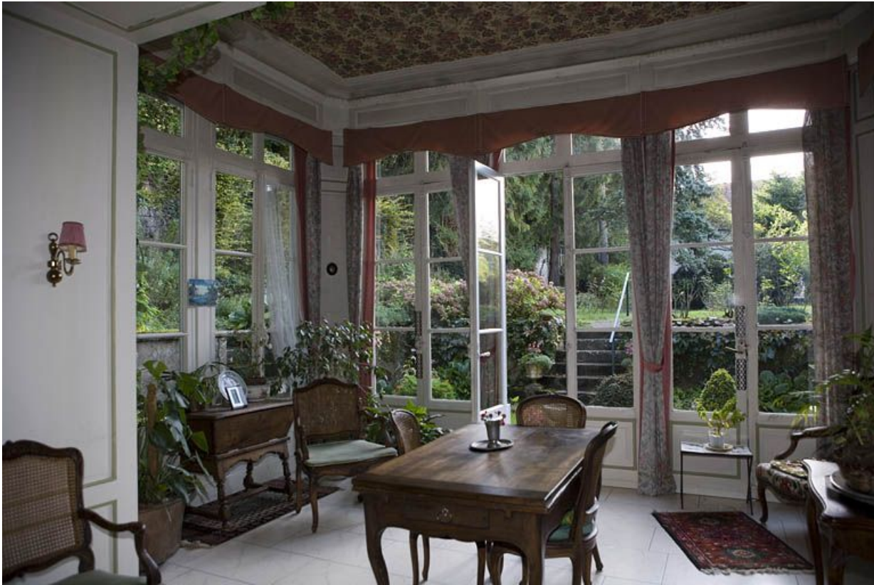
Intérieur : vue d'ensemble de la salle à manger d'été de trois quarts droit.

25, Besançon, 1 rue des Fusillés de la Résistance, lieudit : îlot Chapitre