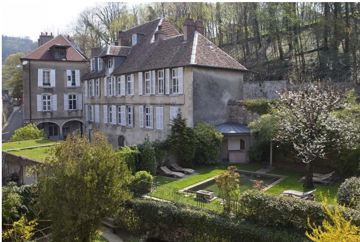
Vue d'ensemble de l'édifice de trois quarts droit, depuis le jardin voisin.

25, Besançon, 1 rue des Fusillés de la Résistance, lieudit : îlot Chapitre