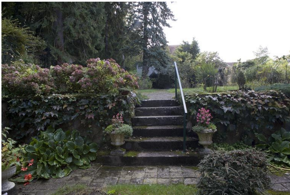
Vue du jardin à droite de l'édifice depuis la courette.

25, Besançon, 1 rue des Fusillés de la Résistance, lieudit : îlot Chapitre