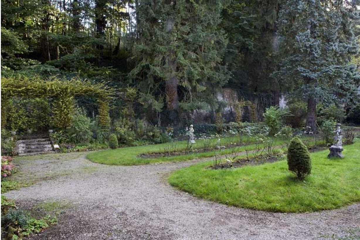
Vue du jardin à droite de l'édifice.

25, Besançon, 1 rue des Fusillés de la Résistance, lieudit : îlot Chapitre