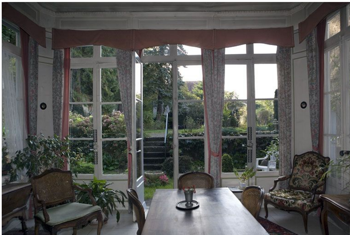
Intérieur : vue d'ensemble de la salle à manger d'été depuis le fond de la pièce.

25, Besançon, 1 rue des Fusillés de la Résistance, lieudit : îlot Chapitre