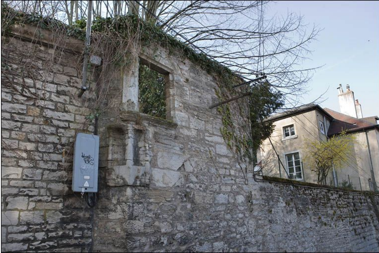
Restes d'une ouverture et de niches aménagées dans le mur du jardin longeant la rue.

25, Besançon, 1 rue des Fusillés de la Résistance, lieudit : îlot Chapitre