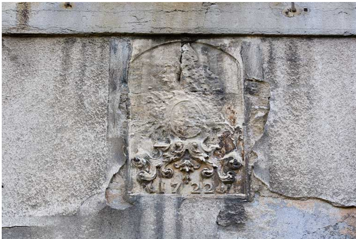
Détail d'un blason bûché daté 1722 sur une baie du rez-de-chaussée.

25, Besançon, 1 rue des Fusillés de la Résistance, lieudit : îlot Chapitre