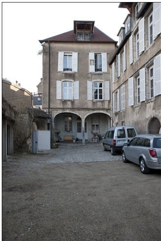
Vue d'ensemble de l'aile gauche depuis la cour, de face.

25, Besançon, 1 rue des Fusillés de la Résistance, lieudit : îlot Chapitre