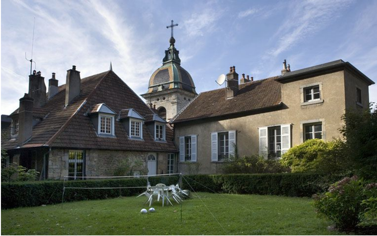
Vue d'ensemble de l'aile gauche depuis le jardin situé à gauche de la maison.

25, Besançon, 1 rue des Fusillés de la Résistance, lieudit : îlot Chapitre