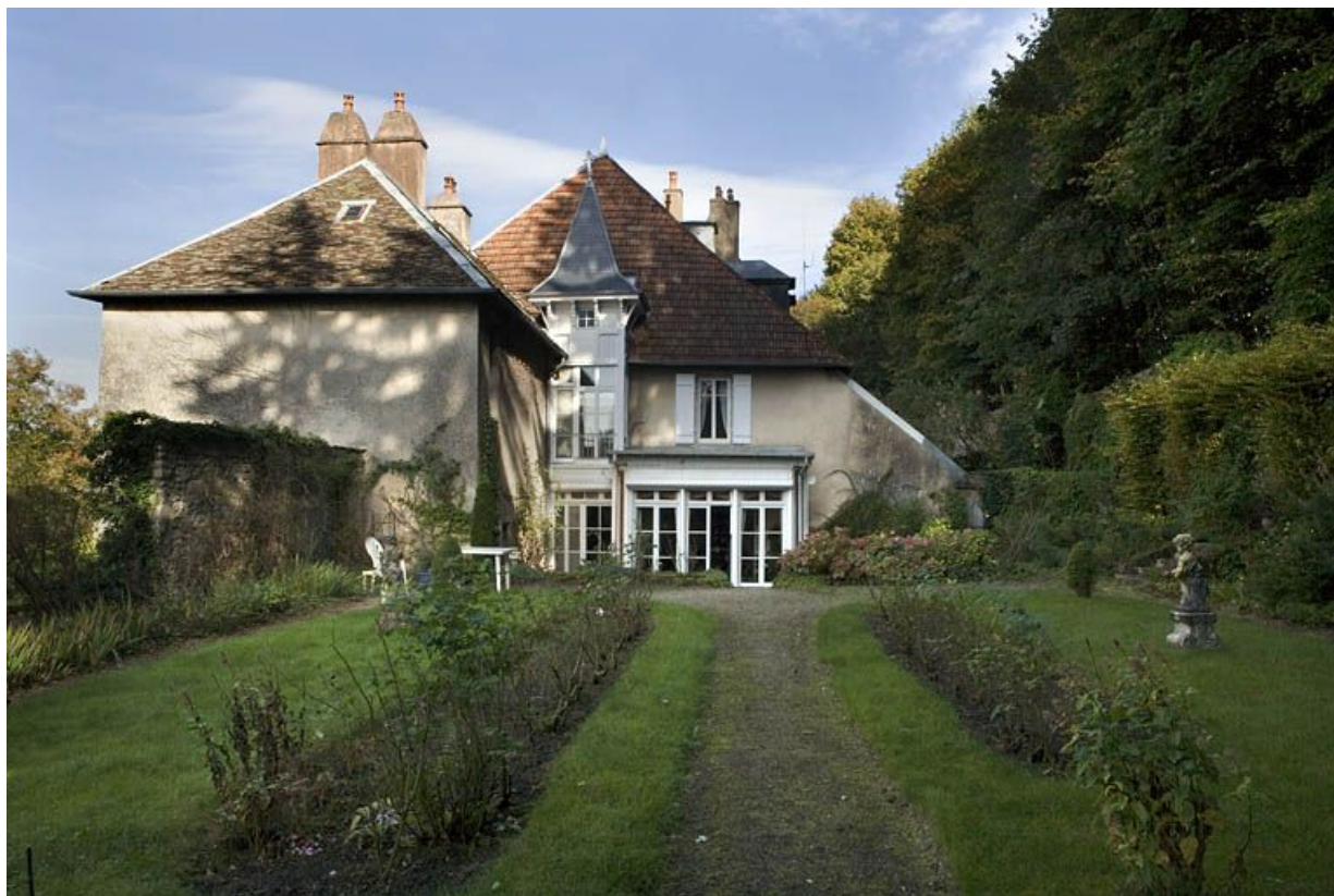
Façade latérale droite : vue éloignée depuis le fond du jardin.

25, Besançon, 1 rue des Fusillés de la Résistance, lieudit : îlot Chapitre