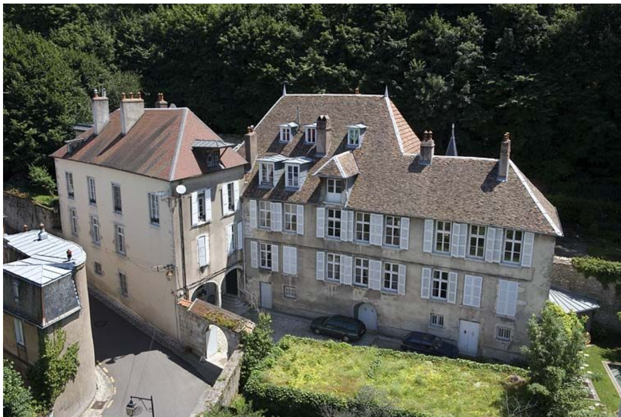
Vue plongeante sur la demeure depuis le clocher de la cathédrale Saint-Jean.

25, Besançon, 1 rue des Fusillés de la Résistance, lieudit : îlot Chapitre