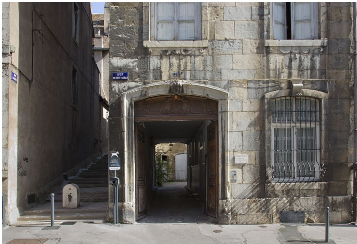
Logis principal : détail du passage cochier depuis la rue, vue éloignée.

25, Besançon, 25 rue Renan, lieudit : îlot Cingle