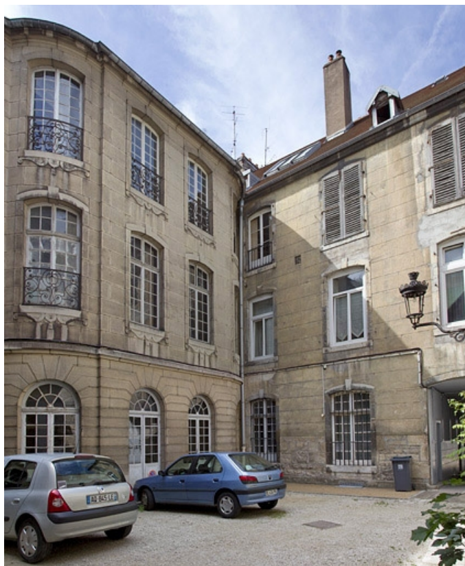
Logis principal : détail de la façade postérieure et de l'aile droite de l'escalier, de trois quarts gauche. 25, Besançon, 25 rue Renan, lieudit : îlot Cingle