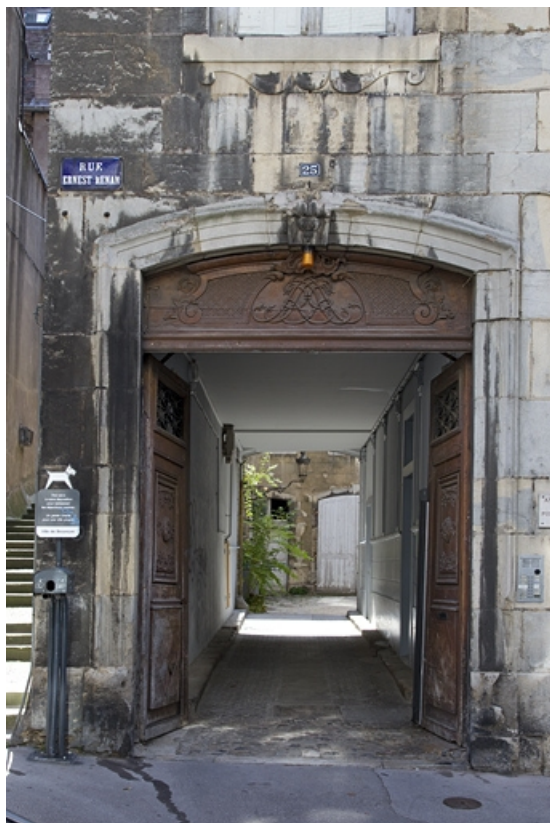
Logis principal : détail du passage cocher depuis la rue. 25, Besançon, 25 rue Renan, lieudit : îlot Cingle