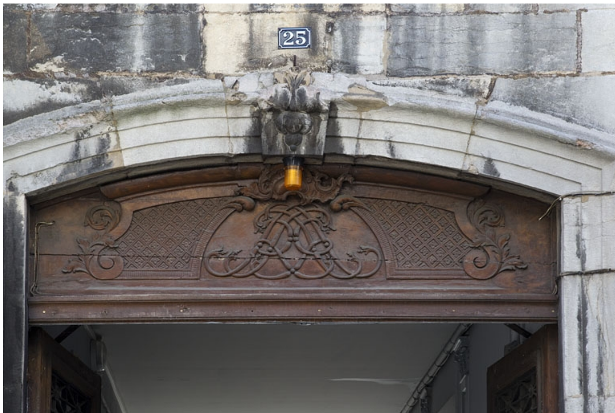
Logis principal : détail du décor du tympan en menuiserie de la porte d'entrée.

25, Besançon, 25 rue Renan, lieudit : îlot Cingle