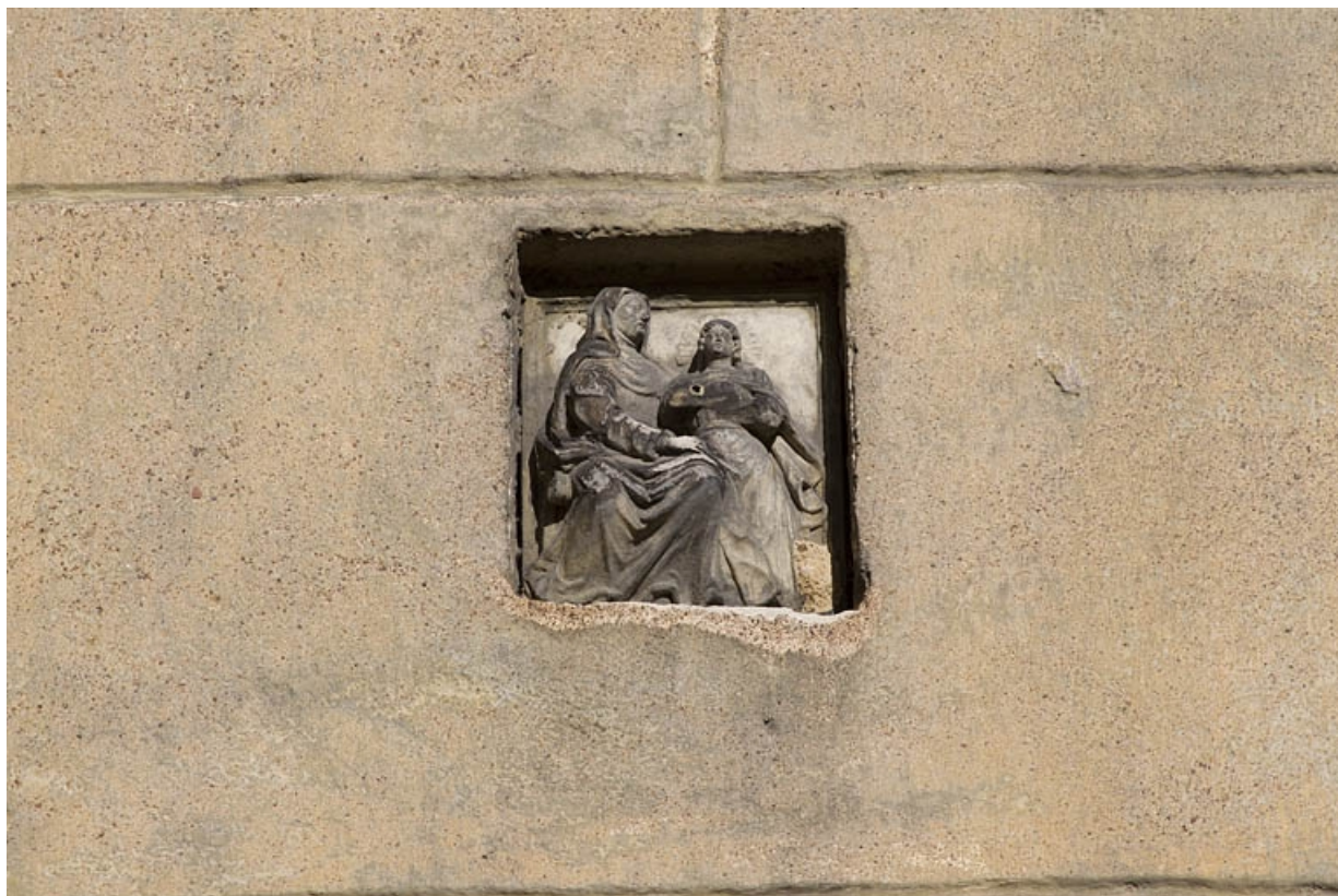
Mur de la cour : détail d'une sculpture représentant sainte Anne et la Vierge.

25, Besançon, 25 rue Renan, lieudit : îlot Cingle