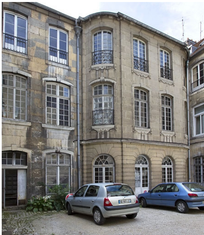
Logis principal : détail de l'aile droite de l'escalier, de trois quarts gauche. 25, Besançon, 25 rue Renan, lieudit : îlot Cingle