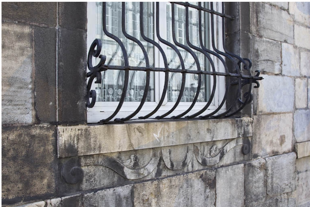
Logis principal, façade antérieure, rez-de-chaussée : détail de la partie inférieure d'une grille de fenêtre. 25, Besançon, 25 rue Renan, lieudit : îlot Cingle