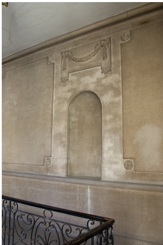
Aile de l'escalier : détail du décor de la cage. 25, Besançon, 25 rue Renan, lieudit : îlot Cingle