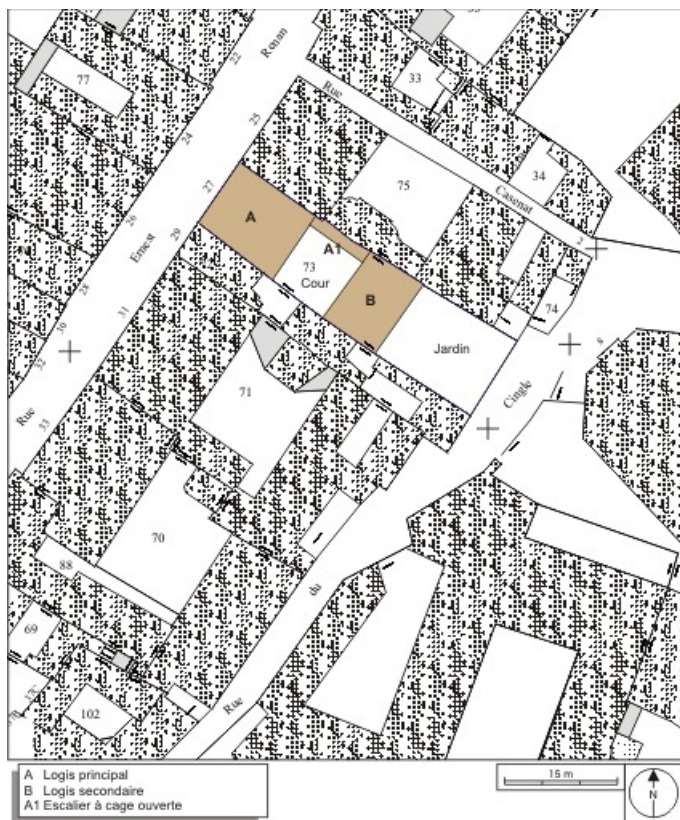
Plan masse et de situation. Extrait du plan cadastral, 1974, section AM. 25, Besançon, 27 rue Renan, lieudit : îlot Cingle