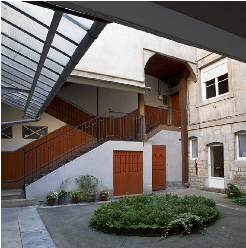
Vue d'ensemble de l'escalier à cage ouverte sur cour, de trois quarts gauche. 25, Besançon, 27 rue Renan, lieudit : îlot Cingle