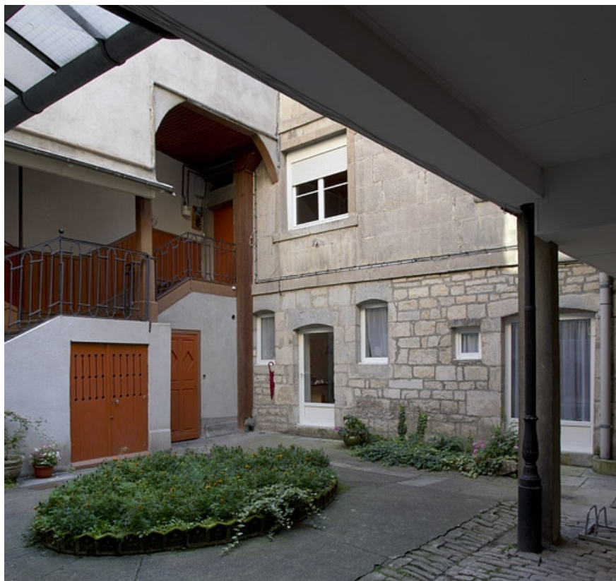
Vue d'ensemble de l'escalier à cage ouverte et du logis secondaire, de trois quarts gauche. 25, Besançon, 27 rue Renan, lieudit : îlot Cingle