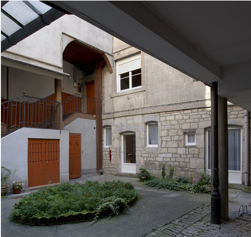
Vue d'ensemble de l'escalier à cage ouverte et du logis secondaire, de trois quarts gauche.

25, Besançon, 27 rue Renan, lieudit : îlot Cingle