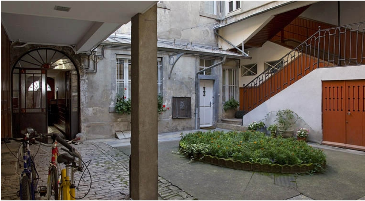
Vue d'ensemble de la cour depuis le fond, de trois quarts gauche.

25, Besançon, 27 rue Renan, lieudit : îlot Cingle