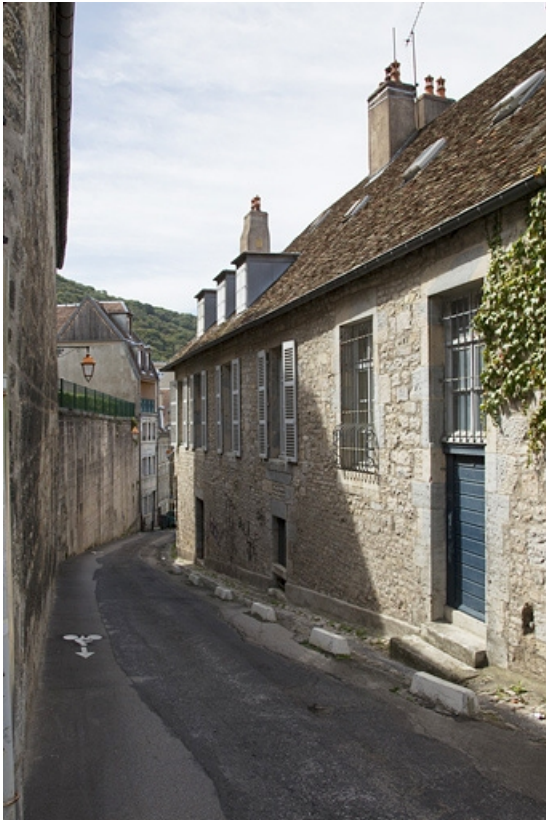
Troisième logis secondaire, façade postérieure : de trois quarts droit.

25, Besançon, 33, 33 bis rue Renan, lieudit : îlot Cingle