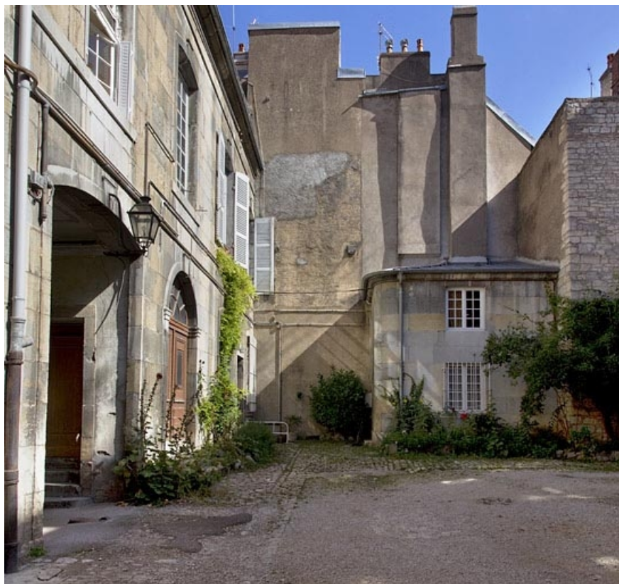
Façade postérieure de logis principal et édicule à gauche de la cour, de face. 25, Besançon, 33, 33 bis rue Renan, lieudit : îlot Cingle