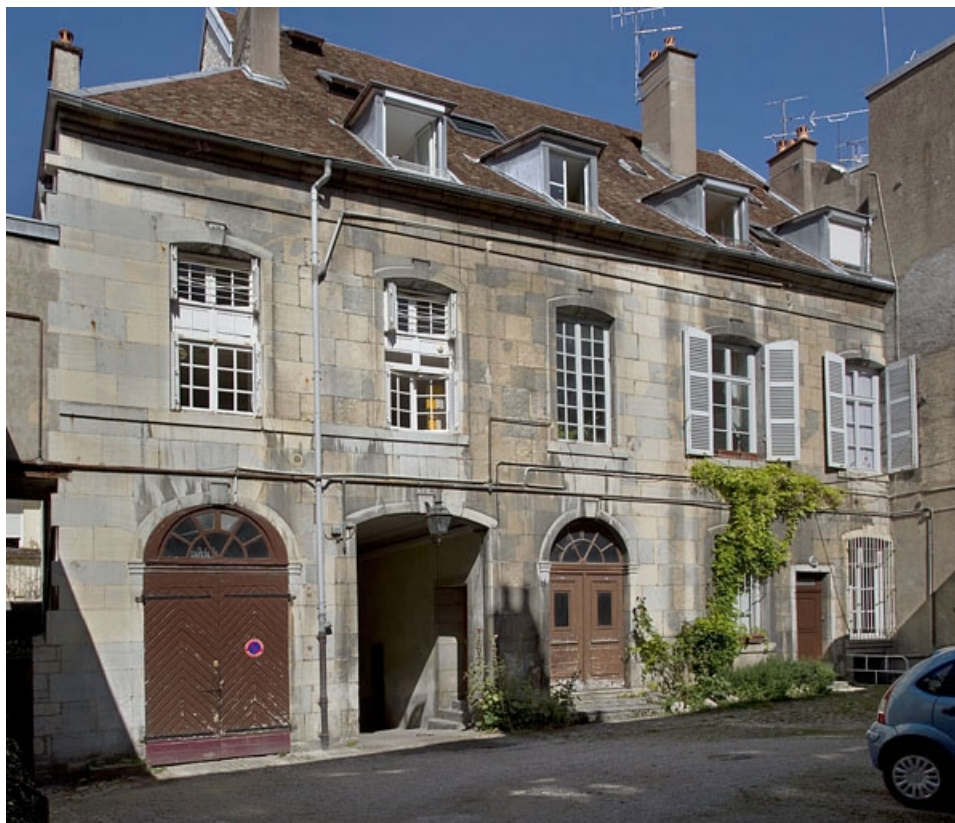
Logis principal, façade postérieure : de trois quarts gauche.

25, Besançon, 33, 33 bis rue Renan, lieudit : îlot Cingle