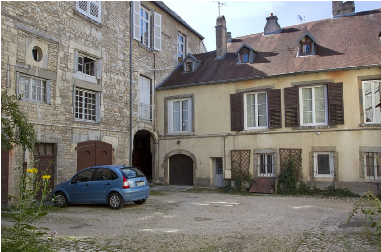
Deuxième logis secondaire, façade antérieure : de trois quarts droit.

25, Besançon, 33, 33 bis rue Renan, lieudit : îlot Cingle