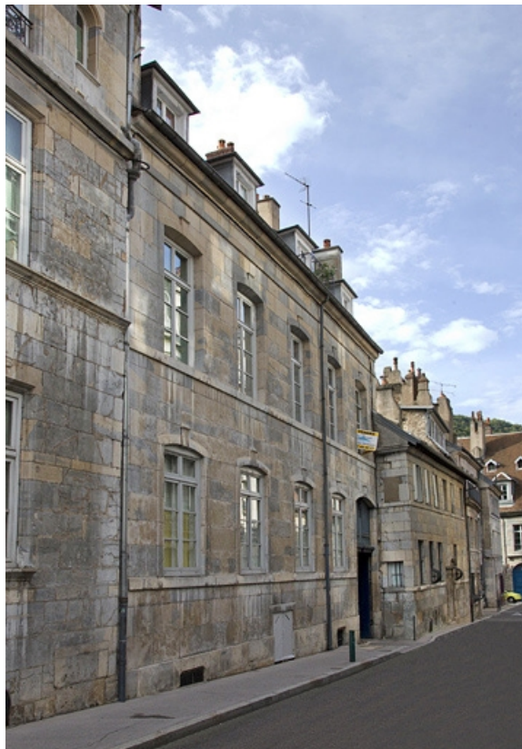
Vue d'ensemble depuis la rue, de trois quarts gauche.

25, Besançon, 33, 33 bis rue Renan, lieudit : îlot Cingle