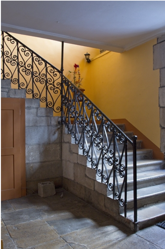
Premier logis secondaire : détail du départ de l'escalier.

25, Besançon, 33, 33 bis rue Renan, lieudit : îlot Cingle