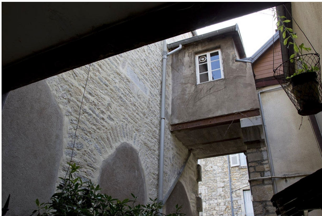
Détail du passage suspendu à l'entrée de la courette débouchant sur la cour principale.

25, Besançon, 33, 33 bis rue Renan, lieudit : îlot Cingle