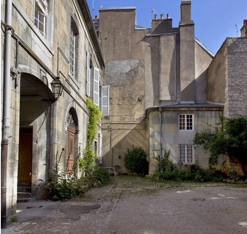
Façade postérieure de logis principal et édicule à gauche de la cour, de face. 25, Besançon, 33, 33 bis rue Renan, lieudit : îlot Cingle