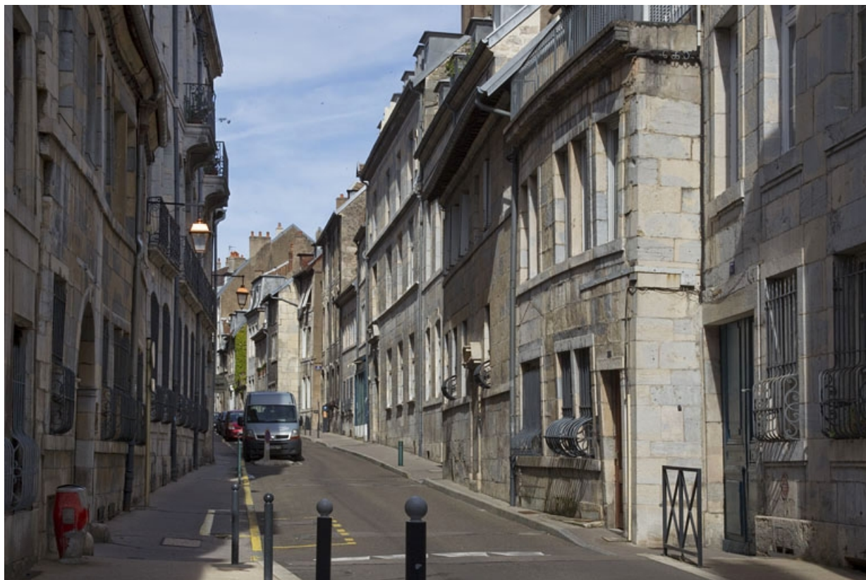
Vue d'ensemble éloignée depuis la rue, de trois quarts droit.

25, Besançon, 33, 33 bis rue Renan, lieudit : îlot Cingle