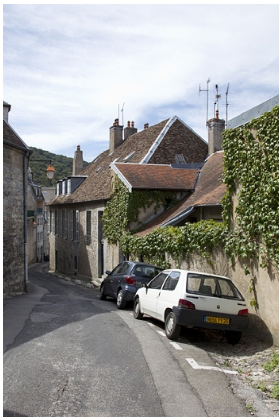
Troisième logis secondaire, façade postérieure : de trois quarts droit, vue éloignée. 25, Besançon, 33, 33 bis rue Renan, lieudit : îlot Cingle