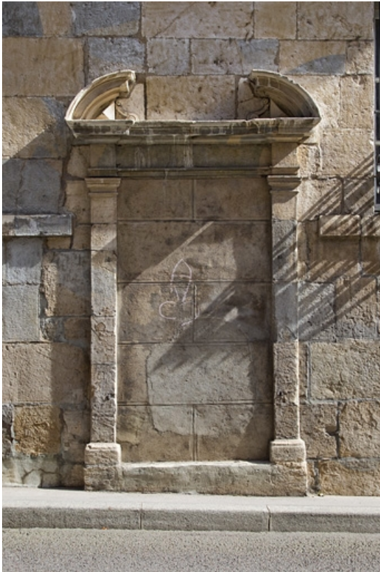
Premier logis secondaire, façade antérieure : détail d'une porte murée.

25, Besançon, 33, 33 bis rue Renan, lieudit : îlot Cingle