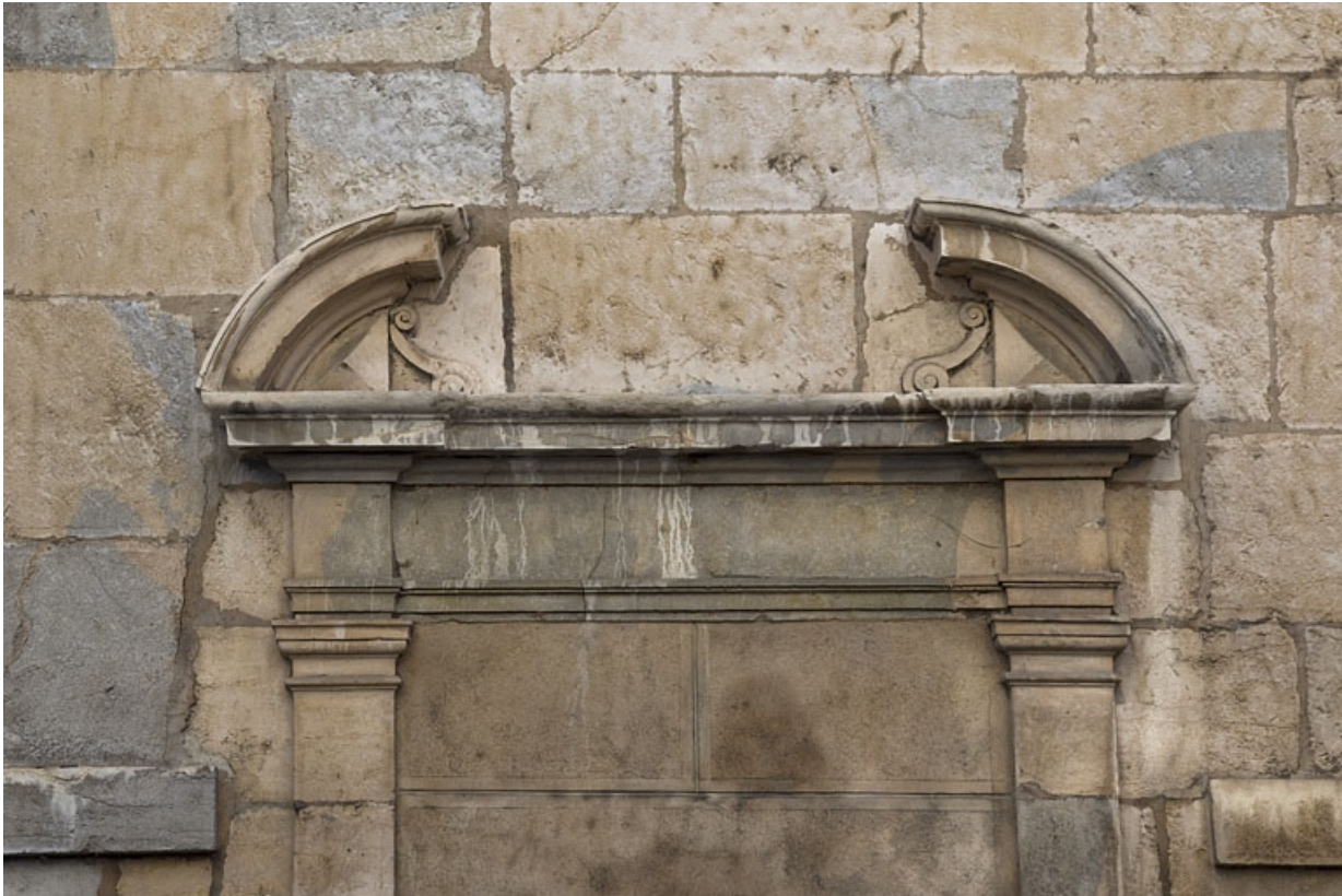
Premier logis secondaire, façade antérieure : détail du fronton interrompu de la porte murée.

25, Besançon, 33, 33 bis rue Renan, lieudit : îlot Cingle