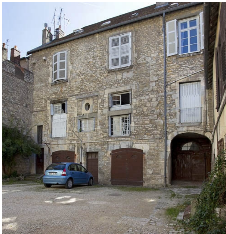
Troisième logis secondaire, façade antérieure : de trois quarts droit.

25, Besançon, 33, 33 bis rue Renan, lieudit : îlot Cingle