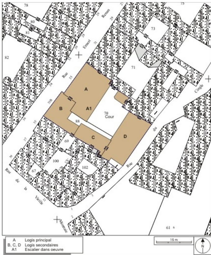
Plan masse et de situation Extrait du plan cadastral, 1974, section AM. 25, Besançon, 33, 33 bis rue Renan, lieudit : îlot Cingle