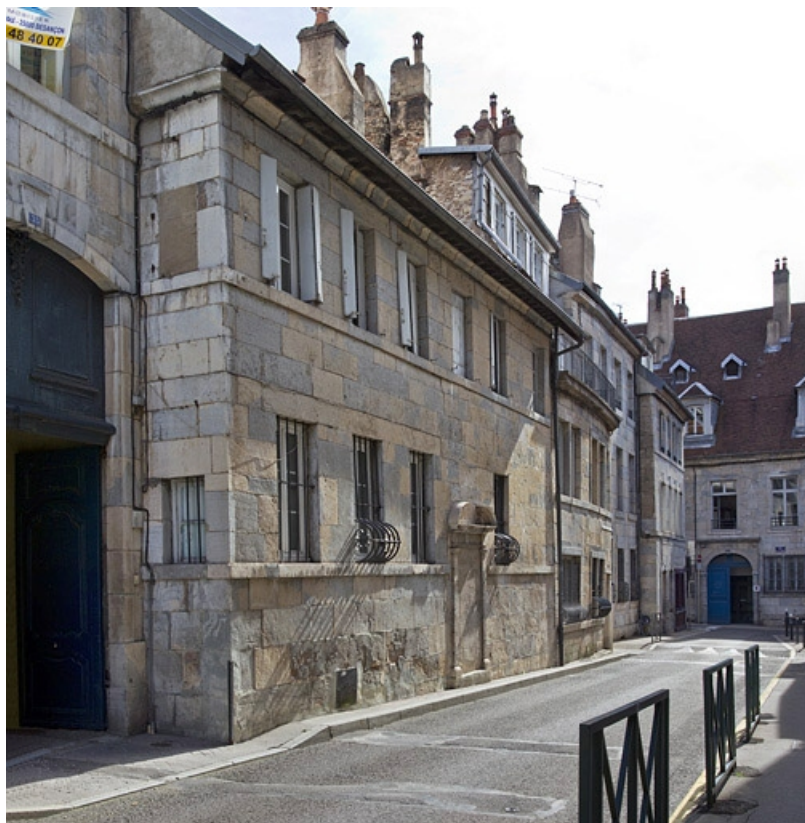
Vue d'ensemble du premier logis secondaire depuis la rue, de trois quarts gauche.

25, Besançon, 33, 33 bis rue Renan, lieudit : îlot Cingle