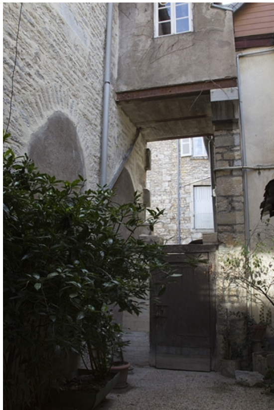
Détail de la courette débouchant sur la cour principale.

25, Besançon, 33, 33 bis rue Renan, lieudit : îlot Cingle