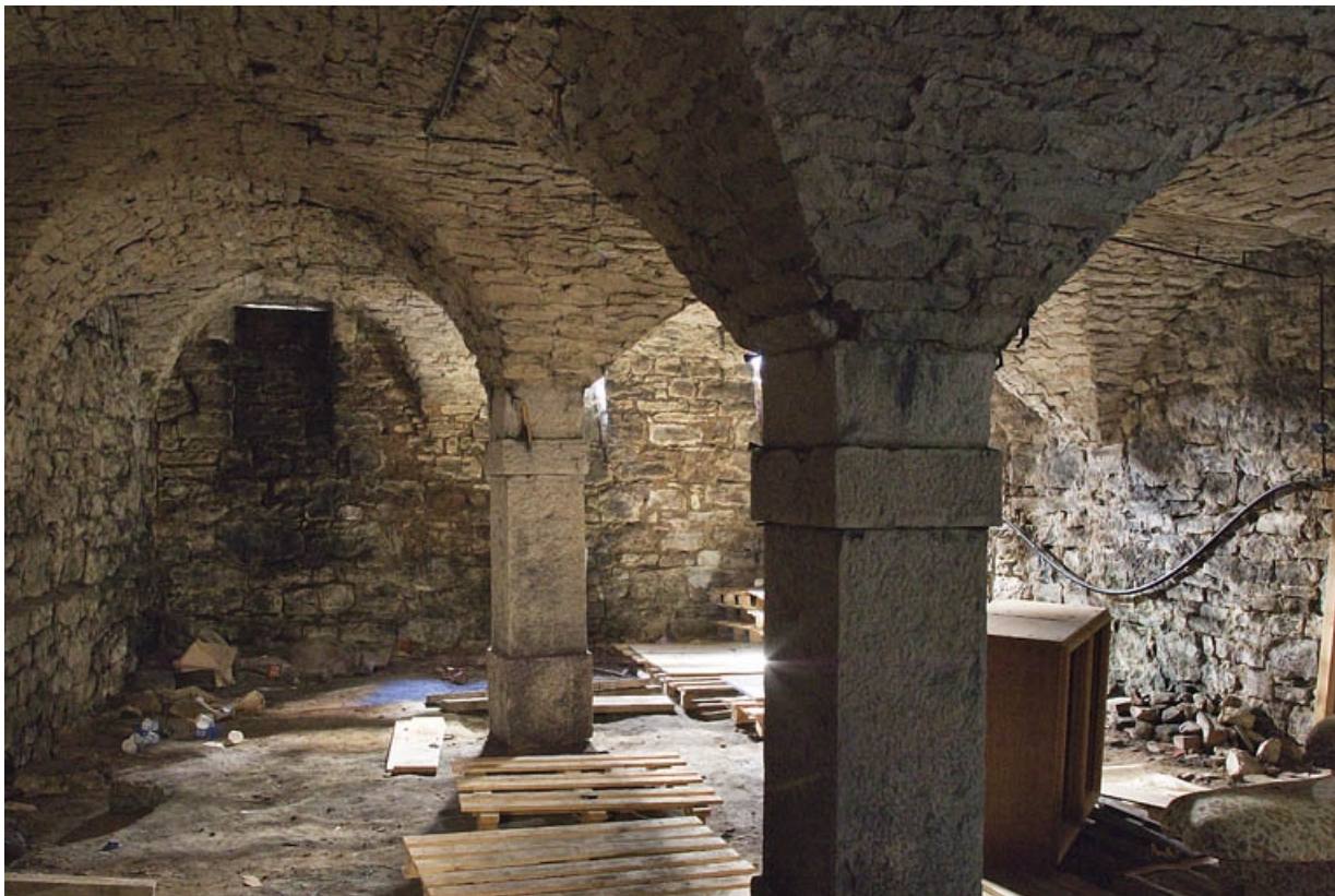
Logis principal : vue de la cave, depuis l'entrée.

25, Besançon, 37 rue Renan, lieudit : îlot Cingle