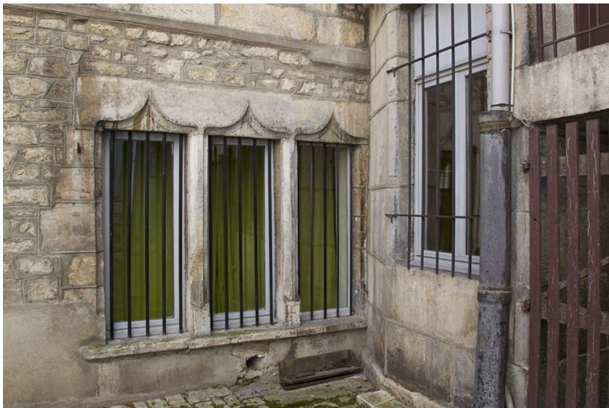
Façade antérieure du premier logis secondaire, rez-de-chaussée : détail des baies en accolade. 25, Besançon, 37 rue Renan, lieudit : îlot Cingle