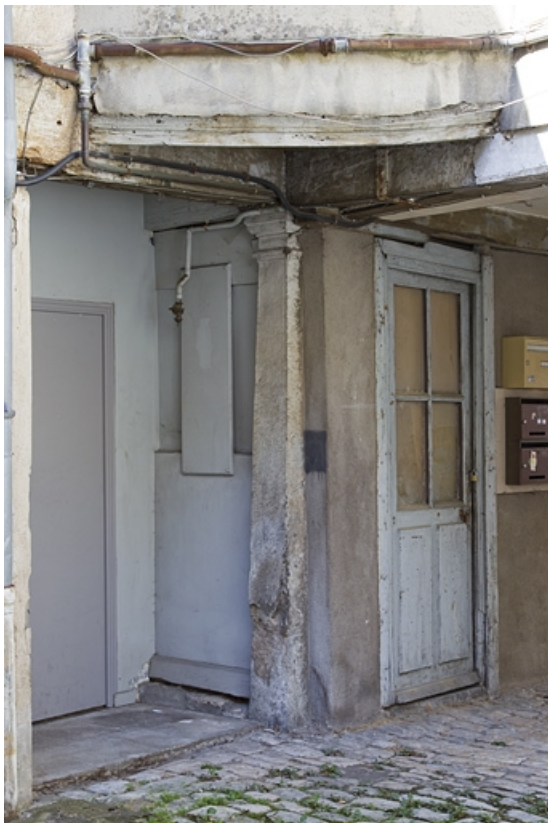
Façade postérieure du premier logis secondaire, vestiges supposés d'un portique : détail d'un pilier. 25, Besançon, 37 rue Renan, lieudit : îlot Cingle