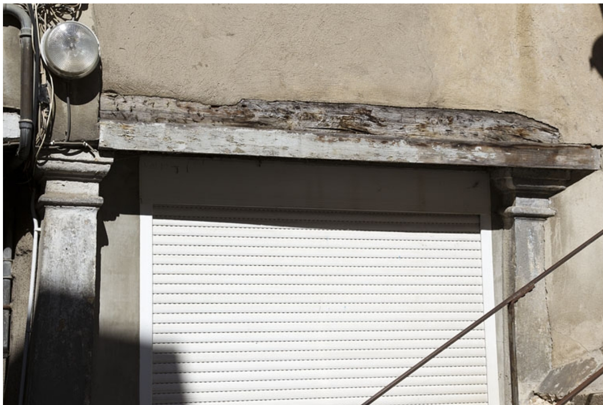
Façade postérieure du premier logis secondaire, vestiges supposés d'un portique : détail de deux piliers. 25, Besançon, 37 rue Renan, lieudit : flot Cingle