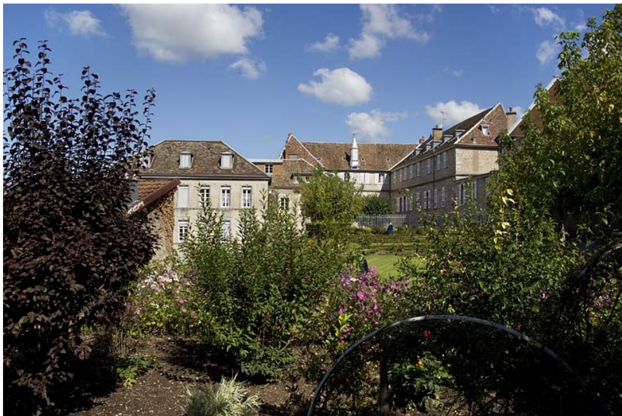
Vue d'ensemble de l'édifice depuis le fond du jardin.

25, Besançon, 6 rue du Palais, lieudit : îlot Cingle