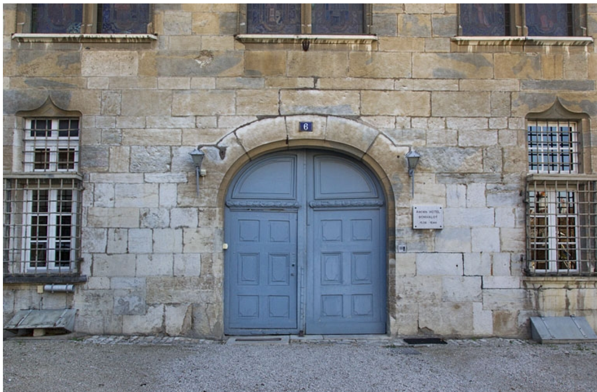
Logis principal, façade antérieure : détail du portail d'entrée.

25, Besançon, 6 rue du Palais, lieudit : îlot Cingle