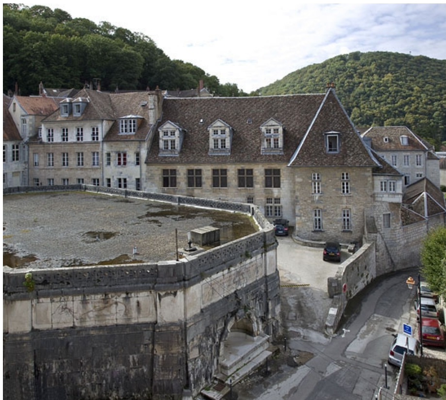
Vue d'ensemble de l'édifice depuis une fenêtre du vieil archevêché.

25, Besançon, 6 rue du Palais, lieudit : îlot Cingle