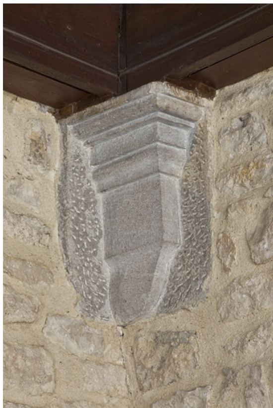
Logis principal, portique : détail d'une console supportant le plafond.

25, Besançon, 6 rue du Palais, lieudit : îlot Cingle