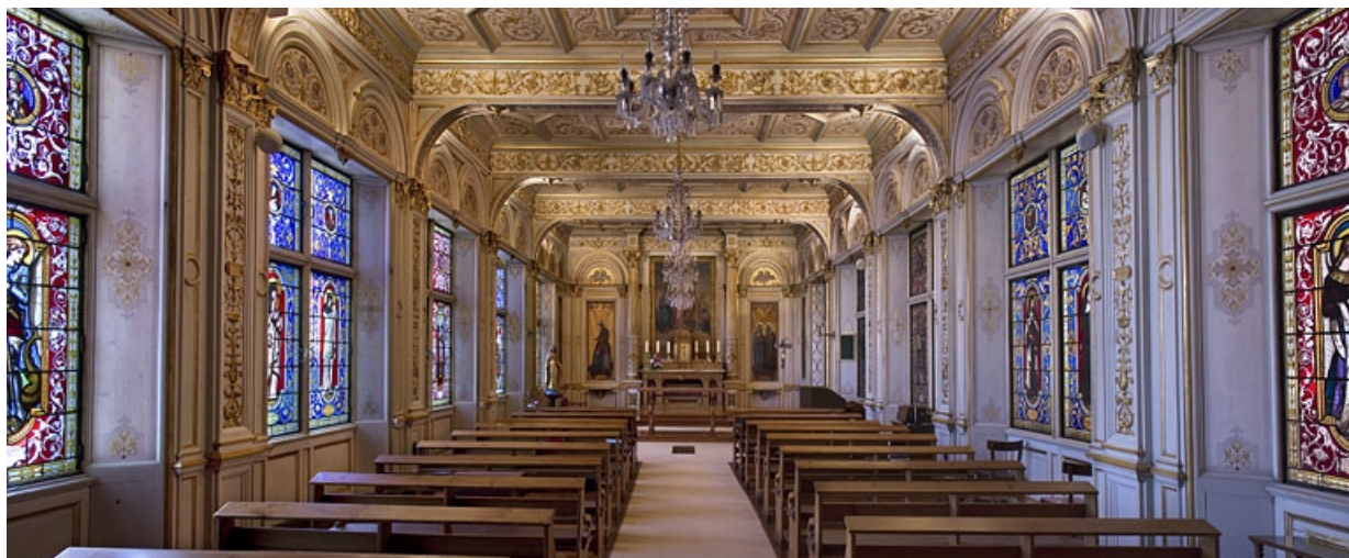
Logis principal, intérieur, chapelle : vue d'ensemble depuis l'entrée.

25, Besançon, 6 rue du Palais, lieudit : îlot Cingle