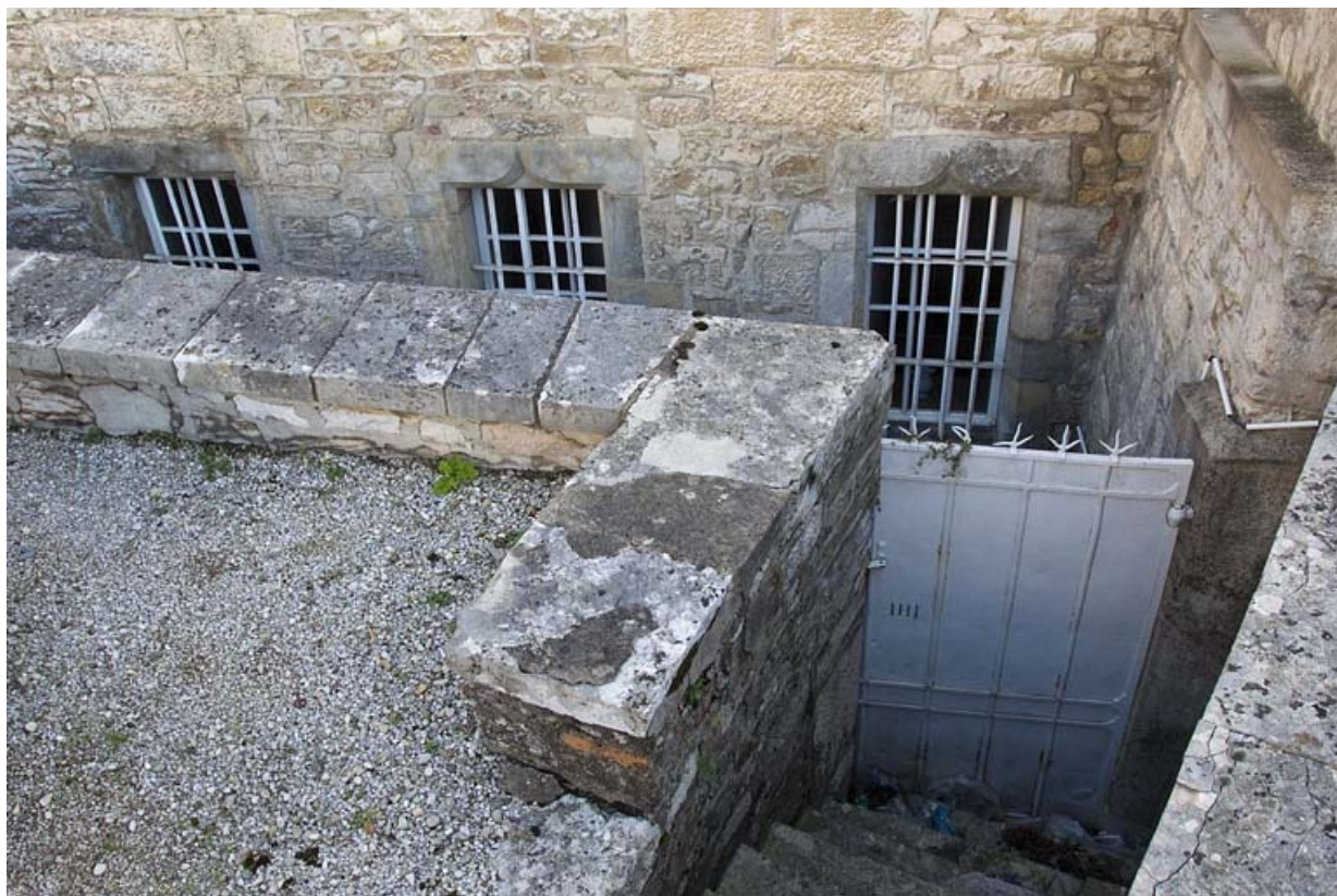
Logis principal, soubassement droit : détail de la cour anglaise devant les fenêtres de la cuisine.

25, Besançon, 6 rue du Palais, lieudit : îlot Cingle