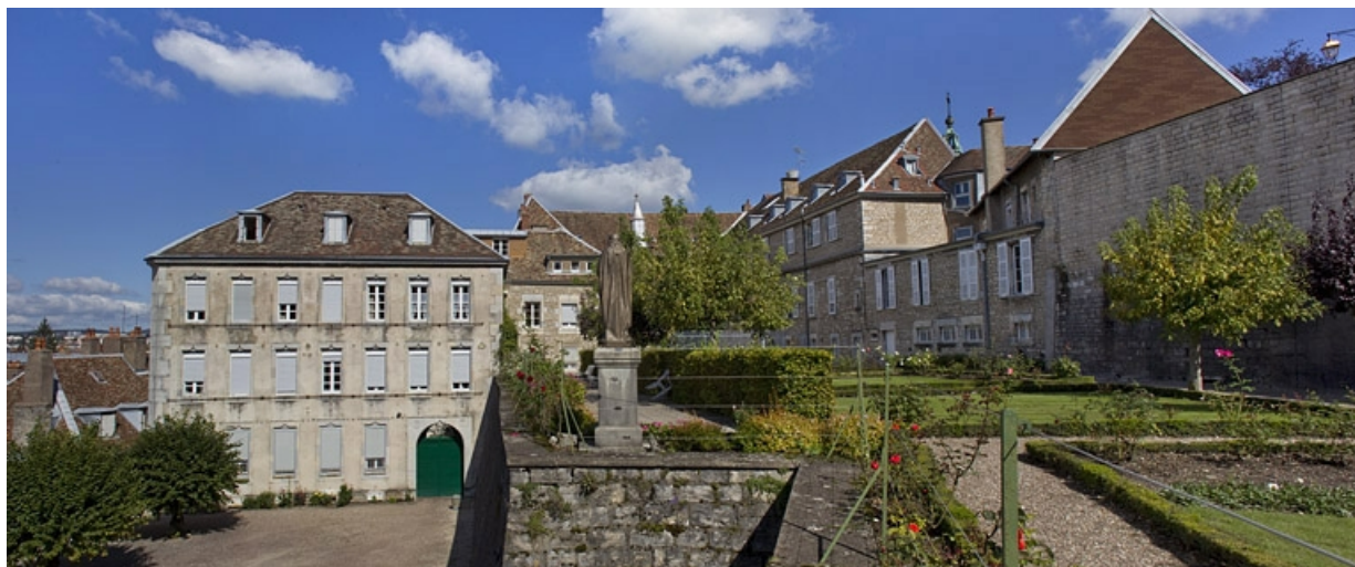
Vue d'ensemble du logis principal depuis le fond du jardin : de trois quarts gauche.

25, Besançon, 6 rue du Palais, lieudit : îlot Cingle