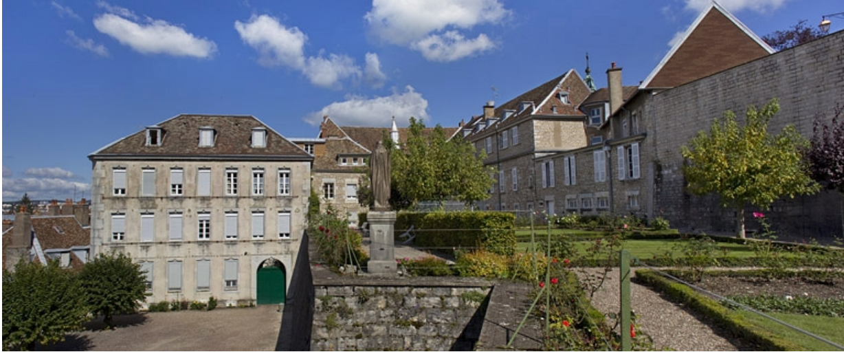
Vue d'ensemble du logis principal depuis le fond du jardin : de trois quarts gauche.

25, Besançon, 6 rue du Palais, lieudit : îlot Cingle