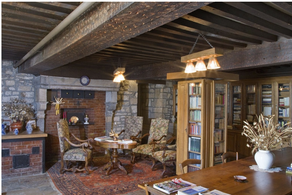
Logis principal, intérieur : détail de la pièce appelée le poêle.

25, Besançon, 6 rue du Palais, lieudit : îlot Cingle