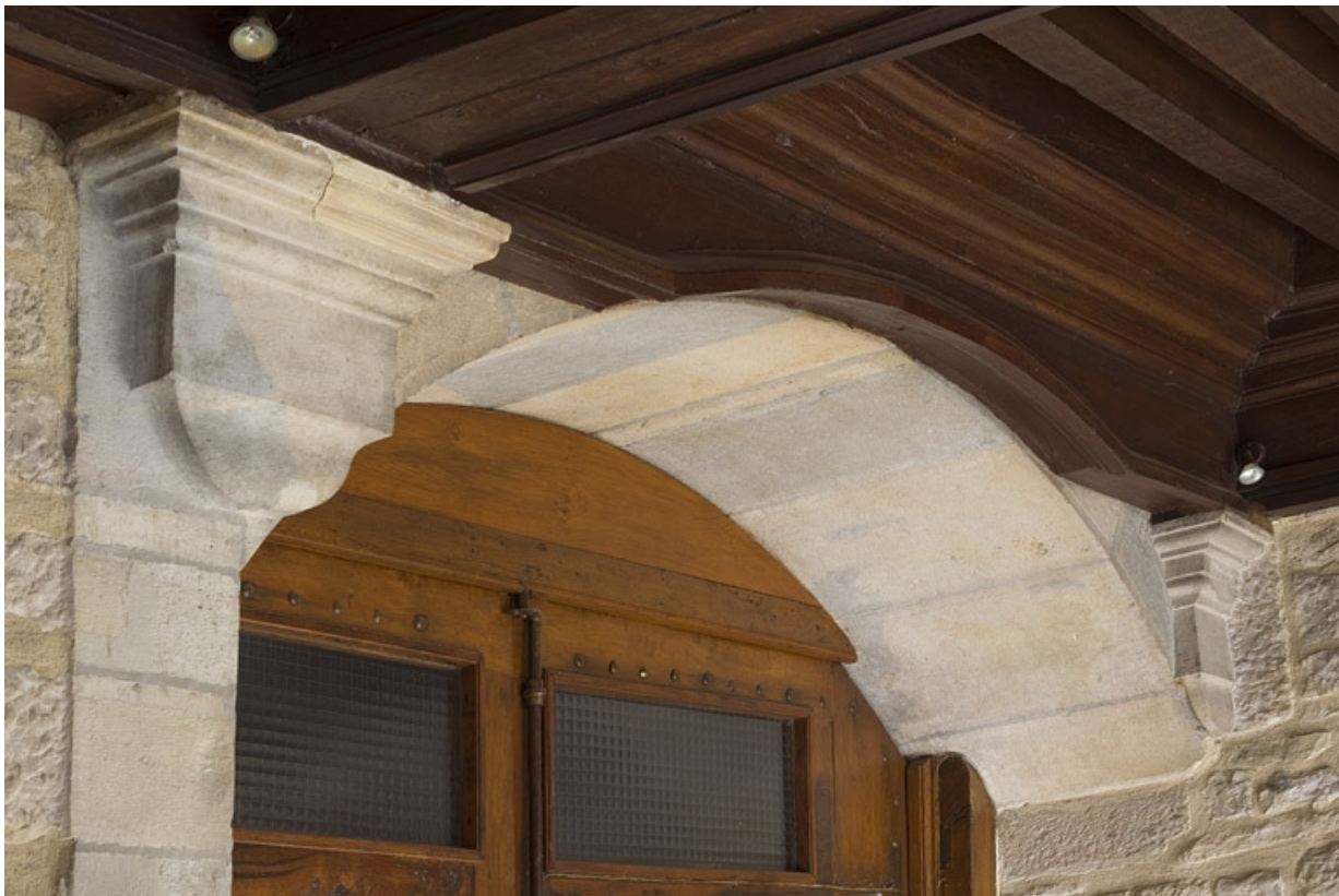
Logis principal, portique : détail de la partie supérieure d'une baie.

25, Besançon, 6 rue du Palais, lieudit : îlot Cingle