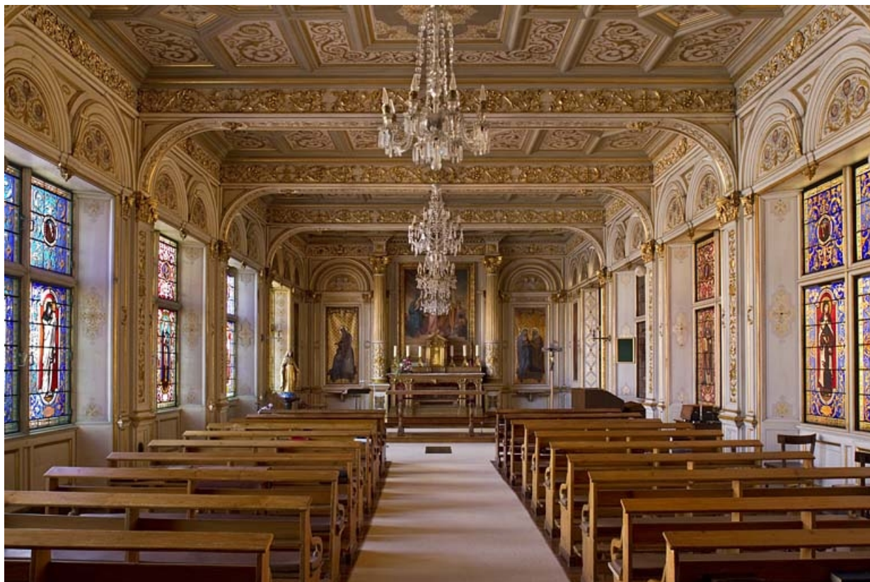
Logis principal, chapelle : vue d'ensemble depuis l'entrée.

25, Besançon, 6 rue du Palais, lieu-dit : îlot Cingle