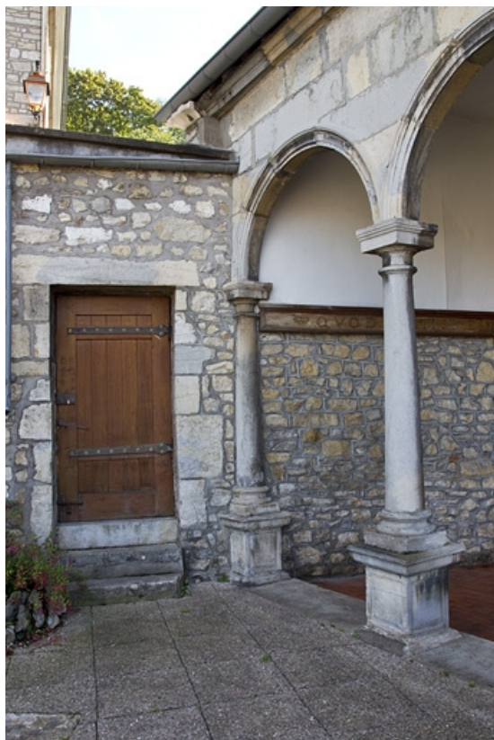
Détail d'une porte dans la clôture de jardin.

25, Besançon, 6 rue du Palais, lieudit : îlot Cingle