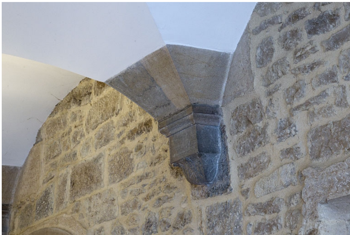
Logis principal, passage cocher : détail d'un support de la voûte.

25, Besançon, 6 rue du Palais, lieudit : îlot Cingle