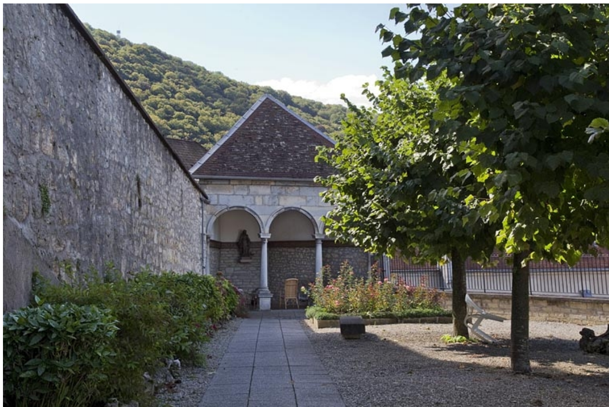
Vue d'ensemble éloignée de la fabrique de jardin.

25, Besançon, 6 rue du Palais, lieudit : îlot Cingle