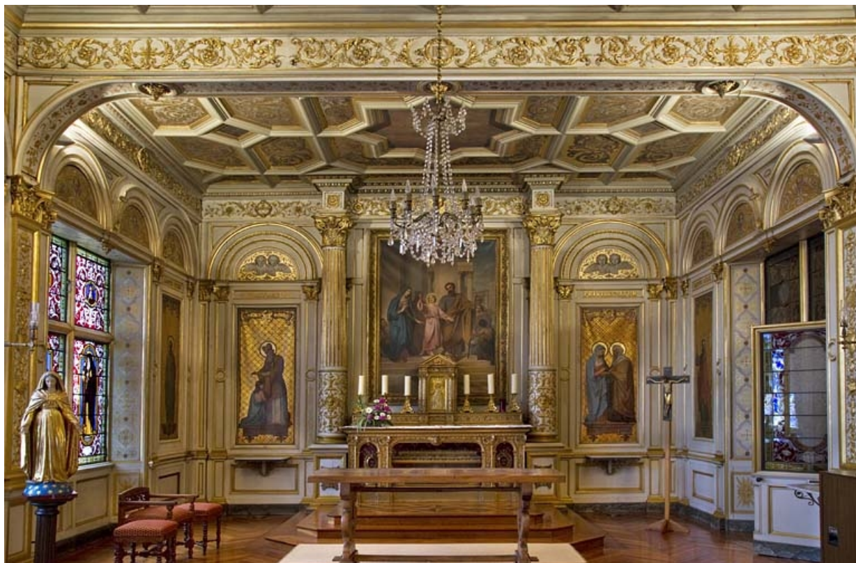
Logis principal, chapelle : vue d'ensemble du maître-autel.

25, Besançon, 6 rue du Palais, lieu dit : îlot Cingle