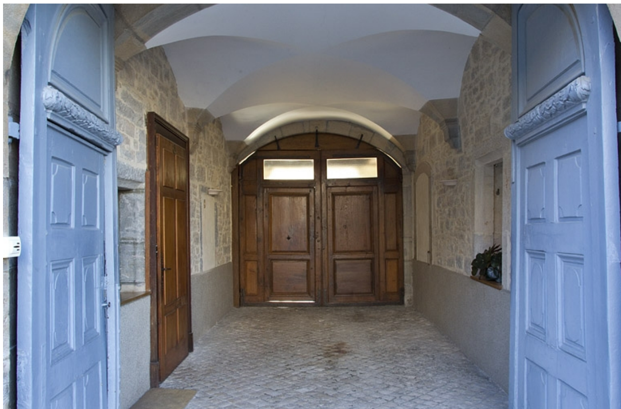
Logis principal : vue d'ensemble du passage cocher, depuis l'entrée. 25, Besançon, 6 rue du Palais, lieudit : îlot Cingle