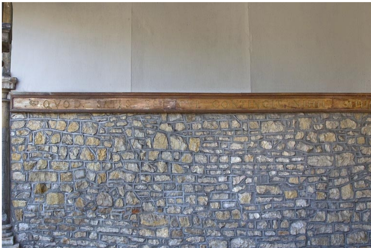
Fabrique de jardin, intérieur : détail de l'inscription.

25, Besançon, 6 rue du Palais, lieudit : îlot Cingle