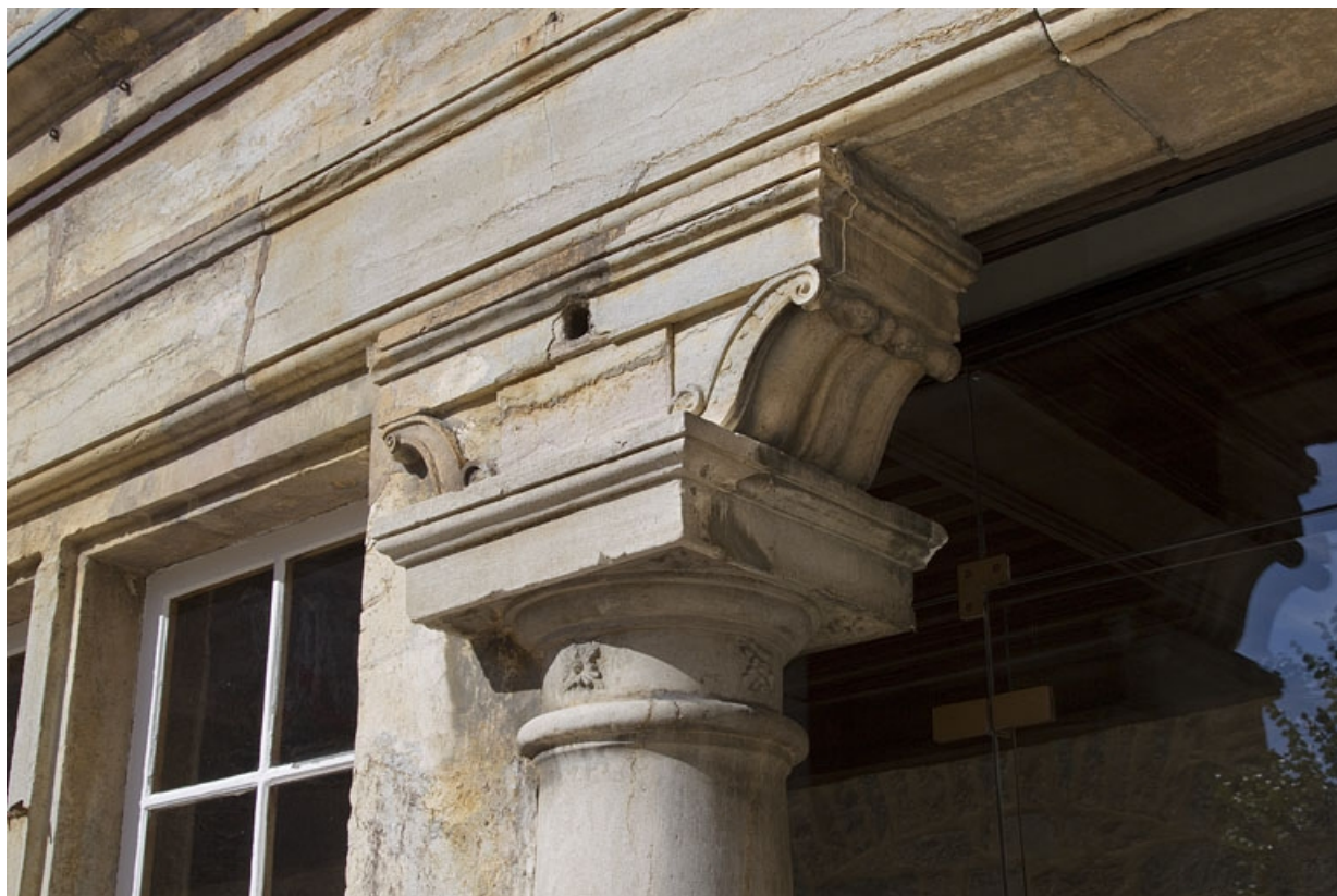
Logis principal, façade postérieure : détail d'une zapata du portique, de trois quarts droit. 25, Besançon, 6 rue du Palais, lieudit : îlot Cingle