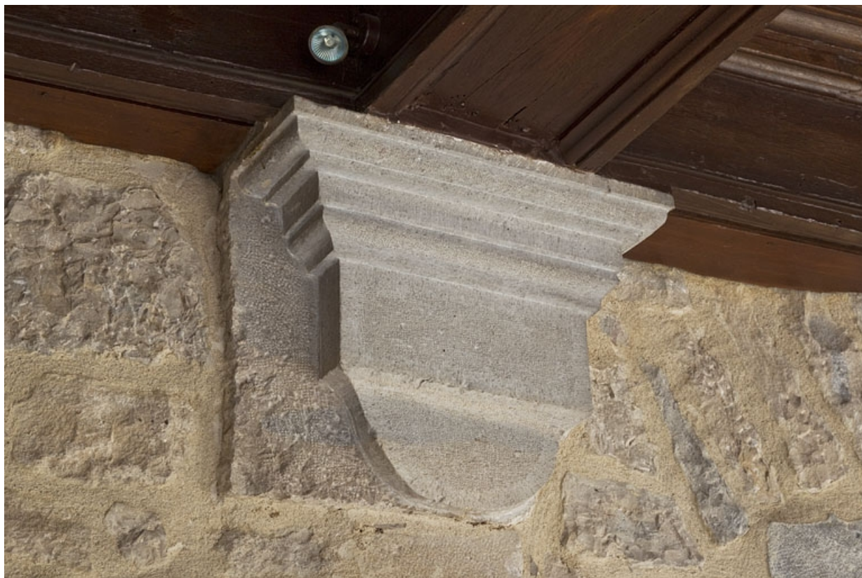
Logis principal, intérieur du portique : détail d'une console supportant le plafond.

25, Besançon, 6 rue du Palais, lieudit : îlot Cingle