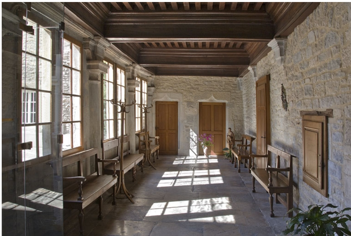
Logis principal : vue d'ensemble de l'intérieur du portique, depuis le passage cocher.

25, Besançon, 6 rue du Palais, lieudit : îlot Cingle