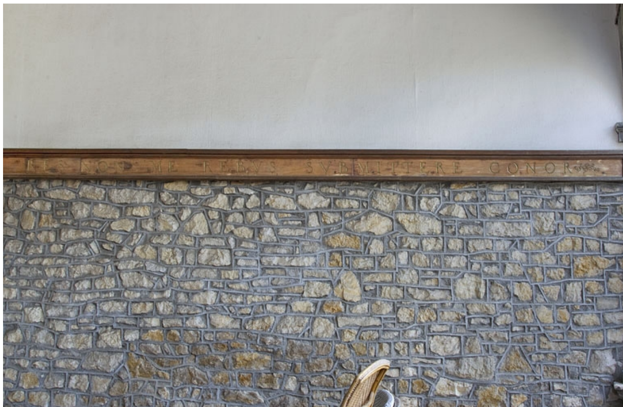
Fabrique de jardin, intérieur : détail de l'inscription.

25, Besançon, 6 rue du Palais, lieudit : îlot Cingle