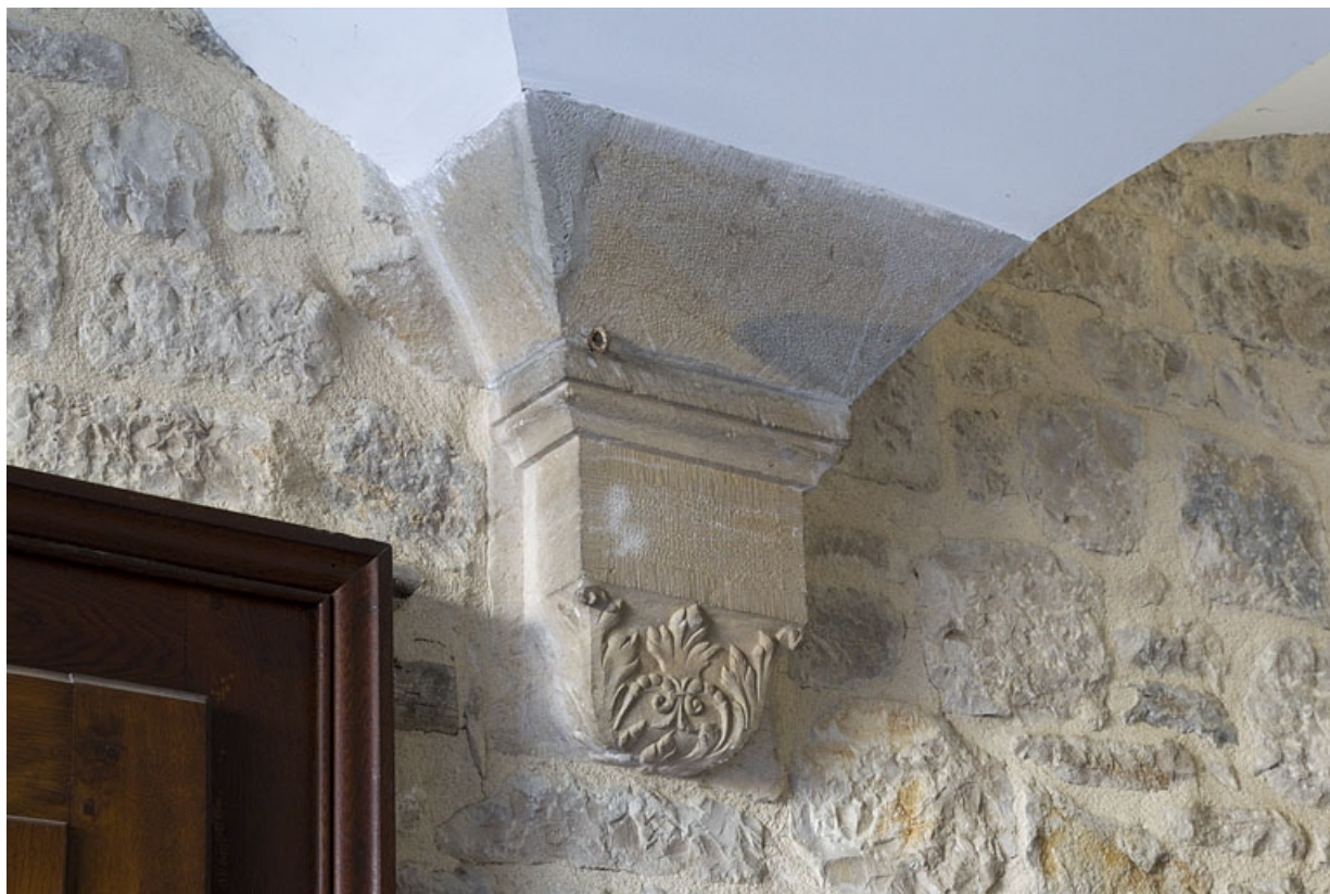
Logis principal, passage cocher : détail d'un support de la voûte.

25, Besançon, 6 rue du Palais, lieudit : îlot Cingle