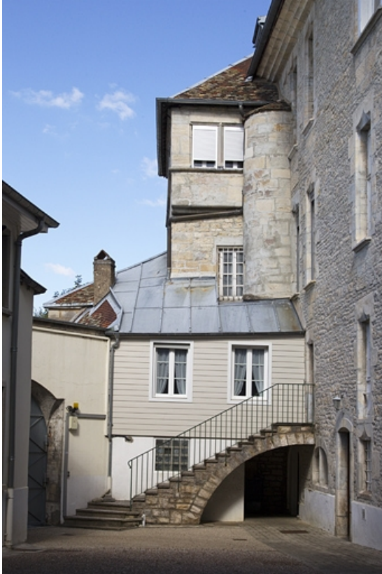
Détail de l'escalier extérieur depuis la cour basse.

25, Besançon, 6 rue du Palais, lieudit : îlot Cingle