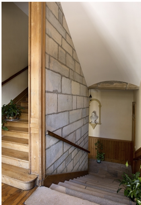
Logis principal, intérieur : vue de l'escalier, en plongée. 25, Besançon, 6 rue du Palais, lieudit : îlot Cingle