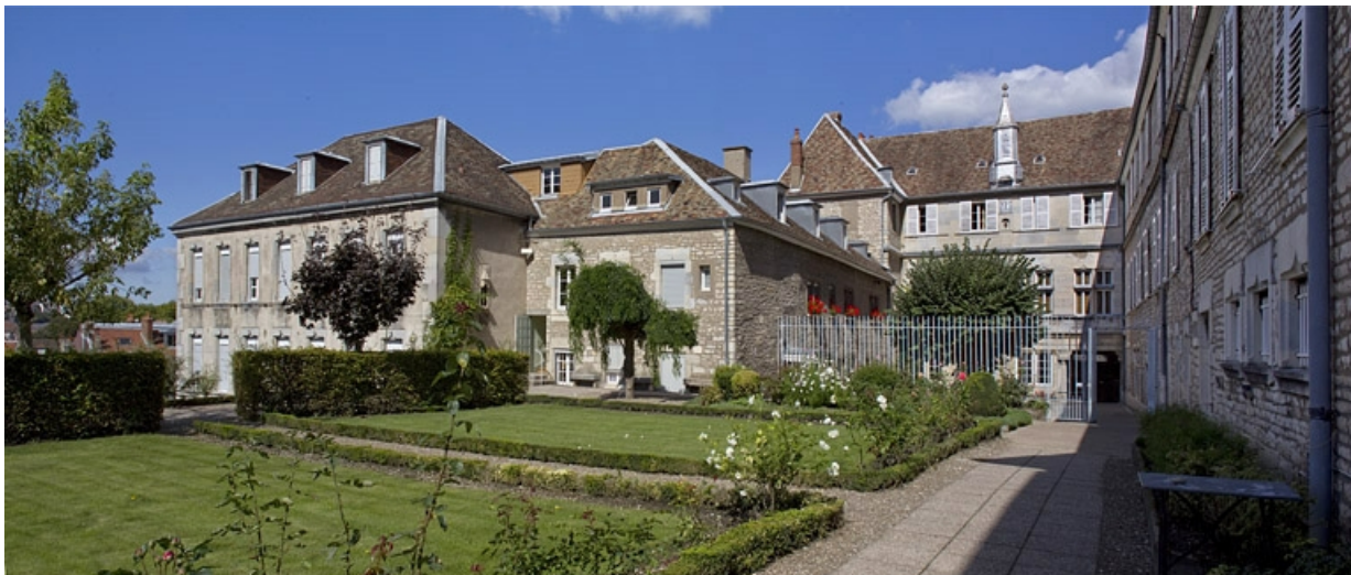
Logis principal : vue de l'aile droite depuis le fond du jardin, de trois quarts droit.

25, Besançon, 6 rue du Palais, lieudit : îlot Cingle