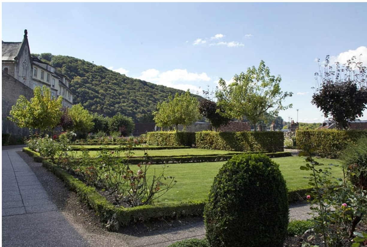
Vue d'ensemble du jardin depuis l'entrée, de trois quarts gauche.

25, Besançon, 6 rue du Palais, lieudit : îlot Cingle