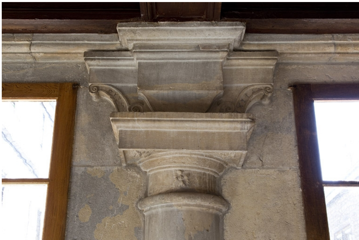
Logis principal, intérieur du portique : détail d'une zapata de face.

25, Besançon, 6 rue du Palais, lieu-dit : îlot Cingle