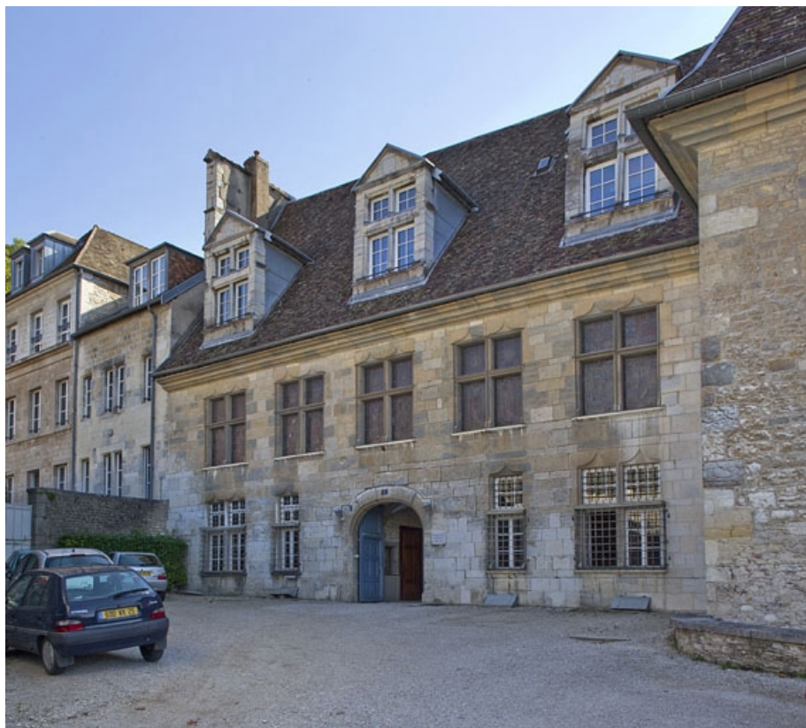
Logis principal, façade antérieure : de trois quarts droit.

25, Besançon, 6 rue du Palais, lieu-dit : îlot Cingle