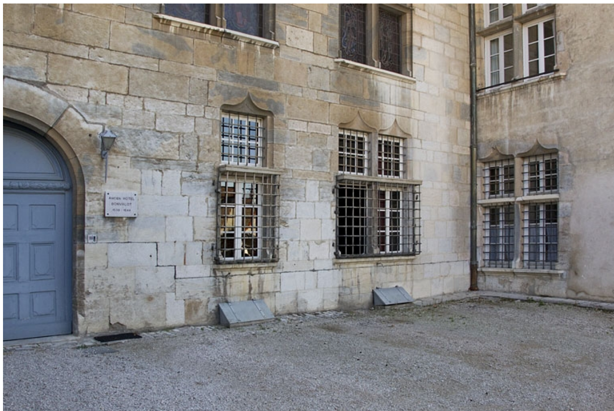
Logis principal, façade antérieure : détail du rez-de-chaussée de la partie droite.

25, Besançon, 6 rue du Palais, lieudit : îlot Cingle