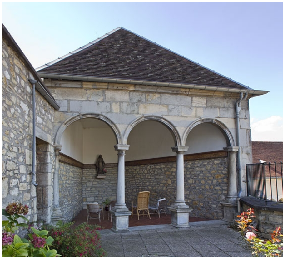
Vue d'ensemble de la fabrique de jardin, de face.

25, Besançon, 6 rue du Palais, lieudit : îlot Cingle