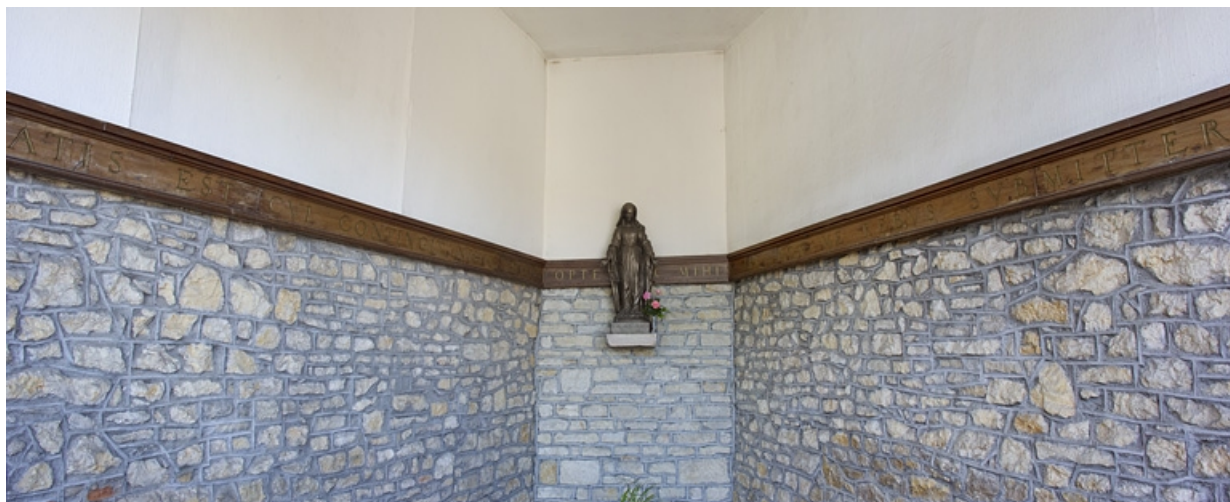
Fabrique de jardin : vue de l'intérieur, de face.

25, Besançon, 6 rue du Palais, lieudit : îlot Cingle