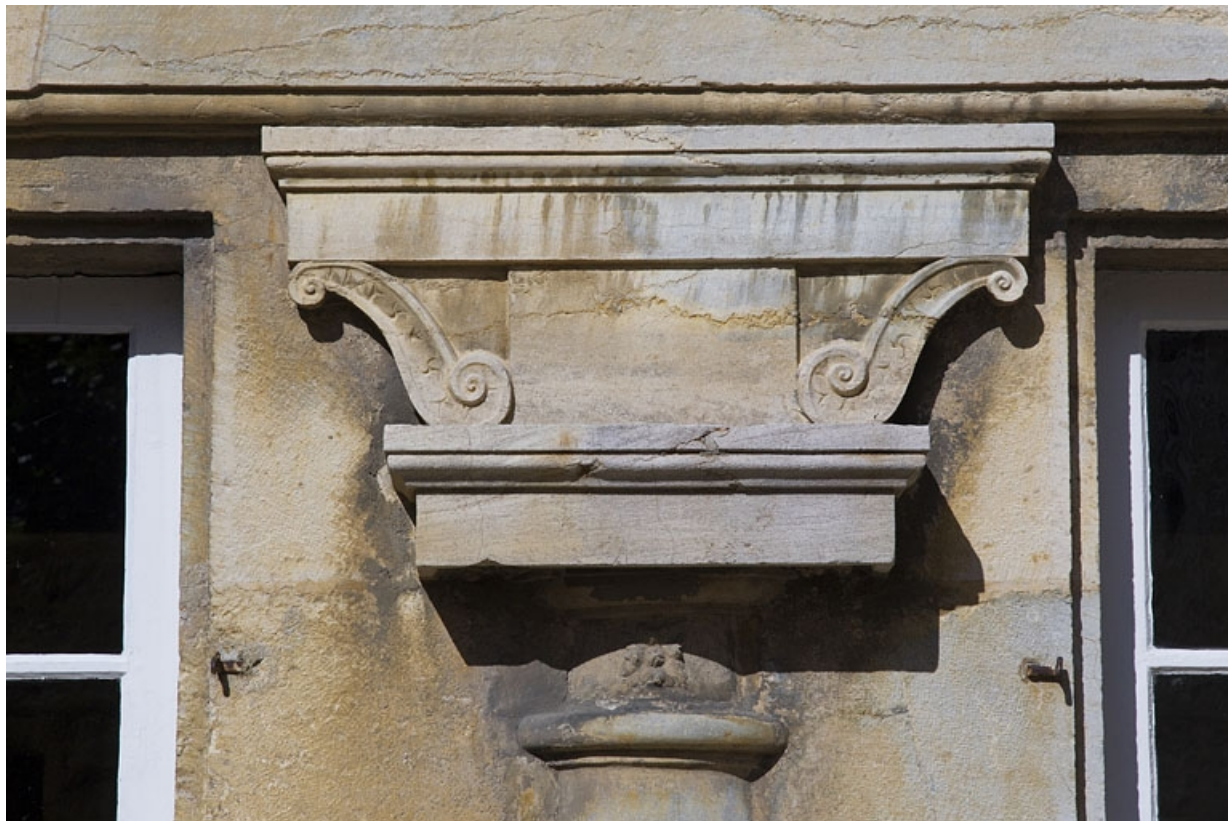
Logis principal, façade postérieure : détail d'une zapata du portique : de face. 25, Besançon, 6 rue du Palais, lieudit : îlot Cingle