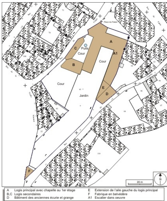
Plan masse et de situation. Extrait du plan cadastral, 1974, section AM. 25, Besançon, 6 rue du Palais, lieudit : îlot Cingle