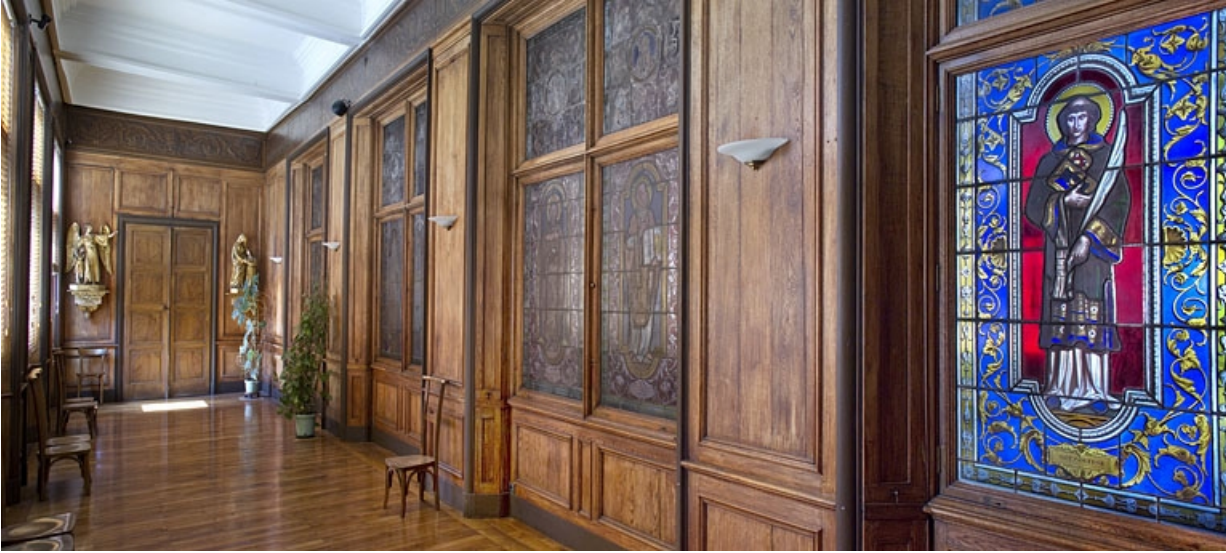
Logis principal, intérieur, premier étage : vue de la cloison séparant la chapelle de la galerie, de trois quarts droit. 25, Besançon, 6 rue du Palais, lieudit : îlot Cingle