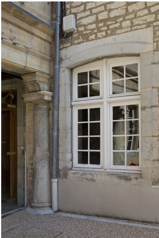
Logis principal, portique : détail de la colonne à l'extrémité droite. 25, Besançon, 6 rue du Palais, lieudit : îlot Cingle