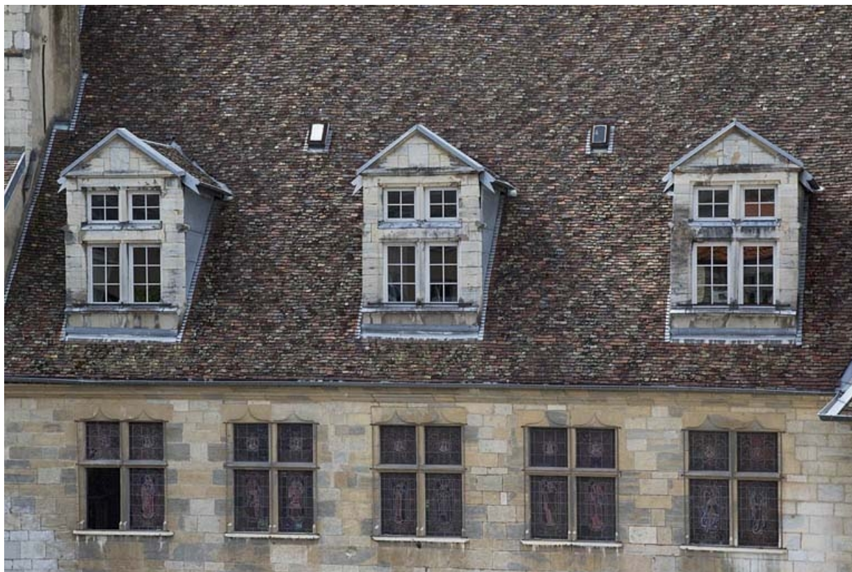
Logis principal, toiture : détail des lucarnes donnant sur l'extérieur.

25, Besançon, 6 rue du Palais, lieudit : îlot Cingle