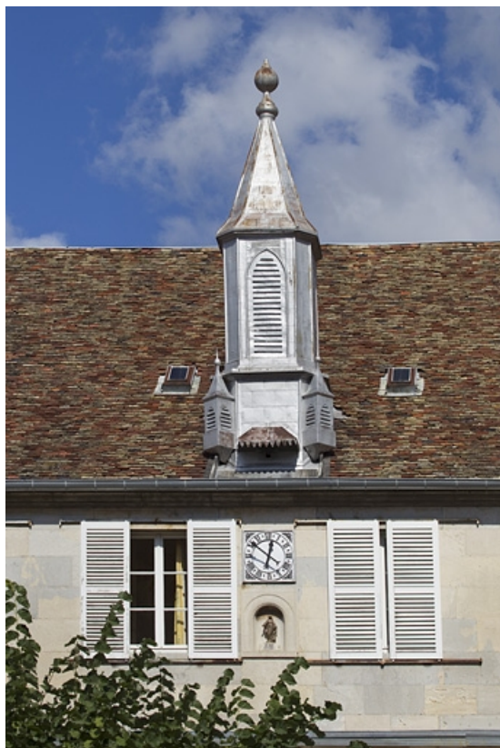
Logis principal, toiture, pan sur jardin : détail du clocheton.

25, Besançon, 6 rue du Palais, lieudit : îlot Cingle