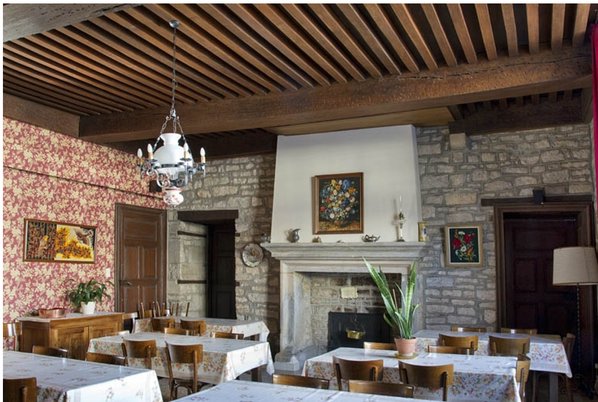
Logis principal, intérieur : vue d'ensemble de la cheminée d'une pièce du rez-de-chaussée. 25, Besançon, 6 rue du Palais, lieu dit : îlot Cingle