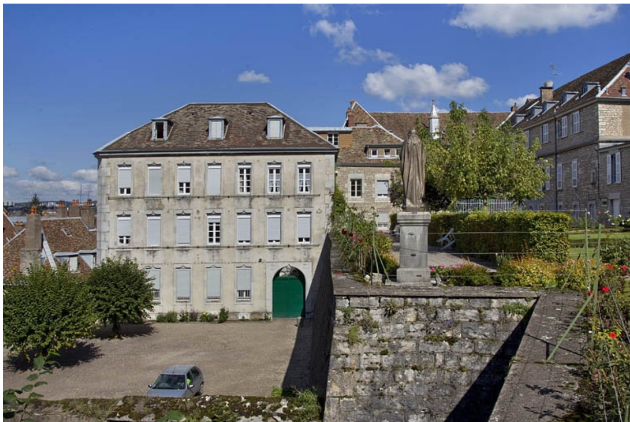
Vue d'ensemble de la basse-cour, depuis le fond du jardin.

25, Besançon, 6 rue du Palais, lieudit : îlot Cingle