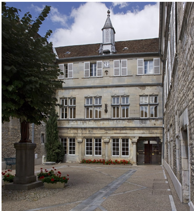
Logis principal : vue de la façade postérieure. 25, Besançon, 6 rue du Palais, lieudit : îlot Cingle