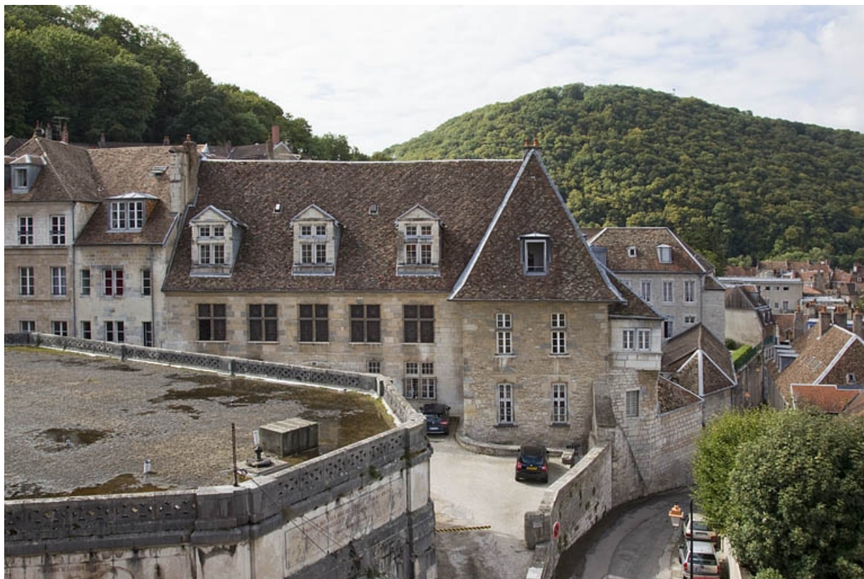
Vue d'ensemble depuis le vieil archevêché.

25, Besançon, 6 rue du Palais, lieudit : îlot Cingle