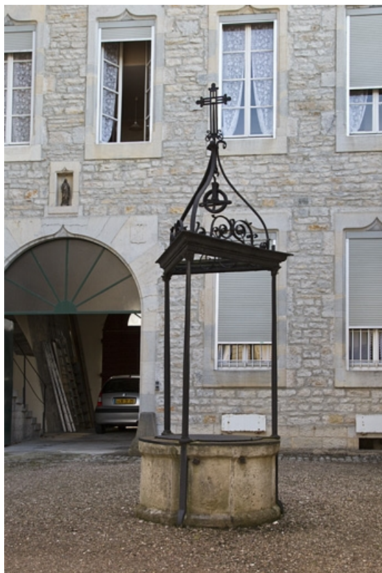
Détail du puits dans la cour basse.

25, Besançon, 6 rue du Palais, lieudit : îlot Cingle