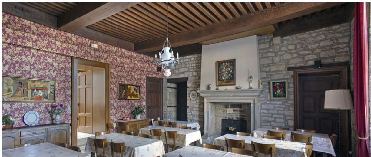
Logis principal, intérieur : détail d'une pièce du rez-de-chaussée.

25, Besançon, 6 rue du Palais, lieudit : îlot Cingle