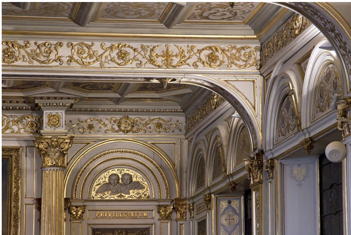
Logis principal, chapelle : détail du décor, à droite du maître-autel.

25, Besançon, 6 rue du Palais, lieudit : îlot Cingle