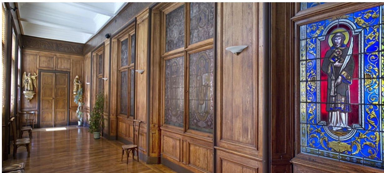
Logis principal, intérieur, premier étage : vue de la cloison séparant la chapelle de la galerie, de trois quarts droit. 25, Besançon, 6 rue du Palais, lieudit : îlot Cingle