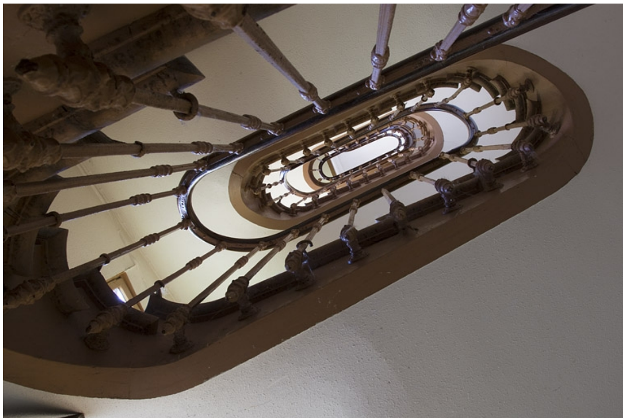
Premier logis secondaire : détail de l'escalier à retours avec jour.

25, Besançon, 31 rue Renan, lieudit : îlot Cingle