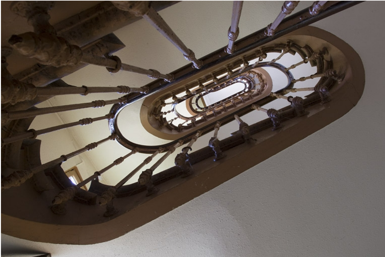
Premier logis secondaire : détail de l'escalier à retours avec jour.

25, Besançon, 31 rue Renan, lieudit : îlot Cingle