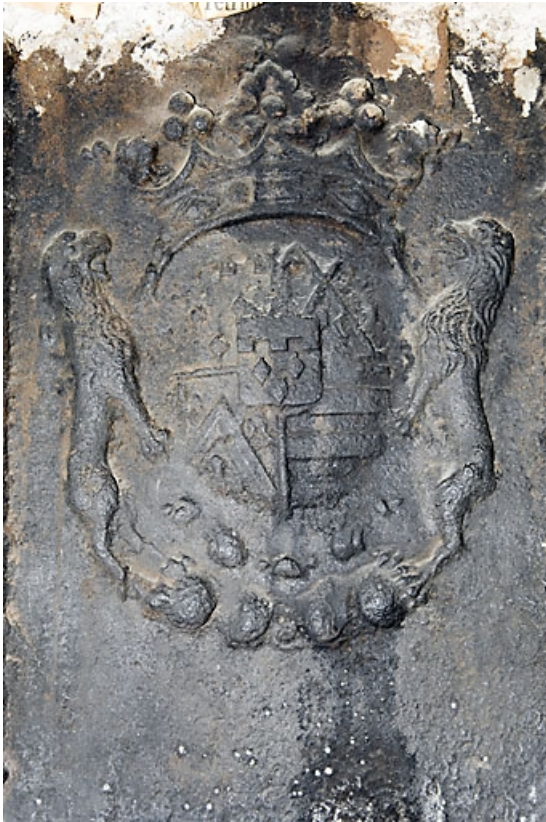
Détail des armoiries sur une plaque de cheminée du premier étage.

25, Besançon, 31 rue Renan, lieudit : îlot Cingle