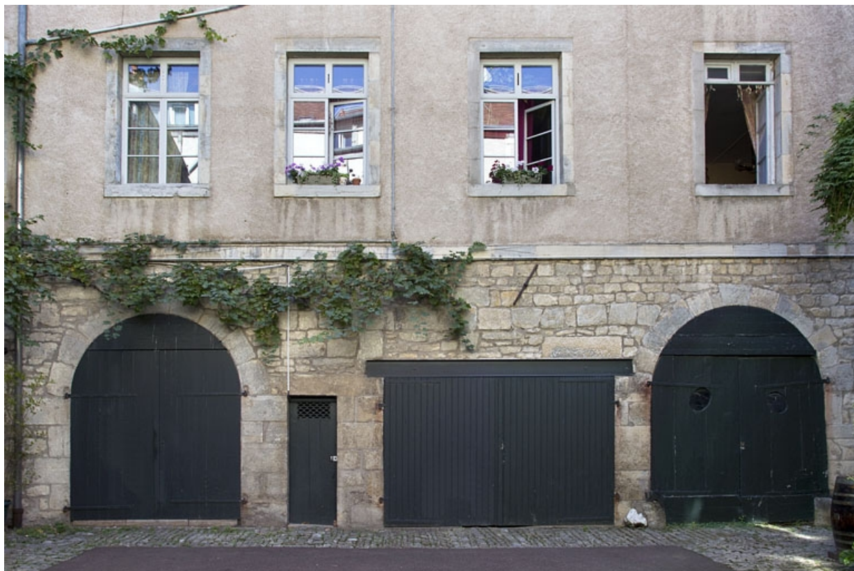
Deuxième logis secondaire : détail des remises du rez-de-chaussée.

25, Besançon, 31 rue Renan, lieudit : îlot Cingle