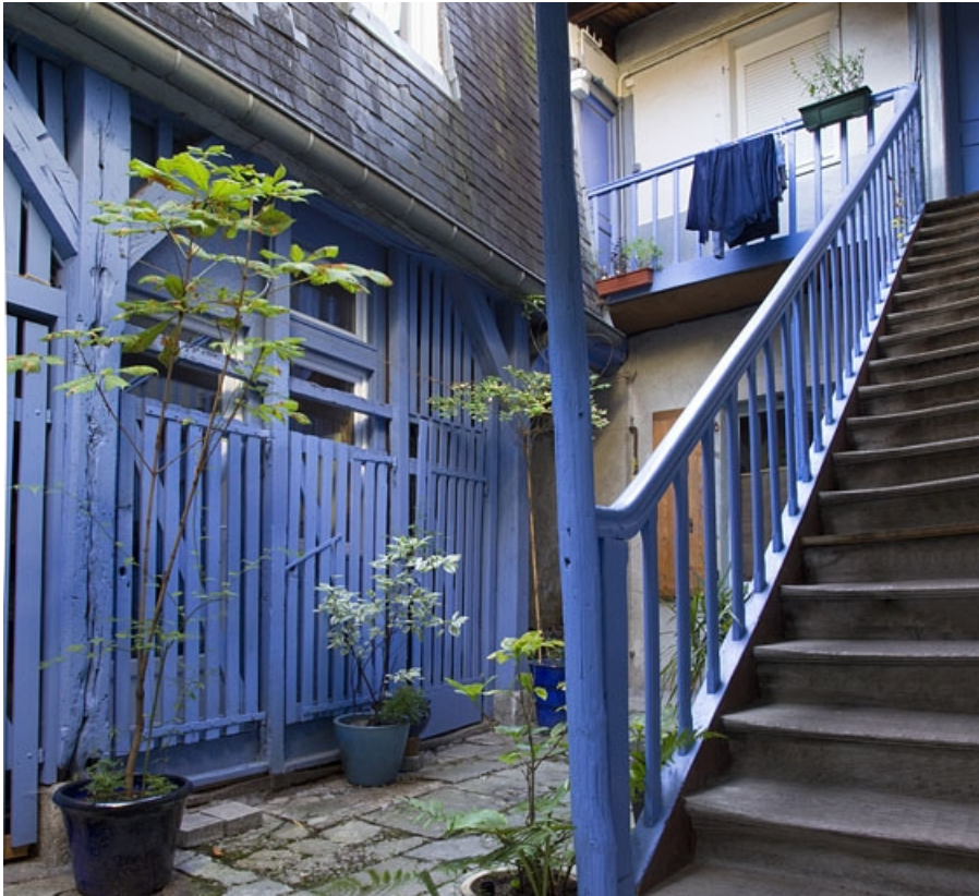
Vue d'ensemble des bûchers, depuis l'entrée de la courette.

25, Besançon, 31 rue Renan, lieudit : îlot Cingle