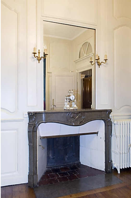
Détail d'une cheminée du premier étage.

25, Besançon, 31 rue Renan, lieudit : îlot Cingle