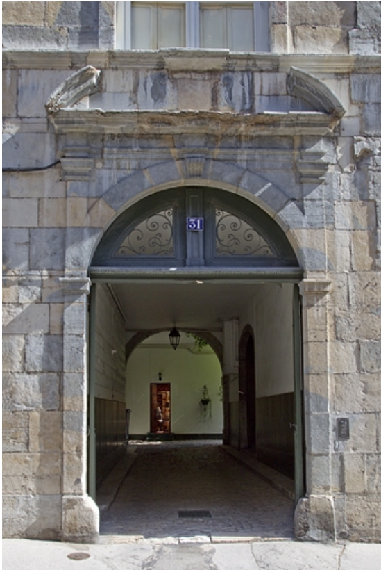
Logis principal : détail du portail d'entrée.

25, Besançon, 31 rue Renan, lieudit : îlot Cingle