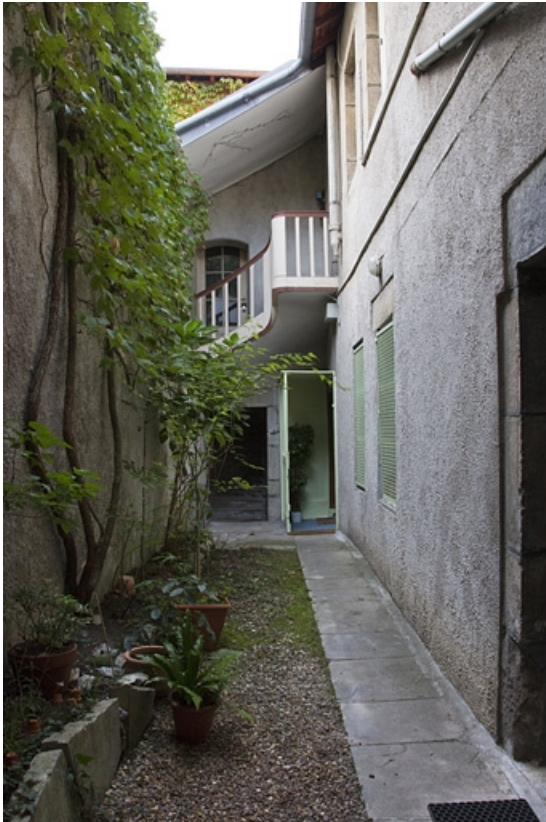
Deuxième logis secondaire : détail de la façade postérieure depuis l'entrée de la deuxième courette.

25, Besançon, 31 rue Renan, lieudit : îlot Cingle