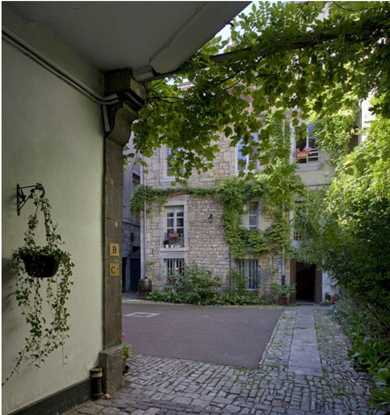
Vue de la cour depuis le passage cocher.

25, Besançon, 31 rue Renan, lieudit : îlot Cingle