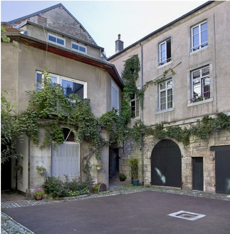
Troisième logis secondaire : de trois quarts gauche.

25, Besançon, 31 rue Renan, lieudit : îlot Cingle