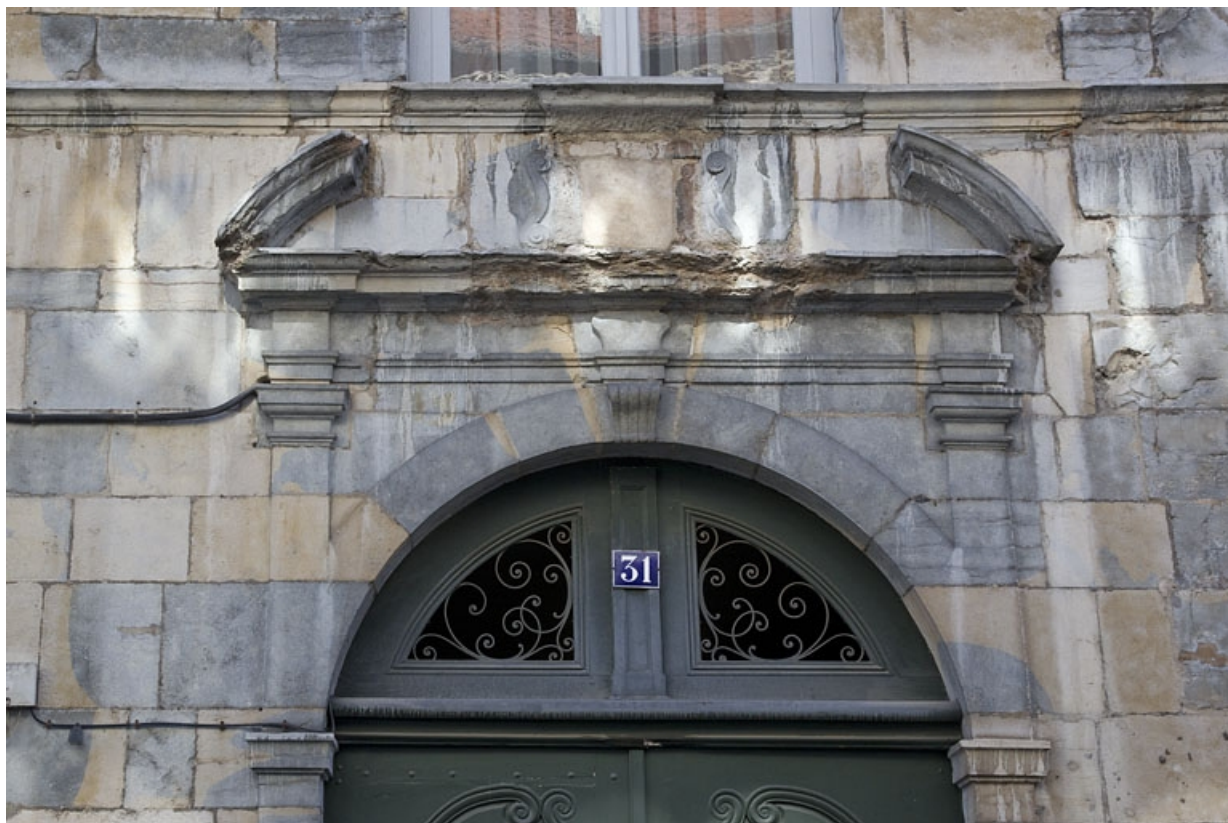
Logis principal, portail d'entrée : détail du fronton interrompu.

25, Besançon, 31 rue Renan, lieudit : îlot Cingle