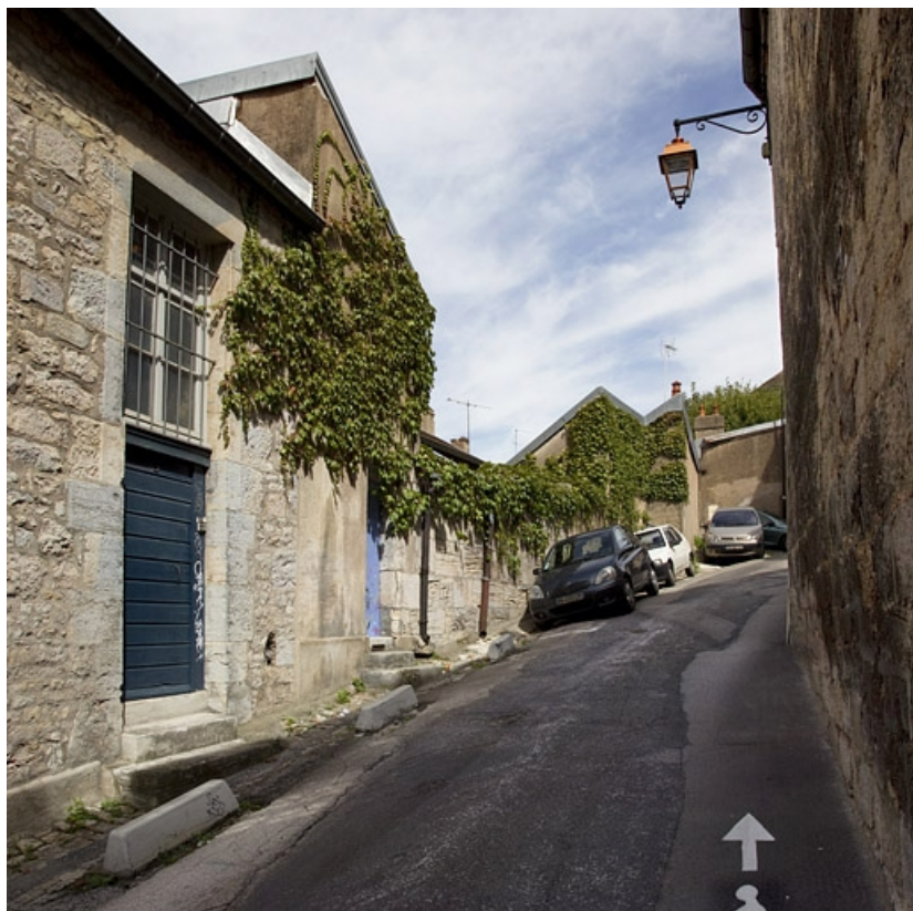
Vue du mur de clôture depuis la rue du Cingle.

25, Besançon, 31 rue Renan, lieudit : îlot Cingle