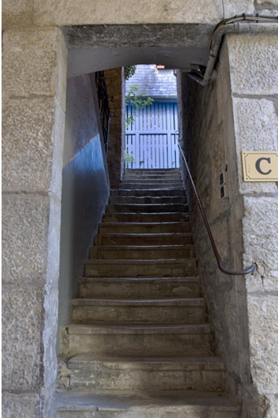
Deuxième logis secondaire : détail de l'escalier à retours sans jour.

25, Besançon, 31 rue Renan, lieudit : îlot Cingle