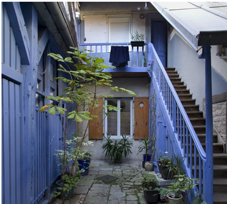
Deuxième logis secondaire, façade postérieure : détail de l'escalier extérieur. 25, Besançon, 31 rue Renan, lieudit : îlot Cingle