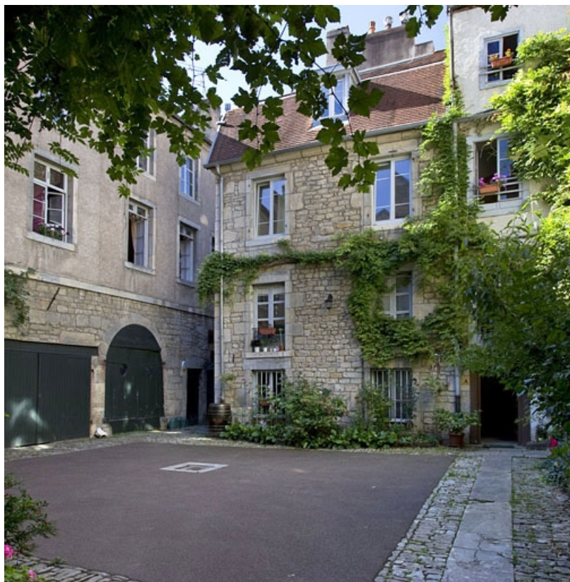
Vue d'ensemble du premier logis secondaire, depuis l'entrée de la cour.

25, Besançon, 31 rue Renan, lieudit : îlot Cingle