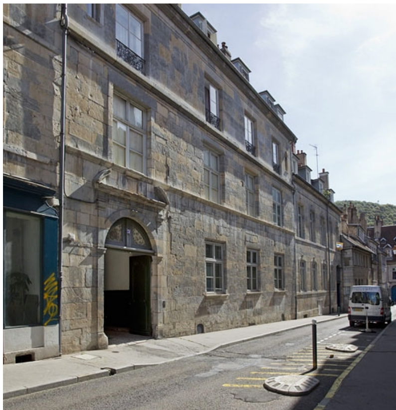
Vue d'ensemble depuis la rue : de trois quarts gauche.

25, Besançon, 31 rue Renan, lieudit : îlot Cingle