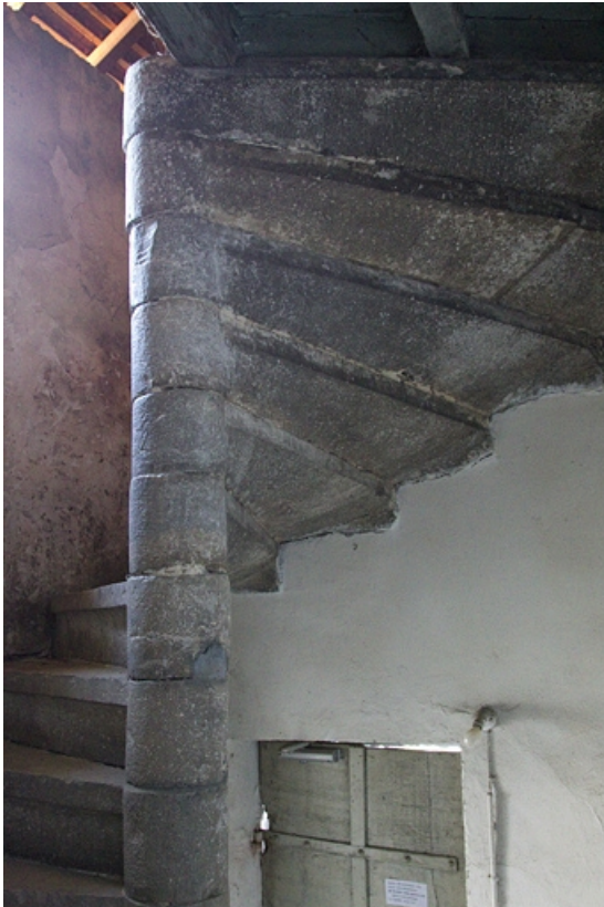
Deuxième logis secondaire : détail d'escalier en vis.

25, Besançon, 31 rue Renan, lieudit : îlot Cingle