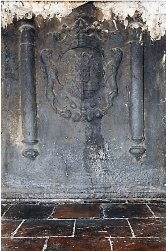
Détail d'une plaque de cheminée du premier étage.

25, Besançon, 31 rue Renan, lieudit : îlot Cingle