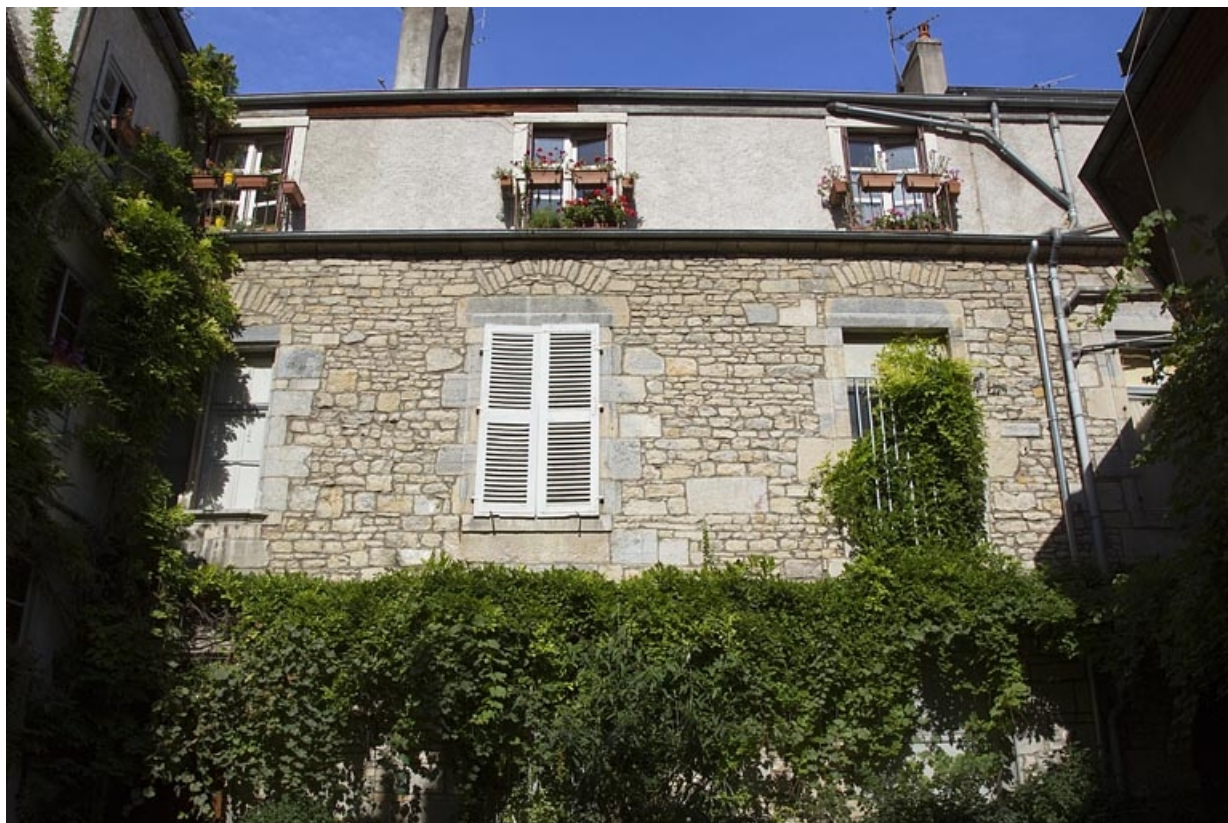
Logis principal : vue d'ensemble de la façade postérieure, de face.

25, Besançon, 31 rue Renan, lieudit : îlot Cingle