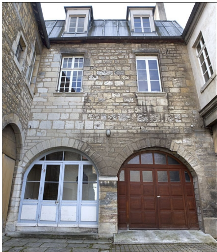
Vue d'ensemble de la façade antérieure du logis en fond de cour.

25, Besançon, 14 rue de la Convention, lieudit : îlot Boitouset