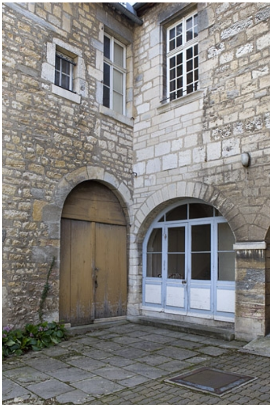
Détail de l'angle gauche entre l'aile gauche et le logis en fond de cour.

25, Besançon, 14 rue de la Convention, lieudit : îlot Boitouset