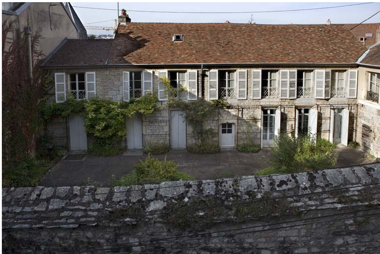
Vue d'ensemble de la façade postérieure depuis le jardin de l'hôtel Franchet de Rans.

25, Besançon, 14 rue de la Convention, lieudit : îlot Boitouset