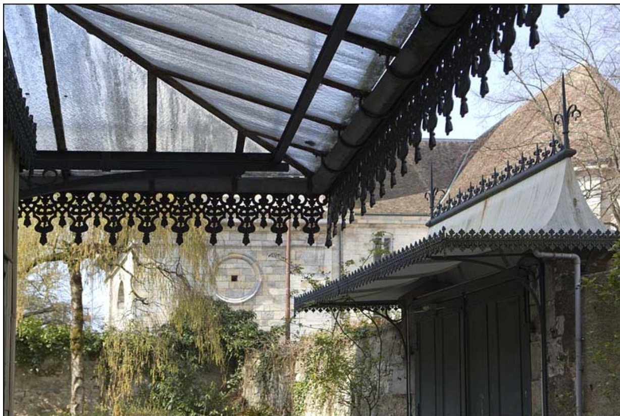
Détail du toit en tôle du portail dans clôture, depuis la porte du logis principal.

25, Besançon, 12 rue de la Convention, lieudit : îlot Boitouset