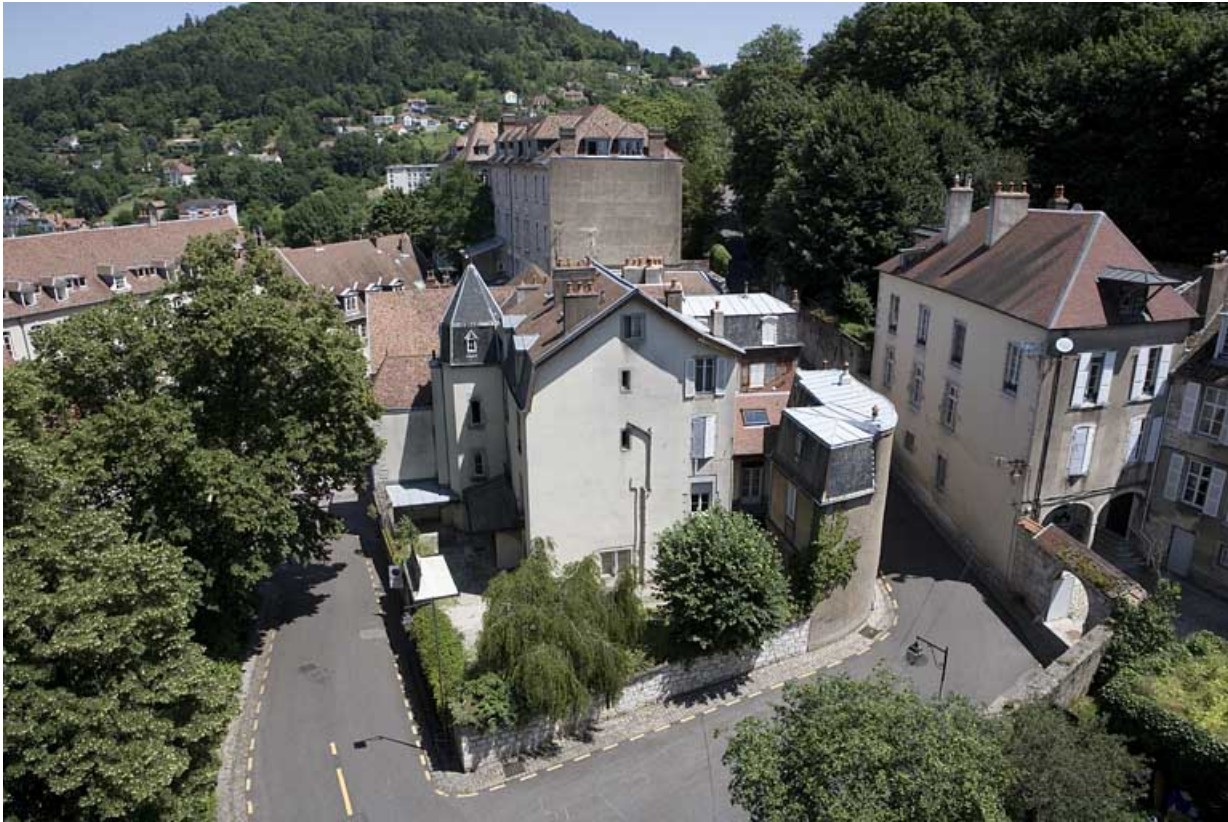
Vue plongeante sur la demeure depuis le clocher de la cathédrale Saint-Jean.

25, Besançon, 12 rue de la Convention, lieudit : îlot Boitouset