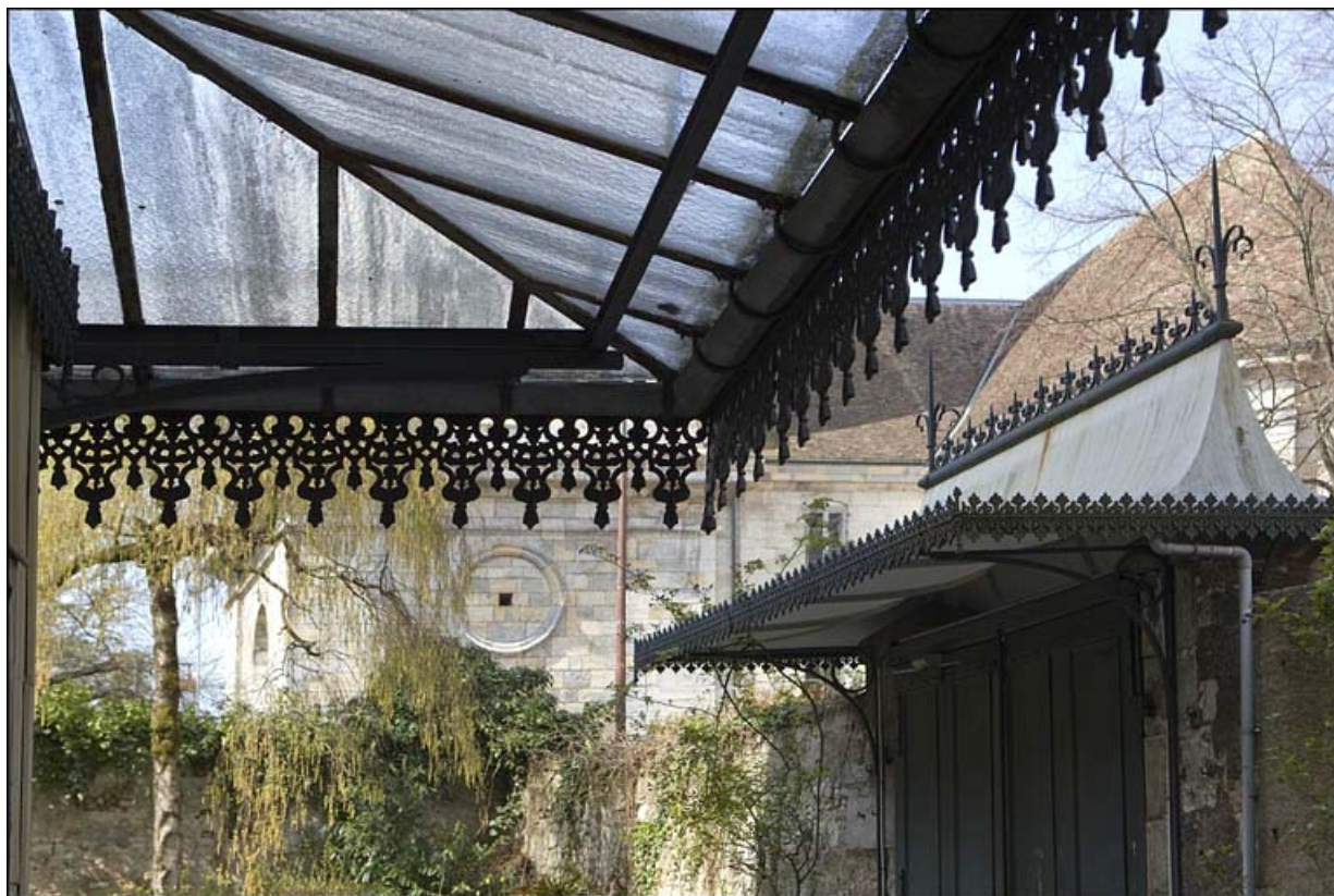
Détail du toit en tôle du portail dans clôture, depuis la porte du logis principal.

25, Besançon, 12 rue de la Convention, lieudit : îlot Boitouset