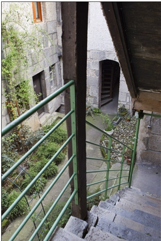
Vue d'ensemble des façades du logis secondaire depuis l'intérieur de l'escalier dans la deuxième cour.

25, Besançon, 28 rue Rivotte, lieudit : îlot Boitouset