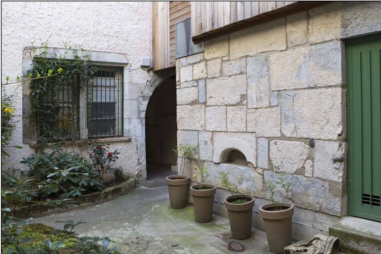
Détail d'une partie de la façade antérieure du logis secondaire sur la première cour.

25, Besançon, 28 rue Rivotte, lieudit : îlot Boitouset