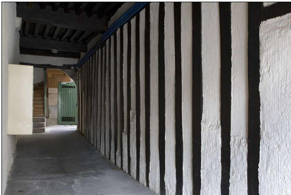
Vue du mur latéral droit, en pan de bois, du passage cocher.

25, Besançon, 28 rue Rivotte, lieudit : îlot Boitouset