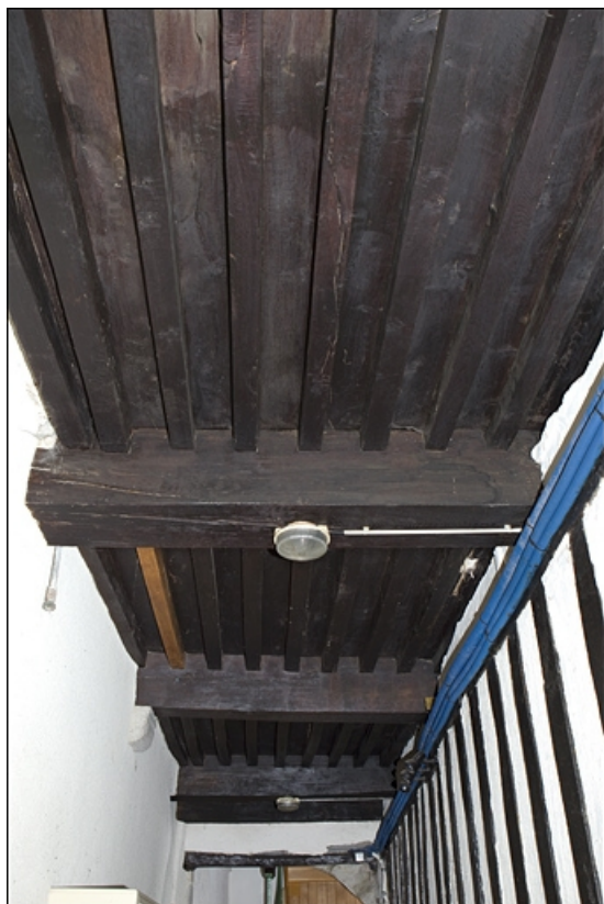
Vue du plafond à la française du passage cocher.

25, Besançon, 28 rue Rivotte, lieudit : îlot Boitouset