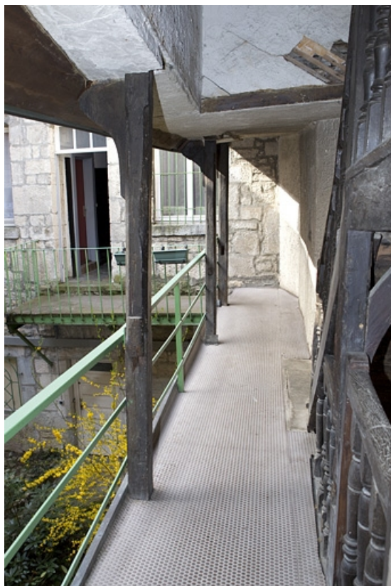
Escalier à cage ouverte : détail de la coursière desservant le premier étage du logis secondaire.

25, Besançon, 28 rue Rivotte, lieudit : îlot Boitouset