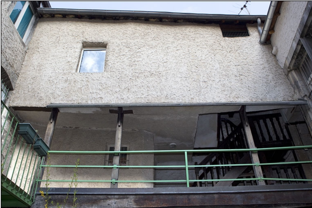
Escalier à cage ouverte : détail de la coursière desservant le premier étage du logis secondaire, face depuis la cour. 25, Besançon, 28 rue Rivotte, lieudit : îlot Boitouset