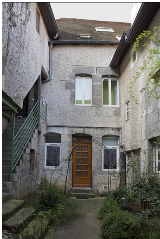
Vue d'ensemble des façades du logis secondaire depuis l'entrée de la deuxième cour.

25, Besançon, 28 rue Rivotte, lieudit : îlot Boitouset