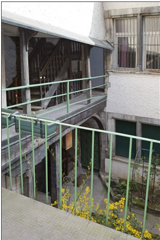
Vue d'ensemble de l'escalier à cage ouverte depuis le premier étage du logis secondaire. 25, Besançon, 28 rue Rivotte, lieudit : îlot Boitouset