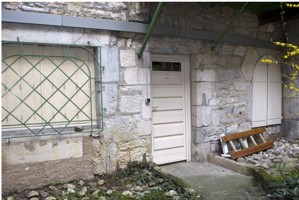
Façade antérieure du logis secondaire : détail du rez-de-chaussée.

25, Besançon, 28 rue Rivotte, lieudit : îlot Boitouset