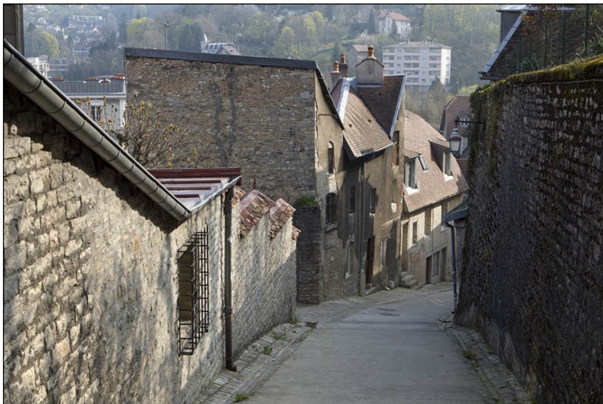
Façade latérale gauche du logis secondaire, en descendant la rue du Chambrier. 25, Besançon, 28 rue Rivotte, lieudit : îlot Boitouset