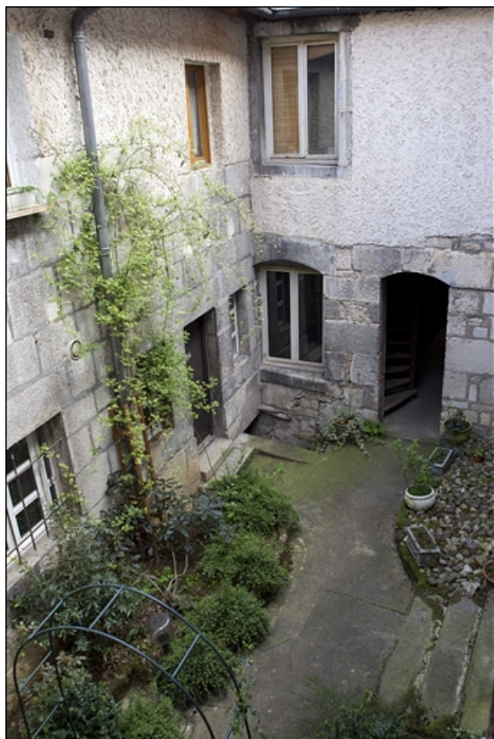
Vue d'ensemble des façades du logis secondaire depuis l'escalier dans la deuxième cour.

25, Besançon, 28 rue Rivotte, lieudit : îlot Boitouset