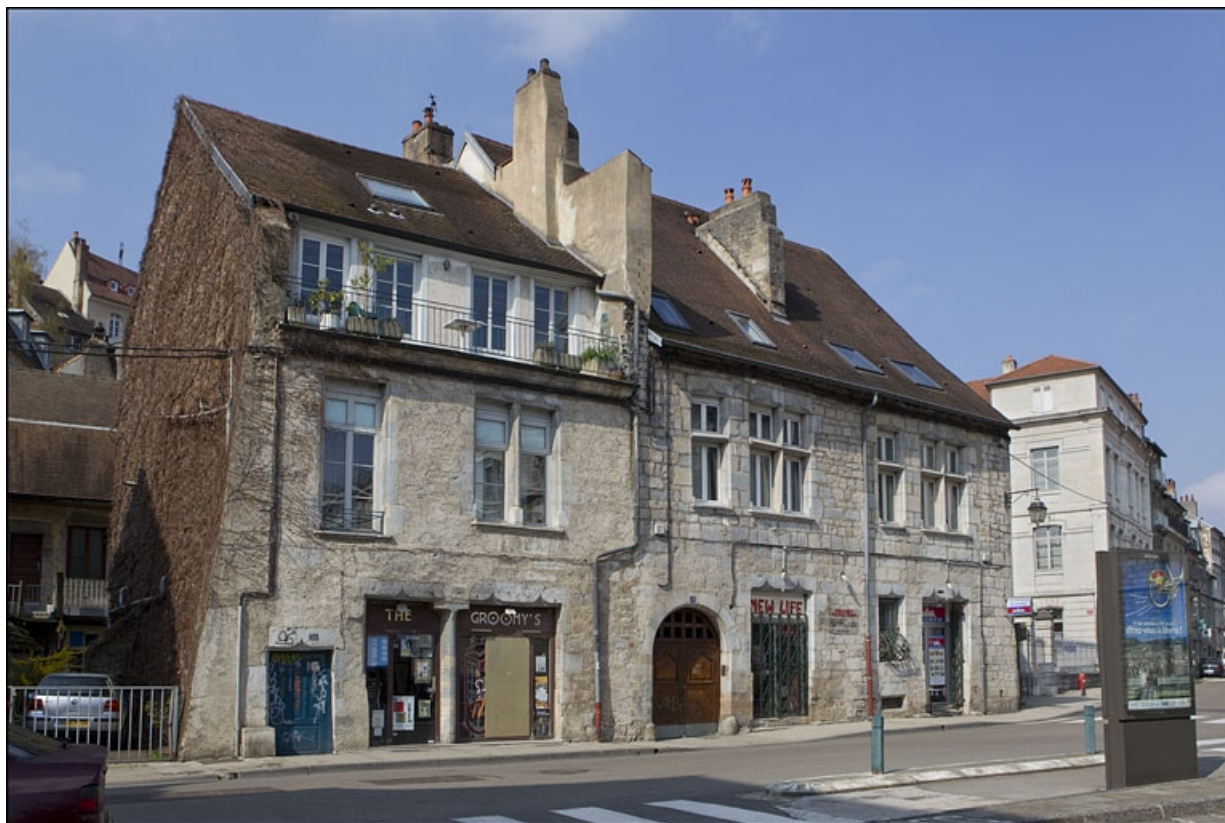
Vue d'ensemble du logis principal depuis la rue, de trois quarts gauche.

25, Besançon, 28 rue Rivotte, lieudit : îlot Boitouset