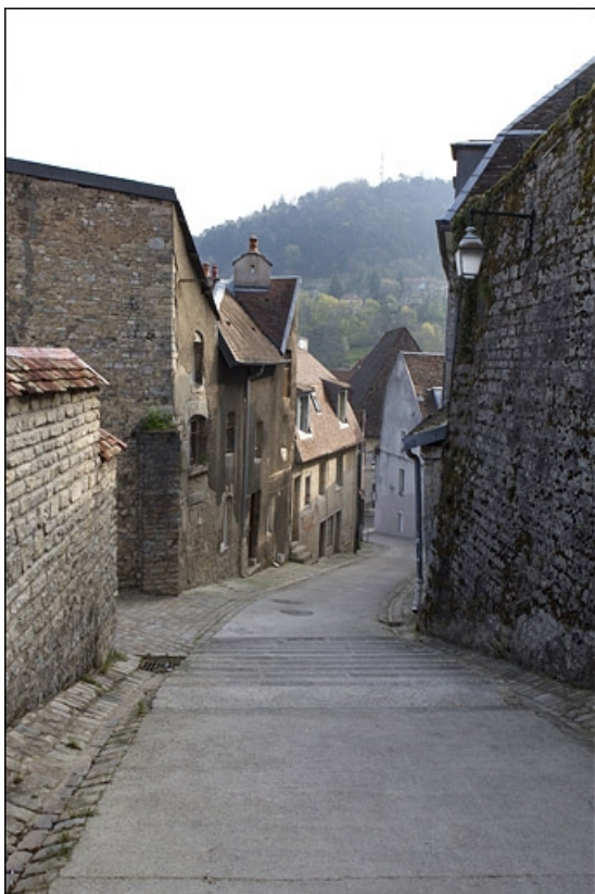
Façade latérale gauche du logis secondaire, en descendant la rue du Chambrier : vue rapprochée. 25, Besançon, 28 rue Rivotte, lieudit : îlot Boitouset