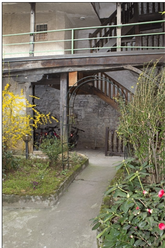
Vue de l'escalier à cage ouverte à droite de la première cour.

25, Besançon, 28 rue Rivotte, lieudit : îlot Boitouset