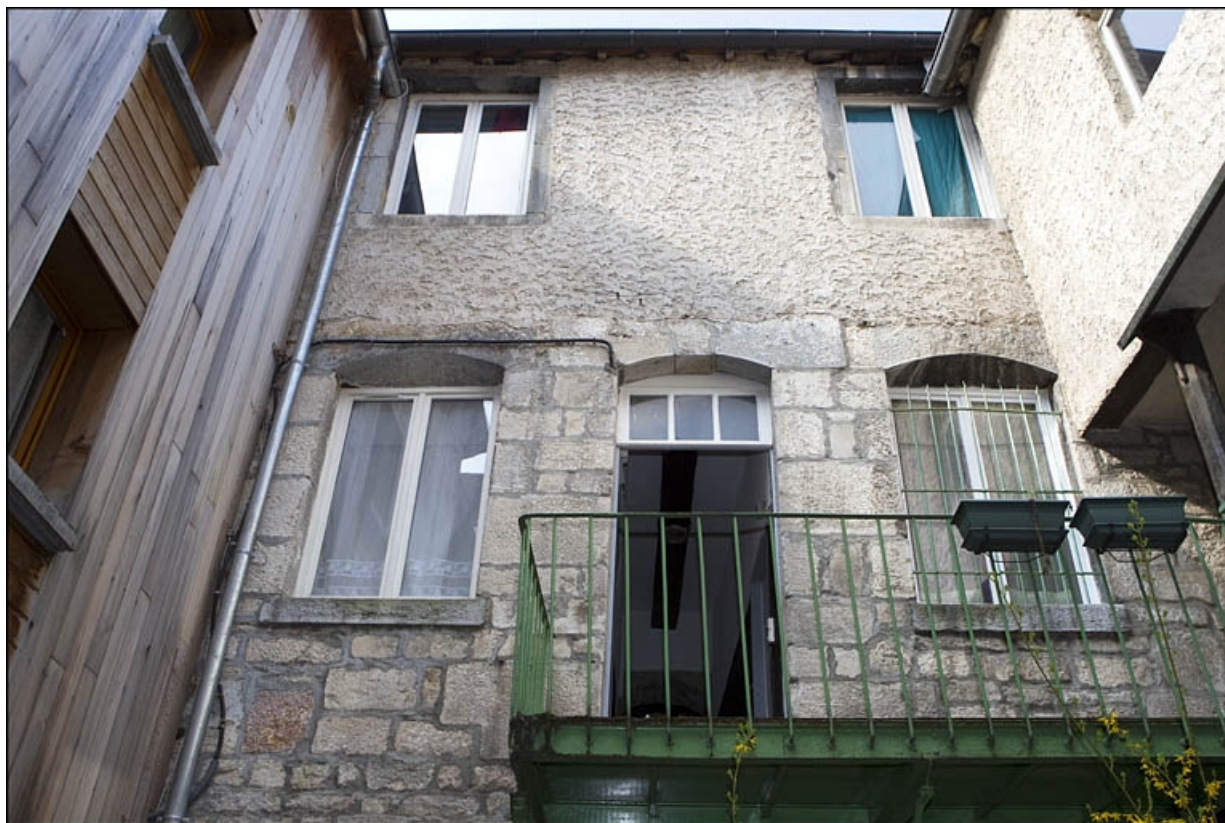
Façade antérieure du logis secondaire : vue d'ensemble depuis le premier étage.

25, Besançon, 28 rue Rivotte, lieudit : îlot Boitouset