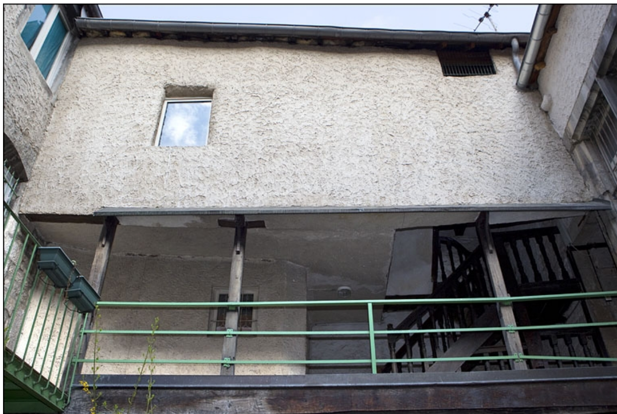
Escalier à cage ouverte : détail de la coursière desservant le premier étage du logis secondaire, face depuis la cour. 25, Besançon, 28 rue Rivotte, lieudit : îlot Boitouset