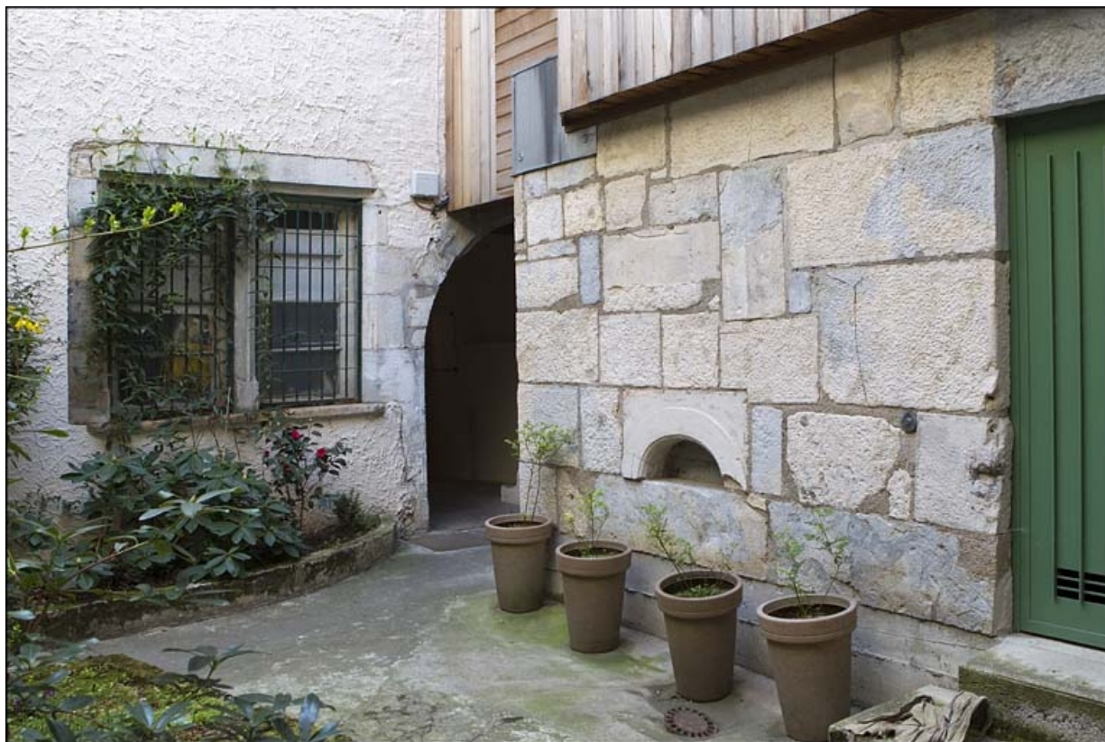
Détail d'une partie de la façade antérieure du logis secondaire sur la première cour.

25, Besançon, 28 rue Rivotte, lieudit : îlot Boitouset