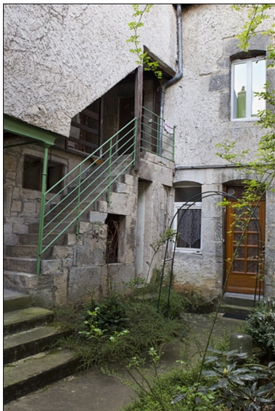
Deuxième cour : vue de l'escalier et de la façade du logis secondaire au fond de la cour.

25, Besançon, 28 rue Rivotte, lieudit : îlot Boitouset