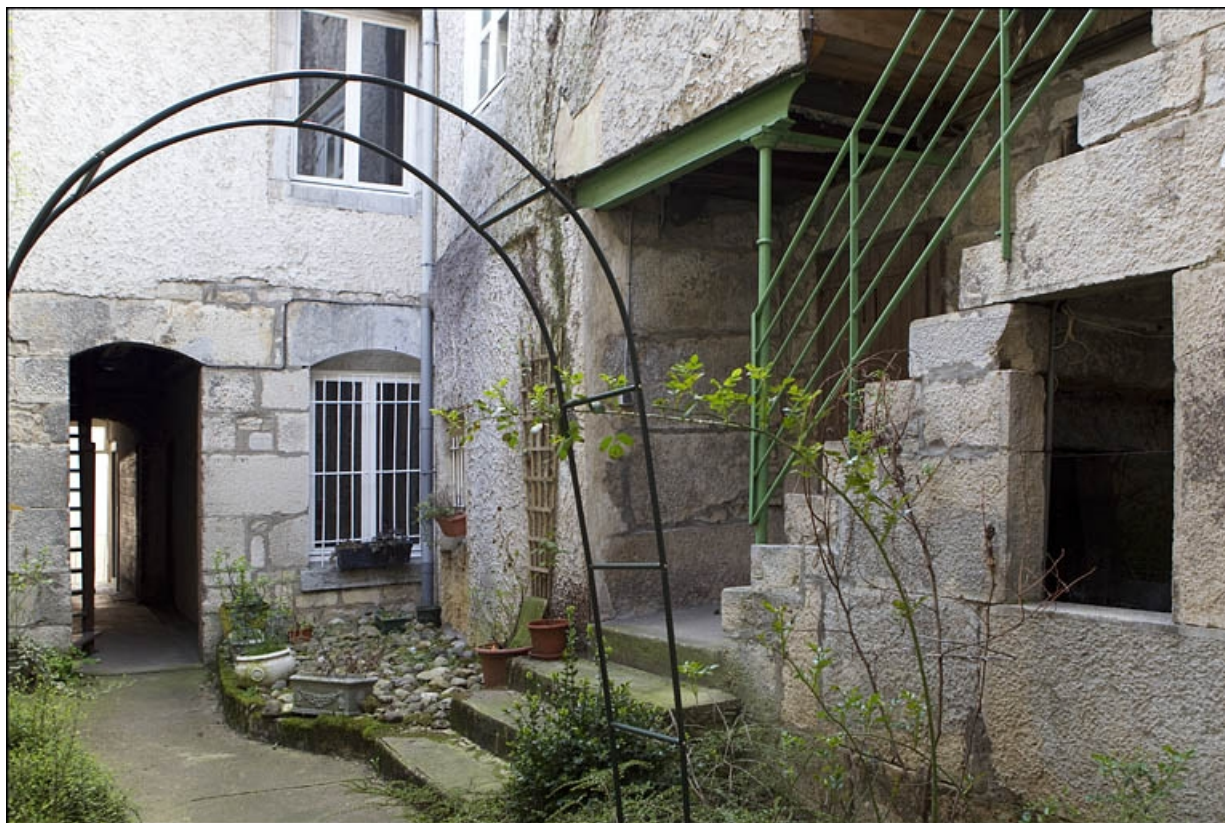
Deuxième cour : vue de l'escalier, de trois quarts droit.

25, Besançon, 28 rue Rivotte, lieudit : îlot Boitouset