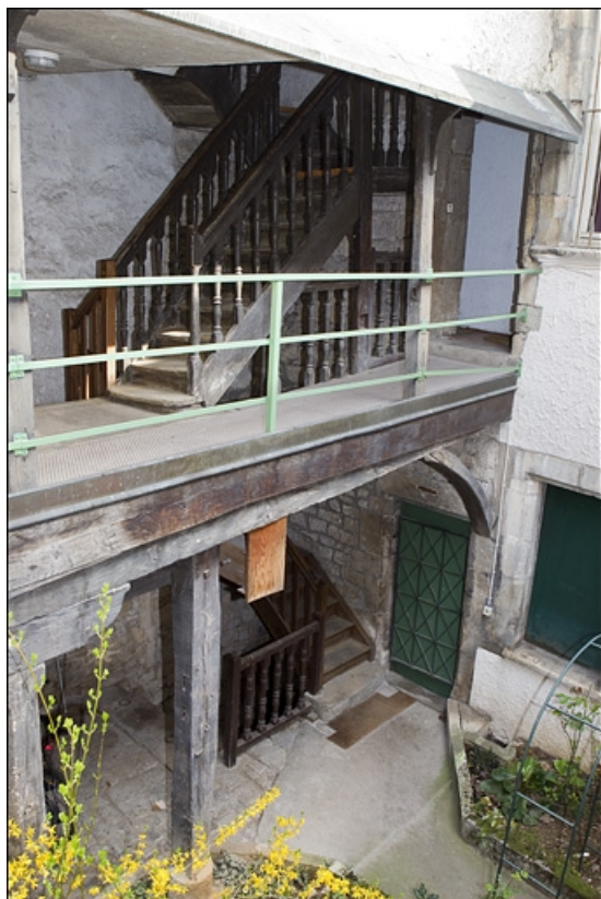
Vue d'ensemble de l'escalier à cage ouverte depuis le logis secondaire.

25, Besançon, 28 rue Rivotte, lieudit : îlot Boitouset