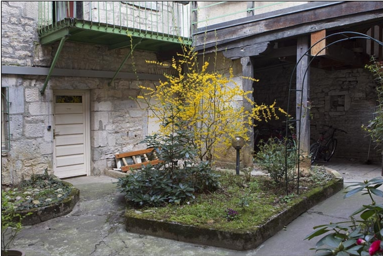
Détail du fond de la première cour, de trois quarts droit.

25, Besançon, 28 rue Rivotte, lieudit : îlot Boitouset