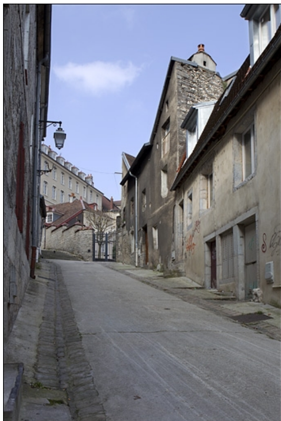
Façade latérale gauche du logis secondaire, en montant la rue du Chambrier. 25, Besançon, 28 rue Rivotte, lieudit : îlot Boitouset