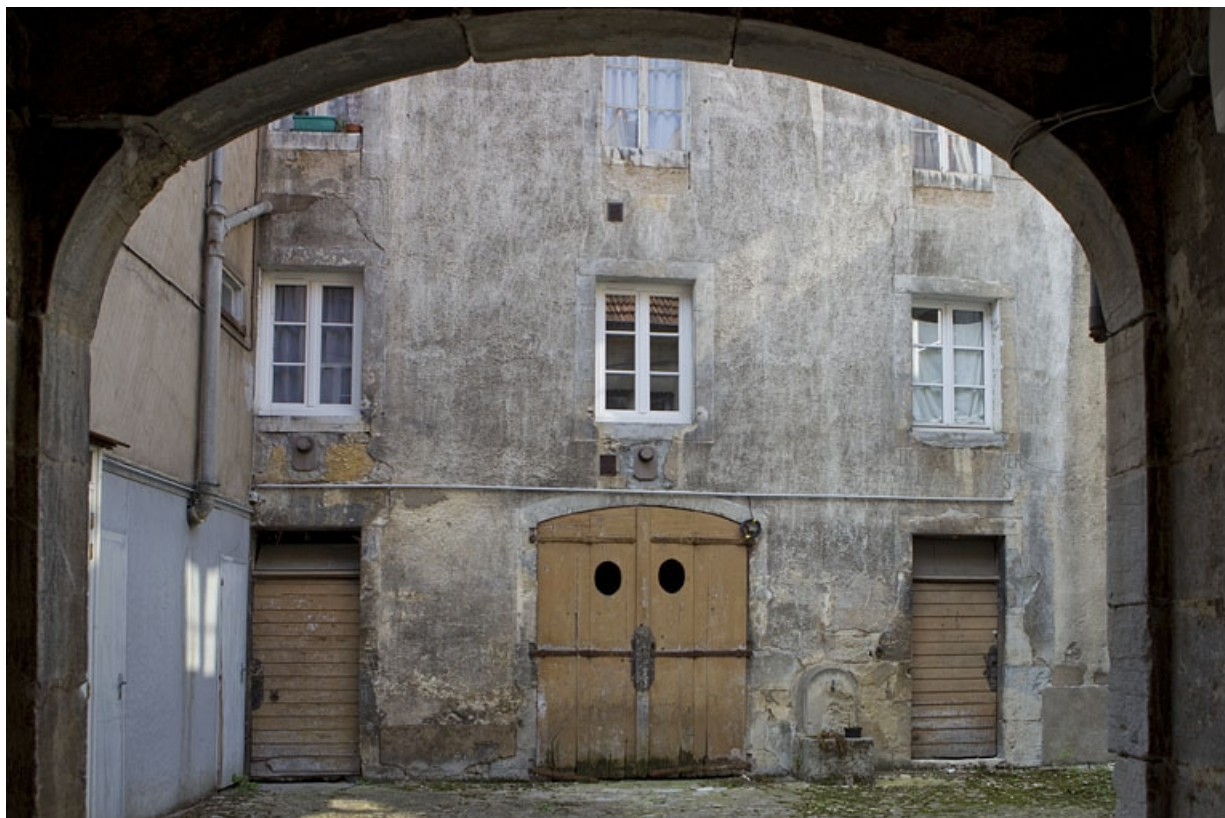
Façade antérieure du deuxième logis secondaire depuis le passage cocher. 25, Besançon, 22 rue Rivotte, lieudit : îlot Boitouset