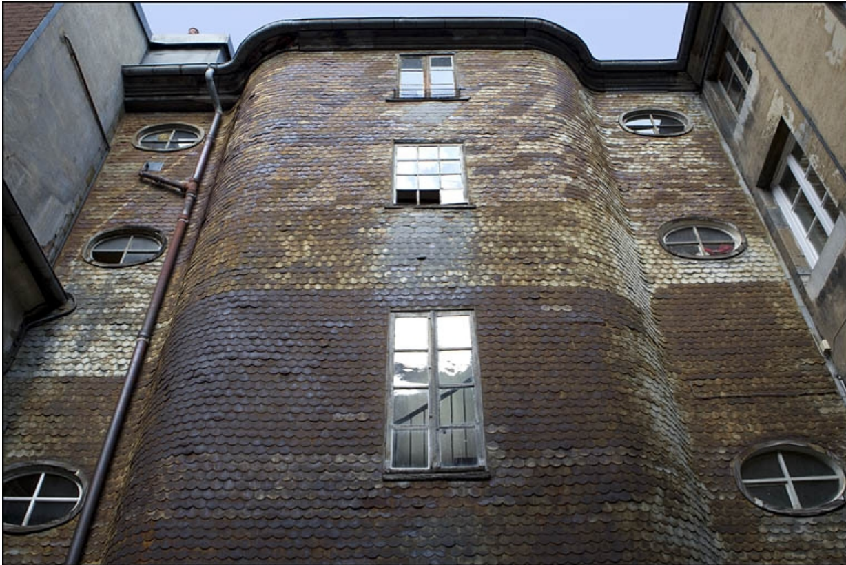
Détail de la partie supérieure de l'escalier à cage ouverte, de face.

25, Besançon, 22 rue Rivotte, lieudit : îlot Boitouset