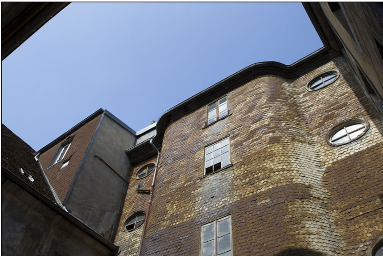
Détail de la partie supérieure de l'escalier à cage ouverte.

25, Besançon, 22 rue Rivotte, lieudit : îlot Boitouset