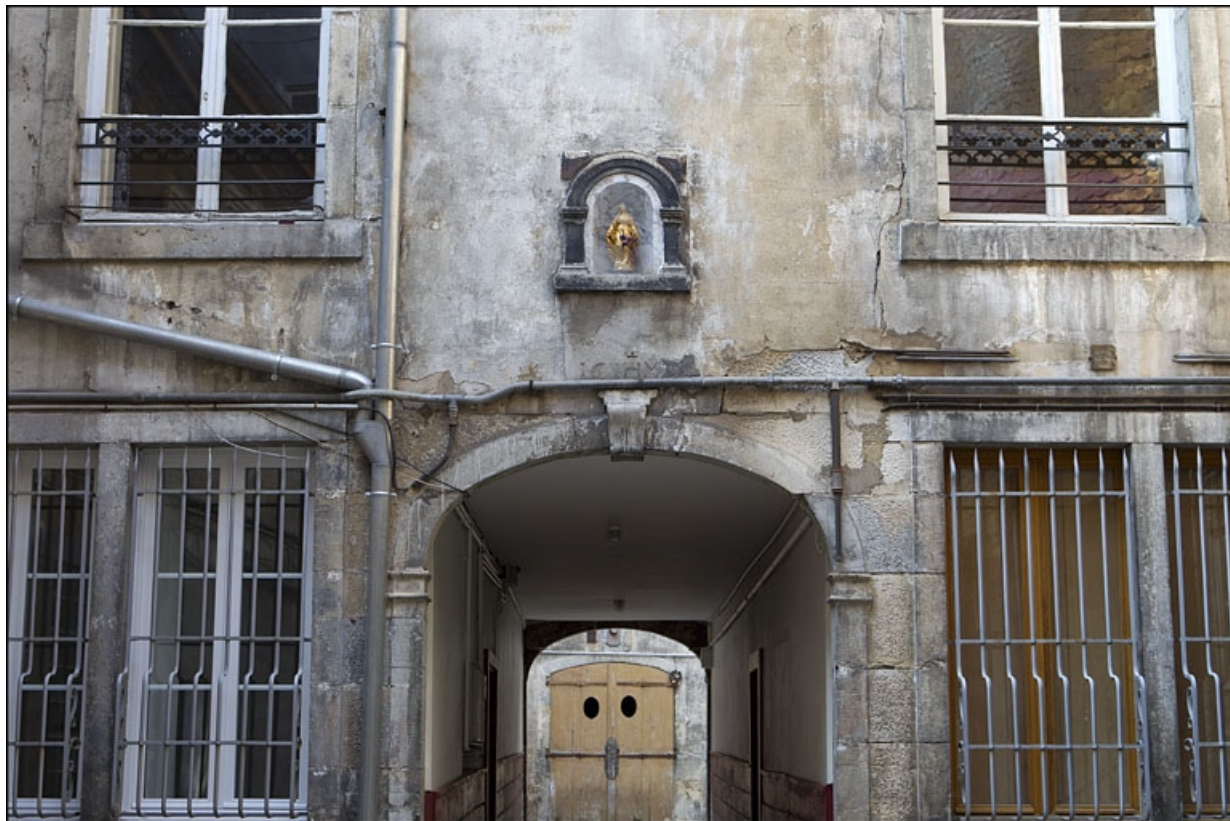
Premier logis secondaire : vue du passage cocher.

25, Besançon, 22 rue Rivotte, lieudit : îlot Boitouset