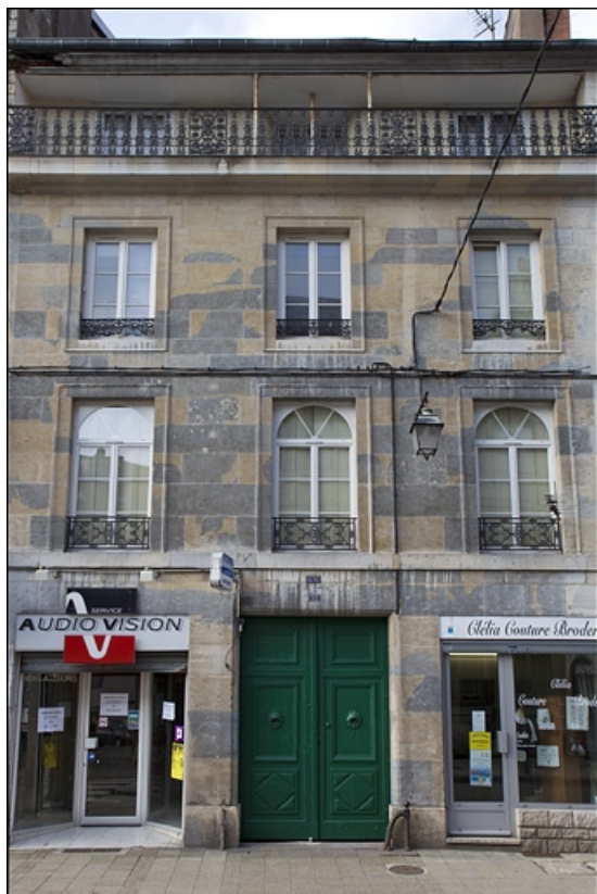
Vue d'ensemble de la façade antérieure sur rue du logis principal.

25, Besançon, 22 rue Rivotte, lieudit : îlot Boitouset