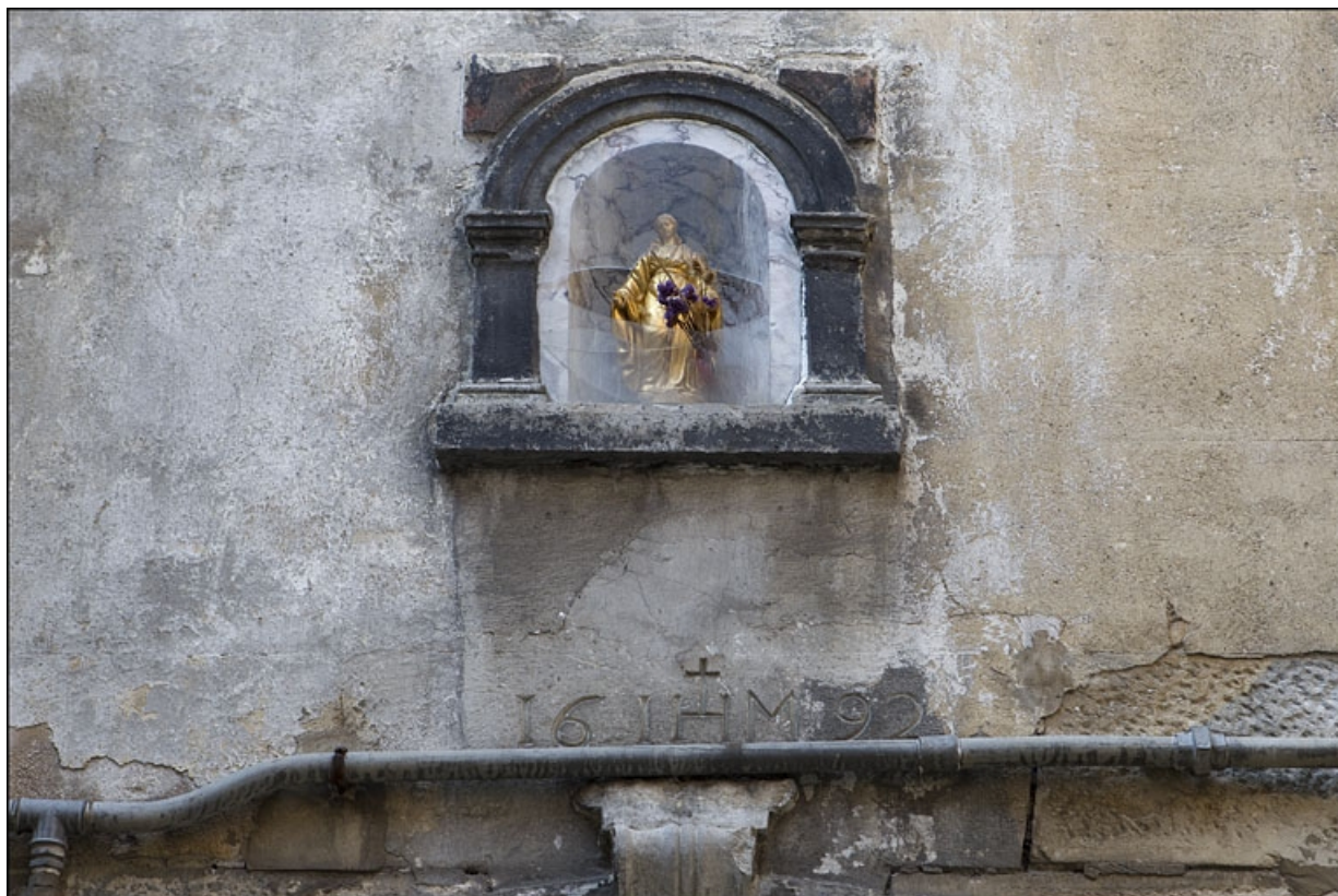
Détail de la niche sur la façade antérieure du premier logis secondaire.

25, Besançon, 22 rue Rivotte, lieudit : îlot Boitouset