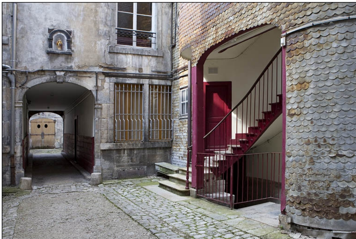
Détail du départ de l'escalier à cage ouverte et du deuxième passage cocher, depuis l'entrée de la première cour. 25, Besançon, 22 rue Rivotte, lieudit : îlot Boitouset