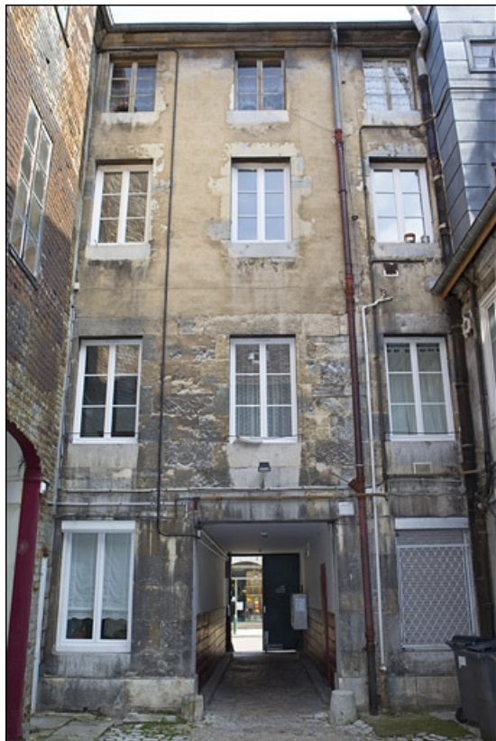
Logis principal : façade postérieure.

25, Besançon, 22 rue Rivotte, lieudit : îlot Boitouset