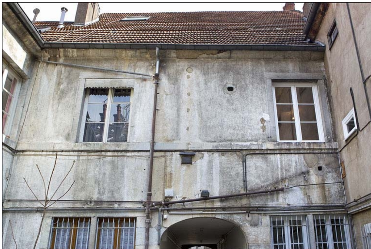
Vue de la façade postérieure du premier logis secondaire, à partir du premier étage.

25, Besançon, 22 rue Rivotte, lieudit : îlot Boitouset