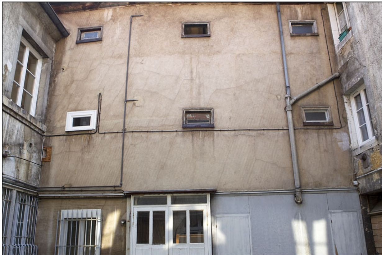
Premier logis secondaire, aile gauche sur la deuxième cour.

25, Besançon, 22 rue Rivotte, lieudit : îlot Boitouset