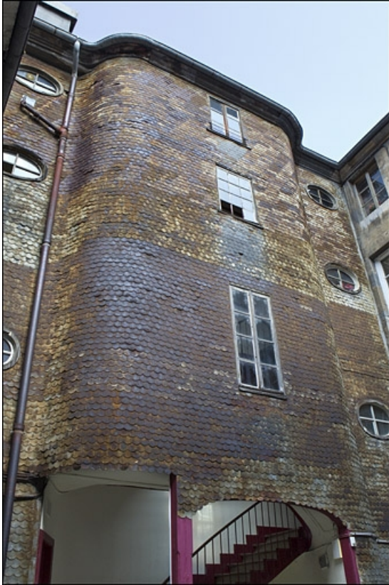
Vue d'ensemble de l'escalier à cage ouverte depuis la cour.

25, Besançon, 22 rue Rivotte, lieudit : îlot Boitouset