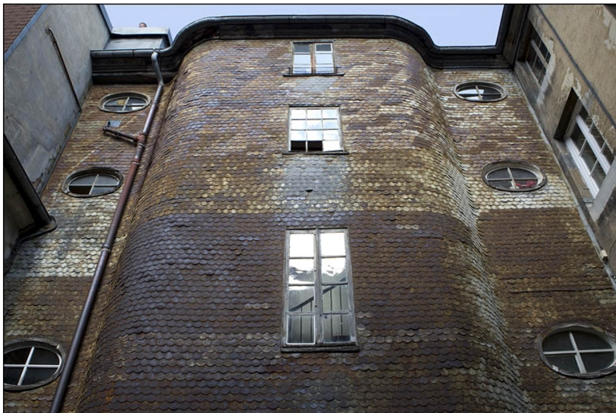
Détail de la partie supérieure de l'escalier à cage ouverte, de face.

25, Besançon, 22 rue Rivotte, lieudit : îlot Boitouset