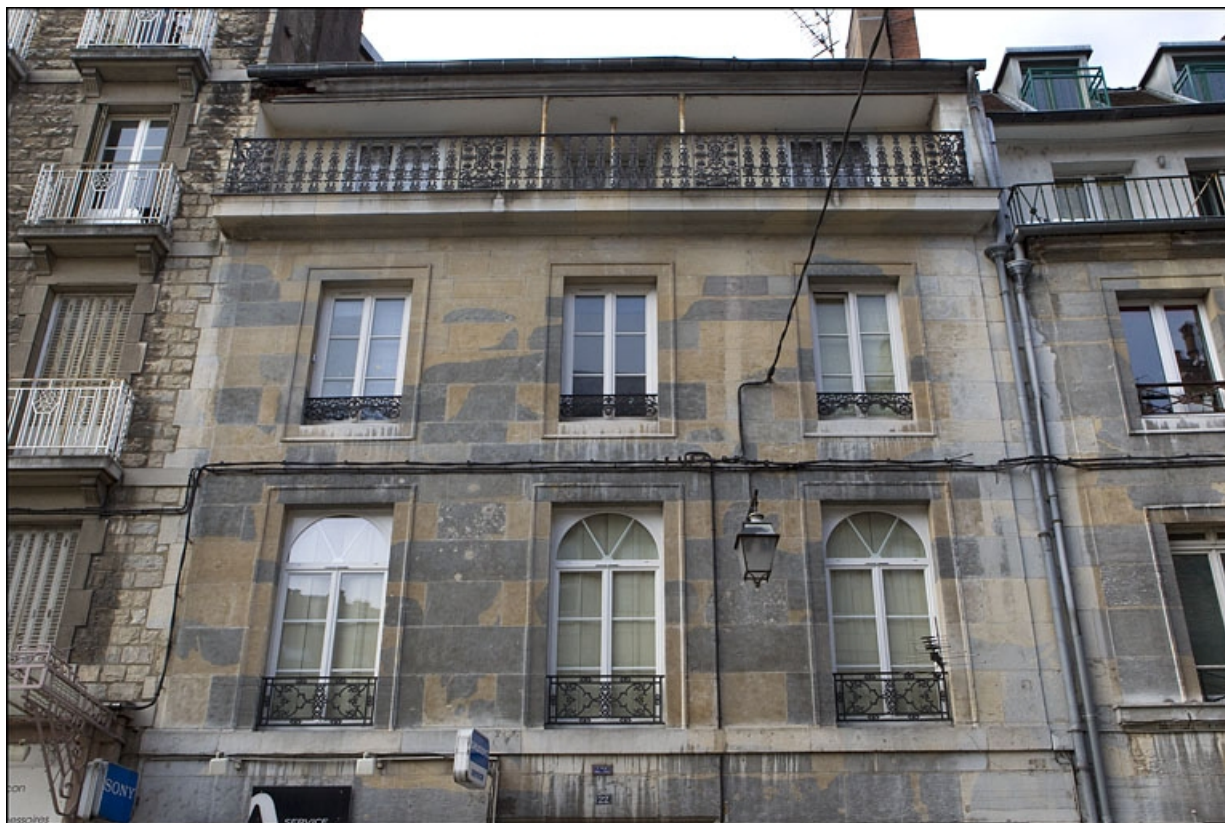
Vue de la façade antérieure sur rue du logis principal à partir du premier étage.

25, Besançon, 22 rue Rivotte, lieudit : îlot Boitouset