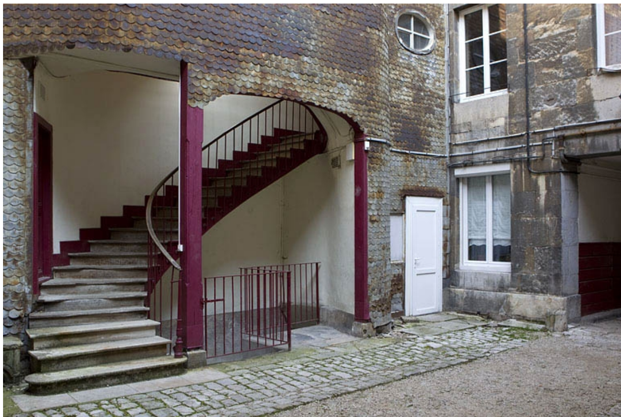
Départ de l'escalier à cage ouverte, à droite de la première cour.

25, Besançon, 22 rue Rivotte, lieudit : îlot Boitouset