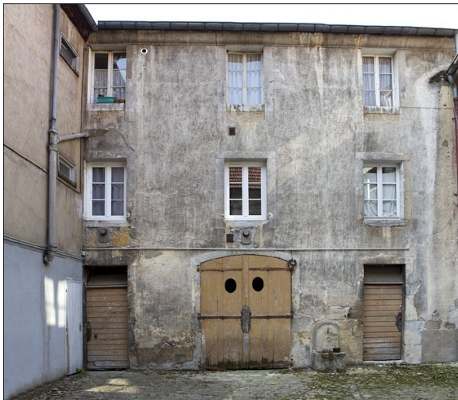
Vue de la façade antérieure du deuxième logis secondaire, au fond de la deuxième cour. 25, Besançon, 22 rue Rivotte, lieudit : îlot Boitouset