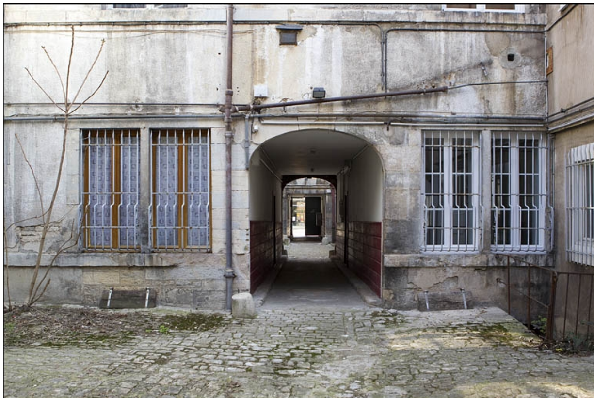
Vue du rez-de-chaussée de la façade postérieure du premier logis secondaire.

25, Besançon, 22 rue Rivotte, lieudit : îlot Boitouset