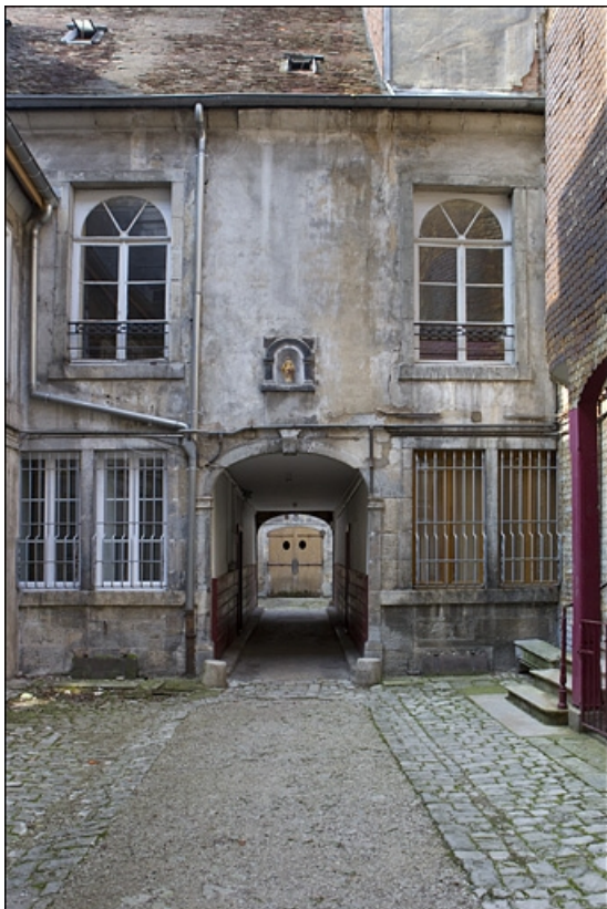
Façade antérieure du premier logis secondaire donnant sur la première cour. 25, Besançon, 22 rue Rivotte, lieudit : îlot Boitouset