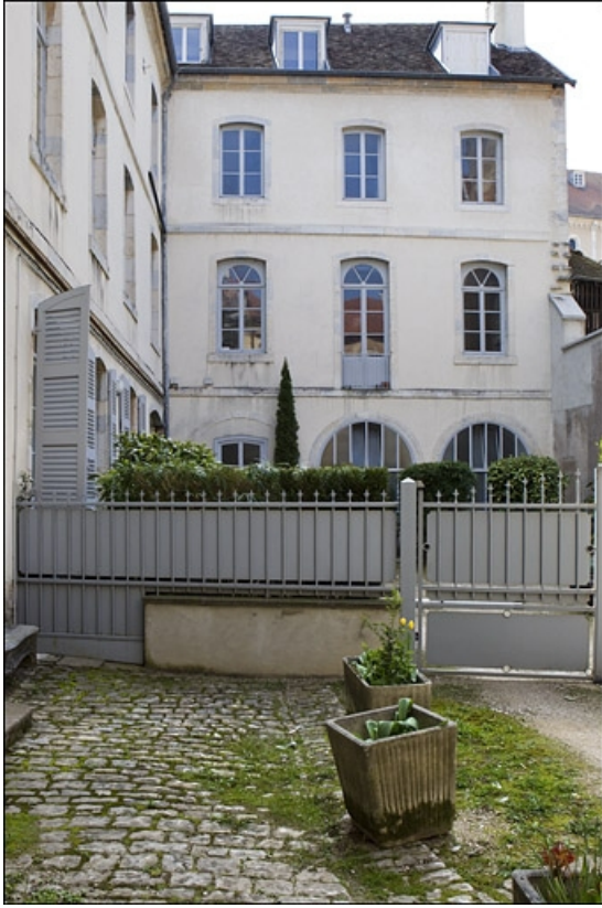
Vue de la façade antérieure de l'aile en fond de cour.

25, Besançon, 8 rue Pécelet, lieudit : îlot Boitouset