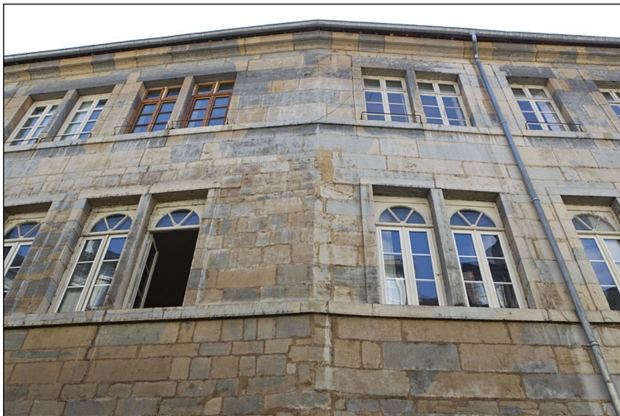
Façade antérieure sur rue du logis principal : vue des premier et second étages.

25, Besançon, 8 rue Pécelet, lieudit : îlot Boitouset