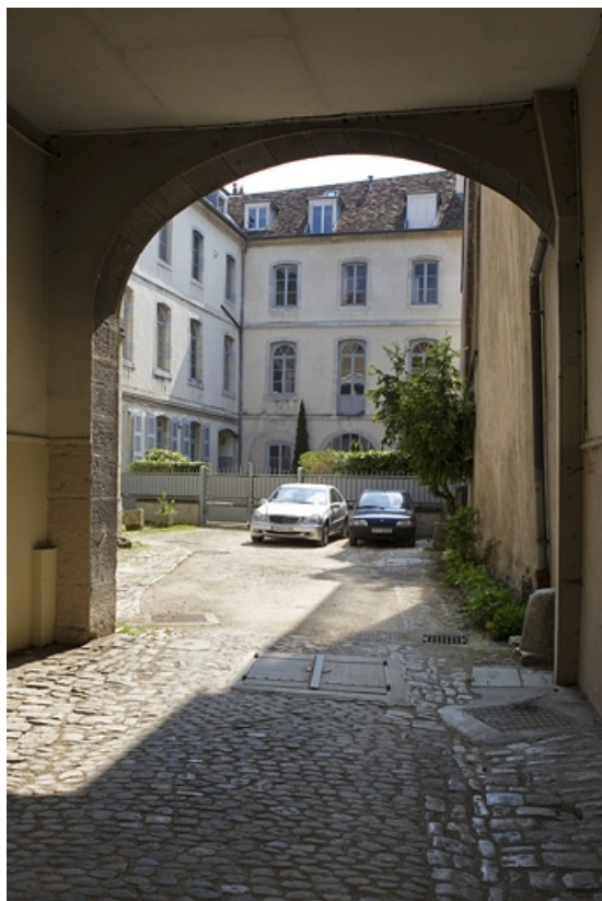
Vue d'ensemble du logis secondaire depuis le passage cocher sur rue.

25, Besançon, 8 rue Péclet, lieudit : îlot Boitouset