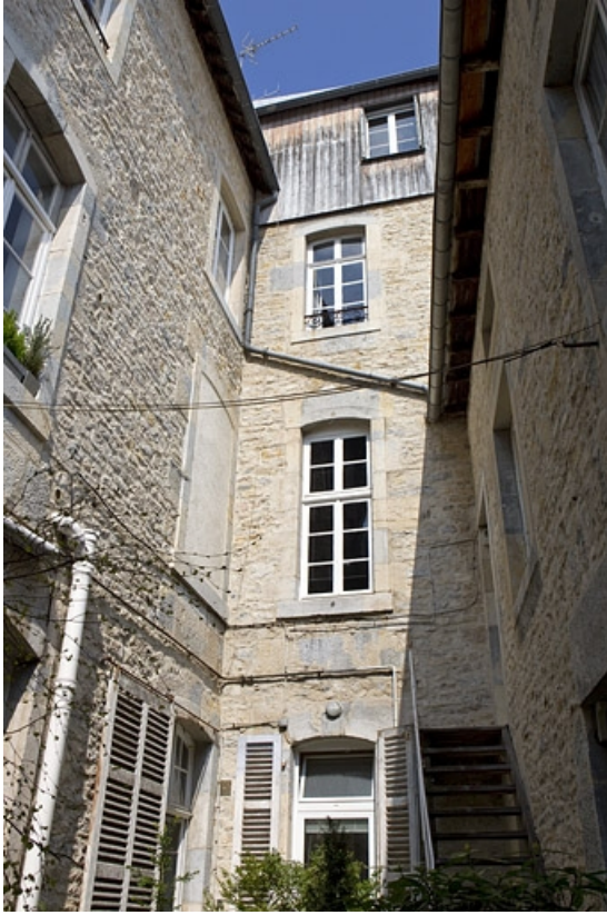
Vue des façades donnant sur l'ancienne basse-cour.

25, Besançon, 8 rue Pécelet, lieudit : îlot Boitouset