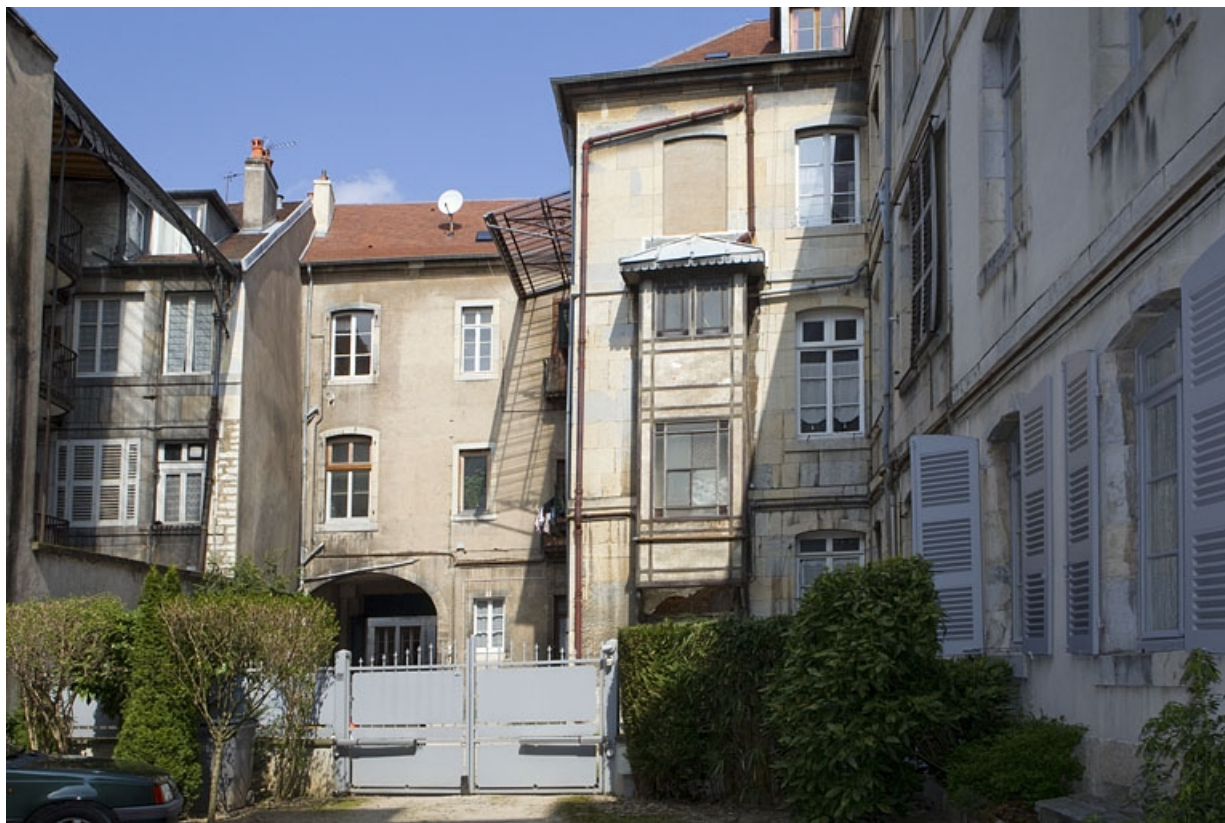
Vue de la façade postérieure du logis principal depuis le fond de la cour.

25, Besançon, 8 rue Pécelet, lieudit : îlot Boitouset