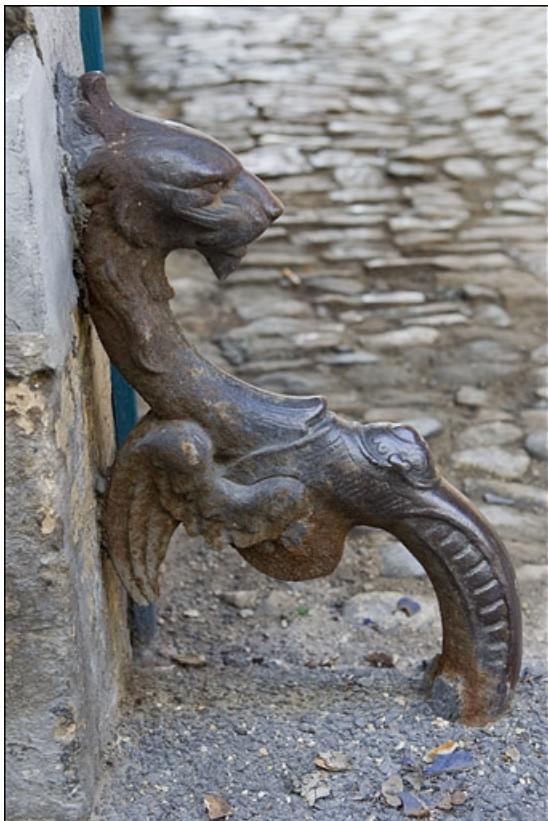
Objet non identifié (chasse-roue ?) en fonte en forme de dragon situé dans la cour.

25, Besançon, 8 rue Pécelet, lieudit : îlot Boitouset