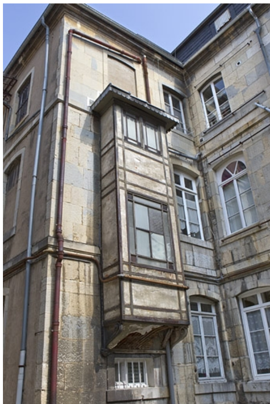
Détail d'une logette sur la façade postérieure du logis principal.

25, Besançon, 8 rue Pécelet, lieudit : îlot Boitouset