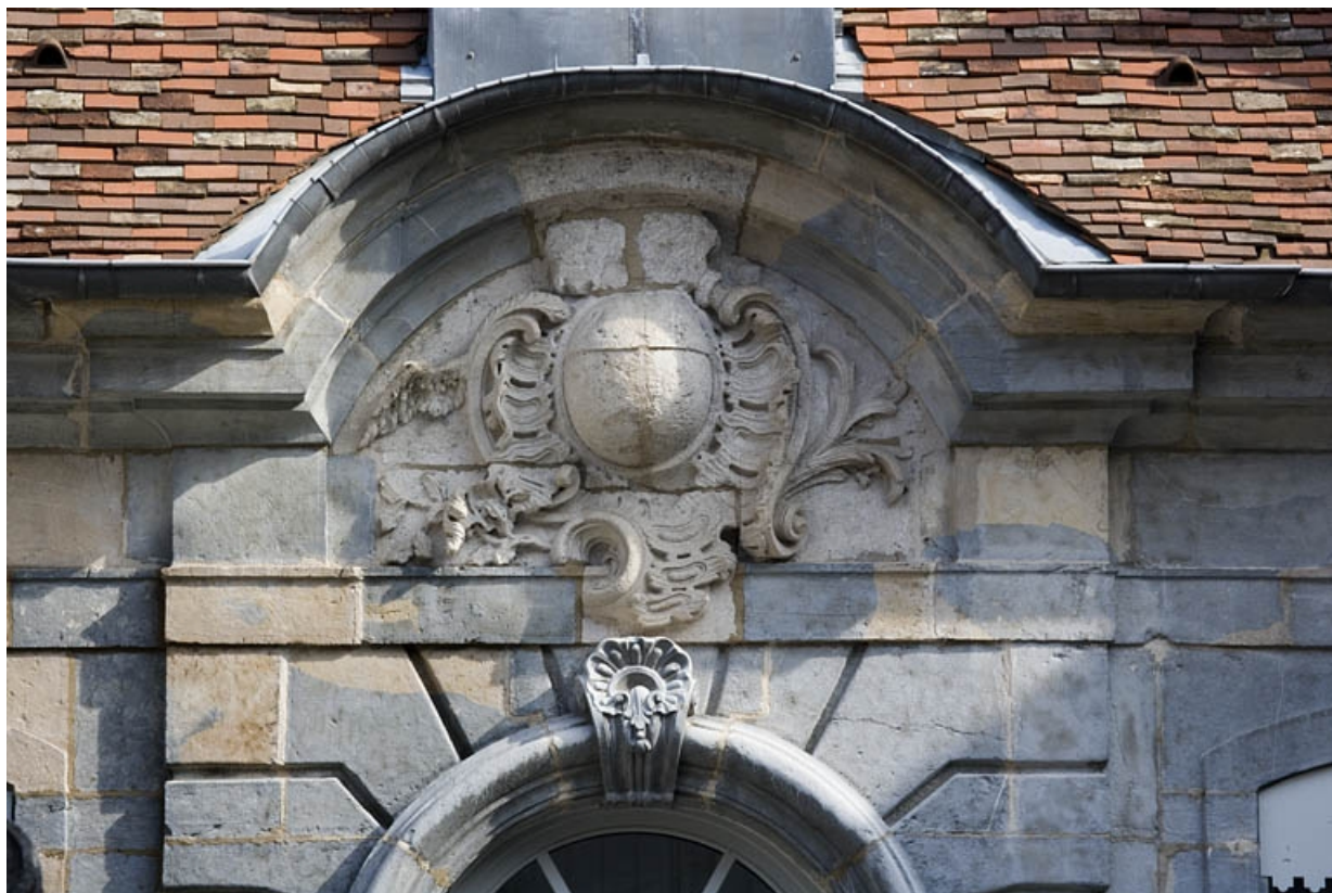
Détail de la sculpture à la partie supérieure de l'avant-corps central.

25, Besançon, 3, 5 rue de la Convention, lieudit : îlot Boitouset