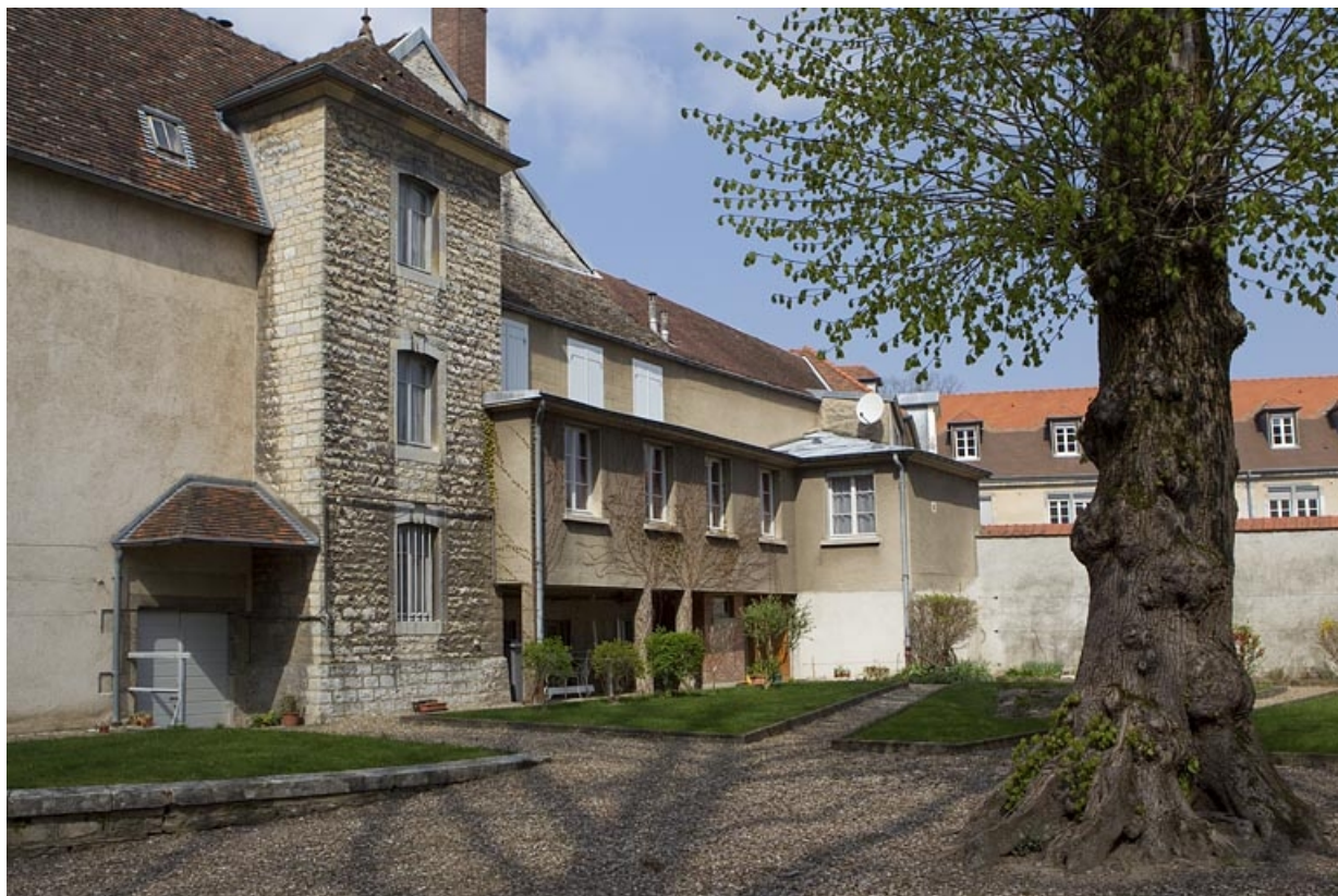
Façade latérale droite de l'hôtel depuis le jardin.

25, Besançon, 3, 5 rue de la Convention, lieudit : îlot Boitouset