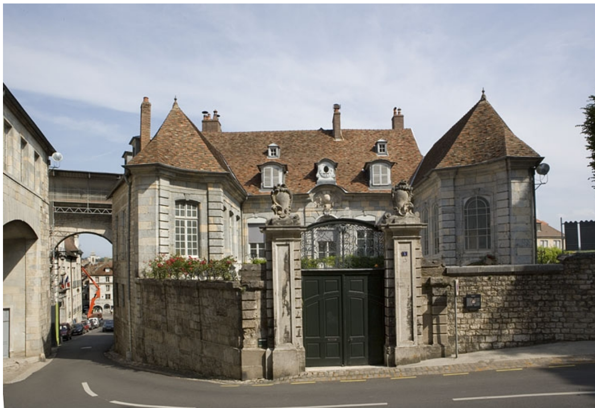
Vue d'ensemble de l'hôtel depuis la rue : de face.

25, Besançon, 3, 5 rue de la Convention, lieudit : îlot Boitouset