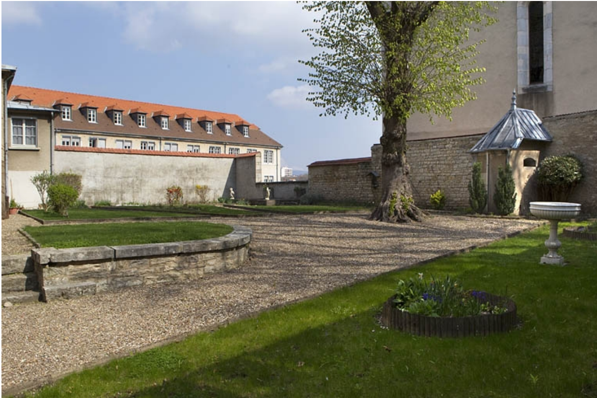
Vue d'une partie du jardin.

25, Besançon, 3, 5 rue de la Convention, lieudit : îlot Boitouset