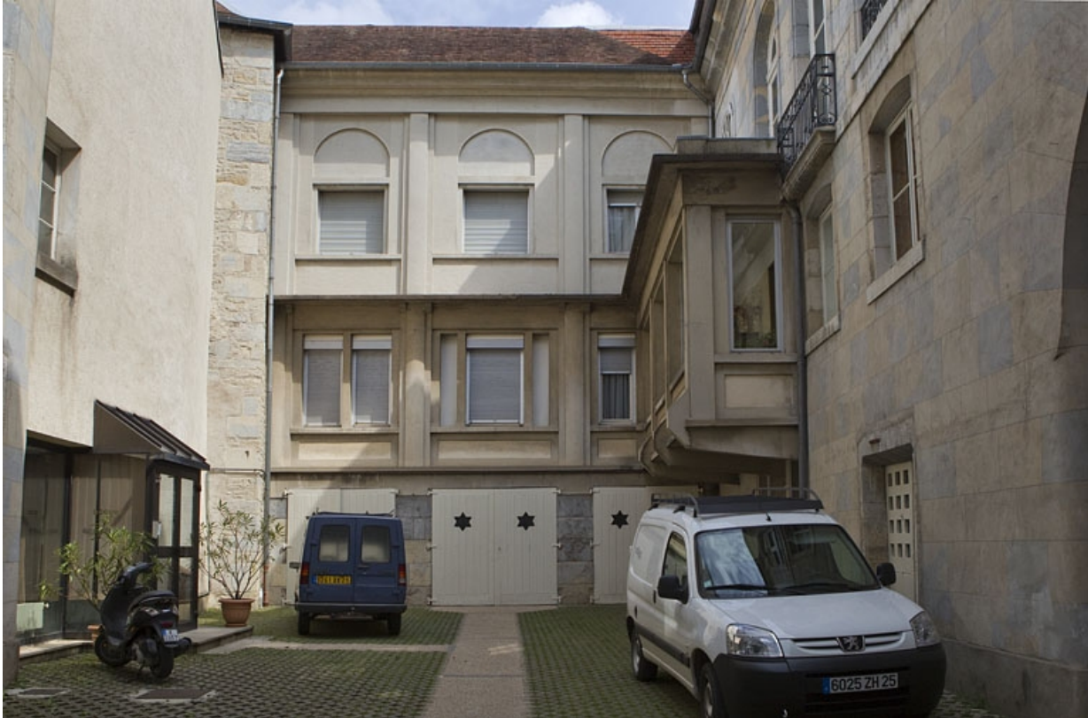
Vue d'ensemble de la cour postérieure.

25, Besançon, 3, 5 rue de la Convention, lieudit : îlot Boitouset