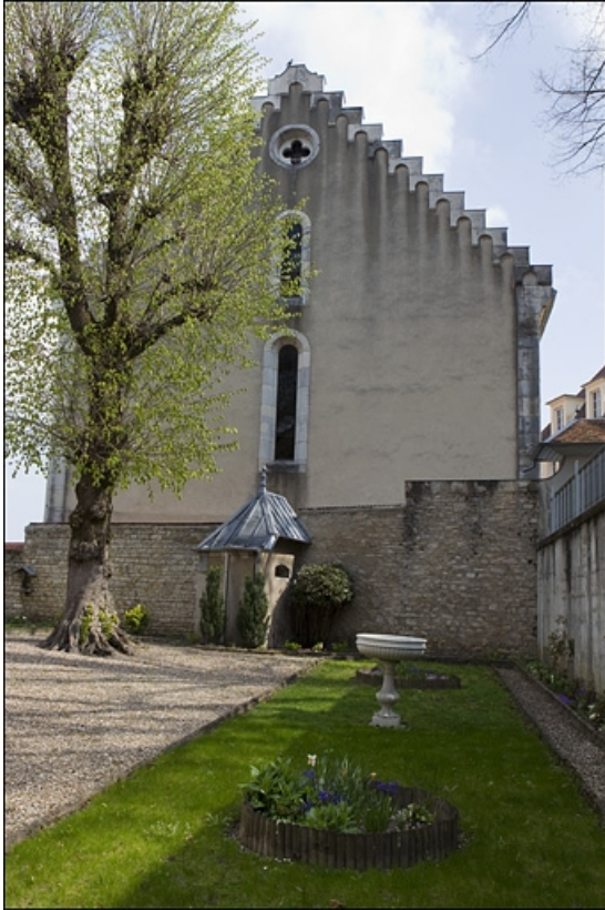
Vue éloignée du pavillon de jardin.

25, Besançon, 3, 5 rue de la Convention, lieudit : îlot Boitouset