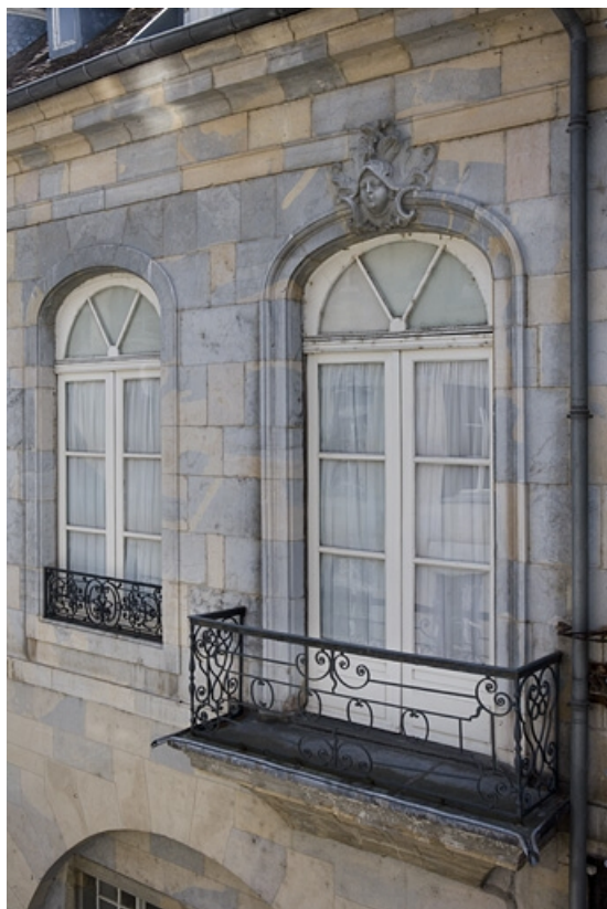
Détail de la porte-fenêtre sur la façade postérieure de la maison.

25, Besançon, 3, 5 rue de la Convention, lieudit : îlot Boitouset