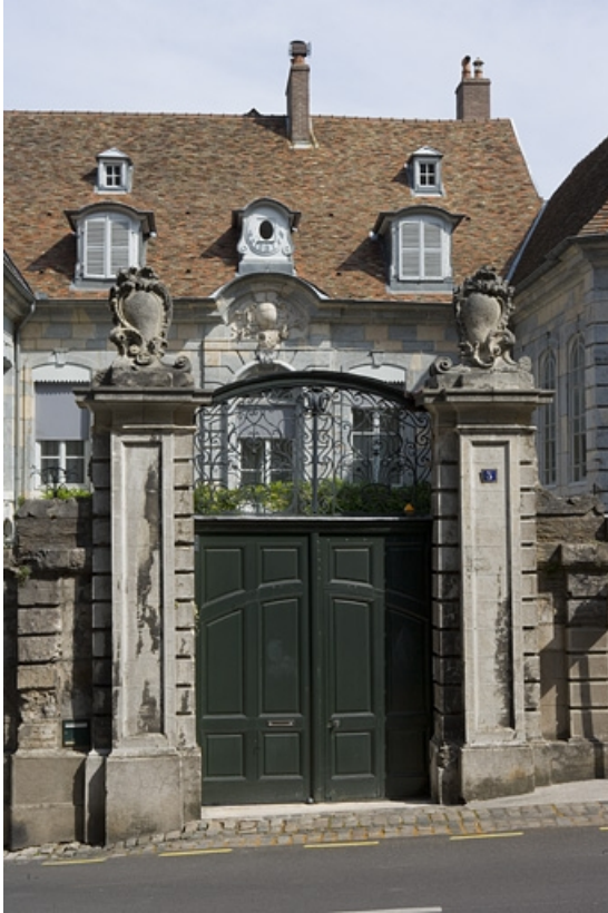
Vue d'ensemble du portail d'entrée depuis la rue.

25, Besançon, 3, 5 rue de la Convention, lieudit : îlot Boitouset