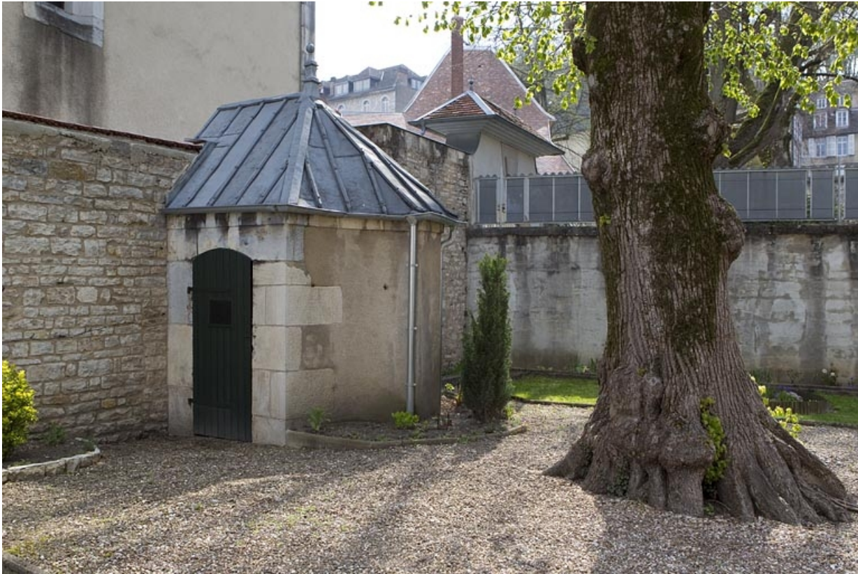
Vue d'ensemble du pavillon de jardin, de trois quarts droit.

25, Besançon, 3, 5 rue de la Convention, lieudit : îlot Boitouset