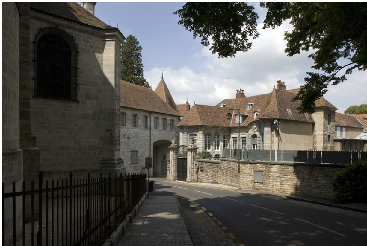
Vue d'ensemble de l'hôtel depuis la rue : vue éloignée de trois quarts droit.

25, Besançon, 3, 5 rue de la Convention, lieudit : îlot Boitouset