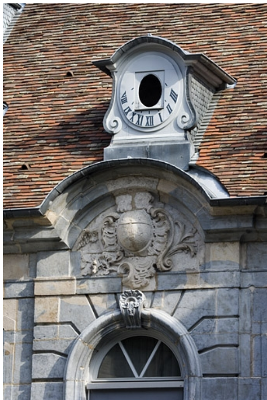
Détail de la partie supérieure de l'avant-corps central.

25, Besançon, 3, 5 rue de la Convention, lieudit : îlot Boitouset