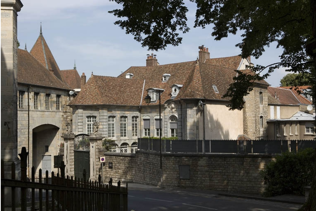
Vue d'ensemble de l'hôtel depuis la rue : de trois quarts droit.

25, Besançon, 3, 5 rue de la Convention, lieudit : îlot Boitouset