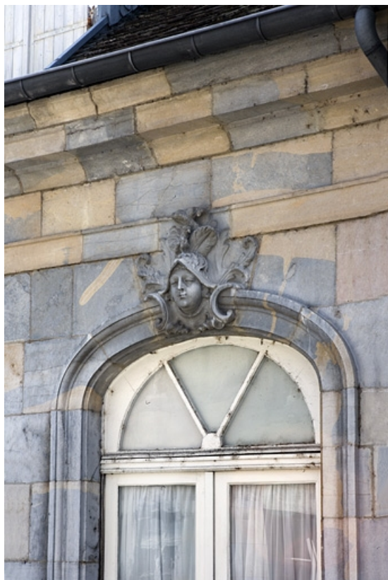
Détail de la sculpture sur l'arc de la porte-fenêtre : façade postérieure de la maison. 25, Besançon, 3, 5 rue de la Convention, lieudit : îlot Boitouset