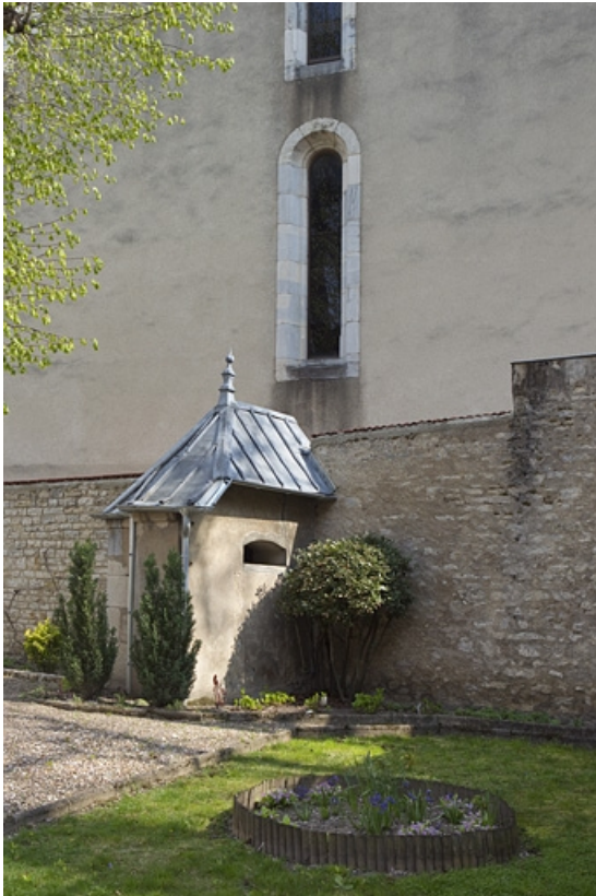
Vue d'ensemble du pavillon de jardin.

25, Besançon, 3, 5 rue de la Convention, lieudit : îlot Boitouset