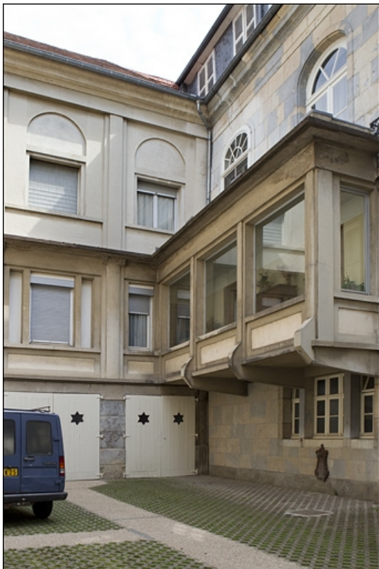
Détail des façades donnant sur la cour postérieure.

25, Besançon, 3, 5 rue de la Convention, lieudit : îlot Boitouset